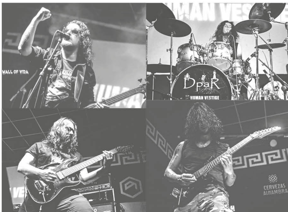
LA PRESENTACIÓN DE HUMAN VESTIGE en el festival Metal Infernus II en la ciudad de Valencia, fue a juicio de los expertos la mejor debido a su respaldo técnico.

Dentro de las entrevistas destacó la realizada en La Cantera Musical de Valencia Radio, que transmitió online la extensa entrevista donde comentaron su paso por España,