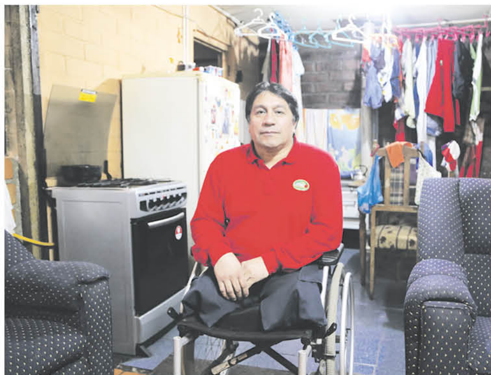
ESTE MULCHENINO manifestó que busca dar a conocer su historia con el fin de tener una mejor calidad de vida para él y su familia.