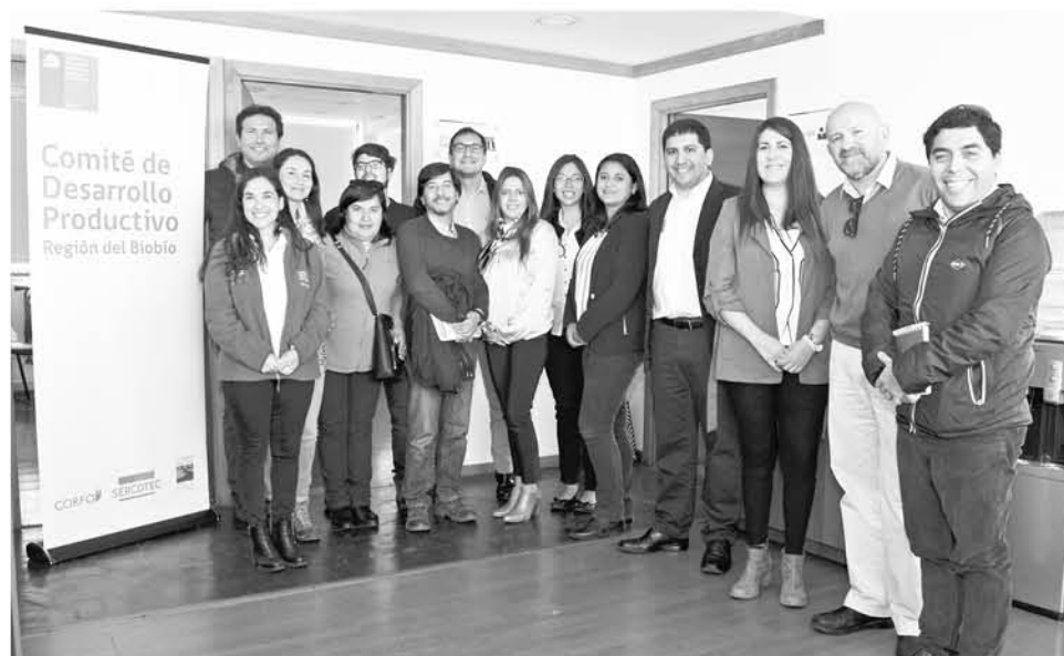
EN EL CENTRO DE DESARROLLO de Negocios de Los Ángeles, se realizó una detallada exposición, donde recibieron capacitación sobre las principales herramientas de apoyo.

Finalmente, cabe recordar que actualmente el Comité