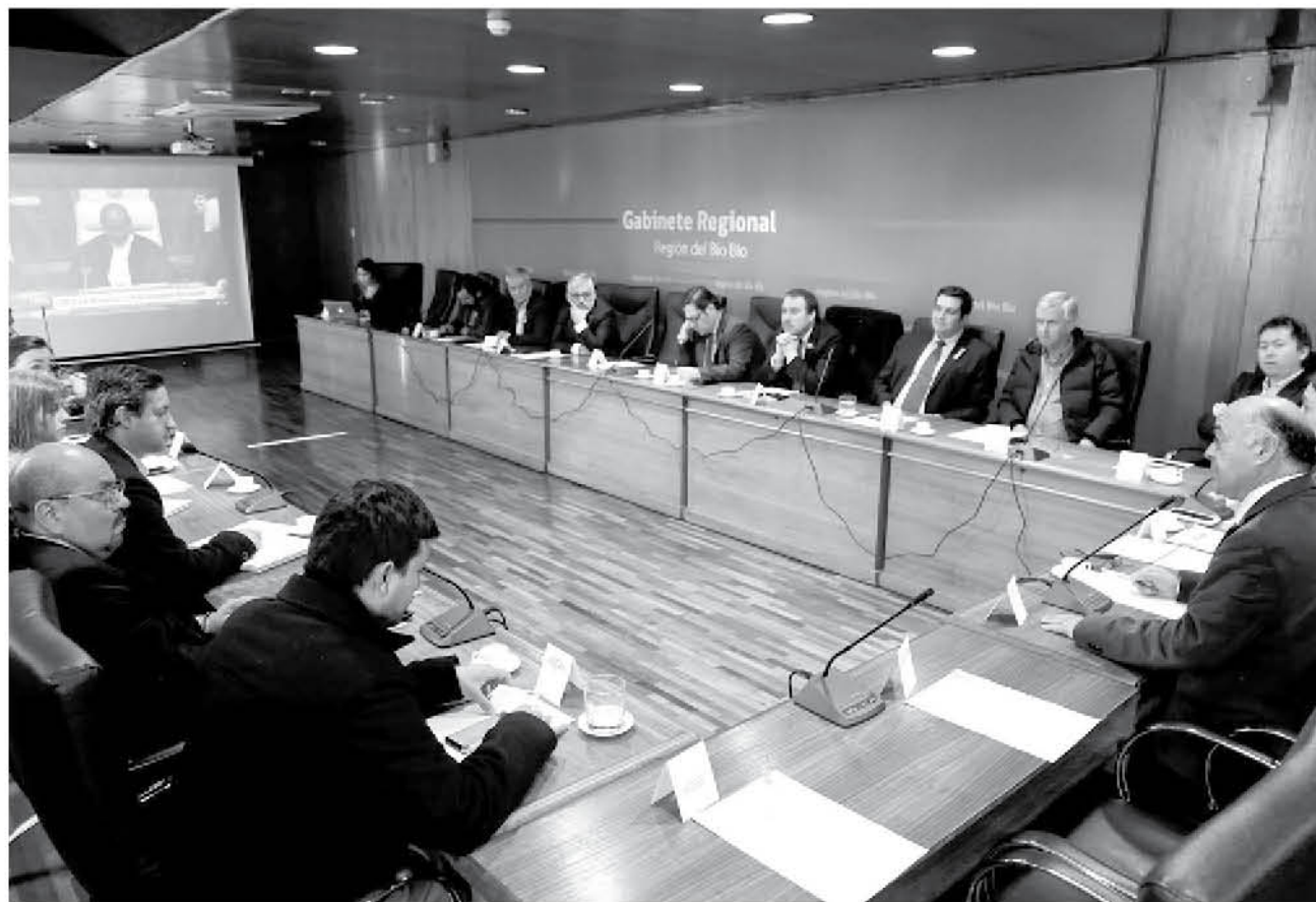
LAS AUTORIDADES DESTACARON la fuerza de la unión durante la defensa chilena.