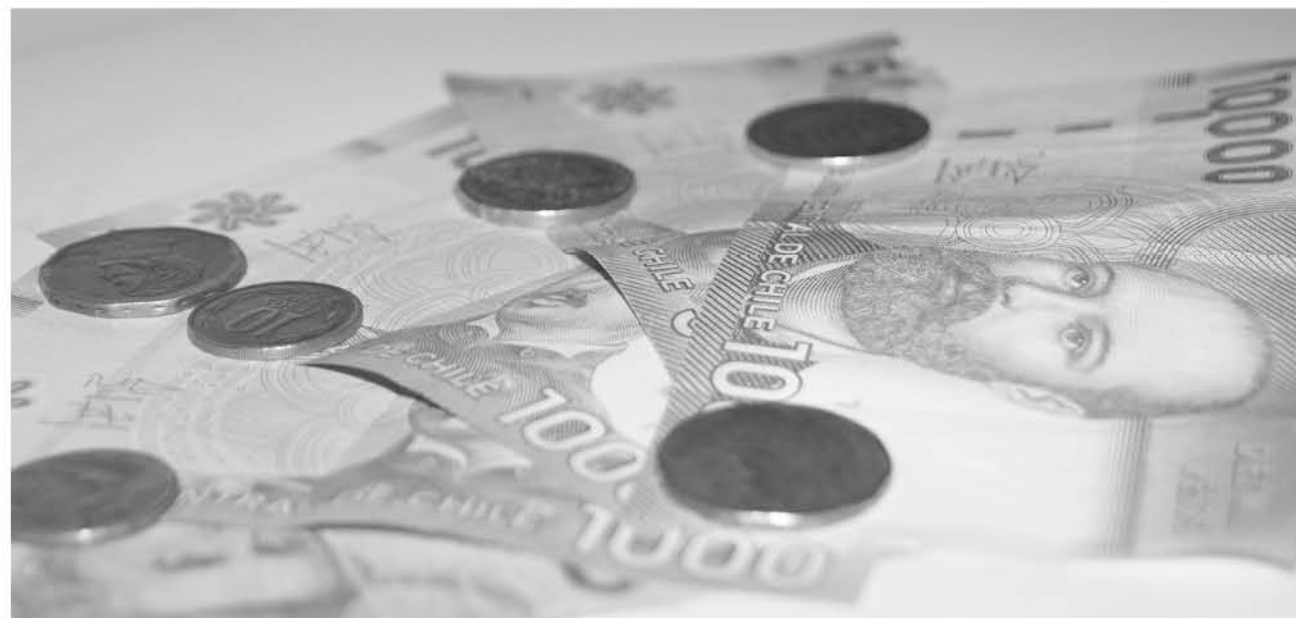
LA CAMPAÑA EN REDES SOCIALES, busca que los escolares incorporen el concepto del ahorro de una manera lúdica.

En este contexto, el Sernac, también presentará en los colegios, la obra de teatro de educación financiera denominada "La Clase Maestra". Además, exhibirá la actividad "Cine en tu colegio", y dictará el taller "El crédito".