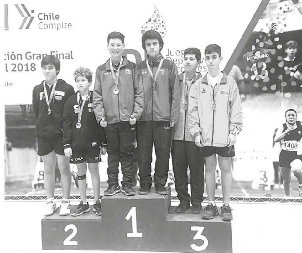
EL CONJUNTO REGIONAL derrotó al representante de la región del Maule y Metropolitana.