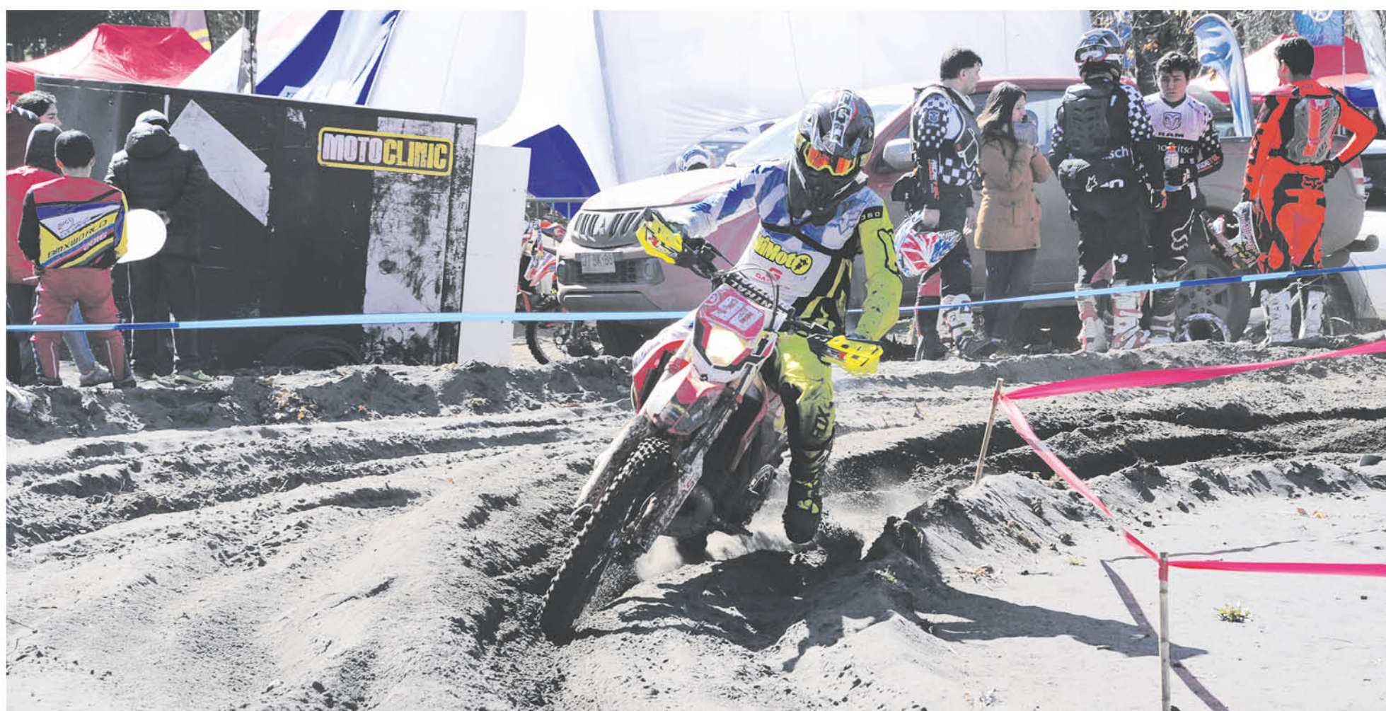
PESE AL MAL CLIMA las filas de riders comandaron sus naves a través de la exigente pista en Tucapel. (Foto de contexto)

Hasta con agua nieve tuvieron que sortear el circuito los pilotos más experimentados que se pusieron a prueba en uno de los circuitos más duros del certamen.