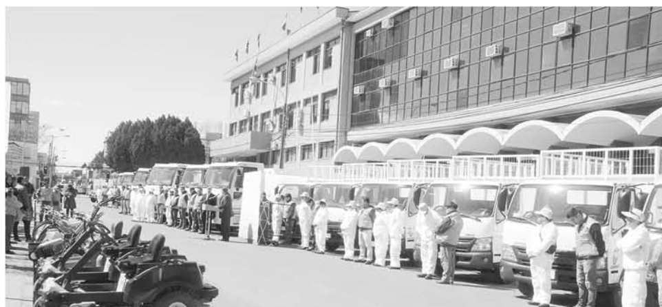
SON UN TOTAL DE 28 VEHÍCULOS, con 10 camiones aljibes entre ellos, 6 camiones recolectores y el resto camiones de apoyo.

En cuanto a áreas importantes, pero que no necesariamente son áreas verdes, particularmente el estadio municipal, el alcalde expresó que "nosotros le hemos pedido que lo mantenga como un espacio deportivo, no como un área verde y hemos hecho