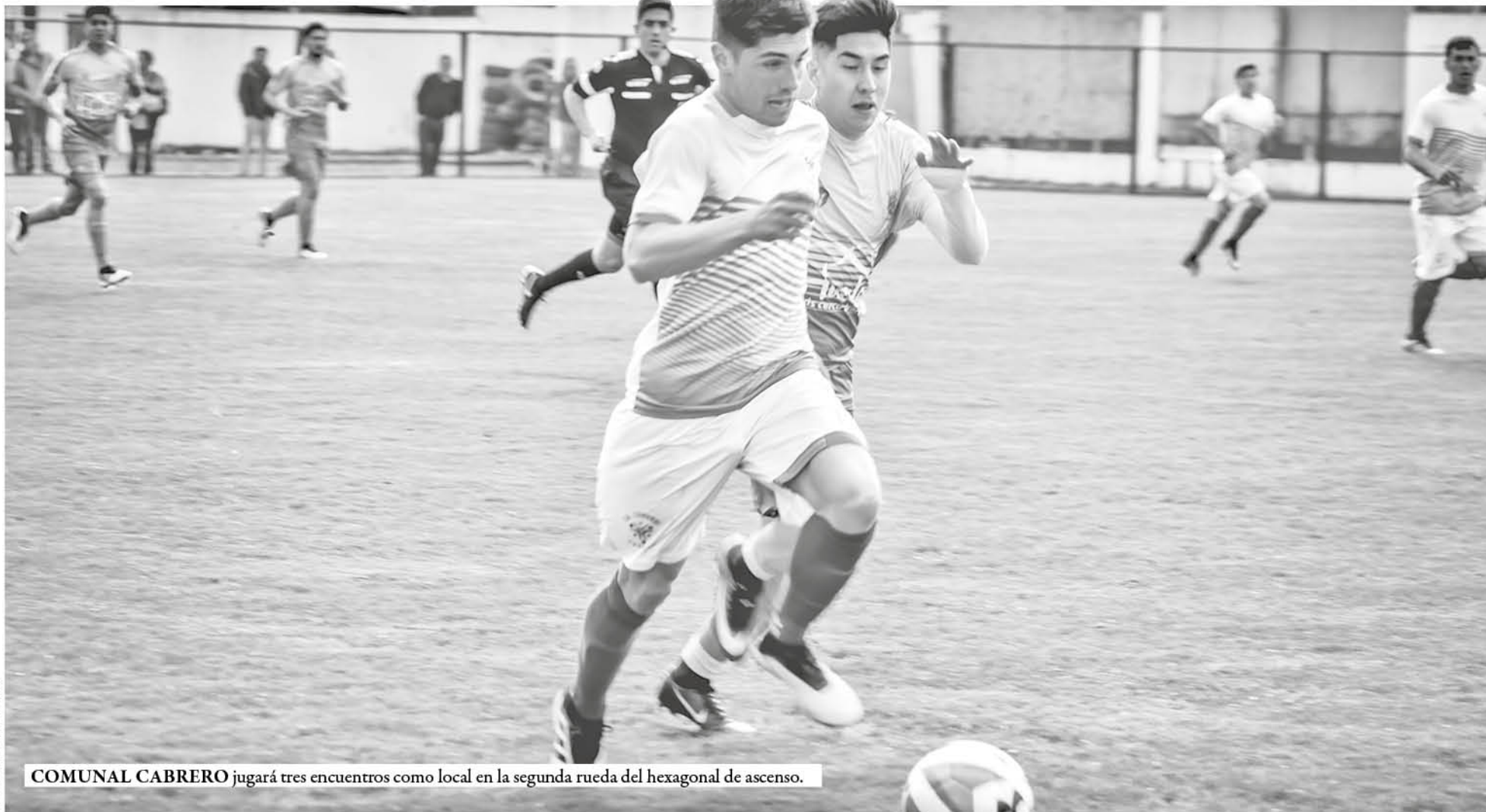
COMUNAL CABRERO jugará tres encuentros como local en la segunda rueda del hexagonal de ascenso.