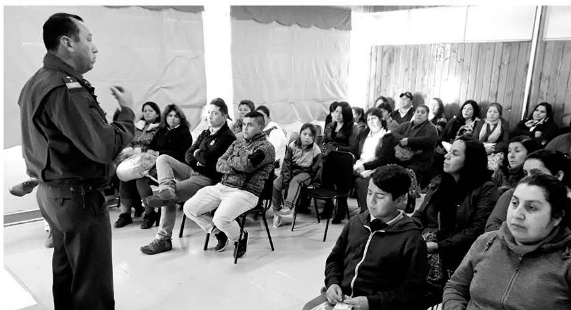
EL TRABAJO QUE ESTOS PROFESIONALES están realizando desde el mes de marzo trata de potenciar el valor de la educación familiar.

este oficial -quien ha recorrido diferentes establecimientos con esta diligencia- se están realizando desde el mes de marzo con gran participación ciudadana, que inclusive han sido solicitadas por otros establecimientos.