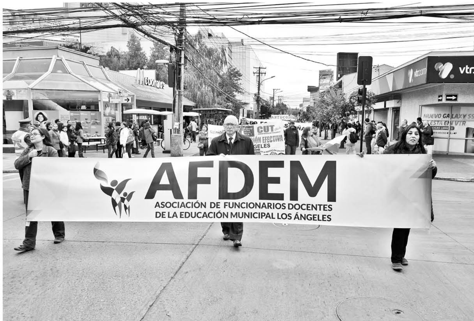
HACE ALGUNOS DÍAS, la Dirección del Trabajo, solicitó acoger la petición de inhabilitación.

Asimismo, los docentes manifestaron que al darse cuenta de esto, alzaron la voz, por lo que fueron marginados. “Cuando empezamos a darnos cuenta de la forma cómo se estaba llevando a la organización por el mismo camino del gremio de los profesores y engañando a los docentes, empezamos a levantar la voz y ello fue motivo más que suficiente para que nos marginaran de la parte visible de la Asociación con una serie de pretextos, para terminar informando a los socios que ‘ellos hacían la pega’ en defensa de los docentes, aun cuando existen tam-