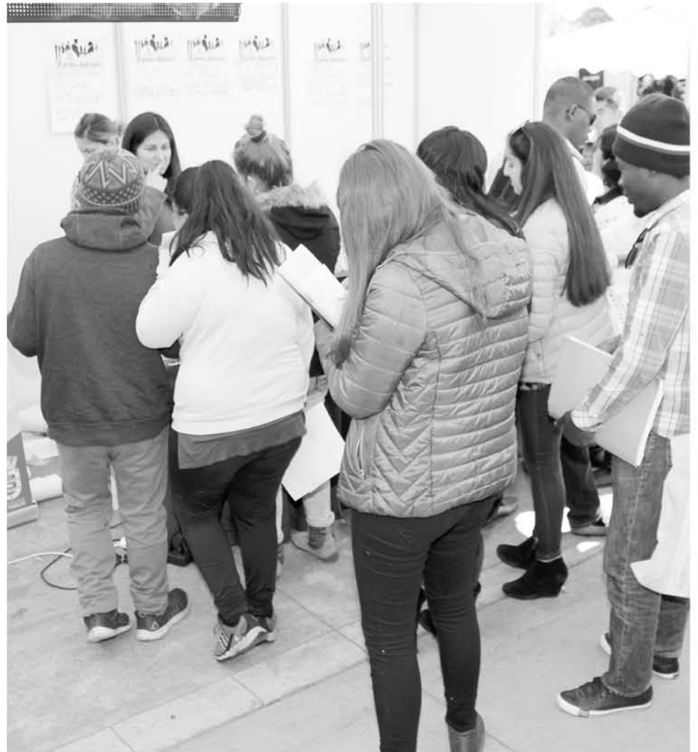
EN UNA PRIMERA ETAPA, será un total de 6 mil empleos los que se ofrecerán en la provincia.

Cabe recordar que la iniciativa contempla la realización de 50 ferias laborales en todo el país. La primera fase se llevará a cabo en 8 regiones, entre septiembre y noviembre de 2018, donde se crearán más de 21.500 empleos. La segunda fase se realizará partir de diciembre de este año.