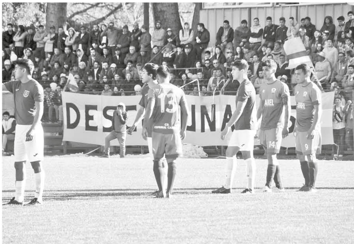
QUEDAN PUNTOS POR JUGAR y el comunal debe levantar la cabeza para sus siguientes encuentros. (Foto de contexto)

Igualmente en su anterior encuentro contra Deportes Concepción, se repitió una historia similar, donde el poco control del juego por parte de Comunal Cabrero, hizo que finalizara el encuentro 2-0 a favor del "León de Collao", con un cuadro verde descuidado que perdió el