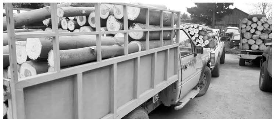
EN EL PROCEDIMIENTO fueron incautadas las tres camionetas donde se trasladaba la madera, además de las herramientas utilizadas en el delito.

Además de ello, se logró constatar que uno de los delincuentes fue reconocido por mantener un amplio prontuario policial, por las condenas por amenazas y conducir en estado de ebriedad con resultado de lesiones.