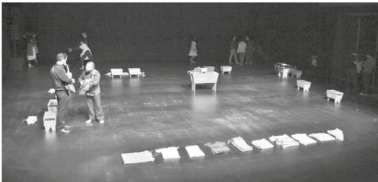
ES LA OPORTUNIDAD PARA LOS ARTISTAS de la provincia de presentar su proyecto en el Teatro Regional. El pájaro de Chile, obra de teatro reconstrucción que inauguró la temporada 2018 de la Sala de Cámara en marzo.

El Teatro busca replicar la exitosa experiencia de la primera convocatoria, que seleccionó a 20 proyectos