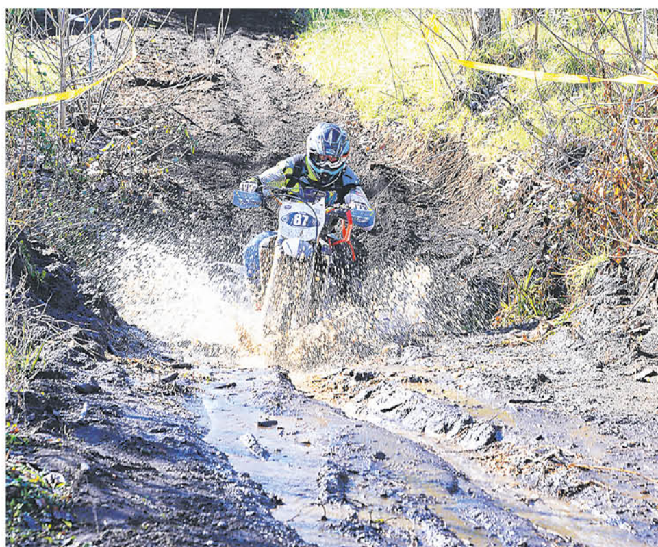
LA GRAN PRUEBA DEL ENDURO cuenta con un 60% del circuito terminado y días a su favor para pulir cada detalle de la ruta.

competencia comentó que son cuatro campos los que deben unir, y han desarrollado la logística imponiendo la ruta ante cualquier eventualidad o inclemencia del tiempo, por lo que el trabajo ha sido extenuante estas últimas jornadas. "Nuestro compromiso es fuerte y hemos preparado el sector para que los pilotos no tengan ninguna preocupación".