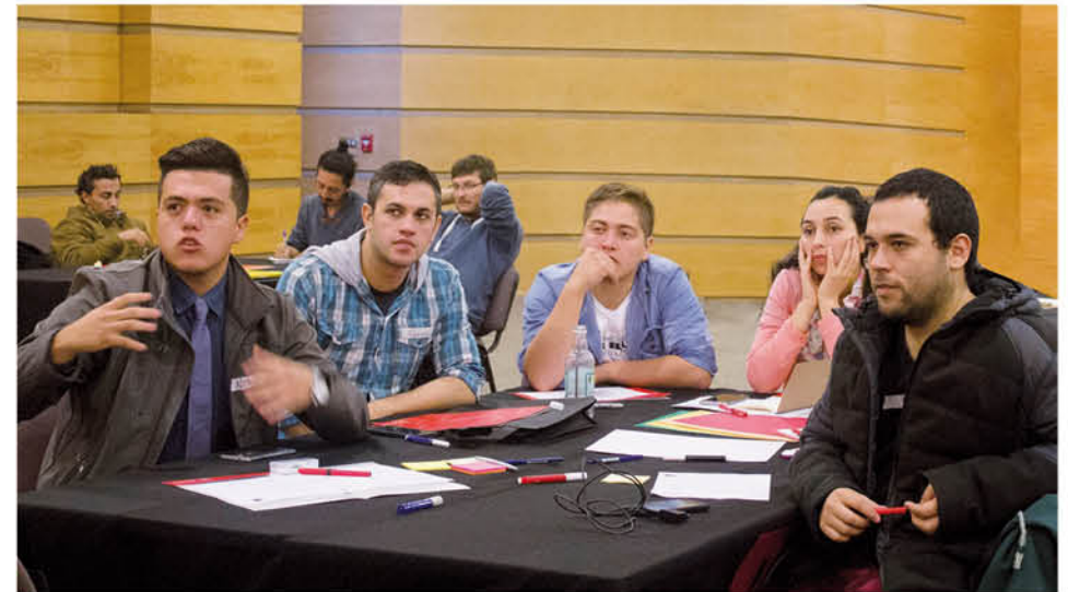
Todos los equipos seleccionados en el desafío 50 Ideas para mi Región están siendo asesorados y acompañados en el desarrollo de sus ideas de negocio, preparándose para la final regional y gran final nacional del desafío.

como los niveles de internacionalización y la absorción de la tecnología, junto con fomentar que los actores interactúen y estén dispuestos a colaborar desde sus capacidades y fortalezas. Así se genera el ambiente adecuado para recibir programas que entreguen las herramientas necesarias a los emprendedores para su desarrollo y crecimiento. Otro punto de mejora dentro de los ecosistemas de emprendimiento es su accesibilidad. La mayoría de los ecosistemas en Chile se encuentra inserto en estratos socio-económicos altos, por lo que tenemos el gran desafío de incentivar que estos sean abiertos, inclusivos y de fácil acceso a todas aquellas personas que deseen emprender.