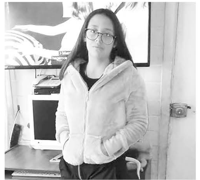
ESTA FOTOGRAFÍA corresponde al último registro de la menor en su casa.

Para mayores antecedentes sobre el paradero de esta joven su propia madre mani-