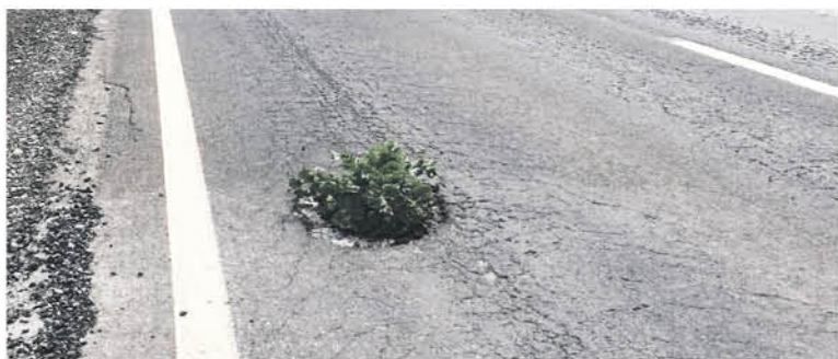
EL CONCEJAL SANHUEZA decidió hacer esta "protesta pacífica" para alertar a los conductores que transitan frecuentemente de por el camino Millantú- Santa Fe.

Vialidad, nosotros vamos a hacer lo que nos corresponde pero debemos esperar porque hay que aplicar asfalto que necesita ese camino".