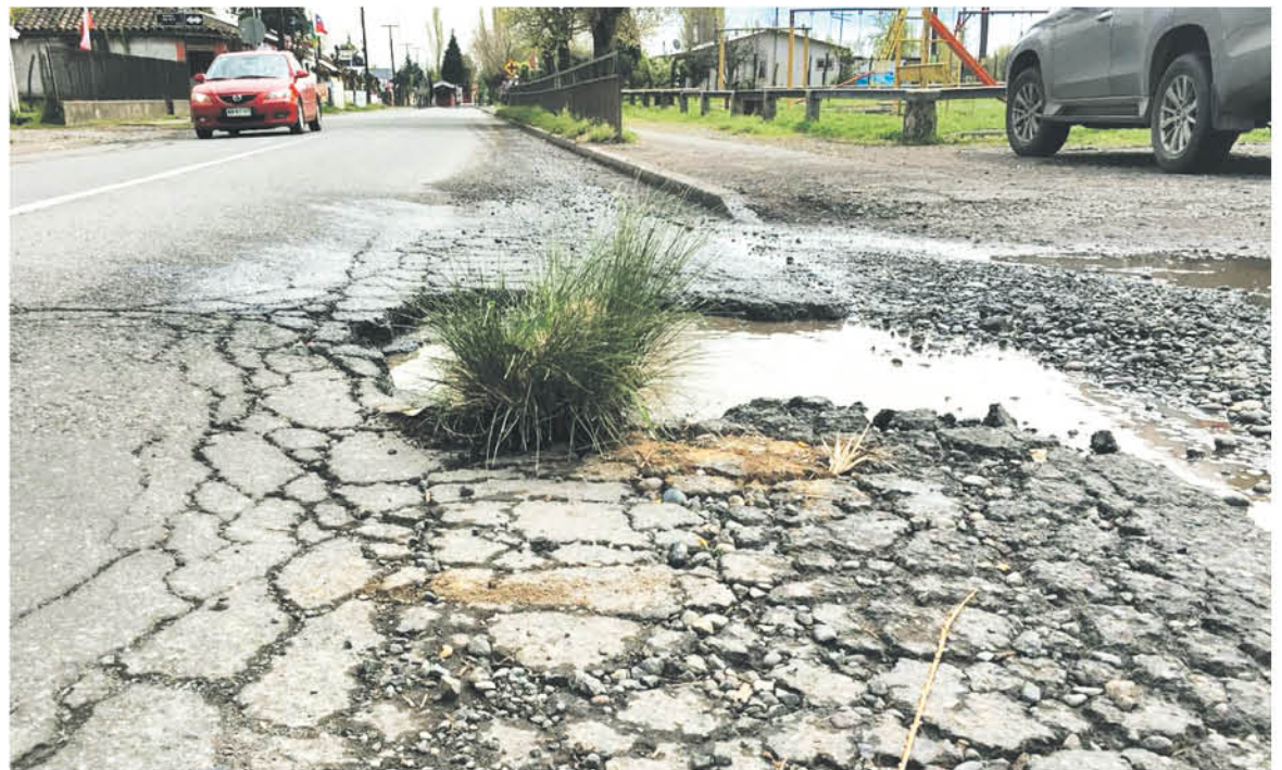
SON 8 KILÓMETROS CUBIERTOS DE BACHES que han producido daños en vehículos particulares y de transporte colectivo que transitan en esta vía.