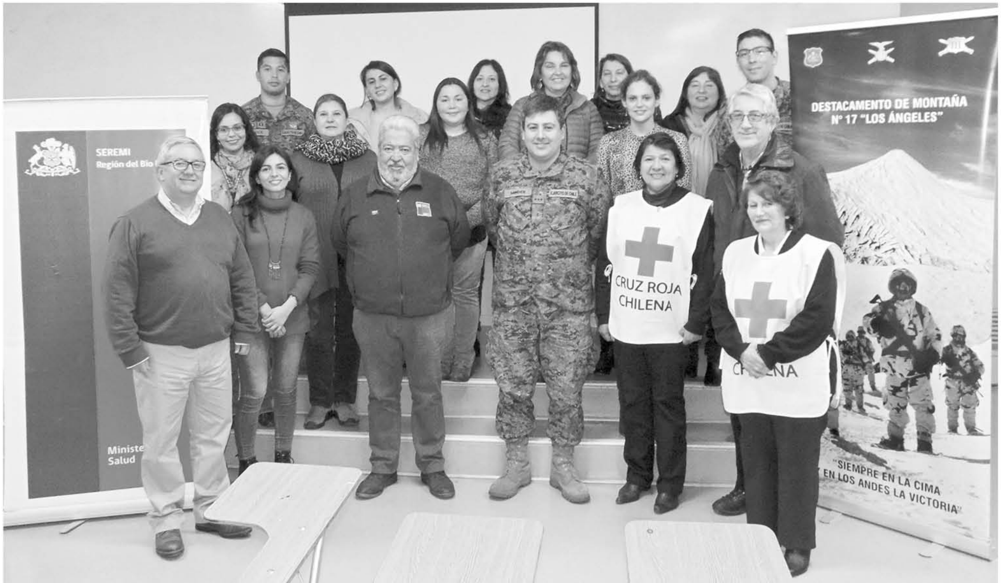
EN LO QUE VA DEL AÑO se han capacitado 200 funcionarios a nivel provincial.

Funcionarios de Ejército, de la Cruz Roja, de la Seremi de Salud, de la Municipalidad de Los Ángeles, del Centro de Atención a Víctimas y de la Conaf, entre otros, participaron de esta capacitación de equipos respondedores en casos de especiales.