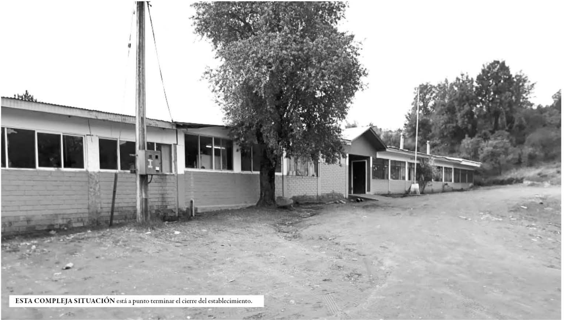
ESTA COMPLEJA SITUACIÓN está a punto terminar el cierre del establecimiento.