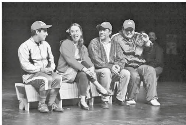
LAS AGRUPACIONES que aprovechen esta oportunidad tendrán recursos adicionales para traslado y alojamiento.

Como en la primera versión, las propuestas recibidas en esta convocatoria serán revisadas por un comité asesor, constituido por representantes de medios de comunicación regional, miembros del directorio de la Corporación Teatro Regional del Biobío y gestores culturales (no vinculados a proyectos postulados), quienes harán la selección de los proyectos.