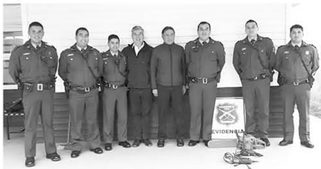
ESTE CIUDADANO ANGELINO, quiso hacer público sus agradecimientos a los oficiales de la comisaría René Sepúlveda Parraguez.

En un patrullaje preventivo, los oficiales lograron identificar una serie de especies con orden de robo las que portaba un ladrón conocido como “el jinete”.