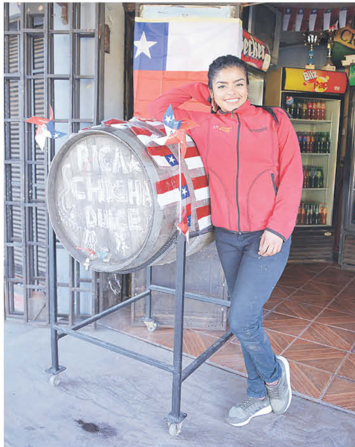
DATOS DEL GOBIERNO indican que por cada inmigrante que celebra el dieciocho en el país, hay dos chilenos que lo hacen en el extranjero.

“Se siente cómo las personas disfrutan con las cuecas, siento que hay mucho