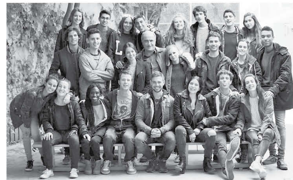
LA SERIE DE LOS PERIPATÉTICOS, así llama Merlí a su grupo de alumnos, ha dejado huella ciertamente, porque no es una historia más de instituto, sino que muestra las relaciones entre personajes de manera muy real y con mucha verosimilitud.

que era agorafóbico, temor obsesivo ante los espacios abiertos.