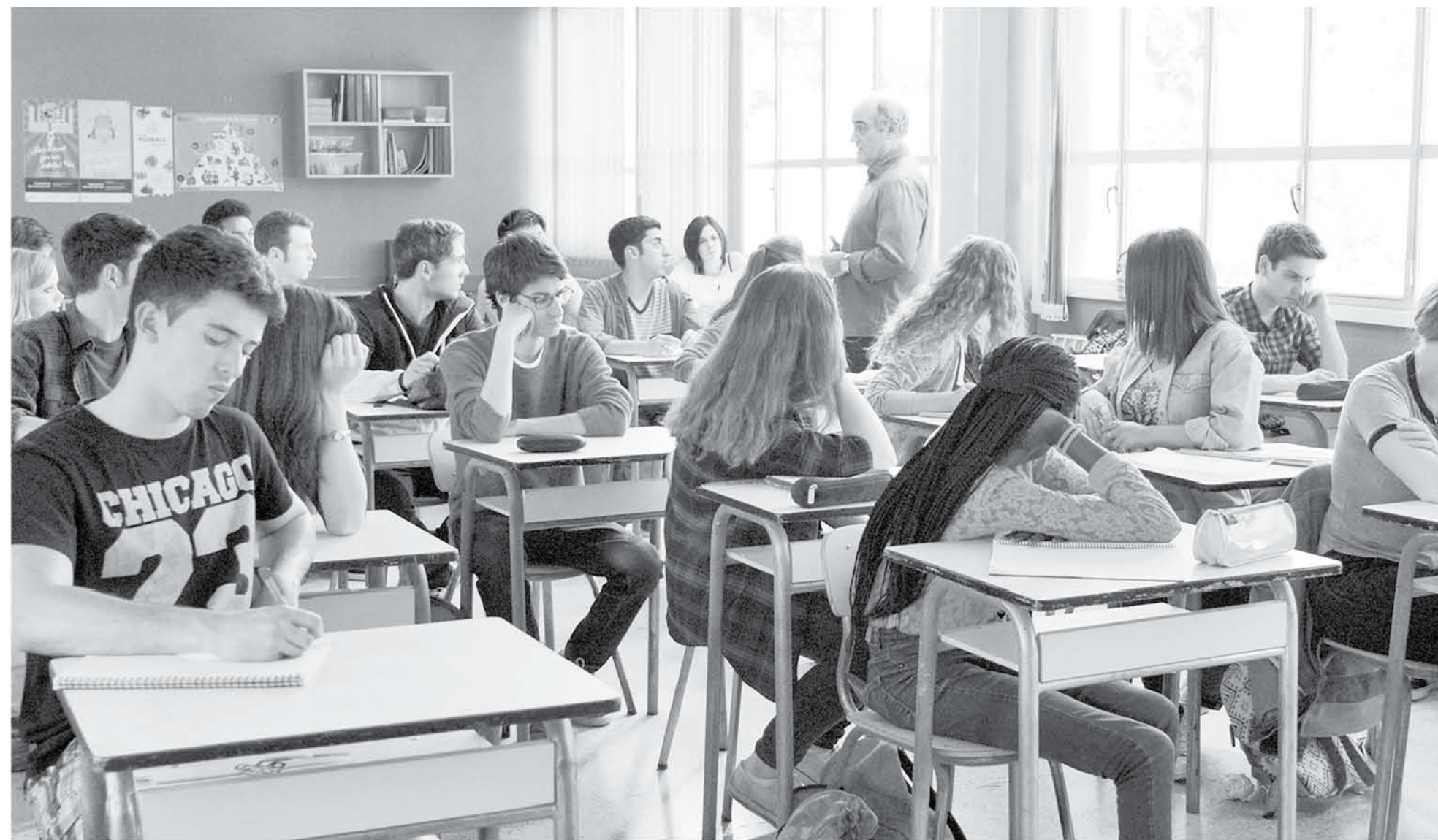
LA SERIE CATALANA DE MERLÍ se ha convertido en todo un fenómeno en Latinoamérica desde que Netflix la emite en streaming.

Es una serie protagonizada por un profesor de filosofía atípico, llamado Merlí, que comenzó en el canal autonómico TV3 de Cataluña (España) grabada en catalán, y que se ha convertido en un fenómeno mundial. Netflix la ha distribuido en Latinoamérica y ha arrasado en todos los países donde se ha visionado.