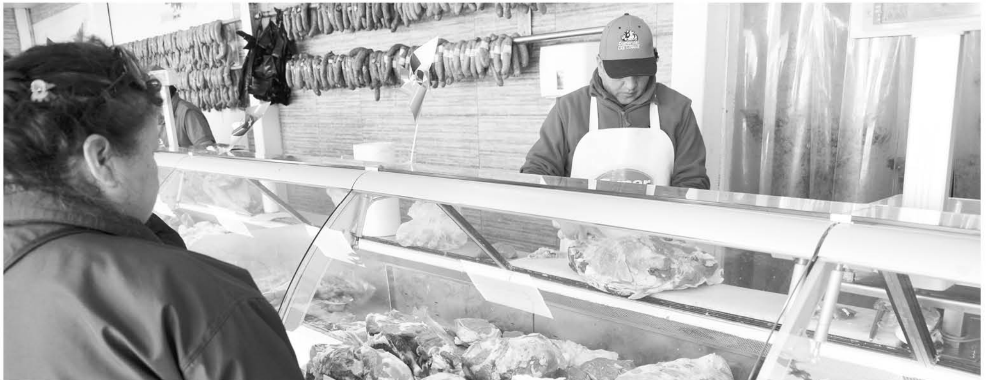
LA CARNE SE CONVIERTE en el centro de atención de quienes celebrarán estas Fiestas Patrias en torno a la parrilla.

Si la carne le resulta jugosa al cortarla, no crea que está cruda, recuerde que las carnes crudas no son jugosas. La carne estará cocida si su color varía entre rojizo y rosado.