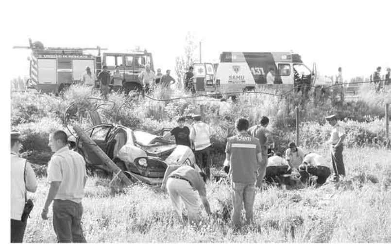
ENTRE 2016 Y 2017 los accidentes aumentaron en un 15% y en 2017 hubo 39 detenciones por conducir en estado de ebriedad.

Posterior a ello, el hermano de esta valiente mujer -quien relata esta historia con un nudo en la