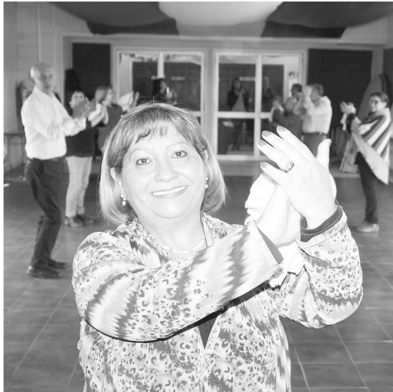
En la actualidad trabaja a tiempo completo realizando diversas clases a niños, jóvenes y adultos mayores.