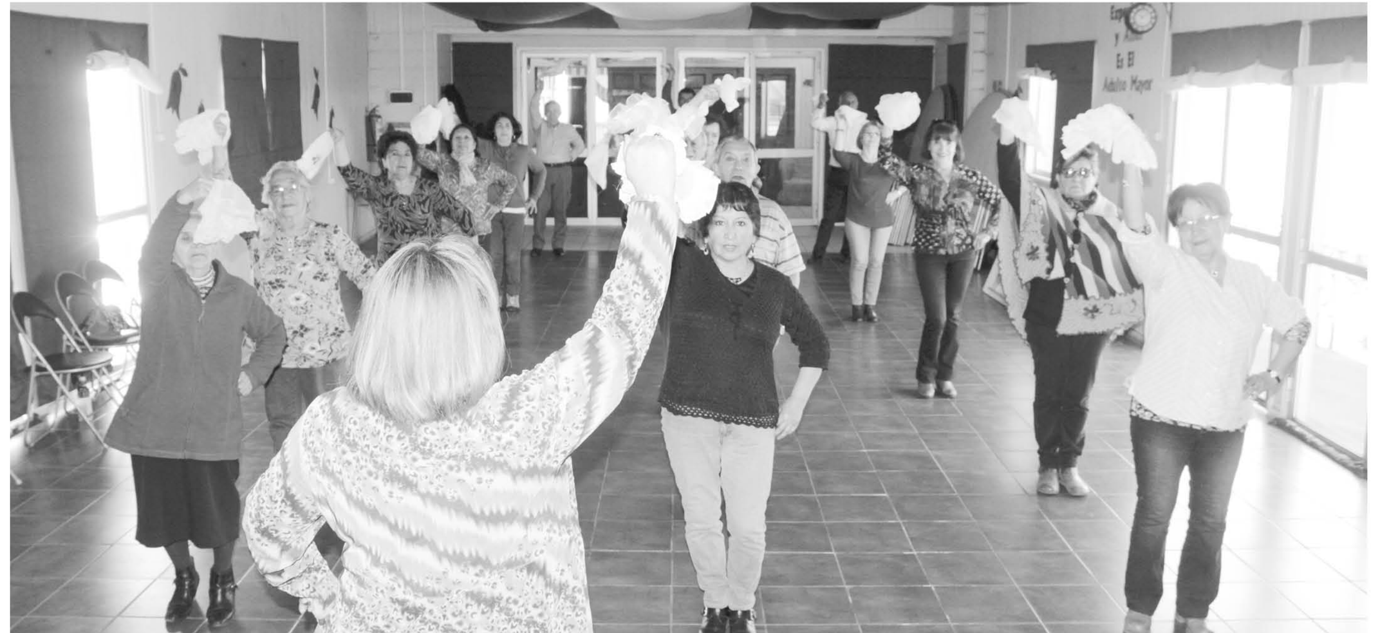
Pese a que su padre no quería que estuviera en un conjunto, logró hacer una vida en torno al folclor.

Sobre la forma en cómo convenció a su progenitor que la deje disfrutar de lo que ama, nos cuenta: "Yo tenía como 17 años más o menos y, por ser menor, tenía que