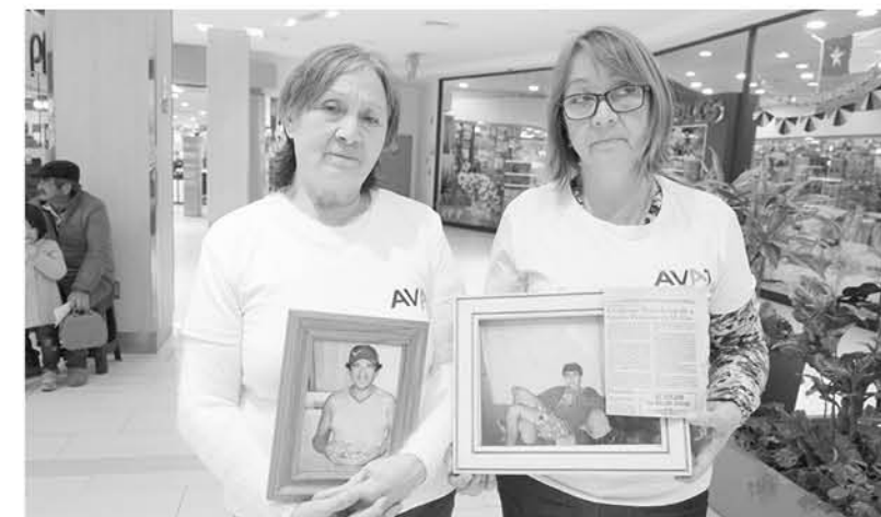
ESTA FAMILIA EXPLICÓ QUE, este año, un puesto de la larga mesa estará vacío debido a un accidente vehicular.

garganta- explica que su hermano agonizó durante ocho días en la UCI de Los Ángeles, lo que terminó con su vida a los 52 años.