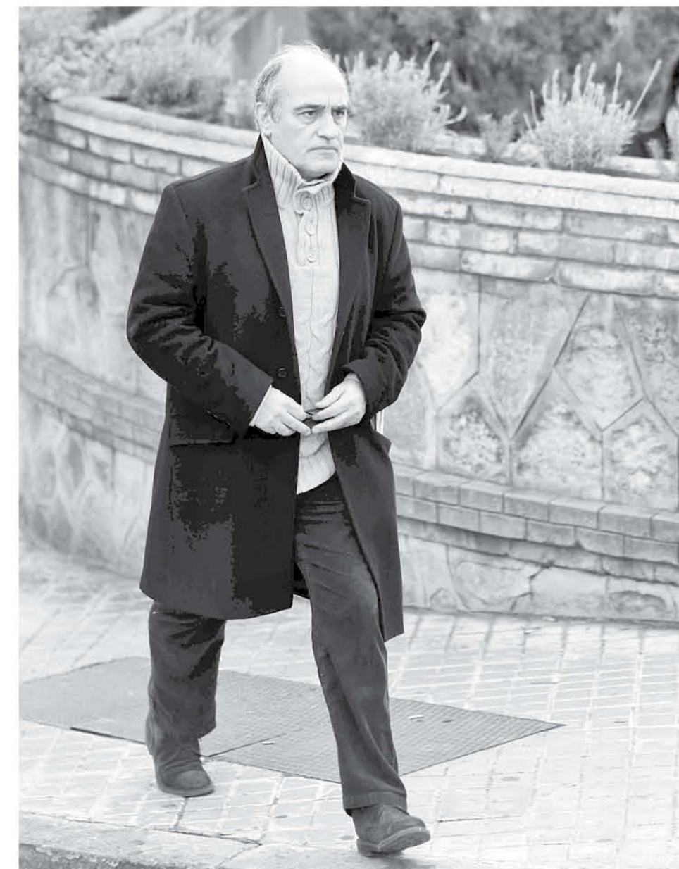
ORELLA CUENTA CON 40 AÑOS de carrera en el mundo de la actuación y ha participado en películas como Alatriste (2006) o Los Ojos de Julia (2010).

Este último se ha convertido en todo un hito de adolescentes y fans de la serie, ya que interpreta al malo de la clase, con un carácter chulesco y un tanto inapropiado, a veces, sin embargo, es un chico sensible con problemas que no sabe cómo resolver.