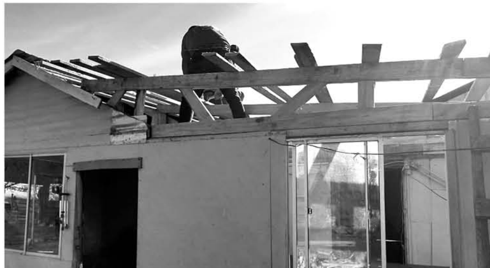
CON LA AYUDA DEL SECTOR PÚBLICO Y PRIVADO, con sus propias manos Carabineros ayudó a reparar la casa.

Debido a filtraciones producto de las lluvias, las condiciones del hogar no eran las mejores, por lo que la Patrulla de Atención a las Comunidades Indígenas y la Oficina Comunitaria ayudaron a esta persona.