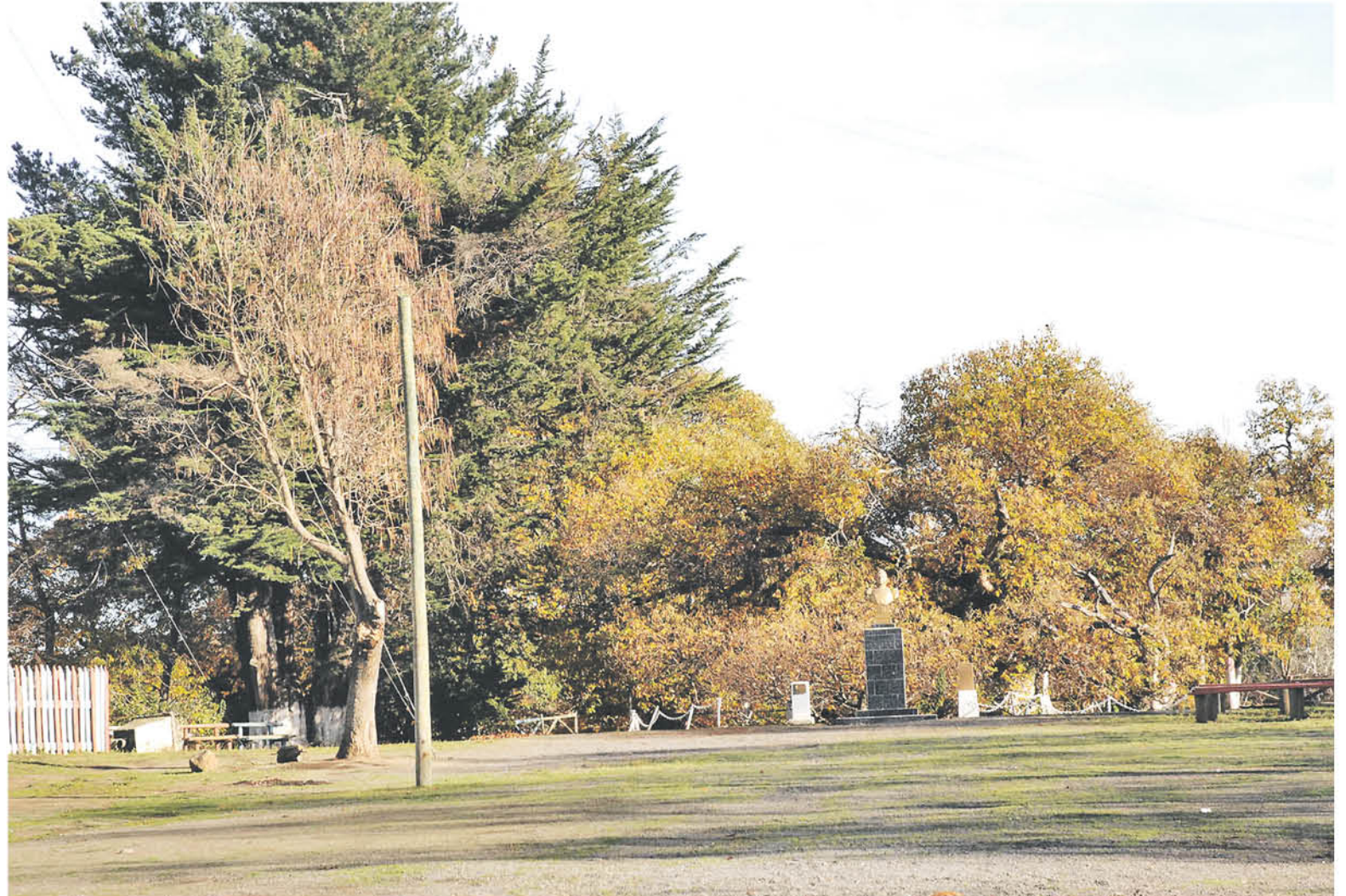
EL LEGADO DE SU PADRE le permitió materializar los ideales de independencia que albergó desde muy joven por la tierra en que nació.

"El padre de la Patria, que siempre tuvo una vida modesta y una subsistencia económica precaria, el legado de su padre le dio estabilidad económica y pudo disponer de bienes que le permitieron hacer florecer y materializar