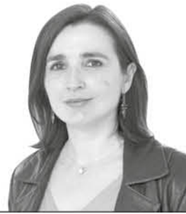
Viviana Fernández Escuela de Negocios Universidad Adolfo Ibáñez

Chile experimentó un aumento notable en la productividad del trabajo en el sector minero entre 1978 y 2004, principalmente debido al descubrimiento y desarrollo de nuevas minas y a la innovación y las nuevas tecnologías. Sin embargo, desde 2005 en adelante la productividad ha disminuido notablemente.