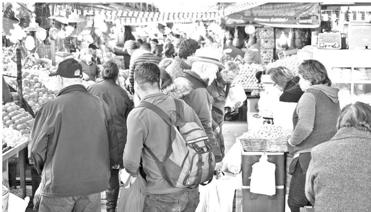
ANTE EL AUMENTO DE CIUDADANOS se espera un considerable crecimiento de la dotación policial en las principales calles de la ciudad.

De igual manera, el prefecto de Biobío agregó que el llamado principal se basa en evitar los excesos, para no poner en riesgo a