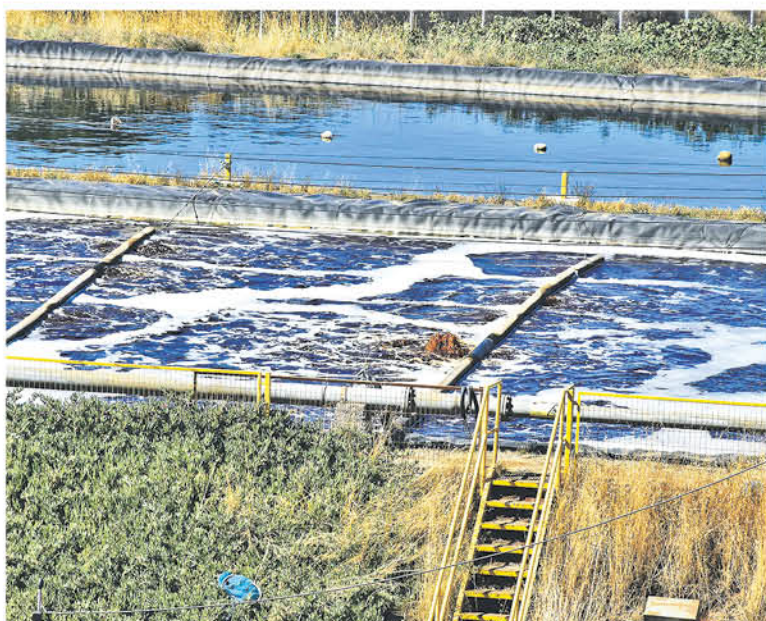
KDM es el titular del proyecto “Relleno sanitario Los Ángeles” que funciona con la resolución ambiental N° 252

“El proyecto está diseñado para la recepción de residuos sólidos domiciliarios o industriales asimilables a domiciliarios, generados principalmente por la comuna de Los Ángeles y cercanas, dentro de la provincia del Biobío.”