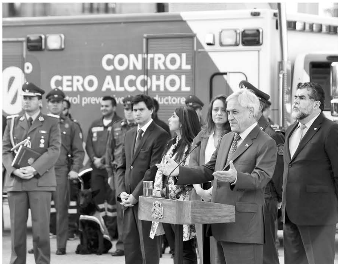
EL PLAN ANUNCIADO POR EL PRESIDENTE busca fundamentalmente prevenir accidentes de tránsito derivados de la conducción bajo los efectos del alcohol.

La medida contempla la disposición de 40.000 Carabineros en servicio ordinario más 15.000 de servicio extraordinario por día.