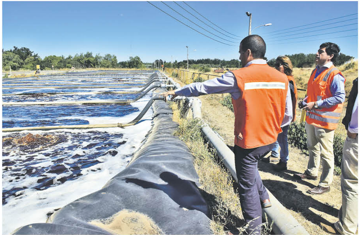
DE ACUERDO A LA FISCALIZACIÓN realidad por el personal de SMA se encontraron hallazgos que permitieron cursar un documento donde se advierte a los dueños del relleno que pasará si no regularizan lo que está fallando.

De acuerdo a lo anterior, el concejal angelino manifestó que “por ello se hizo el sumario con objetivo