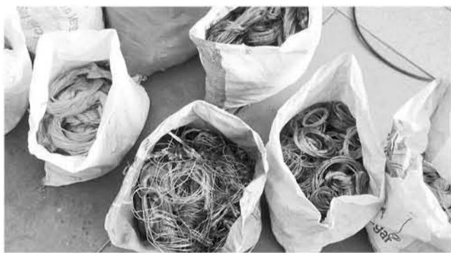
ESTE NUEVO IMPLICADO mantendría relación con el primer detenido en la compra y venta de este material.

Según explicó Carabineros, se trataría de un hombre de 60 años, quien mantendría lazos comerciales con el primer detenido del hecho.