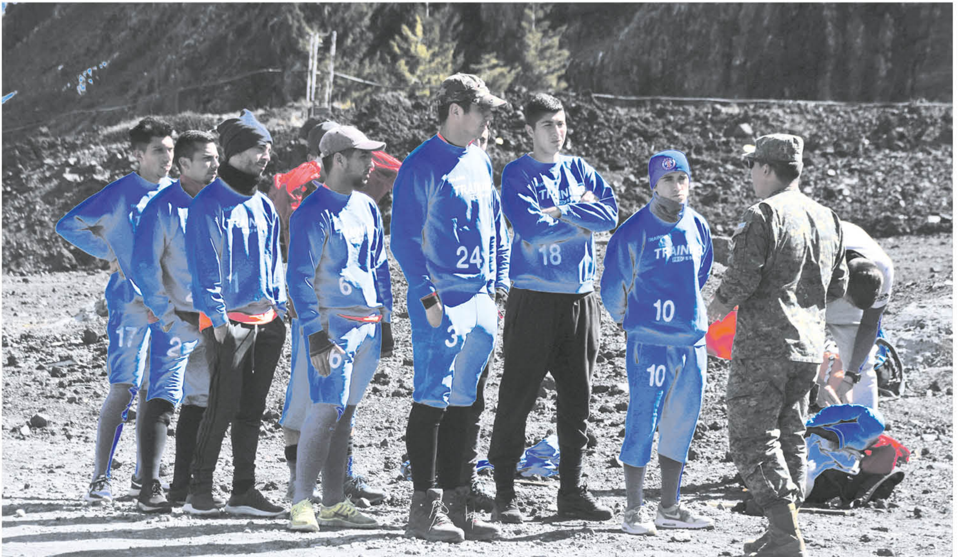
DEPORTES IBERIA tendrá su primer encuentro en la liguilla de ascenso frente a General Velásquez este 23 de septiembre.

En lo más alto de la montaña, el cuadro azulgrana dirigido por Patricio Almendra realizó una intensa jornada de preparación de cara a la compleja liguilla de ascenso.