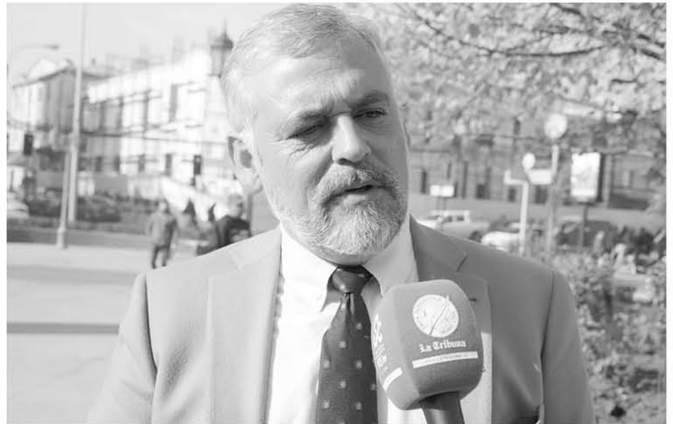
SERÁN CINCO DÍAS en los que emprendedores locales tendrán la oportunidad de ofrecer sus productos a los turistas.

Asimismo, recalcó que en caso de querer hacer uso de cualquiera de sus servicios turísticos de la región, como alojamiento, turismo aventura, entre otros, preferir aquellos que estén registrados formalmente con Sernatur para así evitar malas experiencias.