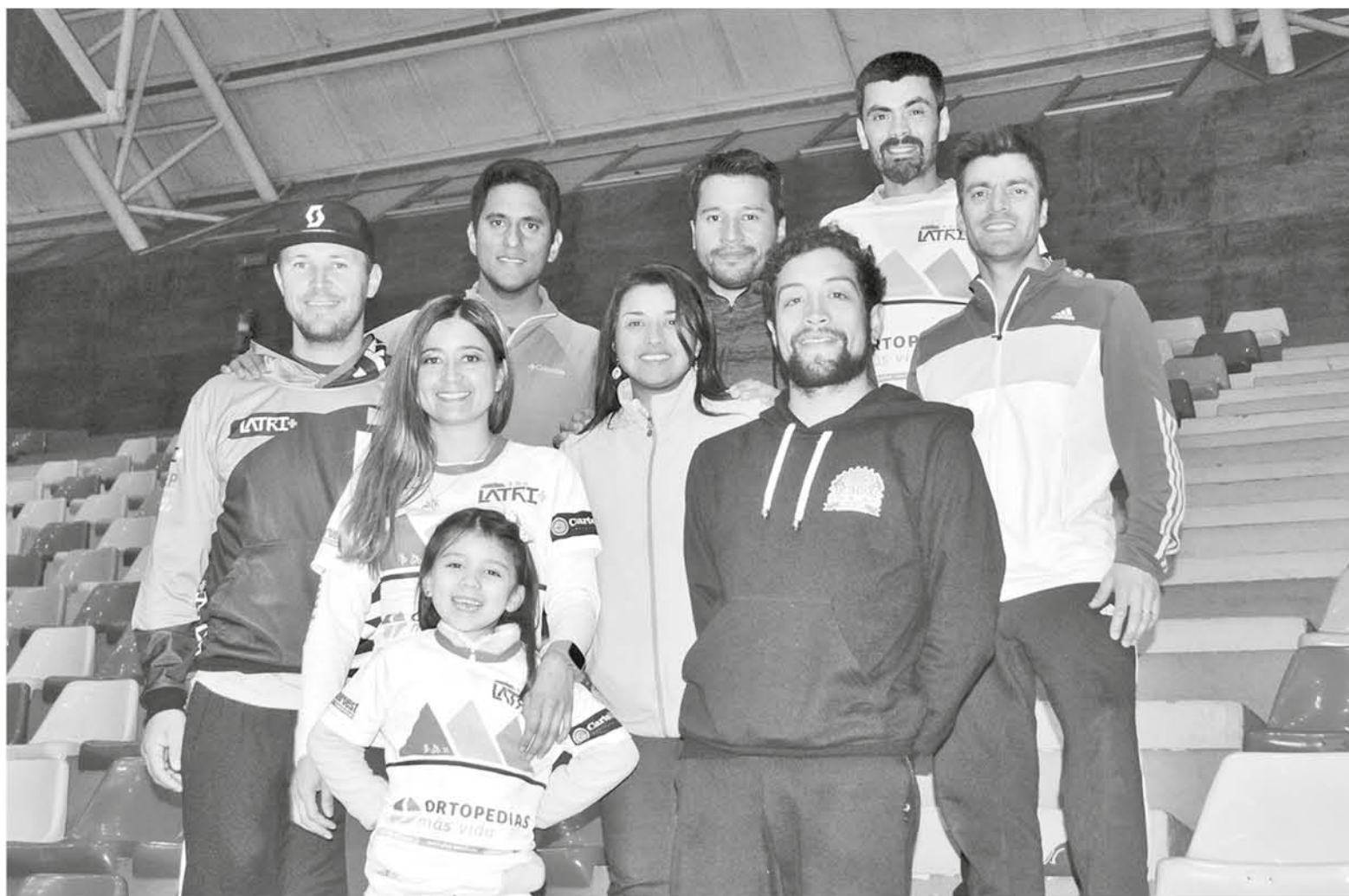
ALGUNOS INTEGRANTES PREPARAN con el equipo desafíos individuales, pero siempre sacando la cara por Latri Endurance.

Estos deportistas destinan muchas horas al entrenamiento para sentirse cómodos con las competencias y obtener buenos resultados, como quedó demostrado en su última prue-