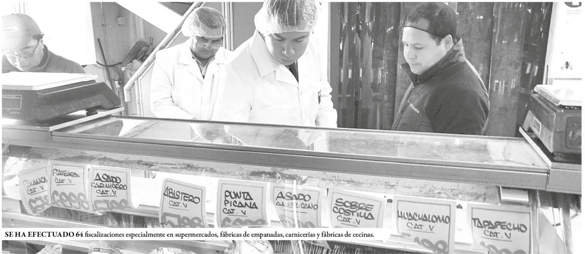
SE HA EFECTUADO 64 fiscalizaciones especialmente en supermercados, fábricas de empanadas, carnicerías y fábricas de cecinas.