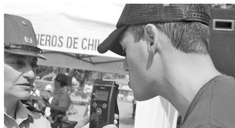
EN LA PROVINCIA DE BIOBÍO, la Prefectura Biobío ya trabaja en una planificación que apunta principalmente a aumentar los controles carreteros.

El Servicio Nacional para la Prevención y Rehabilitación del Consumo de Drogas y Alcohol (Senda), junto con Carabineros, realizará más de 20 mil controles de alcotest, aumentando un 60 por ciento respecto del 2017, en todo el país. A estos se suman los más de 50 mil que efectuarán las fuerzas policiales.