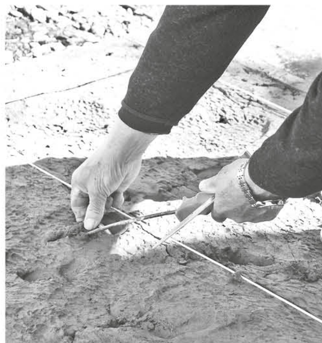
ESTA ES LA RUEDA FINAL del campeonato de rayuela que lleva jugándose desde principios de este año.

Tras el comienzo de la segunda rueda del Campeonato Oficial de Rayuela 2018, donde Pedro Aguirre Cerda nuevamente ganó y sumó unidades para seguir imbatible en lo máximo de la tabla con 218 unidades, seguido por Orompello con 190 y El Sauce, bastante lejano, con 160 puntos.