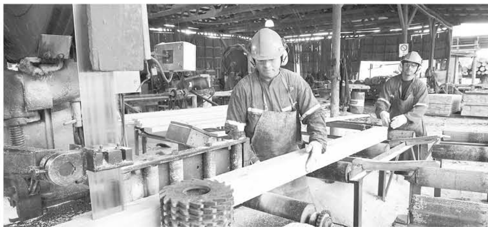
LA INICIATIVA busca apoyar a los Gestores Energéticos de las empresas PYME en la búsqueda de oportunidades de mejora de consumo energético de sus instalaciones.