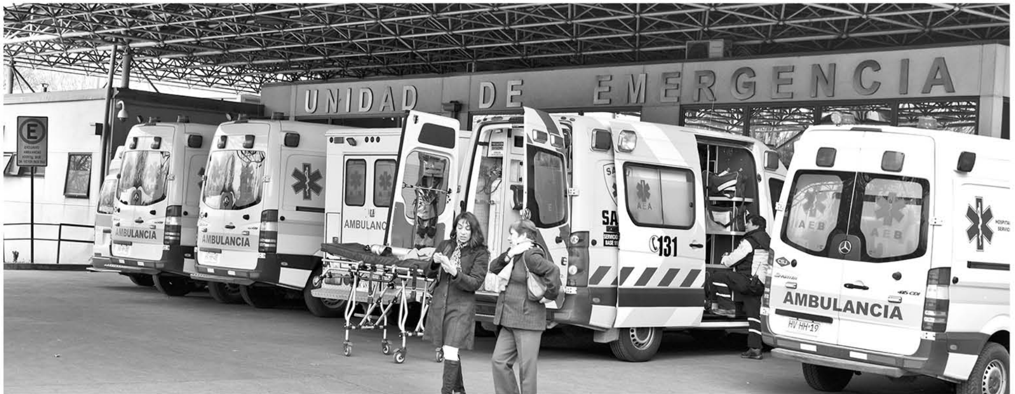
COMIENZA EL REFORZAMIENTO en los servicios de salud de toda la provincia, incluyendo urgencias, SAMU y atención primaria, entre otros.