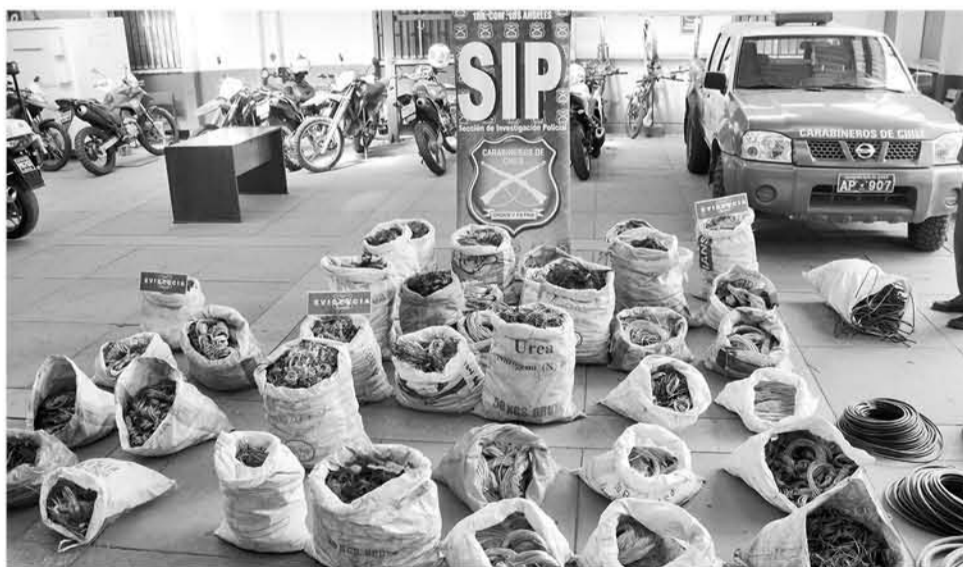
EL MATERIAL ERA REUNIDO en diferentes sacos para ser trasladado de Los Ángeles.