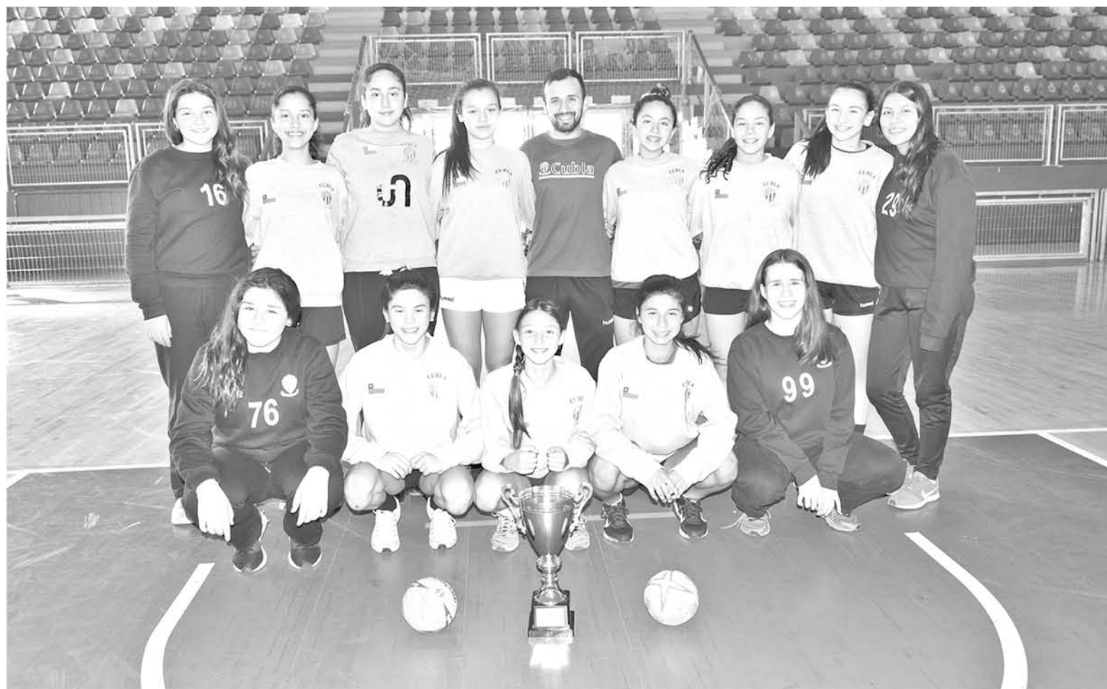
LAS CHICAS ENTRENAN PESAS, cancha y hasta artes marciales para mejorar su desempeño en los encuentros.

En cuanto al triunfo nacional, comentó que todo fue gracias a un trabajo intenso donde el camino no ha sido fácil, asegurando que