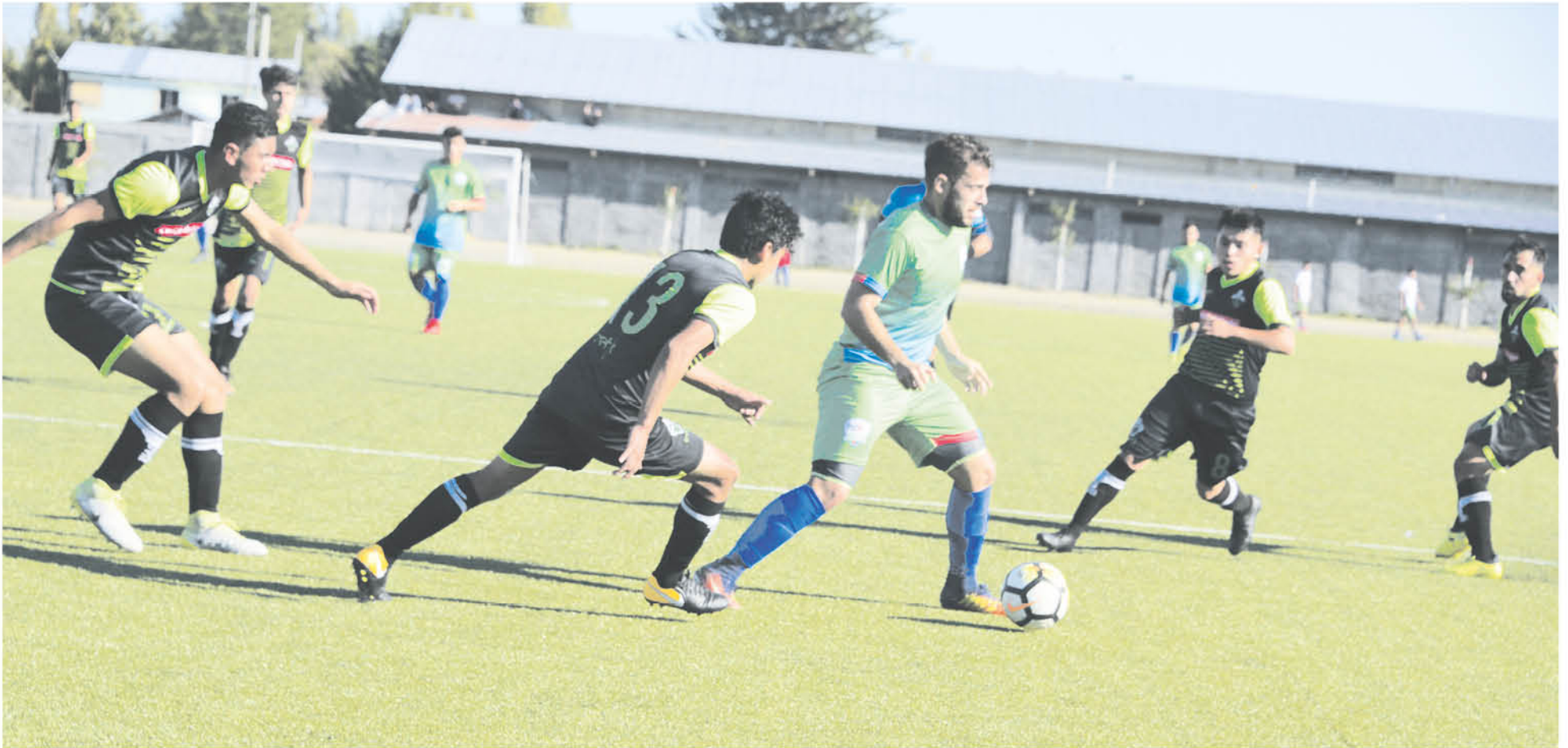
LA PRIMERA FASE del hexagonal de ascenso concluirá con los encuentros consecutivos de Comunal Cabrero.

Tras la negación de Buenos Aires de Parral a invertir la localía, el cuadro verde deberá enfrentar al León de Collao en su próximo encuentro válido por la liguilla para subir de categoría.