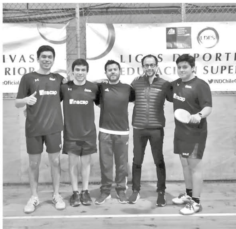
LA SELECCIÓN tuvo que viajar contantemente a Concepción para jugar los encuentros, pero aun así logró imponerse.

rían mostrar su mejor desempeño, porque el evento deportivo es a nivel nacional y está auspiciado por el Instituto Nacional de Deportes", pero aseguró que de todas formas "se puede competir con las universidades grandes, ya que eliminamos a la UdeC y la UCSC, que eran los equipos más fuertes".