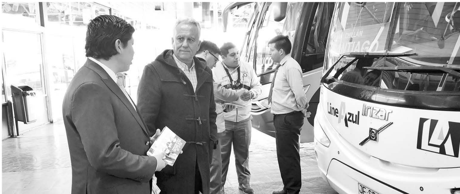
UNO DE LOS BUSES FISCALIZADOS por las autoridades. Los pasajeros recibieron también información de precaución.

Solo en la mañana de este miércoles 12 se cursaron cinco infracciones y hubo dos prohibiciones de salida en Los Ángeles. Uno de estos últimos casos se trató de un bus fiscalizado por el gobernador Ignacio Fica y el seremi Jaime Aravena.