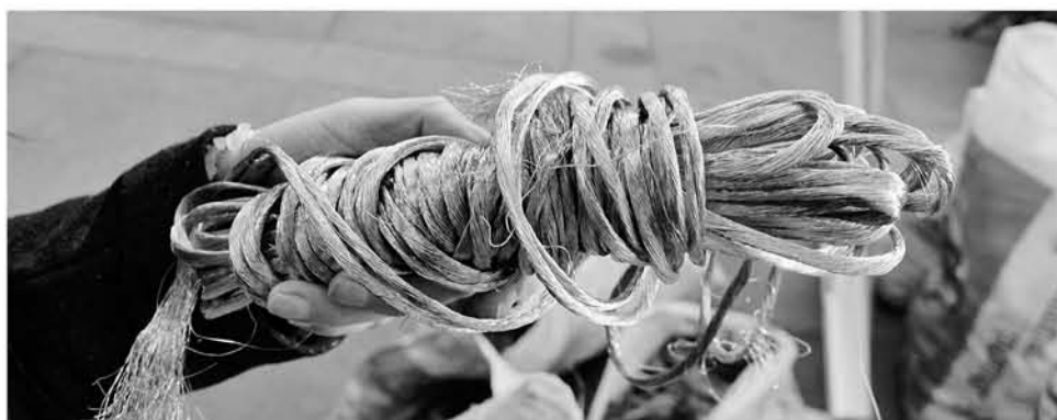
LA CANTIDAD COBRE incautada en este procedimiento, alcanzó cerca de una tonelada de material.

La detención se llevó a cabo cuando oficiales incautaron un local comercial, donde un hombre apilaba esta importante cantidad de material, el que estaba listo para ser trasladado.