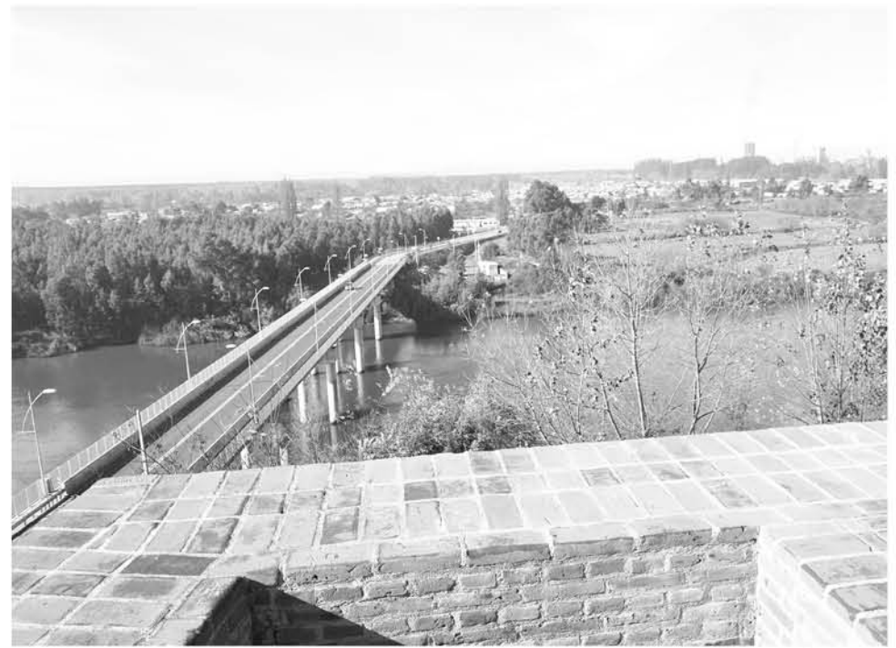
LA INICIATIVA es parte de la red de 20 parques que el Ministerio ejecuta a nivel Nacional.

bió, enfatizó que "tenemos un desafío grande, el ideal según la Organización Mundial de la Salud -OMS- es 9 metros cuadrados por habitante, y estamos trabajando para eso",