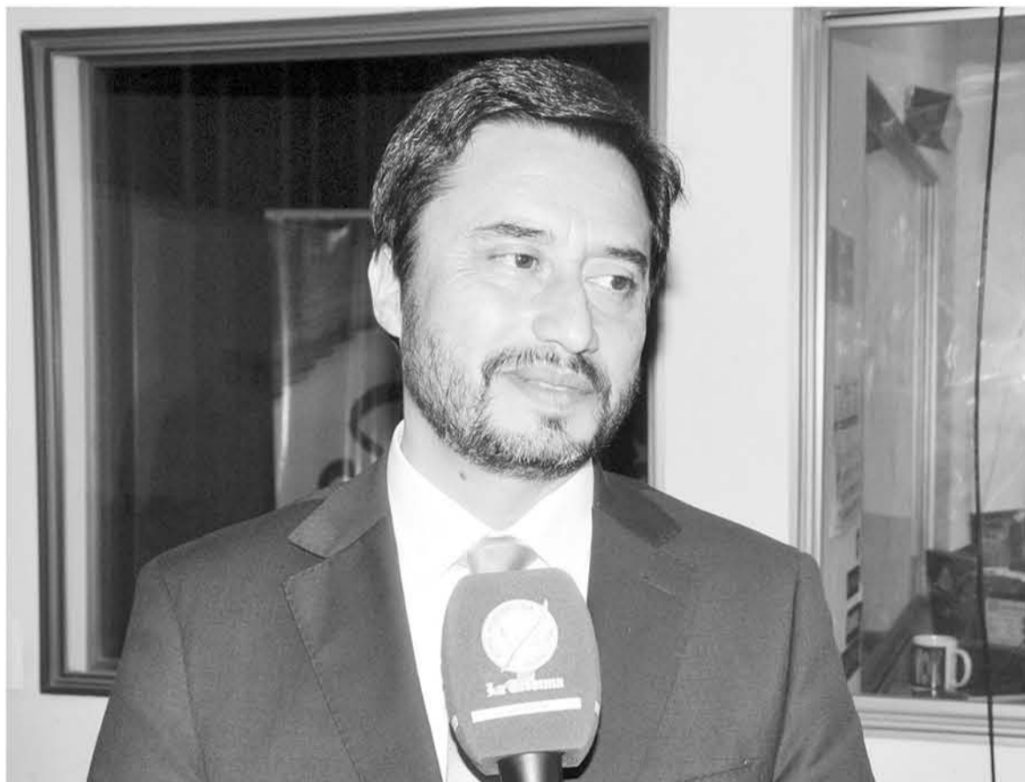
SEGÚN INFORMACIONES DE PRENSA, el seremi de Energía, Rodrigo Torres, este lunes se presentó a trabajar, negándose a firmar su renuncia.

ca rotundamente, porque, además, le hace un daño al propio Gobierno”, sentenció el presidente distrital del gremialismo.