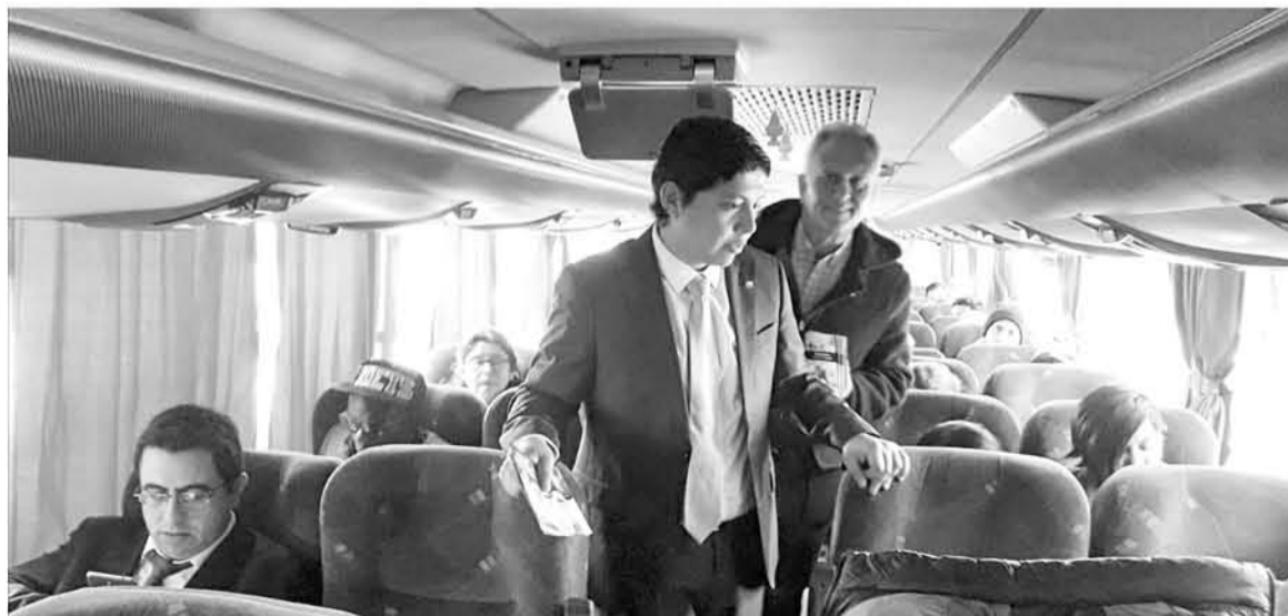
SEREMI DE TRANSPORTE Y GOBERNADOR de Biobío comentan la inhabilitación a una de las máquinas para iniciar su recorrido.