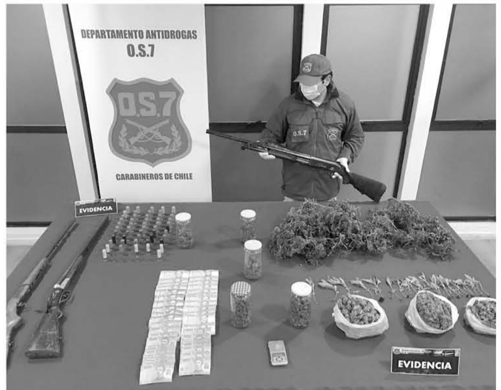
EL OPERATIVO FUE REALIZADO por personal de OS7 de Los Ángeles, luego de diversas investigaciones por parte de los oficiales.