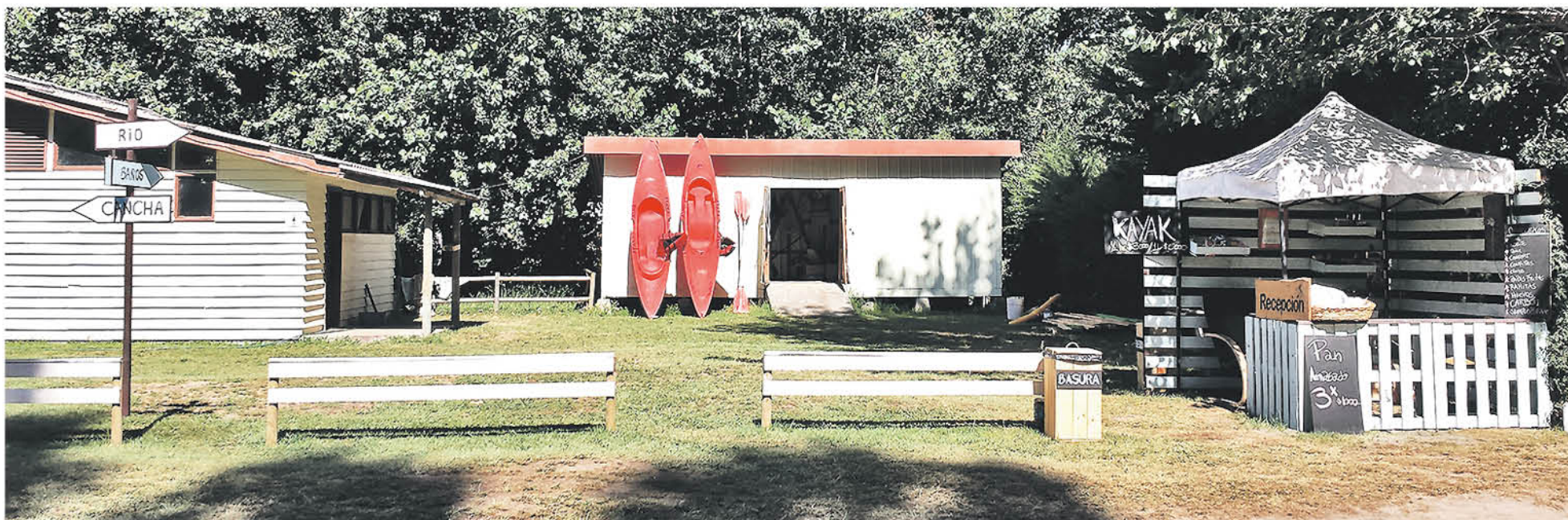
CAMPAMENTO PARA NERDS tiene como objetivo reunir a aficionados a la ciencia en un entorno natural y turístico.