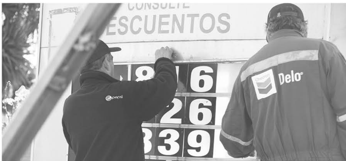
DESDE HOY, las gasolinas de 93 y 97 octanos aumentarán su valor en 5,7 y 5,8 pesos por litro, respectivamente.

Desde este jueves los combustibles aumentarán su valor un promedio de $10 pesos por litro.