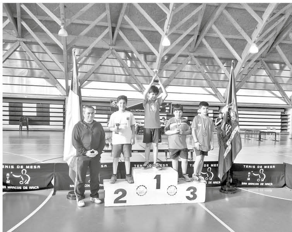
EL JOVEN SE ACERCA con paso firme al primer puesto del ranking nacional.