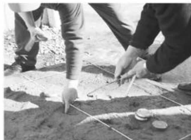
EL CAMPEONATO de rayuela se juega en distintos lugares de la ciudad de Los Ángeles.