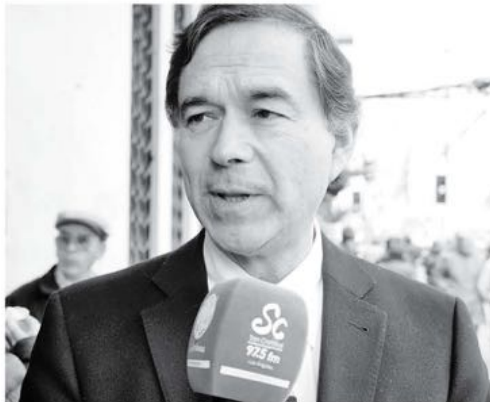
EL DIPUTADO NORAMBUENA aseguró que se debe considerar la opinión de la ciudadanía y áreas donde existan falencias para mejorar.

gobierno, ya que no todos los meses pueden ser positivos, asegurando que "hay trimestres buenos y malos. Espero que las cosas se sigan haciendo mejor para que el Gobierno se acomode un poco más en cuanto a las cifras, porque, si le va bien al Gobierno, le va bien al país".