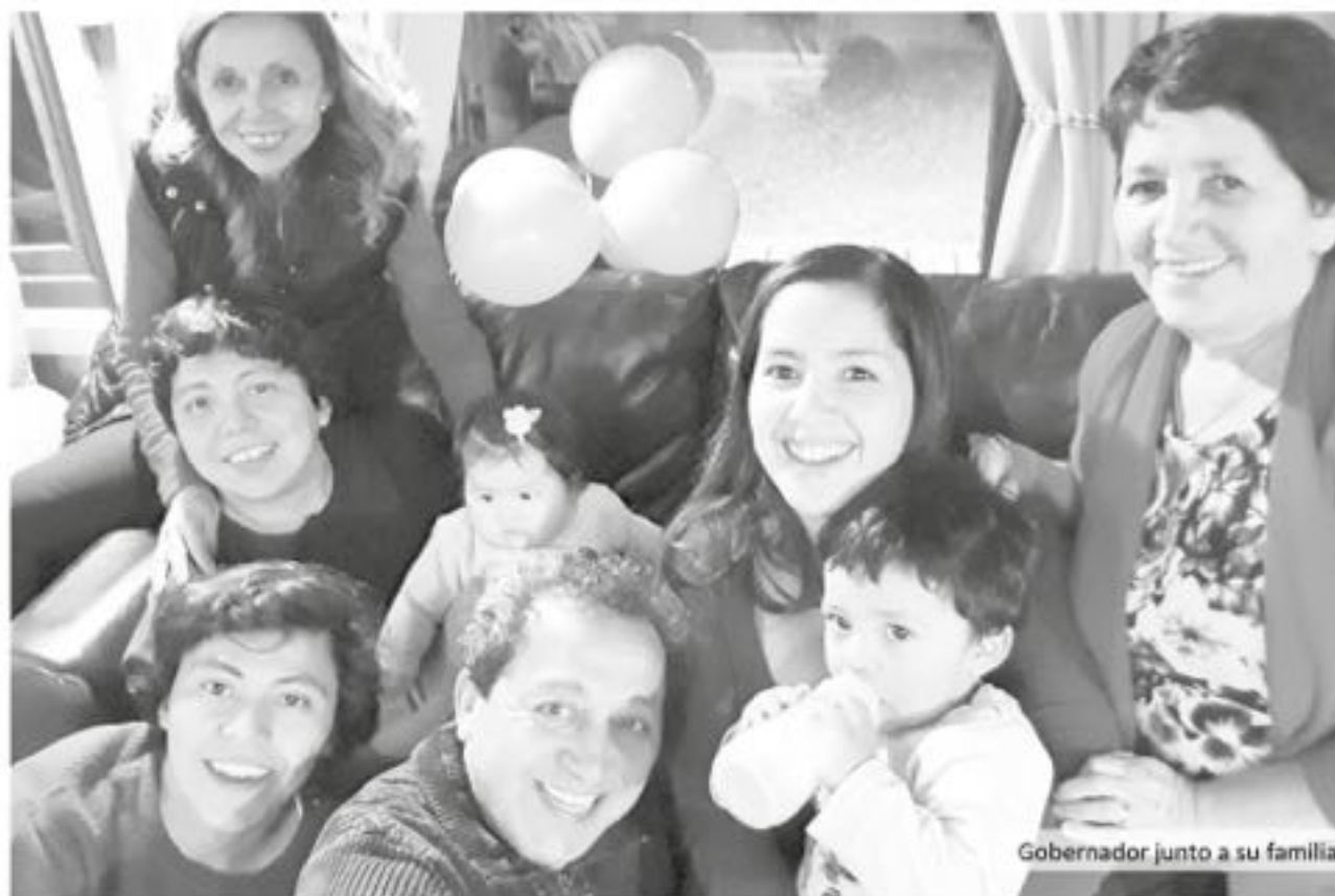
Gobernador junto a su familia.

"Es vital ser joven en este puesto, porque creo que todo en la vida tiene que cumplir un ciclo, y que, por ende, todo debe ir renovándose, y una de las cosas que se tiene que renovar, por una necesidad imperiosa, es la política, y eso incluye a nuestros actores políticos, los dirigentes y también nuestras autoridades". "Nuestra sociedad es la que se va actualizando, por lo