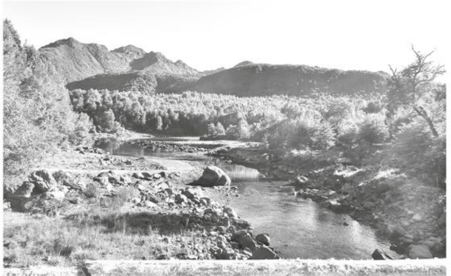
EL RÍO RUCÚE queda en un lugar llamado Los Cajones, a los pies de la montaña Sierra Velluda, muy cerca de Los Ángeles.

A la ribera de este río concurre gran canti-