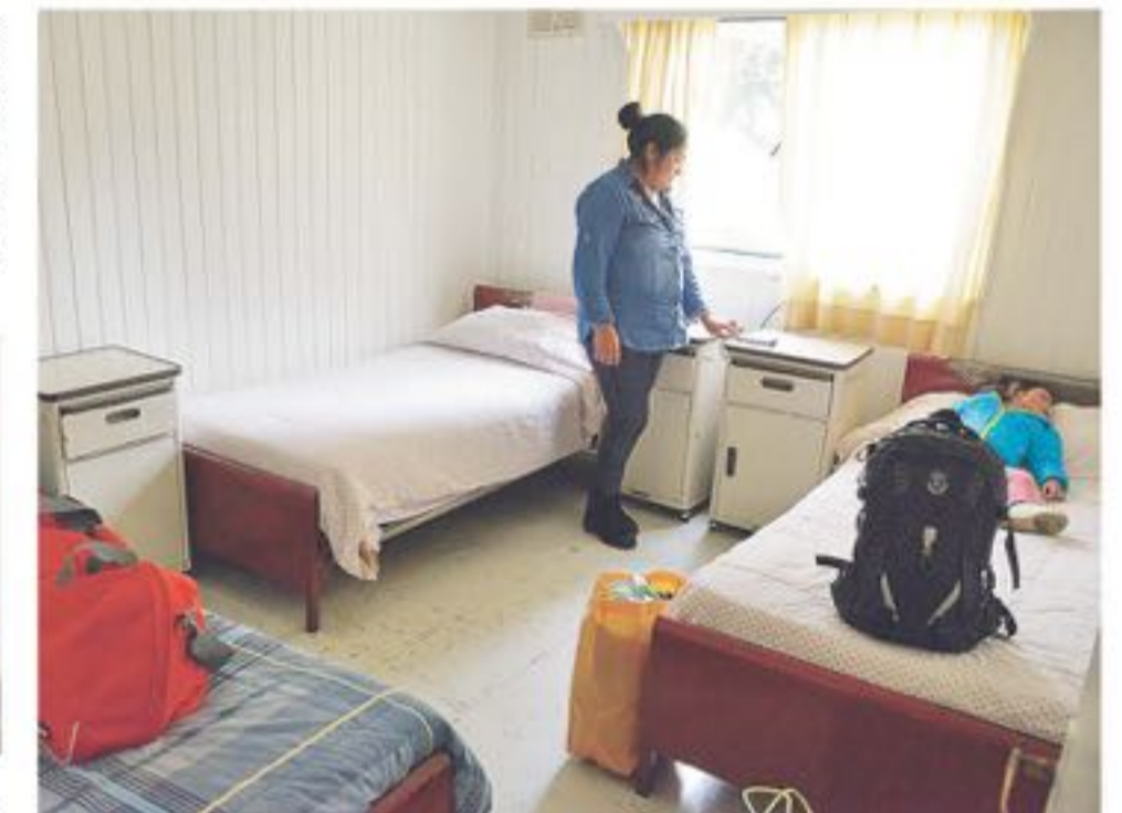
LA INFRAESTRUCTURA del Hogar de la Madre Campesina permite que las madres tengan una permanencia digna y feliz en esta nueva etapa de vida.

En esta unidad se brinda albergue a usuarias del programa de la mujer, con residencia en sectores rurales o alejados a la ciudad de Los Ángeles.