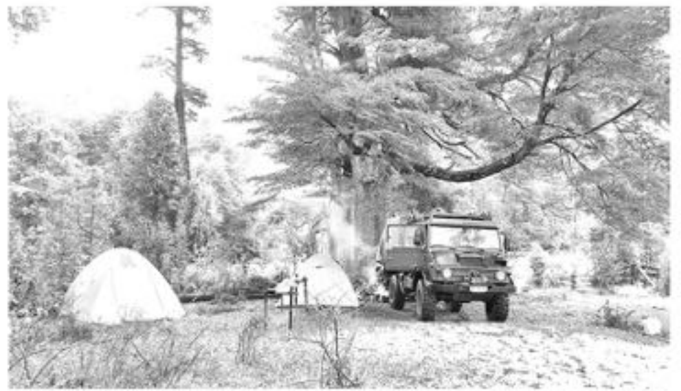
EN SUS ALREDEDORES se puede acampar alrededor de áreas verdes durante gran parte del año.

En resumen, el Río Rucúe es un lugar donde se puede pasar un momento de tranquilidad, por su vegetación prominente coronada por una maravillosa flora y árboles nativos que junto a sus aves logran un conjunto que turistas de todas partes podrán admirar tanto en invierno como las siguientes estaciones del año.