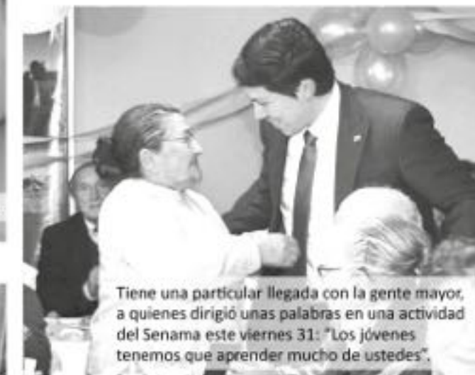
Tiene una particular llegada con la gente mayor, a quienes dirigió unas palabras en una actividad del Senama este viernes 31: "Los jóvenes tenemos que aprender mucho de ustedes".