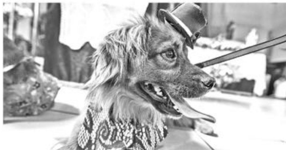
A la hora de mimar y consentir: según Zulily, el 92 % de los “millennials” compra regalos de todo tipo a sus mascotas, y no solo lo hacen en ocasiones especiales como cumpleaños o Navidad: el 51 % lo hace al menos una vez al mes.

Además, el 57 % de “millennial” cuentan con su veterinario a la hora de tomar decisiones acerca de sus mascotas, frente al 42 % de sus predecesores. Del mismo modo, el 50 % de ellos sigue los consejos del especialista al pie de la letra, a diferencia del 31 % de miembros de generaciones anteriores.