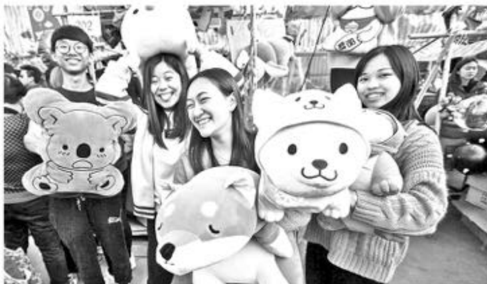
A la hora de vivir el amor, el 45 % de los “millennial” necesitarían que su mascota “aprobese” a su pareja a la hora de iniciar una relación. Y para el 41 %, es mejor acurrucarse junto a sus compañeros peludos que con sus amantes.

Parece que, para estos jóvenes del milenio, la tecnología digital y las tendencias modernas no lo son todo: las mascotas, ocupan un importante lugar.