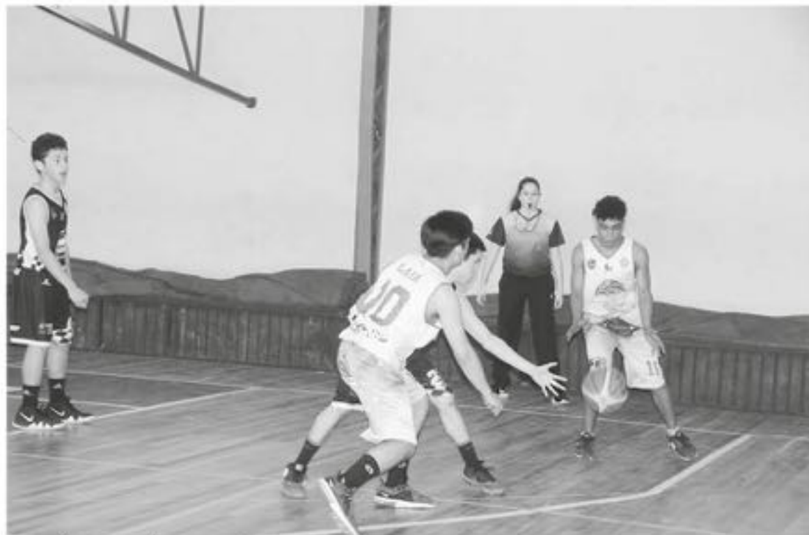
LOS NIÑOS TENDRÁN COLACIONES, premios y otros incentivos en este evento masivo.

Hay que destacar que dentro de los convenios que existen del IND con las distintas municipalidades, en Nacimiento existen 11 talleres deportivos, dentro de ellos, las Escuelas Deportivas EDI, que realiza eventos a nivel provincial de distintas disciplinas.