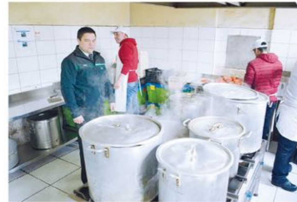
Todos los hombres que cumplen condena en este recinto pueden formar parte de los diferentes talleres ocupacionales que se dictan diariamente.

Algunas de las actividades que estas personas privadas de libertad pueden realizar son folclore, trabajos textiles, artesanía en madera, otros pueden realizar su educación