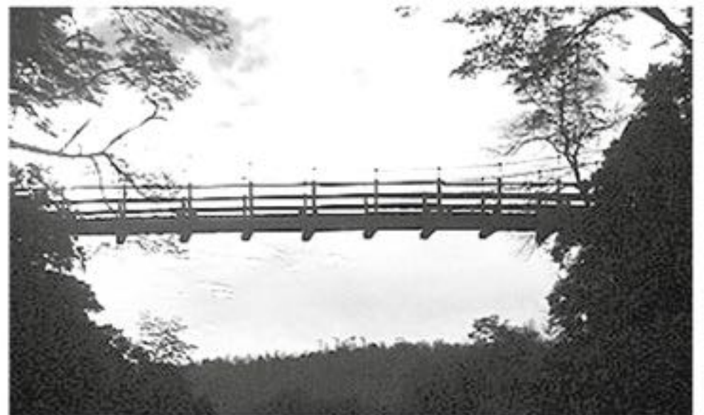
VISITAR EL PUENTE es un destino obligado para todos los turistas y aventureros.