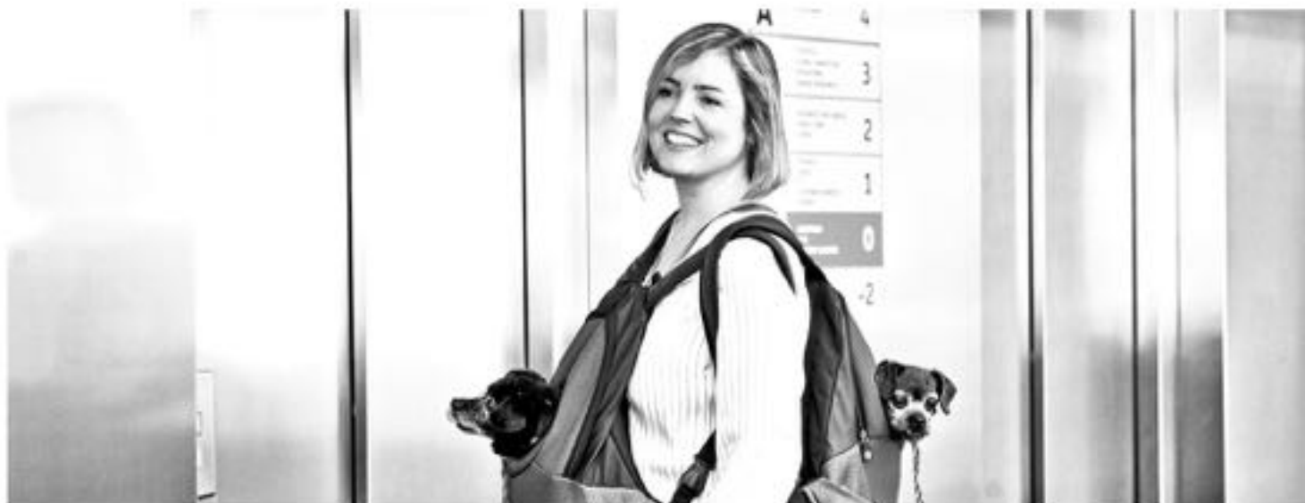
La preocupación por sus compañeros animales, tan similar a la de los padres con los hijos, se ve reflejada a la hora de mimar y consentir.

La costumbre de tener mascotas se remonta a mucho tiempo antes de que existieran la última generación del pasado milenio: jóvenes nativos digitales, nacidos entre los 80 y el año 200, conocidos como “millennial” o “Generación Y”. Sin embargo parece que, del mismo modo que han hecho con otros hábitos y costumbres, esta generación ha logrado un gran impacto en cómo se ve a los animales de compañía.