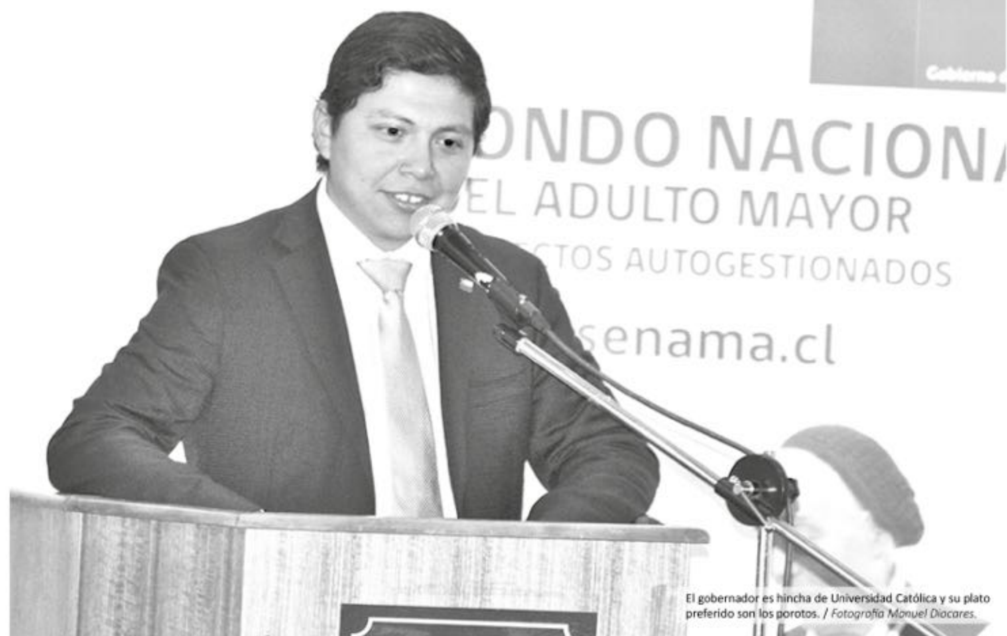
El gobernador es hinchista de Universidad Católica y su plato preferido son los porotos.