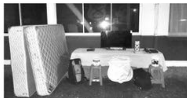
LOS IMPLICADOS HABRÍAN sustraído electrodomésticos, colchones y otros implementos de esta vivienda.

Posterior a esto, fueron puestos a disposición del ministerio público todos los implicados, quienes pasaron a control de detención, donde se pudo conocer que los implicados eran dos parejas.