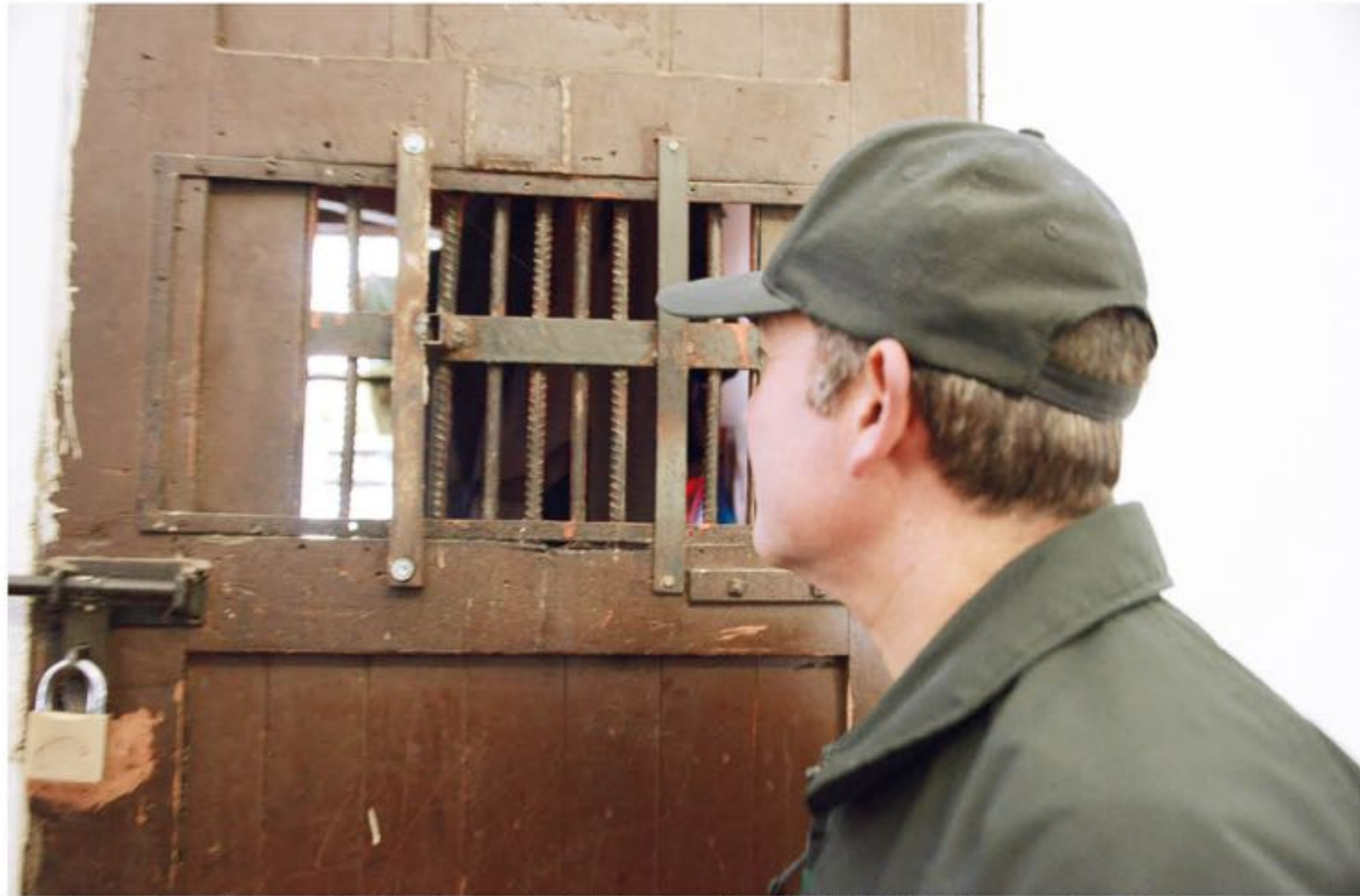
En este lugar se mantiene actualmente un total de 1.700 reclusos provenientes de distintos puntos de la provincia del Biobío, el 60% de ellos corresponde a Los Ángeles.