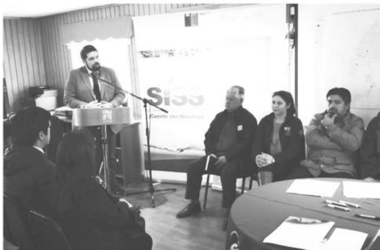
UN TOTAL DE 80 ESTANQUES distribuidos en diferentes puntos de la ciudad, los que fueron analizados y estudiados estratégicamente para este proceso.

Es la segunda capital provincial de la región del Biobío en la que se implementa esta iniciativa, la que se enmarca en la firma de un protocolo de emergencia que permitirá regular el abastecimiento alterno bajo condiciones de desastres.