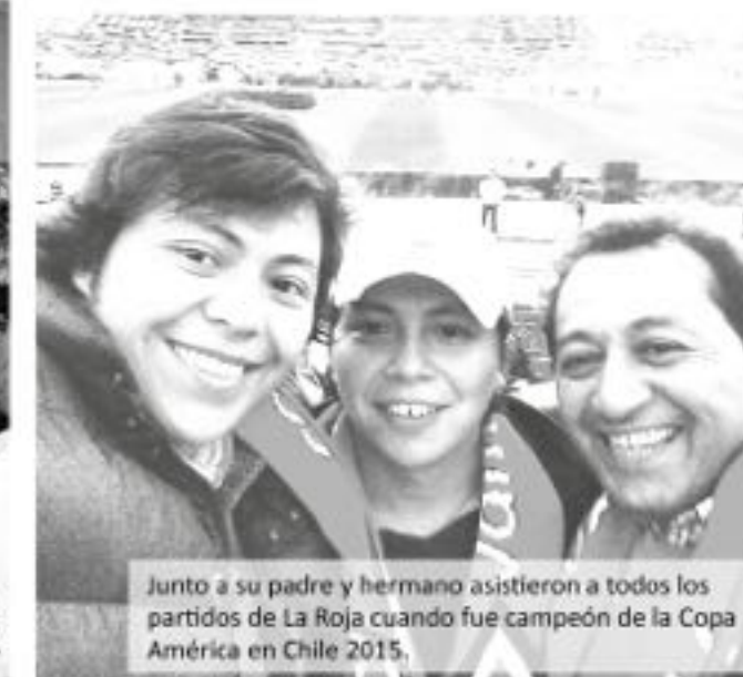
Junto a su padre y hermano asistieron a todos los partidos de La Roja cuando fue campeón de la Copa América en Chile 2015.