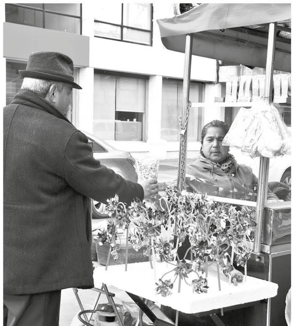
NO SÓLO CELEBRARÁN su aniversario, sino que además darán la bienvenida al Mes de la Patria.