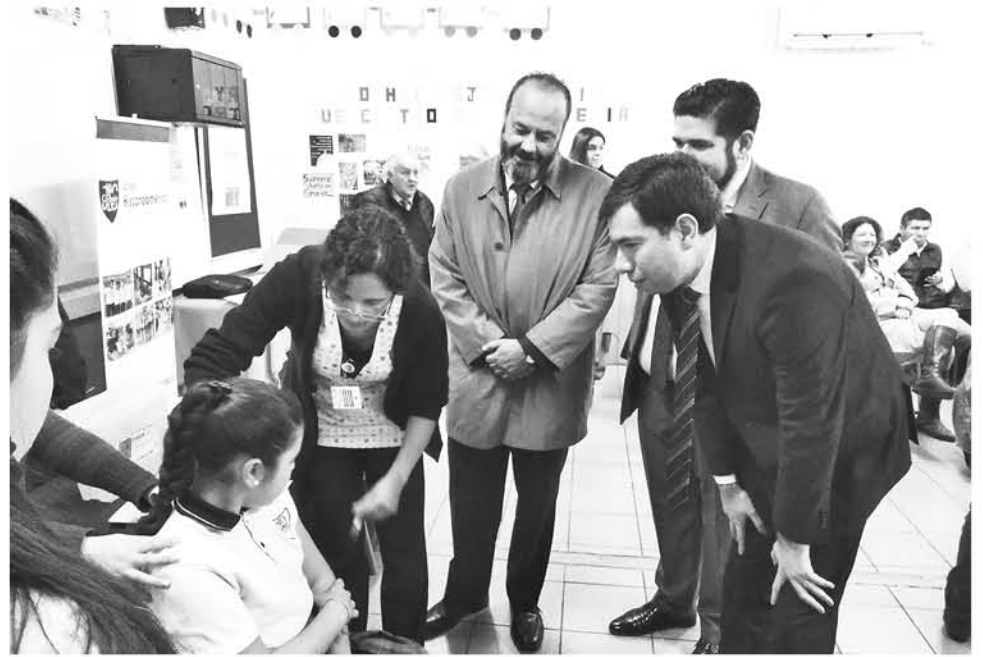
SON CASI 6000 niñas de cuarto y quinto básico que se espera se inmunicen entre otras patologías.

Durante la actividad del lanzamiento de vacunación escolar, además de representantes de la gobernación pro-