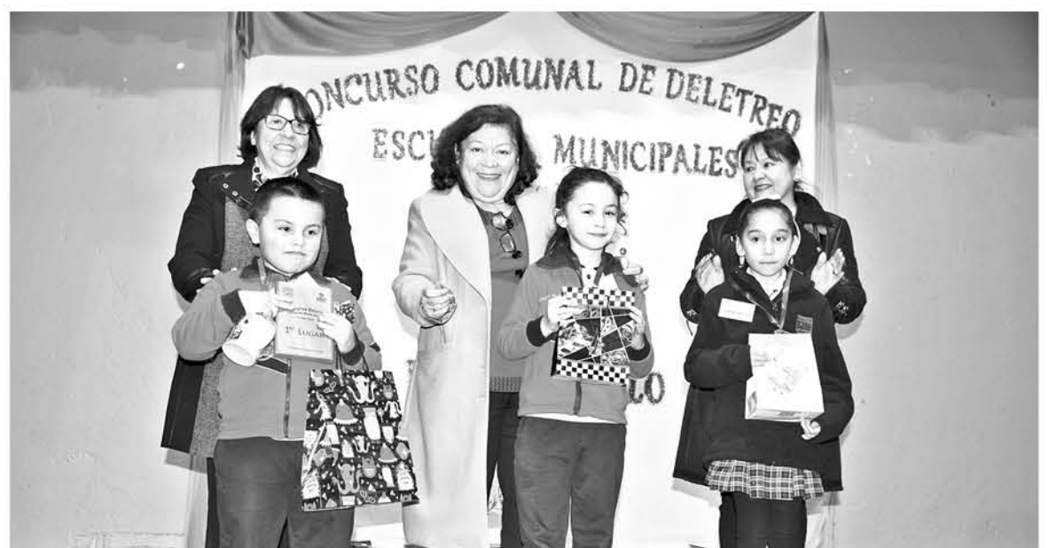
LAS ESCUELAS ESPAÑA y General José de San Martín destacaron en el podio.

Del mismo modo, declaró estar contenta por la buena participación de alumnos que llegaron al certamen y dijo que "se agradece un montón el compromiso de los otros establecimientos, que estén trabajando con sus niños a la par con nosotros para lograr estas habilidades que cuesta desarrollar en este mundo global que existe ahora y que es necesario