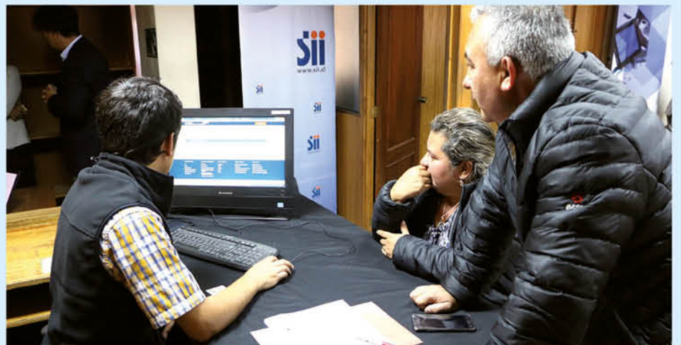
La Universidad Inacap acompaña en los procesos de digitalización de las empresas de menor tamaño, a través del Centro de Desarrollo MyPE Inacap. Un ejemplo de ello es la Operación Renta, que año a año ayuda a las empresas a cumplir con sus obligaciones tributarias.

cesamiento, plataformas de gestión de servicios, todos elementos del vocabulario actual y futuro de las Pymes.