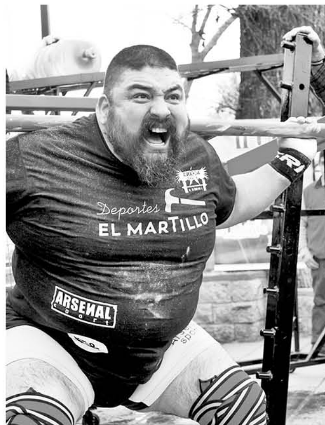
LA CANTIDAD DE ANGELINOS representando en el panamericano demuestra que en Los Ángeles sí se levanta peso.

Hay que destacar que, para que pudieran asistir a