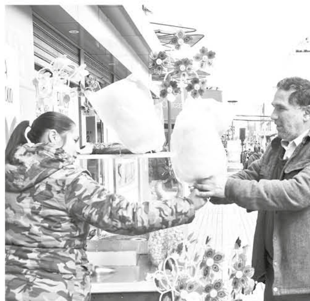
LA ACTIVIDAD se ha convertido en una tradición de todos los años y que cada vez congrega a más personas.