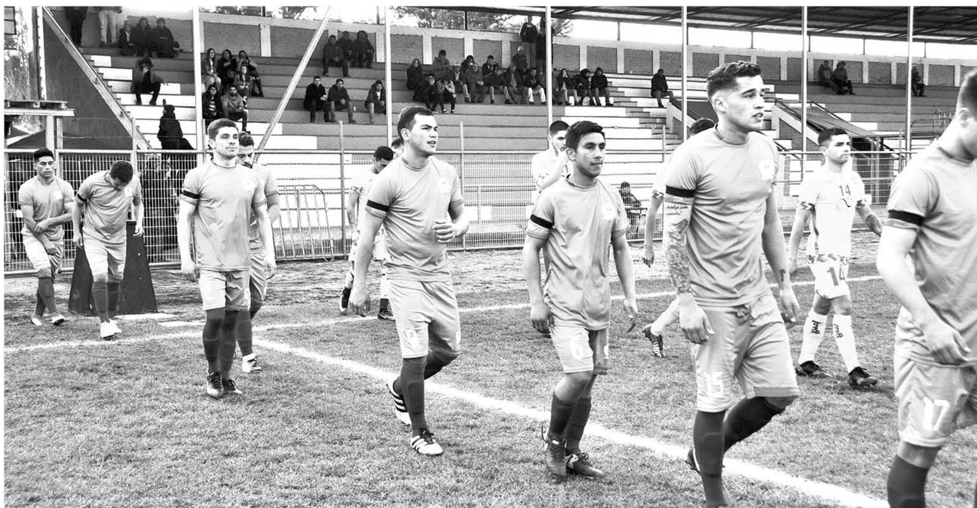
EN LA FASE DEFINITIVA del campeonato, Comunal Cabrero deberá hacer uso de sus mejores elementos que dosificó las últimas fechas.