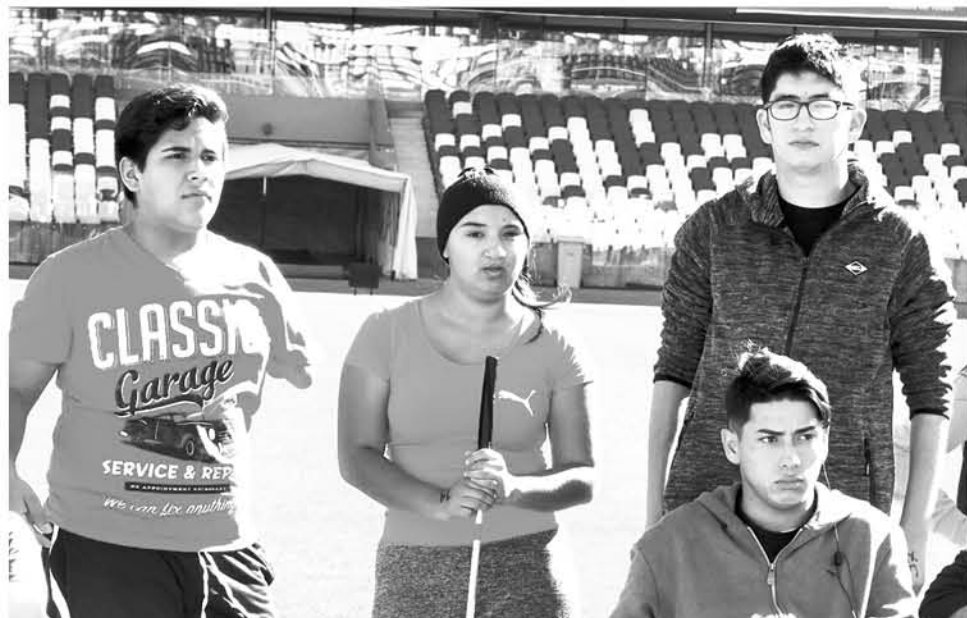
ANTOFAGASTA ES LA CIUDAD líder en deportes adaptados y hubiese sido un buen inicio para los jóvenes.

los jóvenes son los primeros a nivel provincial, empezando este año a competir, donde ya han obtenido buenos resultados en un evento que se realizó en el estadio Ester Roa en Concepción.