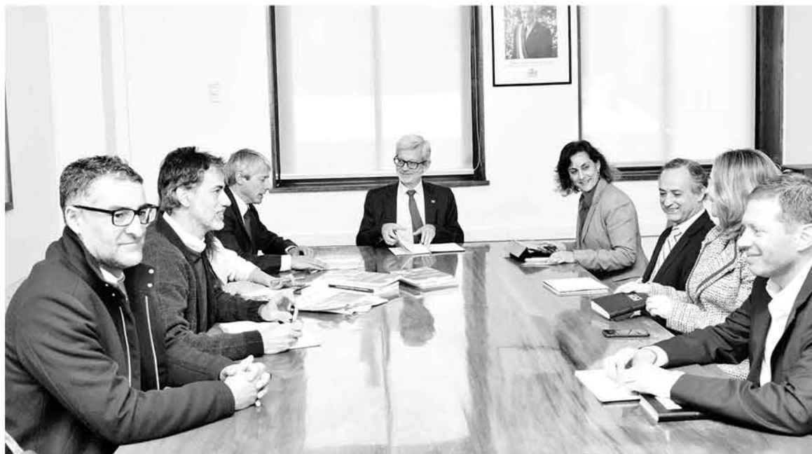
EH2030 BUSCA IMPACTAR con una política pública que beneficie al país y que se traduzca en soluciones, medidas y acciones que atiendan la brecha y riesgo hídrico.

En la etapa tres en la que se encuentra trabajando EH2030, se contempla el diseño de Escenarios futuros 2030 - 2050 en las primeras