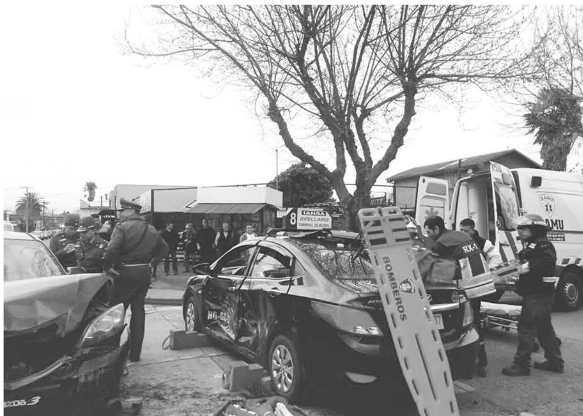
EL IMPACTO se produjo en la intersección de calle Janequeo con Valdivia pasada las 13.00 horas.

do investigado por Carabineros para determinar la responsabilidad de los involucrados.