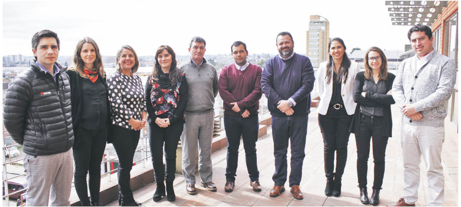
PRIMERA SESIÓN del Consejo Urbano.

Leyla Bascur Contreras prensa@latribuna.cl