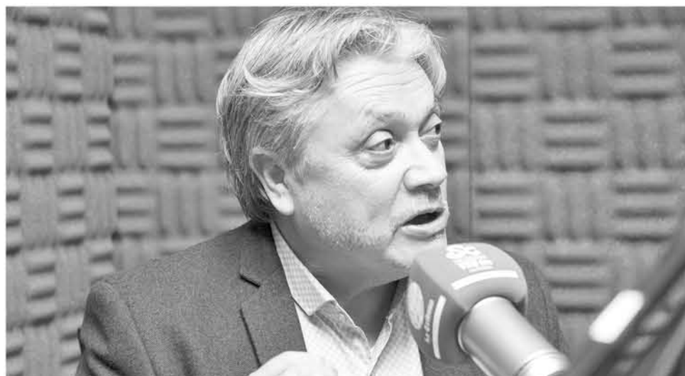
EL SENADOR NAVARRO contó que esta semana se reunió con el prefecto de la PDI de Concepción para analizar este tema.

Anunció que solicitará al Ministerio Público que incaute todas las máquinas que existen en la región.