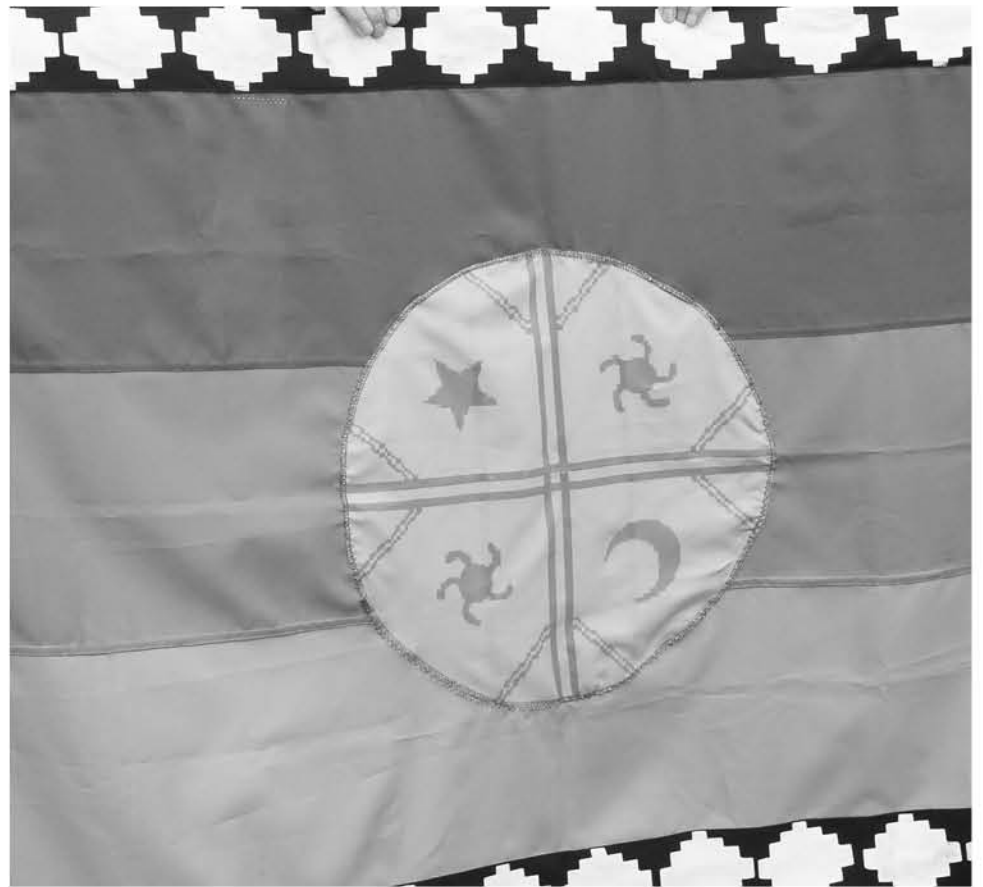
UNA ORDEN DE DESALOJO se encuentra en curso para desalojar del predio El Infiernillo, en Alto Biobío, a una familia pehuenche, que alega derechos ancestrales sobre esas tierras.