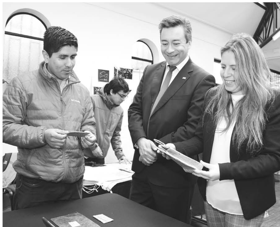
PODRÁN ACCEDER a los fondos de la mencionada línea de financiamiento personas naturales o jurídicas, con al menos un año de antigüedad desde la emisión de la primera factura o boleta.