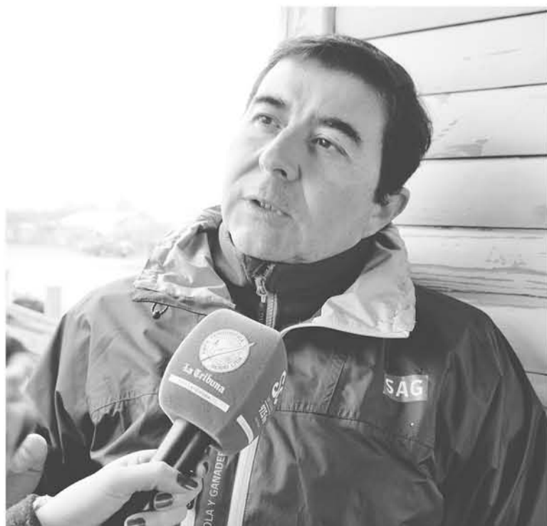
ANTE ESTOS HECHOS y próximo a las Fiestas Patrias personal del SAG anunció las medidas regulatorias de este delito de abigeato.

Finalmente, el profesional del SAG Biobío señaló que anualmente se entregan en promedio 70.957 formularios de movimiento animal e invitó a los propietarios de los establecimientos donde existen animales, en forma temporal o permanente, que aún no han realizado este trámite -que tiene carácter gratuito- a acercarse a las oficinas del SAG de la región para aclarar sus dudas y cumplir con la legislación vigente.