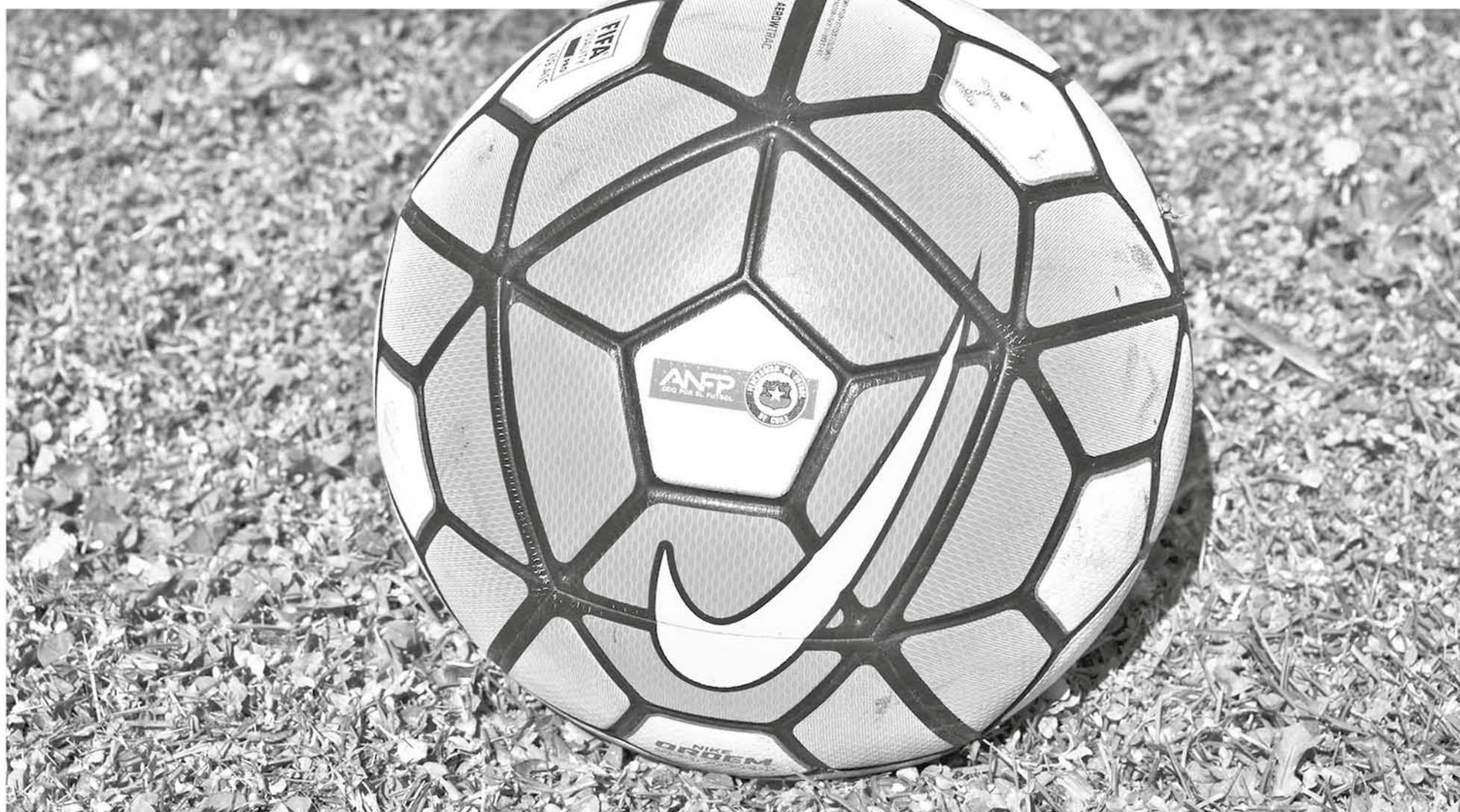
SE ESPERA QUE LOS DETALLES de estas regulaciones se vayan arreglando conforme avance el proyecto.