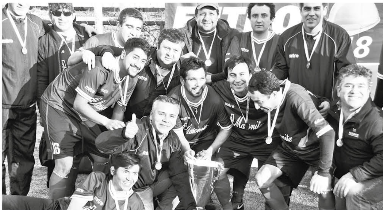
EL CAMPEONATO BUSCÓ mejorar la calidad de vida de los trabajadores de la construcción mediante el deporte.

Hay que destacar que durante la premiación también se entregaron reconocimientos a la "valla menos batida", recibido por Guiller-