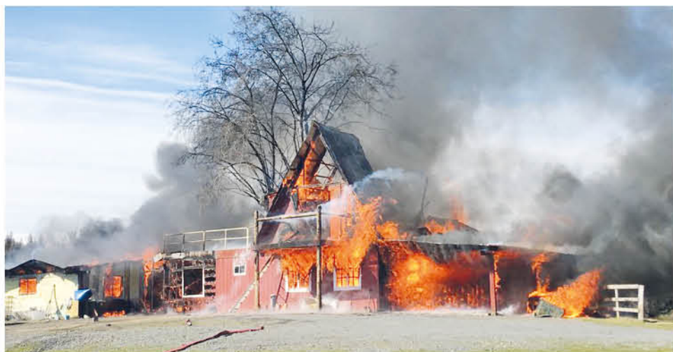
ESTE INCIDENTE se habría generado debido a un recalentamiento de estufa.

En el instante del fuego, personal municipal designado por el alcalde Jaime Quilodrán se presentó en el lugar, activando los protocolos de emergencia para colaborar en este proceso, además se coordinó la entrega de ayuda de manera inmediata para la familia damnificada.