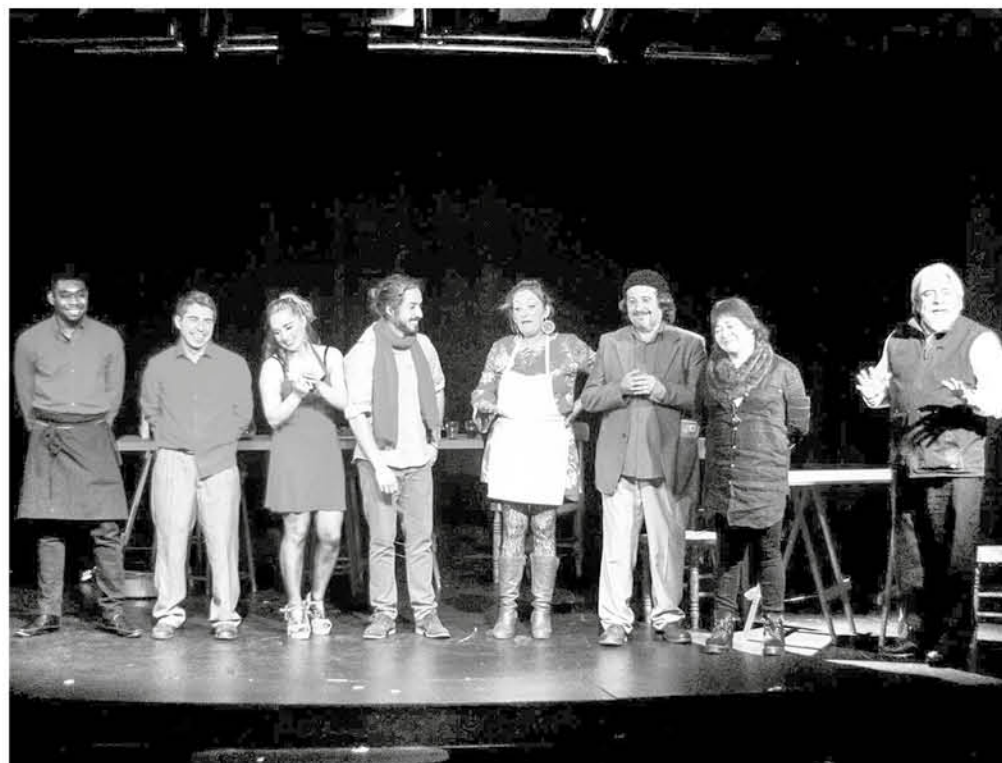
CONTENTOS Y MOTIVADOS terminaron los actores, la segunda presentación de Poetas y Borrachos de Perfiles y Siluetas.