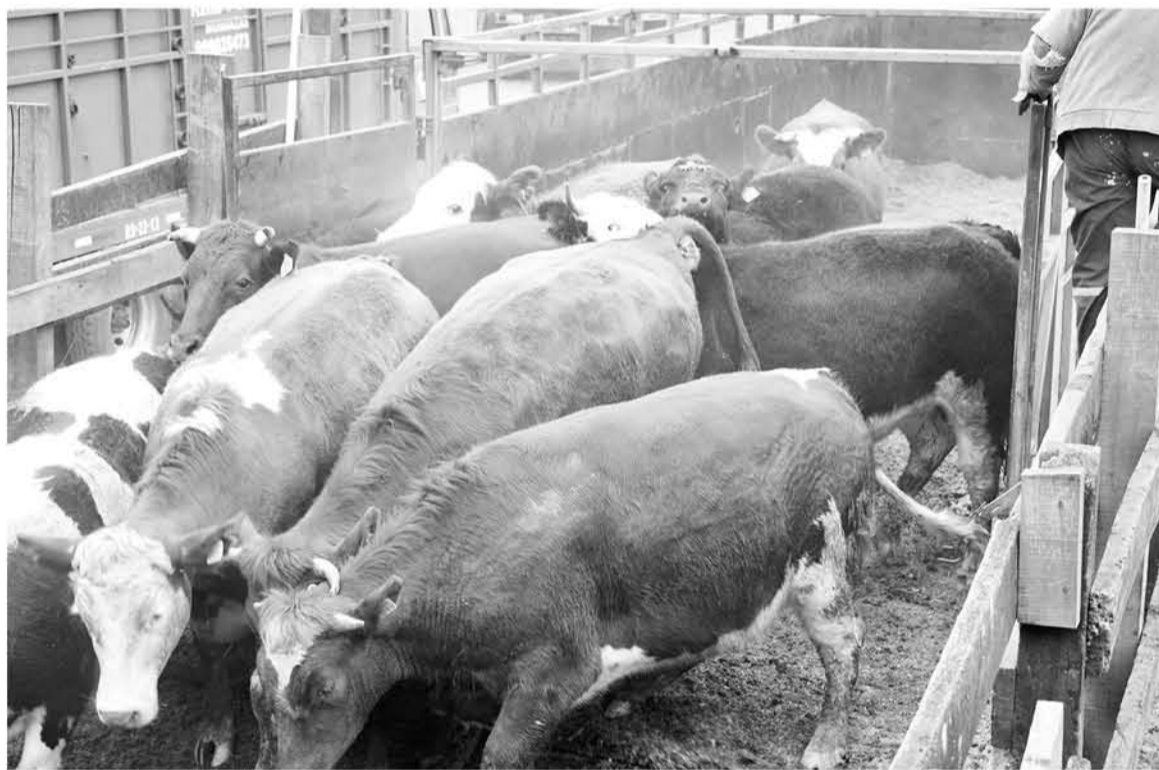
EL ROBO DE LOS ANIMALES para este hombre está avaluado en un total de 130 millones de pesos.

“Creo que ya entregamos todos los antecedentes, hemos concurrido