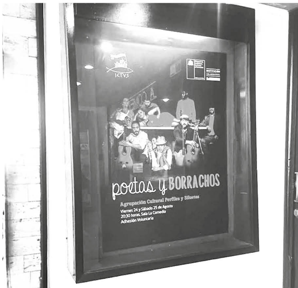
POR MÁS DE DOS semanas estuvo el anuncio de la obra de la compañía angelina en la cartelera del afamado teatro Ictus.