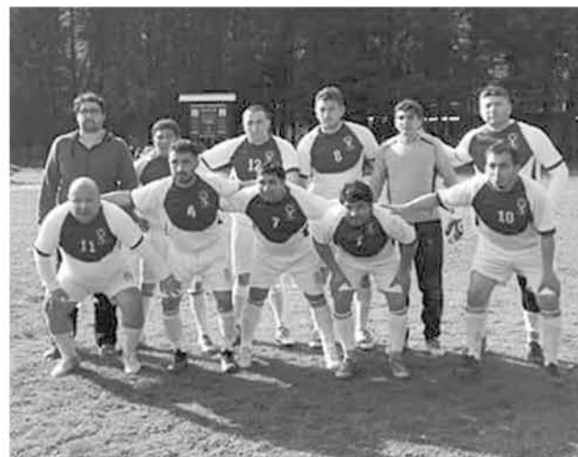
CANADELA ES UNA CORPORACIÓN privada sin fines de lucro, que fomenta el deporte y la recreación en los trabajadores y sus familias.

El equipo sanrosendino concretando el desafío en todo un día de encuentros, mostró ser merecedor de representar a la provincia en la cita nacional de la disciplina.