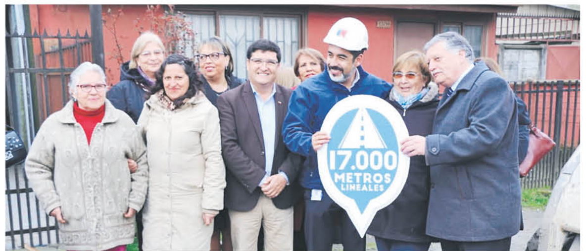
EN EL SECTOR de Santiago Bueras presidió su primera actividad en la provincia de Biobío.

liderando ese equipo. Y ahí hay una señal de este foco de trabajo con colaboradores de confianza".