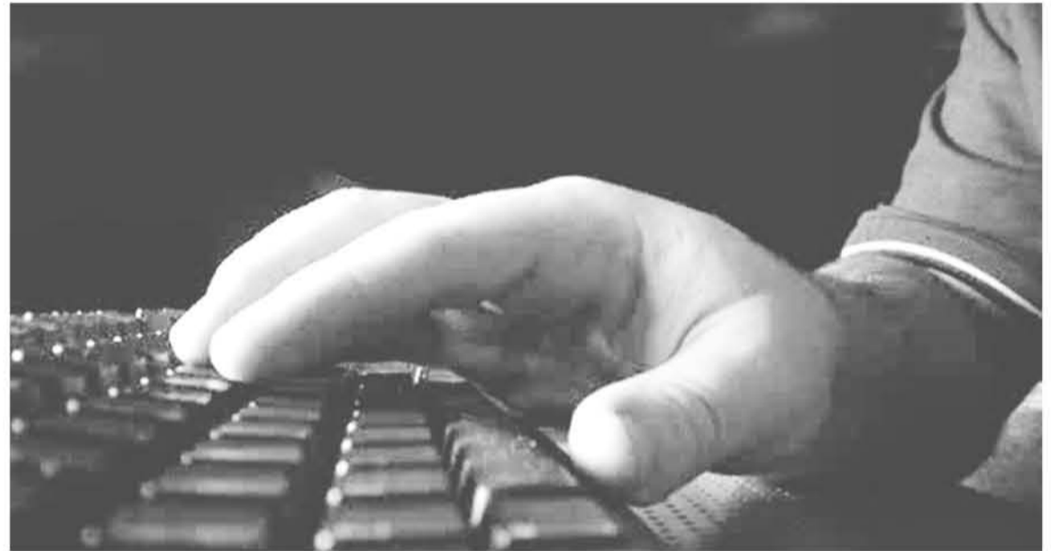
LA MAYORÍA DE LOS ATAQUES tiene como finalidad el robo de dinero por lo que los hackers aprovechan fechas como el ‘Black Friday’.

“El año pasado Brasil también estuvo dentro de los 20 países más atacados a nivel mundial. Esto se debe a que los cibercriminales utilizan el correo electrónico, mensajes de SMS, llamadas telefónicas y anuncios en redes sociales con nombres de empresas conocidas, lo que hace que los usuarios no desconfíen de