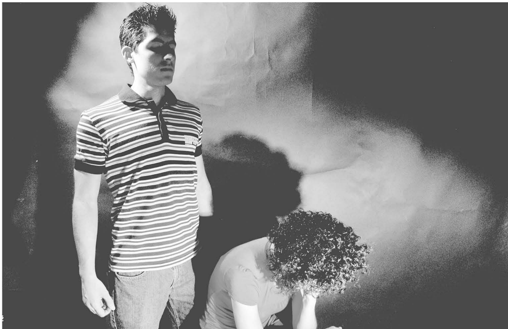
LA INICIATIVA busca ampliar la tipificación del delito de femicidio contra otras personas que no necesariamente puedan ser el cónyuge o excónyuge o conviviente de la víctima. (Foto de contexto)

La iniciativa modifica el Código Penal en materia de tipificación del femicidio y otros delitos contra la mujer.