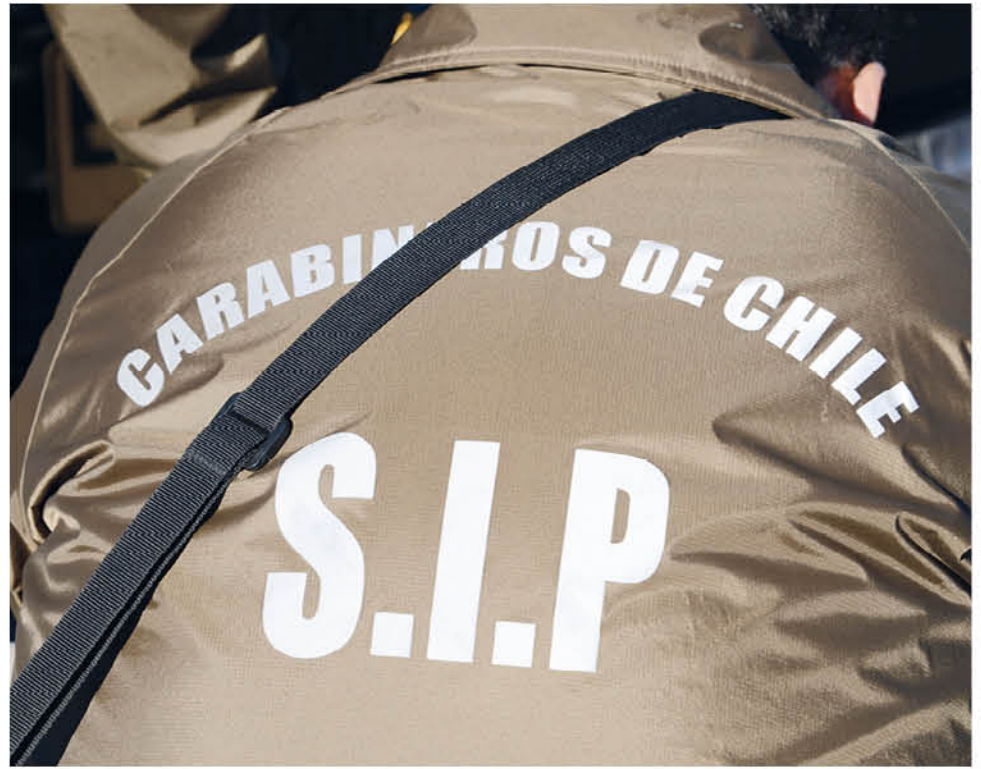
LA MENOR Y SU MADRE se mantienen con resguardo policial, luego de los actos generados por este hombre, con amplio prontuario policial.

Por este delito, durante el pasado lunes, el sujeto pasó a control de detención, para cumplir condena en la ciudad de Linares por las órdenes de detención, no obstante de igual forma será formalizado por amenazas de muerte y lesiones de carácter leve en VIF, quedando la afectada y menor con resguardo policial para que posteriormente el Ministerio Público coordine su traslado a la ciudad donde residen sus familiares.