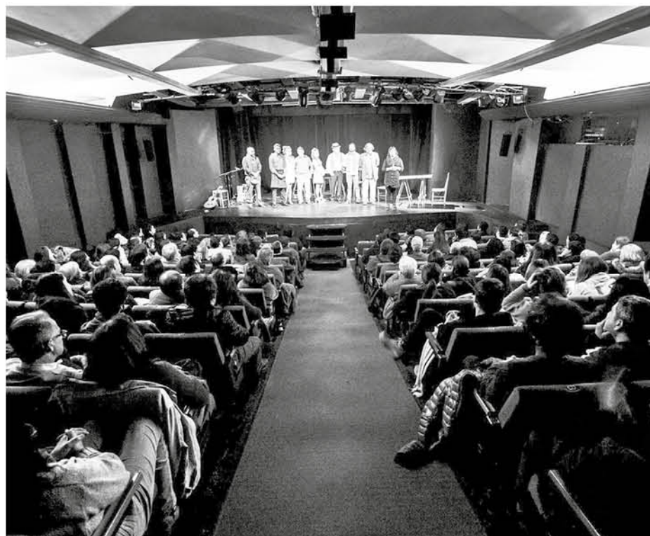
A TABLERO VUELTO se presentaron los dos días en la sala Comedia en Santiago.