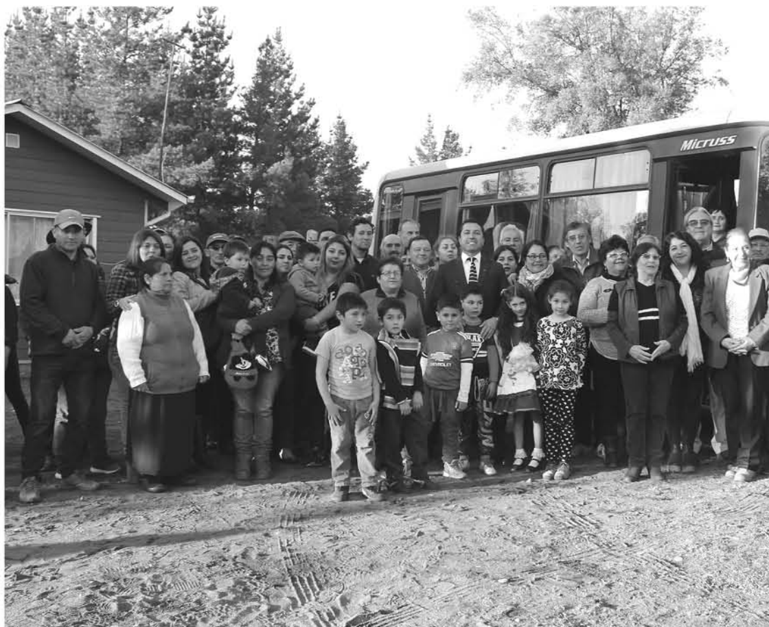
LA COMUNA DE CABRERO ha sido pionera en la provincia, al verse favorecida con la rebaja en el pasaje al transporte público.

Las localidades favorecidas son Pillancó, Tapihue y la Mata Sur, las que se suman a Charrúa y El Progreso, que en mayo pasado ya habían obtenido el beneficio.