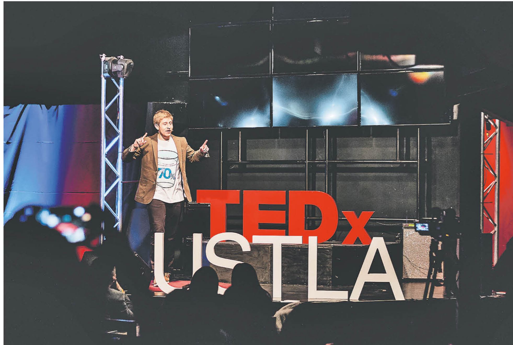
EL EXPONENTE MÁS JOVEN del segundo evento Tedx de la Universidad Santo Tomás en Los Ángeles.