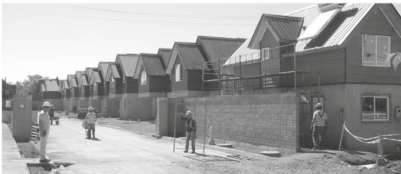
SEGÚN NORAMBUENA, actualmente los reclamos en contra de inmobiliarias para que reparen desperfectos en viviendas nuevas tardan hasta 60 días en resolverse. (Foto de contexto)

Finalmente, el diputado UDI subrayó que es de “suma importancia establecer la obligación de responder no sólo por los requerimientos que les competen a las inmobiliarias, sino también hacerlo dentro de un determinado tiempo, para no dejar así la resolución de dichos problemas a su discreción”.