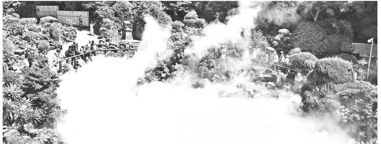
Aguas termales de un profundo color azul cobalto en el complejo de Umi Jigoku (Beppu, Oita).

El ritual del "onsen" en este país se realiza completamente desnudo e incluye una ducha inicial en un espacio compartido, seguida del paso por una o varias piscinas