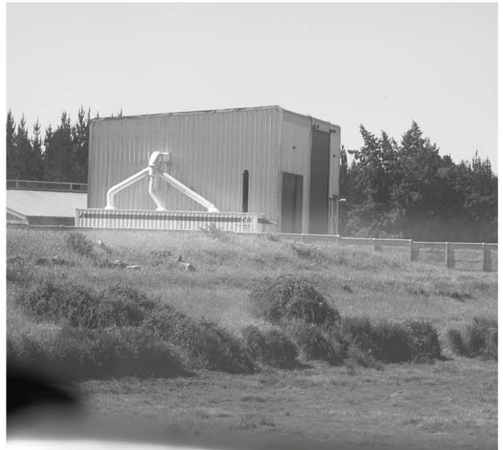
EN EL SECTOR EL MEMBRILLAR de Cabrero funciona el Galpón de Encalado de Biodiversa (Archivo).

“Lo que yo recuerdo es que años atrás por un grano de uva, tuvimos toneladas de dólares en pérdida, por no tomar las medidas en el minuto. Hoy día, estamos poniendo en alerta al Gobierno y eso es lo que tiene que evaluar. No podemos poner en riesgo una empresa que es de todo Chile, de todos los que trabajan en la fruta, por el beneficio de una empresa llamada Biodiversa que depende, finalmente, de Essbio”, enfatizó.