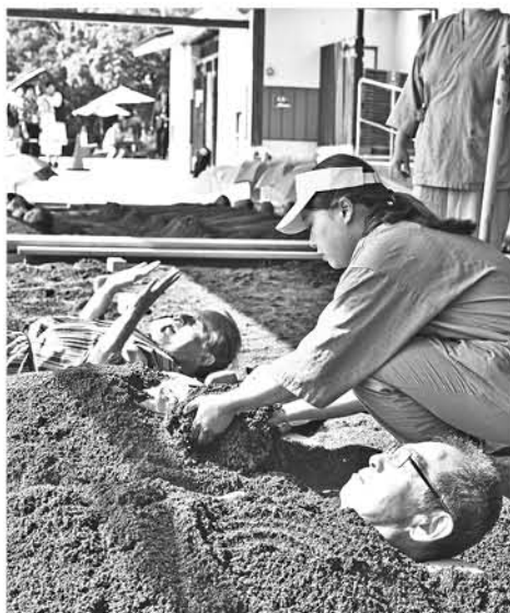
Baños de arena frente al mar en Beppu (Oita).

Oculto por una complicada orografía, Beppu busca ahora colocarse en el mapa de los millones de visitantes que acuden cada año a la isla y ofrecer una forma de turismo diferente, basada en la salud y la relajación.