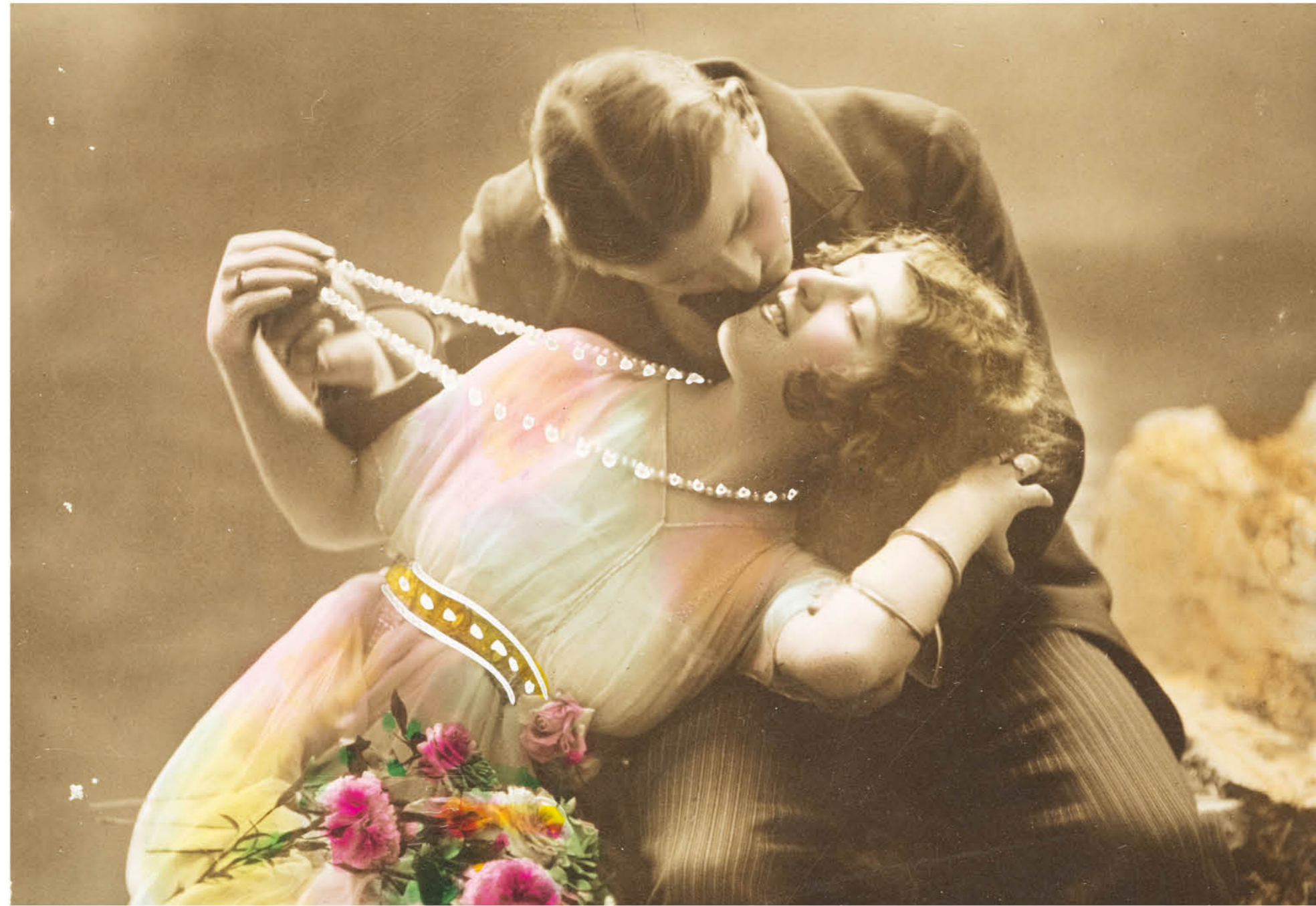
Fragmento de una postal romántica. Cortesía del Museo de Historia de Cataluña, MHC. Fons Xavier Roigé (Foto: MHC, Pep Parecer).