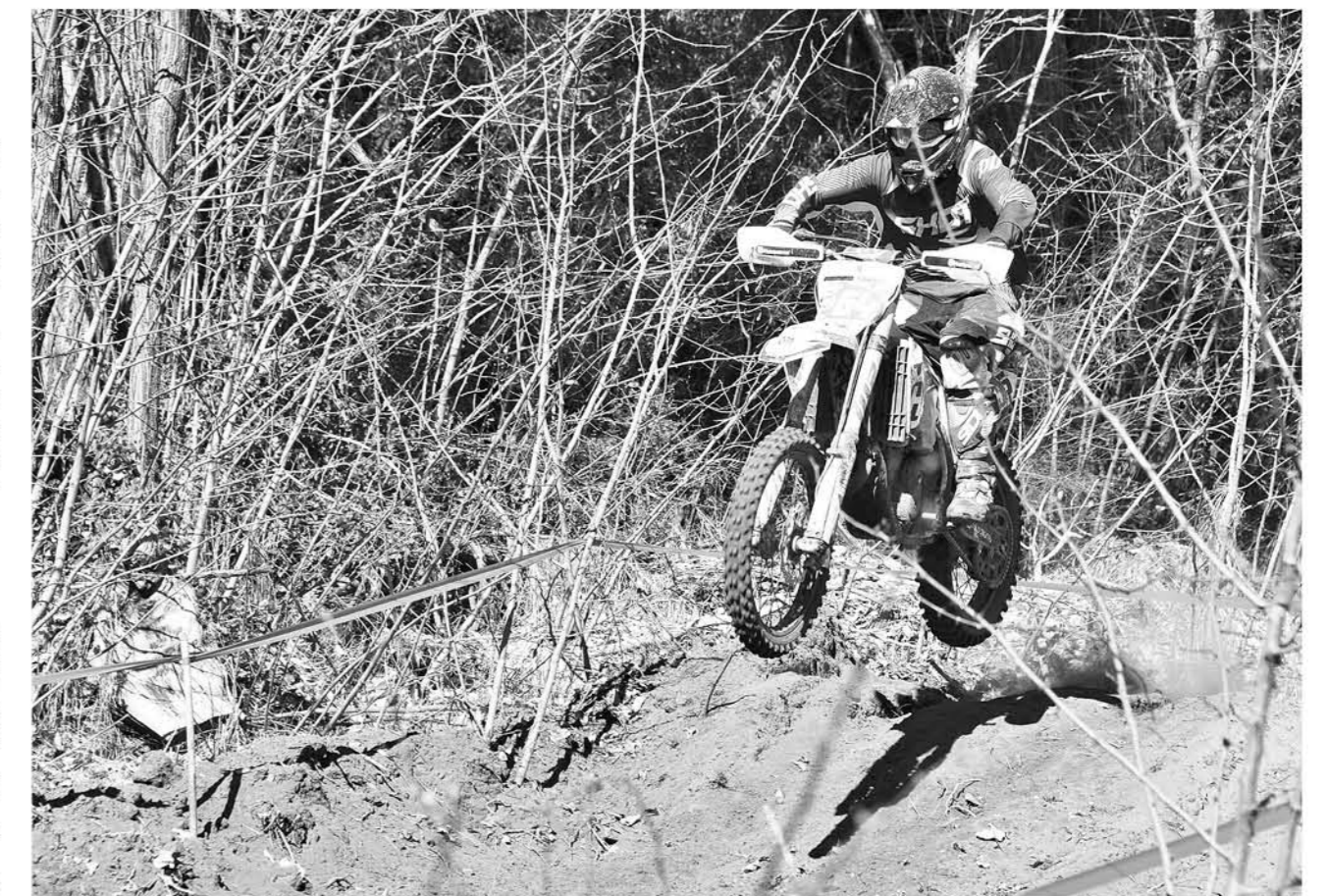
SIN LUGAR A DUDAS el Triple Corona es hoy por hoy un evento imprescindible para los fanáticos del mundo tuerca.

"Los pilotos del Triple Corona van a otros campeonatos importantes y cuando los veo siento orgullo, porque ellos en mi campeonato corren y eso me da gusto, me