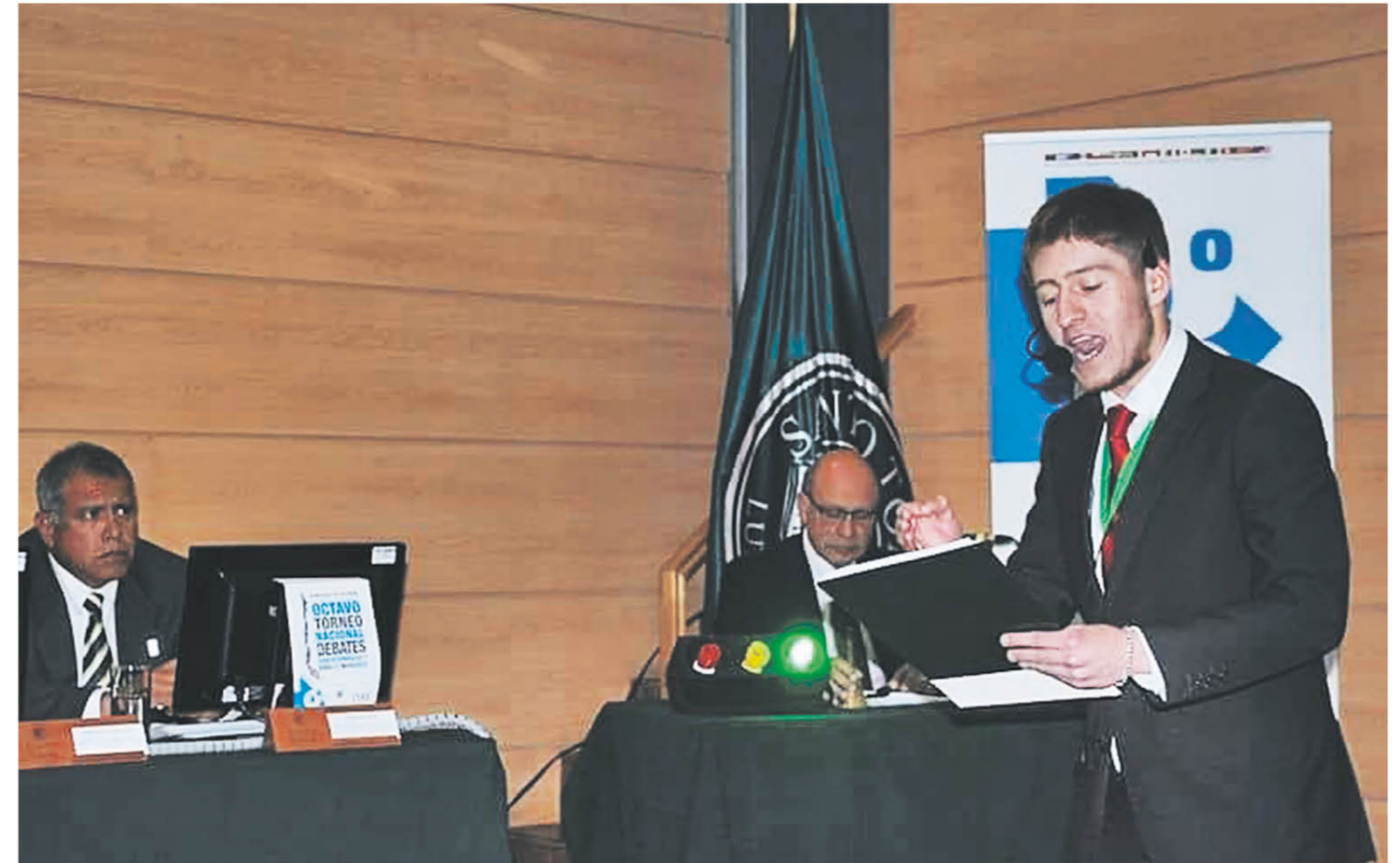
LA EXPERIENCIA adquirida en el grupo de debate de su universidad ha sido muy valiosa.

"Y en ese momento del diario me hicieron la entrevista. En mi charla TeDx presenté el recorte de la nota que me hicieron en el diario, porque para mí a los 13 años que me hicieran una entrevista fue un gran hito, muy importante,