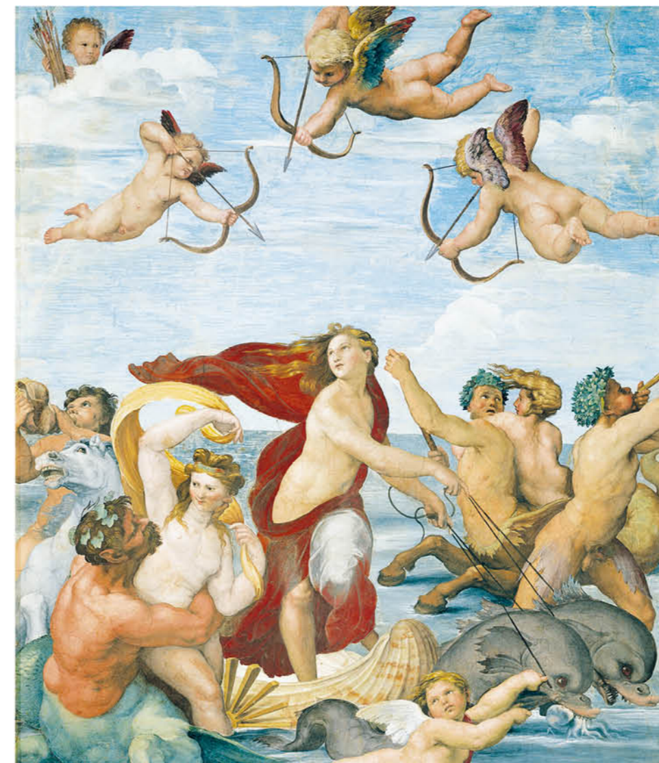
Escena de El triunfo de Galatea, de Raffaello Sanzio, Roma, 1511. cortesía del Museo de Historia de Cataluña, MHC. Foto: Photoaia

Está claro que Cupido, ha movido, mueve y seguirá moviendo nuestros corazones y el mundo.