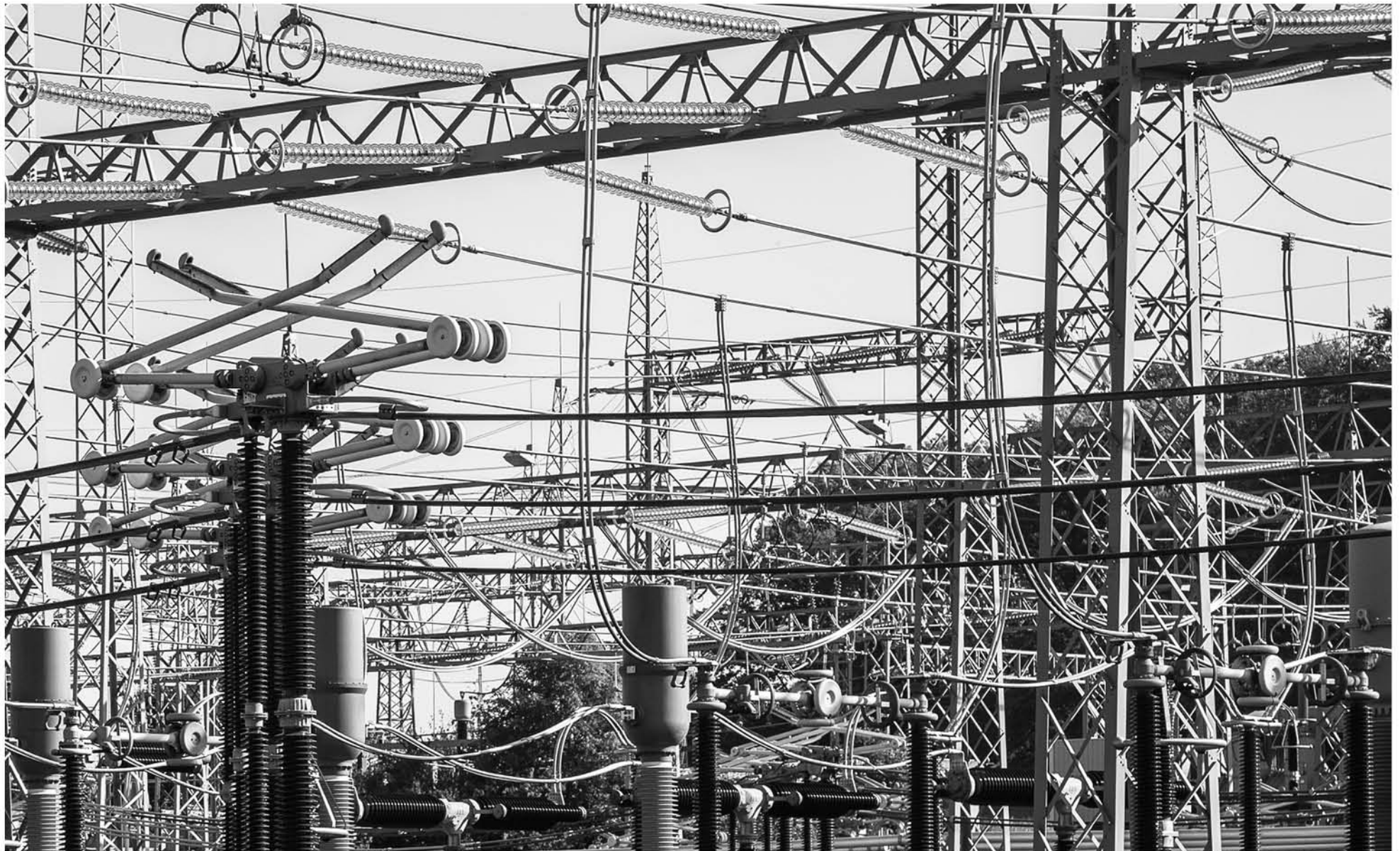
SEGÚN EL INE, la distribución de electricidad, gas y agua en el país aumentó 4,4% en julio pasado. (Foto de contexto)

El producto que más influyó en la variación positiva a doce meses del índice fue servicios de distribución de electricidad a clientes industriales (10,3%), con una incidencia de 2,758 puntos porcentuales. Los productos servicios de distribución de gas por red (14,8%), servicios de distribución de electricidad a clientes comerciales (7,5%) y servicios de distribución de agua potable (1,9%) aportaron en total 1,777 puntos porcentuales.