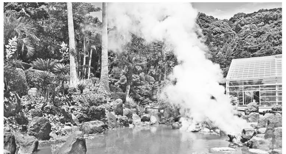
Aguas termales de color rojizo en el complejo de Umi Jigoku (Beppu, Oita).

Abierta por un lado al mar y unida por el otro a los montes de Tsurumi y Yufu, Beppu se ha convertido en una ciudad "onsen" y concentra en un solo espacio decenas de estos baños, "ryokan" (alojamientos tradicionales japoneses), museos, galerías de arte y una amplia variedad de restaurantes.