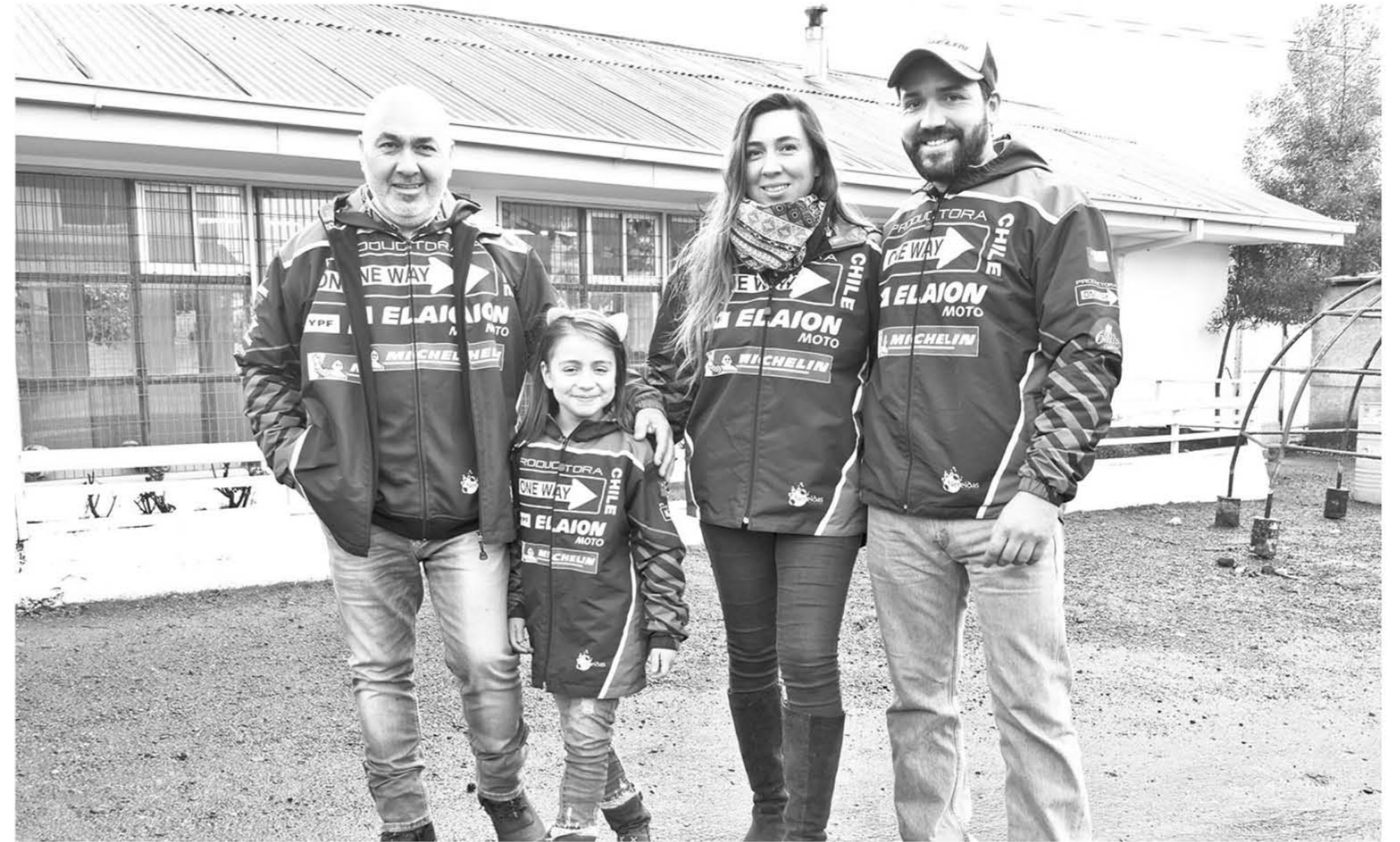
JUNTO A PARTE de su familia, que ha sido un pilar fundamental para él.