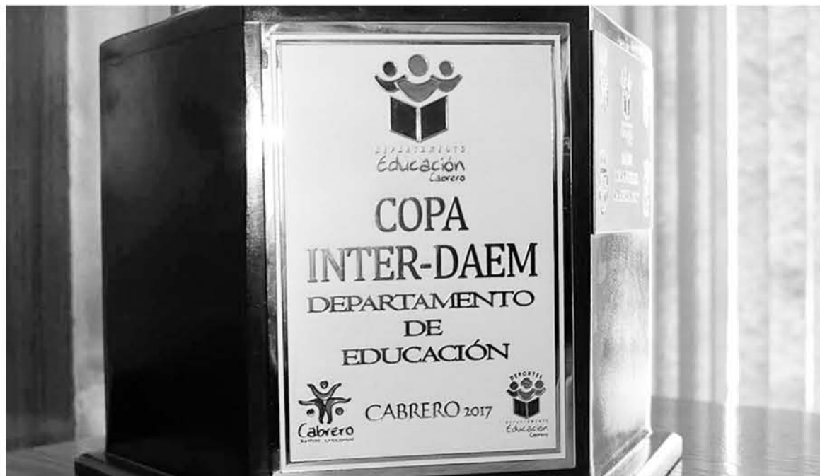
LA COMPETENCIA hasta ahora la lidera el representativo de Los Ángeles.

Del certamen toman parte los departamentos de Educación de Cabrero, Yumbel, Los Ángeles y Concepción.