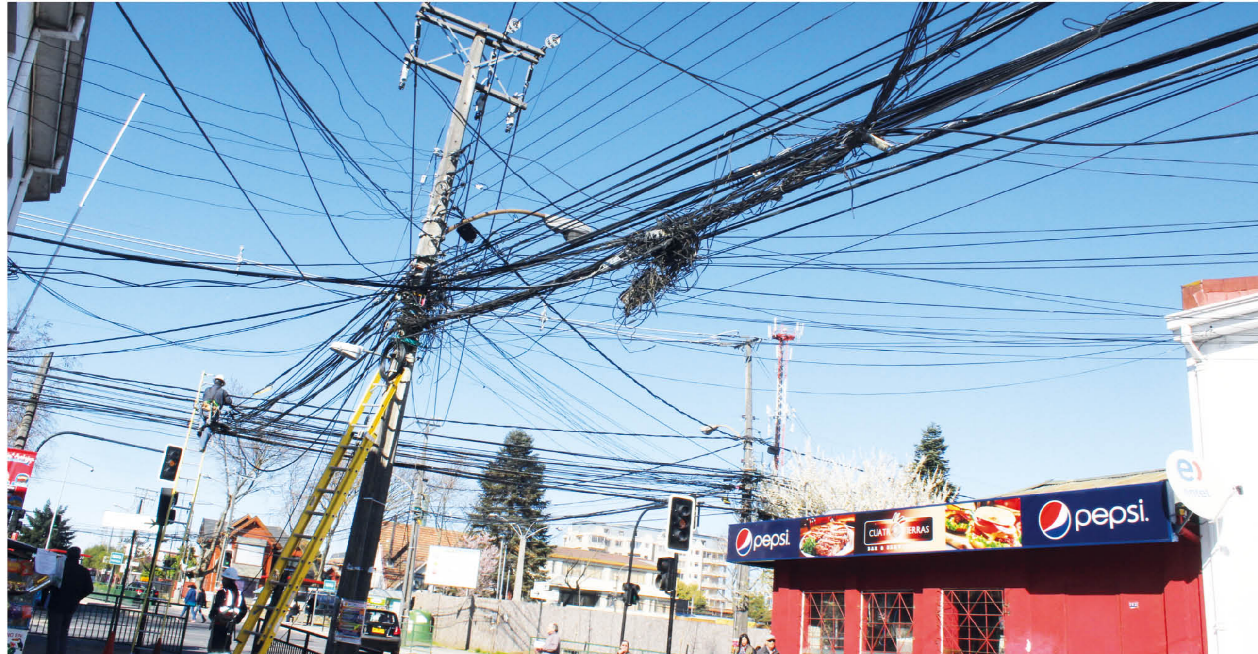
Bajo tuición de la Subtel está el cableado en desuso existente en las calles, explicó el director regional de la SEC.