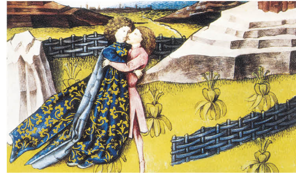
Representación de una pareja donde aparece el comino, una hierba aromática que se creía que aumentaba la fertilidad. Aparece en el códice De natura rerum o Codex Granatensis, dedicado al conocimiento de las ciencias naturales en el siglo XIV.

Con el triunfo del cristianismo, a partir del siglo IV, se desarrolló una nueva idea de amor, la Iglesia adquirió el monopolio de poder