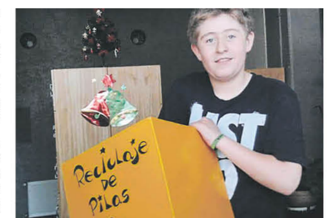
DESDE PEQUEÑO manifestó su interés por el medio ambiente.