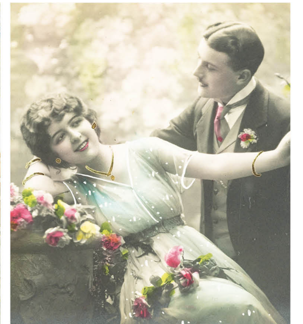
Postal romántica. Fons Xavier Roigé. Cortesía del Museo de Historia de Cataluña, MHC (Foto: MHC, Pep Parecer)