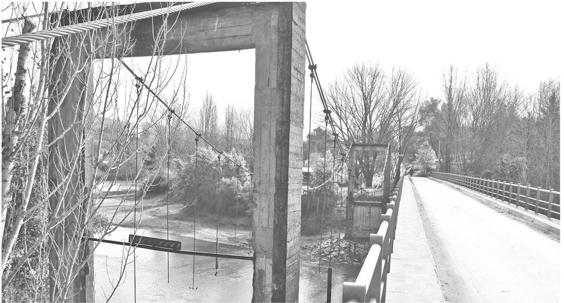
EN COMPLETO ABANDONO el puente colgante de Nacimiento.