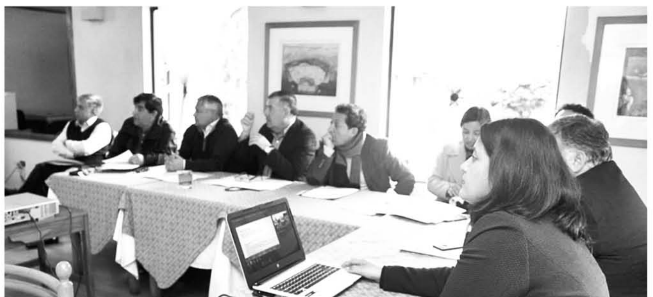
LA REUNIÓN DESARROLLADA esta semana por la asociación se llevó a cabo en el Hotel La Turbina, ubicado en la comuna de Negrete.

“Hablamos también de reciclaje del aceite vegetal, en que, en mi caso, en Nacimiento, ya tenemos un convenio que se va a ampliar a toda la asociación de municipalidades. También dar cuenta de los recursos que los concejos municipales han aprobado para la Asociación Biobío Centro, para la contratación de maquinaria pesada y otras acciones que