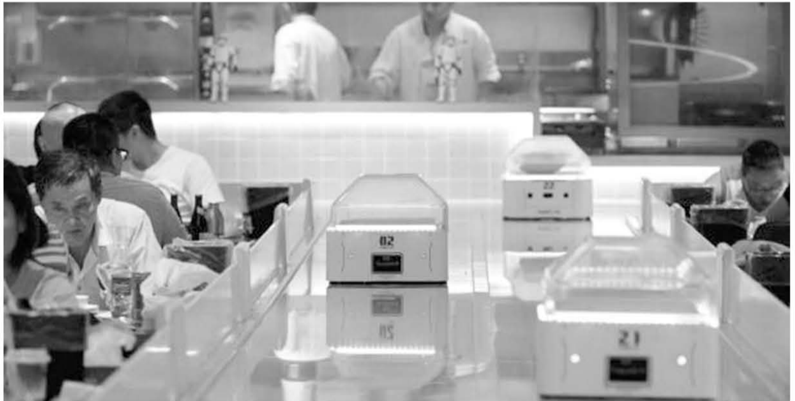
EN EL RESTAURANTE Robot.He los robots cumplen las funciones tradicionales de los meseros.