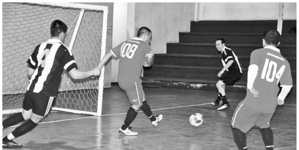
EL CAMPEONATO FINALIZARÁ en septiembre con una ceremonia de término donde será la premiación de los adultos.

peonato dijo "espero que se cumplan todas las expectativas independiente de los resultados tantos positivos como negativo en cuanto a los mar-