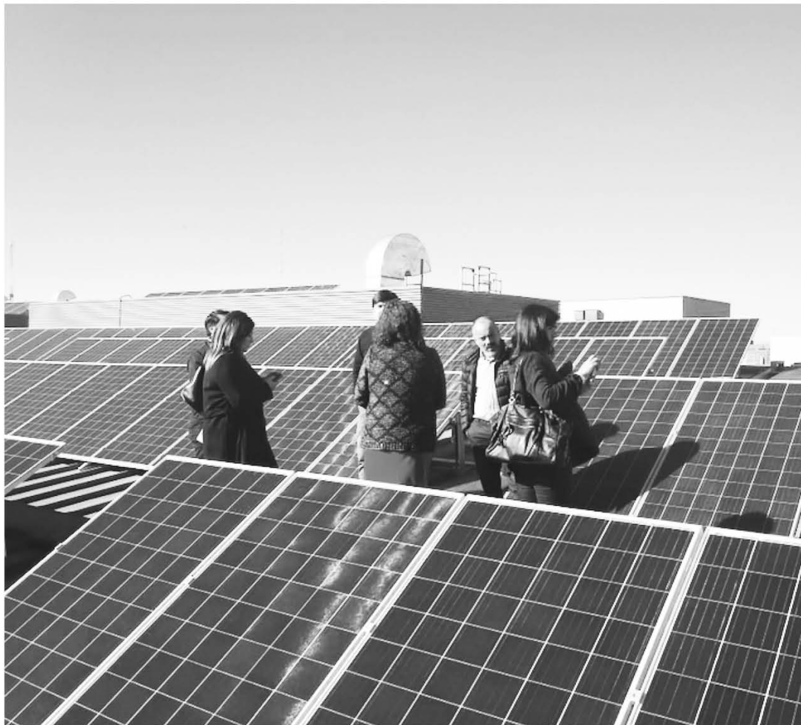
EL HOSPITAL angelino ostenta 308 paneles solares fotovoltaicos.

"Salud Sin daño" es una organización que busca transformar el sector salud a uno que no sólo no contamine, sino que contribuya a generar ambientes saludables para todos. Por eso, para Antonella Risso esta visita ha sido muy fructífera "nos llevamos una muy buena impresión del trabajo que se está realizando en los hospitales de Santa Bárbara y Los Ángeles, donde sus profesionales están muy comprometidos con una salud más global, ojalá muchos más establecimientos en el mundo puedan replicar lo que se hace en estos hospitales".