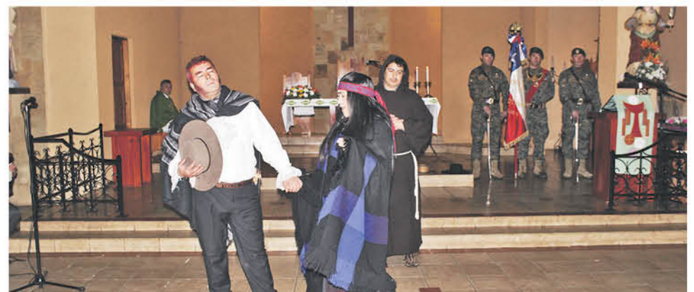
LA ACTIVIDAD TUVO entretenidos episodios de representaciones donde se conoció detalles de la vida de Bernardo O'Higgins.

Asimismo el gobernador, Ignacio Fica, la única autoridad provincial que participó en el inicio y asistió al evento de cierre destacó la iniciativa, manifestando que su importancia la podría consagrar como tradición en Biobío.