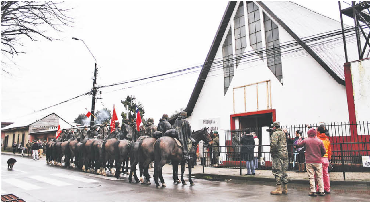
HOY SE REALIZÓ el último hito de la Ruta de O'Higgins en la Parroquia "Santa Bárbara Bendita".