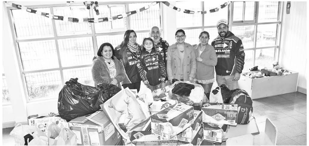
EL ORGANIZADOR ASEGURÓ que para próximas competencias la familia tuerca ayudará a distintas instituciones.

"Una casa con 30 niños tiene muchas necesidades,