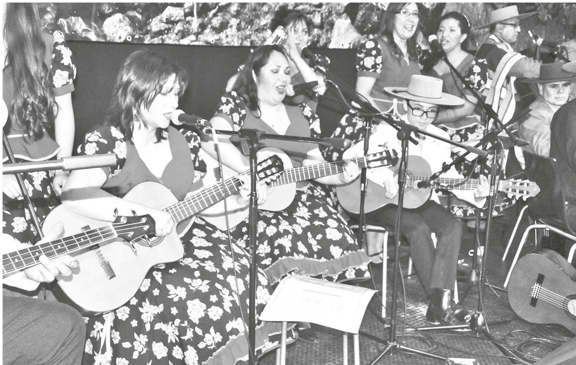
PRIMERA FERIA FOLCLÓRICA de Los Ángeles se realizará el sábado 25 y domingo 26 de agosto en el Polideportivo.