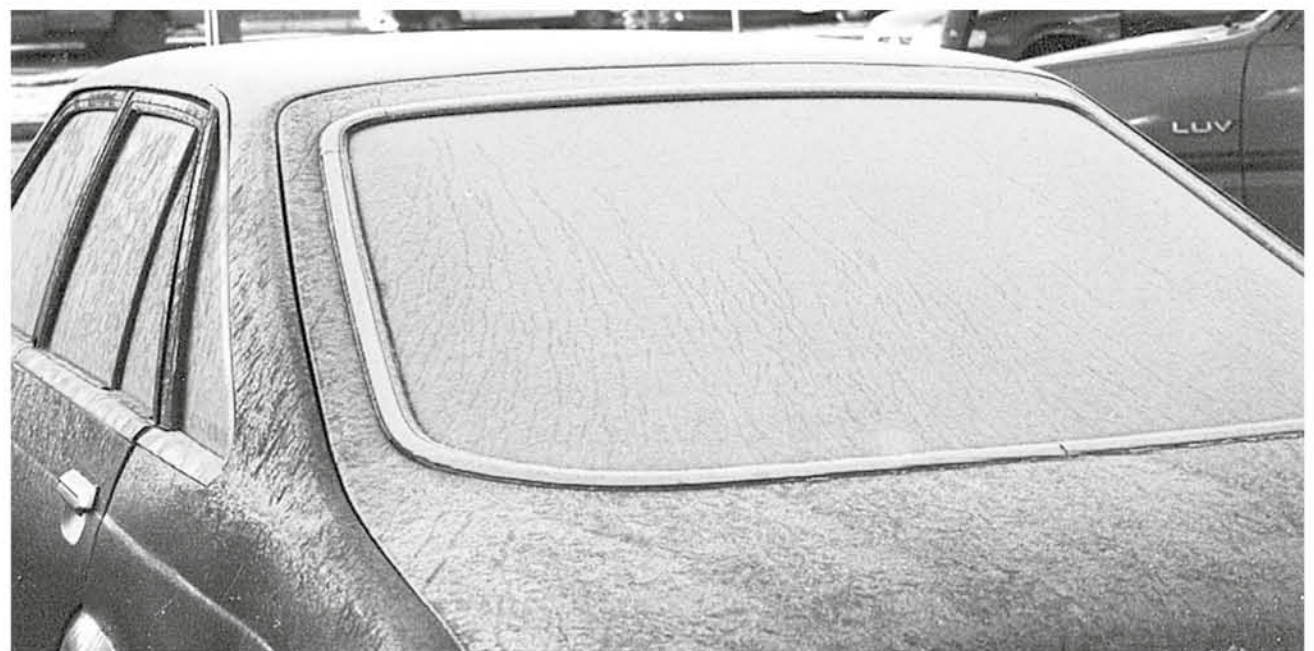
LAS HELADAS PODRÍAN ser parte de la jornada.

Cubierta plástica de color claro permiten mejor acumulación de temperatura en el suelo. Asimismo, utilizar cubiertas sobre las plantas,