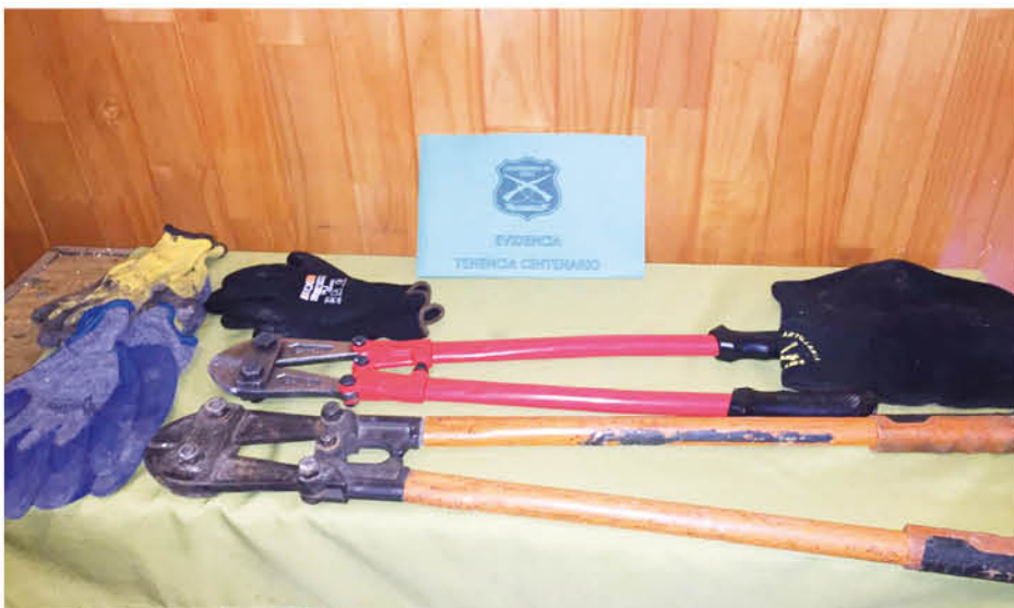
LOS DELINCUENTES fueron sorprendidos en un procedimiento policial en el sector Paraguay.

Hay que mencionar que de los imputados sólo uno de ellos mantiene antecedentes de hechos delictuales anteriores. Por ello pasaron a control de detención durante el día jueves.