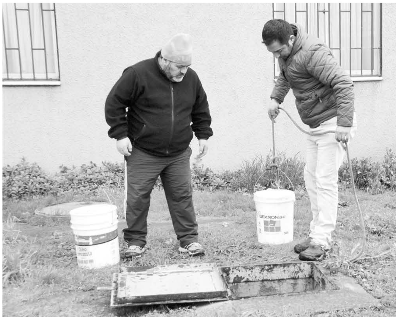
LA NORMA DEBERÁ ser aplicada en la construcción de alcantarillados (Foto de contexto).

La nueva norma está destinada a ser utilizada por proyectistas, contratistas de obra, organismos regulatorios, propietarios de infraestructura y organizaciones de inspección que se encuentren involucrados en la construcción de alcantarillados.