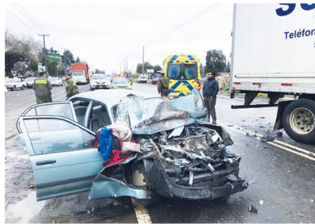
EL INCIDENTE está siendo investigado por personal de Carabineros para determinar la responsabilidad de los implicados en este grave accidente.

Durante la tarde del jueves, Carabineros investigó las causas de este hecho para determinar las razones que propiciaron este incidente donde afortunadamente no se registraron víctimas fatales a pesar de la gravedad del impacto.