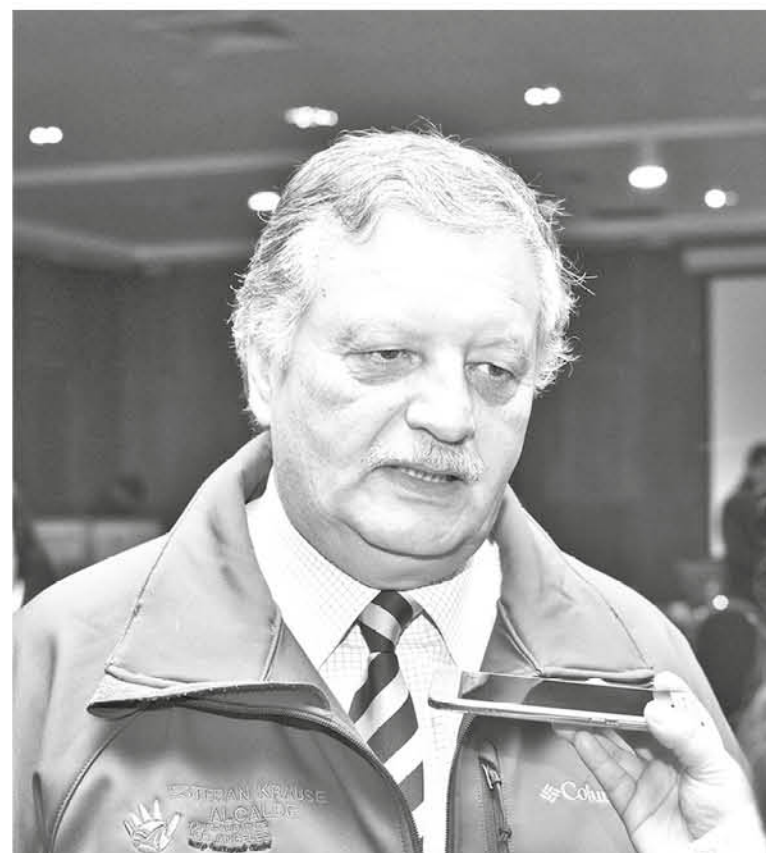
ESTEBAN KRAUSE, alcalde de Los Ángeles, manifestó que es una fiesta folclórica previa a las celebraciones dieciocheras.

El programa comenzará el sábado 25 de agosto a las 12 horas y se extenderá hasta las 24 horas, media noche. Para el domingo 26 se anunció que comenzará a las 11 de la mañana hasta las 20 horas.