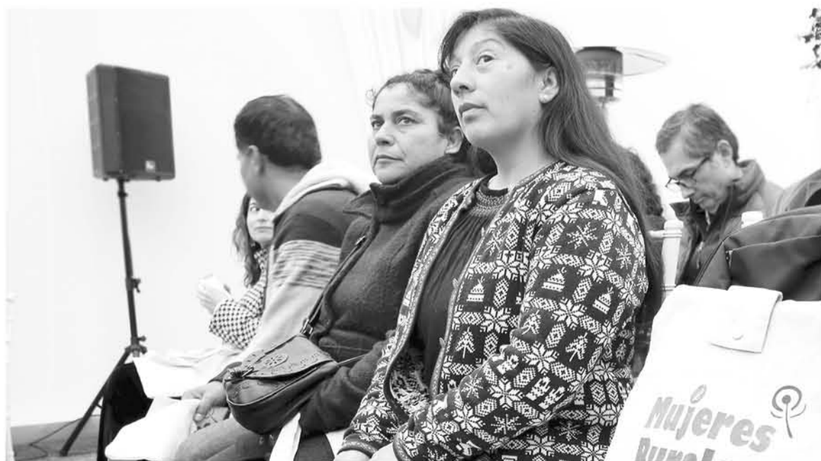
COMO DATO A DESTACAR el 44 % de los usuarios de Indap son mujeres.

En su intervención entregó algunas cifras que permiten visualizar la importancia del trabajo conjunto: las mujeres rurales participantes “tienen un promedio de edad de 49 años y emprenden ‘grandes’; el 20 % de ellas son mayores de 60. En tanto, el 27 % de ellas pertenece a algún pueblo originario, ubicadas geográficamente en lugares apartados. El 53% se reconoce como ‘dueña de casa’ lo que conlleva que muchas de ellas no han trabajado fuera de su casa antes”. Esto les ayuda, acotó, “al empoderamiento y a la autonomía personal y económica”.