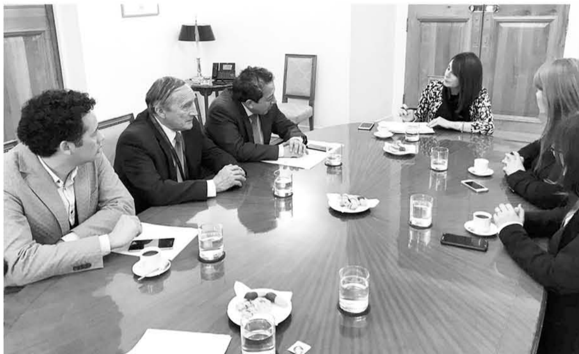
LA REUNIÓN de esta actividad se realizó en conjunto con otras autoridades políticas.