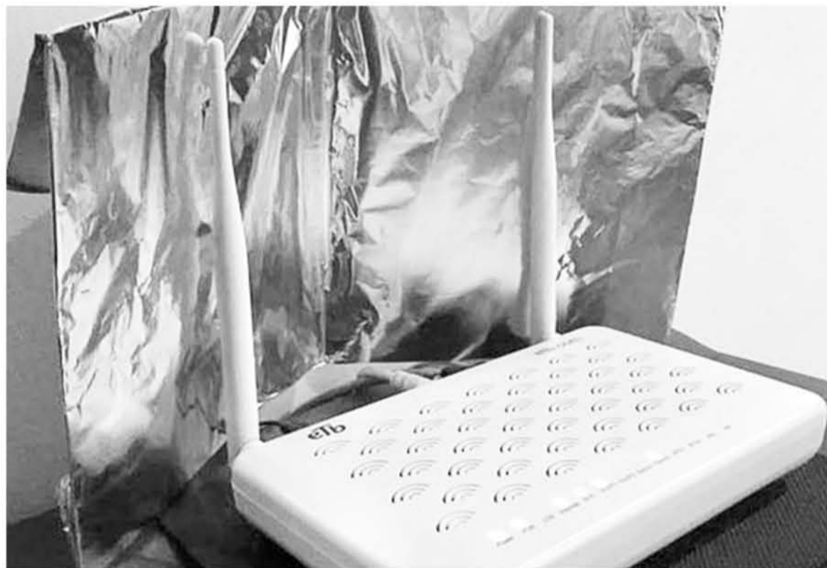
LOS ROUTERS que se usan en las casas generalmente son omnidireccionales.

Las demás habitaciones perderán señal, pero ésta se concentrará en el lugar que la necesitas.