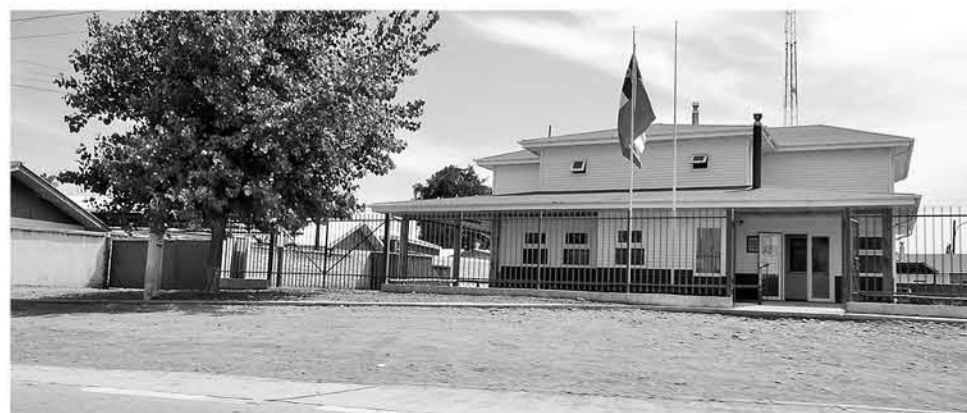
EL FUNCIONARIO se mantiene en evaluación en el hospital institucional de Carabineros en Santiago.

El incidente que mantiene al funcionario en evaluación, se produjo cuando el implicado pasó sus implementos de detención hacia adelante y se abalanzó sobre el cabo primero provocándole una herida cortopunzante en el cuello.