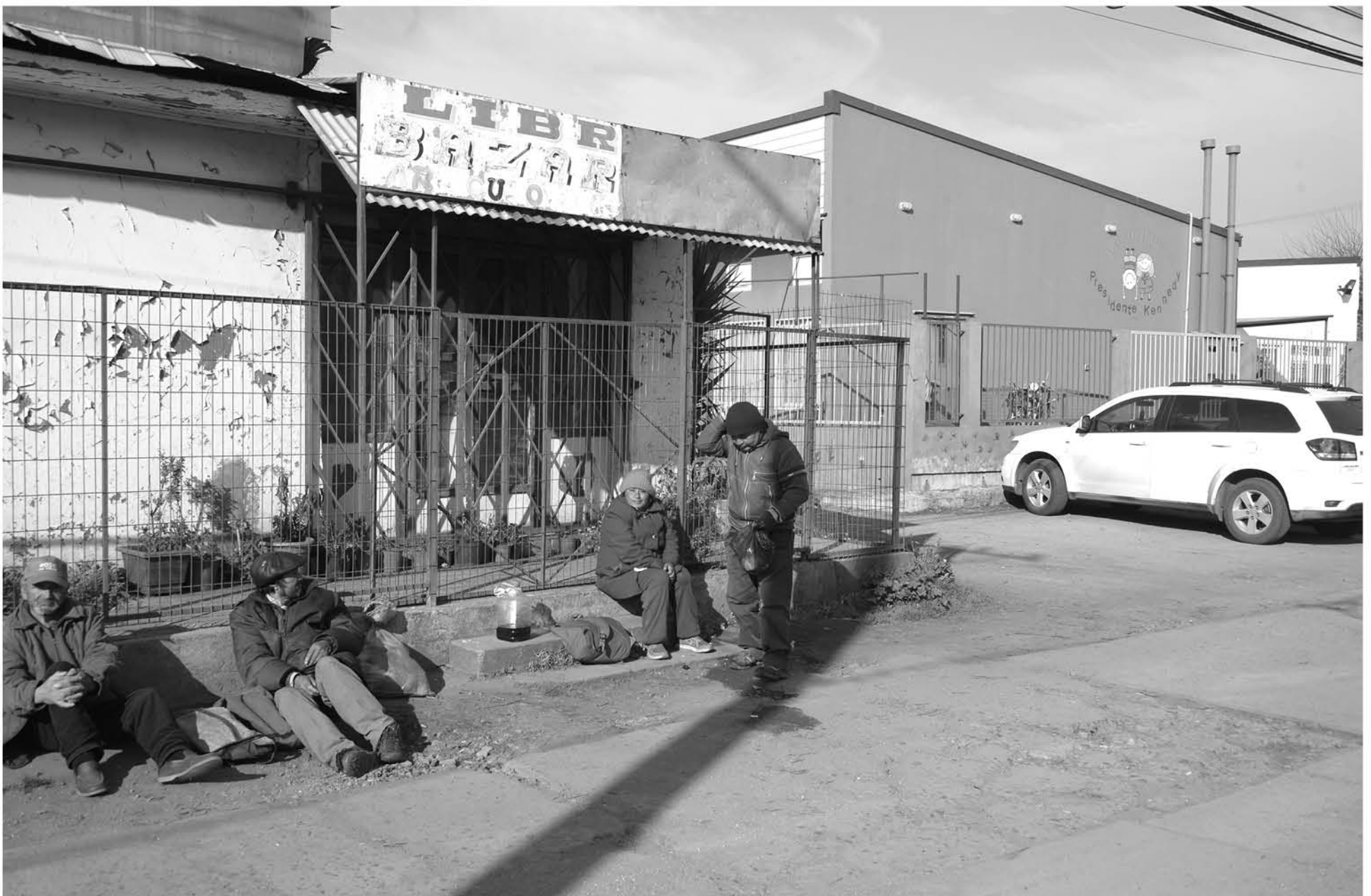
LA SITUACIÓN DENUNCIADA afecta al jardín infantil Presidente Kennedy ubicado en calle Colo Colo con Las Azaleas, en Los Ángeles.

Diario La Tribuna intentó también contactarse con el encargado del Hogar de Cristo que funciona en el sector, sin embargo, hasta el cierre de esta edición aquello no fue posible.