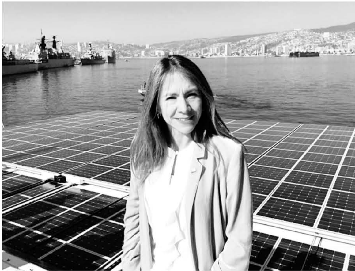
LA MINISTRA DE ENERGÍA, Susana Jiménez, anunció que la Agencia de Eficiencia Energética pasará a llamarse Agencia de Sostenibilidad Energética.