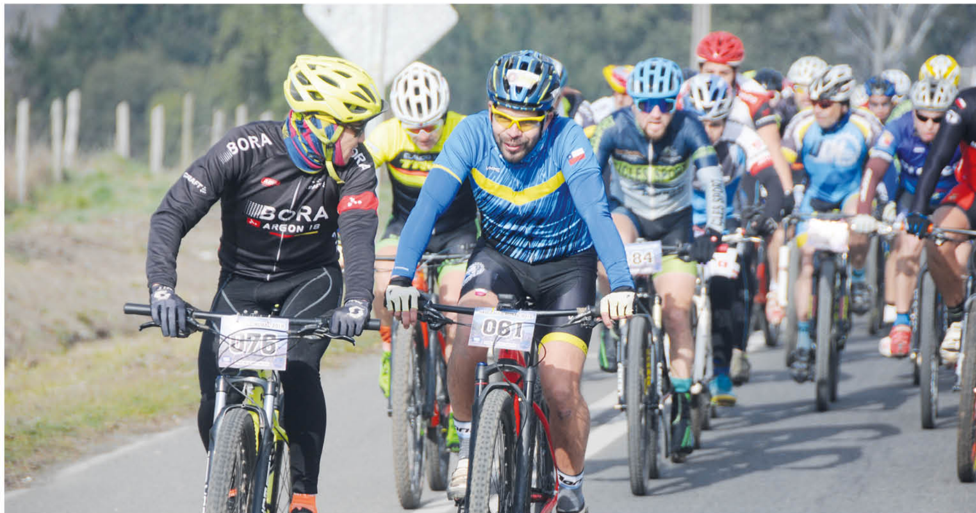
ESTE DÉCIMO SÉPTIMO RAID Ciclo Rural a la Provincia de Biobío constó de 13 etapas donde los ciclistas recorrieron hermosos sectores de la zona.

La fase que terminará un período de competencia a todo terreno en distintas partes de la provincia promete ser una de las más concurridas y peleadas de la convocatoria debido al majestuoso desafío de ascender al volcán Antuco.