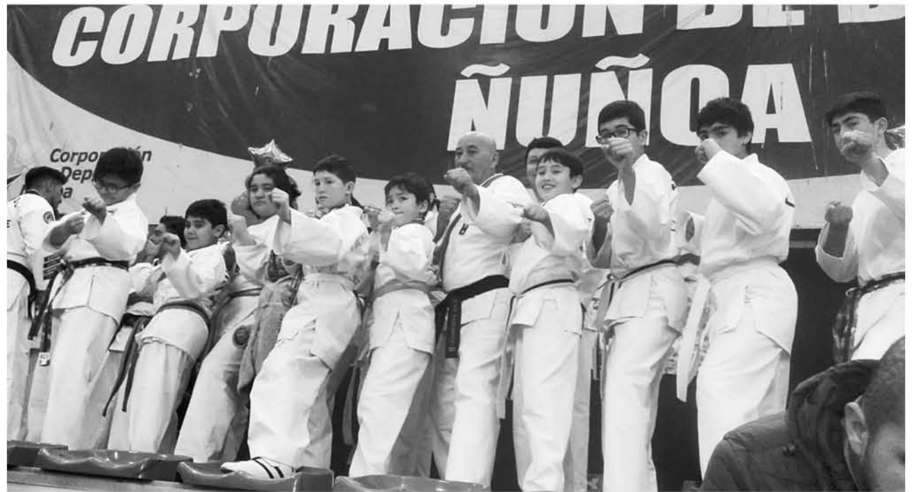
LOS JÓVENES VIAJARON junto a su instructor con poco equipamiento, pero grandes ganas de representar a la provincia.

tuvo nueve primeros lugares, seis segundos, seis terceros y diez medallas por participación, lo más destacable de su actuación fue que los alumnos con mucho esfuerzo viajaron a la capital para enfrentar aproximadamente a 1400 competidores de todo el país.