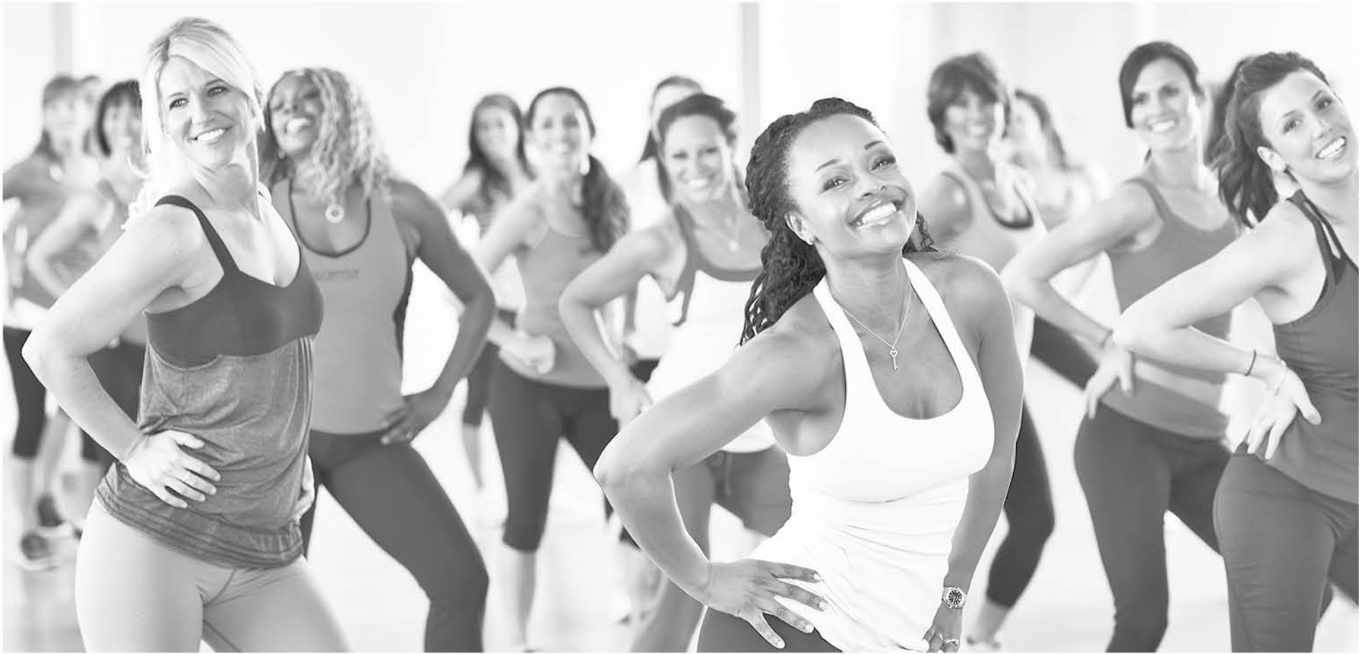
DEBIDO A QUE el entrenamiento es una vez a la semana, se trabajan características y capacidades físicas diferentes. (Foto de contexto)