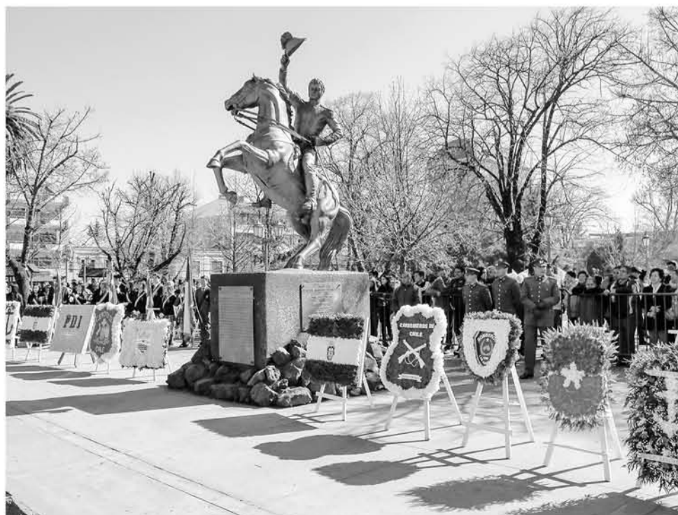
DISTINTAS INSTITUCIONES homenajearon al considerado Padre de la Patria el pasado lunes 20 de agosto en Los Ángeles.

Autoridades depositaron ofrendas florales en la estatua ubicada en la Plaza de Armas de la ciudad.