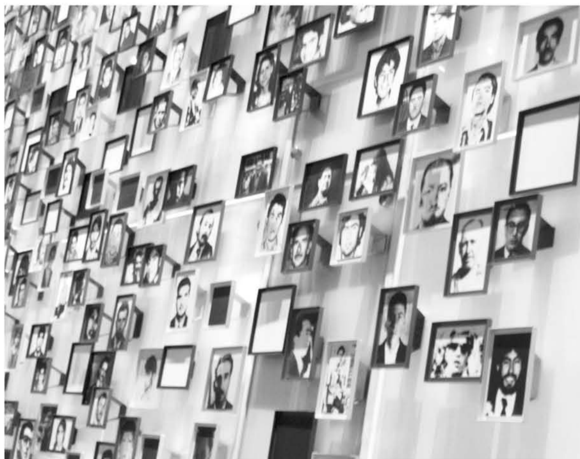
TRAS LA POLÉMICA GENERADA por los dichos del renunciado ministro Rojas contra el Museo de la Memoria, el Presidente Piñera propuso la creación de un Museo de la Democracia.

“La historia y reconciliación de nuestra patria se irá escribiendo con gestos y actos concretos, no incitando al odio o la violencia, y haciéndose cargos de los temas que indignan a la ciudadanía, por lo que hay que avanzar