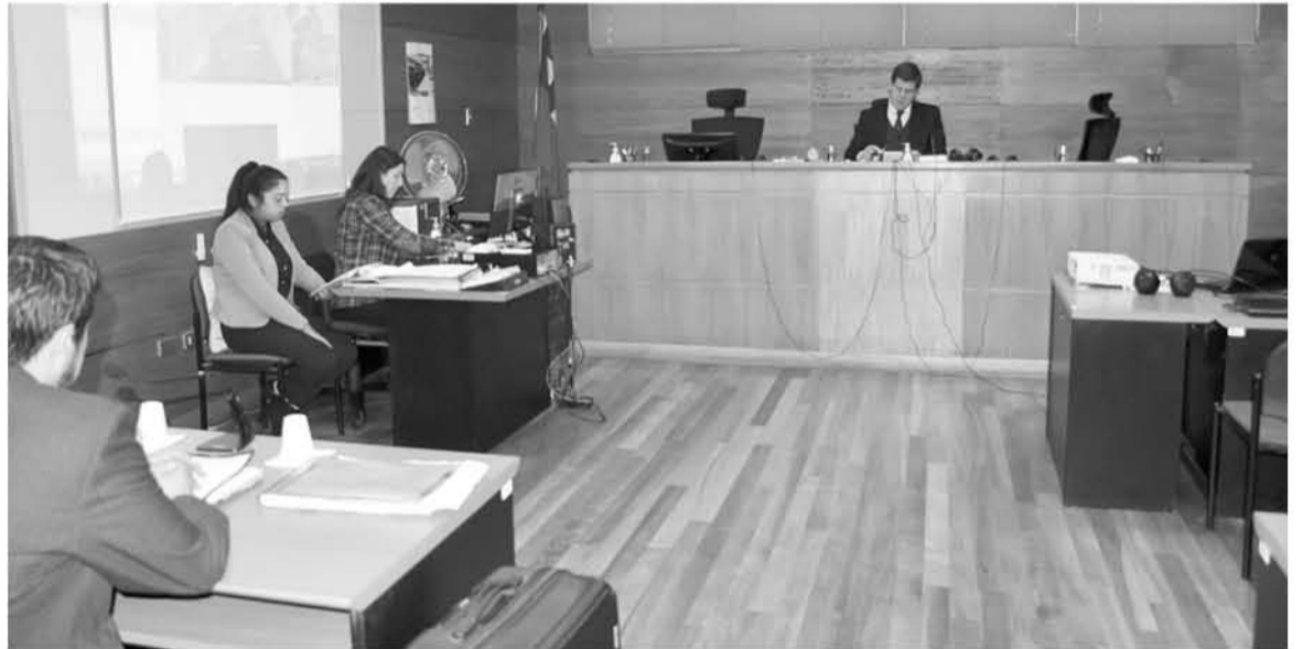
EL CASO FINALIZÓ el día de hoy en Chillán con la sentencia definitiva para este hombre.

Sobre esto el jefe comunal expuso que este es un organismo creado en