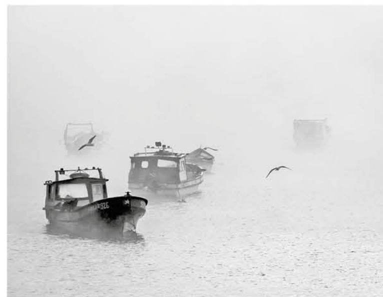
PRIMER LUGAR, Categoría Blanco y Negro Tema Libre, "Bruma Marina". Mauricio Fariña, Chile.