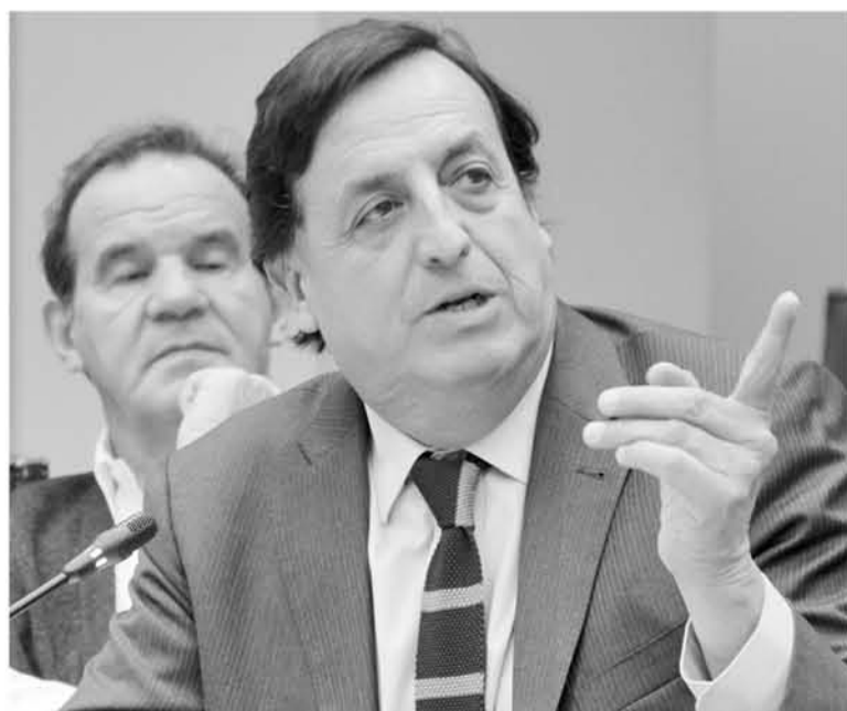
PÉREZ VARELA aseguró que el Gobierno destinará este año $3.125.454.168 a nivel nacional, para distintos proyectos en materia de prevención y seguridad.

Víctor Pérez contestó las críticas que su par por la zona, Felipe Harboe, hizo luego de conocerse la distribución de los recursos del Fondo Nacional de Seguridad Pública.