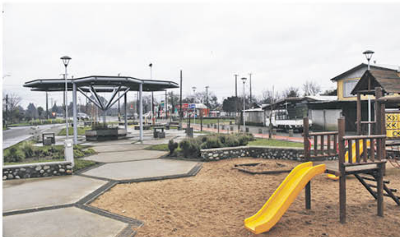
LA ACTUAL ADMINISTRACIÓN ha volcado todos sus esfuerzos por cambiarle la cara a la comuna y abrazar el turismo como un eje de desarrollo productivo.

La primera autoridad regional, se declara consciente de ser una comuna pequeña y por ello tal vez, los recursos cuesta que sean liberados con más facilidad. Es por ello que junto a su equipo de trabajo, propondrán la creación de una Corporación de Desarrollo Productivo y Turístico, para que a través de este organismo realicen alianzas con empresas que trabajan en la zona pero que no tributan en ella, puedan traspasar recursos a de acuerdo a la Ley de donaciones.