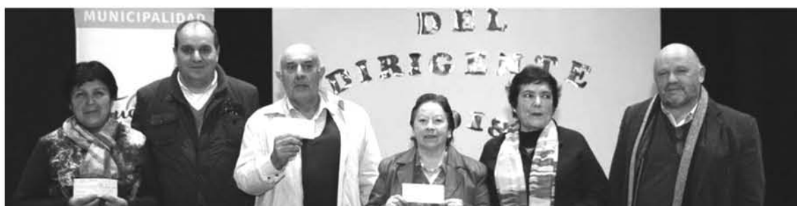
LOS DIRIGENTES se mostraron agradecidos con el municipio al adjudicar estos recursos a sus organizaciones.

Un total de 11 organizaciones de la comuna de Tucapel recibieron cheques correspondientes a los Fondos de Desarrollo Vecinal.