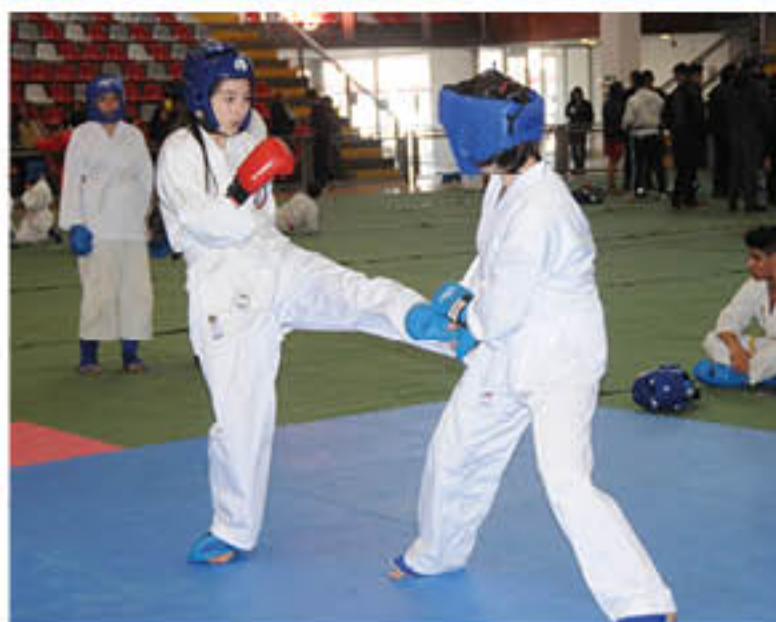
LA CIUDAD CUENTA con grandes exponentes en distintas disciplinas que van desde los balones, pasando por los de contacto hasta llegar a las tuercas.