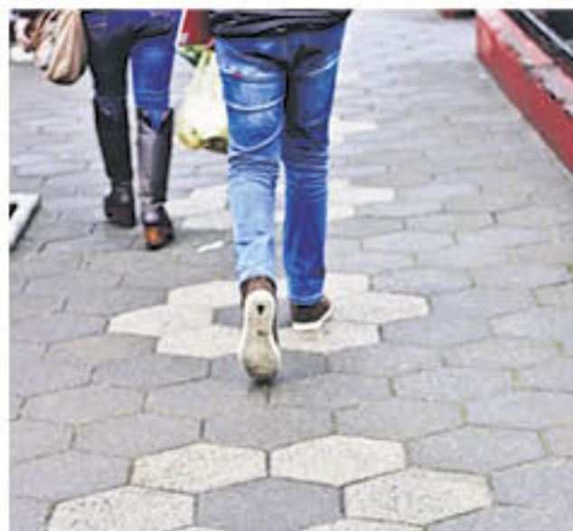
TODO GIRA en torno a la miel, sus veredas por ejemplo tienen forma de las celdillas de una colmena.

Finalmente, Salamanca destaca una vertiente que está entre el estadio y una laguna natural "este lugar es muy visitado tanto por los turistas como los vecinos y también implementaremos medidas para la seguridad constante y la preservación".