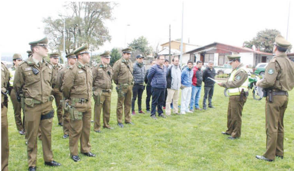
LAS ACTIVIDADES en esta primera instancia se efectuaron en diferentes puntos de las comunas de Nacimiento y Negrete.

Según se pudo conocer, de manera extraordinaria, estas no serán las únicas rondas que se generen en ambas comunas, puesto que según agregó el oficial en esta primera actividad se lograron determinar otros puntos que podrían ser cubiertos en otras operaciones.