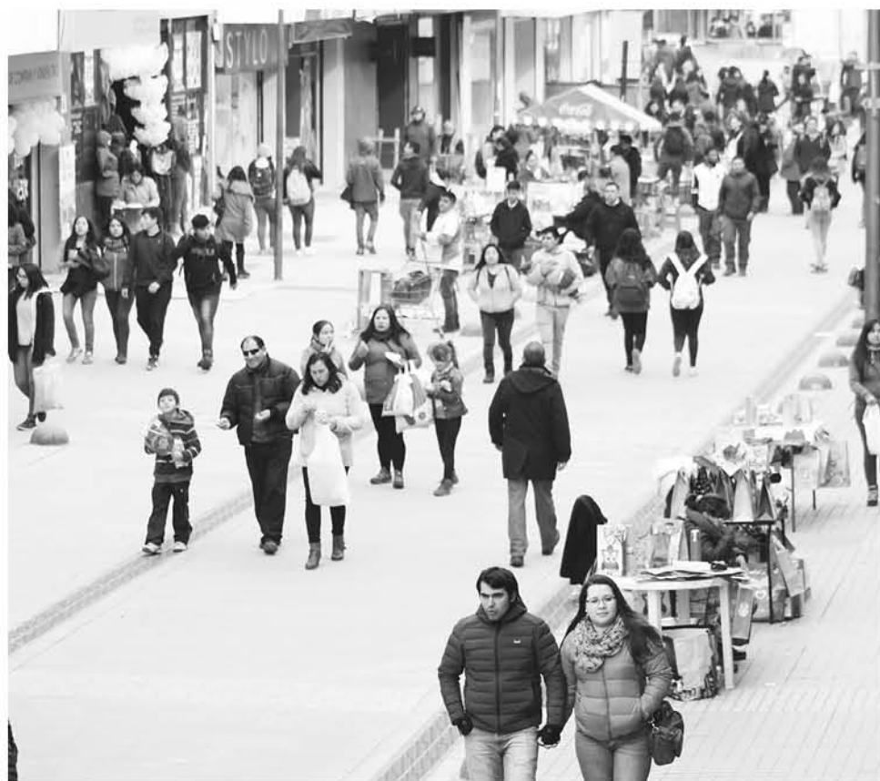
DESDE EL GREMIO destacaron el alza en la economía.

Desde el gremio se mostraron esperanzados en lo que pueda venir y pusieron énfasis en el comercio ambulante.