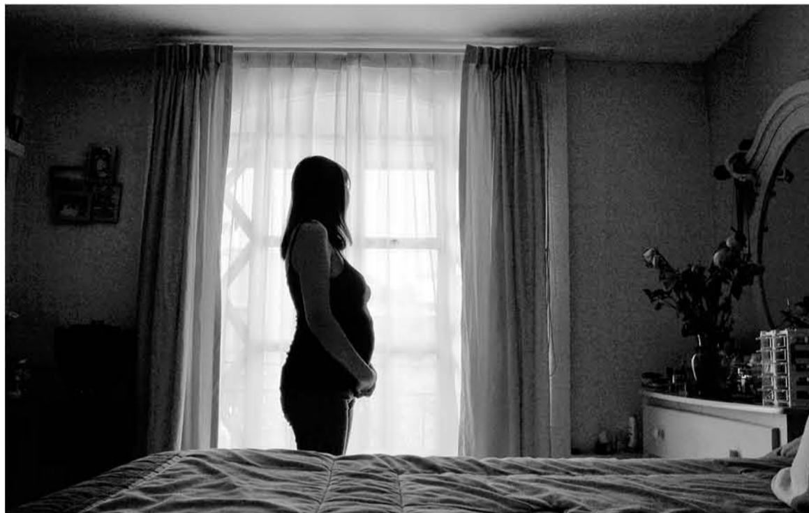
LOS GINECÓLOGOS DIAGNOSTICAN la enfermedad en una embarazada cuando constatan que el óvulo fecundado se anida en las trompas de Falopio en vez del útero. (Foto de contexto).

“Su incidencia anual es alta y sólo es superada por el virus papiloma. La clamidia es más común que la gonorrea y el VIH Sida. Se presenta en la mayoría de los casos en personas menores de 25