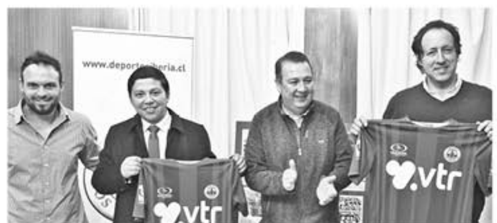
LA FIRMA FUE con la finalidad de hacerse socios partícipes de la institución y familia azulgrana.

Por su parte el diputado aseguró "queremos que aprueben los recursos necesarios para la provincia de