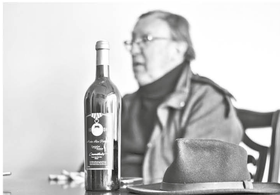
“ESTE ES UN VINO vivo y ¡muy vivo! por tal motivo hay que abrirlo con mucha anticipación para poder tomarlo en un par de horas”.