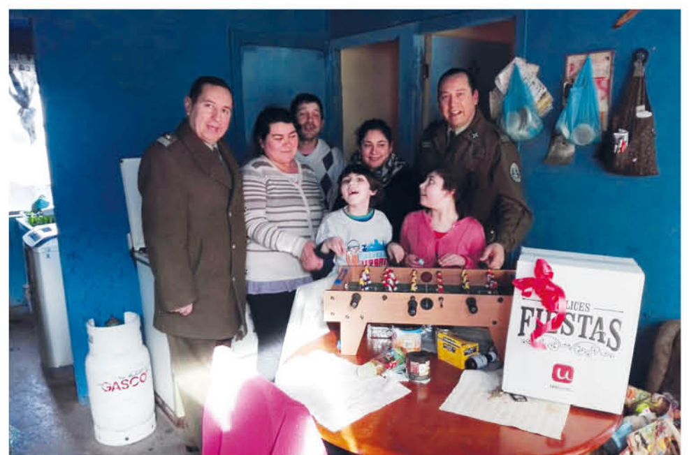
LOS OFICIALES entregaron apoyo en alimentos y diversión para ambos menores de edad.

Fue por ello que a través de diversos medios los oficiales gestionaron ayuda solidaria que en esta ocasión va directamente hacia los menores que actualmente recurren a una escuela especial de la comuna, desde donde se gestionó además este importante y noble gesto en pro de los más necesitados.