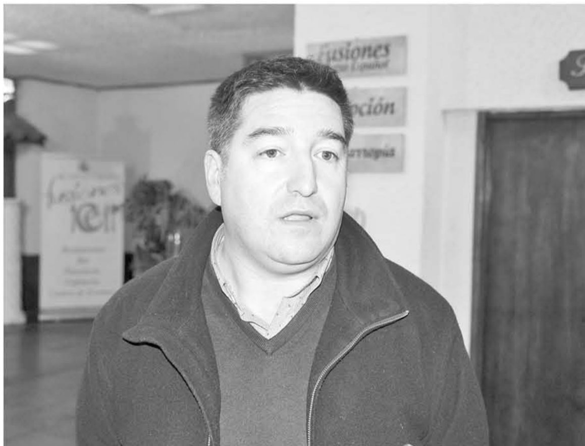
EL PRESIDENTE REGIONAL de Evópoli aseguró que las diferencias al interior del partido ya fueron superadas.