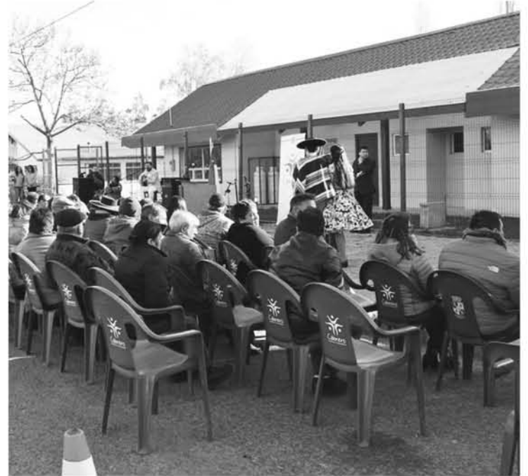
UN CENTENAR DE VECINOS del sector El Progreso, en Cabrero, participaron de la ceremonia de inauguración de su nueva sede.