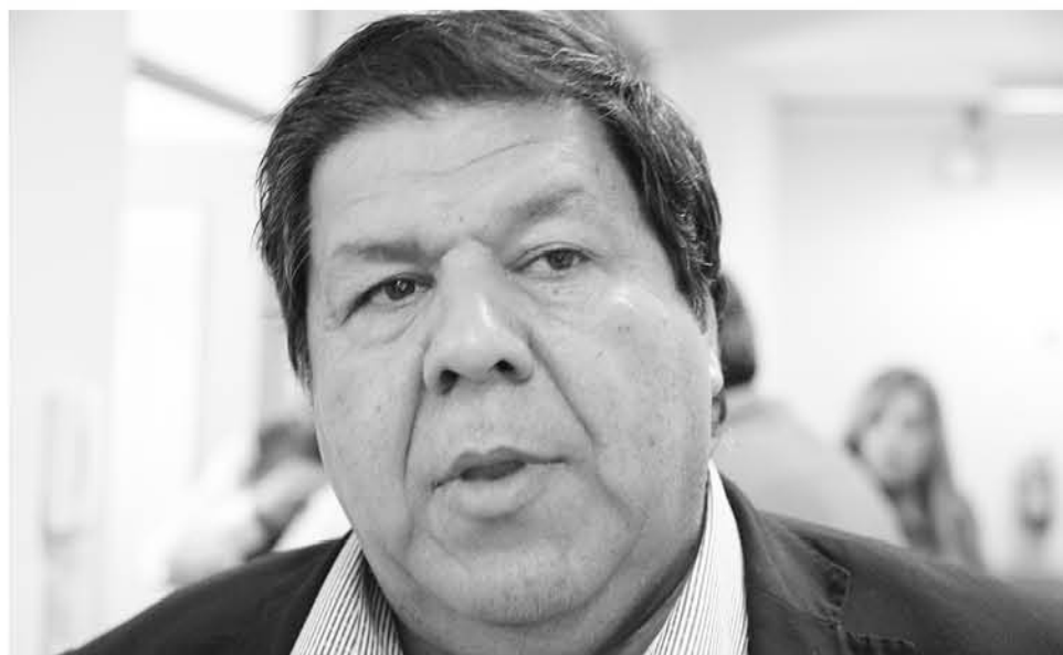
LA AUTORIDAD ha seguido de cerca los casos que conmocionan a su comuna.

caso en materia penal, delin cuencial y que exista conmoción comunal, “nosotros nos vamos a hacer presentes en las querellas, hoy día hasta el momento no ha sido posible, porque no conocemos las conclusiones de los informes policiales respectivos, pero una vez que los conozcamos, vamos a emitir los antecedentes para hacer la presen-