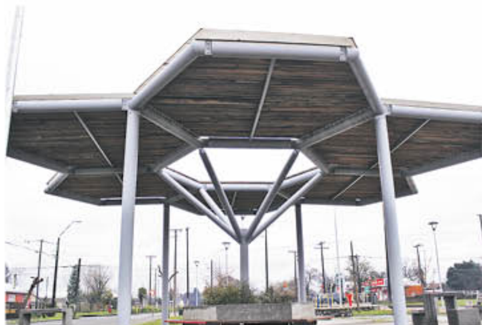
EL PARQUE TEMÁTICO es un espacio que puede congrega exposiciones, ferias y también es un muy buen espacio para que visitantes a la comuna descansen.

A la entrada de la comuna se encuentra el Centro Turístico, que está siendo desarrollado por etapas y que actualmente se está en la construcción de las piezas históricas que relatarán el desarrollo santabarbarino, con sus hitos históricos y también con lo que tiene que ver con su flora y fauna nativa tal como se puede apreciar en el Metro de Santiago, un trabajo