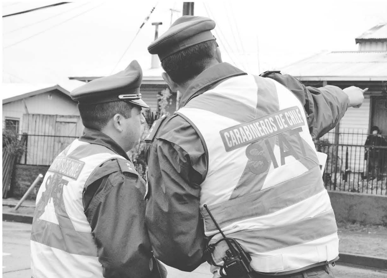
LA MAYOR CANTIDAD DE INFRACCIONES actualmente se han llevado a cabo en las calles Vicuña Mackenna, avenida Ricardo Vicuña, avenida Alemania, avenida Los Ángeles y también en calle Los Carrera.

Según agregó el profesional, estos casos se han presentado hasta la fecha con mayor frecuencia, en las calles de Vicuña Mackenna, avenida Ricardo Vicuña, avenida Alemania, avenida Los Ángeles y también en calle Los Carrera, donde se han originado accidentes estas últimas semanas y otras de estas calles se evidencia en calle Gabriela Mistral y avenida Marconi, ya que estos son los puntos, donde generalmente los conductores están transgrediendo los límites permitidos de velocidad con esta modi-