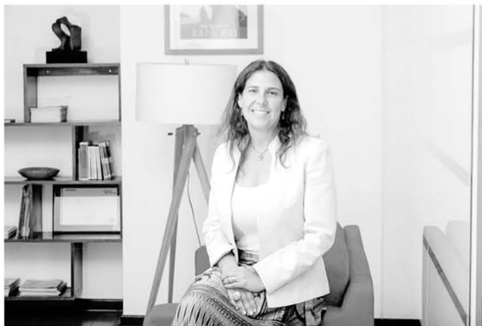
LA PROFESIONAL CUENTA con más de 20 años de experiencia principalmente en el área comercial y de marketing.