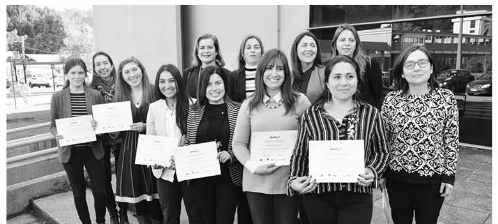
LOS RECURSOS han sido destinados, por una parte, a la etapa de asesorías y mentorías y ahora, recibirán este subsidio variable de hasta 12 millones de pesos.

Finalmente, cabe mencionar que tras la entrega de los respectivos recursos financieros, los proyectos trabajarán en terminar un prototipo que pueda ser validado en el mercado para continuar, posteriormente, con su etapa de crecimiento y preparar su proceso de promoción, distribución y venta.