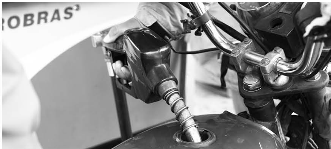
EXISTE LA POSIBILIDAD de adquirir una propiedad completamente nueva, o también se puede comprar una usada.

En los precios de productos que ENAP entrega a los distribuidores mayoristas, influyen factores como el precio en el mercado de referencia, costos de transporte y logística, costos de internación o arancel aduanero, seguros, impuestos específicos e IVA, evolución del tipo de cambio y el efecto del impuesto o crédito del Fondo de Estabilización de Precios de Combustibles Derivados del Petróleo.