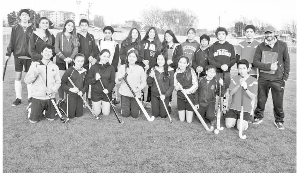
LOS EQUIPOS APROVECHARON al máximo las instalaciones del Complejo Deportivo Orompello para entrenar.

Por su parte el cuadro de Río Bravo, tuvo una provechosa jornada