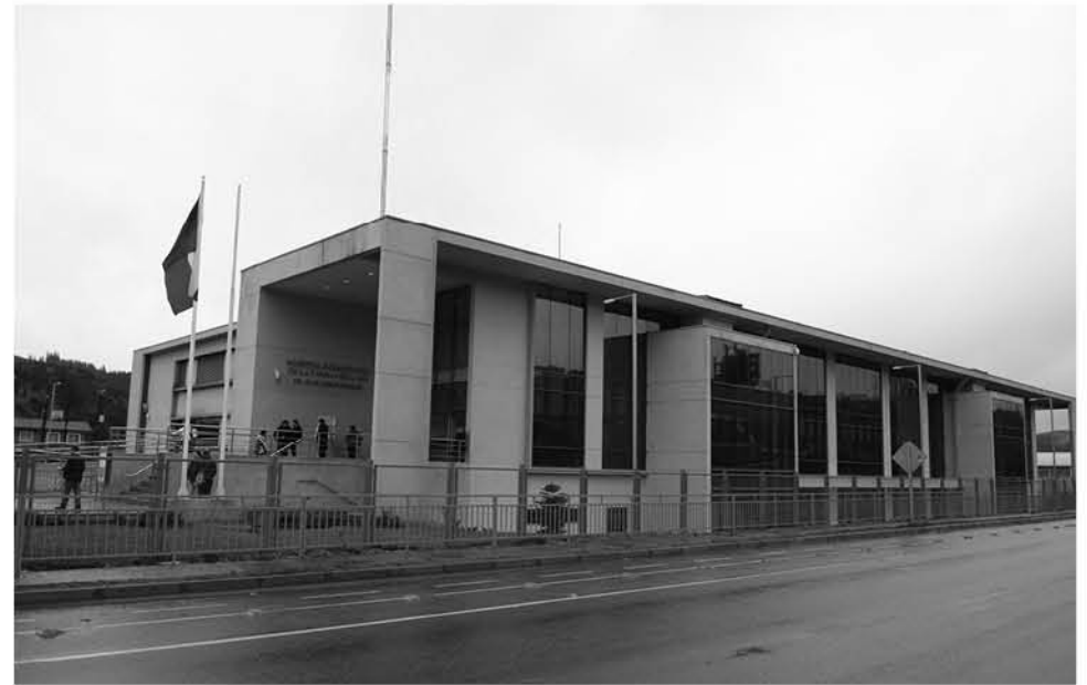
LOS HECHOS DENUNCIADOS habrían afectado a un grupo de ocho ex trabajadores que se desempeñaron en el Hospital de Laja, contratados por la empresa de aseo Chillandent Servicios Integrales Limitada.

Finalmente, destacaron que como empresa proveedora del servicio de aseo del Hospital de Laja no han recibido ningún reclamo por parte de dicho establecimiento de salud.