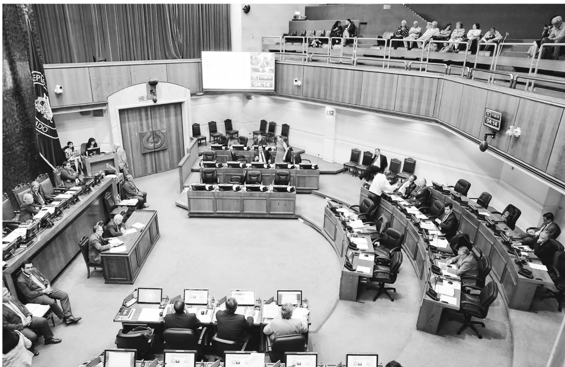
UN INTENSO DEBATE ha generado en la Cámara la tramitación de esta ley (Archivo).

Finalmente, la recomendación de la Comisión Mixta es no innovar en cuanto a los plazos (cinco años, contados desde la fecha de la inscripción) y procedimientos para que realicen acciones solicitando compensación en dinero terceros que acrediten dominio sobre todo el inmueble o una parte de él y que no hayan ejercido oportunamente una reclamación, así como los que pretendan derechos de comunero sobre el mismo o ser titulares de algún derecho real que los afecte.