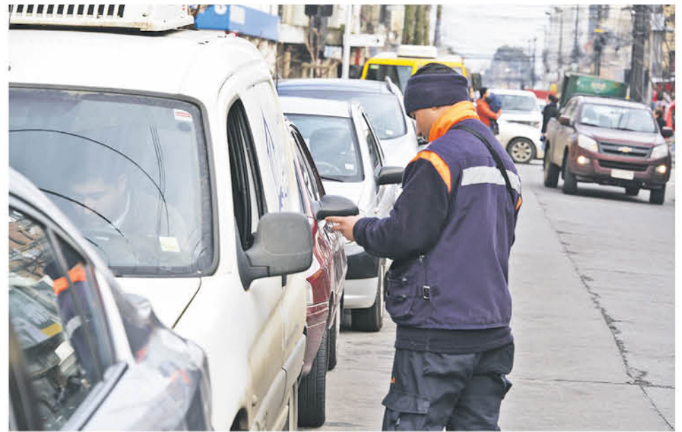
LA CONCESIÓN DE ESTACIONAMIENTOS en Los Ángeles a cargo de la empresa ECM es un dolor de cabeza para todos los angelinos.