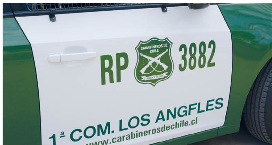
LAS ESPECIES ROBADAS fueron devueltas a su dueña, luego del procedimiento policial.

En la detención del sujeto, se pudo corroborar que este hombre mantiene más de 18 detenciones anteriores por delitos de mayor connotación social. Luego de esto el hombre quedó en libertad, por orden de fiscalía.