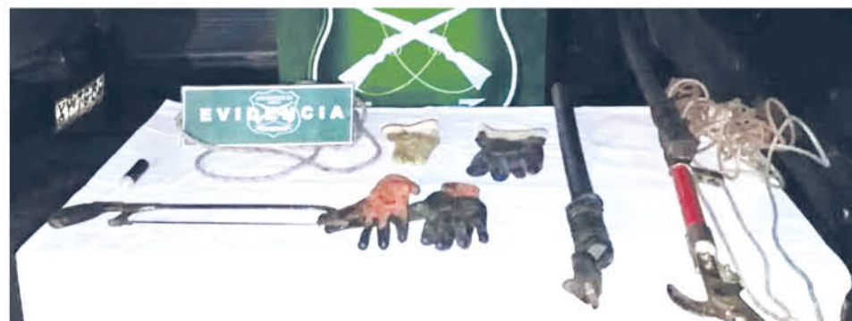
PERSONAL DE CARABINEROS procedió a la fiscalización de todos los implementos de estas personas.

Por orden de la fiscalía local, la mañana del miércoles quedaron en libertad tres sujetos que fueron detenidos, durante la madrugada, luego de ser sorprendidos intentando robar tendido eléctrico, en la carretera Cinco Sur.