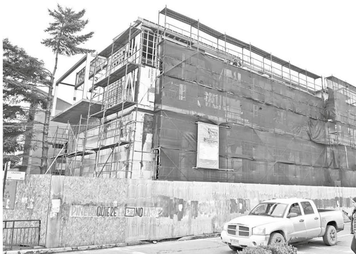
EL PRÓXIMO 30 de agosto se enfrentarán en el tercer Tribunal Ambiental Codepala y la municipalidad de Los Ángeles, para exponer la situación en que se encuentra el edificio del ex Liceo de Hombres debido a la construcción del futuro Centro Cultural.