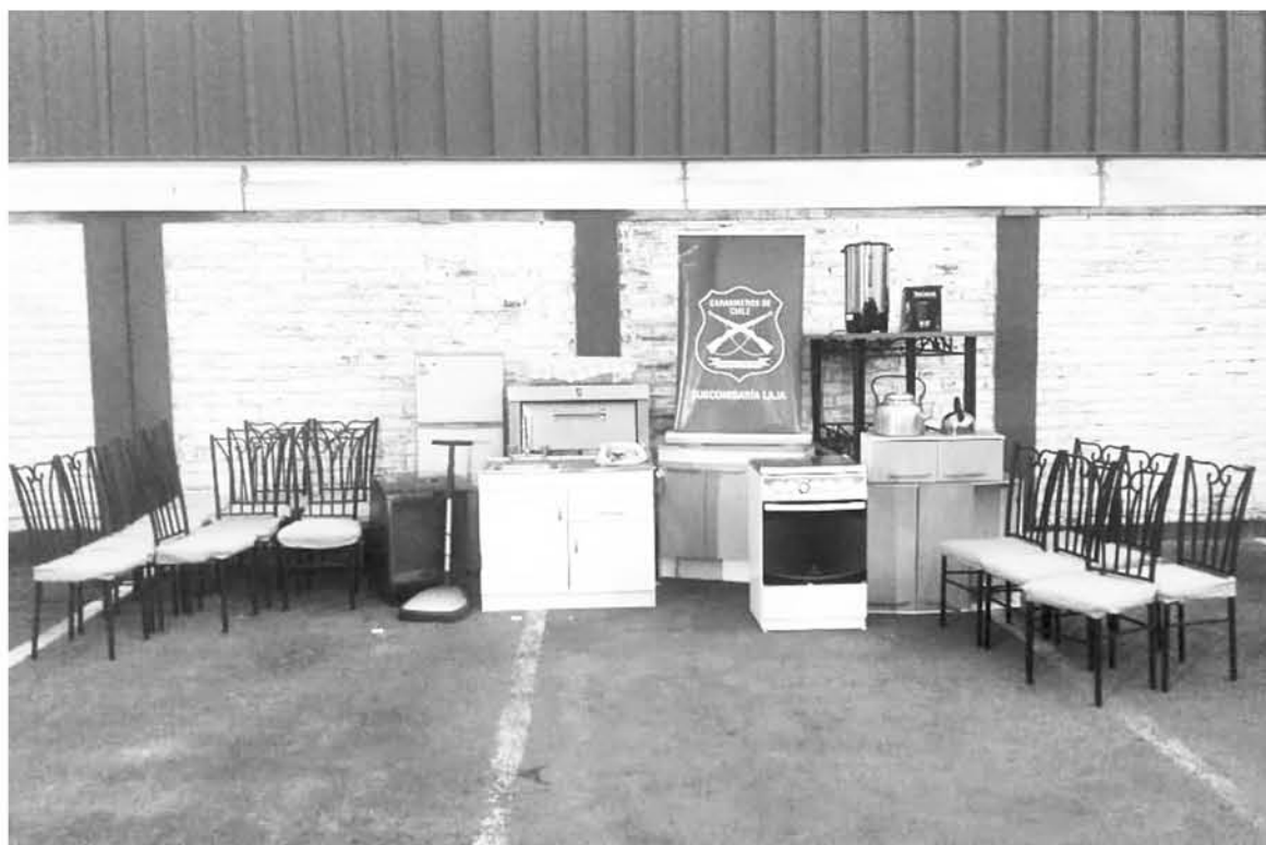
LAS ESPECIES FUERON robadas con total calma desde las inmediaciones de esta capilla ubicada en la calle Chorrillo de la comuna de Laja.

Según explicó el capitán Tomás Hormazábal de la Subcomisaría de Laja, la tarde del martes "este es un procedimiento que está en curso y de manera preliminar se puede conocer que se trataría de dos hombres involucrados quienes tenían en su poder todos los artículos".