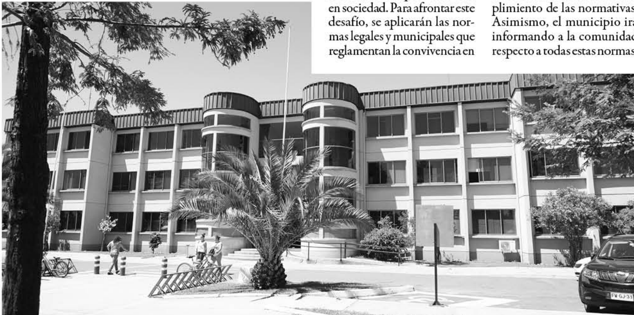
EL MUNICIPIO DE CABRERO dispuso un aumento en el número de inspectores municipales para fiscalizar el cumplimiento de distintas ordenanzas.

El administrador municipal señaló también que el respaldo de este plan se encuentra en la propia ciudadanía, que en variadas reuniones vecinales manifiesta sus quejas por la falta de cumplimiento de leyes, decretos y ordenanzas, demandando al Municipio una acción efectiva al respecto.