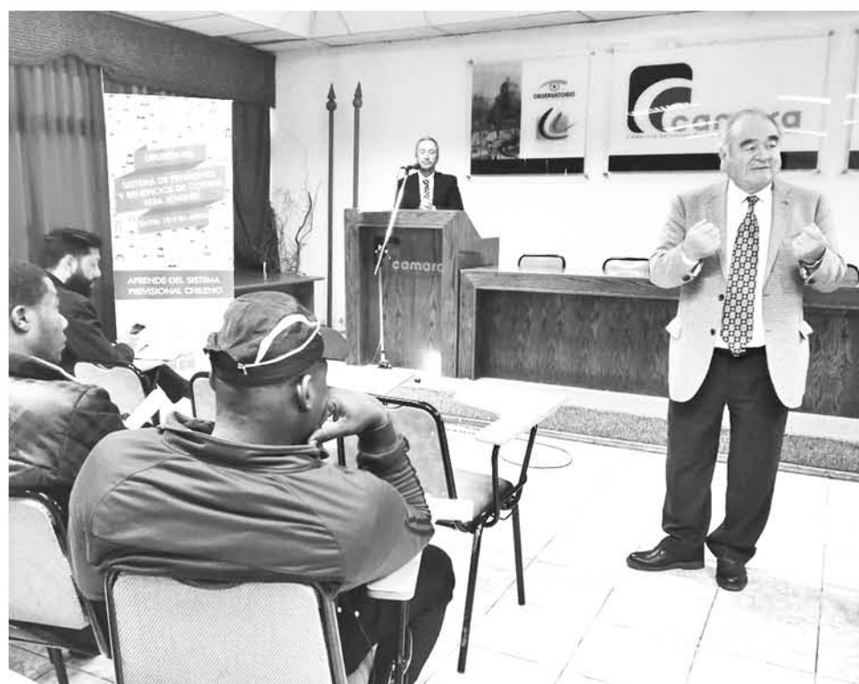
CON LA INICIATIVA, se pretende instar a los jóvenes a participar y conocer la forma en la que se cotiza en el país.

Recalcando que ese es el gran objetivo del Gobierno con relación a este tema, “en