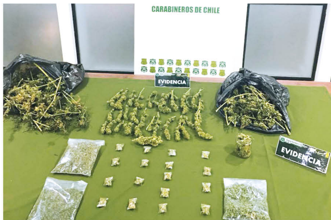
EN ESTE OPERATIVO, se llevó a cabo la noche del martes en el sector de Los Guanacos.

Por este delito y según las instrucciones de fiscalía local, este hombre de 24 años de edad identificado con las iniciales J.M.L.L., se mantuvo en detención.