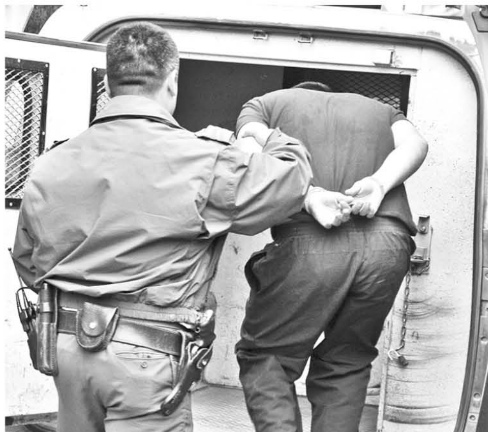
EL MENOR ACTUÓ solo en todos estos actos y fue identificado gracias a las referencias entregadas por sus propias víctimas. (Foto de contexto).

El implicado de 17 años, sustrajo especies desde un supermercado y luego ingresó a dos viviendas para realizar otros actos delictuales.