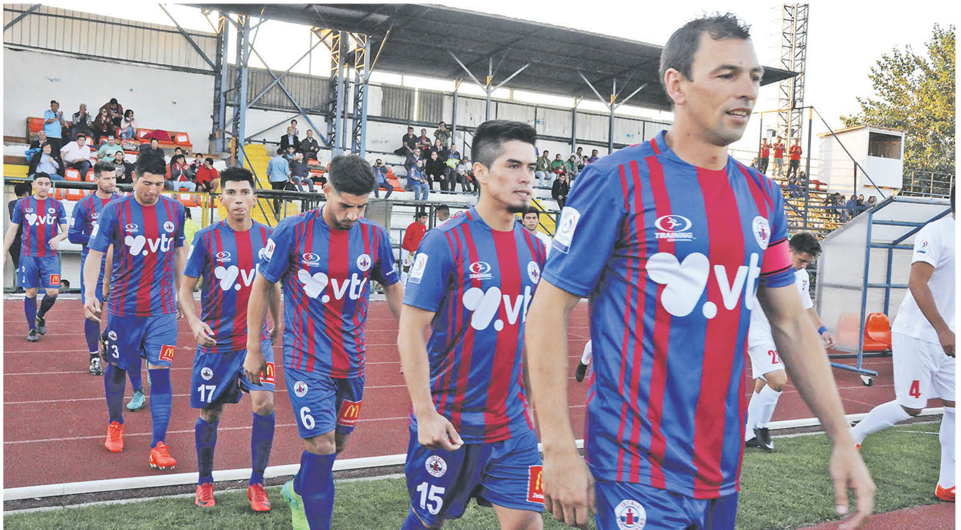
ESTE FIN DE SEMANA Iberia enfrentará como local a su clásico rival Malleco Unido.