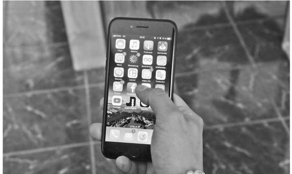
LA ZONA pasó de 10 en el primer semestre de 2016 a 13 en el mismo período en 2018.

Consultada por la realidad del Biobío, Hyde destacó que en las cifras a nivel nacional se muestra un alza más evidente en las denuncias por ciberbullying, y manifestó que "en la región se no han presentado variaciones drásticas en las denuncias por ciberbullying, pasamos de 10 en el primer semestre de 2016 a 13 en el mismo período en 2018. Pese a esto, todos debemos mantenernos muy