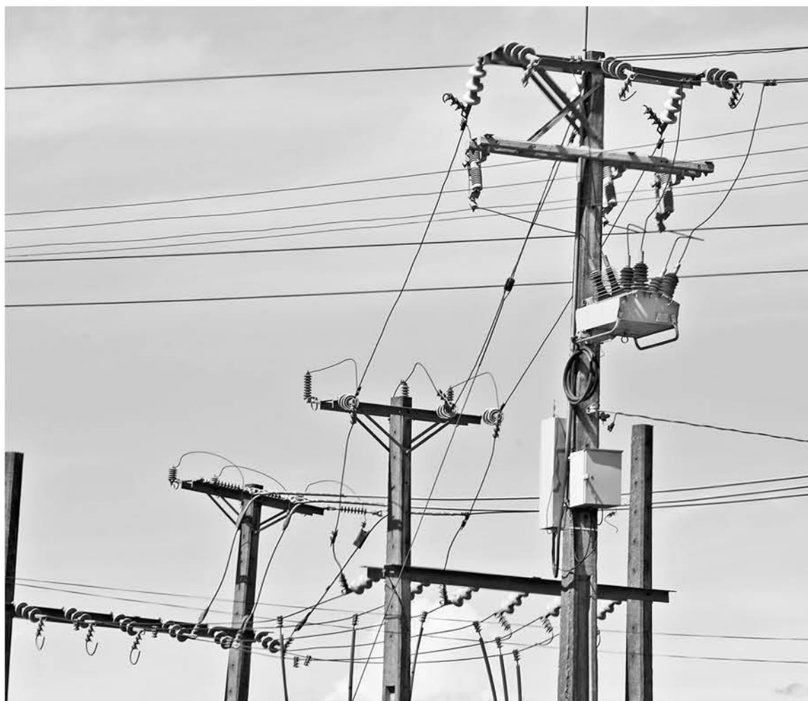
PERSONAL DE LA EMPRESA CGE realizó las reparaciones en este sector durante la tarde del domingo.

Ante esto, según se dio a conocer, se debió aplicar protocolos de emergencia por medio del uso de generadores para continuar las transmisiones, las que lograron ser reestablecidas durante la mañana del domingo.