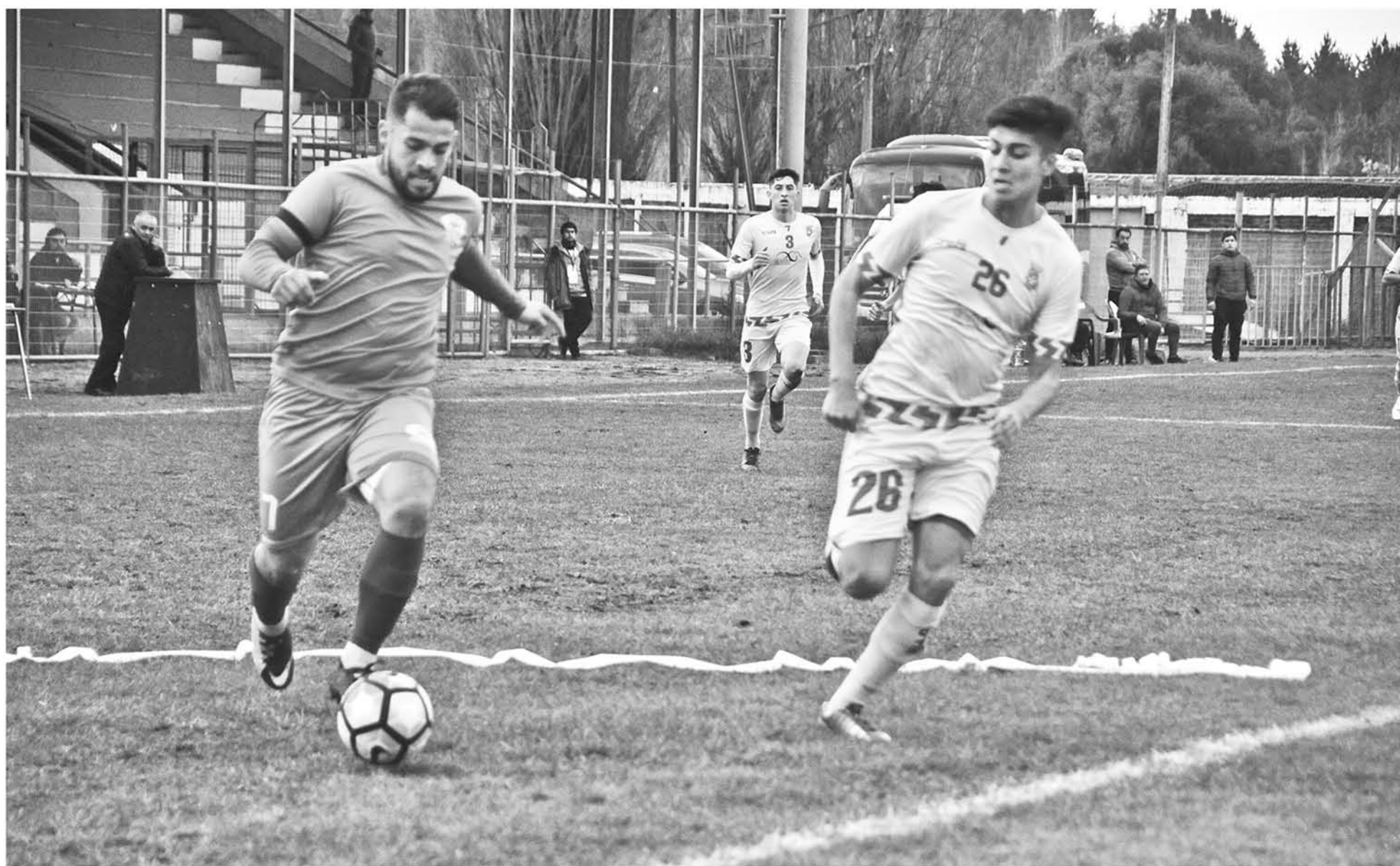
PESE A LO ANTERIOR, Comunal Cabrero sigue como puntero en la tabla de posiciones.