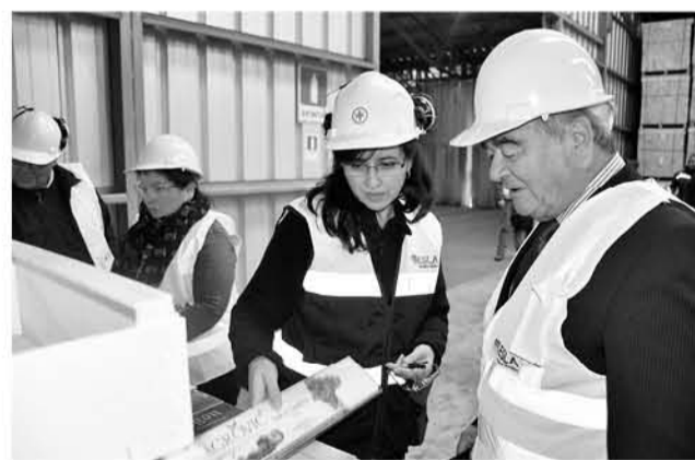
EL SEREMI anticipó que de los 260 cupos disponibles, 80 han sido dispuestos para las provincias de Ñuble y Biobío.

Analista desarrollador de aplicaciones web. Ese es el curso, sin costo, al que te convoca el Servicio Nacional de Capacitación y Empleo - Sence - a través del Programa Becas Laborales y el financiamiento del OTIC Sofofa.