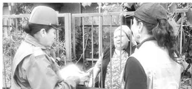
EN ESTA OPORTUNIDAD la campaña realizada por los oficiales se enfocó en la población Diego Portales.

Cabe señalar que estas campañas se enmarcan en el contexto de trabajo con la comunidad orientado en diversos aspectos que puedan ser problemáticas que atenten contra la seguridad ciudadana.