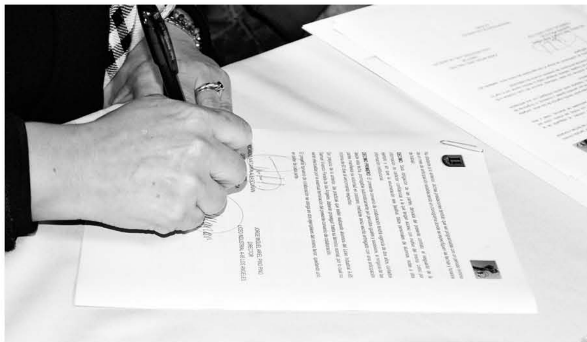
AMBOS CONVENIOS se suman a los que ya están en curso durante este 2018 con Repuestos Biobío, Lechería Ancali y Latin Equipment.