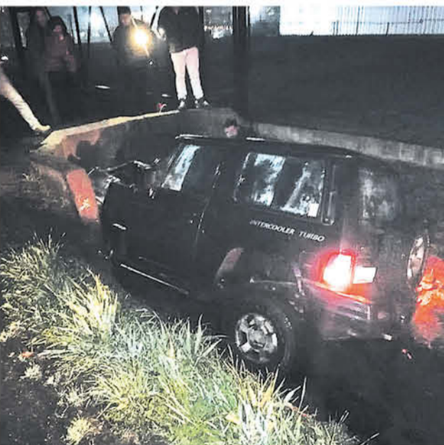
EL CONDUCTOR del vehículo tuvo que ser rescatado por Bomberos desde esta zanja donde terminó su recorrido.

Al momento de ser asistido por personal de emergencia, en el vehículo se encontraba solo su conductor.