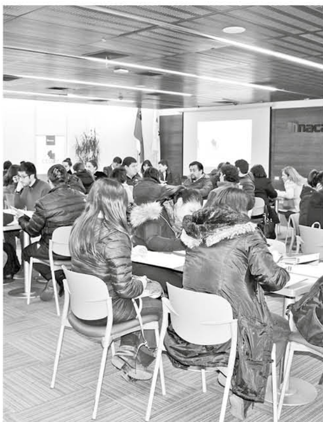
EL CURSO SE DICTARÁ en 5 sesiones, extendiéndose durante cuatro semanas.