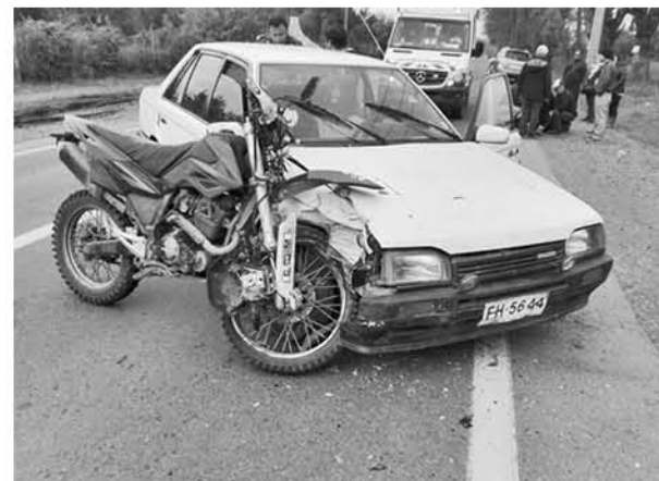
EL CONDUCTOR de este auto se mantuvo durante la tarde de este domingo en detención.

Hasta el cierre de esta edición, no se pudo determinar qué tipo de lesiones fue la que sufrió el joven afectado por este impacto.