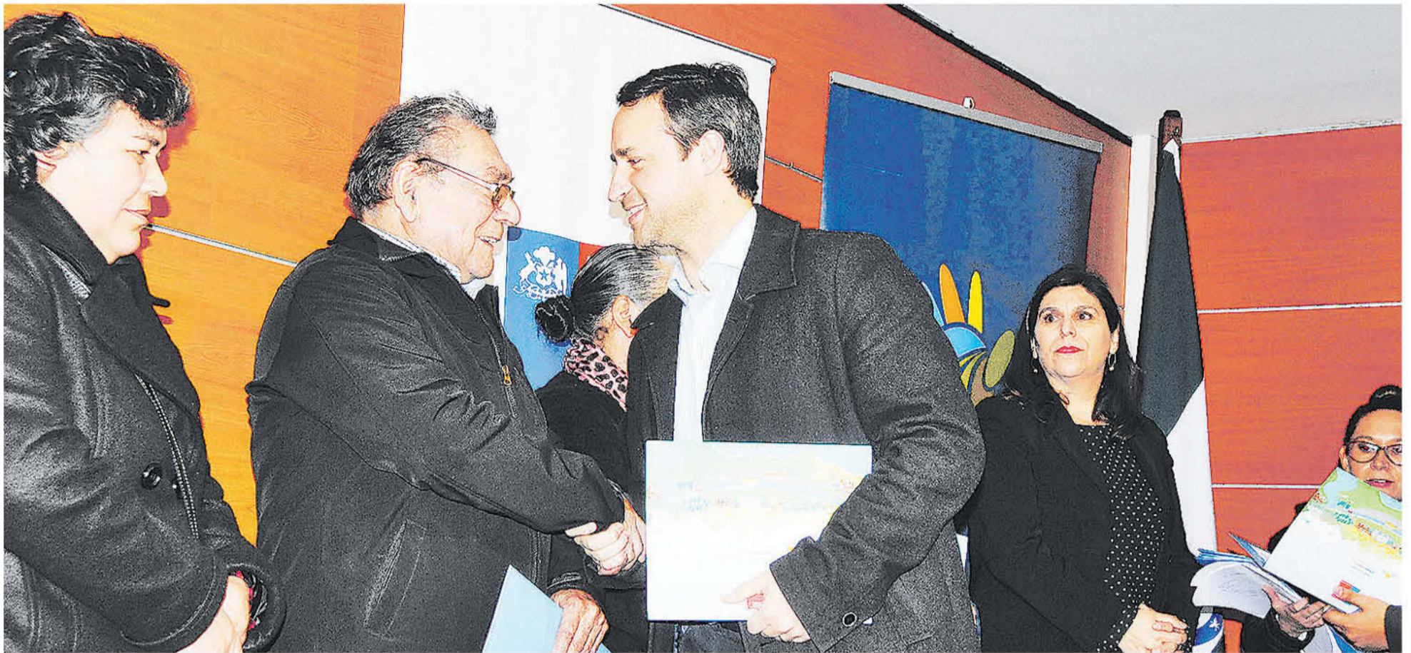
LA ACTIVIDAD se basó en la entrega de estos diferentes subsidios a familias de la provincia.