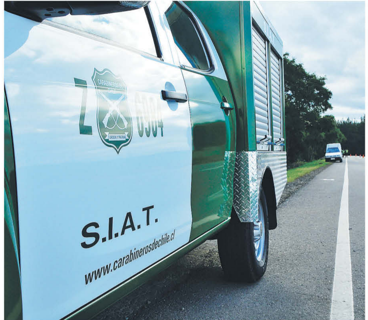
EL ACCIDENTE se produjo la madrugada del sábado por causas que aún se están investigando. (Foto de contexto)

Cabe señalar que sus restos serán velados durante esta semana en su