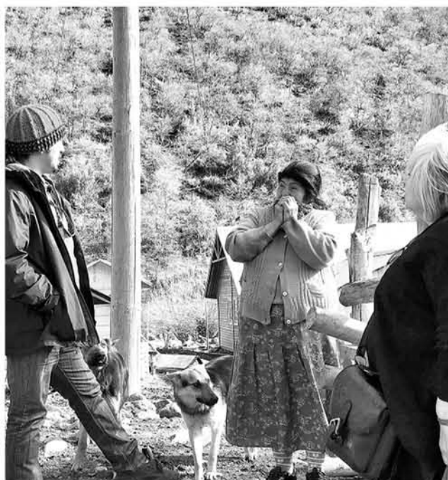
EN ESTA OCASIÓN, fueron cinco las comunidades visitadas.

La instancia busca crear las bases curriculares para la enseñanza de los idiomas de pueblos originarios.