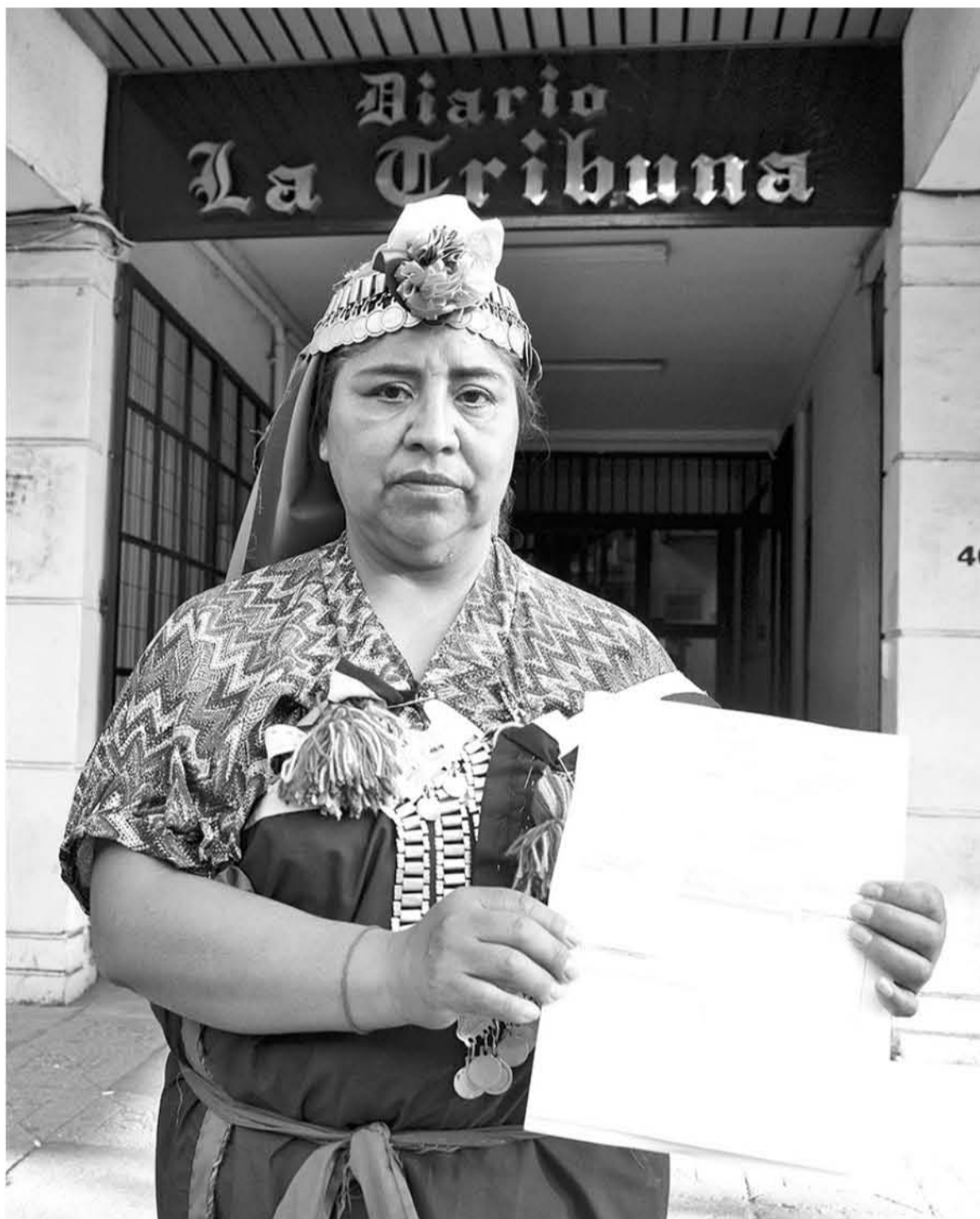
LA DIRIGENTE entregó de manera personal este petitorio al Presidente de la República.

“El Presidente de la República no tiene idea de dónde están las comunidades... ellos son afuerinos... llegan a un lugar y piensan que todo detrás de la montaña funciona bien. Entonces, por eso la mayor parte de los problemas se tiene que abordar con alto nivel de Gobierno. Ahí tiene que haber gente responsable que tiene que hacer auditorías, ver