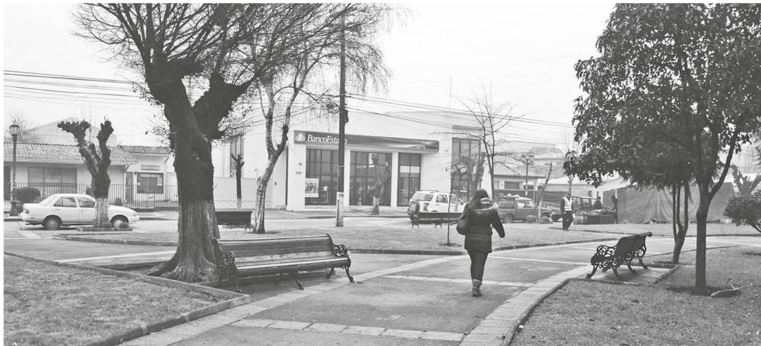
LA COMUNA fue una de las más beneficiadas de la zona.

“Si bien es cierto, los dirigentes se esfuerzan, presentan los proyectos, el municipio apoya y asesora también, pero aquí los consejeros regionales son los que tienen la última palabra, son ellos quienes levantan su mano, y aprueban los proyectos de la región, y en esta oportunidad los consejeros de la provincia de Biobío apoyaron estos proyectos, sin dejar de agradecer a todos los Core”, recalzó la máxima autoridad de Cabrero.