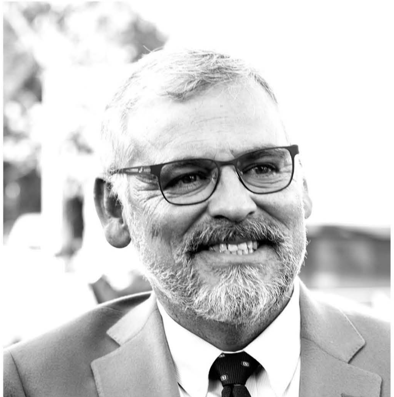
SEREMI DE ECONOMÍA subrayó la importancia y los gestiones que se realizan para dar más oportunidades de desarrollo a las PYME locales.

Al respecto, Gutiérrez enfatizó que a principios de meses sostuvieron una importante reunión con BancoEstado, para conocer las ofertas que tiene la entidad