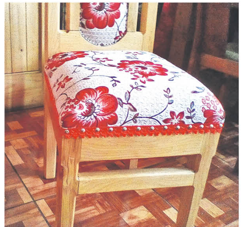
BANQUETAS Y TAPIZAR SILLAS, algunos de los trabajos que estos maestros mueblistas tienen en un puesto de la Feria de las Pulgas en Santiago Bueras. Fono de contacto +56986667212 y +56990023823.

Una conversación cargada de emotividad y esperanza que finalizó con una expresión de solidaridad comprensible por las experiencias de vida a la que se sometieron "si alguna institución que ayuda a los demás (niños o ancianos) necesita que les restauremos muebles, lo podemos hacer sin cobrar, el tema es colaborar por toda la ayuda que nos han entregado a nosotros".