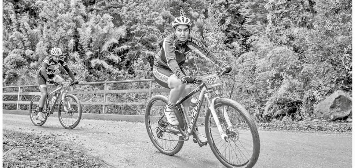
EN ESTA ETAPA la participante del equipo de Cabrero nuevamente se quedó con la fecha. (Foto de contexto)

Los deportistas ya se preparan para la penúltima fecha de la competencia que tendrá como anfitrión a la ciudad de Los Ángeles, este 12 de agosto en el circuito local.