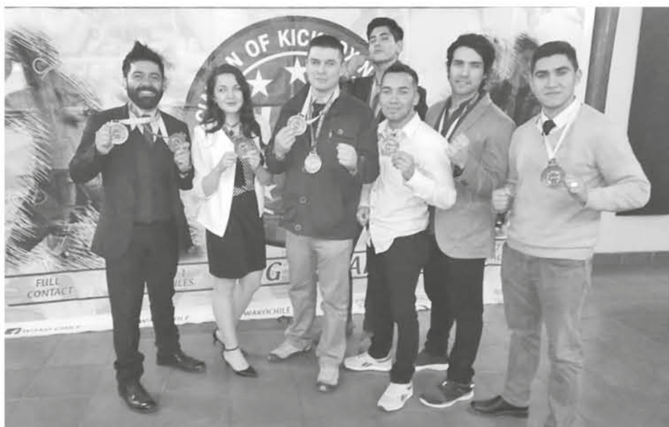
LOS DEPORTISTAS deben cumplir con una serie de entrenamientos especiales exigidos por la federación.

Los seleccionados, se preparan arduamente para la convocatoria, pero para ello necesitan los recursos necesarios para costear el viaje, por lo que realizarán todas las actividades posibles para defender los colores de la bandera en México.