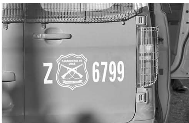
AMBOS JÓVENES fueron sorprendidos en la plaza de esta localidad pasada las 21 horas de este lunes. (Foto de contexto).

El joven de 16 años realizaba las transacciones en el centro de la ciudad junto con una mujer de 18 años, pasada las 21 horas.