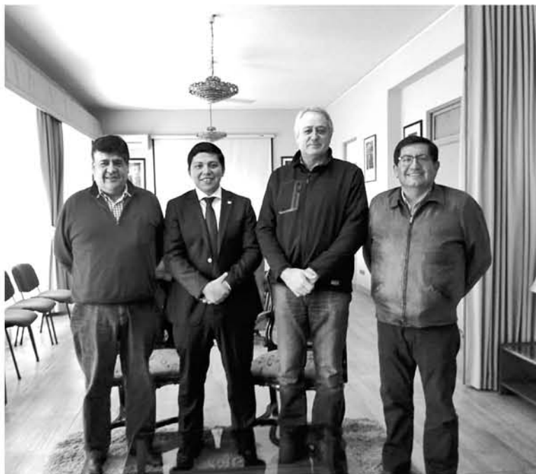
LOS DIRIGENTES de la agricultura local esperan tratar todos los temas que afectan a los gremios de la provincia.

SALUDO PROTOCOLAR DE LA MULTIGREMIAL BIOBÍO