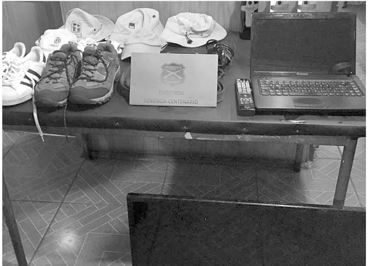
LOS INVOLUCRADOS habían sustraído especies de la vivienda cuando se encontraba sin sus moradores.

Ante esto el sujeto fue detenido durante la noche en dependencias de la Tenencia, posterior a ello, durante el día martes el hombre pasó a control de detención para comenzar una investigación al respecto por este delito que afectó a ciudadanos de la provincia.