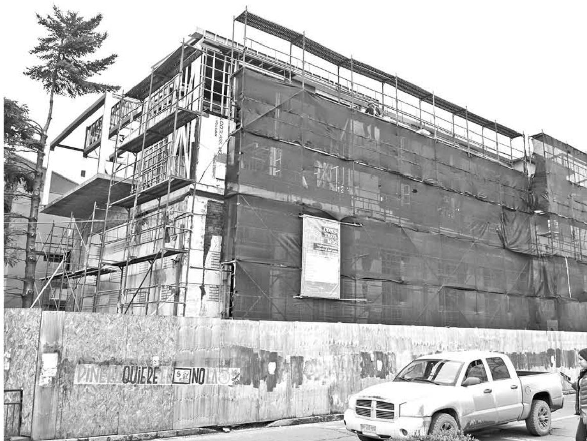
LAS OBRAS EN EL EX INTERNADO continuarán paralizadas, en lo que respecta a su fachada, hasta la próxima audiencia donde se decidirá el futuro de este edificio.

Aunque este es un hecho coyuntural en los acontecimientos que han rodeado el proceso de la construcción del Centro Cultural, que se viene realizando desde hace varios años, cobra relevancia por las acciones que ha realizado el tercer tribunal ambiental ya que en el mes de julio se realizó una visita inspectiva en dichas