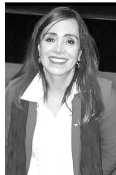
DESDE LA SEREMI de Cultura de Biobío lamentaron la situación.