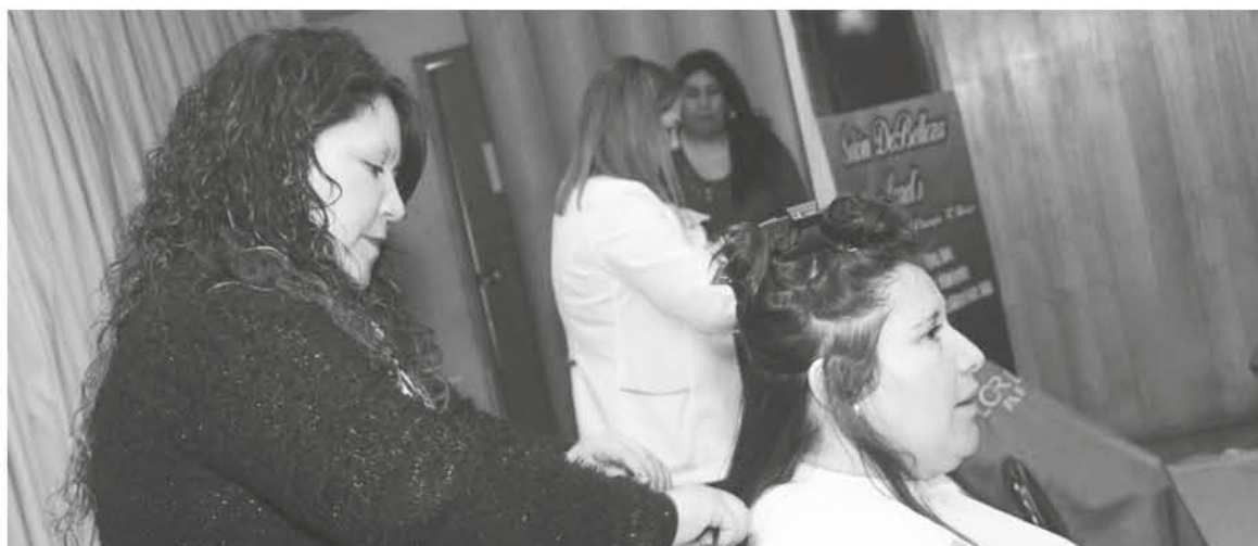
LAS ASISTENTES a esta feria además pudieron recibir asesoría de parte de otros servicios públicos.

El Centro de la Mujer de esa comuna, en coordinación con el municipio local y el Sernameg organizaron la “Feria Integral de la Mujer”.