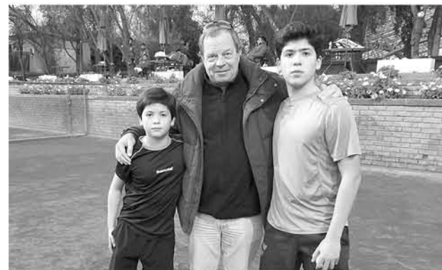
TRAS LA AUDIENCIA los muchachos deberán lograr sus objetivos y expresar al máximo sus potencialidades.

Los trabajos con el profesional francés seguirán efectuándose donde las promesas del tenis serán evaluadas a distancia, para el próximo año asistir personalmente a Valencia al centro de desarrollo, donde asisten los mejores tenistas del mundo.