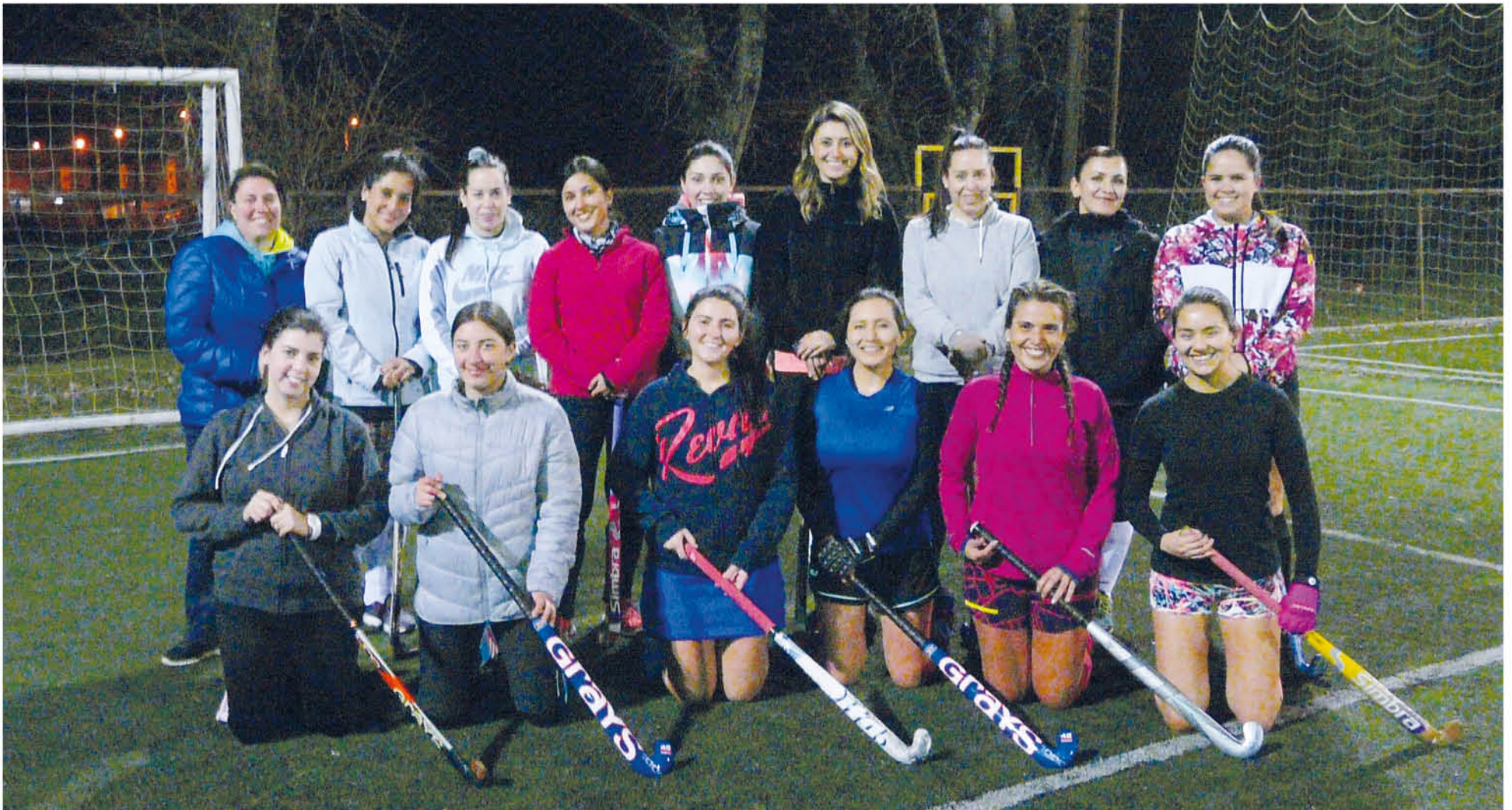
EN EL MES DE SEPTIEMBRE el equipo de hockey desea realizar su primer cuadrangular.

A partir de la inquietud de algunas damas por practicar la disciplina en la ciudad nació el equipo próximo a estrenar sus primeros encuentros.