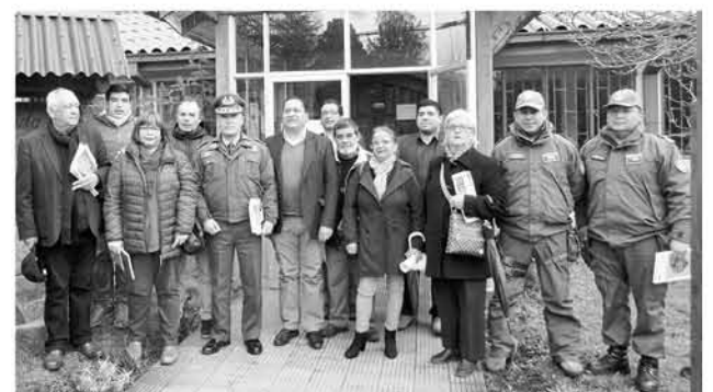
LA VISITA DEL GENERAL Medina se realizó en dependencias del municipio y por diferentes cuarteles policiales.

Además de esto durante la jornada, el general Medina también visitó diversos cuarteles policiales para ver las necesidades de los carabineros en zonas más alejadas. Es así como pudo compartir con los funcionarios de la Subcomisaría Cabrero, de las tenencias Huépil y Antuco y de los retenes Quilleco y Polcura.