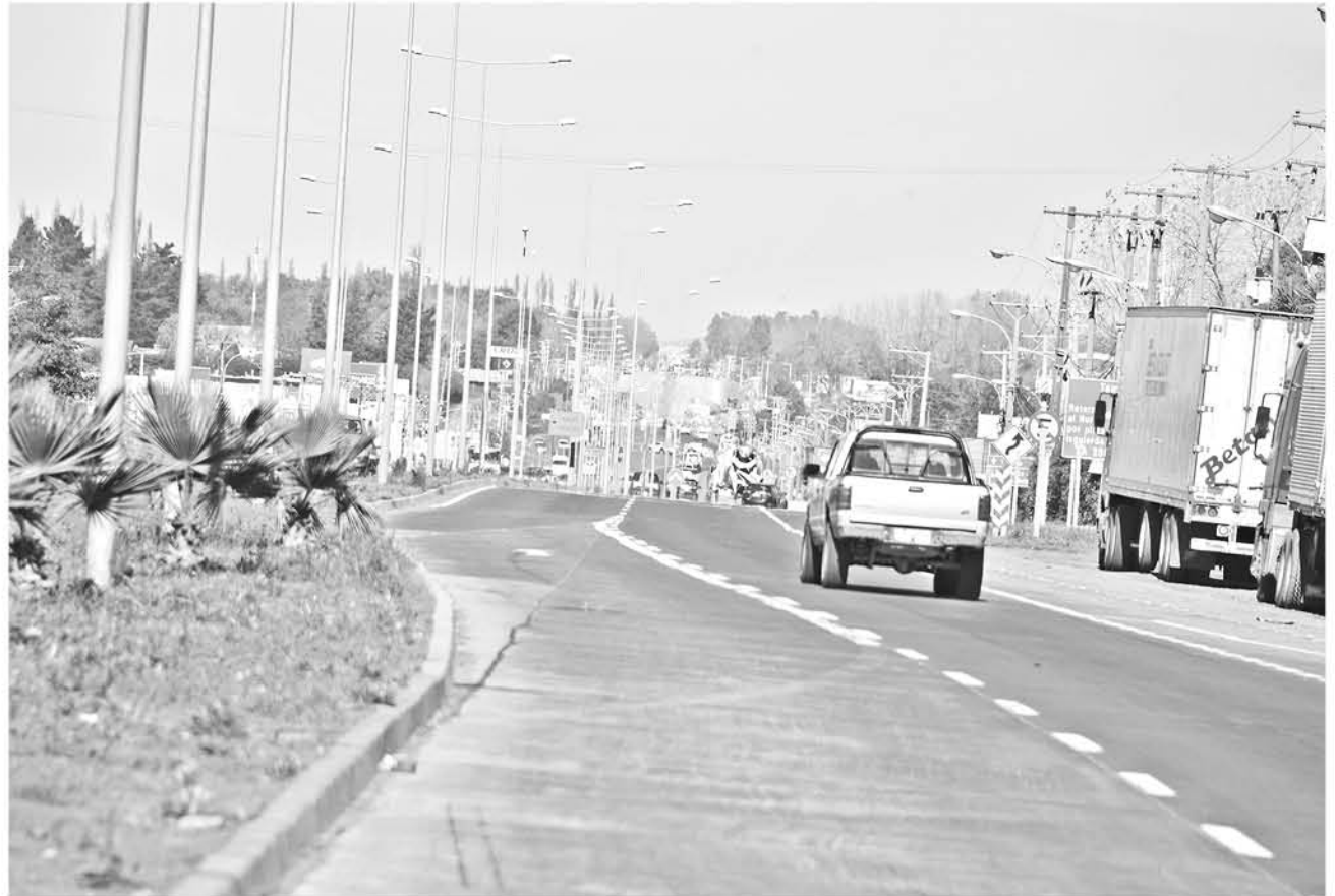
EL SEREMI de Transportes y Telecomunicaciones en Biobío, recalzó que la gestión para el cambio de velocidad es de única responsabilidad de quién tenga la tutela de la ruta.

A lo que agregó que esto es en base a un minucioso y