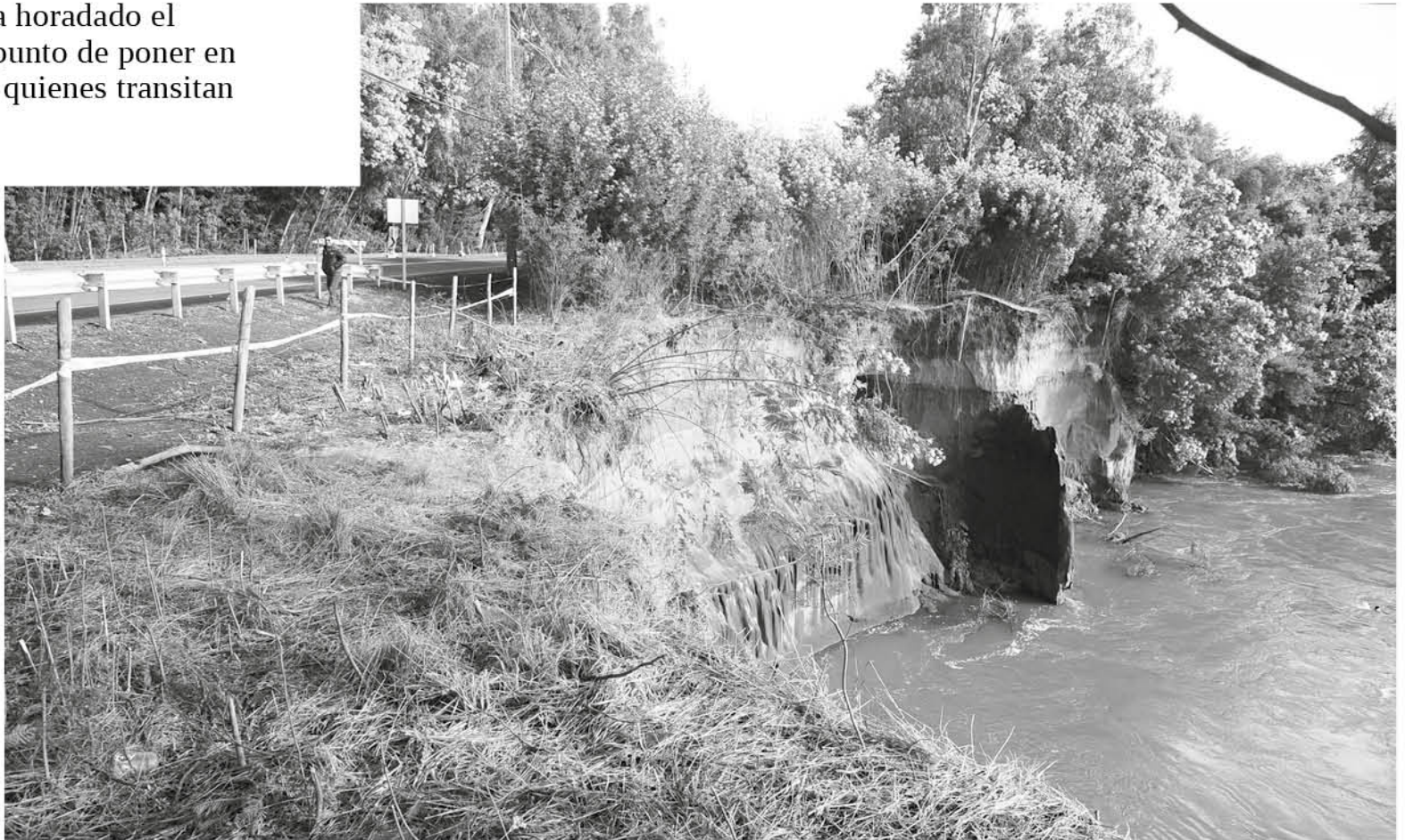
EL DIRECTOR PROVINCIAL de Vialidad explicó que la solución pasa por enocar la orilla del río en este punto de la ruta Q-80.

“Ese vértice está generando un remolino y ese a su vez es el que está socavando el terreno. Lo que se tiene