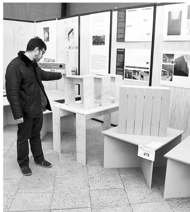
LA MUESTRA se extenderá hasta el domingo 12 de agosto.