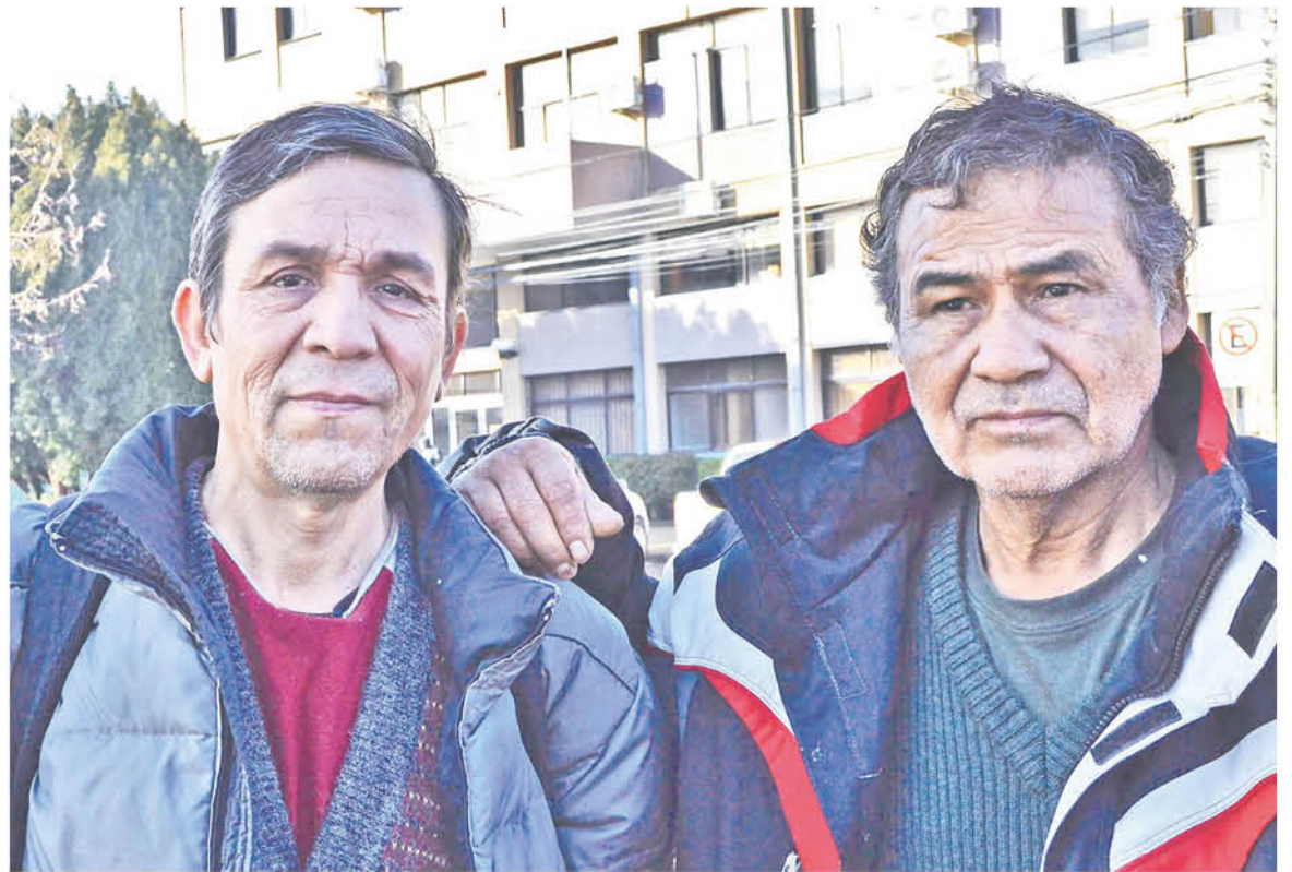
AMIGOS desde hace más de 20 años buscan angustiosamente que alguien les dé una oportunidad para arrendar una casita o un sitio.

Se sienten muy agradecidos de todos aquellos que los han ayudados "hay gente que nos ha tendido la mano, sólo nos falta encontrar un