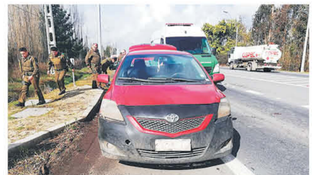
EL HECHO FUE ALERTADO por medio de un llamado a la central de emergencias de Carabineros.

Por esto, los oficiales manifestaron que los involucrados en este delito durante el viernes pasaron a detención, para ser formalizados por el robo en lugar habitado.