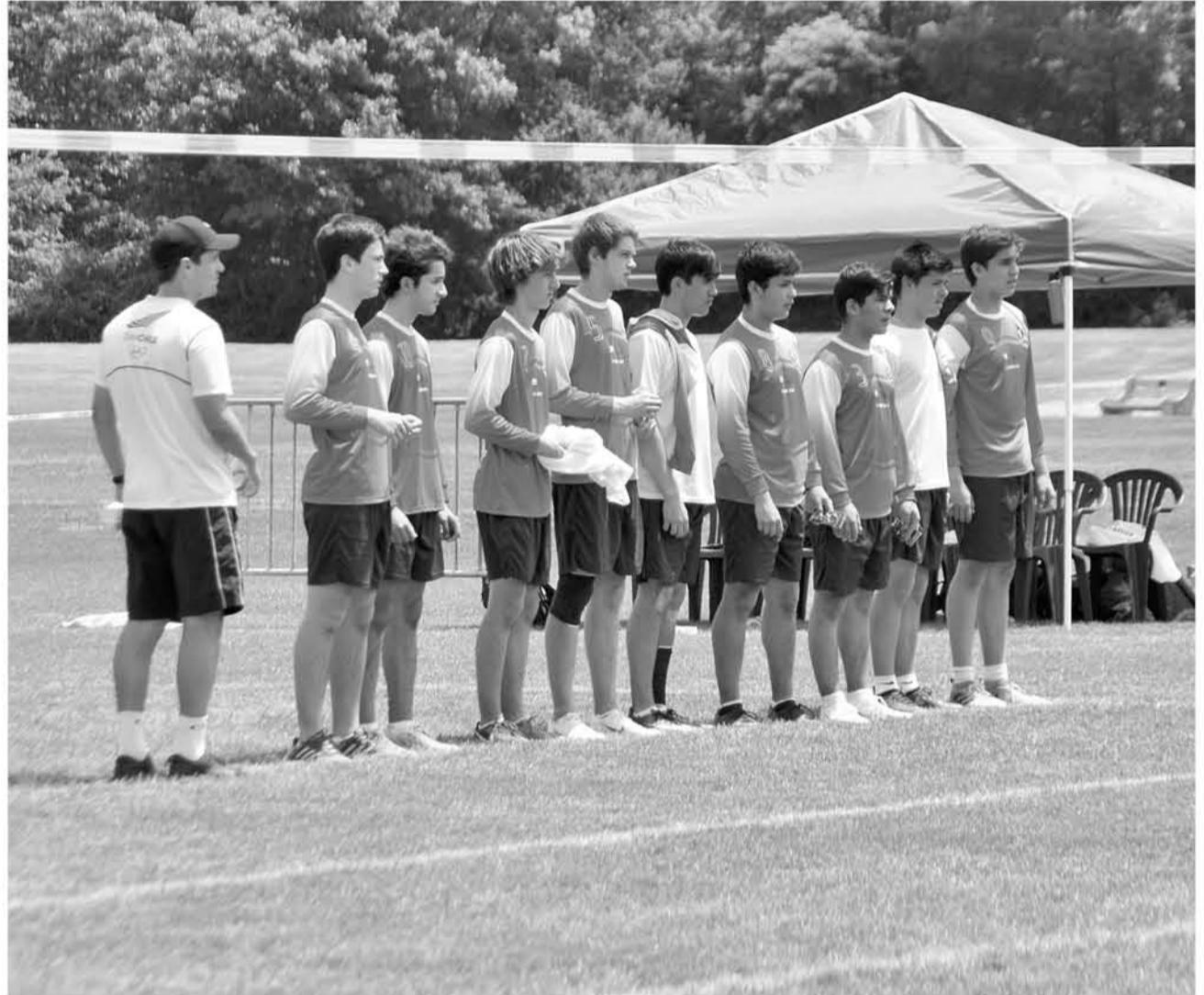
LOS JÓVENES ESPERAN que este deporte se haga conocido para que nazcan nuevos exponentes en la disciplina.