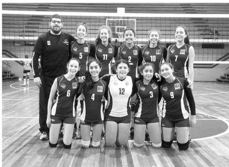
LA DELEGACIÓN ANGELINA tiene grandes probabilidades de obtener buenos resultados en la convocatoria.