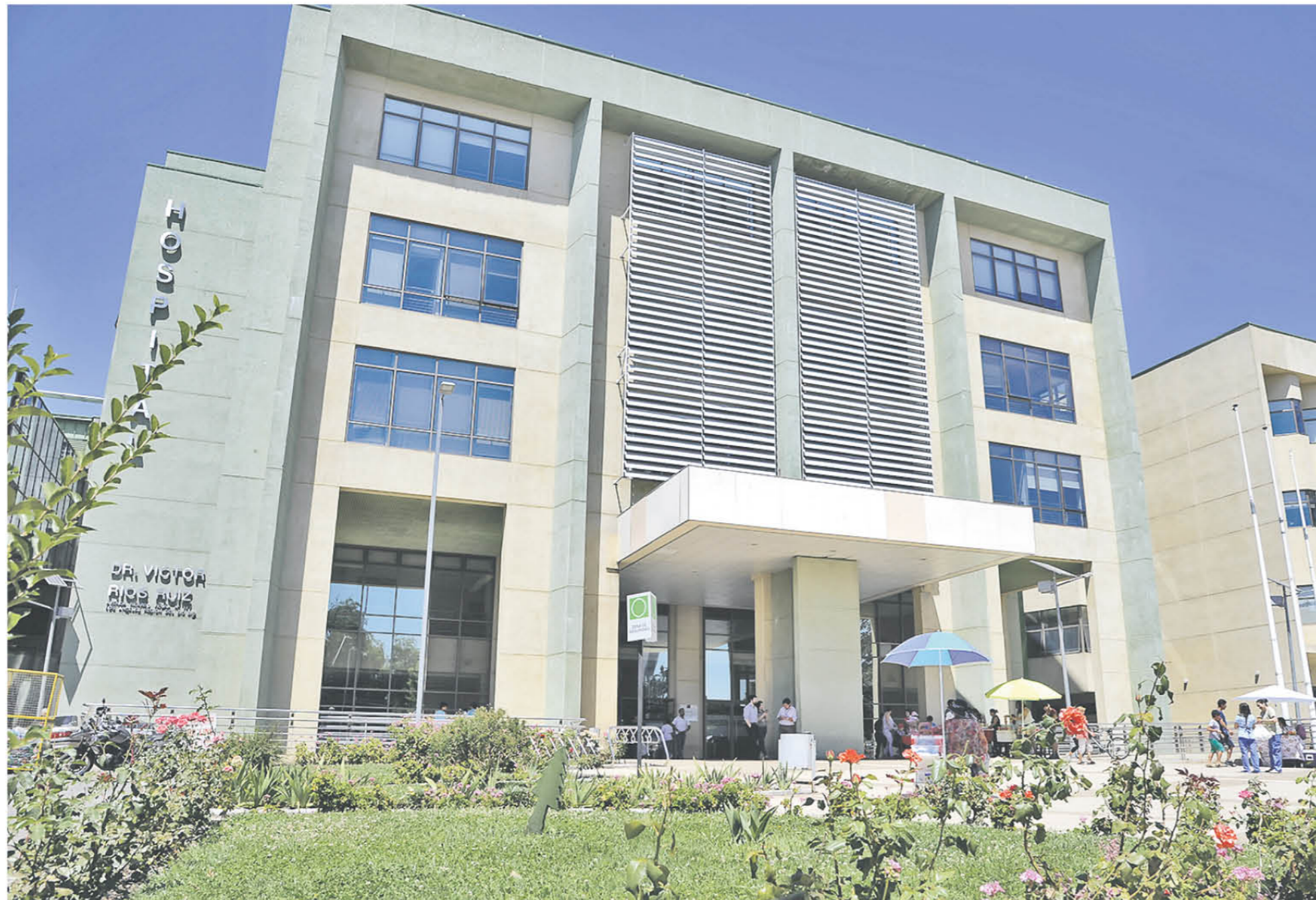
MUCHOS USUARIOS DENUNCIAN que los encargados de entregar medicamentos desempeñan pésimamente su trabajo.

COMPLEJO ASISTENCIAL DR. VÍCTOR RÍOS RUIZ