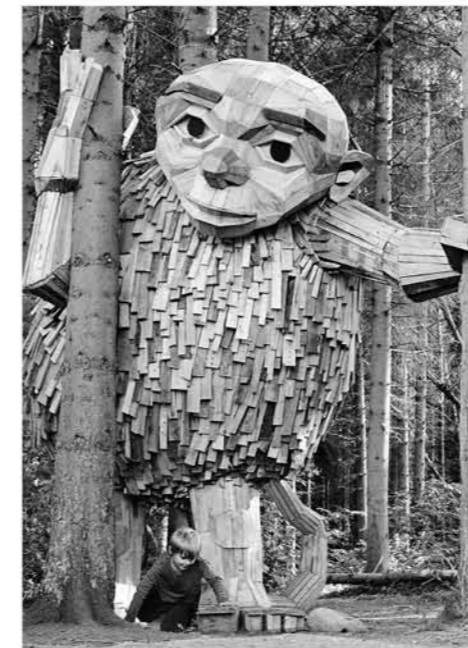
El gigante Little Tilde (Pequeño Tilde) en Vallensbæk (Copenhague, Dinamarca).Foto: Thomas Dambo

Para encontrar a los gigantes escondidos, los visitantes disponen de un mapa similar a los utilizados en el juego de la búsqueda del tesoro, con algunas pistas de donde están escondidos.