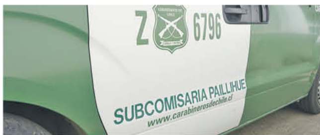
PERSONAL DE LA SUBCOMISARÍA Paillihue trabajó en este procedimiento de detención.

Tras una persecución, Carabineros de la Subcomisaría de Paillihue logró dar con los antisociales.