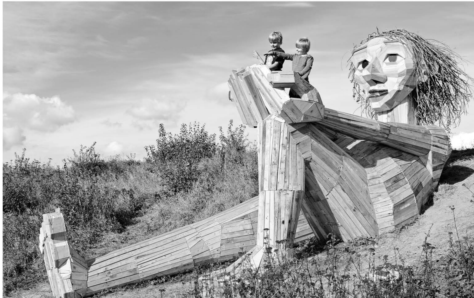
El gigante 'Hill top Trine' (Trine en la cima de la colina), en Hvidovre (Copenhague, Dinamarca).Foto: Thomas Dambo

El artista danés Thomas Dambo ha instalado varias esculturas de madera reciclada de gran tamaño en los espacios verdes de seis suburbios de Copenhague, para estimular la curiosidad y que, al encontrarlas, se experimente el impacto que ofrecen los lugares hermosos donde se encuentran.