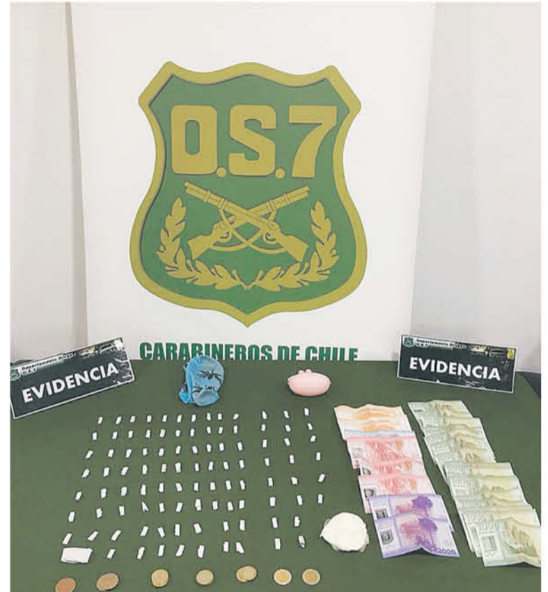
ESTOS DELINCUENTES fueron detenidos por medio de un trabajo investigativo por parte de los funcionarios de OS7.

Además de ello, sobre este nuevo trabajo investigativo el jefe de esta sección policial manifestó que "con estas detenciones se logra sacar de circulación dos microtraficantes de la villa Padre Hurtado de las comunas de Los Ángeles, buscando generar mayor sensación de seguridad para los residentes de esta población y personas que transitan en este sector".