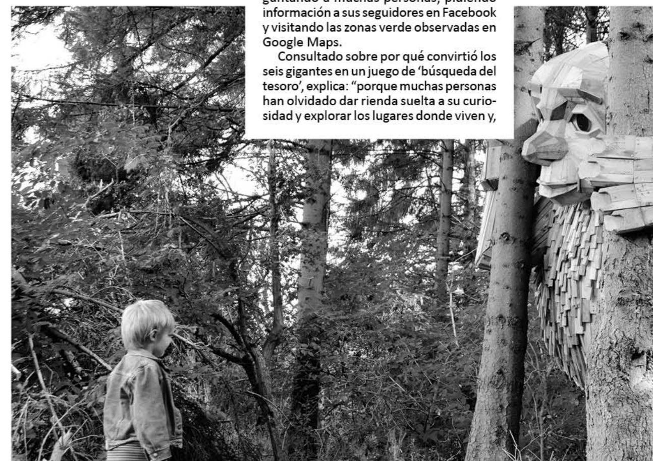
El gigante Little Tilde (Pequeño Tilde) en Vallensbæk (Copenhague, Dinamarca).

Además de dar a la gente una buena experiencia y recordarles que explorar es divertido, Dambo espera que los gigantes les hagan conscientes de que su basura podría ser útil para otras personas antes de desecharla.