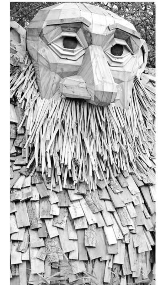
El gigante de madera 'Teddy Friendly' (Amigable Teddy) en Høje Taastrup (Copenhague, Dinamarca).Foto: Thomas Dambo

Estas obras, llevan los nombres de algunos de los voluntarios que las construyeron junto con Dambo, y cada una de ellas requirió dos semanas de preparación en el taller y una semana para ser construida en el lugar. Pueden visitarse en un día, viajando en coche o bicicleta.