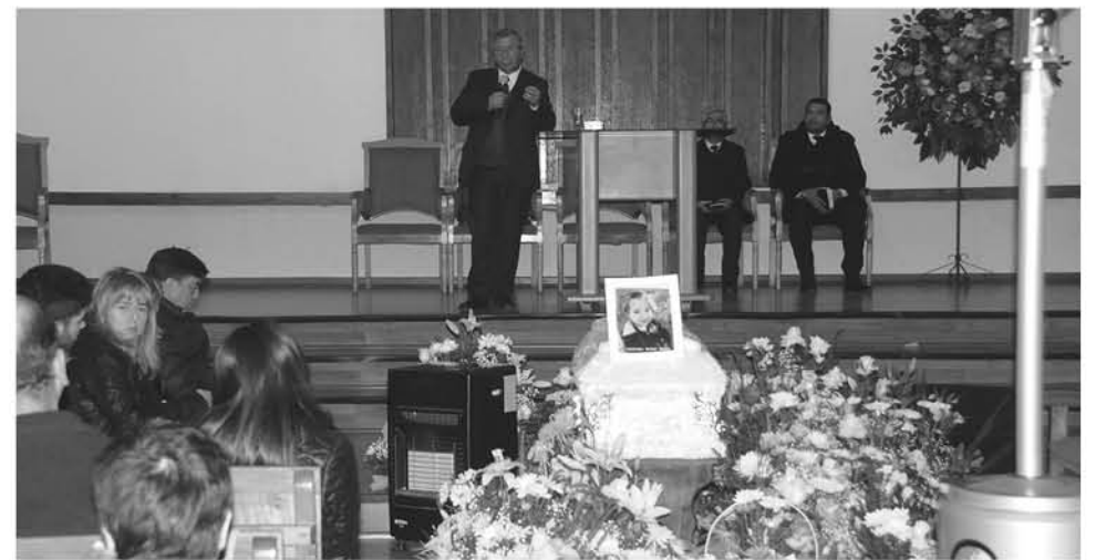
SU VELORIO SE REALIZÓ en la Iglesia Adventista de Los Ángeles.

MAÑÍOS, LLEUQUES, COIGÜES Y ROBLES SON ESPECIES AFECTADAS