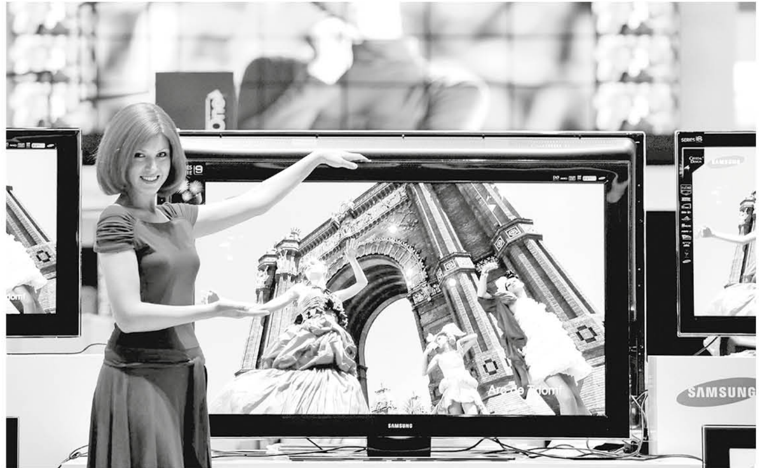
Una joven ante una pantalla plana de televisión en el stand de Samsung en la Feria Internacional de Electrónica 2008 (IFA) de Berlín (Alemania).

Por otro lado, ver las cadenas tradicionales de manera legal a través de la conexión a internet es posible gracias a plataformas gratuitas que permiten acceder, por ejemplo, a partidos de fútbol. Por no hablar del auge de plataformas de pago que permiten dis-