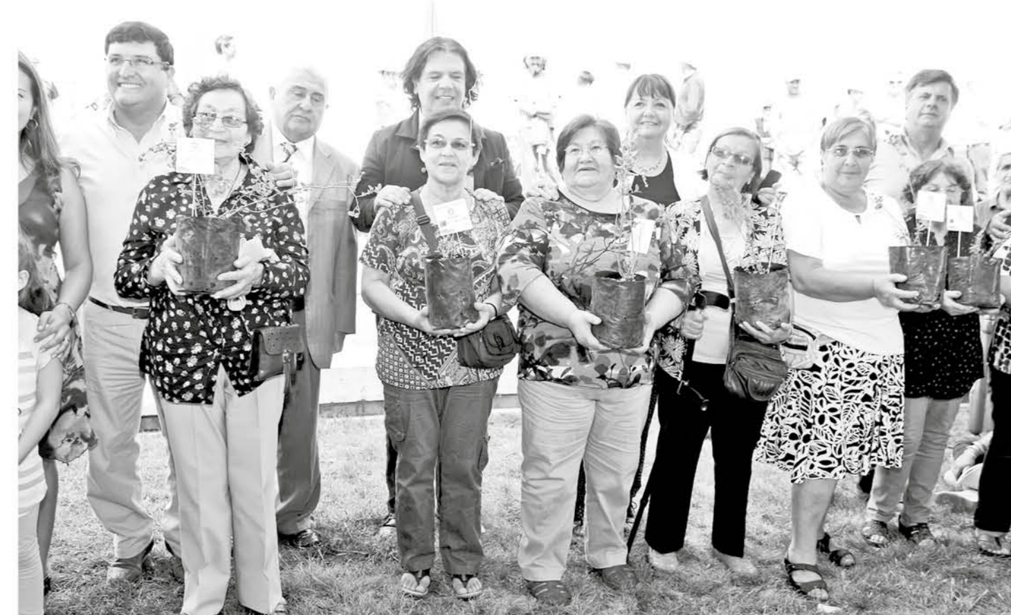
EL EMPRESARIO ASEGURA SE DEBE DAR GRAN PRIORIDAD A PROMOVER LA IDENTIDAD AGRÍCOLA ENTRE LA COMUNIDAD.