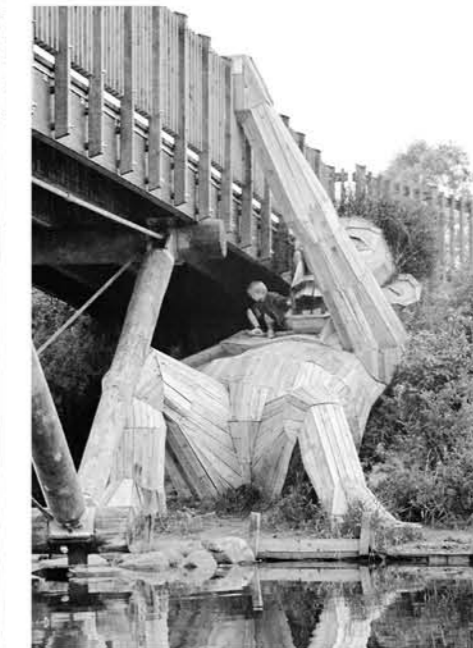
El gigante 'Oscar under the bridge' (Oscar debajo del puente) en Ishøj (Copenhague, Dinamarca).Foto: Thomas Dambo