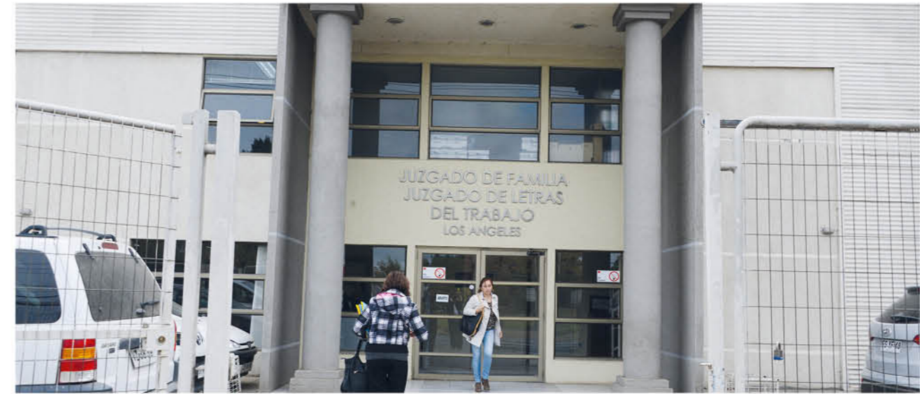
ACTUALMENTE EL TRIBUNAL de Familia de Los Ángeles cuenta con la participación de tres a cuatro jueces que participa de los cientos de cosos que enfrenta esta comuna.

audiencias de aquí”. ANTECEDENTES DE ESTE CENTRO DE ATENCIÓN Según continuó explicando la juez presidente del Tribunal de Familia de Los Ángeles, este Juzgado de Familia fue creado el año 2005 catalogado como un centro de tamaño menor, con una dotación de cuatro jueces encargados de atender sus distintas aulas, sin embargo el año 2008 a estas instalaciones se sumaron otros dos jueces para optimizar el funcionamiento. Pese a ello, según relatan estos profesionales encargados del área, una situación de colapso se produjo cuando restaron a su dotación un juez, quedando sólo cinco magistrados en ejercicio “sin perjuicio de lo anterior, en el año 2017 de acuerdo a una resolución de la Corte Suprema, se dispone que uno de estos magistrados debían ser trasladado hasta la ciudad de Concepción desde el mes de octubre de ese año”. A este número de funcionarios, en ejercicio se resta que en la actual situación esto afecta a los profesionales por eventuales ausencias no programadas como lo son las licencias médicas, provoca una carga laboral, lo que se suma que en este