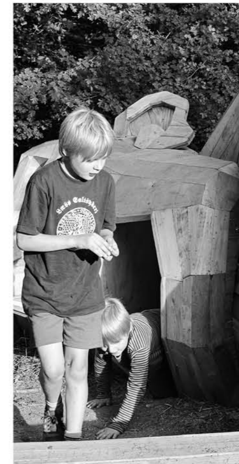
El gigante 'Sleeping Louis' (Durmiente Luis) en Rødovre (Copenhague, Dinamarca).