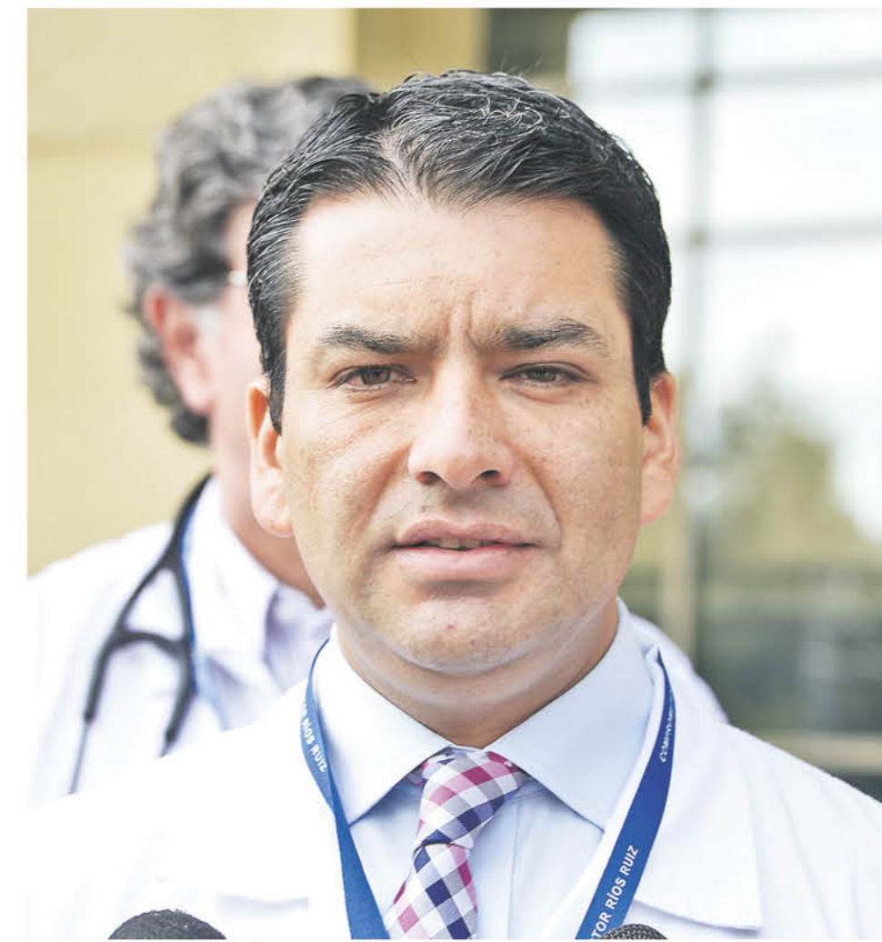
EL DIRECTOR ASEGURÓ que cuando la gente denuncia una mala conducta, ellos evalúan inmediatamente al funcionario.

algunas ocasiones, no hay que generalizar, pero yo he visto la mala disposición de los médicos" afirmó. "Hay gente que se tiene que atender obligatoriamente de forma particular, mi madre se puede operar gracias a sus hijos, pero hay gente que no tiene los recursos, el servicio de salud no está funcionando, no podemos dejar a la gente en sus manos, porque terminará muriendo" puntualizó.