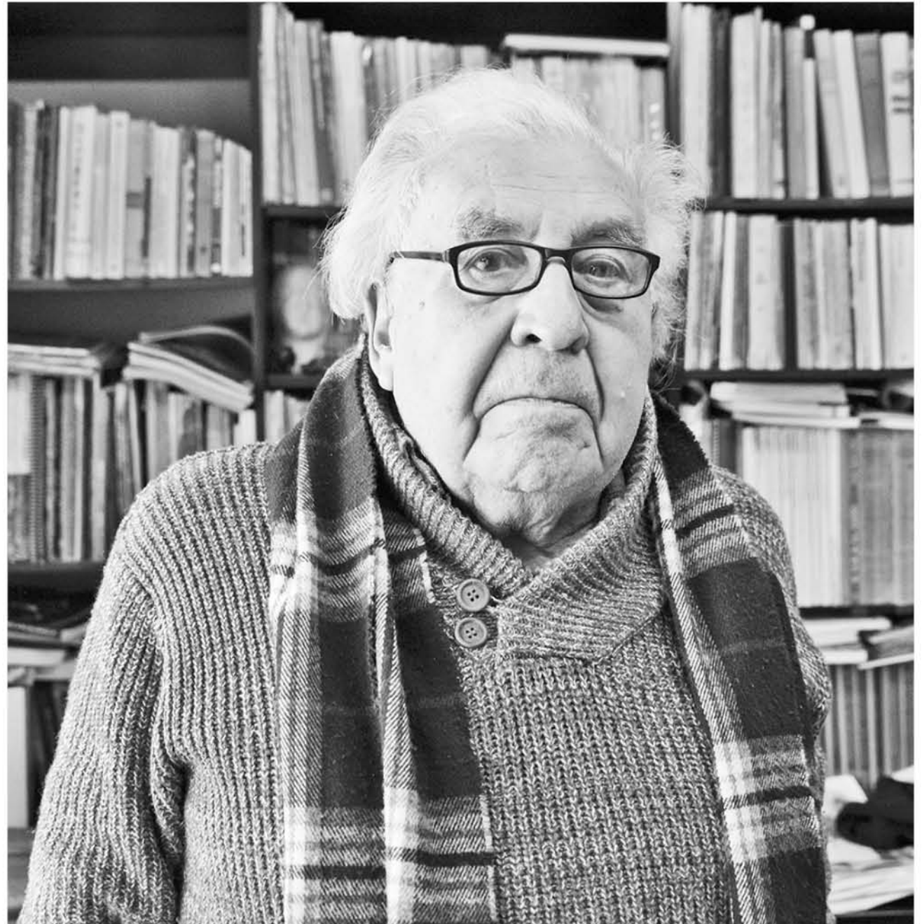
EL ARQUITECTO AFIRMÓ "un pueblo que no tienen historia no tiene pasado, no es nada".

También comentó que han destacado y salvaguardado todas las obras que vienen desde los mapuches, en especial los kuelles, por la estación de ferrocarriles en Santa Fe, donde los mapuches construyeron su monumento funerario a los grandes toqui y, marcaban su territorio.