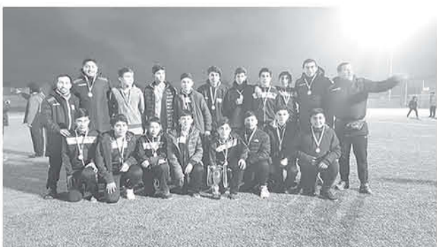
ESTA ESCUELA DE FÚTBOL comenzó a funcionar a mediados de abril y ya está consiguiendo buenos resultados deportivos.

En su primera competición de esta categoría, los jóvenes de la Escuela de Fútbol Municipal de Mulchén finalizaron invictos el torneo, donde enfrentaron a equipos provenientes de distintas zonas del país.