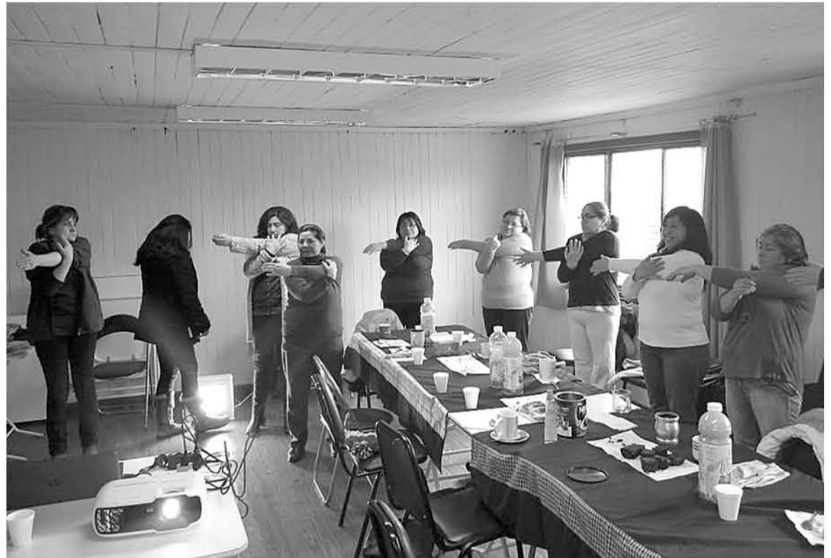
LAS PERSONAS CAPACITADAS fueron instruidas en materias tales como autocuidado y cuidados de la piel en pacientes severos.

Cabe recordar que los pacientes con dependencia severa son aquellos que, por su condición de salud, deben permanecer la mayor parte del tiempo en cama, sin poder movilizarse por sus propios medios y que necesitan apoyo permanente de sus cuidadoras —generalmente familiares— para satisfacer sus nece-