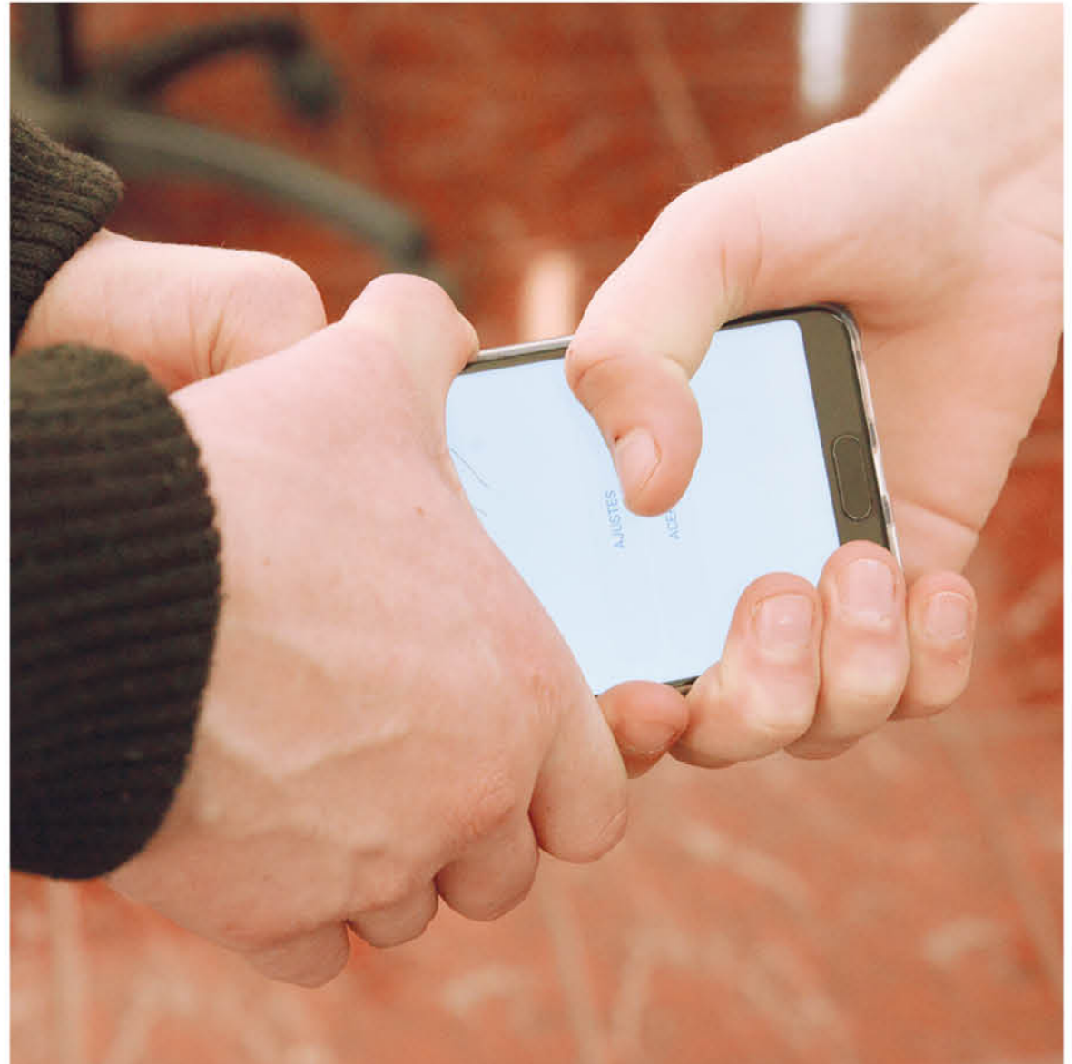
EL JOVEN AFECTADO se dirigió hasta Carabineros para relatar su vivencia y recuperar el objeto de robo, que se efectuó en la vía pública.

es bueno el auto resguardo, con el fin de evitar estos lamentables hechos, que muchas veces fundan el temor en la comunidad y sobre todo en los jóvenes.