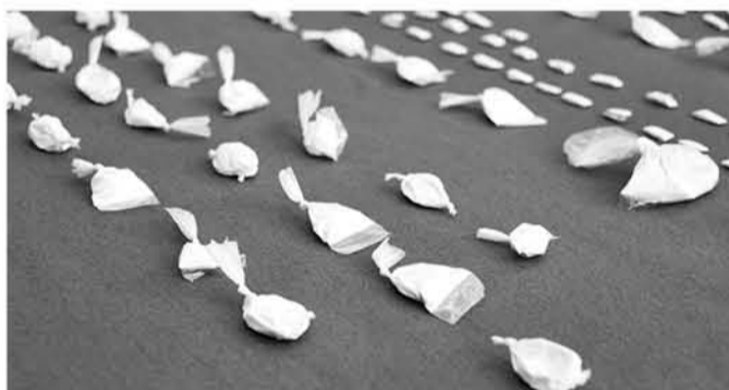
LOS TRABAJOS preventivos se enfocan en reducir el consumo y crear conciencia sobre el cuidado que éstas tienen en la sociedad.

El trabajo se enmarca en el contexto de educar sobre el consumo de sustancias y fácil acceso que estas tienen con la comunidad.