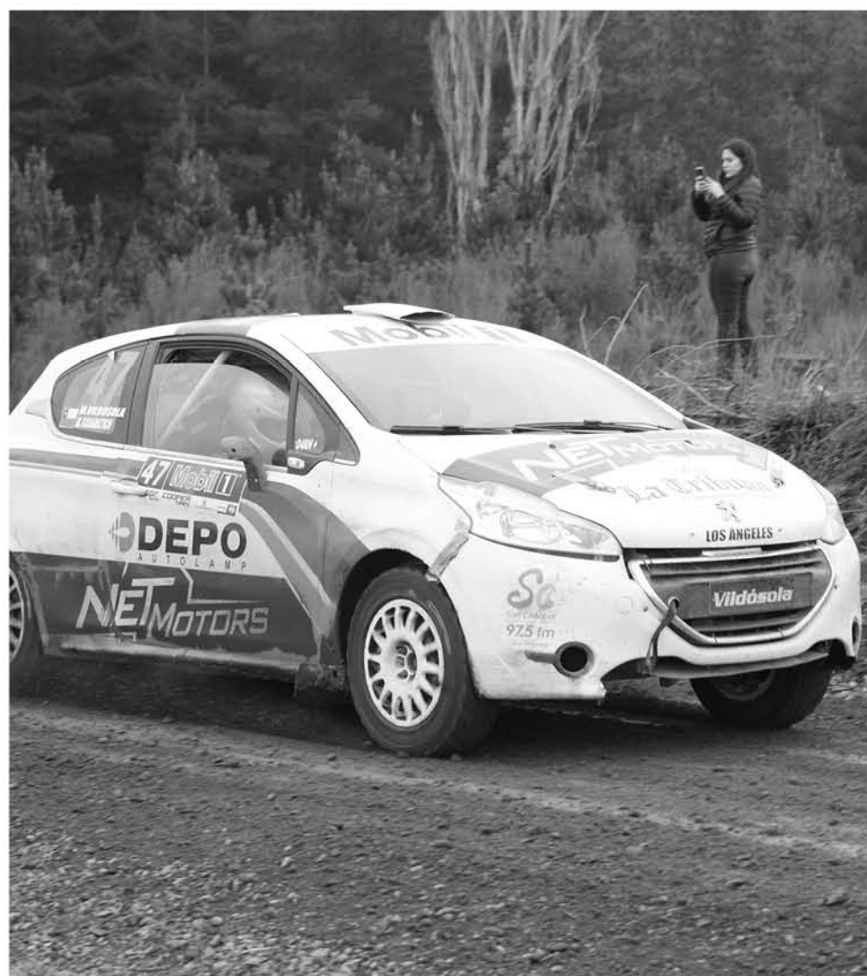
LAMENTABLEMENTE el piloto de NetMotors-Depo, Marcelo Vildósola, no participará en esta fecha.