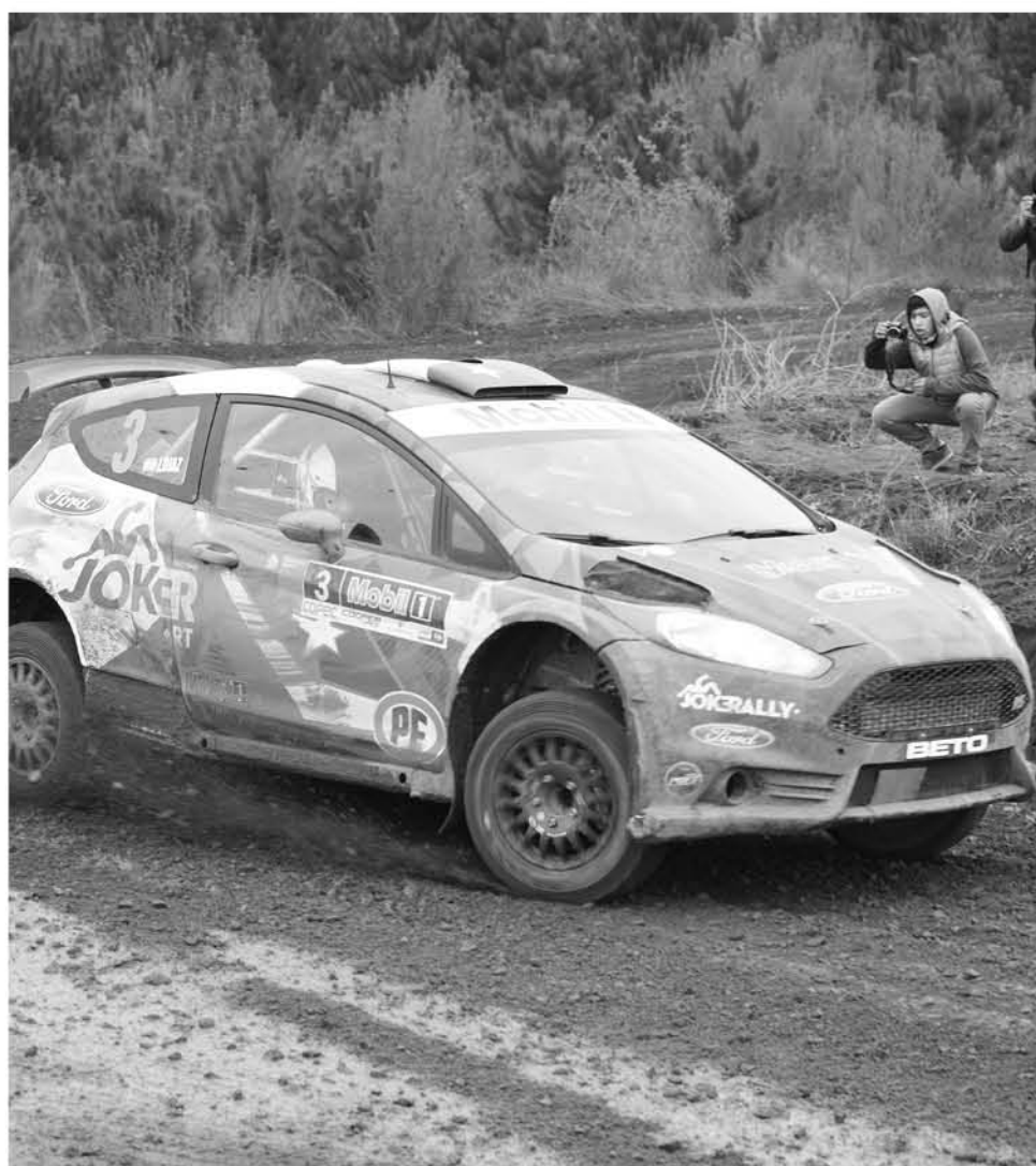
ESTA SERÁ UNA DE LAS FECHAS más atractivas de la competencia donde participarán los angelinos del Team Joker. (Foto de contexto)