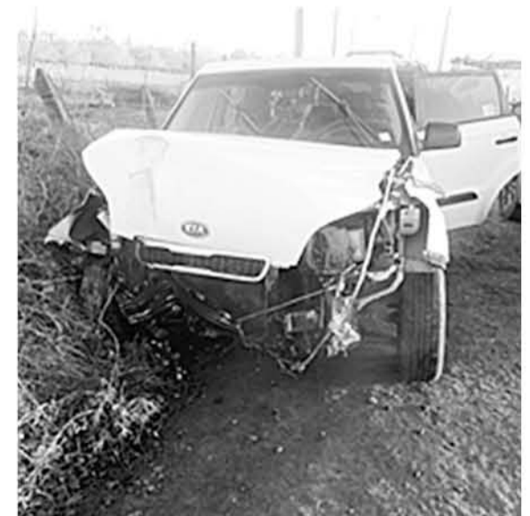
EL AUTO FUE ENCONTRADO la mañana del pasado martes por terceros.

minar además sobre este incidente, ya que el implicado tendría que responder por los daños producidos a la empresa de tendido eléctrico CGE, ya que provocó daños a la inmobiliaria de esta empresa.