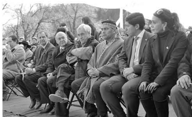
ESTE MARTES EL PRESIDENTE PIÑERA inauguró la escuela modular de Callaqui y el Cefsam de Ralco (Archivo).

“Considero también, que existe una real interpretación de las necesidades globales de la región al anunciar la construcción de nuevos hospitales, expansión del Biotrén y el anhelado proyecto habitacional para más de 1.600 familias en Lota los que se han mantenido en carpeta por años. En cinco meses, más que buenas noticias. Personalmente conozco también el interés real y la verdadera disposición por reactivar el aeropuerto María Dolores. Espero también sea noticia en una próxima visita”, agregó.