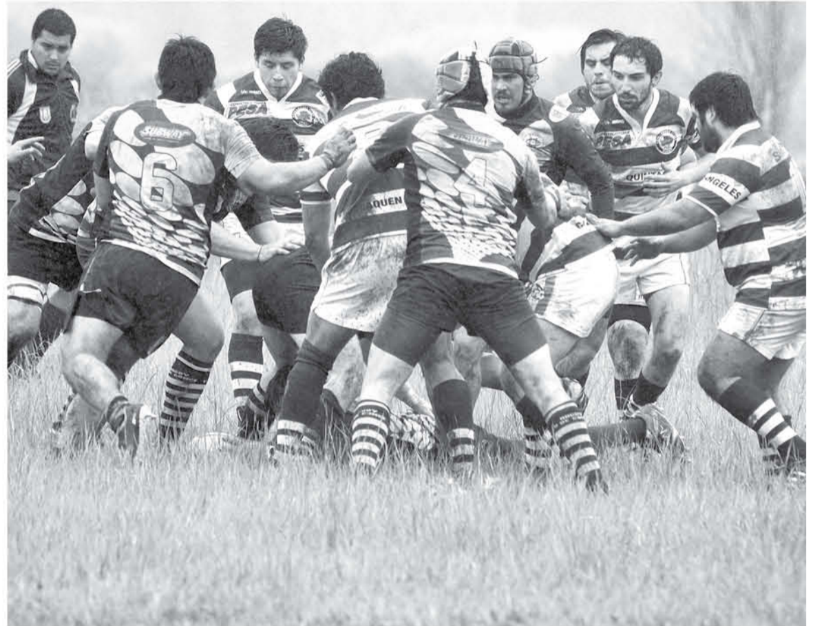
EL ENCUENTRO DEL FIN DE SEMANA frente a la Udec será uno de los más atractivos del campeonato.