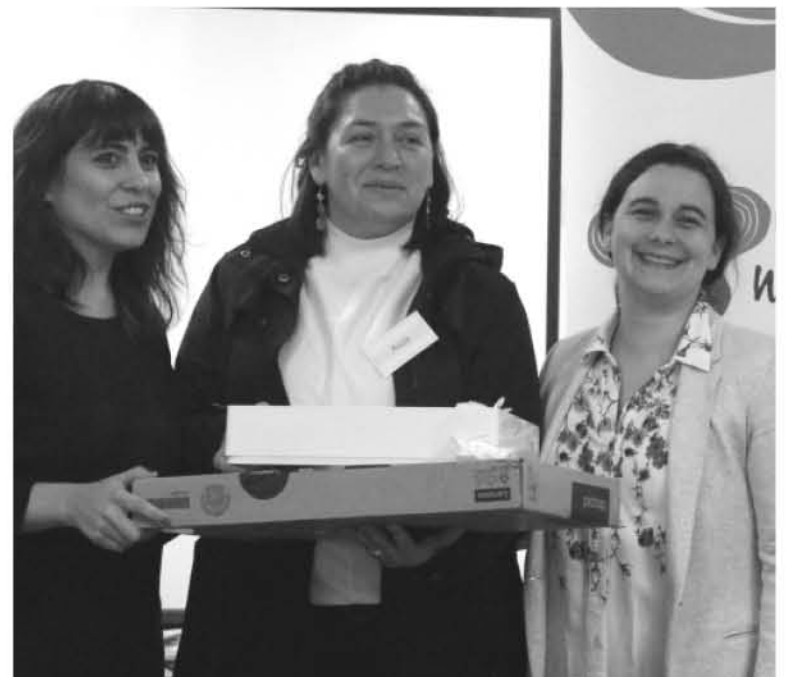
EL CONCURSO tuvo como ganadoras a cinco estudiantes, de tres regiones diferentes, entre ellas una angelina.