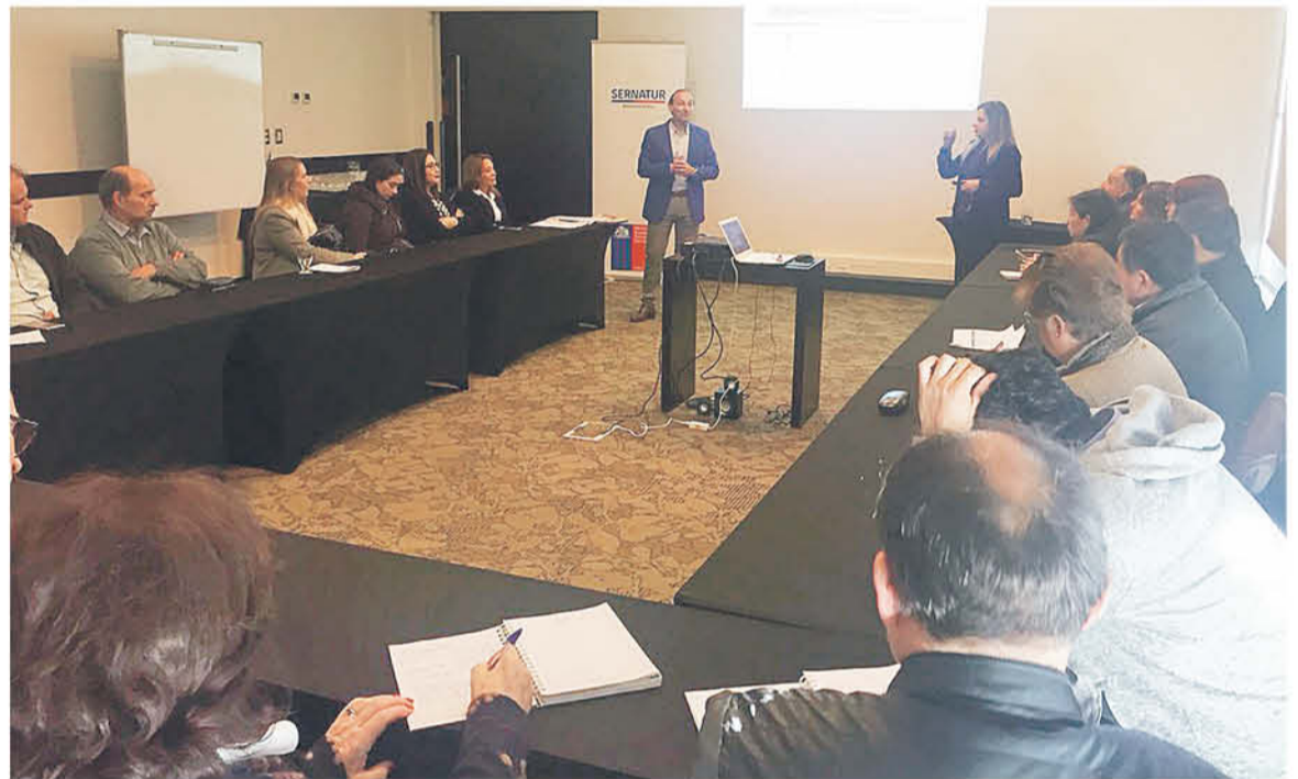
LOS TALLERES DICTADOS por expertos internacionales han generado bastante participación e interés por los empresarios del rubro turísticos en la provincia.