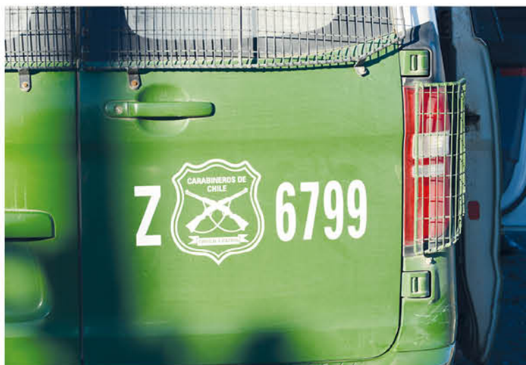
EL DETENIDO HABRÍA INGRESADO saltando una serie de muros y rejas que protegían estas inmediaciones.

Durante la media noche del pasado miércoles, Carabineros de Laja detuvo a un hombre cuando este se encontraba oculto en un mueble, luego de robar en dependencias de una constructora, en la comuna del papel.