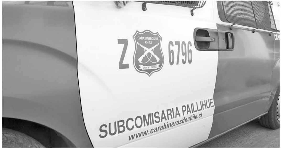
EL VEHÍCULO DECOMISADO mantenía antecedente por robo desde Talca.

En el lugar, el implicado en este delito de compra ilegal de vehículos según manifestó a los oficiales, el realizó esta compra por medio de