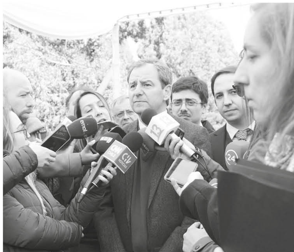
SOLICITADO POR LOS MEDIOS DE PRENSA locales y nacionales estuvo el ministro Varela tras su paso por la zona este martes.

con esto a revisar el sitio web dispuesto para el efecto: www.sistemadadmisionescolar.cl