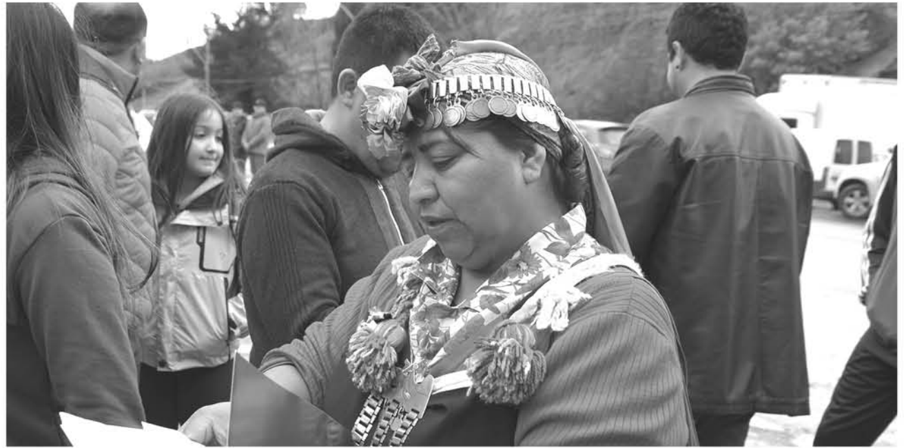
DENTRO DE SUS PETICIONES destaca la preocupación por la alta tasa de alcoholismo que existe en Alto Biobío, y que conlleva una serie de conflictos en la comunidad.

"Cada Gobierno de turno llega acá con diferentes mandatos y, muchas veces, la mayor parte, a nosotros no nos toman en cuenta. Necesitamos soluciones de corto, mediano y largo plazo, tiene que ser de comunidad a alto