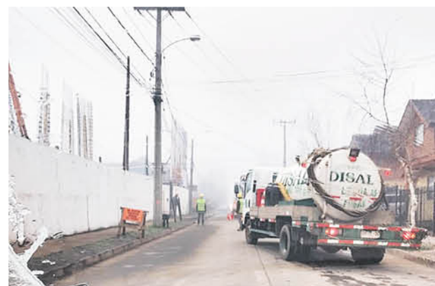
UNA SERIE de documentos formales son los que se han presentado hasta la fecha para que la empresa en cuestión responda por las molestias que se producen en este sector.