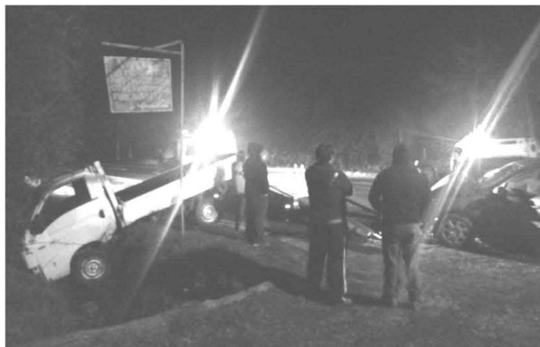
LOS OCUPANTES DE AMBOS VEHÍCULOS fueron trasladados hasta el hospital base de Los Ángeles para constatar lesiones.

Ante este hecho, vecinos del sector acusan falta de precaución por parte de los conductores que transitan en este lugar a altas velocidades.