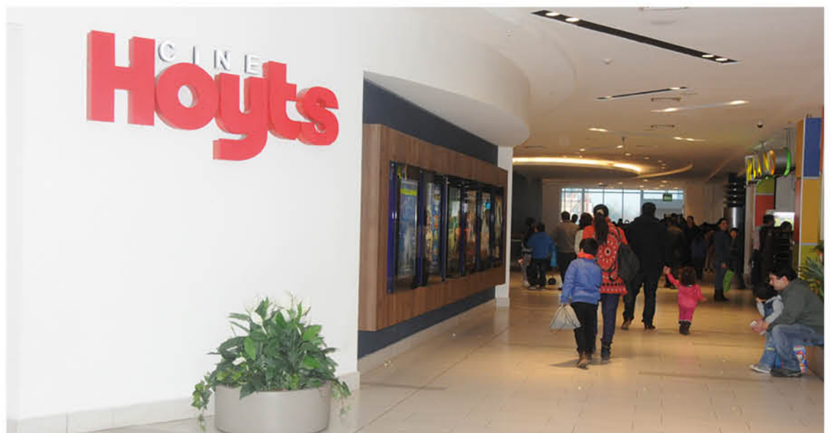
ESTE SOLITARIO DELINCUENTE ingreso a este centro comercial como cualquier otro trabajador hasta llegar a la caja fuerte de esta sucursal.