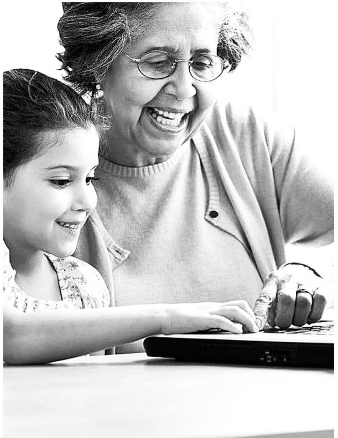
CADA VEZ AUMENTA el número de adultos mayores que se incorpora al uso de las nuevas tecnologías.

Para eso, debes enseñarle que presten mucha atención a los enlaces de cualquier web en la que le pidan datos personales. Asimismo, que busquen herramientas de seguridad que ofrezcan protección de phishing scams y softwares malignos, como por ejemplo, SmartScreen, el cual analiza las páginas y determina si pueden ser sospechosas. Lo mejor de todo es, que en el caso de que lo sean, tu abuelita recibirá una