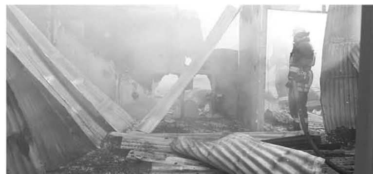
SEGÚN INDICÓ BOMBEROS, los actuales índices de incendios vividos en la provincia apuntan a un aumento anual de estos siniestros.

“Siempre que se manipula implementos que utilizan combustible, es fundamental comenzar su uso en el exterior, ya que son altamente peligrosos en un inicio y, en los casos de combustibles, siempre hay que tener en cuenta que se corre un doble riesgo, por lo que debe existir responsabilidad”, puntualizó el comandante sobre estos implementos que, si bien aportan a capear las bajas temperaturas, significan un riesgo para la vida de las personas.