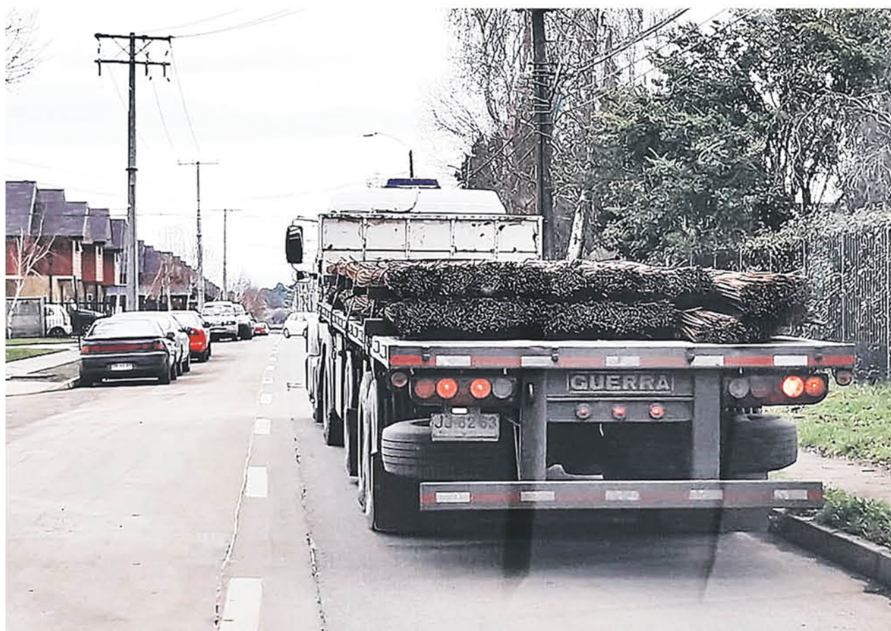
LOS MISMOS VECINOS de este sector han realizado registros fotográficos de la importante cantidad de camiones que a diario se han tomado los espacios.

Esto fundamentado en los problemas que radican prin-