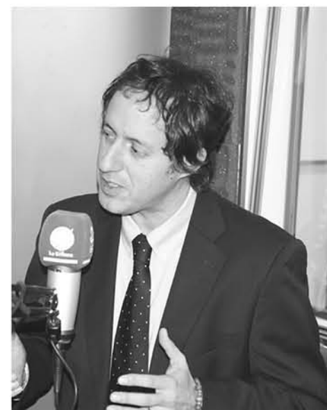
Alejandro Navarro, senador por la Circunscripción XII Biobío Costa.

"Yo creo que todo ha sido muy bueno, hemos estado impulsando las políticas del gobierno del Presidente Piñera".