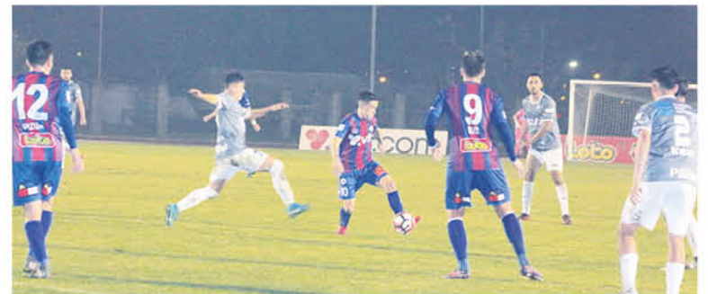
EL ENCUENTRO estuvo marcado por complejas jugadas entre ambos equipos, quienes sumaron puntos a sus tablas (Foto de contexto)