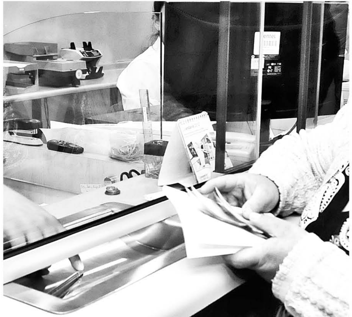
EL NUEVO MONTO de la Pensión Básica Solidaria es de $107.304.

De las cuales, 21 mil 184 personas reciben beneficios del Pilar Solidario del Sistema de Pensiones Solidarias, de las cuales; 13.534 recibe una Pensión Básica Solidaria de Vejez, y 7.650, una Pensión Básica Solidaria de Invalidez.