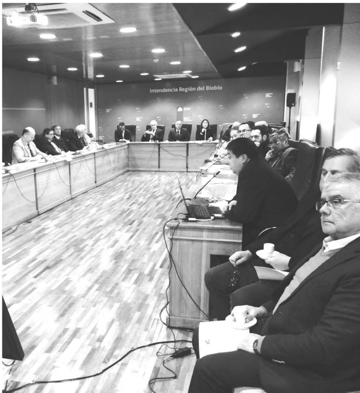
ADEMÁS, se dimensionó los impactos para la región del Biobío que registra el Anteproyecto Regional de Inversiones, ARI, como también la cartera de proyectos priorizados.

Finalmente, Corbiobío informó que la defensa de los presupuestos regionales proseguirá en el Congreso Nacional, en un trabajo conjunto con la comisión de hacienda y la Bancada Regionalista de senadores y diputados.