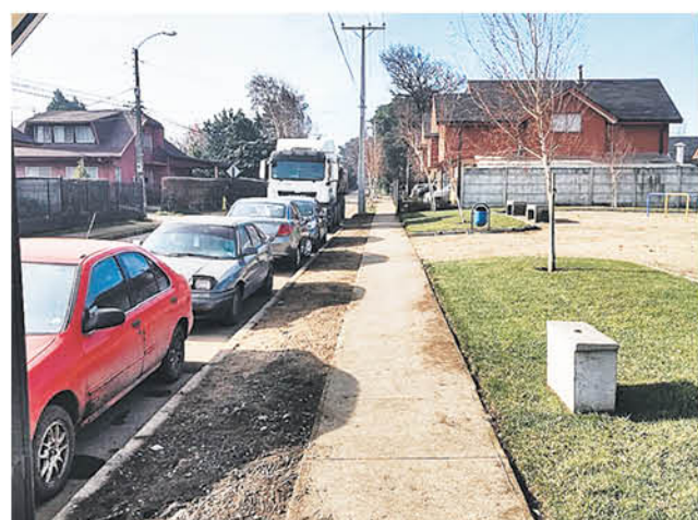
UNO DE LOS PROBLEMAS que se observa en este lugar, además, es el exceso de suciedad por los materiales que se presentan en este lugar.

En tanto, personal de la Inmobiliaria Eleva representantes de este proyecto fueron consultados por La Tribuna, quienes manifestaron sobre esto, que han tomado las medidas correspondientes a la hora de comenzar este proyecto y que este es un tema que se conversó previo a que se iniciaran las obras tanto con el municipio de Los Ángeles, Serviu con el fin de regularizar todos los procedimientos según Ley y de igual manera, se realizaron reuniones informativas con los vecinos interesados.