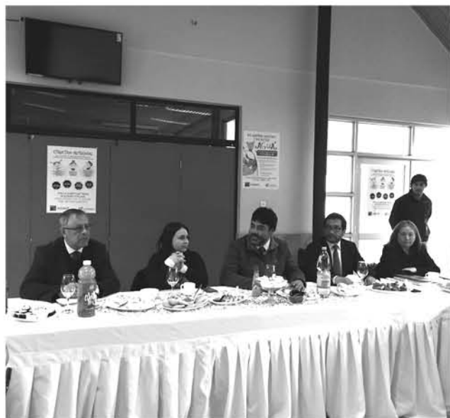
EL ENCUENTRO se llevó a cabo en la comuna de Antuco.

La tercera reunión de coordinación y trabajo es la que se realizó en Antuco con jefes comunales de Educación y que fue liderada y convocada por la Dirección Provincial de Educación Biobío.