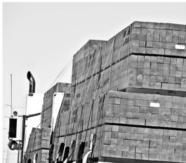
EL ENCUESTO contempla visitas de los empresarios chilenos a puntos de venta y distribución de la capital guatemalteca.

Serán parte de la delegación de nueve compañías de Biobío que, durante la próxima semana, participarán en un evento organizado por ProChile, que convocará a 200 potenciales compradores de esa zona.