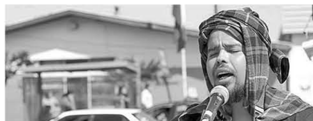
UN TRIBUTO al desaparecido artista lajino Le Nano, compositor, músico, dibujante, escritor y antipoeta.

Su pasión por el arte lo llevó a recorrer diferentes ciudades compartiendo con otros artistas y personas, un joven que impactó con su partida a tan temprana edad, 27 años, al igual que las grandes leyendas del rock. En el show se podrán escuchar canciones compuestas por Le Nano, al igual que parte de su prosa y