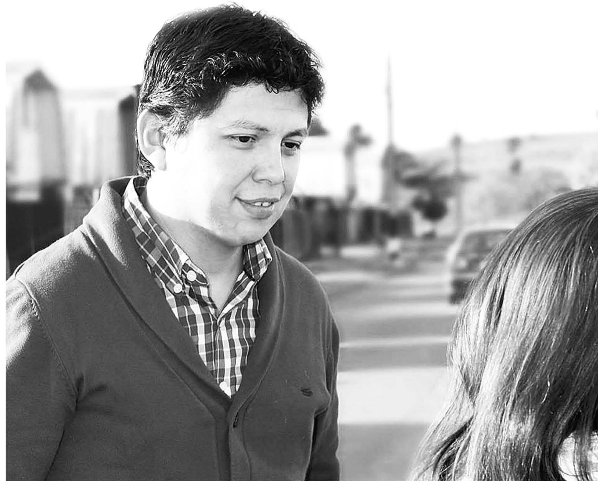
IGNACIO FICA asumirá oficialmente la Gobernación de Biobío este viernes 27 de junio a las 11:00 horas.

Asimismo, en Chile Vamos descartaron algún eventual conflicto por nepotismo, por tratarse del hijo del alcalde de Laja.