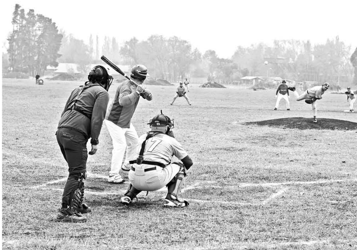
SI EL EQUIPO pierde un partido se les pondría muy difícil el panorama.

Por último el coach comentó que esperan en los siguientes encuentros establecer un equipo más competitivo para tratar de llegar a sus otros encuentros cómodamente, ya que