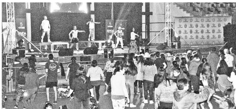
EN LA CONVOCATORIA seis instructores estarán acompañando a Bruno de Axé Bahía. (Foto de contexto)

Con la finalidad de motivar el ejercicio en estas vacaciones de invierno instructores de zumba fitness realizarán una clase junto a la reconocida figura brasileña.