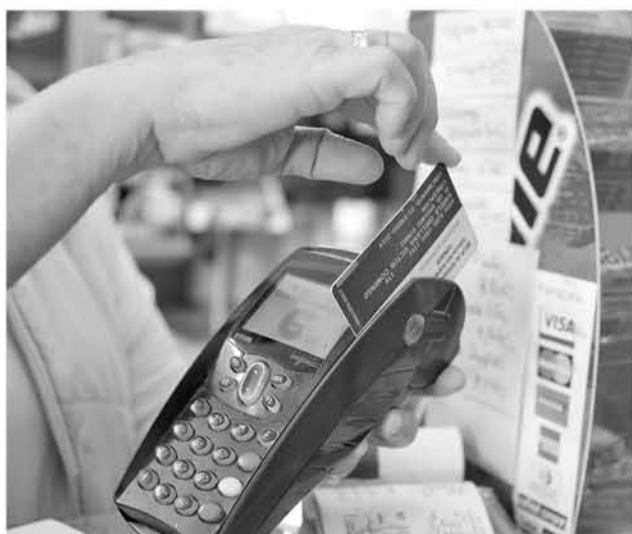
EL PARLAMENTARIO PPD sostuvo que "se requiere una persona que se dedique a hacer un diagnóstico a la actual situación en ciberseguridad (Foto de contexto).

Senador Harboe expuso la necesidad de implementar a la brevedad medidas de inversión, normativas e institucionalidad adecuada para hacer frente a este tipo de ataques. "Chile está en la mira del cibercrimen mundial", dijo.