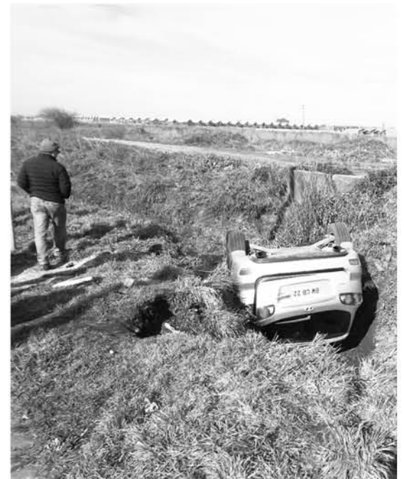
CARABINEROS investiga los motivos de este incidente.

Policía local, manifestando que la conductora se encontraba en normal estado de temperancia, por lo que ambas personas fueron despachadas a sus domicilios.