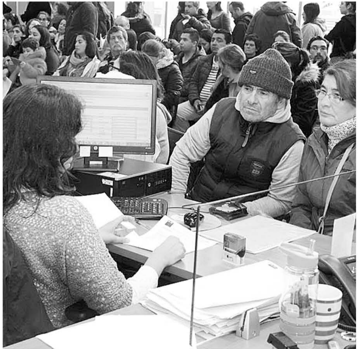
LOS INTERESADOS en postular deben tener más de 60 años.

tener más de 60 años al momento de postular, o cumplidos durante el 2018, pertenecer al 70% de la población nacional más vulnerable de acuerdo al Registro Social de Hogares, acreditar un ingreso mínimo equivalente a 3,8 UF, correspondiente a la pensión asis-