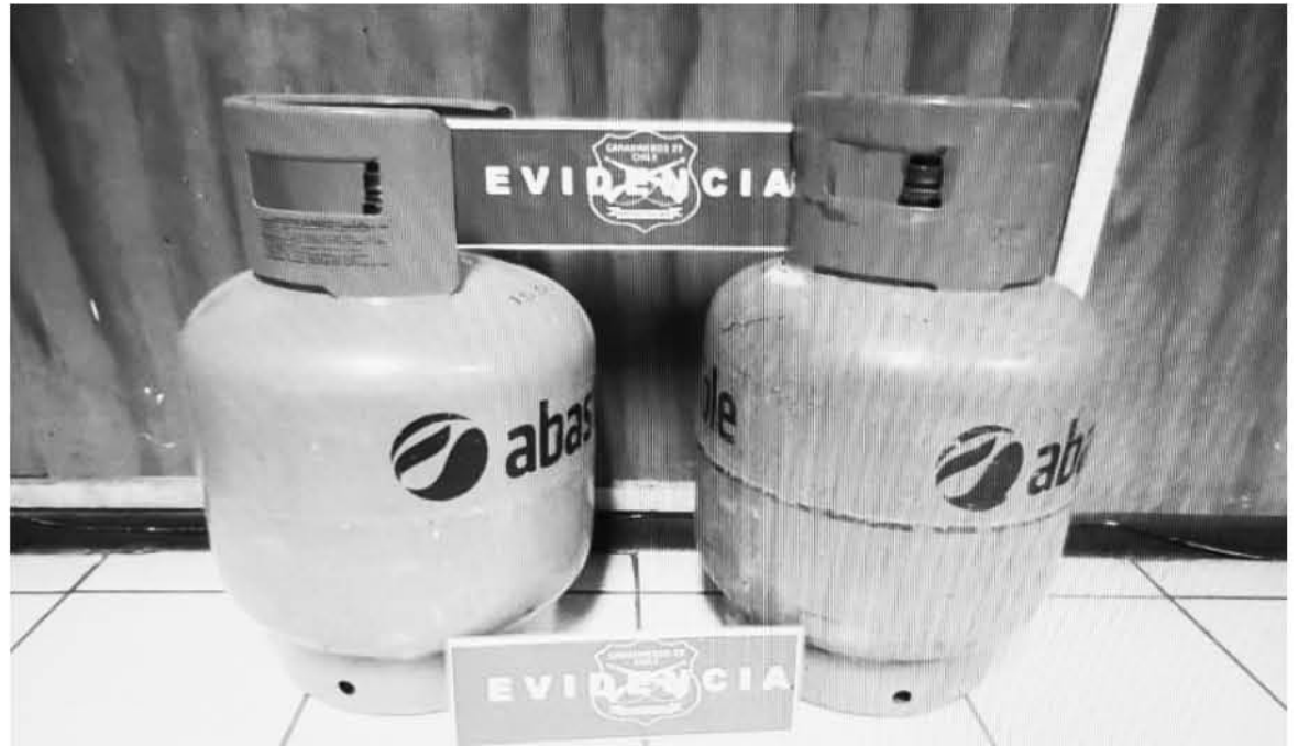
LOS MENORES fueron identificados por medio del sistema de cámaras y de seguridad.

Debido a esto, todos los involucrados pasaron a control de deten-