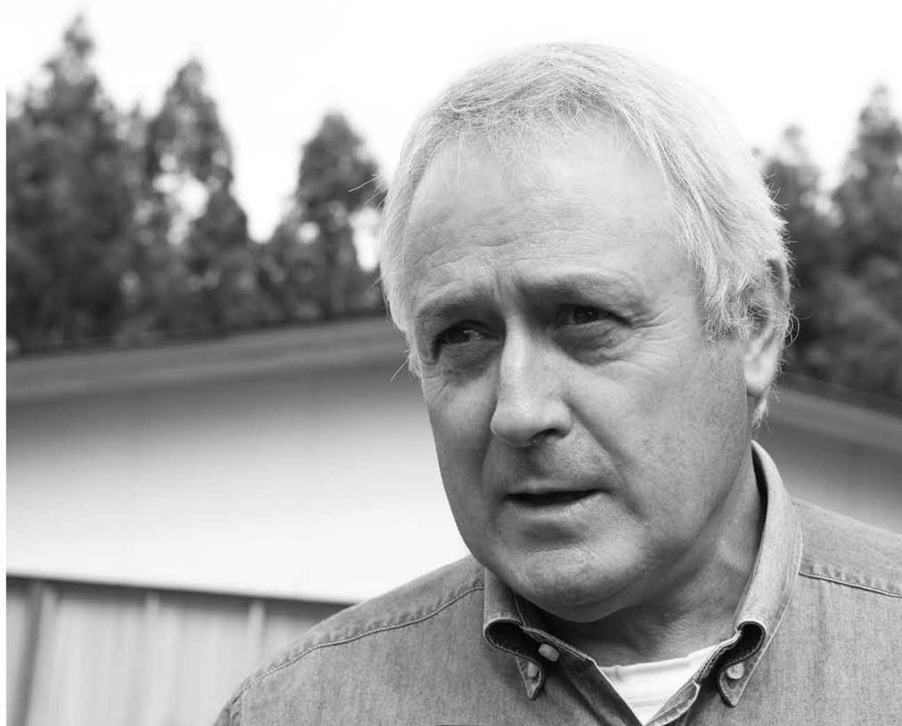
EL GREMIALISTA RECALCÓ que “la dinámica exportadora supera las contingencias, como es en este caso la llamada ‘guerra comercial’”.

Adicionalmente, esta guerra comercial ha generado daños colaterales, como lo que ocurre en India con las nueces, que pasaron de tener un arancel de 30% a uno de 100%, afectando fuertemente la entrada de nueces chilenas a ese país.