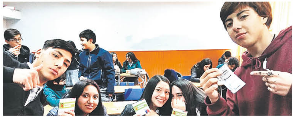
LOS ALUMNOS se manifiestan muy participativos a los talleres.

Durante las actividades, en las que se enfatiza en la responsabilidad que los jóvenes deben tener y se coloca a la afectividad como el elemento central que debe guiar cualquier relación de pareja, los participantes aprenden sobre la correcta utilización de métodos anti-