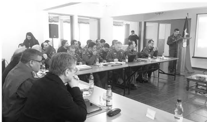
EN ESTA SESIÓN participaron diferentes autoridades locales, para conocer los índices delictuales en la provincia.

El objetivo de esta sesión se basó en analizar aplicación y futuros proyectos para mejorar la seguridad ciudadana.