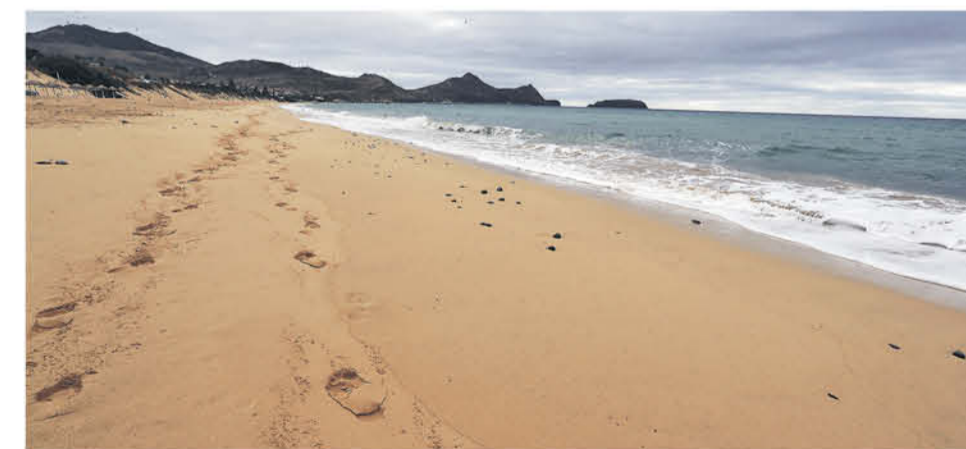
Vista general de la playa de Porto Santo, con el puerto al fondo.

Seis siglos después, Porto Santo sigue dependiendo en parte la navegación que forjó su identidad, pero dispone de dos rutas aéreas regulares que la comunican a diario sus dos ciudades de referencia: Lisboa, en la Península Ibérica, a donde vuela la portuguesa TAP, y Funchal, en Madeira, en un salto de apenas 20 minutos de duración que opera desde este verano la aerolínea canaria Binter.