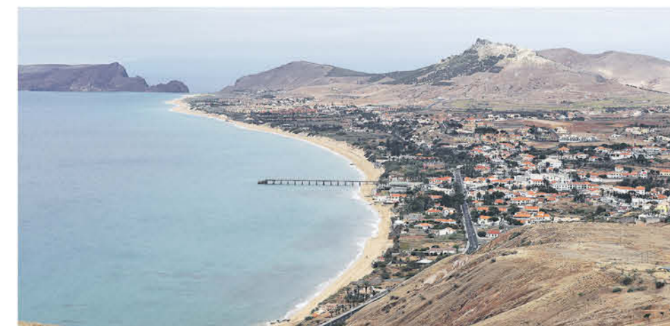
Vista de la costa sur de la isla de Porto Santo, su playa y la capital, Vila Baleira, desde el Miradouro da Portela.