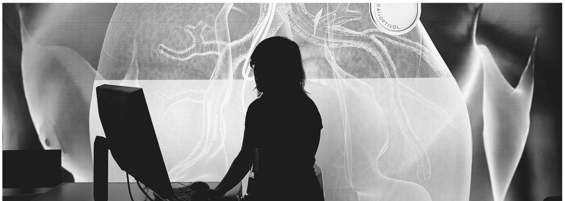
LA INCERTIDUMBRE Y EL TEMOR a que tu vida cambie para siempre por culpa de una enfermedad es la base del miedo al diagnóstico.