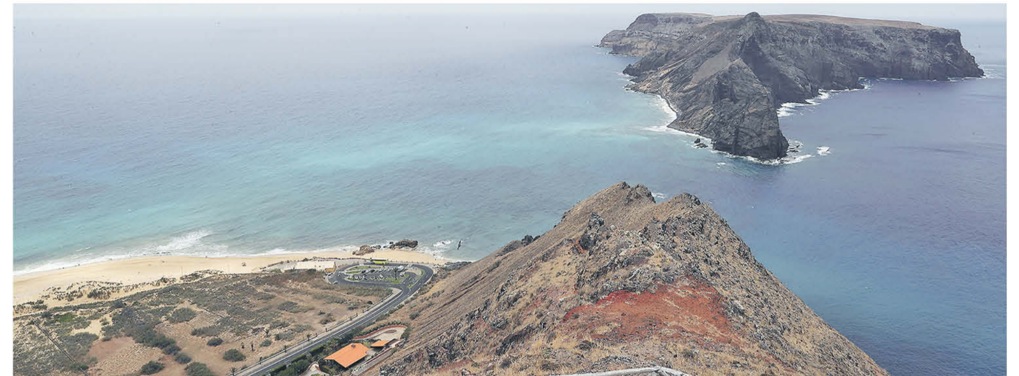
Islote de la Cal, vista desde el miradouro das Flores, en el extremo suroeste de Porto Santo.

Nada que ver con las cifras de Tenerife o Gran Canaria, islas que acogen durante casi todo el año 500.000 y 370.000 turistas mes tras mes, respectivamente; ni con Lanzarote y Fuerteventura, que rondan los 200.000 al mes; ni tampoco con la vecina Madeira, que moviliza unos 100.000. Ni siquiera se acerca Porto Santo en su mes más ajetreado a las cifras de algunas villas costeras del Cantábrico, en España, que en verano pasan de 10.000 a más de 100.000 habitantes.