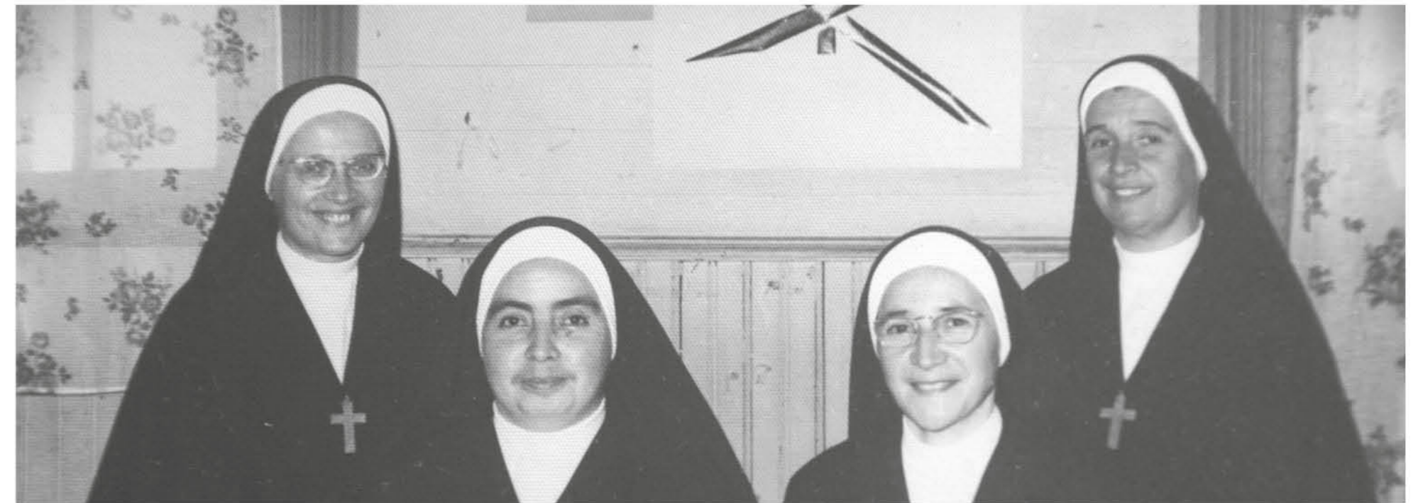
ELLA JUNTO A SUS HERMANAS se han dedicado a la educación profundizando la fe de todas las personas.