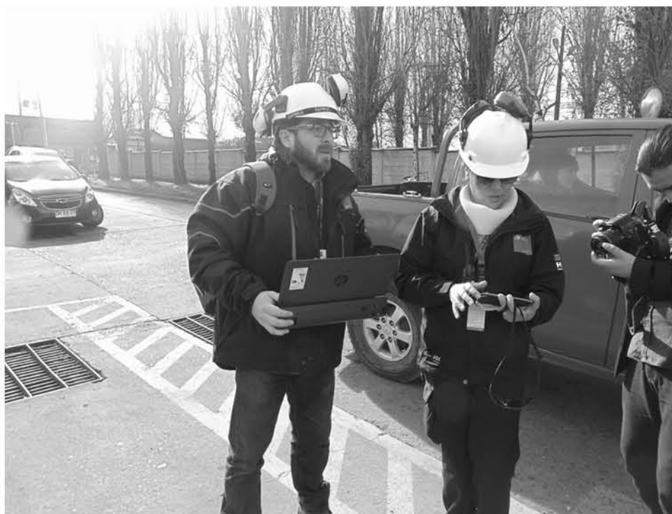
EL MAYOR NÚMERO DE FISCALIZACIONES fue en materia de ruido laboral.

Es por esto que, hasta junio, indicó la encargada de la unidad de Salud Ocupacional, llevamos 22 sumarios ya finalizados, 8 en proceso, y posiblemente de acuerdo a la estadística, en julio podríamos aumentar unos cuantos procesos más.