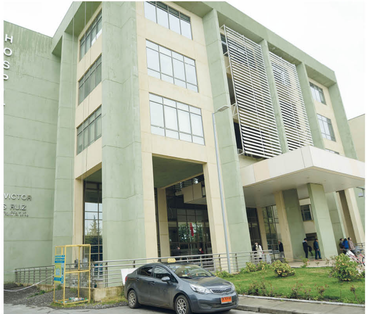
TANTO LA MADRE como el lactante se encuentran en el hospital base de Los Ángeles.

Igualmente, aseveró que todo es confuso desde el punto de vista criminalístico, aunque están haciendo todas las diligencias para poder establecer lo que sucedió en este caso, "por cuanto los primeros antecedentes nos indican que la joven habría dado a luz en su inmueble, siendo trasladada posteriormente por sus padres hasta el referido centro asistencial". Todo se produjo, debido a que la joven -según su versión- no sabía que estaba embarazada y su bebé se encontraría grave debido a que habría sufrido una caída.