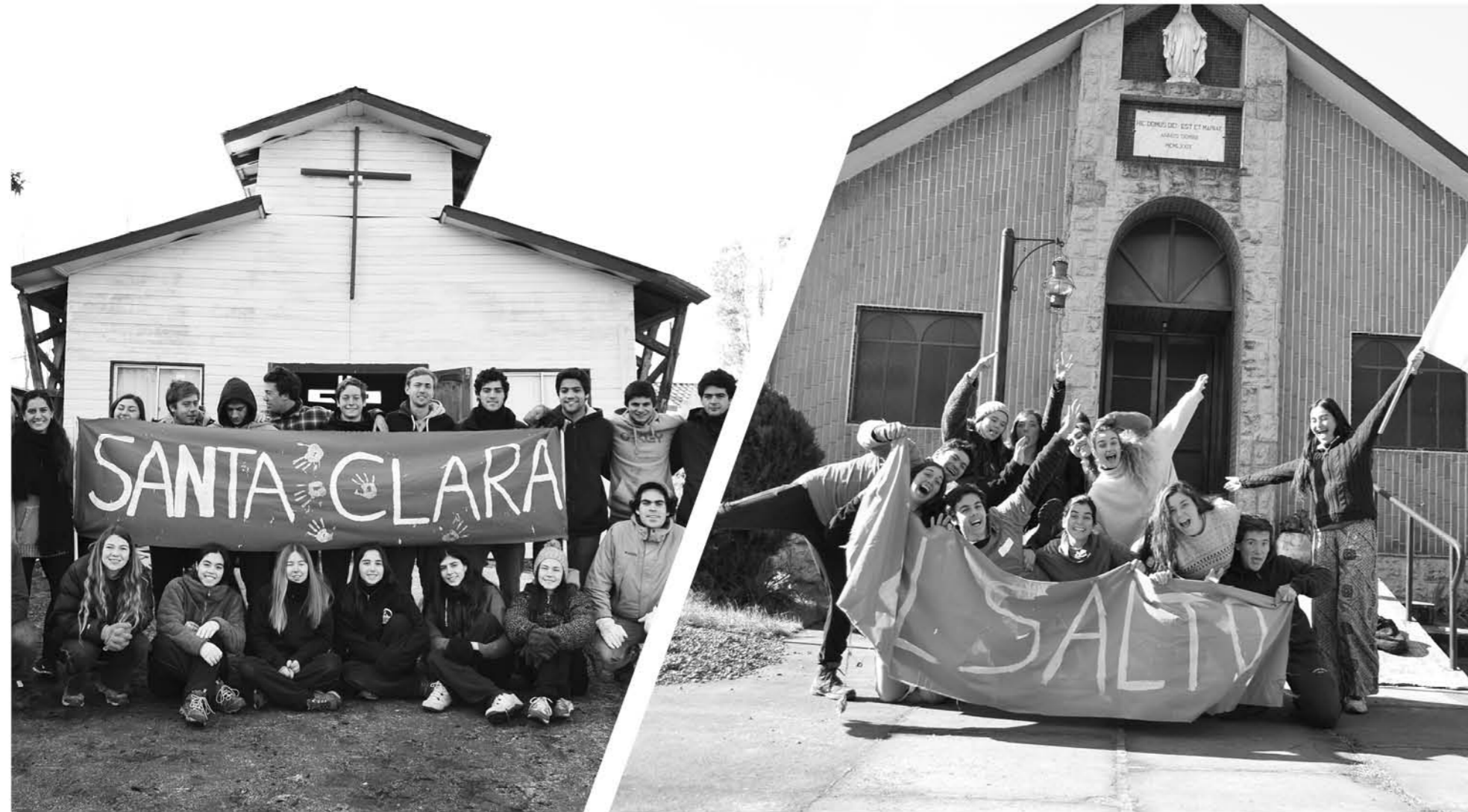
MÁS DE 50 JÓVENES misioneros llegaron a la comuna, como parte del proyecto Misión País UC.

Destinan sus vacaciones para lo que ellos consideran como una de sus actividades más importantes e impostergables: su misión cristiana.