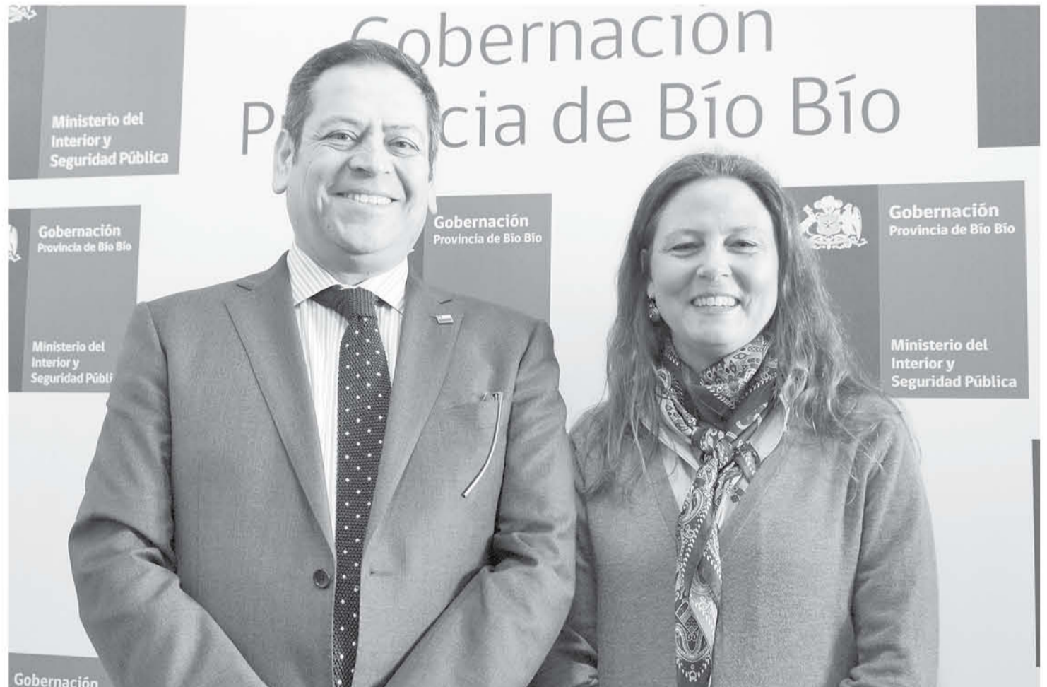
LA NUEVA AUTORIDAD ASEGURÓ que viene a mantener el buen funcionamiento de la Gobernación mientras llega el titular al cargo.

que un cargo de esa naturaleza es complejo para una dueña de casa, comentó estar sorprendida por las palabras, señalando que no tiene nada de malo ser ama de casa, ya que desde el momento en que se independizan los hijos de sus padres, siempre tendrán esa labor incorporada en sus vidas y las capacidades profesionales no tendrían por qué verse influenciadas.