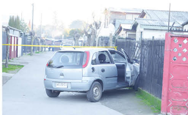
PRODUCTO DE LOS BALAZOS, el vehículo del afectado chocó con una casa.

Cabe recordar que en horas de la tarde del jueves, en la intersección de calle Hernán Díaz con Manuel Rojas, ocurrió una balacera luego que dos autos interactuaran y uno de ellos comenzara a disparar contra el conductor de un auto Chevrolet Corsa, esto en la población Escritores de Chile, en el sector de Paillihue en Los Ángeles.