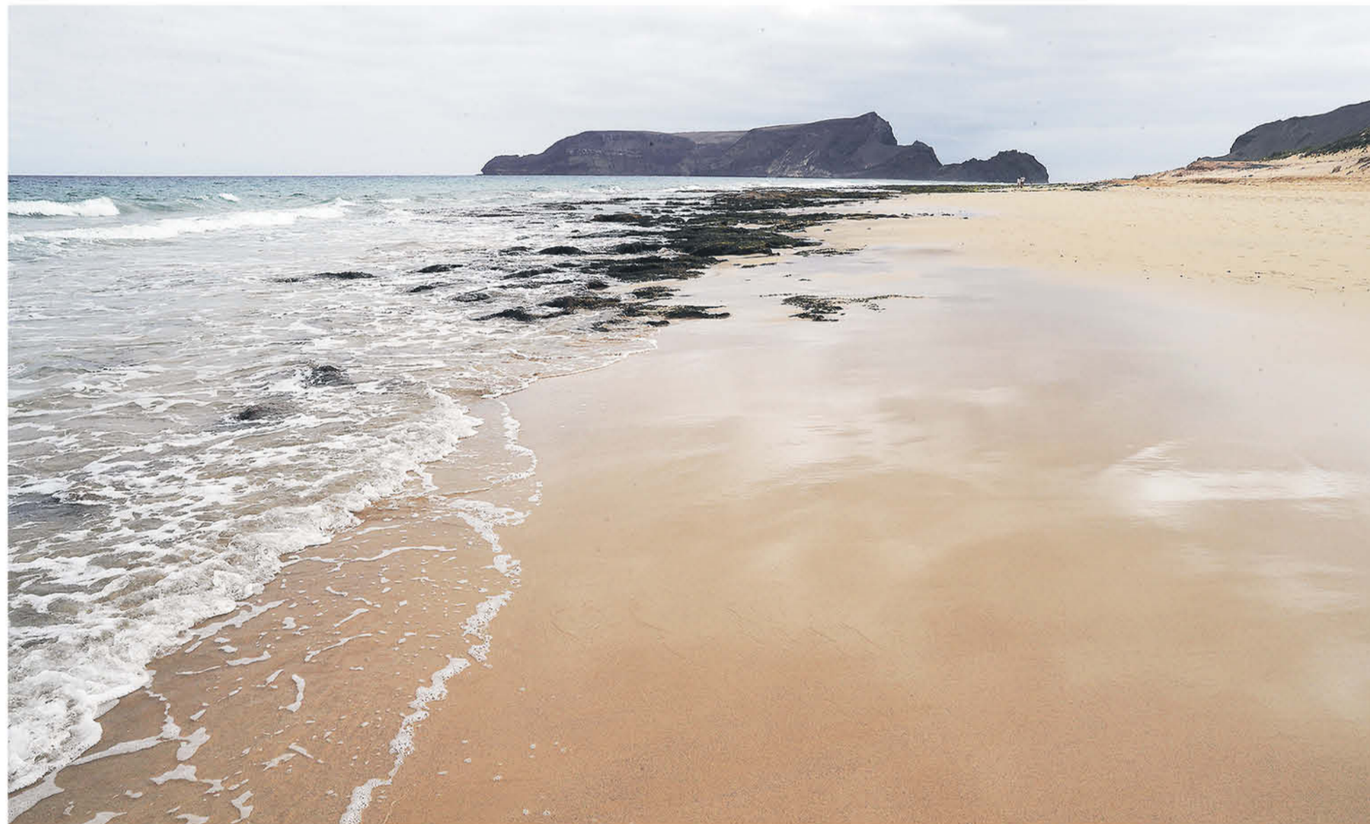
Una pareja pasea en la lejanía en la playa de Porto Santo, con el Islote de la Cal al fondo.

Para suerte de los portosantenses, la isla está cubierta por metros de arena en la mayor parte de su superficie.