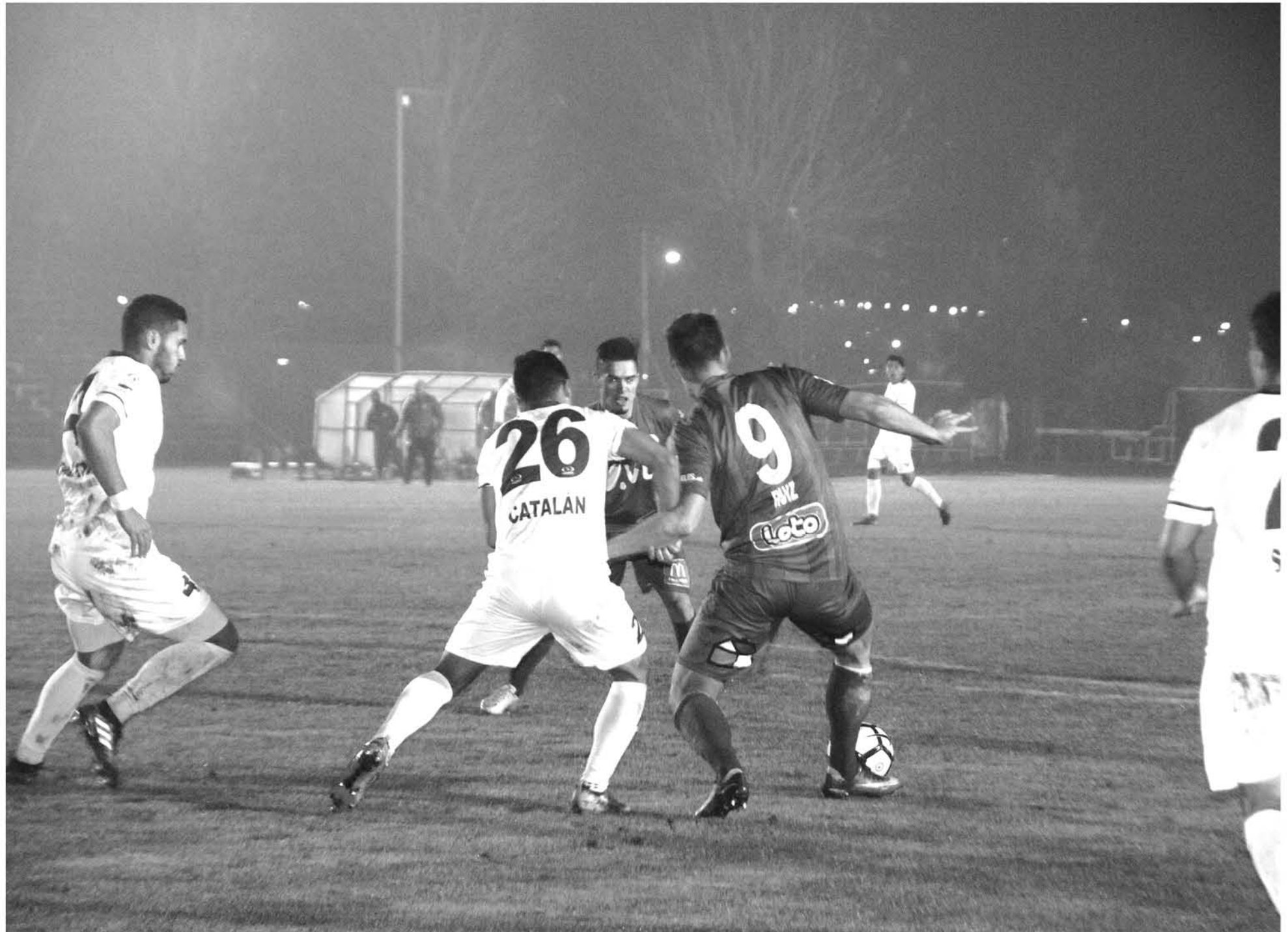
SIN GOLES terminó el duelo entre ambas escuadras que se jugó en Los Ángeles.

Por lo mismo, los últimos días el elenco angelino se estuvo preparando en el Complejo Deporti-