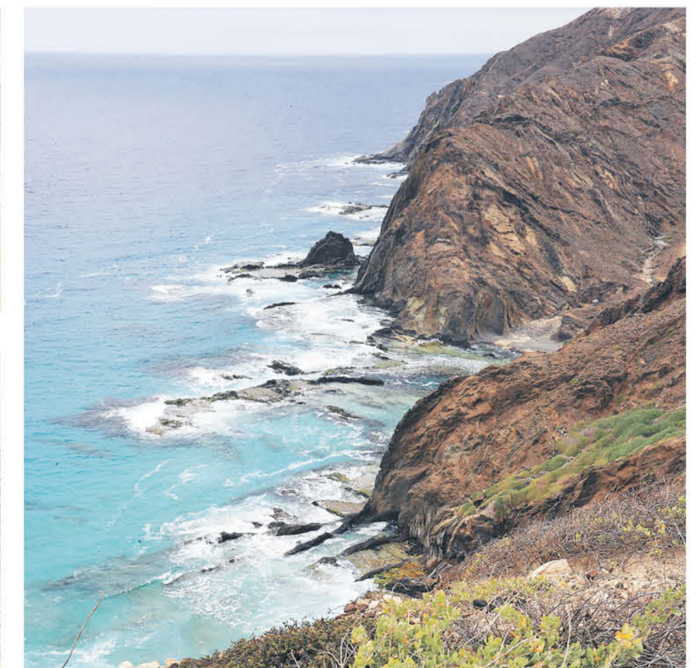
Acantilados de la costa norte de Porto Santo, en la Fonte da Areia (Fuente de Arena).