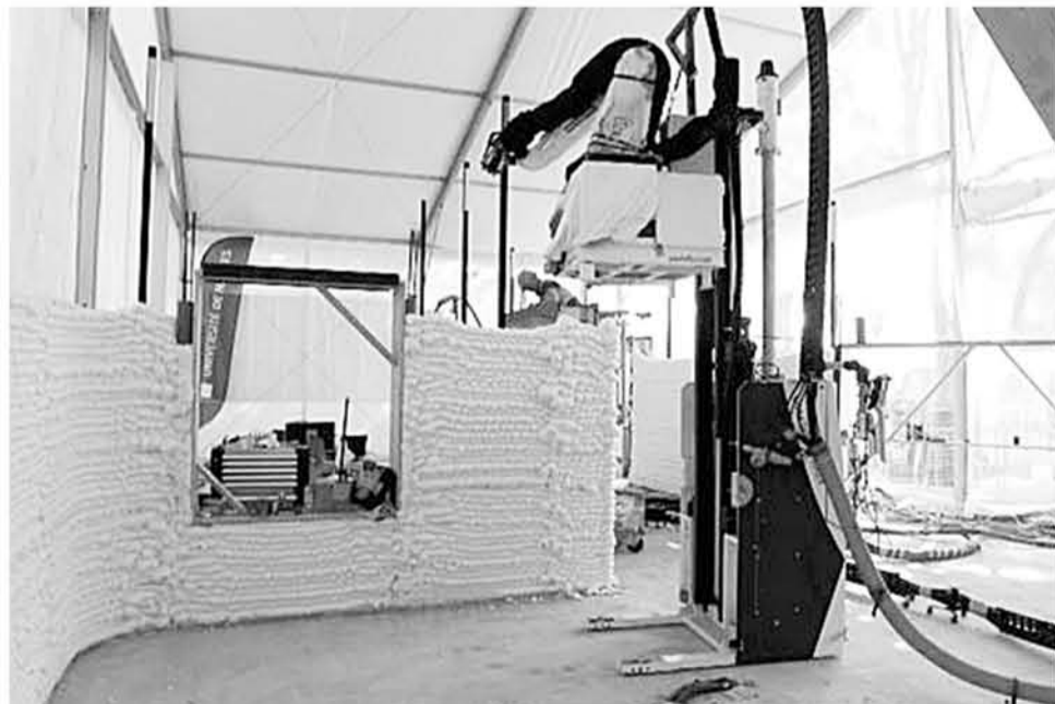
LA IMPRESORA entonces es utilizada para imprimir los bloques desde el suelo hasta arriba para formar las paredes.

También trabaja en un edificio comercial.