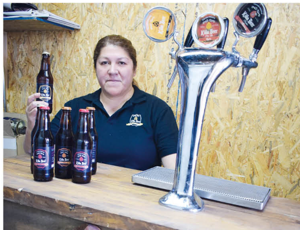
TODAS LAS OPORTUNIDADES de negocios, son evaluadas por el equipo familiar con el objeto de dar a conocer en más lugares su empresa.