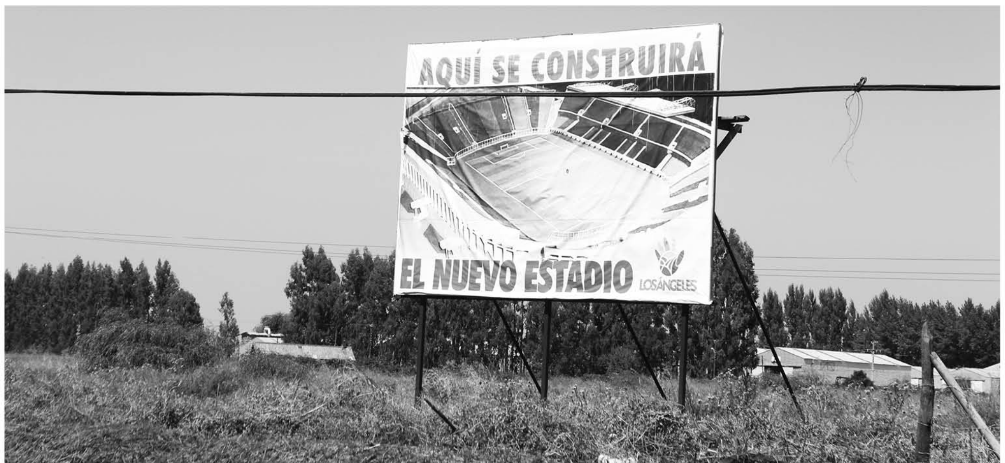
SON MÁS DE 16 MIL MILLONES de pesos los que fueron aprobados en para la construcción del futuro estadio de Los Ángeles.