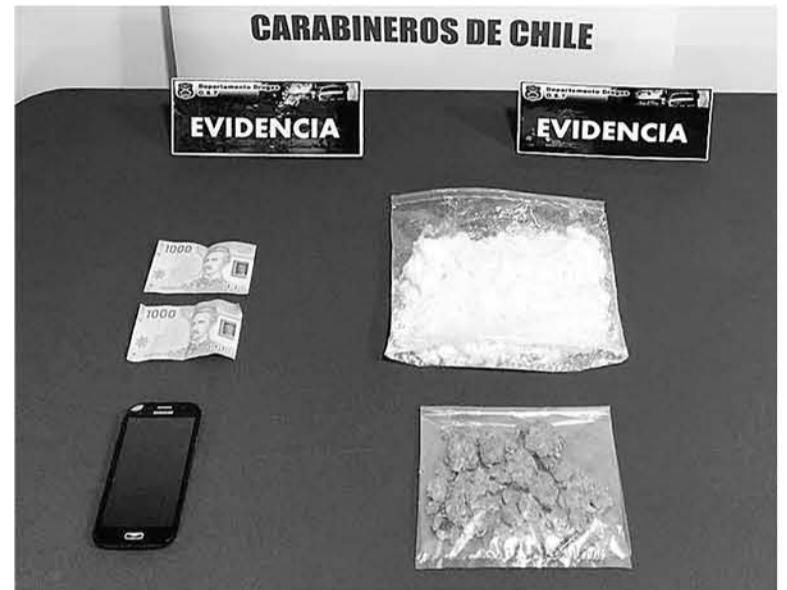
EL HOMBRE ESTARÍA VINCULADO con un clan familiar que se dedica a la distribución de sustancias ilícitas.

Sobre los menores de edad involucrados, estos fueron dejados en libertad de acuerdo a lo instruido por el fiscal de turno. Por su parte,