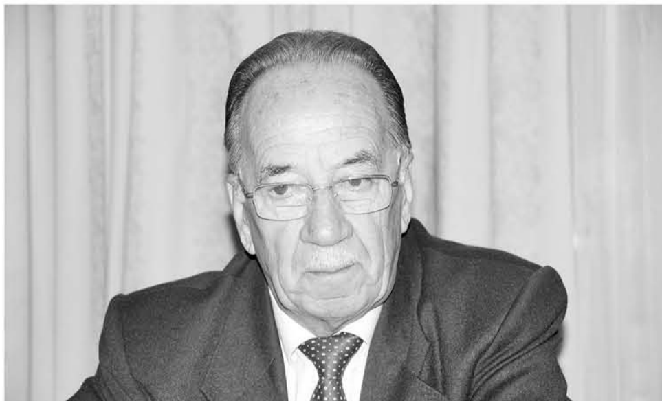
EL DIPUTADO RADICAL planteó que se les debe exigir certificados personales y de salud a los extranjeros que llegan a Chile.

Según el diputado, los inmigrantes con antecedentes penales o investigados por delitos en sus países, o que presenten enfermedades graves aún no detectadas en suelo nacional, no pueden ingresar al país.