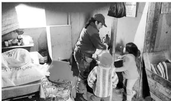
LOS OFICIALES se organizaron de manera independiente, para generar esta ayuda a los habitantes de esta compleja zona.

Por medio de la Oficina de Integración Comunitaria y patrullas de atención comunitaria, oficiales de esta comuna generaron diferentes acciones de apoyo a familias vulnerables.