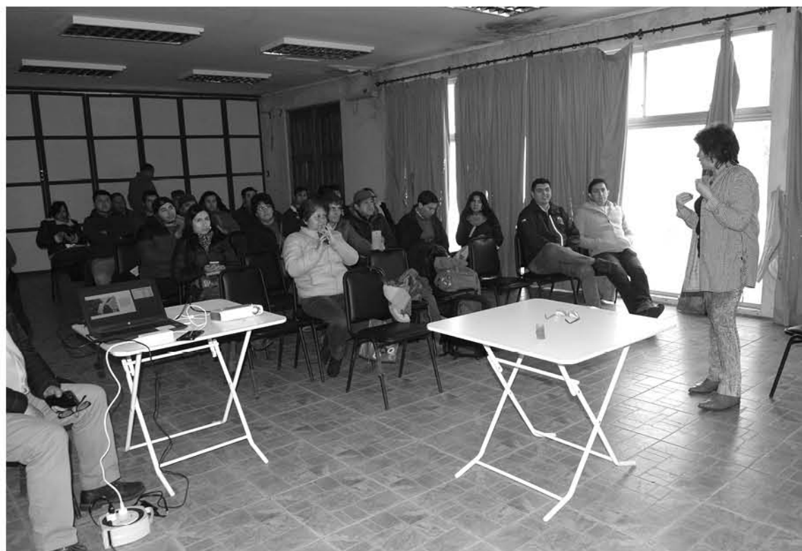
FUERON DECENAS DE APICULTORES que llegaron hasta el centro tecnológico para interiorizarse de distintos temas.

Los productores de miel locales se informaron acerca de productos orgánicos y cómo tratar la varroa, entre otras cosas.