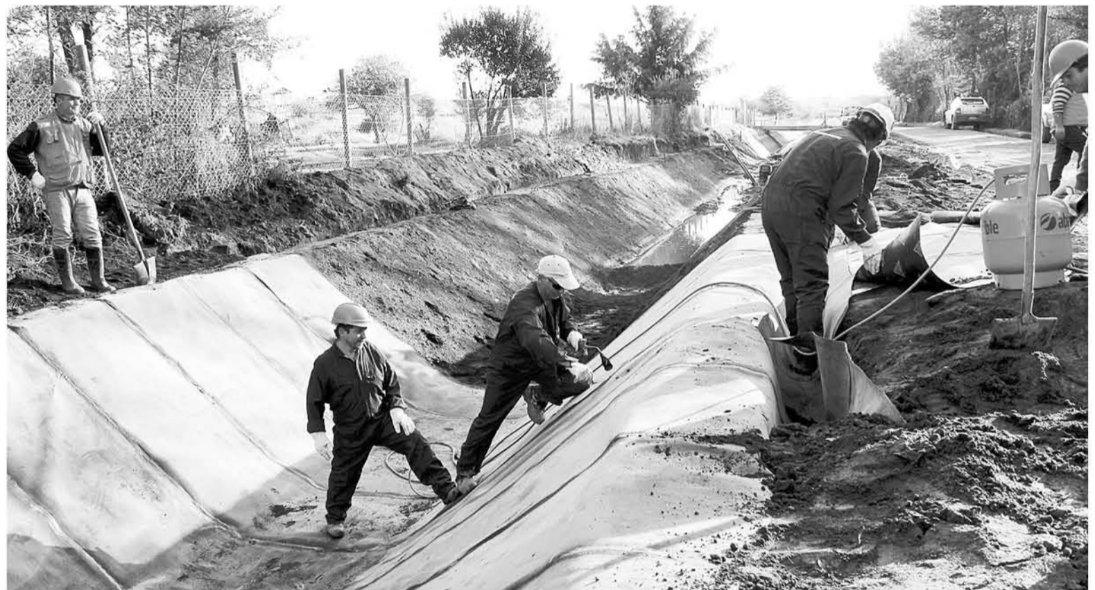
EL MÉTODO DE ENCAUCE cubrirá 30 metros lineales del canal (Foto cedida).

Cabe destacar que el canal Quillón es una de las fuentes más importantes de riego que tiene la comuna-balneario y la extracción de sus aguas se realiza, principalmente, a través de gravedad, motores y compuertas. Por lo mismo, requiere que su cauce esté totalmente limpio y no presente obstáculos.