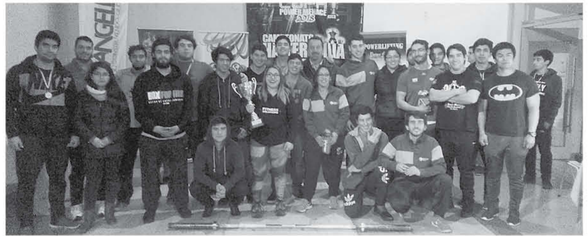
LOS PARTICIPANTES esperan conseguir auspicio para seguir destacando en la desconocida disciplina en la ciudad.

Debido a que el deporte no es conocido, no tienen los recursos sufi-