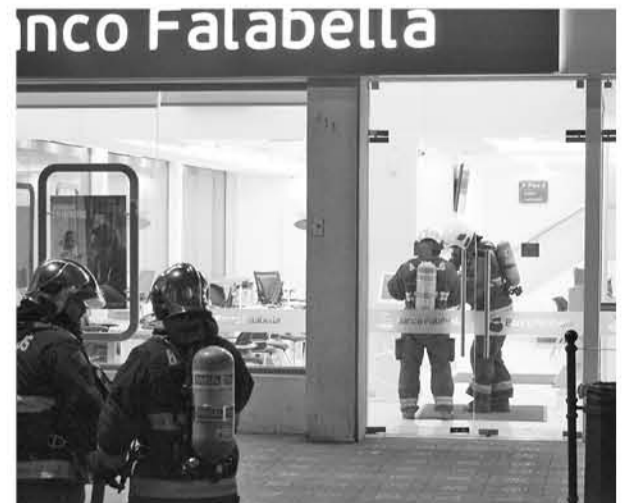
EN EL LUGAR DE ESTA EMERGENCIA trabajaron personal de la Quinta y Novena compañía de Bomberos, además de Carabineros, quienes aislaron las calles involucradas.

Fue por medio de la revisión a las instalaciones, que se pudo determinar que el olor que se mantenía en las instalaciones era producido por una descomposición orgánica en el lugar, por lo que se trabajó en la ventilación de las instalaciones, para regresar a las habituales funciones de este concurrido banco comercial.