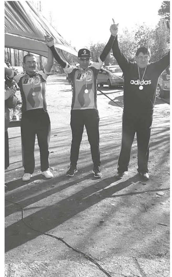
LOS PARTICIPANTES DE UCM Scott también destacaron en esta competencia.