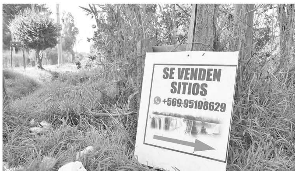
UNA FUERTE OFENSIVA ha emprendido el gobierno contra la venta de sitios irregulares en sectores rurales.

Senador UDI condenó detección de más de 500 hectáreas de loteos irregulares, concentradas en distintas comunas de las regiones del Biobío y Ñuble.