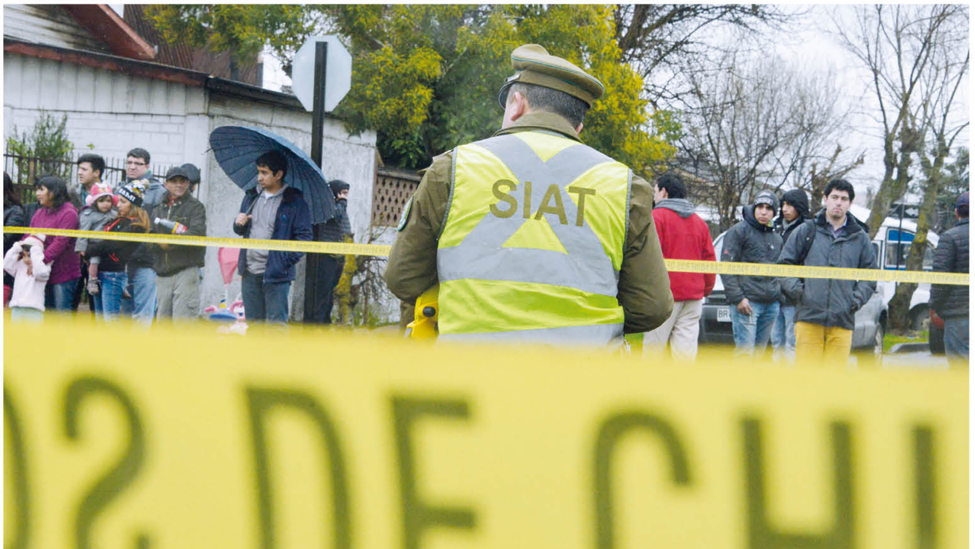
EN LA BAJA DE ESTOS ÍNDICES se registró una disminución considerable en accidentes vehiculares.

“Fue un accidente que está siendo estudiado por la SIAT Biobío, ya que hay varios patrones que estudiar, considerando que en este lugar hay semáforos y además existe ciclovía” puntualizó el teniente.