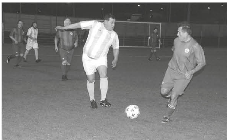
LOS EX JUGADORES iberianos esperan más aporte para realizar actividades, optar a una sede y reencontrarse el próximo año.

El partido fraternal entre las antiguas generaciones que defendieron los colores de Iberia y se reunieron en Los Ángeles desde distintas partes del país, demostró que el amor por la camiseta es más fuerte, enfatizando que para hacer fútbol no influye la edad.