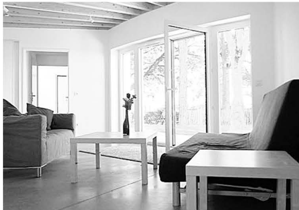
EL COMEDOR de la casa.