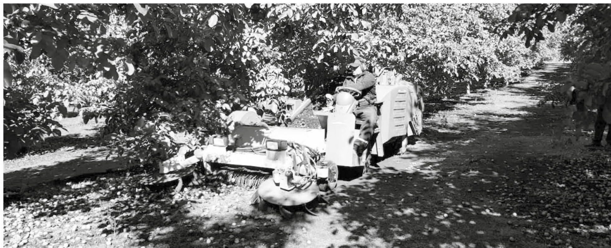
LA CALIDAD DE LA NUEZ CHILENA es insuperable, y particularmente en la zona existen plantaciones con variedades de última generación.

"Eso trajo los primeros años, pérdidas del 60% y fue eso, lo que hizo que el primer intento por implantar el nogal en la región, terminara por fracasar el año 2002. Ese año no fue posible controlar la bacteria y las pérdidas hicieron que finalmente desaparecieran los huertos", al tiempo que agregó "se asumieron los nuevos desafíos, con tecnología de avanzada, trabajando con biólogos de Santiago para así generar una estrategia de control de la bacteria, lo que permitió que finalmente el cultivo prosperara en la región".