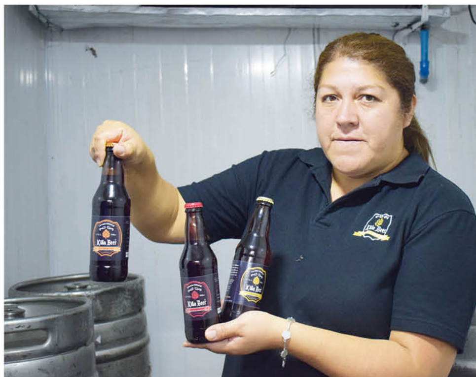
TRES VARIEDADES, producen en Huépil pero que van sumando varios estilos.

microcréditos individuales a grupos de emprendedores, es decir, personas que se organizan en sus barrios para recibir sus microcréditos. Actualmente y sumando a las dos oficinas que tienen en la región del Biobío, Los Ángeles y Concepción, apoyan a alrededor de 5.100 emprendedores. Hoy Banigualdad, oficina Los Ángeles, cuenta con casi 3 mil 200 emprendedores en las comunas de Antuco, Cabrero, Laja, Mulchén, Nacimiento, Negrete, Quilaco, Quilleco, San Rosendo, Santa Bárbara, Tucapel, Yumbel, Yungay y obviamente Los Ángeles.