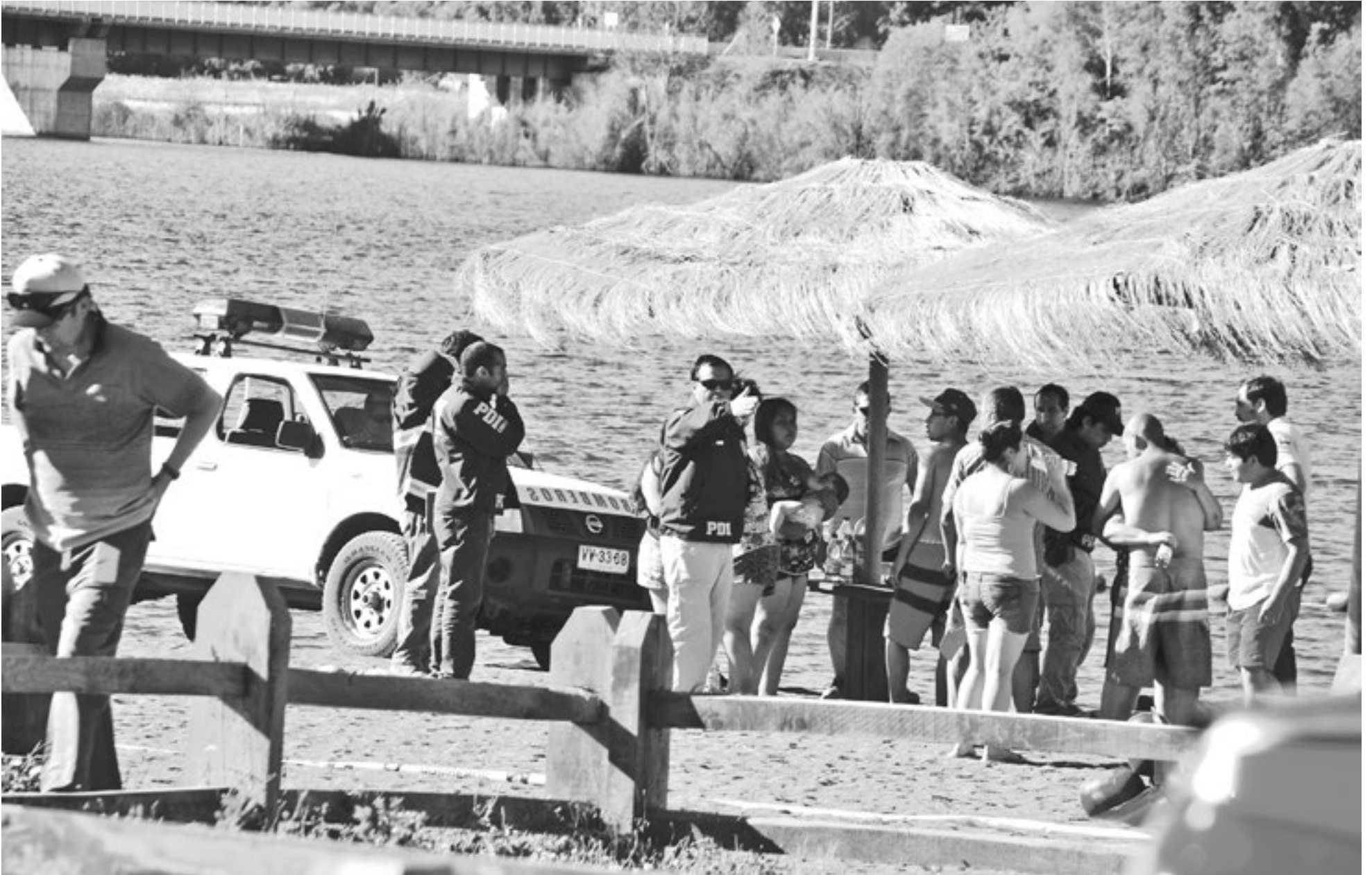
CONSTERNACIÓN Y LAMENTACIONES dejó la muerte de niño de 8 años.