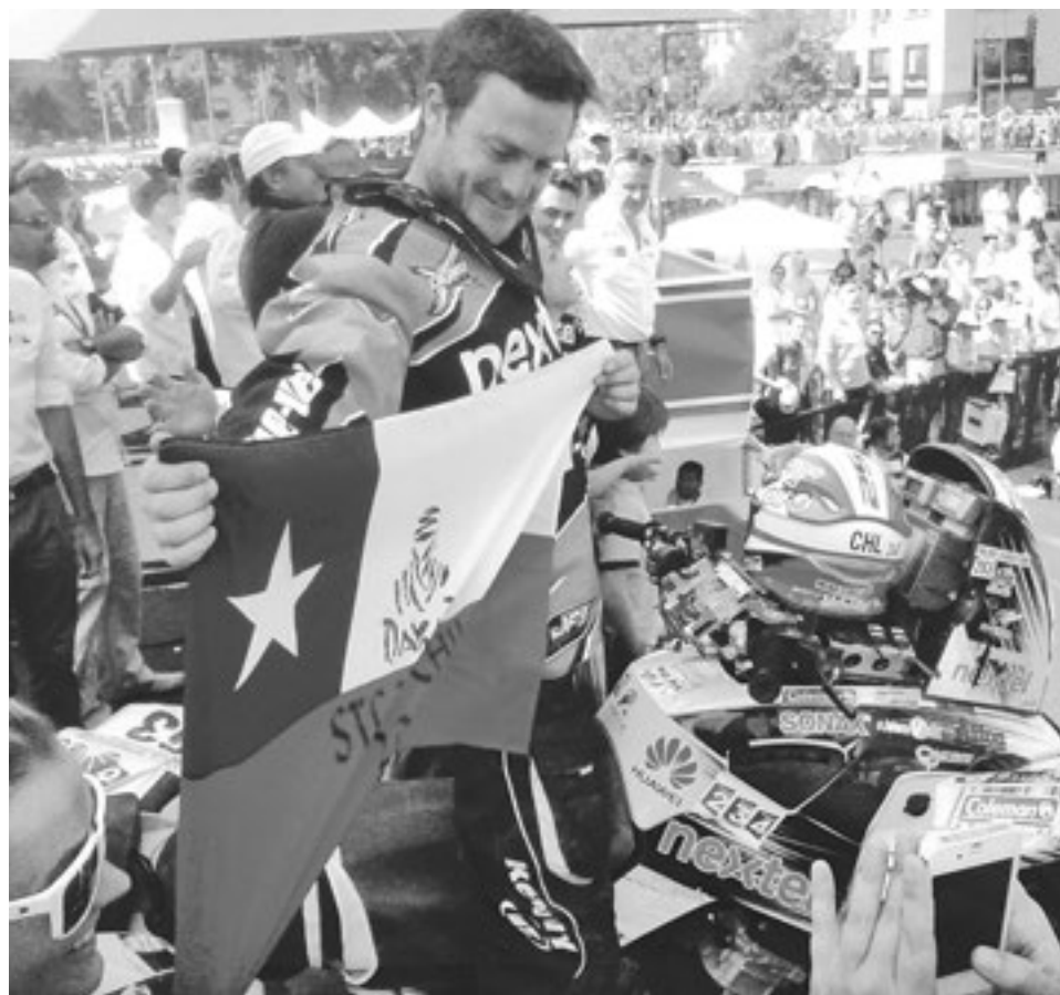
PALMA SE QUEDÓ con la mejor ubicación de chilenos en cuatriciclos.

Así es como el Dakar culmina en su edición 2015, y se queda a la espera de la decisión de las autoridades respecto a la inclusión de Chile en una próxima oportunidad.