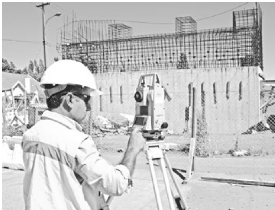
ACTUALMENTE SE ESTÁ REVISANDO la topografía del lugar.