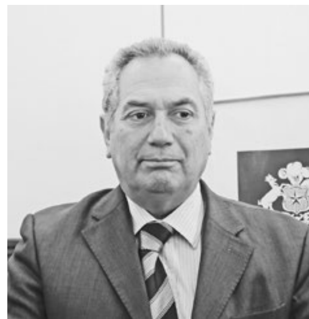
SEREMI DE SALUD sostuvo que Cefam Entre Ríos ya fue licitado.

En cuanto a la atención primaria, la autoridad sostuvo que ya se licitó el Cefam Entre Ríos de Los Ángeles, y que además este año se iniciaría el proceso para materializar la ejecución de los Cecof de Santa Bárbara, Laja y Cabrero.