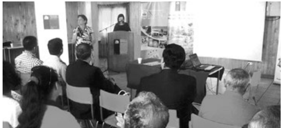
LA DIRECTORA DEL SERVICIO de Salud Bío Bío estuvo presente en la actividad.

Este proyecto de normalización, significa una inversión cercana a los 10 mil millones de pesos, abarcando una superficie de 9.814 metros cuadrados que beneficiarán no sólo a la comuna de Nacimiento, sino también a la vecina comuna de Negrete, conformando así la unidad estratégica entre ambas localidades.