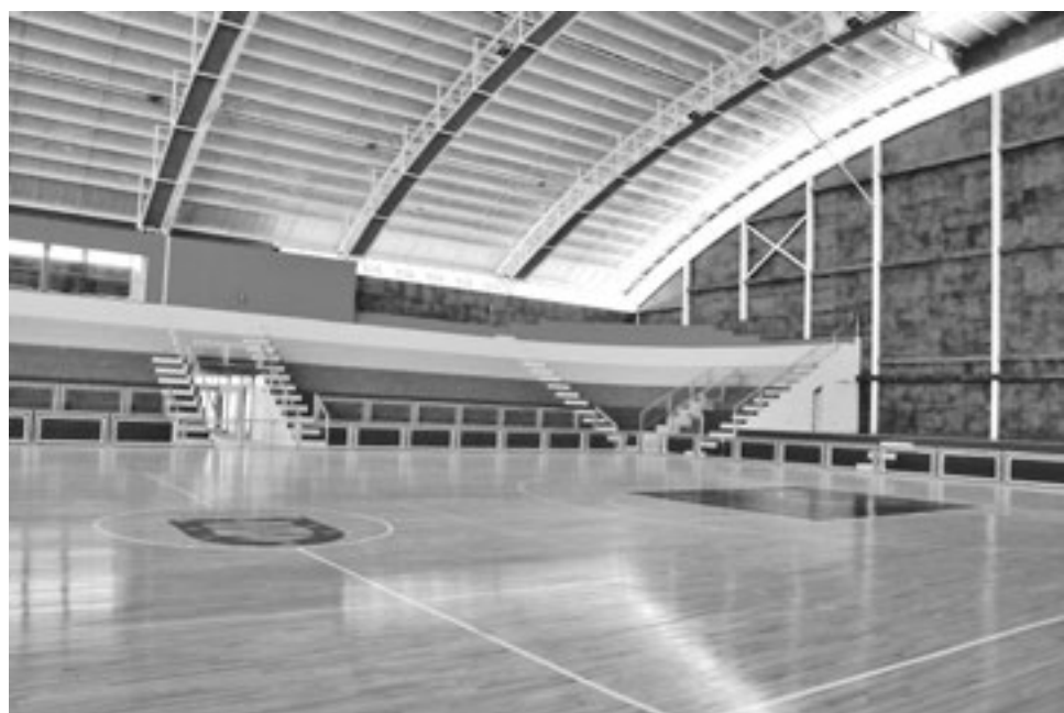
INSTALACIÓN DE BUTACAS y otros implementos estarán listos a fines de marzo.

El proceso para acondicionar el polideportivo angelino ha demorado más de la cuenta, pero desde el municipio aseguran que se está dentro de las últimas etapas para que, a fines de marzo, ya se cuente con las herramientas básicas. De esta forma, el polidepor-