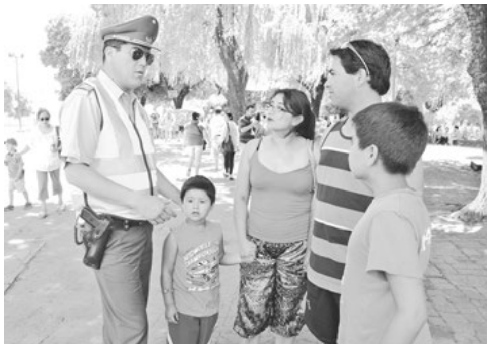
CARABINEROS TIENE UN PLAN de seguridad preparado para toda la semana de peregrinaje.