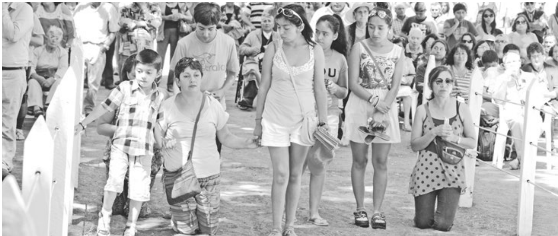
FIELES PAGANDO MANDAS en el templo de San Sebastián.