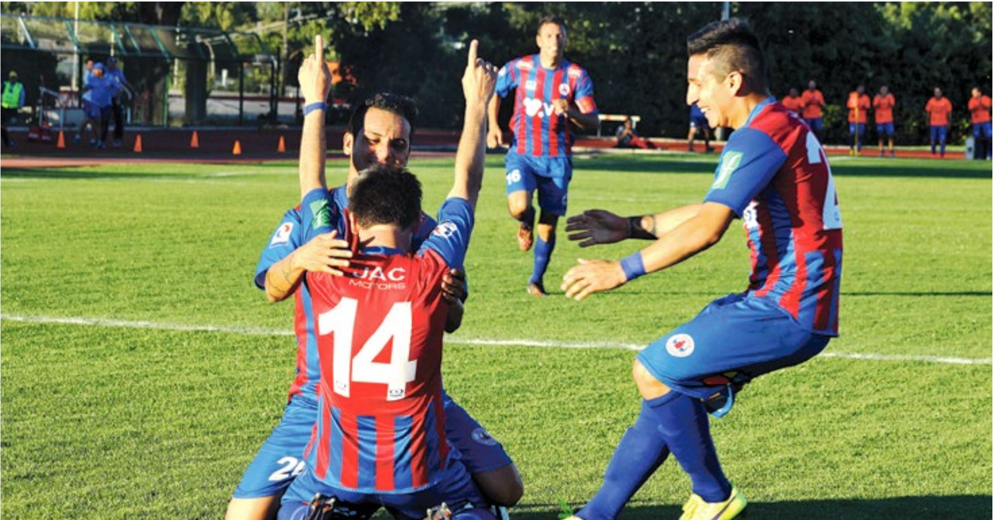
SÓLIDA VICTORIA DE IBERIA DEJA CONFORMIDAD EN EL EQUIPO Y PÚBLICO ANGELINO.