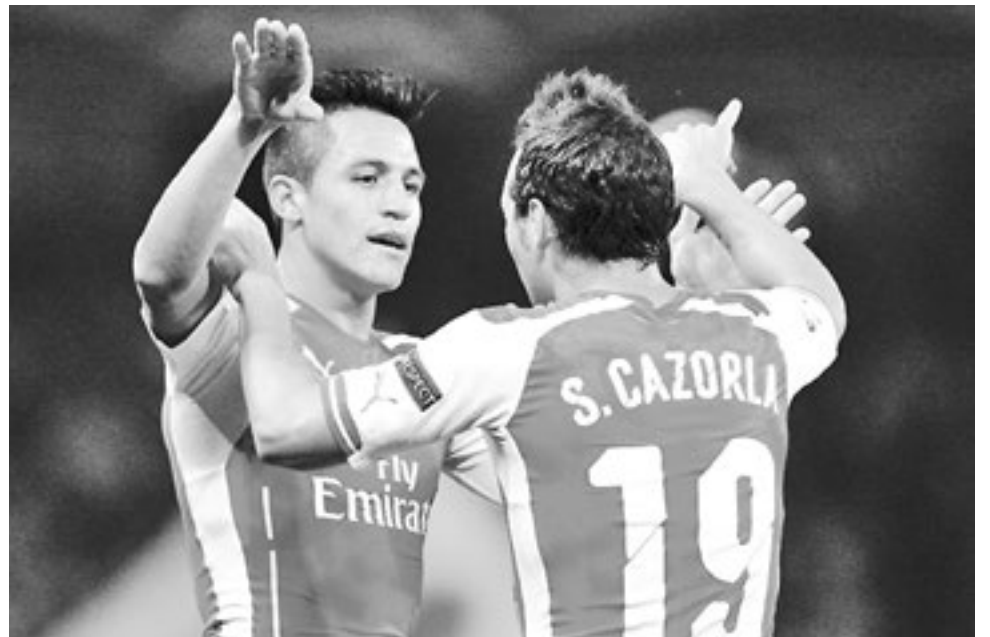
CON GRAN PARTIDO de Cazorla y Sánchez, el Arsenal acorta distancias con punteros.

A pesar de eso, Pellegrini insistió en ir al frente, pero