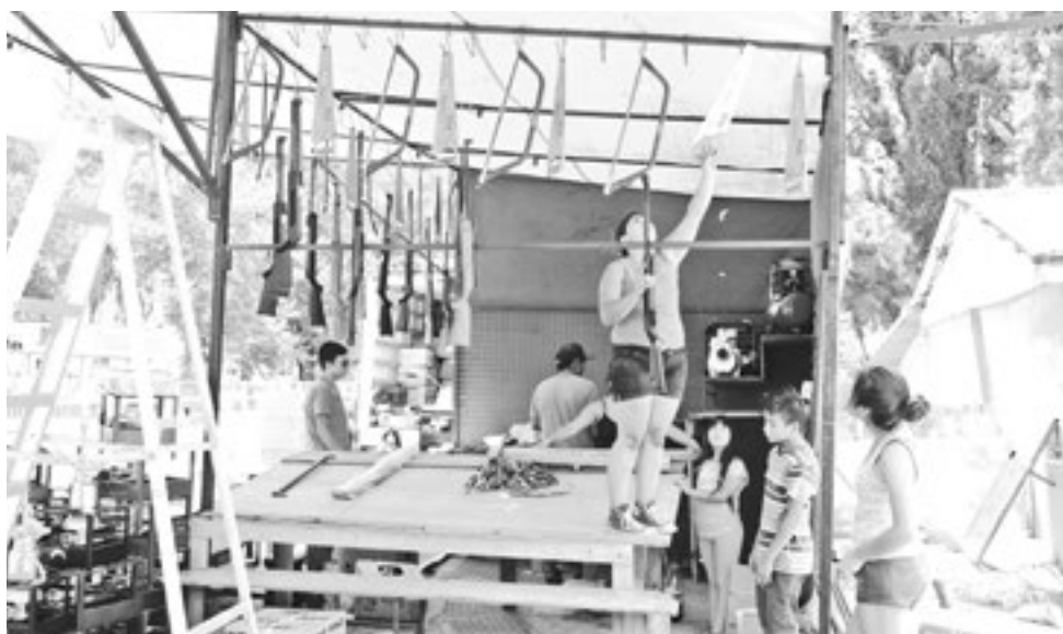
HASTA FERRETERÍAS SE INSTALAN alrededor del camposanto de San Sebastián de Yumbel.