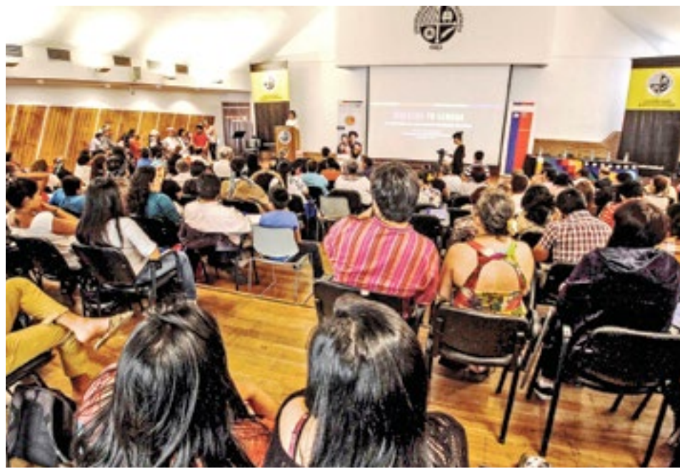
ADemás de EXPERTOS chilenos participaron profesionales provenientes de Perú, Bolivia y Argentina, entre otros país, y tuvo al País Vasco y el euskera como invitados especiales.

La iniciativa, ingresada en mayo de 2014, se encuentra en primer trámite constitucional en el Senado. El proyecto, gestado en dos congresos de lenguas indígenas en 2010 y 2011, busca reconocer, proteger y garantizar los derechos lingüísticos, individuales y colectivos de los pueblos indígenas en Chile, así como la promoción del uso y desarrollo de sus lenguas y su armónica relación con el idioma castellano”. Además de reconocer la pluriculturalidad del país, la moción establece la creación del Instituto de Derechos Lingüísticos, para valorar, revitalizar y