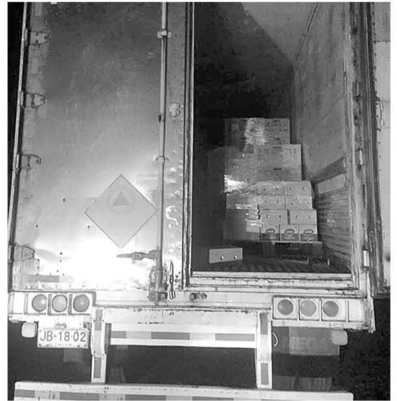
EL PROCEDIMIENTO se efectuó luego de un llamado anónimo a la central de Carabineros.

Debido a todo esto, durante el pasado viernes este responsa-