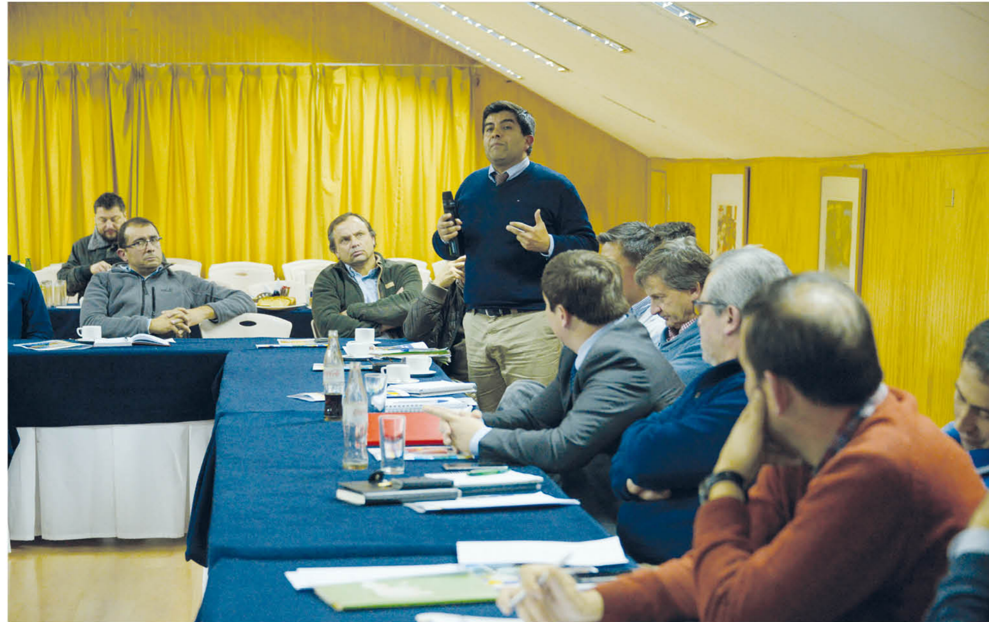
LA REUNIÓN DE COORDINACIÓN para dar inicio a un trabajo que desemboque en la constitución de la Junta de Vigilancia del Biobío se realizó en el Hotel La Turbina de la comuna de Negrete.

La instancia tiene por finalidad resguardar el buen uso de las aguas del principal caudal de la región y el más grande del país.