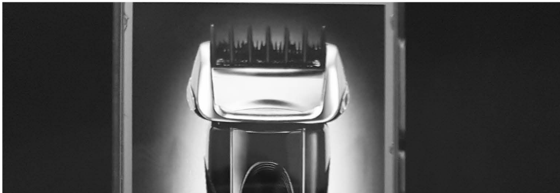
QUE TIENE QUE PARECER una afeitadora, pues hecho, la aplicación se lo conseguirá.

La aplicación "Fake a Call" permite recibir una llamada falsa de cualquier persona (en apariencia), conocida o no, e incluye hasta voces grabadas para dar realismo a la idea de que hay alguien al otro lado. Disponible tanto en iOS como en Android, las llamadas pueden programarse o recibirse de manera instantánea.