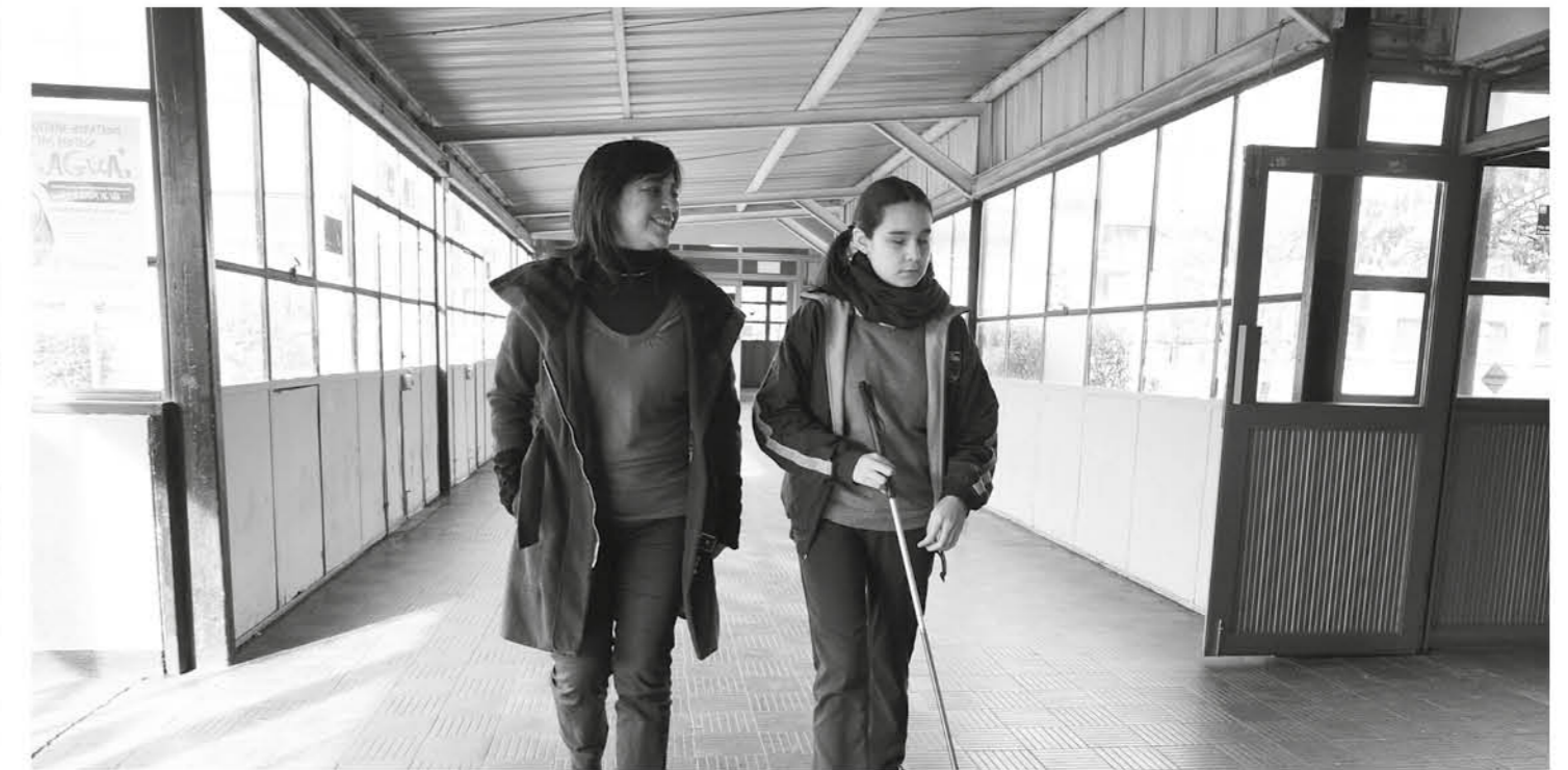
POR SUERTE, ACTUALMENTE existen metodologías de enseñanza en favor de la diversidad.

"Lo que a mí me motiva es que quiero que mis niños, partan en igualdad de condiciones en esta carrera que es la vida. Mi objetivo es que vayan a la universidad, de hecho tengo niños que están en la uni-