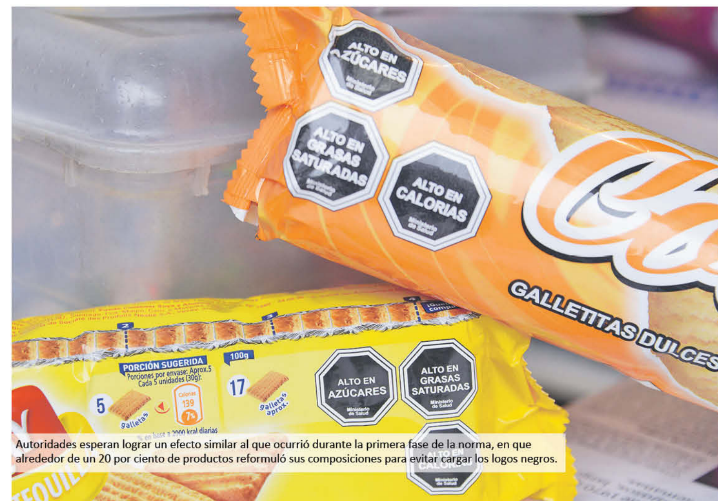
Autoridades esperan lograr un efecto similar al que ocurrió durante la primera fase de la norma, en que alrededor de un 20 por ciento de productos reformuló sus composiciones para evitar cargar los logos negros.

Desde hace dos años, se implementó la Ley de Etiquetados, destacándose por la aparición de estos sellos negros octagonales en los envases, con lo que nos dimos cuenta que en vez de llevar una dieta saludable, se estaba comiendo alimentos altos en sodio, azúcares,