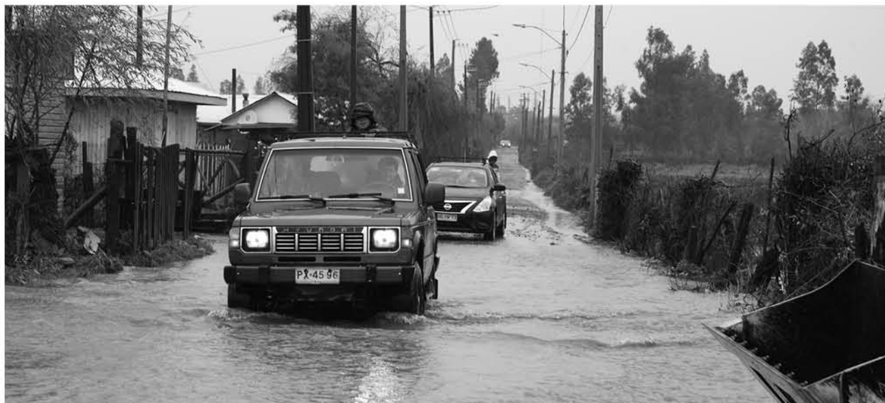
ANEGAMIENTOS MENORES de calles por la copiosa lluvia fue lo que se vivió en Los Ángeles.

Conservador y Archivero Judicial de Los Ángeles Necesita incorporar a su equipo de trabajo