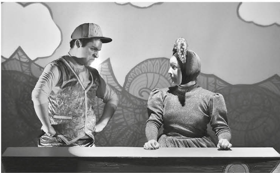
LA ÚLTIMA PRESENTACIÓN fuera de Los Ángeles fue en Villarrica con la obra Imaginario.

Hamlet y Ofelia (2015); y en los zapatos de otro (2016).