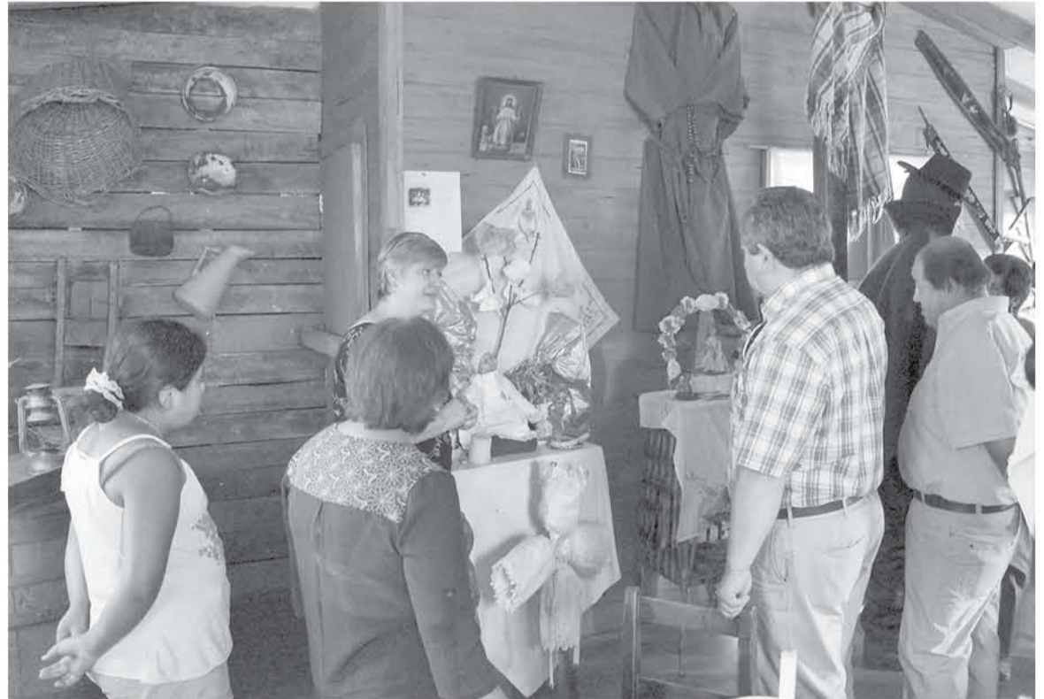
ESTE LUGAR CON 13 AÑOS de trayectoria se dedica a la exposición de variadas actividades históricas, donde son profesionales de manera independiente quienes presentan exposiciones a sus interesados.

dijo que "la iniciativa parte cuando este grupo de profesionales se da cuenta que las intervenciones ciudadanas no logran alcanzar el objetivo de valorar el patrimonio ya que las personas no lo tenían claro, entonces comenzamos a recopilar antecedentes".