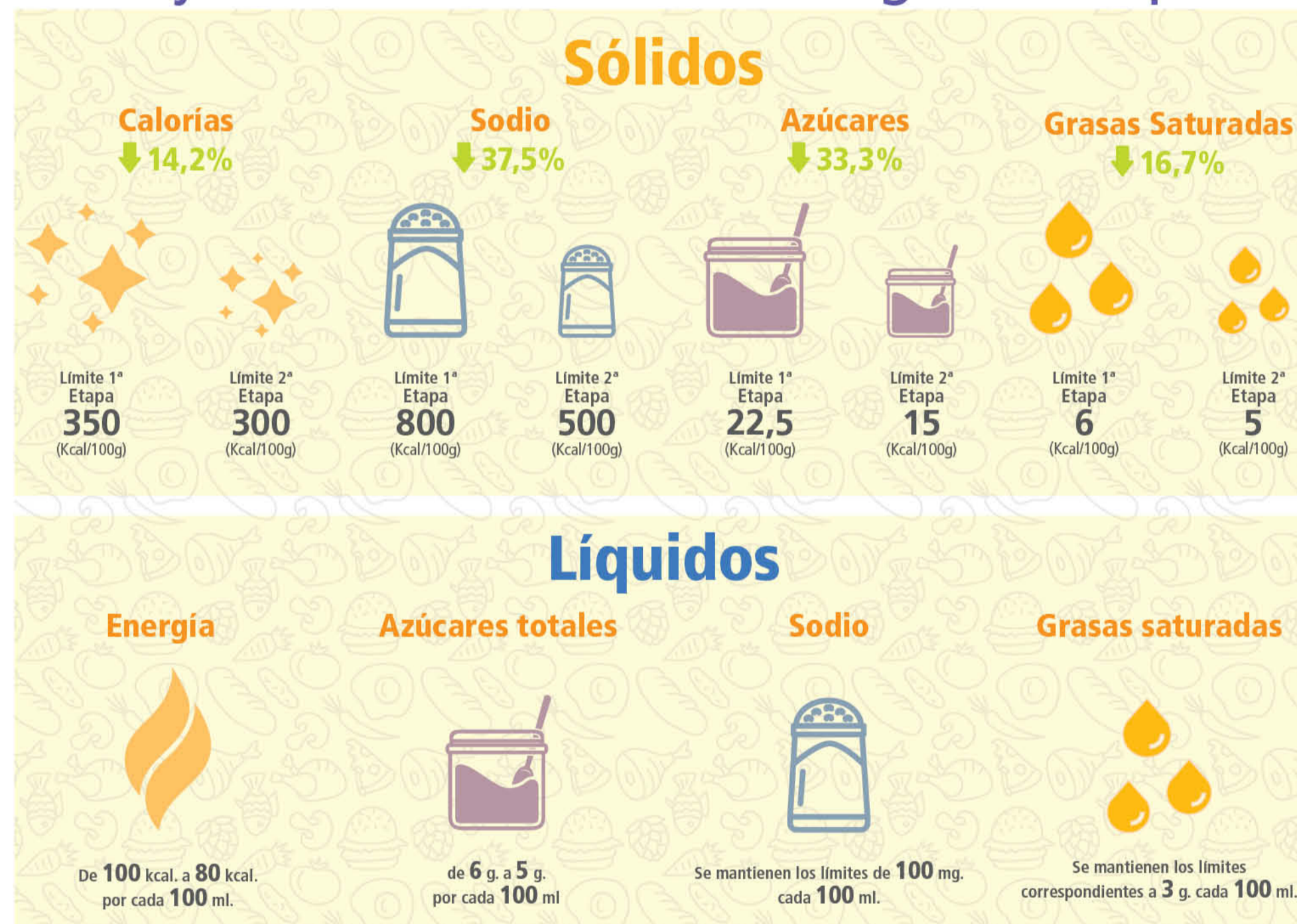
Estas nuevas estimaciones se basaron en un estudio del Instituto de Nutrición y Tecnología de los Alimentos (INTA) de la Universidad de Chile, que analizó alrededor de 7.500 productos que están afectos a la ley, como cereales, leches, congelados, yogures y bebidas, entre otros.