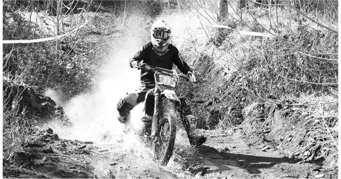
LA ORGANIZACIÓN ESPECIFICÓ que dará énfasis al cumplimiento de horario y la seguridad del evento.

El evento gratuito que promete ser de alto calibre, pondrá a prueba la resistencia, destreza y habilidad de los motociclistas al máximo. Además los asistentes podrán disfrutar en la fiesta costumbrista de rigor, donde serán bien atendidos por los emprendedores locales.