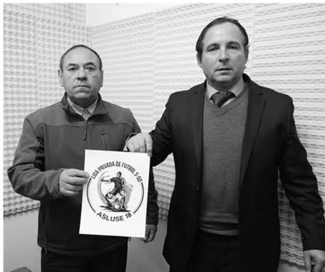
EL 12 DE AGOSTO los organizadores citaron a una reunión para los interesados en participar.