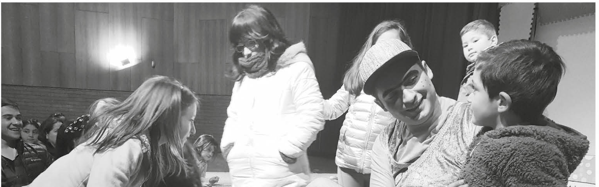
EL DESAFÍO DEL ELENCO es tratar problemáticas atinentes y utilizando el teatro como herramienta de cambio social.