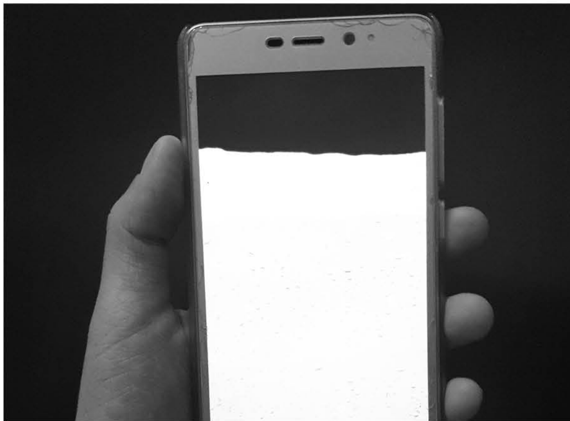
A VECES el móvil se puede convertir -virtualmente- en una jarra de cerveza.

tencia suena surrealista, e incluso de mal gusto, según se mire, esa es esta (o más bien, estas, porque hay varias). Claro está que, desde el punto de vista del sentido del humor, es un juego más.