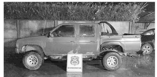
EL PRIMER IMPLICADO de este caso intentó darse a la fuga durante el procedimiento.

Sobre la procedencia de este vehículo, fueron los propios oficiales quienes corroboraron que la camioneta mantenía una orden por robo vigente desde el 30 de junio, cuando fue sustraída desde la ciudad de Angol.