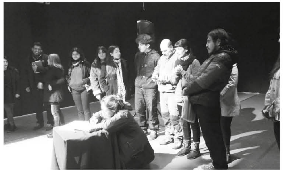
EL CENTRO DE ESTUDIANTES es la primera organización en el área en la provincia de Bío Bío.