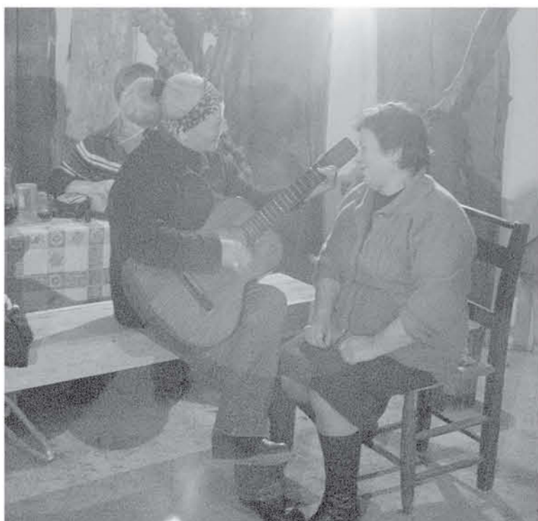
SUS ACTIVIDADES se enfocan en el trabajo con grupos y centros educacionales superiores y establecimientos, donde se pueden reforzar mallas curriculares en las áreas de Ciencias, tecnología, biología e historia.