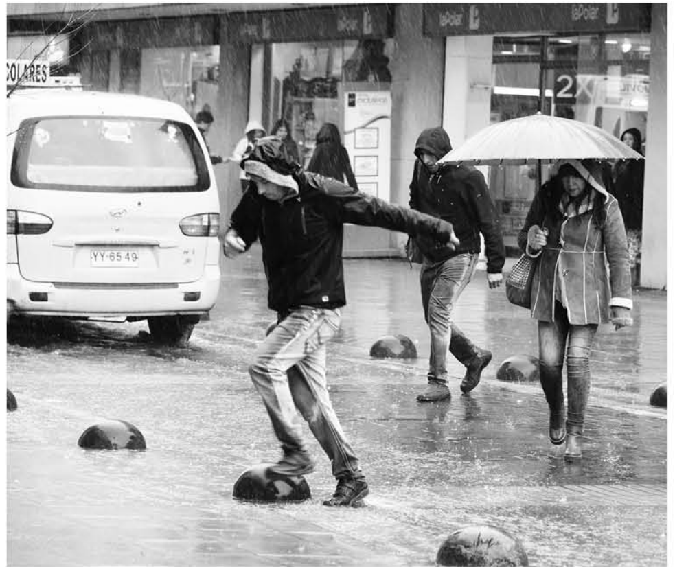
SISTEMA FRONTAL, con mucha lluvia y viento emigró a Argentina.

En Los Ángeles durante las horas de la noche del jueves se realizaron reparaciones del alumbrado público en villa Mininco; en la comuna cordillera de Quilaco se reportó un corte de energía eléctrica que se mantuvo por algunas horas en sector Quilapalos, siendo repuesta durante las horas de la mañana; en Nacimiento se registró un deslizamiento de terreno en el km 2.2 Camino Millapoa Diuquín