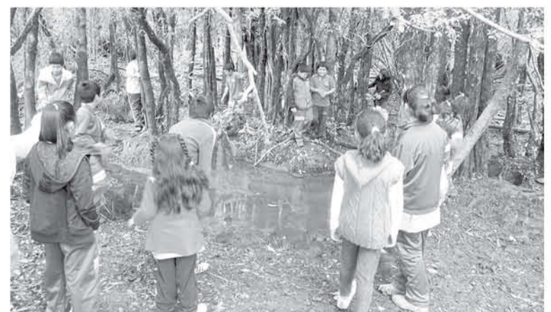
LAS INSTALACIONES MANTIENEN una ruca ancestral, sala de exposición, huertos rurales, espacios de observación de la vida campesina en tradiciones y cultura productiva y 15 hectáreas de humedales, que son centro de investigación para su valoración, conservación y resguardo.

"La misión del Museo Butalevo es rescatar proteger, promover y colocar en valor el sincretismo cultural pehuenche- español que nos hereda nuestra actual cultura criolla campesina en todas sus manifestaciones y diversidad, mediante la salvaguarda del patrimonio cultural material e inmaterial" puntualizó esta profesional.