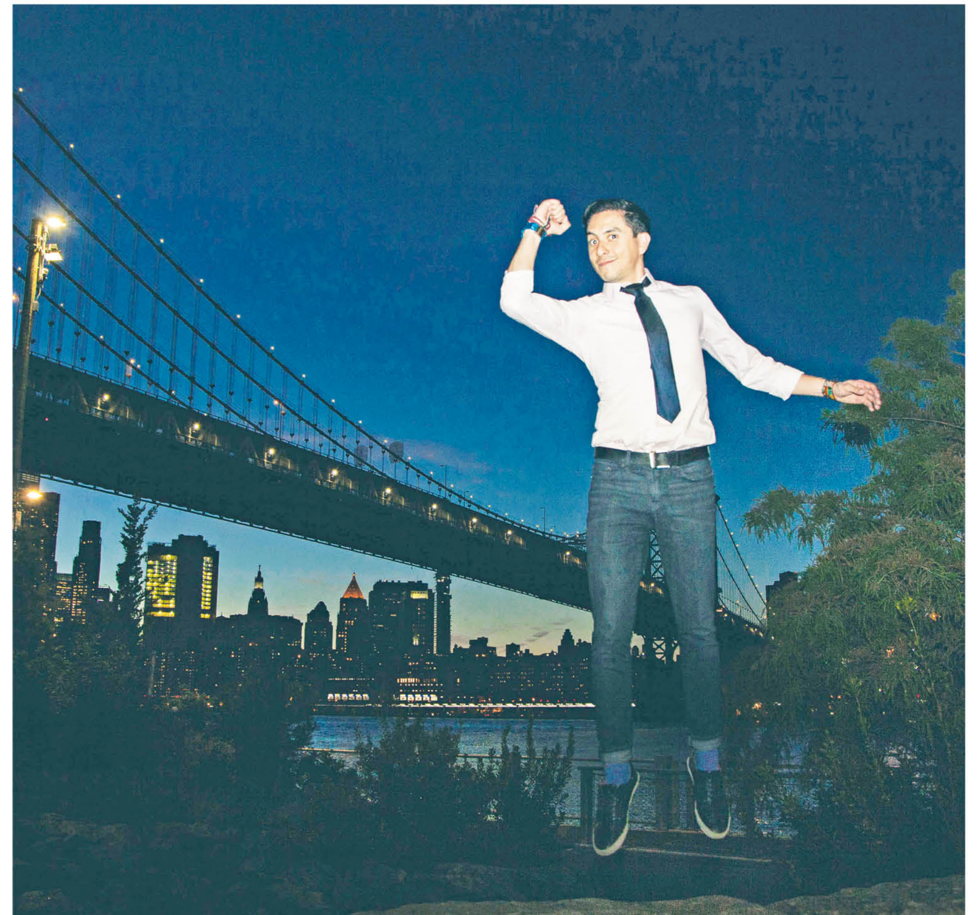
En 2010 fundó Vortex, un grupo de investigación transnacional, junto al doctor en Economía Luis Jorge Garay, con quien Salcedo comparte país de origen.

Con Vortex, Salcedo y Garay no querían limitarse a Colombia o a América Latina, sino al mundo entero: “comenzamos a interesarnos por el enfoque internacional. Nos dimos cuenta de que la justicia tradicional está