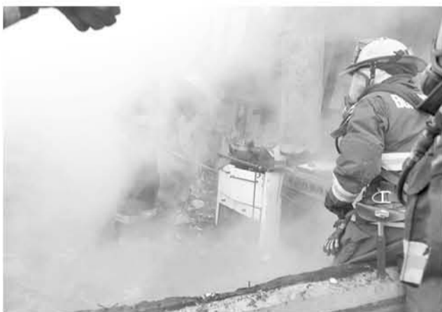
POR EL MOMENTO se investigan las causas de este trágico suceso que no alcanzó a ser controlado por los voluntarios de esta comuna.

Durante la madrugada del día viernes una vivienda del sector Misque en la comuna de Yumbel, terminó totalmente consumida por las llamas, y con tres damnificados.