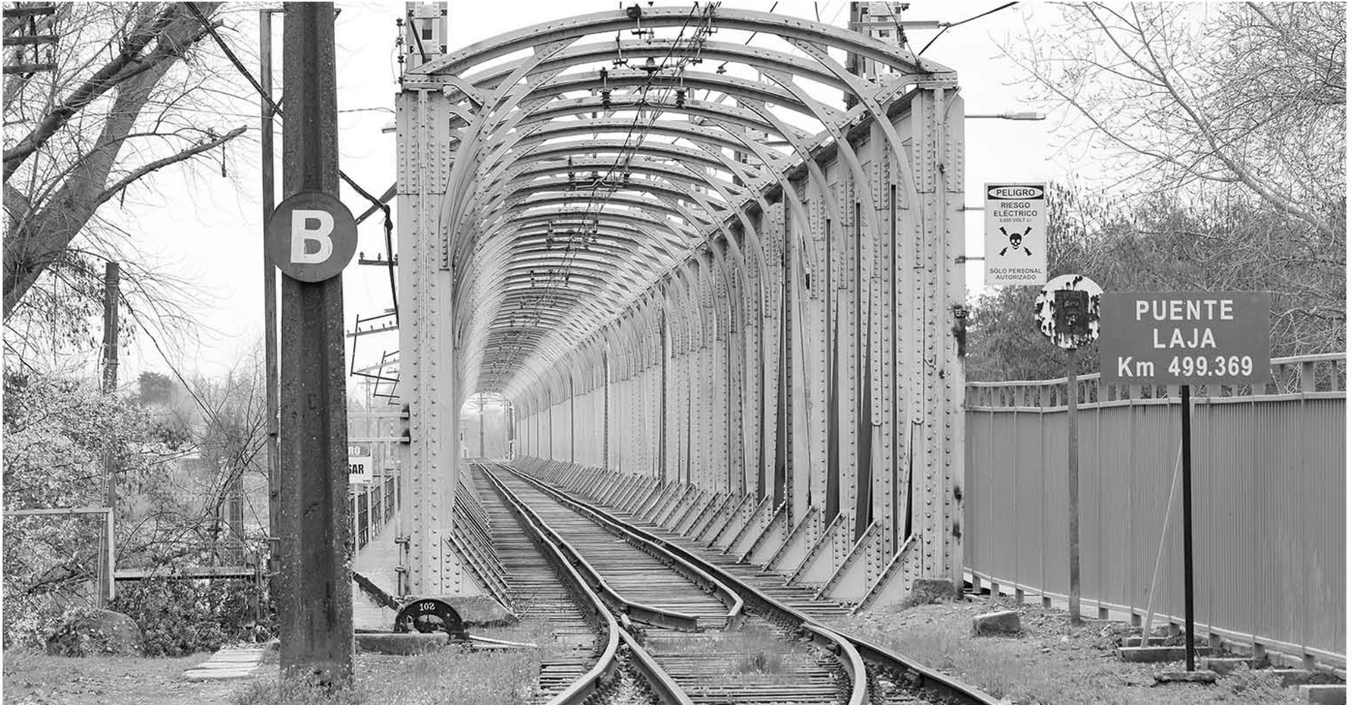
EL PUENTE FERROVIARIO RÍO LAJA ubicado en la comuna de San Rosendo fue construido en 1888.

El Ministerio de Obras Públicas pidió la revisión de trece viaductos a nivel nacional tras el colapso del puente ferroviario sobre el río Cautín y el Cancura en Osorno, siendo incluidas tres estructuras de la región del Biobío.