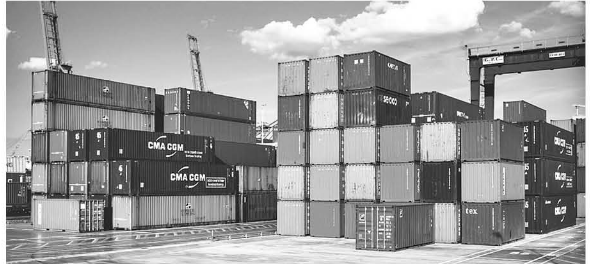
LA GUERRA COMERCIAL entre las dos mayores economías del planeta comenzaría este viernes, cuando Estados Unidos imponga aranceles a una serie de productos de China por un total de US$ 34 mil millones.

Consultado por la preocupación e incertidumbre que pudiese existir con respecto a los “coletazos” que es guerra comercial traería a la zona, sobre todo en las exportaciones, el secretario regional ministerial de economía llamó a la calma, sin dejar de estar pendiente de cómo se va desarrollando este proceso.