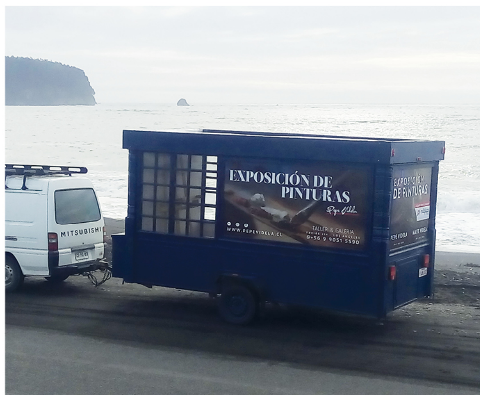
UN IMPORTANTE PROYECTO hecho con financiamiento personal, que puede llegar a ser una revolución en la forma de acercar el arte a la gente.