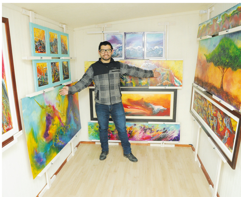
EL CARRO EN SU INTERIOR puede contener pinturas para exposición o simplemente ser un taller para que niños puedan aprender a pintar sin salir de su barrio.

“Fue toda una linda aventura, manejar el carro hasta allá, probamos por primera vez cómo funciona esto y fue un gran éxito la puesta en escena” finalizó el pintor angelino.