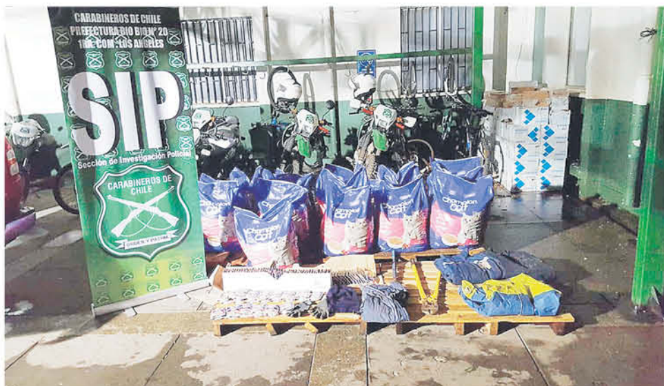
LOS INVOLUCRADOS se dieron a la fuga en diversos puntos de la región luego de cometido el hurto a este camión de carga.

Posterior a la detención y al momento de la formalización, se pudo determinar que los involucrados mantenían antecedentes penales con varias infracciones, entre los que se encontraba tráfico de drogas, robo en lugar no habitado y otros delitos de connotación social.