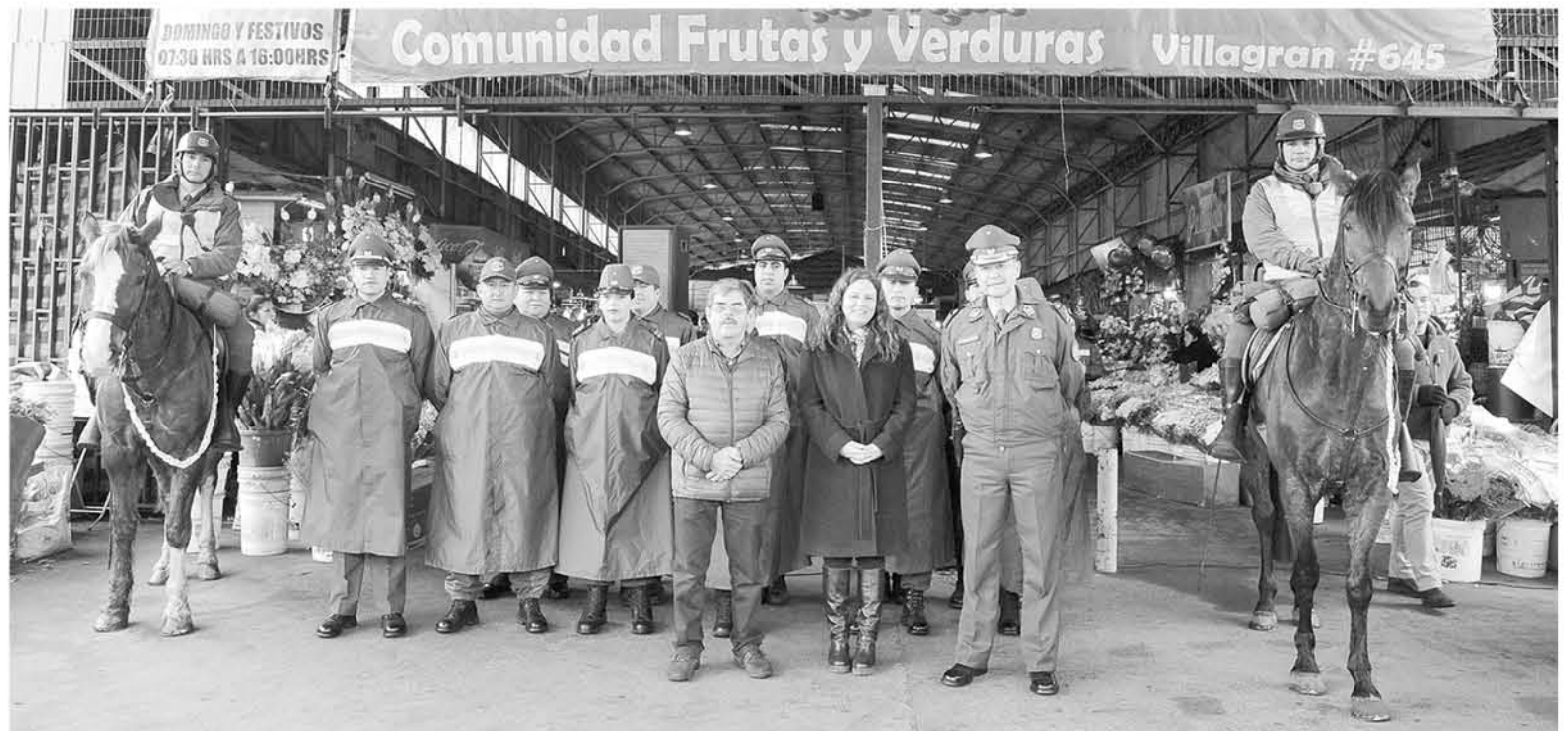
EN LA PUESTA EN MARCHA DE ESTE NUEVO PROGRAMA, el prefecto de Carabineros entregó las instrucciones a los oficiales que trabajarán en garantizar la seguridad ciudadana.

Sobre la reinstalación de un retén móvil fijo en este punto del centro comercial, todavía es materia de evaluación y análisis que prontamente tendría confirmación, ya que se encuentra en reparaciones, sin embargo, en el sector se mantiene el bus de la Prefectura, desde donde operan los funcionarios.