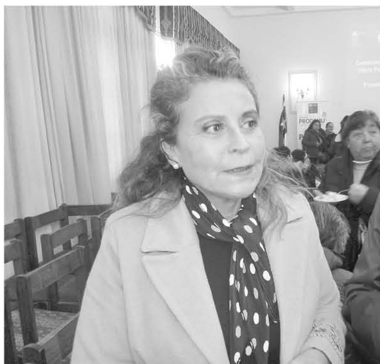
LA DIRECTORA REGIONAL DE PRODEMU aseguró que constantemente deben recurrir a los municipios para así poder llegar a más mujeres con su oferta programática.