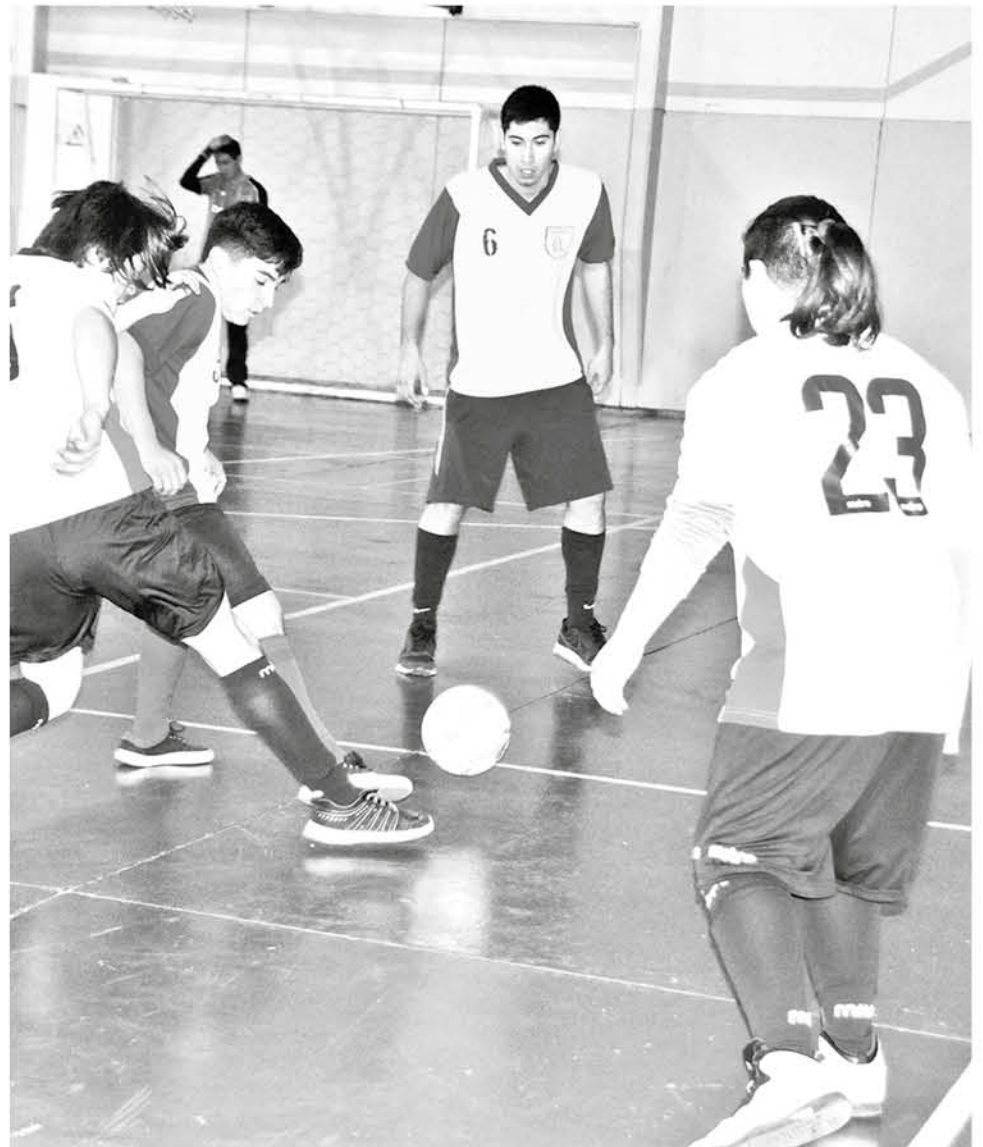
LOS ENTRENADORES COMENTARON que la experiencia es muy alentadora por el compromiso de los chicos con el deporte.

El organizador explicó que el campeonato se lleva realizando desde el 2015, donde fue sólo un día, este año se realizará un campeonato más largo. De cara al próximo año, donde esperan realizar, las olimpiadas por la inclusión, que consistirá en una semana completa de diferentes actividades deportivas. Todo lo anterior bajo la motivación de fomentar estas instancias, para que personas con discapacidad puedan desarrollarse íntegramente. "El deporte con discapacidad en la provincia está muy bajo, muy deteriorado, siempre son ramas inclusivas, donde ciertas personas pueden participar" concluyó.