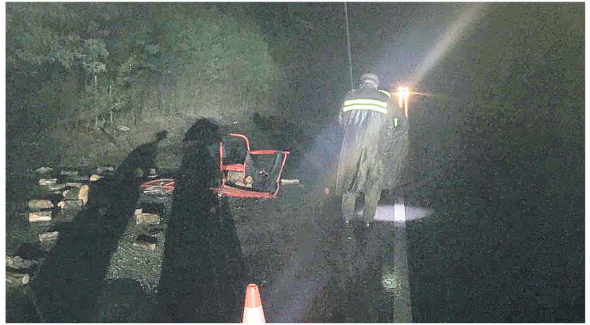
LA INVESTIGACIÓN de este caso busca determinar la responsabilidad del conductor en este complejo caso.

En el lugar del accidente, durante horas posteriores trabajó personal especializado de la SIAT Biobío a petición del Ministerio Público, para determinar las razones de este