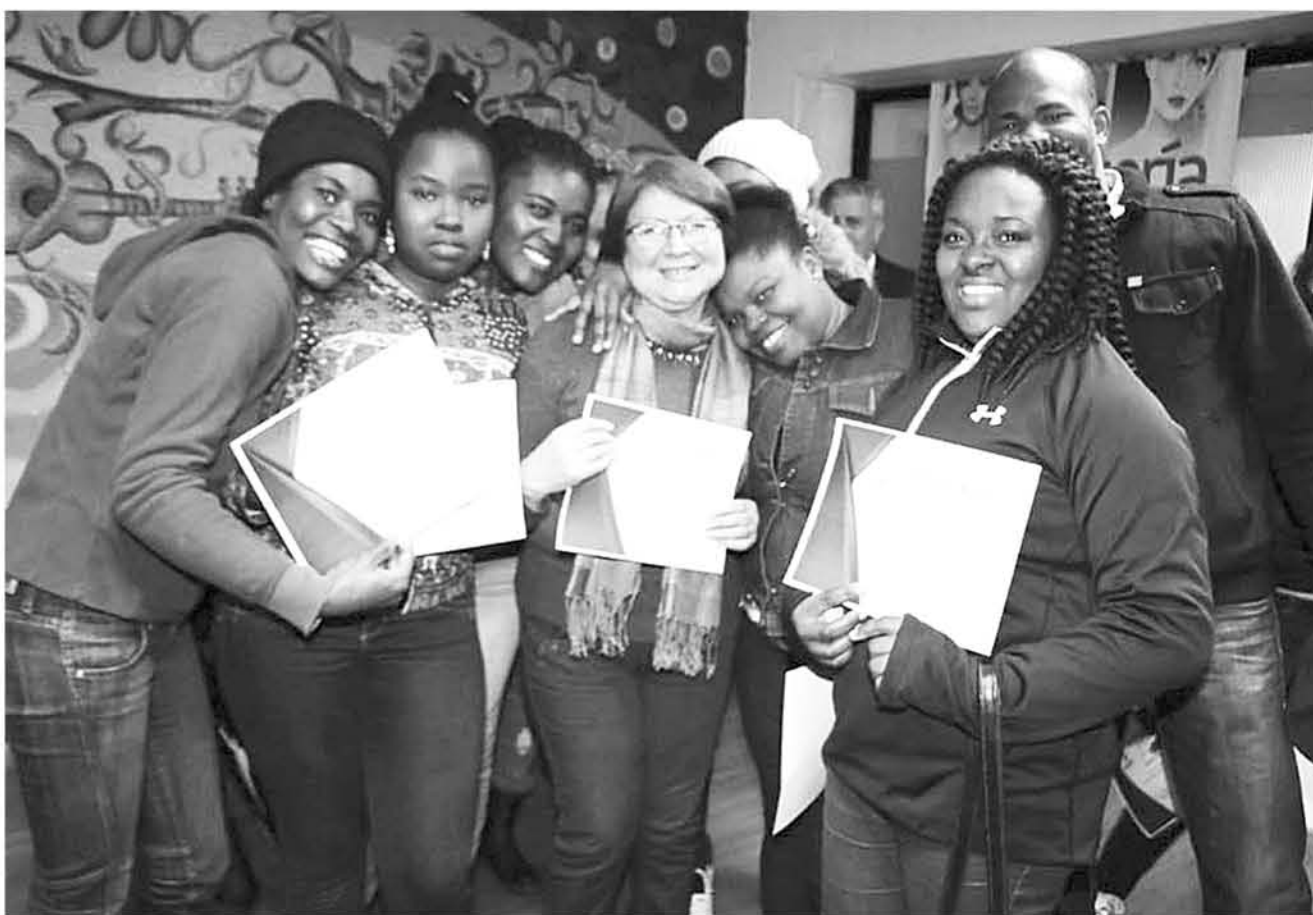
LAS PARTICIPANTES del curso se mostraron muy contentas durante la ceremonia de certificación.

El Centro Integral de la Mujer, ya se encuentra trabajando en el desarrollo de nuevos cursos dirigidos a mujeres migrantes, durante el transcurso del segundo semestre de este año.