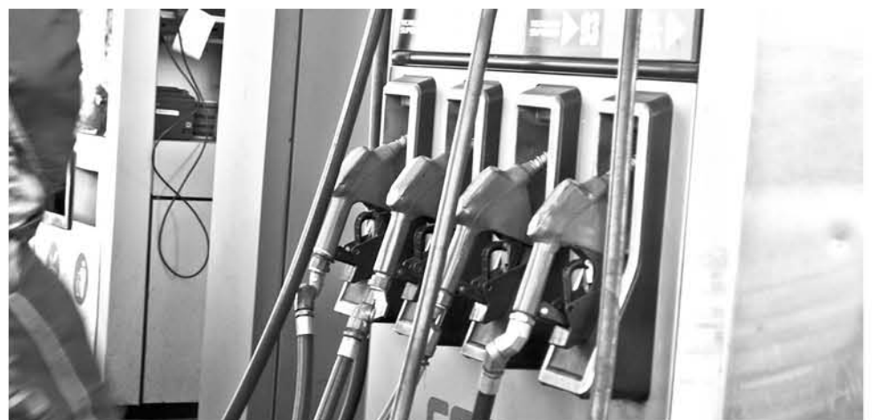
LOS DERIVADOS del petróleo tendrán una variación promedio de $2,05 pesos por litro.

Es así como los precios de la empresa y sus variaciones consideran la aplicación de un tipo de cambio contractual promedio de 5 días para sus clientes de 644,09 $/USD, mayor en 3,03 $/USD respecto del aplicado para el cálculo de precios de la semana anterior.