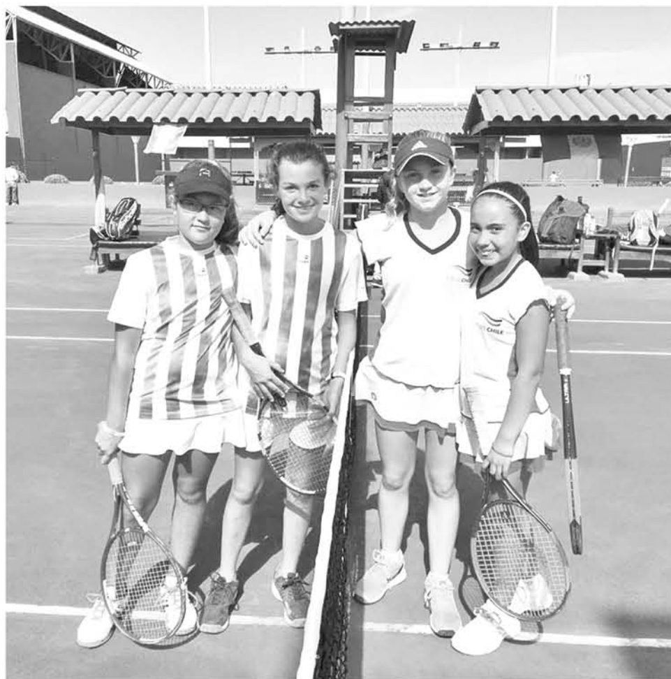
PESE A CAER EN DOBLES, las chilenas lograron imponerse a las trasandinas, para quedarse con el título.