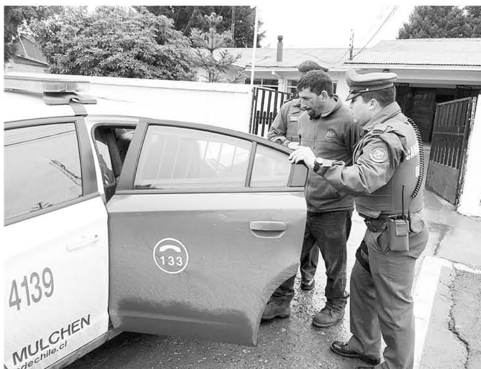
LA LEÑA fue devuelta a su dueño luego de este ilícito y los responsables quedaron en detención para una previa investigación de los hechos.