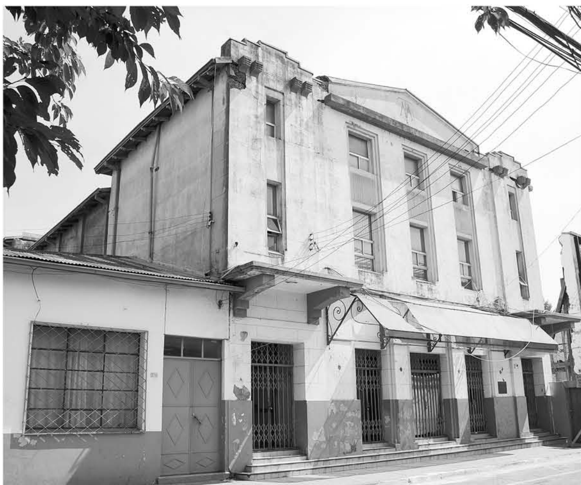
EL PROGRAMA apunta a preservar la riqueza patrimonial de las ciudades o pueblos.

La iniciativa busca formar a 500 personas en temáticas relativas a la recuperación de la identidad urbana de una ciudad.