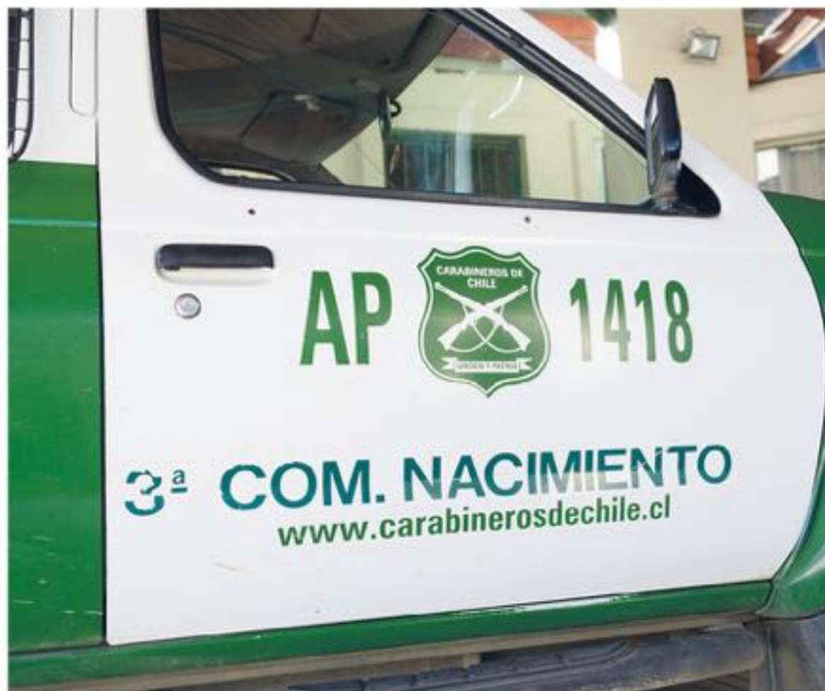
EL ATAQUE QUEDÓ AL DESCUBIERTO en la vía pública cuando el hombre se mantenía con la herida cortopunzante.

"Este hombre actualmente se mantiene fuera de riesgo vital y ha sido un paciente bastante complicado ya que intentó en dos oportunidades escapar del hospital y luego de esto el doctor decidió enviarlo al hospital de Los Ángeles", explicó el comandante de Carabineros de esta comuna.