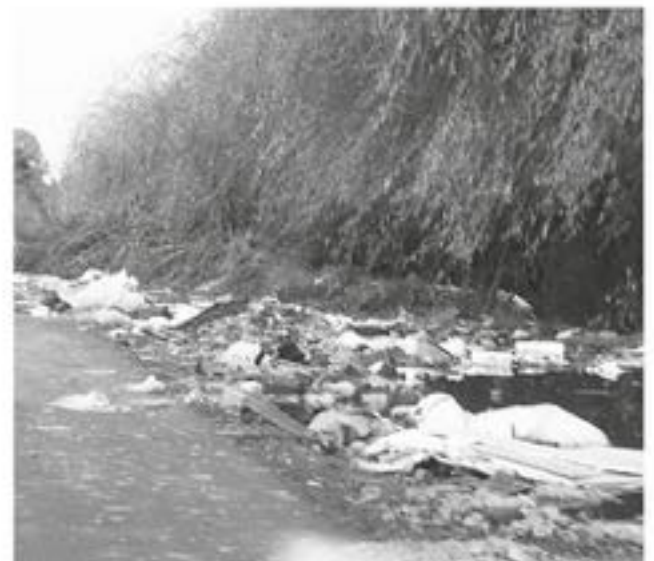
EN DISTINTOS PUNTOS de la comuna de Los Ángeles se pueden observar espacios donde las personas acuden a botar basura de manera ilegal.

Finalmente, recordó que quienes son infraccionados por este tema reciben una multa que va de las 3 a 5 Unidades Tributarias Mensuales ($143.000 a 238 mil pesos), faltas que son revisadas por el Juzgado de Policía Local correspondiente.