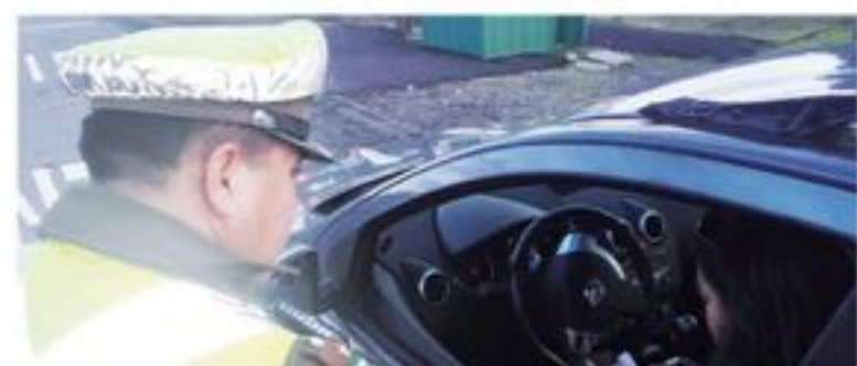
LOS ÍNDICES DE INCIDENTES vehiculares a pesar del despliegue de Carabineros fueron un total de 23, donde se encuentran atropellos, choques, colisiones y otros sucesos donde corre peligro la vida de los ocupantes.

se experimentó una disminución de incidentes vehiculares en un -4,2% en comparación del año 2017, donde se