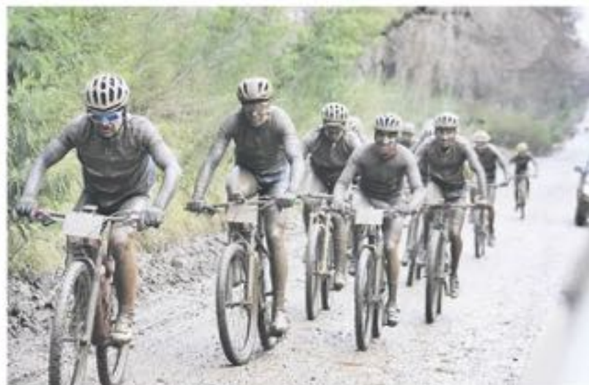
EL CICLISMO DE MONTAÑA presenta un gran riesgo para los deportistas, al pasar por caminos angostos, descensos y otros.