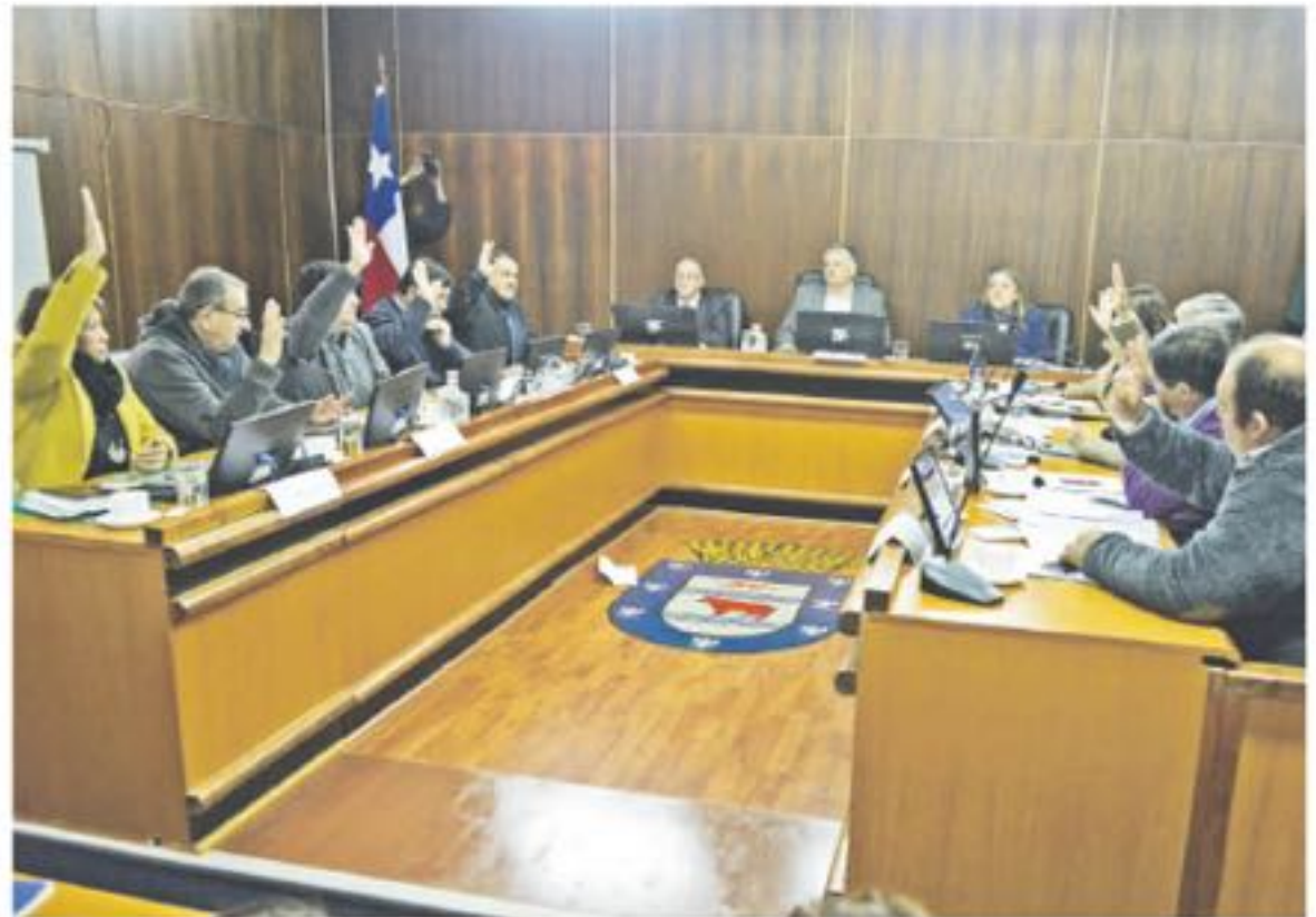
LOS CONCEJALES de Los Ángeles votaron a favor de adjudicar la concesión de la mantención de las áreas verdes a la empresa que anteriormente había sido nominada en primer lugar, tras el dictamen del Tribunal especializado de Compras Públicas.

Jara expuso un extracto de la sentencia entregada a las demandas realizada por Núcleo contra la Municipalidad, donde se indicó lo siguiente: "Que conforme con los fundamentos y razonamientos