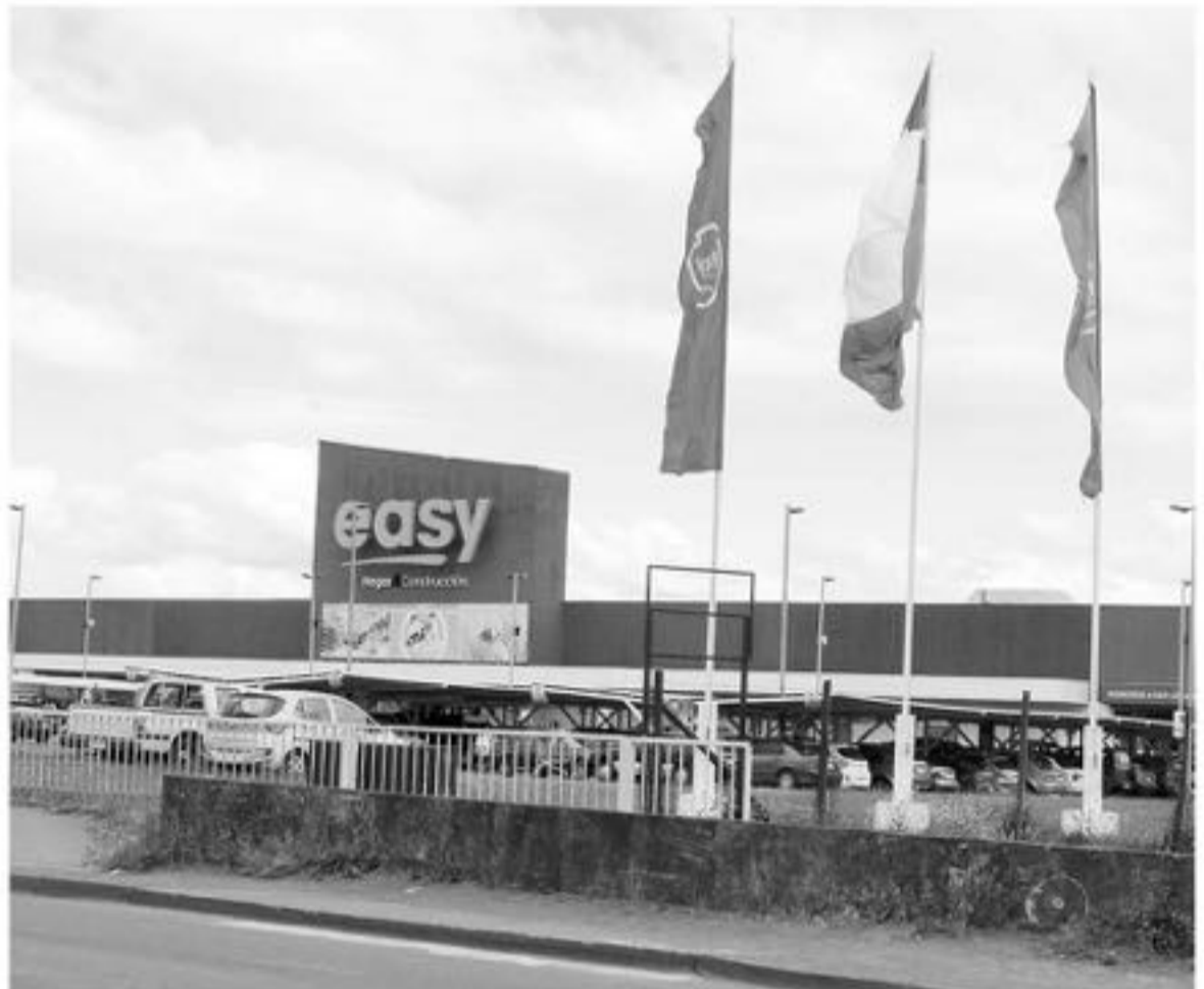
EL SUJETO con domicilio en Temuco realizó estos actos luego de robar un alicate avaluado en 13 mil pesos.