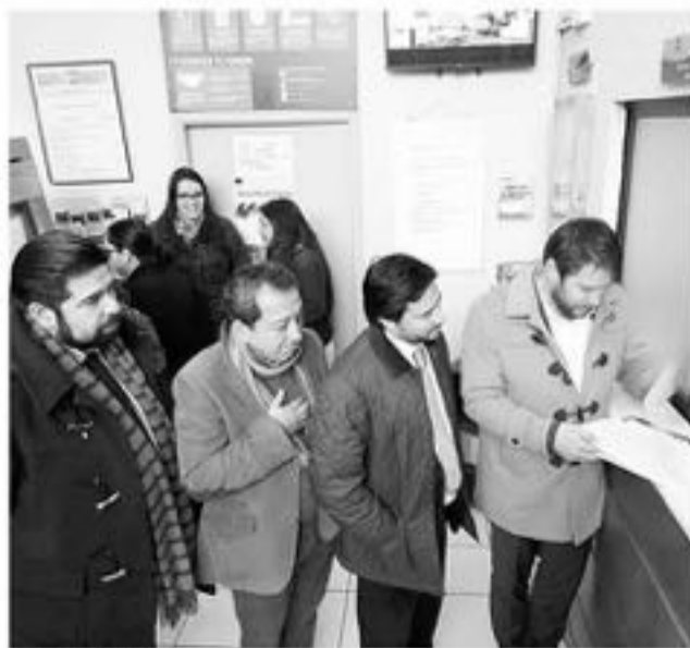
LA QUERRELLA se suma a una de las tantas ya presentadas a nivel provincial por este delito que en esta ocasión podría haber terminado con la vida de una persona.

En esta instancia el alcalde de Laja y San Rosendo, junto con el seremi de Energía y representantes de Frontel presentaron documento para encontrar a los responsables.