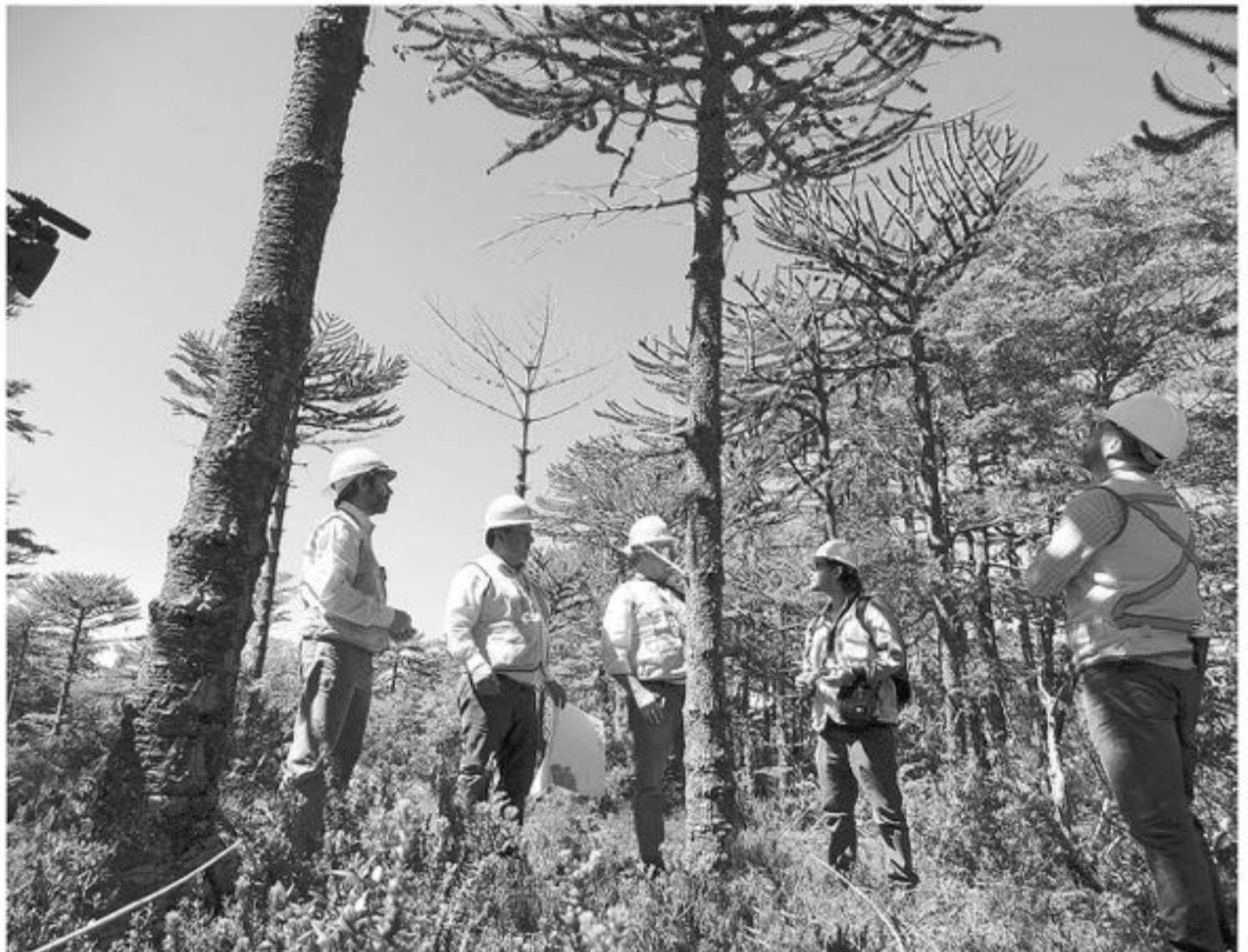
UNA DE LAS HIPÓTESIS que manejan los expertos es el "estrés ambiental" que predispone a estos ejemplares a la acción de agentes.

fue introducido en estas zonas hace muchos años pero llama la atención que un organismo como éste, que habita en el suelo, se encuentre en zonas altas con bosque nativo como es en la Cordillera de Nahuelbuta, indicando una posibilidad que el patógeno haya diseminado por la actividad humana en este tipo de zonas (tránsito de personas y vehículos)", agrega, Eugenio Sanfuentes.