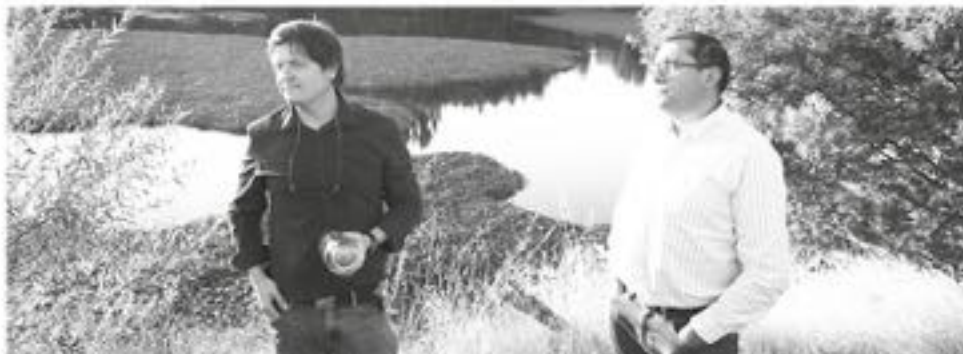
SEGÚN ANCALI, la inundación de terrenos adyacentes a sus instalaciones ocasionaría el derrame de purines contenidos en las piscinas que maneja la lechera (Foto archivo).

"A raíz de esta sentencia de la Corte Suprema, se evalúan nuevas acciones en contra del proyecto. Pues la decisión de la Corte Suprema cierra un camino directo para revisar la evaluación ambiental. Es una decisión formal, y los aspectos de fondo siguen vigentes como motivo de controversia", agrega la minuta.