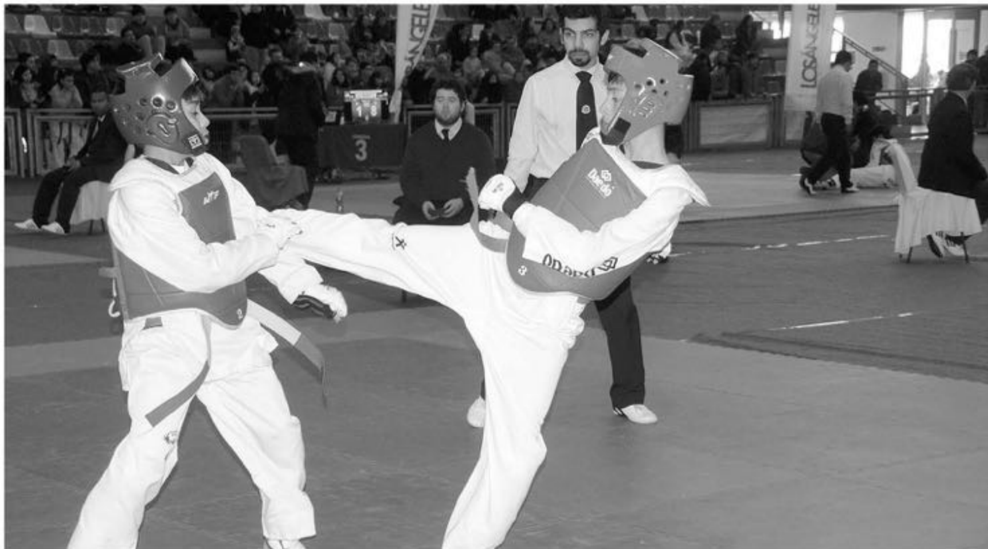
EN LA DISCIPLINA DESTACAN las técnicas de patadas con salto y la nula utilización de armas.

El sábado 23 de junio, la ciudad fue sede de uno de los eventos más importante del arte marcial.