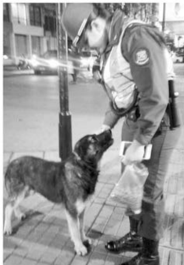
EL ACTO DE ESTA OFICIAL ha sido reconocida por una parte importante de ciudadanos.

Hasta el cierre de esta edición La Tribuna, intentó comunicarse con la oficial para conocer las razones de este noble gesto.