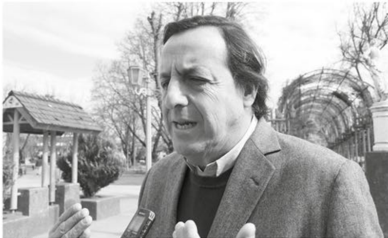
SEGÚN PÉREZ VARELA, nadie en la UDI ha propuesto renegar de la figura de Pinochet ante la redacción de una nueva declaración de principios por parte del partido.

senador UDI circunscripción Biobío Cordillera.