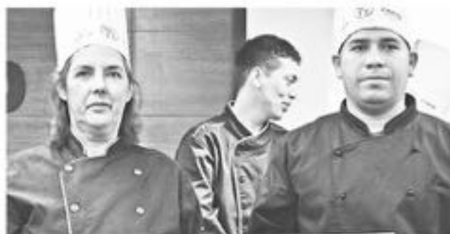
EL SEGUNDO LUGAR fue para la dupla de "Bagual", quienes se adjudicaron un galvano de participación y otros estímulos en el área técnica.