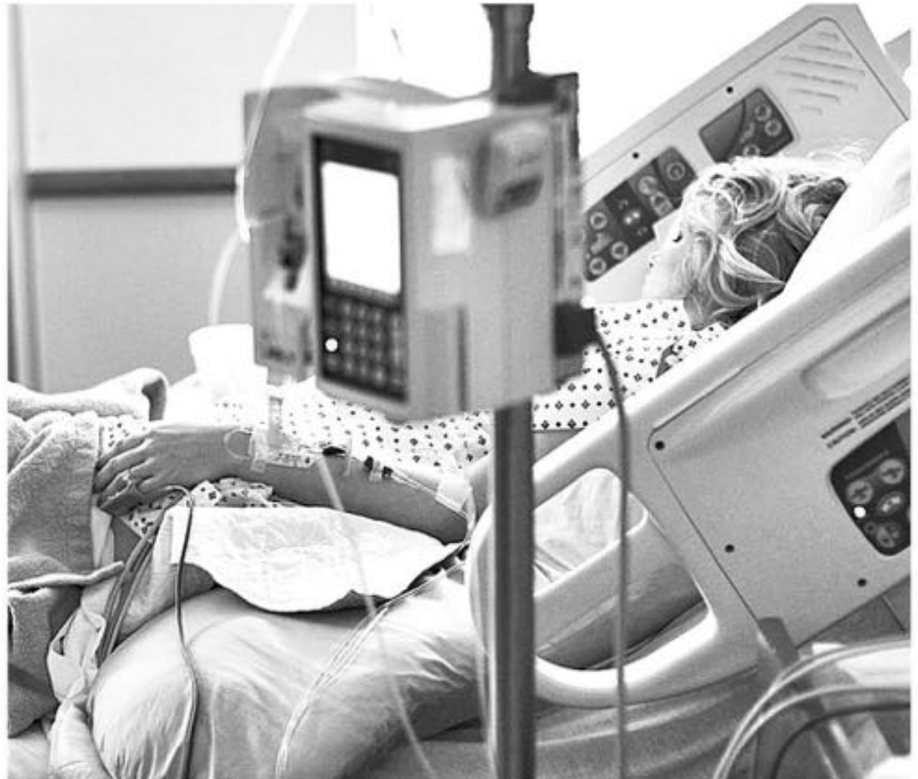
ESTE PROCEDIMIENTO debe ser realizado por el paciente o tutor una vez al año, para así mantenerse en este registro.

Con respecto a si existiese un caso de incumplimiento de sus derechos por parte de alguna entidad eléctrica, el director regional de la Superintendencia, enfatizó que "esto es importante, destacar que la asociación de empresas de distribución ya habían apoyado este tipo de gestiones, pero una vez que se firma el Decreto Supremo por parte de la ministra de Energía, lo que tenemos también son derechos para