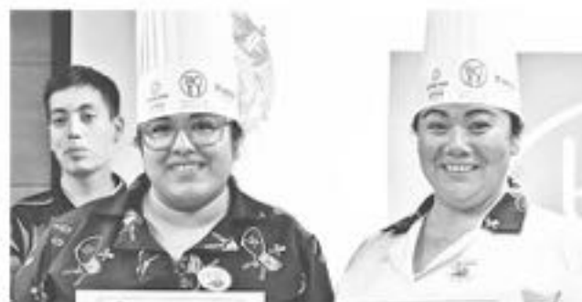
EL TERCER LUGAR fue para restaurant "El Rancho del Abuelo", quienes tradicionalmente ofrecen la pollona en su carta gastronómica.