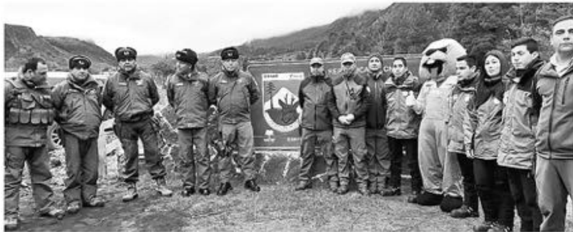
TODO DISPUESTO para esperar la llegada de visitantes en Parque Nacional Laguna Laja.

Ya se encuentra todo dispuesto para que el Parque Nacional Laguna del Laja pueda recibir con el mejor servicio de seguridad al público que quiera visitar la reserva. Así lo confirmaron instituciones a cargo de la administración y la seguridad Conaf y Carabineros, quienes presentaron la dotación de apoyo que trabajará