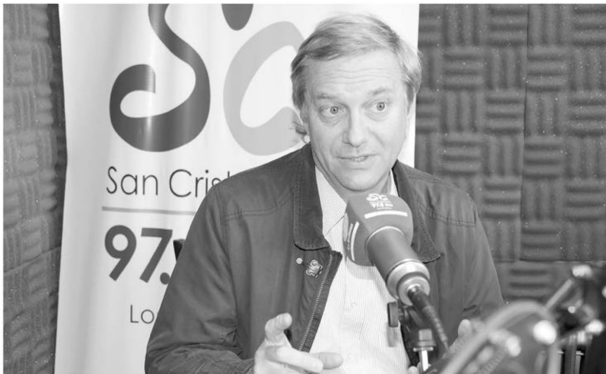
JOSÉ ANTONIO KAST conversó en extenso con Radio San Cristóbal, acompañado por el diputado Cristóbal Urruticoechea y el concejal de Laja José Serra.

El ex candidato presidencial sostuvo que el actual gobierno del Presidente es de "reconstrucción" en lo social y económico, acusando a la ex mandataria de haber dejado al país "postrado" en estas materias y otras.