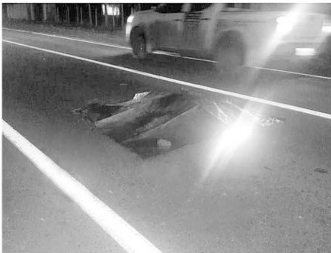
EL HOMBRE DE 45 AÑOS FALLECIÓ mientras se dirigía desde una cancha hasta su casa pasada las 20:00 horas.

Según se ha podido conocer, por personal de Carabineros, el conductor transitaba, de manera correcta, sin ningún indicio de actos que atentaran a la buena conducción en la carretera.