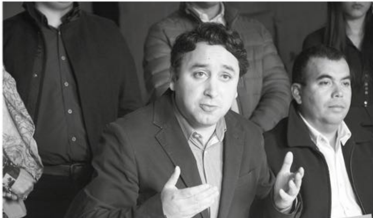
EL PRESIDENTE DISTRITAL de la UDI en Biobío respaldó la redacción de una nueva carta de principios, afirmando que la UDI es un partido "que va más allá de la figura de Augusto Pinochet".