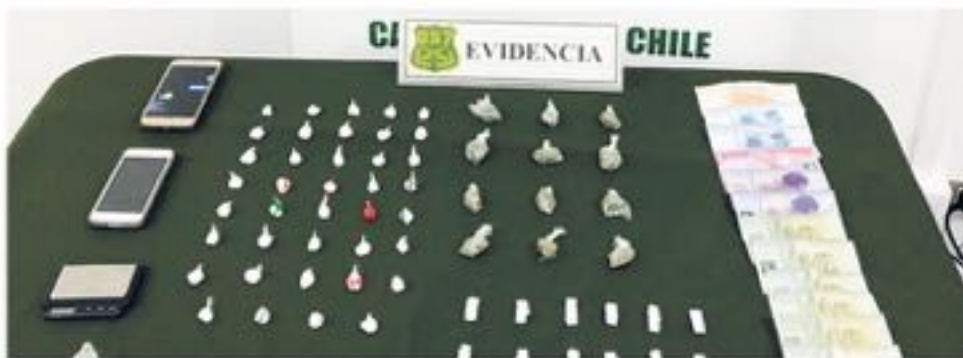
TRES PERSONAS DETENIDAS y formalizadas por tráfico de drogas.

Por medio de este operativo, se logró incautar un total de 1500 dosis de droga que era comercializada en el sector.