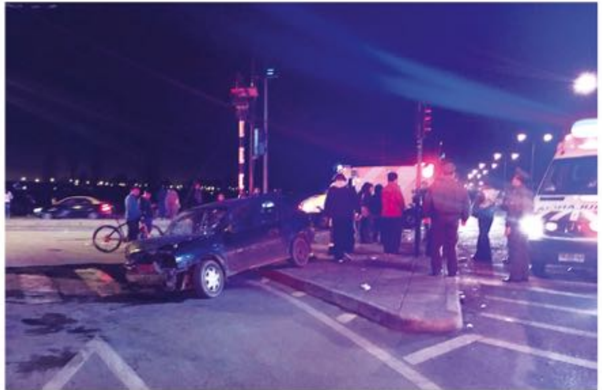
SEGÚN EL RELATO DE TESTIGOS, el accidente se originó por un semáforo en mal estado.

En el lugar, de igual manera trabajó personal de Carabineros, quienes controlaron la situación del tránsito vehicular, debido a la considerable congestión vehicular que se produjo en el lugar.