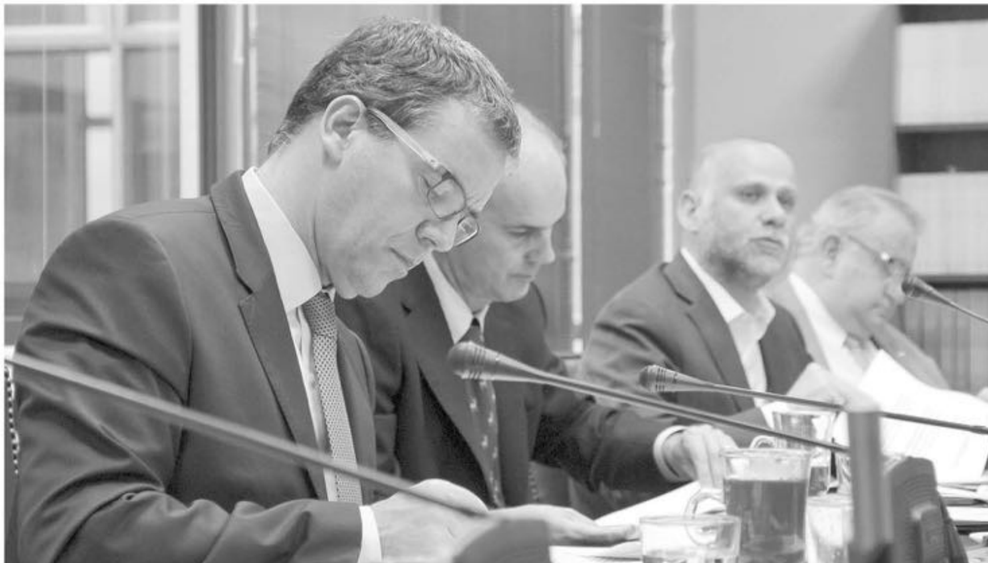
EL SENADOR FELIPE HARBOE ha sido uno de los más críticos luego del ataque informático sufrido por el Banco de Chile hace algunas semanas.

En varios frentes simultáneos trabaja el Senado en orden a recoger las lecciones de los últimos ataques informáticos a entidades financieras. Además del trabajo contingente de las Comisiones de Economía y Hacienda, en julio la Comisión de Defensa y Ciberseguridad recibirá al ministro del Interior.