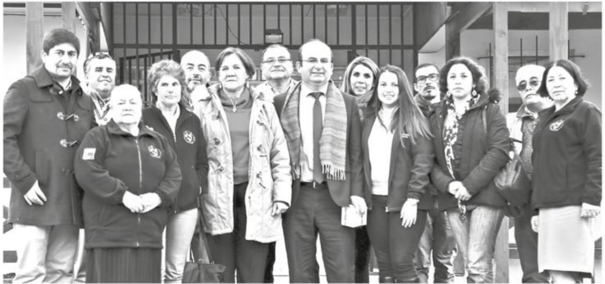
SE ESPERA QUE DENTRO DE 2 a 3 años se pueda contar con un Cesfam de Canteras reestructurado.