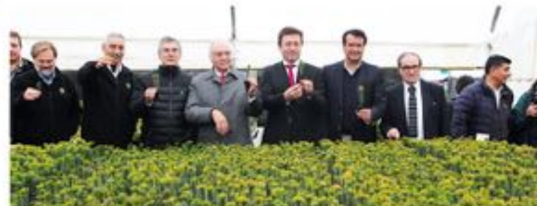
ESTE LOGRO COLABORATIVO entre instituciones públicas y empresa privada, generará la opción para conservar la especie nativa en peligro.