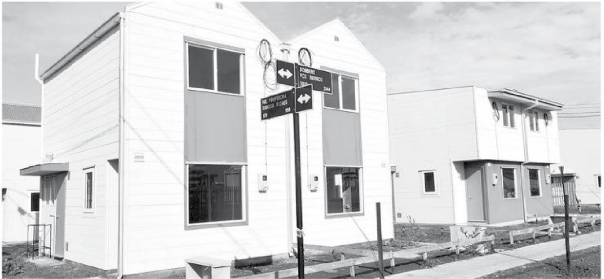
DE LOS SUBSIDIOS OTORGADOS por el Minvu, actualmente se encuentran cuatro en etapa de postulaciones.

Desde la Seremi de Vivienda y Urbanismo de Biobío, llaman a los habitantes a no perderse la oportunidad de postular a los subsidios habitacionales que todavía se encuentran vigentes.