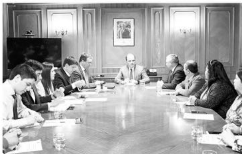
SEGÚN EL SENADOR HARBOE el ministro Monckeberg se comprometió a informar los resultados de las postulaciones al subsidio en la primera semana de julio.

Representantes del comité de vivienda Portal acompañados por el alcalde de dicha comuna, Javier Melo, y parlamentarios por la zona, se reunieron con el ministro de la Vivienda, Cristián Monckeberg.