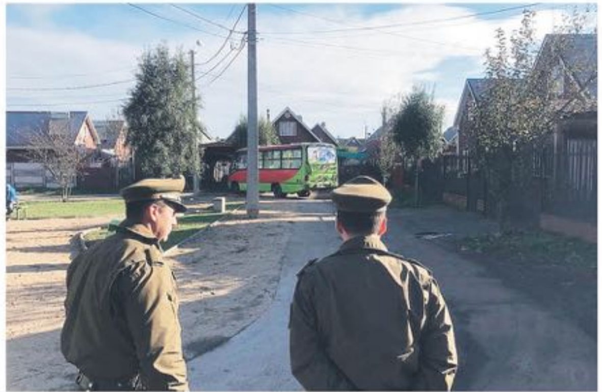
EL CONDUCTOR INVOLUCRADO en este caso, se mantiene en libertad en espera del inicio de este proceso investigativo.

Debido a esto, personal de Carabineros, específicamente personal de la SIAT Biobío, se mantiene realizando una investigación para determinar la responsabilidad del conductor en el caso, que se generó, específicamente en calle Toronto con Cartes.