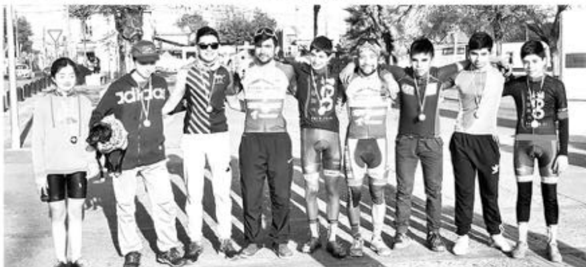
JÓVENES LUCIENDO sus medallas tras recorrer los 64 km en San Rosendo.