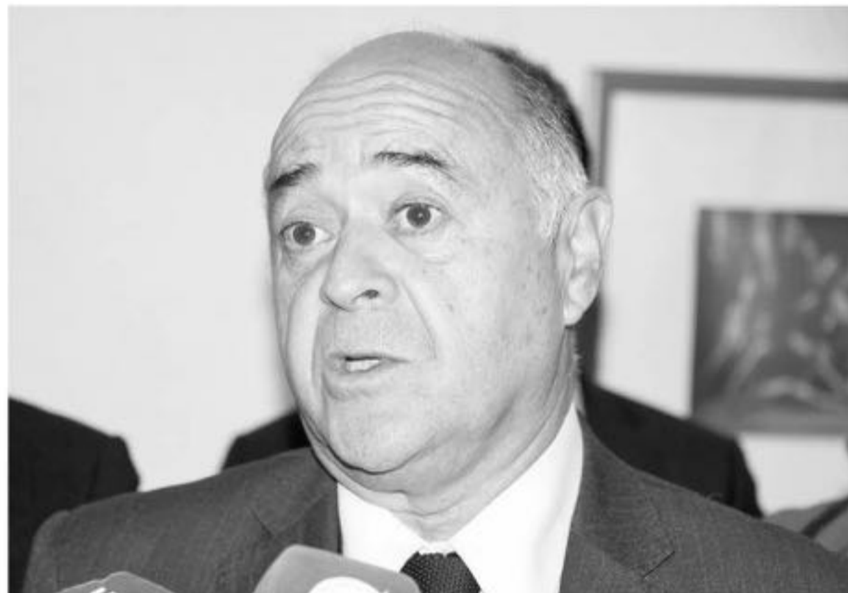
EL INTENDENTE SE REFIRIÓ sobre sus relaciones con el diputado Urruticoechea previo a una ceremonia de entrega de computadores de la que participó este lunes en el Teatro de Los Ángeles.

Dicha pugna al interior del oficialismo en la región fue analizada en el comité político regional que encabeza precisamente el intendente del Biobío, instancia en la cual las diferencias fueron dadas por superadas tanto por la UDI como por Renovación Nacional.