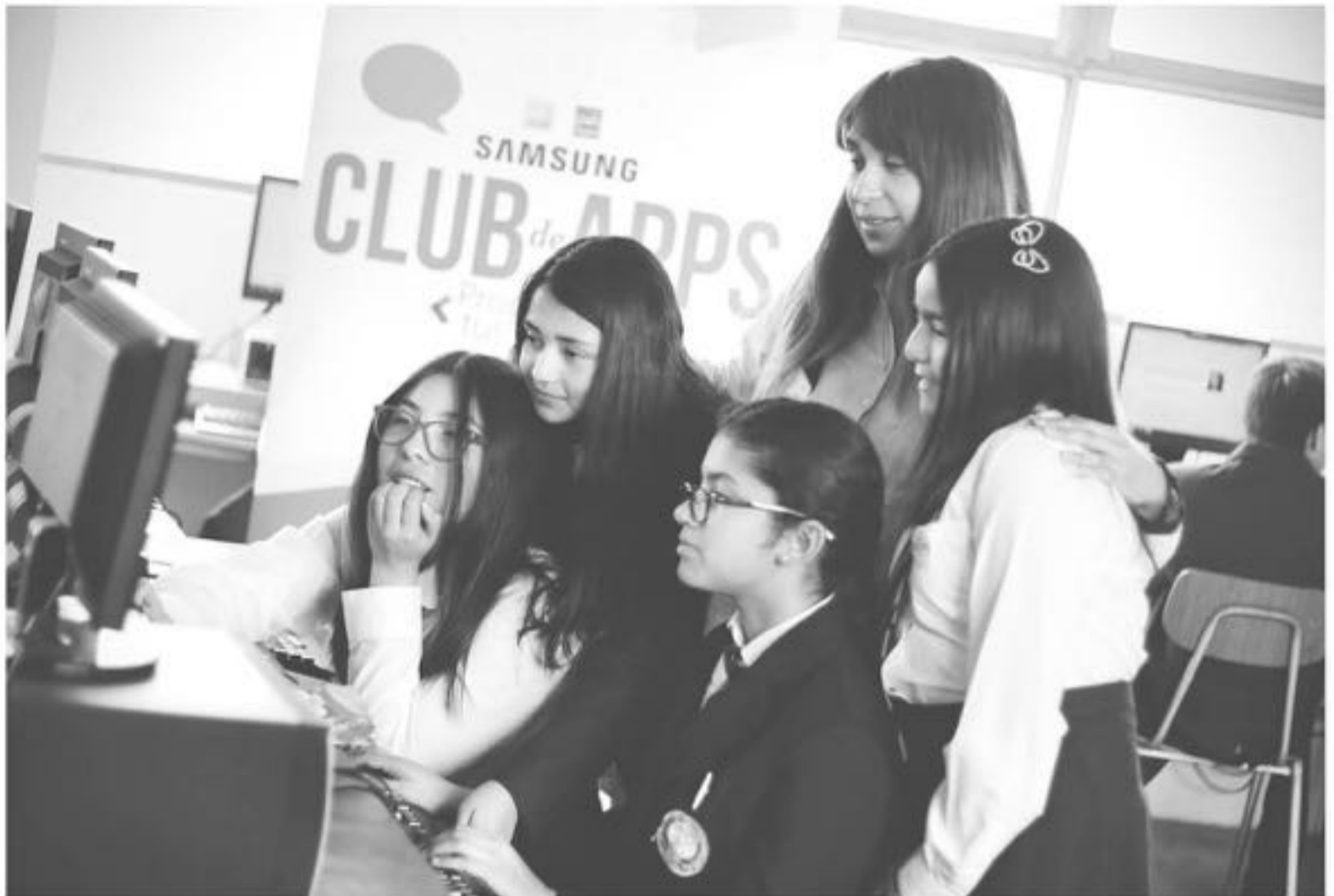
CLUBES de apps.

Cumplida la primera mitad del año, y teniendo en cuenta que el objetivo de ambas organizaciones es beneficiar por lo menos a tres mil estudiantes durante este año, se puede observar que el éxito de los clubes ha sido mucho más alto de lo esperado, ya que se ha cumplido el 71% de la meta anual. Este resultado tiene especial mérito, ya