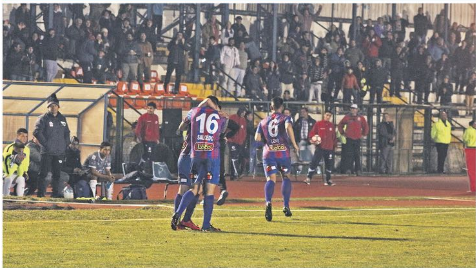
PESE AL EMPATE, desde la "azulgrana" no ocultaron su molestia por el resultado.