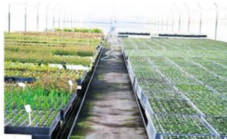
EL VIVERO DOUGLAS, donde se desarrolla la iniciativa de conservación está ubicado en la comuna de Yumbel y es reconocido por su aporte tanto a la reforestación como la reconstrucción de bosques.

Con la puesta en marcha de la migración asistida para la conservación de la araucaria, logro colaborativo entre Infor y CMPC, se pretende terminar con la posibilidad de extinción de esta especie nativa presente en las regiones del sur de Chile.