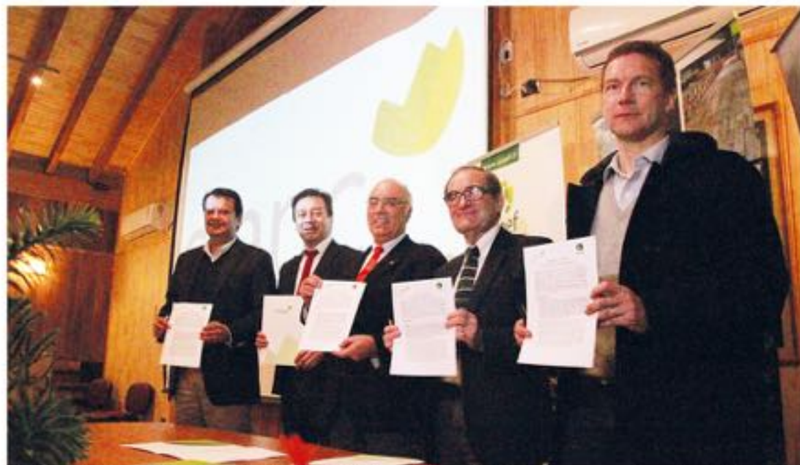
FIRMA DEL CONVENIO DE COLABORACIÓN entre Infor y CMPC para la conservación ex situ de la diversidad genética de la araucaria araucana.