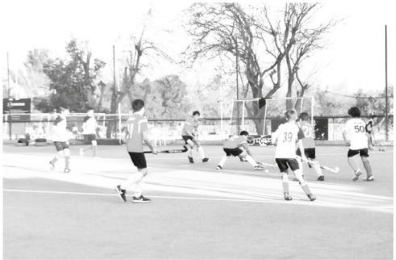
EL CLUB TUVO una notable presentación en la primera parte del año.

"Como club hemos ido creciendo y planteando nuevos objetivos deportivos, que poco a poco se han ido concretando. En primera instancia llevar a cabo la primera fecha de la Liga Zona sur de damas y varones en nuestra ciudad, el