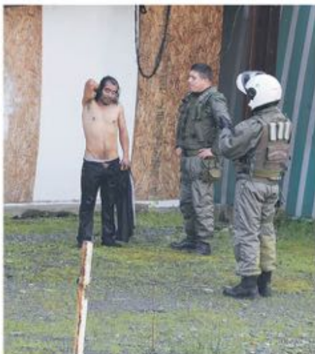
A PESAR DE LA DURA CAÍDA, el hombre resultó sin lesiones siendo trasladado hasta su casa, para investigar las razones de sus actos.

Se trató de una persona de aproximadamente 40 años, que se precipitó al caudal a vista y paciencia de todos los peatones, quienes fueron testigos presenciales de sus actos.