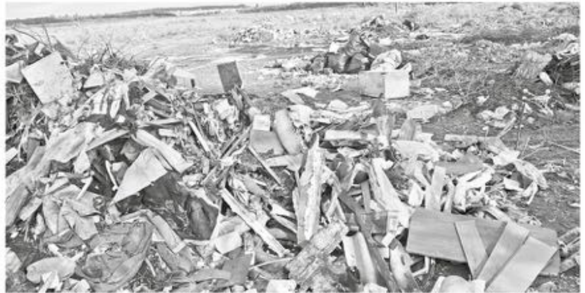
TONELADAS DE BASURA pueden observarse en estos predios ubicados en las proximidades a villa Génesis.