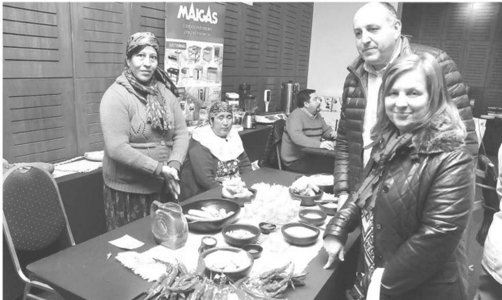
EL PLAZO DE POSTULACIÓN es hasta el 15 de julio. Las bases del concurso y la postulación en línea están disponibles en sernatur.cl/masvalorturistico (Foto de contexto)

En su cuarta versión, el concurso Más Valor Turístico distinguirá productos de enoturismo y de turismo gastronómico que sean innovadores y que aporten a la diversificación de experiencias turísticas.