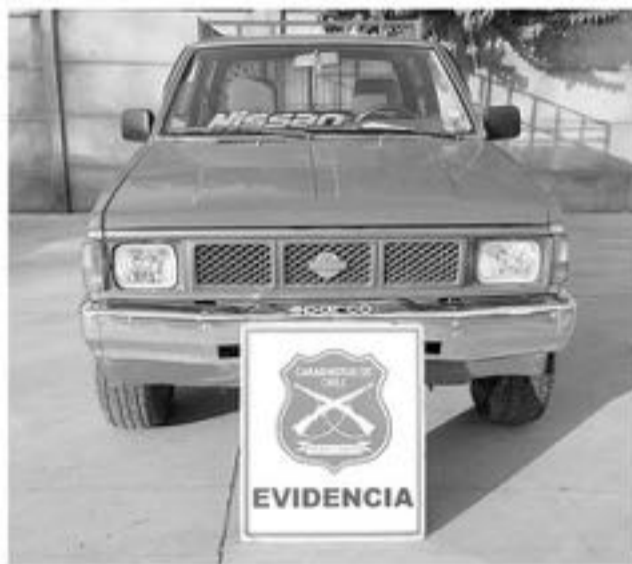
LA CAMIONETA habría sido robada desde la comuna de Mulchén cuando su dueño la dejó estacionada.

Durante una fiscalización, el involucrado no pudo justificar la procedencia del vehículo.