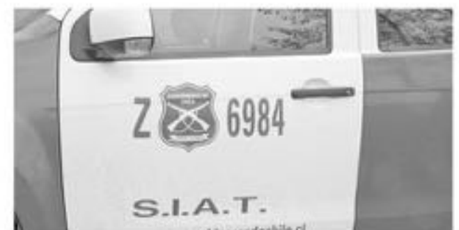
LAS INFRACCIONES se triplicaron entre los días miércoles y viernes.

De igual manera se realizaron fiscalizaciones a los buses que se desplazan a diversos lugares de la región donde se exige el uso de cinturón de seguridad.