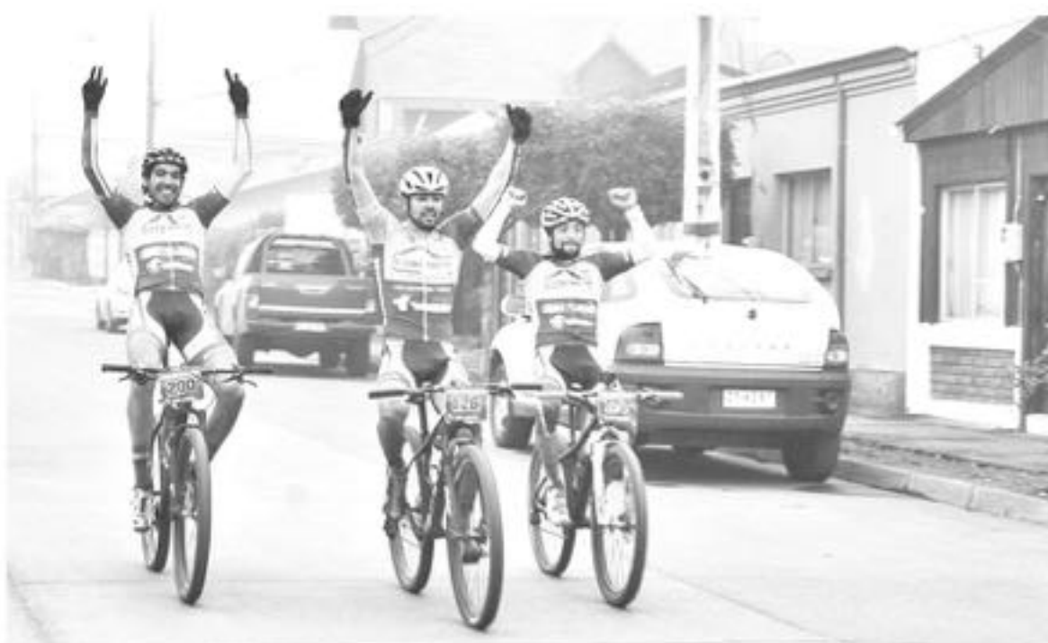
EL EQUIPO LOGRÓ la victoria en la zona norte, donde dieron lo mejor de cada uno.

Los talleres de ciclismo gratuitos son los días martes y jueves de 5 a 7 en el Polideportivo de Los Ángeles, para jóvenes entre 10 y 17 años.