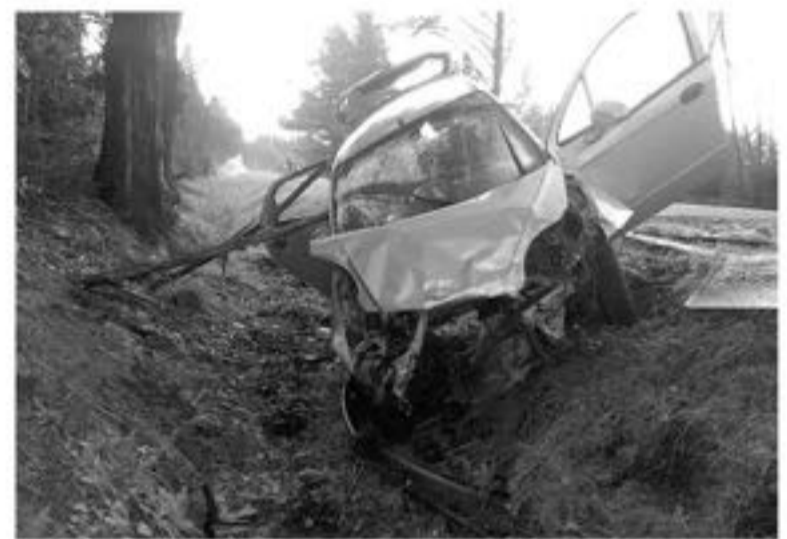
DURANTE HORAS de esta tarde se pudo corroborar que la familia se mantiene fuera de riesgo vital.

Hay que destacar que la tarde del lunes, se pudo corroborar, por medio de personal de Carabineros, que esta familia se mantiene fuera de peligro,