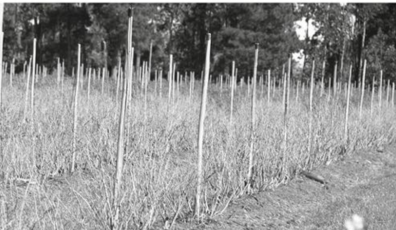
DURANTE ESTE MIÉRCOLES, profesionales de la CNR se reunieron con pequeños agricultores de las comunas de Santa Bárbara, Mulchén y Quilaco.