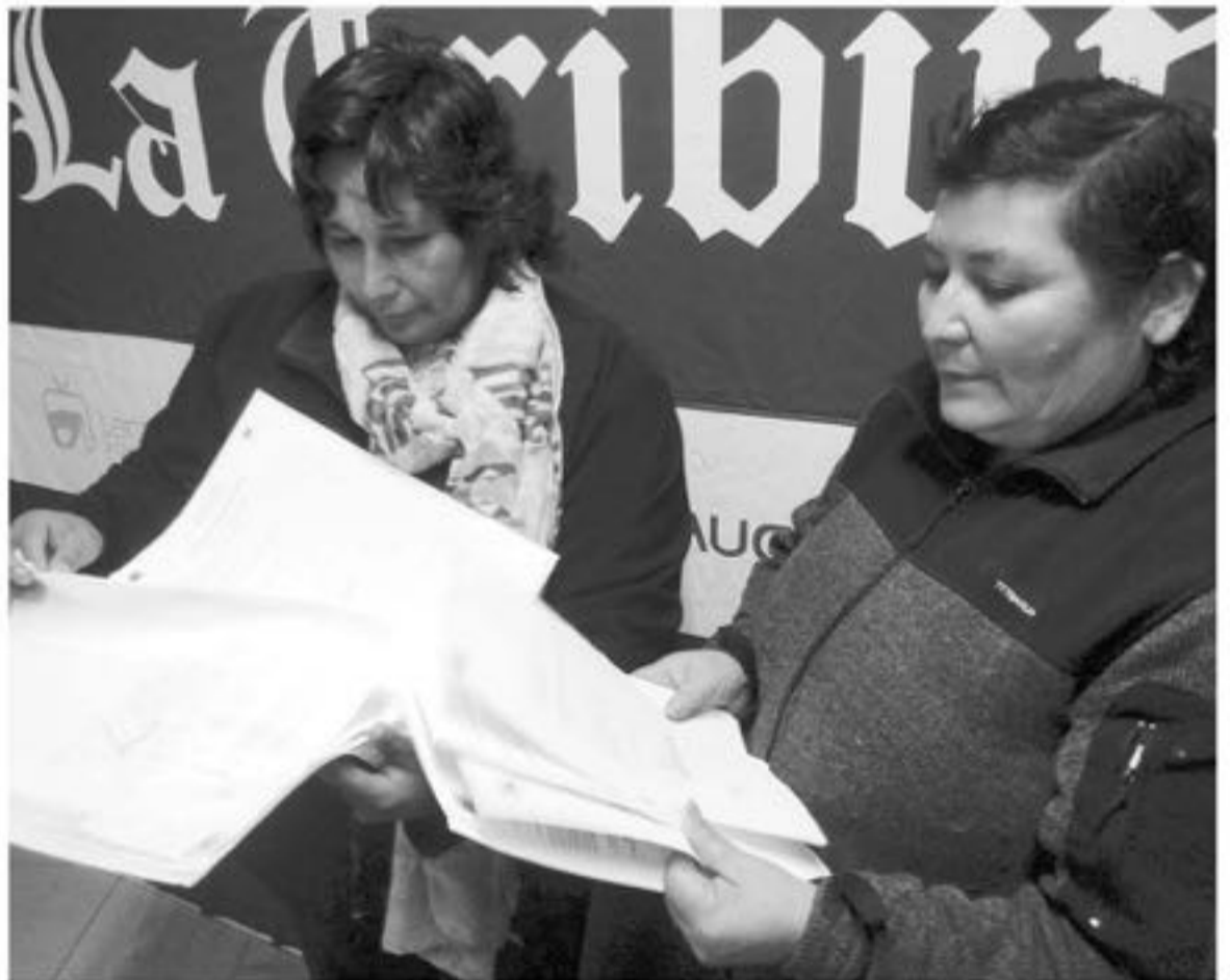
DIRIGENTAS DE LA JUNTA DE VECINOS Altos de Futaleufú de Laja comentaron que el dinero que falta por rendir al GORE asciende a 1 millón 600 mil pesos.

"Nuestra meta era postular a alarmas domiciliarias y extintores, que eran los proyectos que nos