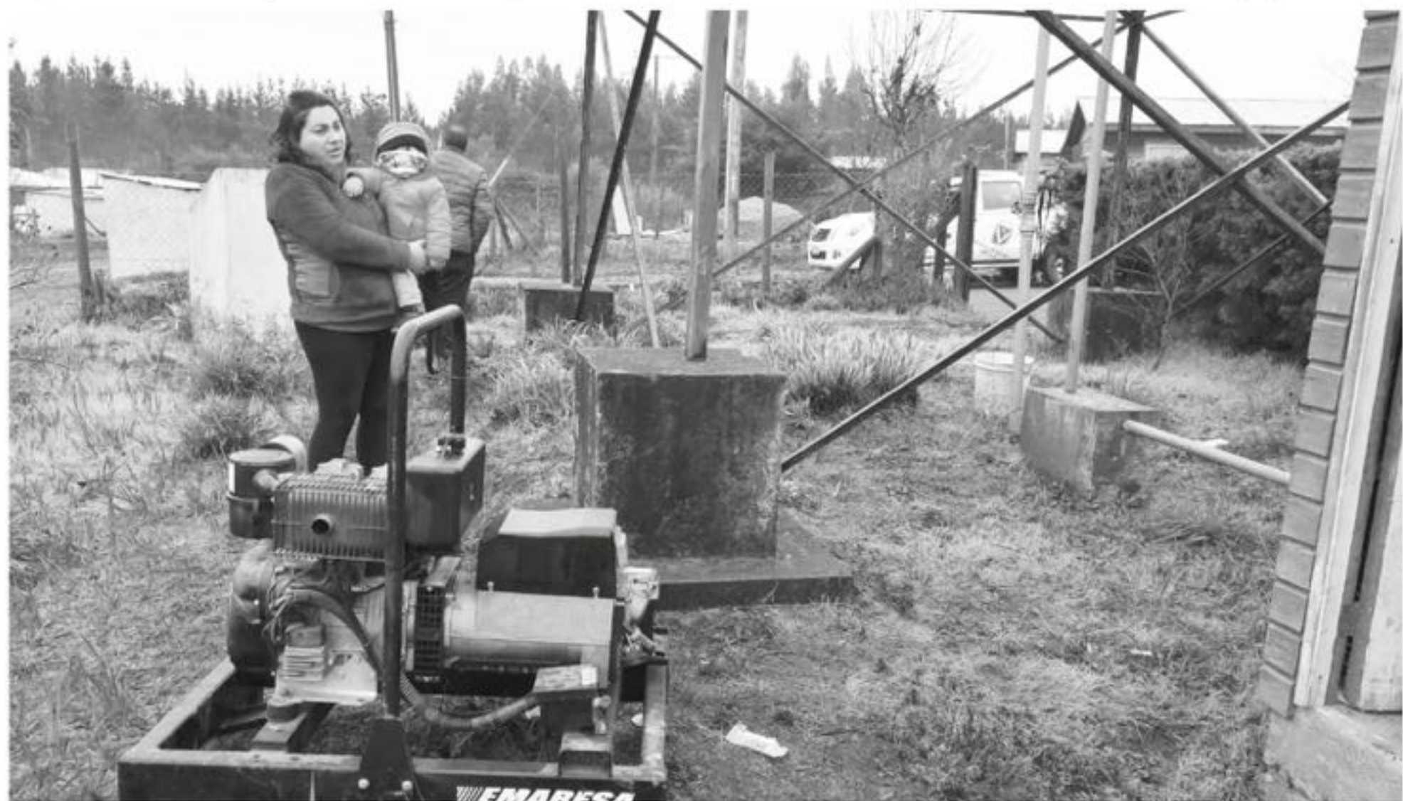
EL MUNICIPIO DEBIÓ APOYAR con generadores a las familias afectadas por la falta de luz, para que pudieran hacer funcionar sus sistemas de abastecimiento de agua (Cedida).

"Se entiende que el alcalde hubiese querido que nosotros siguiéramos trabajando un poco más, pero también tenemos que considerar que las personas que trabajan con nosotros son personas y que también necesitan descansar y, desde el punto de vista de seguridad, nosotros, como compañía, no vamos a comprometer la seguridad de nuestros trabajadores, entendiendo que los trabajos van a continuar al día siguiente y que igual nuestra misión es recuperar el suministro lo más rápido posible", concluyó.