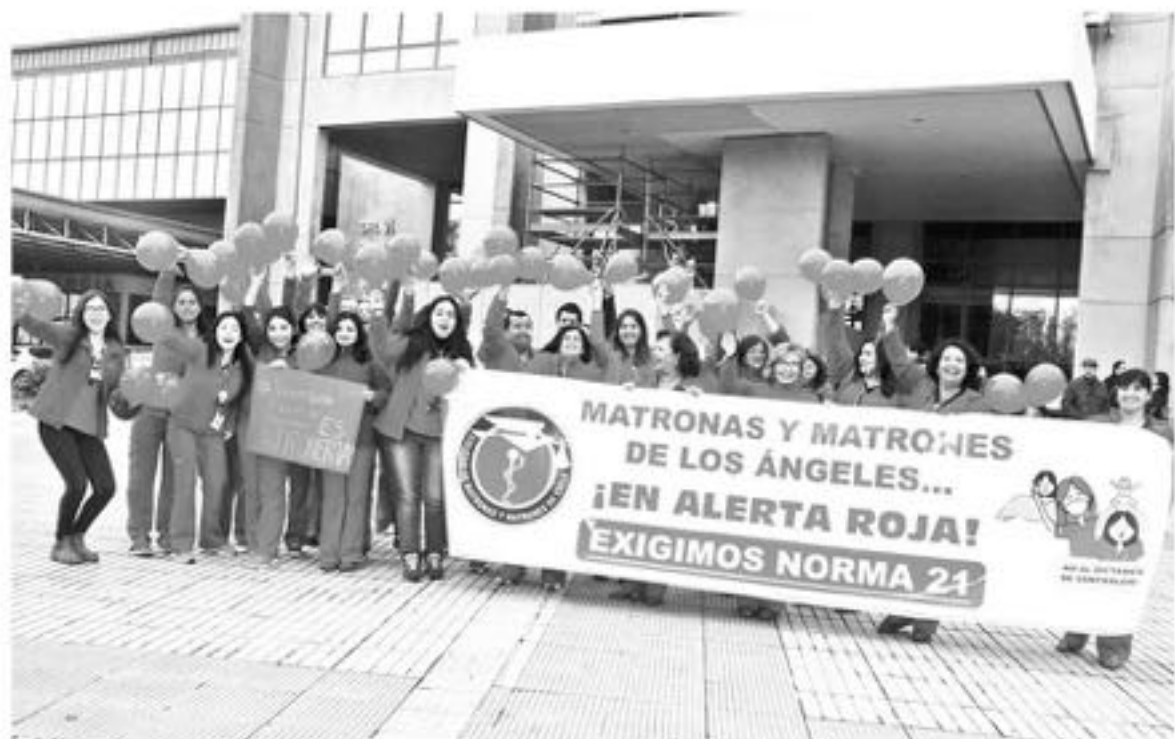
CERCA DE 100 MATRONAS y matrones de la provincia, tanto de hospitales como de centro de atención primaria, participaron de esta iniciativa.

Finalmente, Vidal recalzó que "esa es la forma en que, por lo menos hasta ahora, damos a conocer nuestra molestia. Ahora va a depender de cómo avancen las negociaciones con las autoridades, si es que nos vamos a ir sumando a algunas actividades un poco más de otra índole, a lo mejor de más largo tiempo, según cómo se