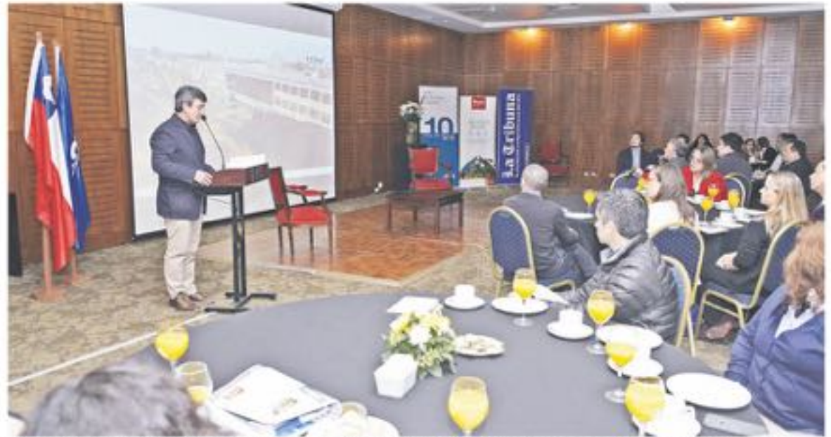
EL SEMINARIO "Construyamos juntos la ciudad que queremos" se convirtió en un espacio de experiencias positivas para los asistentes.