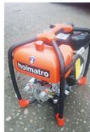
EL ROBO SE GENERÓ cuando las unidades móviles de Bomberos quedaba fuera de las dependencias de este cuartel, ya que se realizaban trabajos de mejora en las calles de esta misma.