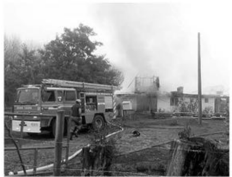
EL ORIGEN DE LAS LLAMAS de este siniestro se debería a la mala utilización de una estufa en la vivienda, la que se sobrecalentó.

Posterior al control de las llamas, fueron los mismos Bomberos quienes corroboraron que se pudo salvar ningún tipo de implementos en la vivienda, por lo que ambas personas fueron trasladadas donde cercanos, quienes los acogieron para prestar los cuidados necesarios y buscar una solución para este lamentable hecho.