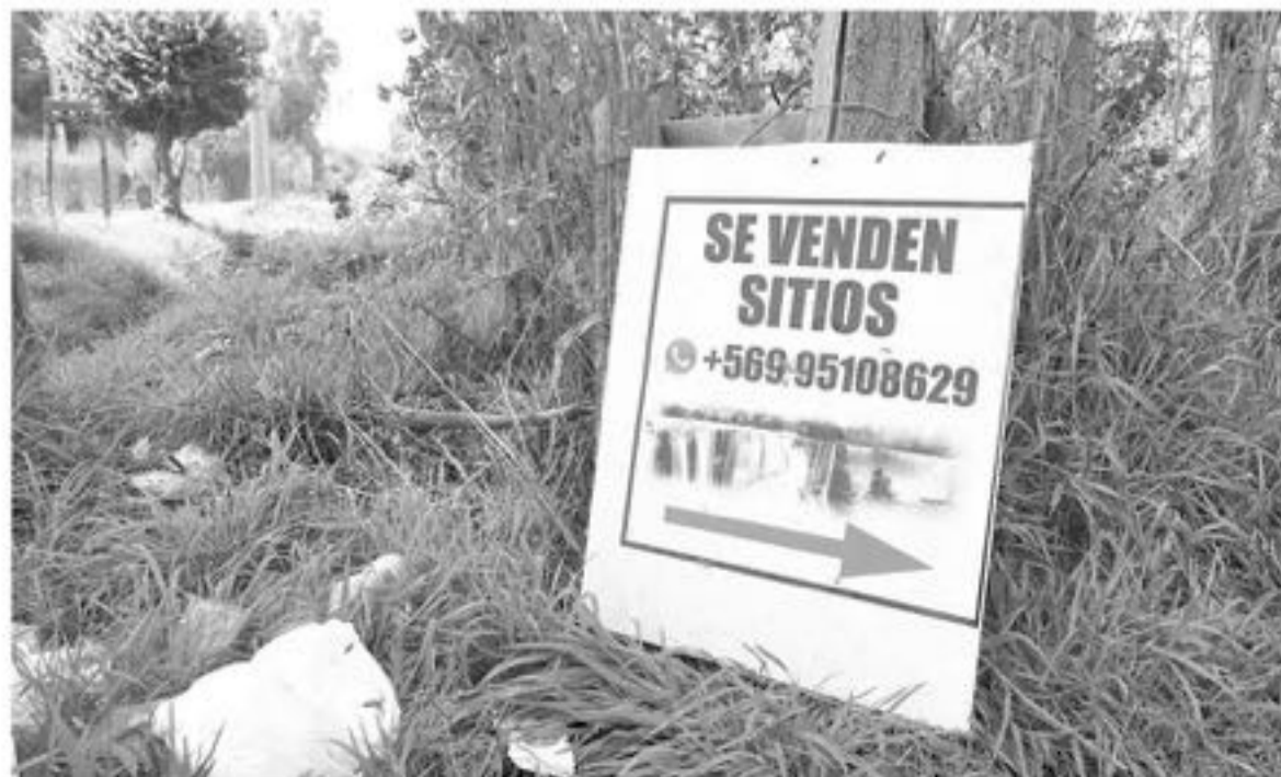
LA EXISTENCIA DE LOS DENOMINADOS "sitios brujos" en la provincia de Biobío es una situación que ha generado más de un conflicto entre particulares en el último tiempo en la provincia de Biobío.

Felipe Ward, ministro de Bienes Nacionales.