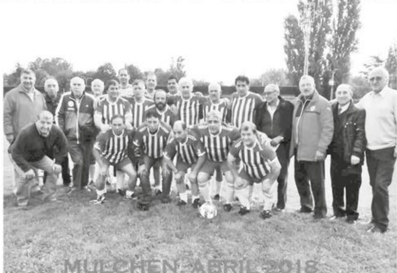
EL CLUB SIEMPRE envía saludos a todos los iberianos que se encuentran delicados de salud.

Lo asisten como lo hicieron antiguamente en la cancha, sólo que ahora no con el balón, sino que con buenos sentimientos y, sobre todo, la motivación de entregarle la energía que necesite.