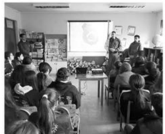
LA INICIATIVA estuvo dirigida a jóvenes de séptimo y octavo básico de la comuna de Laja.

Sobre estas instancias, el capitán agregó que estas campañas se están realizando como ciclos enfocados en diversos delitos como una manera de contribuir a la comunidad, ya que son temas desconocidos.