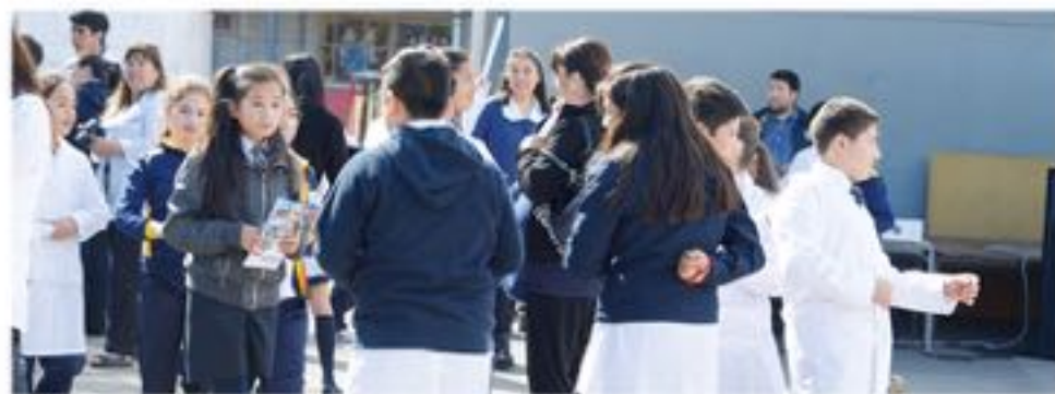
ESTA PUBLICACIÓN que se mantiene en redes sociales ha causado bastante expectación en ciudadanos de la comuna de Mulchén.

Contenidos alusivos a entrega de dulces con droga, fuera de establecimientos educacionales, ha generado que muchos ciudadanos se alarmen.