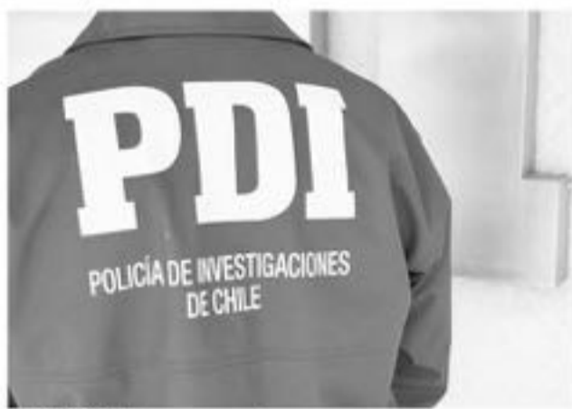
EL CUERPO fue encontrado por terceros.

Personal de la Brigada de Homicidios de la comuna ya trabaja en determinar la identidad de esta persona, ya que al momento del hallazgo este no portaba ningún tipo de documentación.