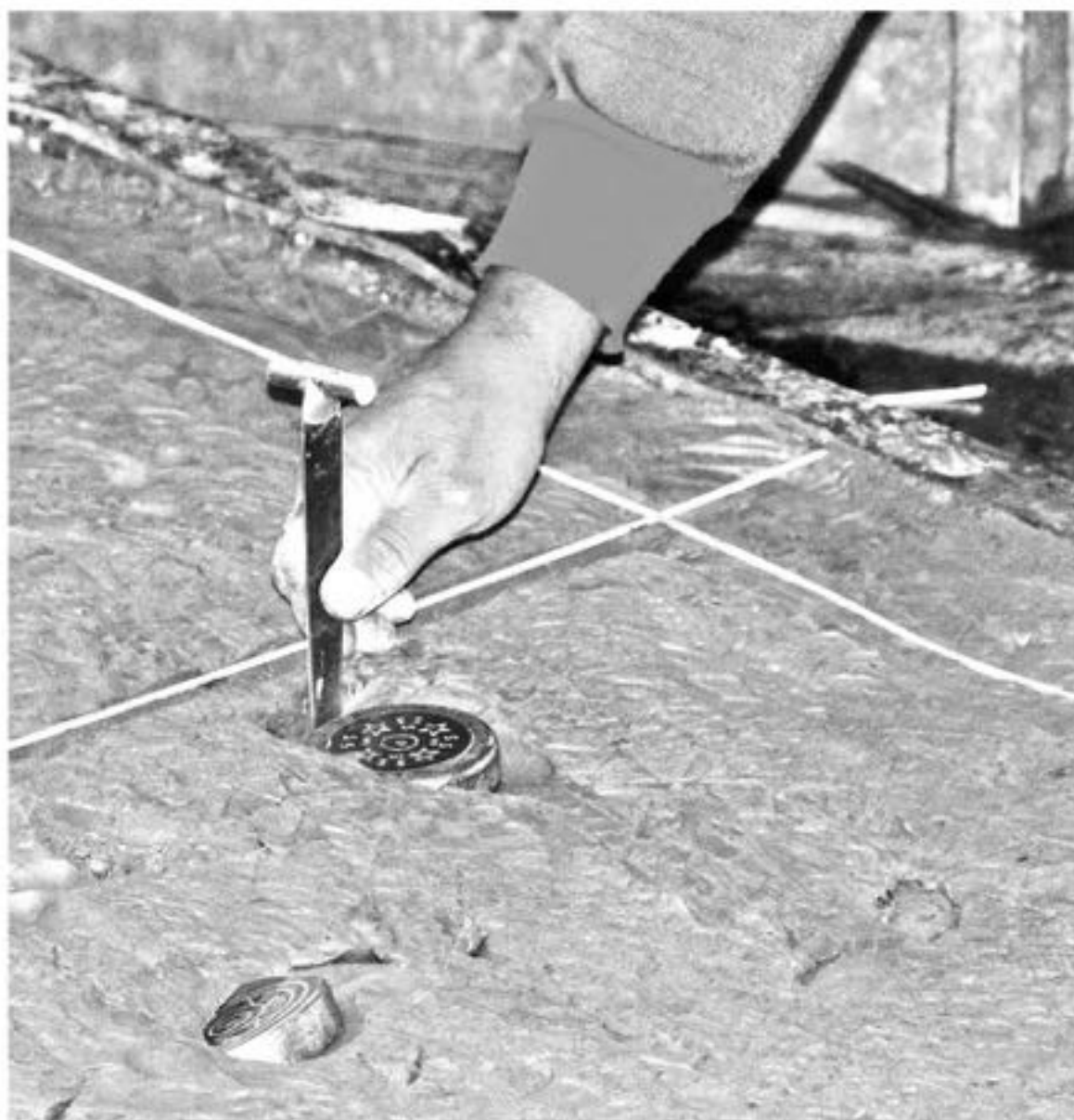
LA SEGUNDA FECHA finalizó con cuatro clubes de los rayueleros peleando el segundo lugar.

Los rayueleros tendrán nuevamente su cita en el deporte nacional para disputarse los puntos, lanzando sus tejos, este domingo desde las 10:30 de la mañana en cada cancha perteneciente a los clubes que juegan la tercera fecha.