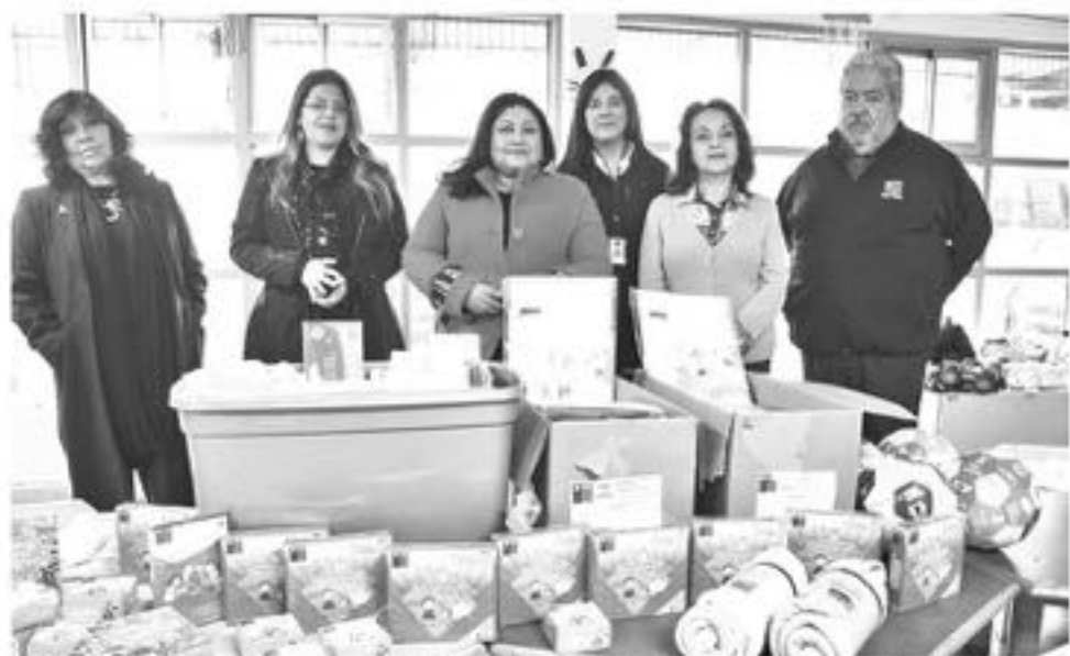
CON RELACIÓN a los recursos dirigidos a reforzar los distintos establecimientos de salud de la provincia, este año han llegado cerca de 250 millones de pesos para toda la red.

En lo que respecta al Complejo Asistencial de Los Angeles se invertirán cerca de $63.444.000 para reforzar la