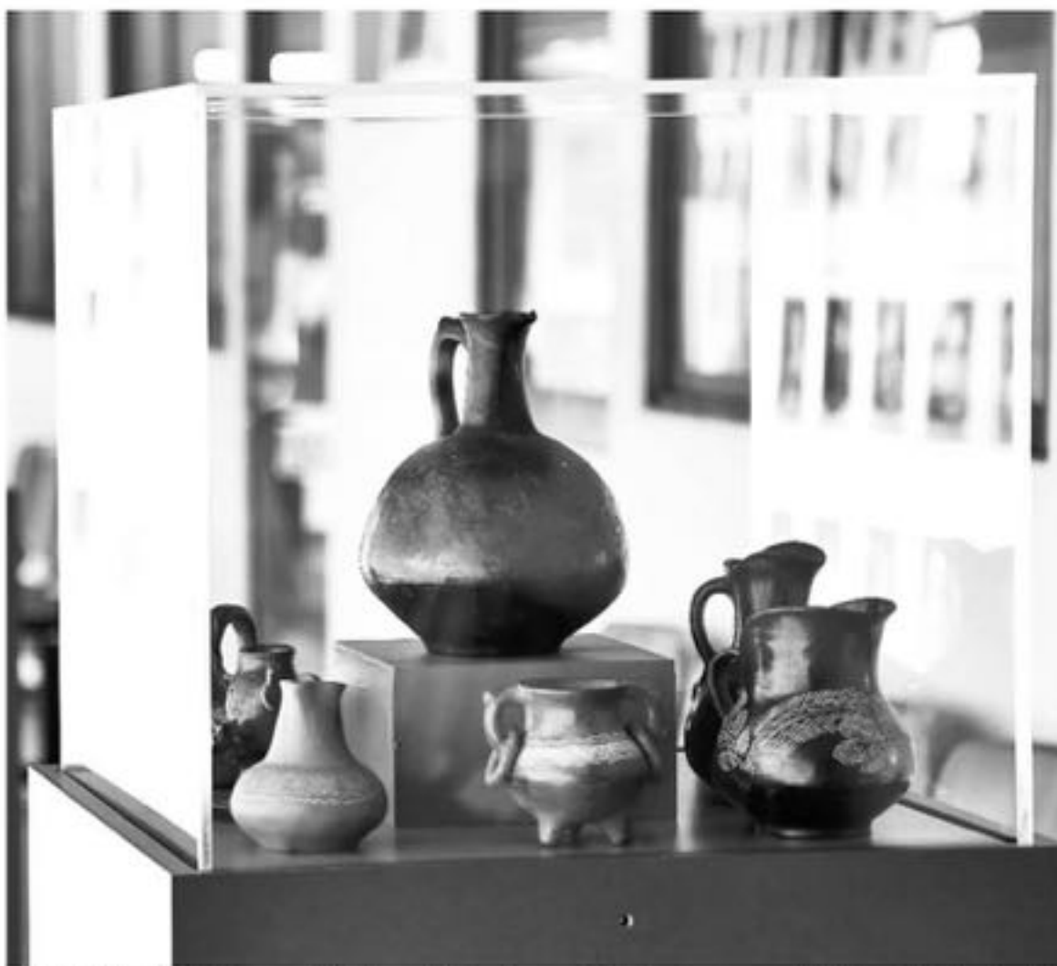
HASTA EL PRÓXIMO martes 3 de julio estará abierta la exposición "Pasado y presente de la alfarería de Quinchamalí".