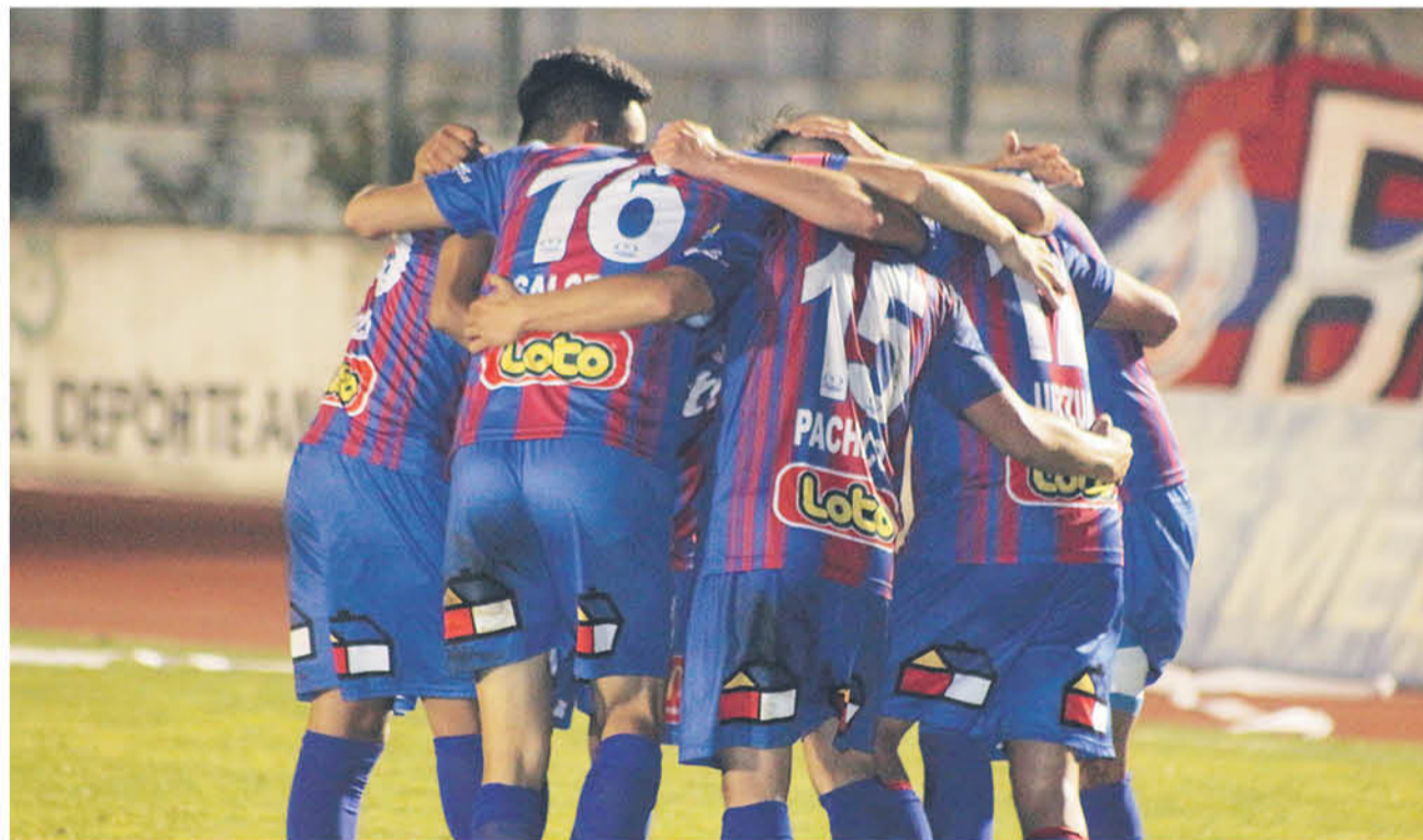
PESE A LOS ABRAZOS EN IBERIA son conscientes de que no hicieron un buen juego.

Aunque consiguió un importante triunfo, en el equipo angelino tienen claro que no se jugó de buena forma.