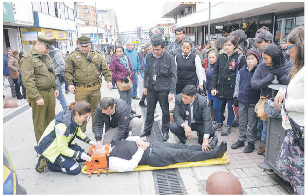
EL HOMBRE SUFRIÓ UNA IMPORTANTE CAÍDA mientras seguía a un delincuente que ingresó a la tienda Tricot.

En tanto, en el suceso mismo transeúntes manifestaron, que el hecho principal de este incidente se debe a la poca seguridad que presentan las esferas