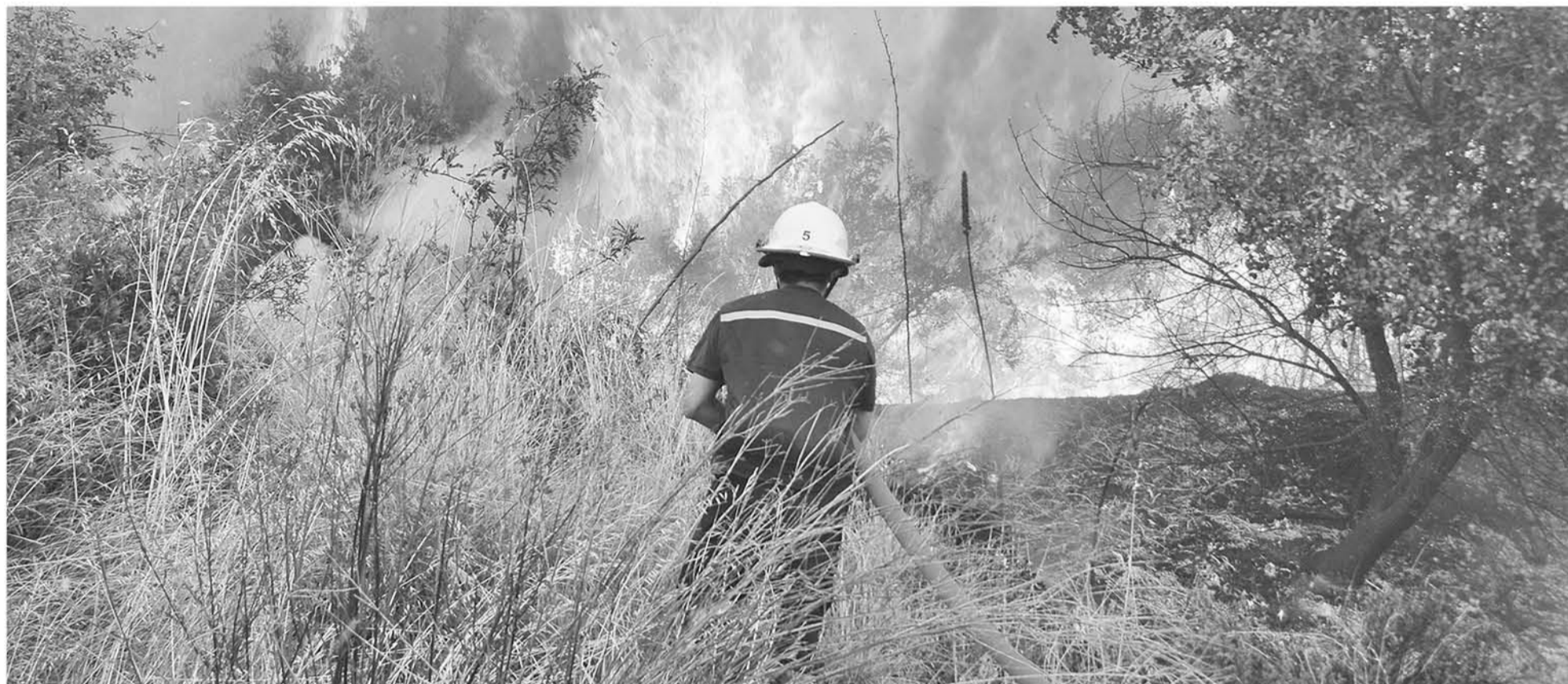
SEGÚN LOS EXPERTOS, la acumulación de material combustible como malezas y plantaciones de baja altura están entre las variables que desencadenan las denominadas “tormentas de fuego”.

Más de 100 expertos españoles, argentinos y chilenos analizaron nuevo fenómeno de siniestralidad forestal que tuvo su punto de inicio hace un año, en Santa Olga y que, meses más tarde, fue replicado en otros países.