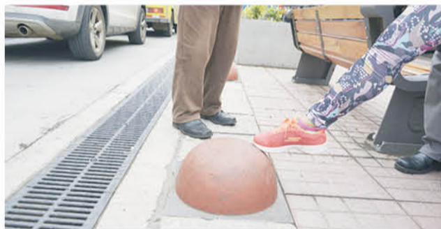
ESTAS SON LAS ESFERAS ornamentales que han presentado diversos accidentes, según manifestaron diferentes ciudadanos.

mentos se ubican, con la finalidad de garantizar que los conductores mantengan la distancia establecida en la calle a la hora de estacionarse.