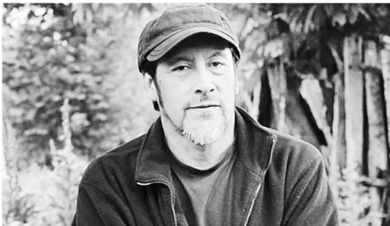
ESCRITOR Y POETA Mapuche, Elicura Chihuailaf (Quechurehue, 1952) es el primer indígena chileno nominado al Premio Nacional de Literatura.