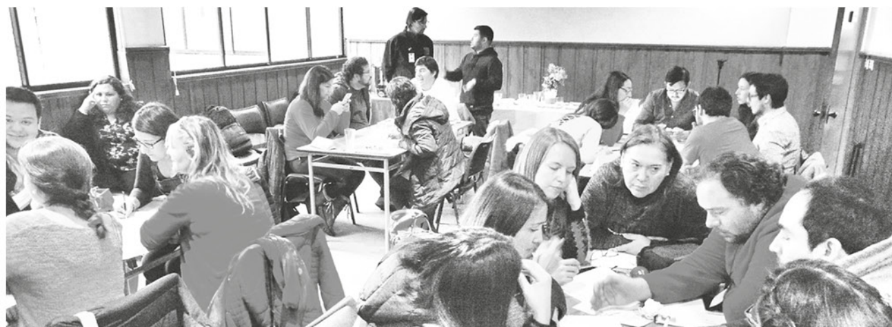
EN LA ACTIVIDAD se trató el manejo del instrumento de certificación de la discapacidad IvaDec-CIF, herramienta necesaria para el reconocimiento oficial de la condición de discapacidad en una persona.