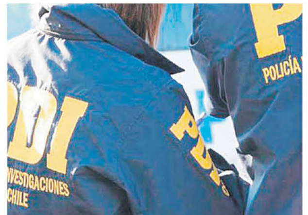
SÓLO UN EXAMEN DE ADN podrá lograr determinar la identidad de este sujeto, hecho que se podría llevar a cabo esta semana.

Con el transcurso de los días, personal de esta sección manifestó que sería un proceso complejo, por la data de muerte de este hombre, quien tendría aproximadamente 60 años de edad y mediría cerca de un metro setenta.