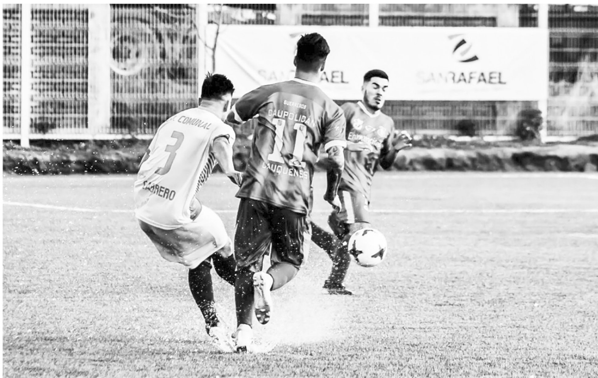
CABRERO SUPERÓ las inclemencias del tiempo y la cancha y continúa como puntero.