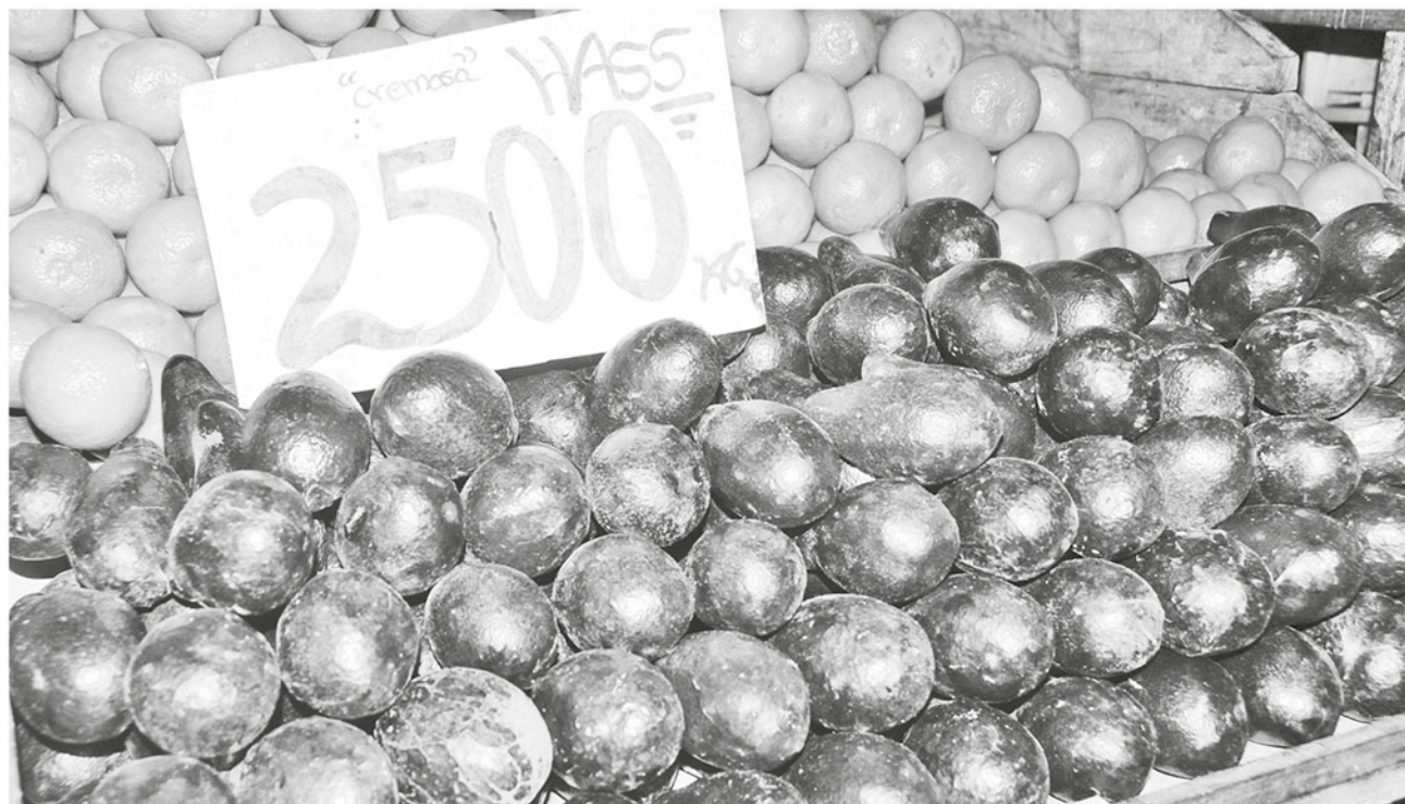
LA VARIACIÓN DE LA PALTA durante el mes de mayo fue de 9,2%.

cifras generales, el IPC de mayo de 2018, registró una variación mensual de 0,3%, cifra que superó las expectativas de expertos, quienes esperaban entre un 0,2% y 0,3%.