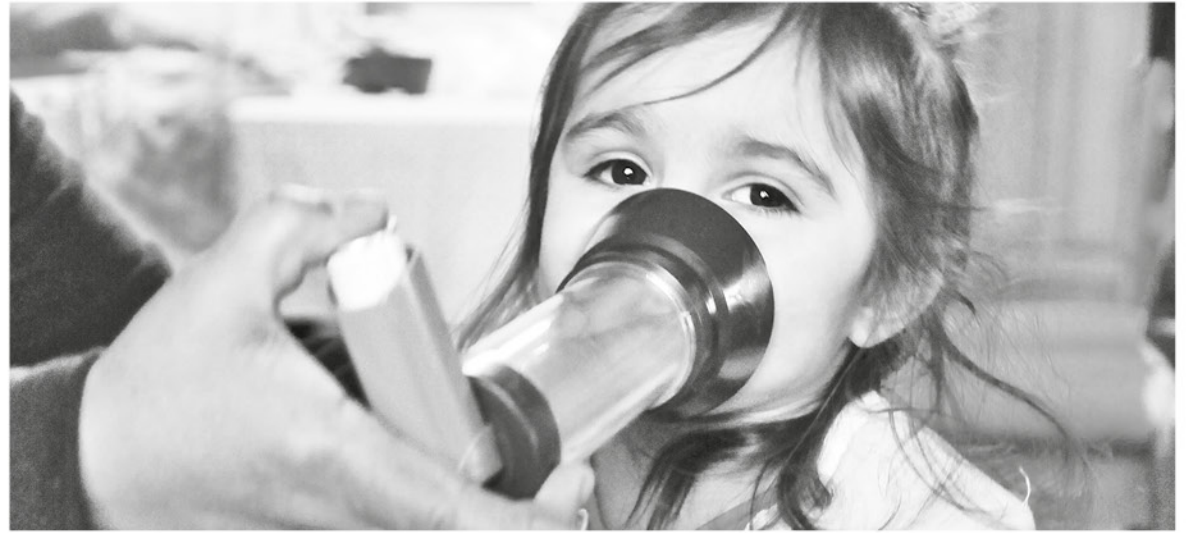
TODO PARTE ESTE miércoles en el gimnasio del Liceo Industrial entre Alianza Verde y Línea de colectivos 22.

A ello, agregó que "de los virus circulantes 136 corresponden a virus respiratorio sincicial, 31 a