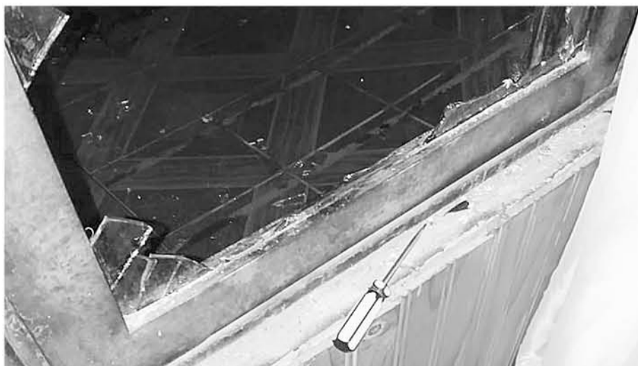
LOS DELINCUENTES fueron encontrados por personal de Carabineros mientras realizaban un patrullaje preventivo.

Se trataba de dos sujetos que vivían a pocos metros de su víctima y mantenían un amplio prontuario policial.