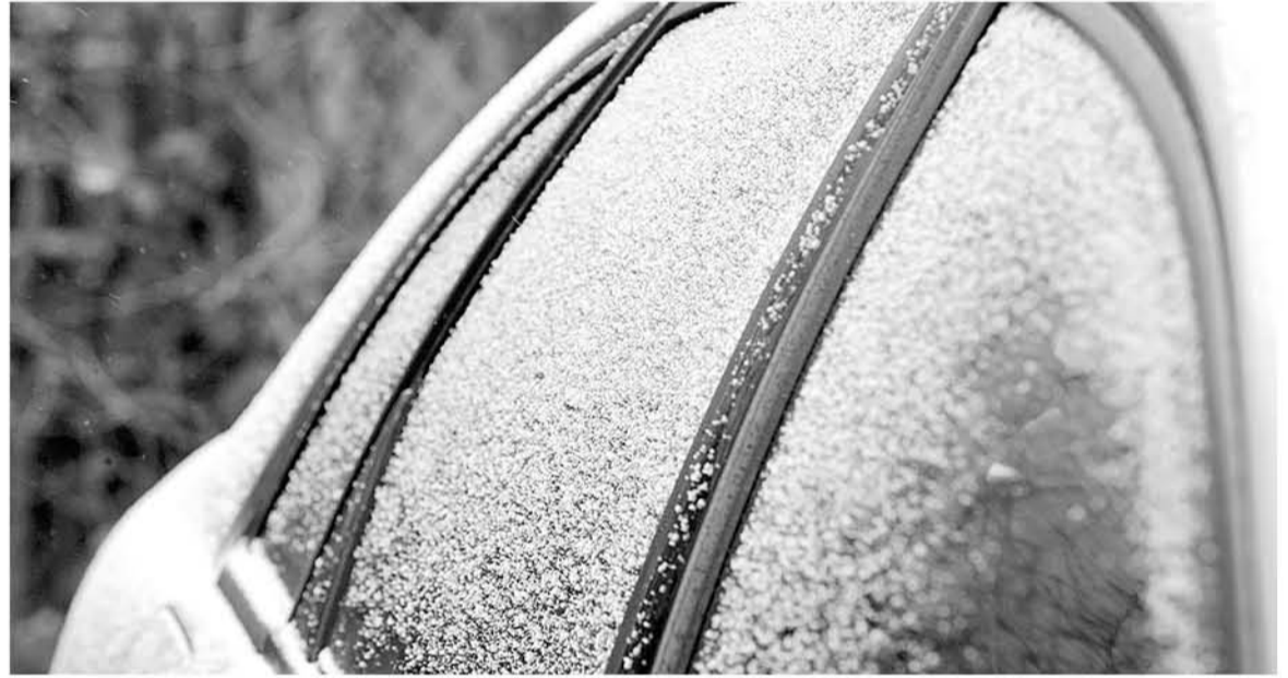
PARA ESTA SEMANA, se prevé temperaturas hasta -3 grados en la provincia, por lo que personal de Carabineros explicó a La Tribuna que los conductores deben tomar las precauciones necesarias, ante estas condiciones.

"Algo similar se puede vivir en la Ruta 5 Sur, donde se han registrado incidentes luego de lluvias. Esto, ya que hay zonas donde se producen apozamientos de agua que originan