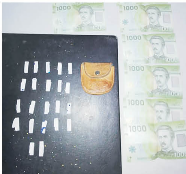
LA MUJER se encontraba vendiendo sustancias ilícitas a plena luz del día.

Los actos fueron denunciados por terceros a personal de Carabineros, mientras realizaba los actos en plena vía pública.