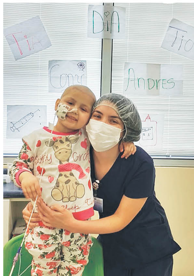
EN EL HOSPITAL CALVO MACKENNA de Santiago, la niña, vive su proceso de post trasplante en una sala de aislamiento de la Unidad de Trasplante.