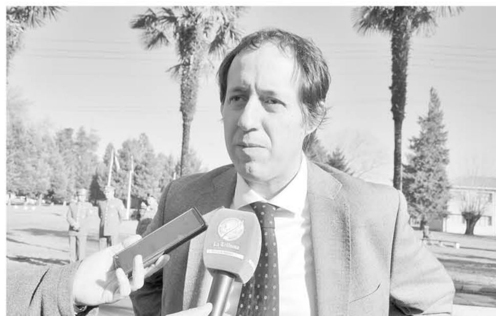
EL PARLAMENTARIO por la zona explicó que la moción presentada apunta a que la normativa se adecúe de tal forma que no se pueda tener un acceso libre a contenidos violentos por internet.

El diputado RN presentó un proyecto de ley dirigido a restringir el ingreso a menores a este tipo de contenidos por internet.