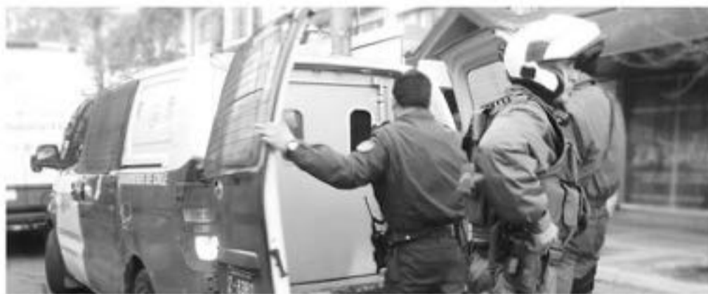
LOS HOMBRES fueron detenidos luego de la agresión al guardia de seguridad. (foto de contexto)

Los sujetos arremetieron contra el trabajador, cuando fueron sorprendidos robando en el interior del centro comercial.