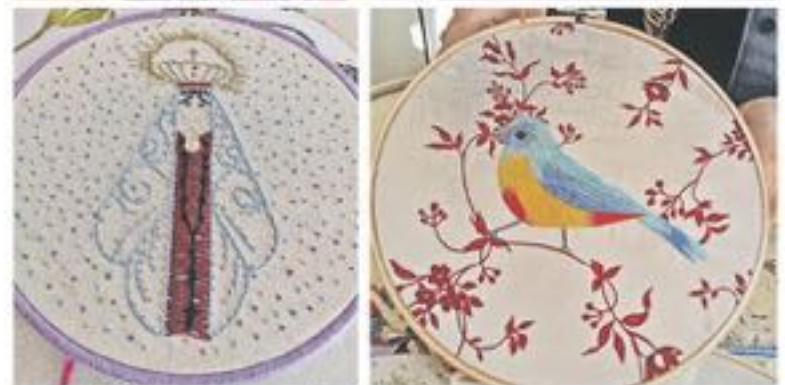
UN SINFIN DE BASTIDORES bordados con sus proyectos son los que expone la creadora de La Pastora Borda.

Tenango (México). "Se pueden crear formas hermosas y han tenido mucha aceptación entre mis alumnas".