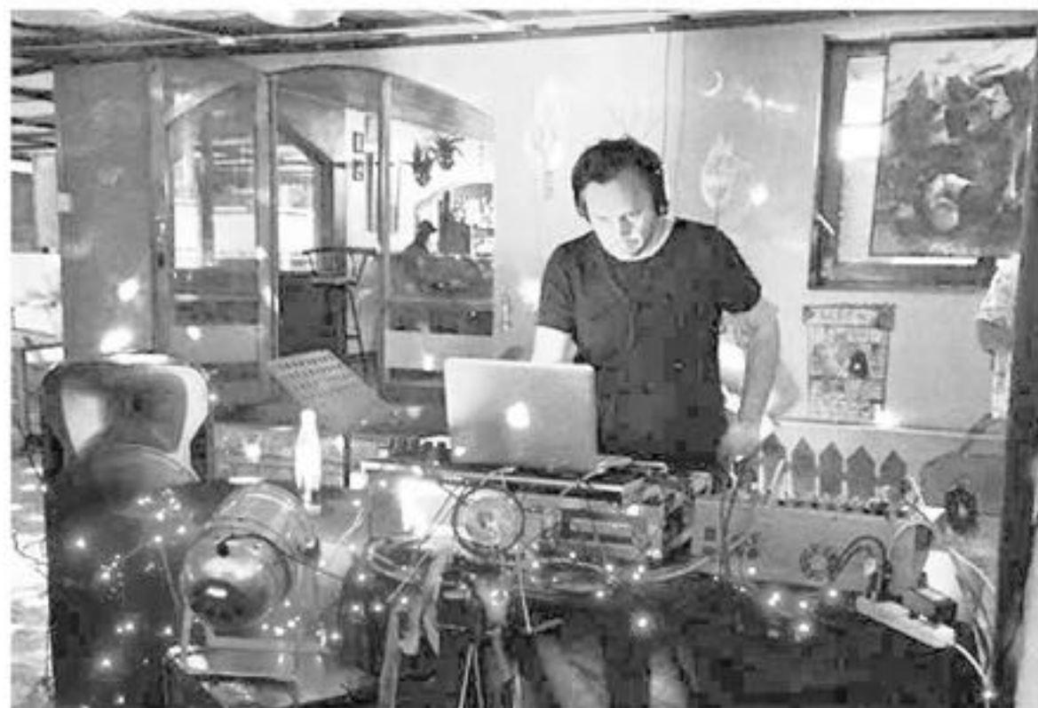
DESDE LAS 20 HORAS en calle Eleuterio Ramírez 0181 la Academia de melómanos estará dedicada al jazz.

Escuela Granada organiza el primer jueves de cada mes innovadoras reuniones para conversar sobre música, no es necesario tener conocimientos del tema.