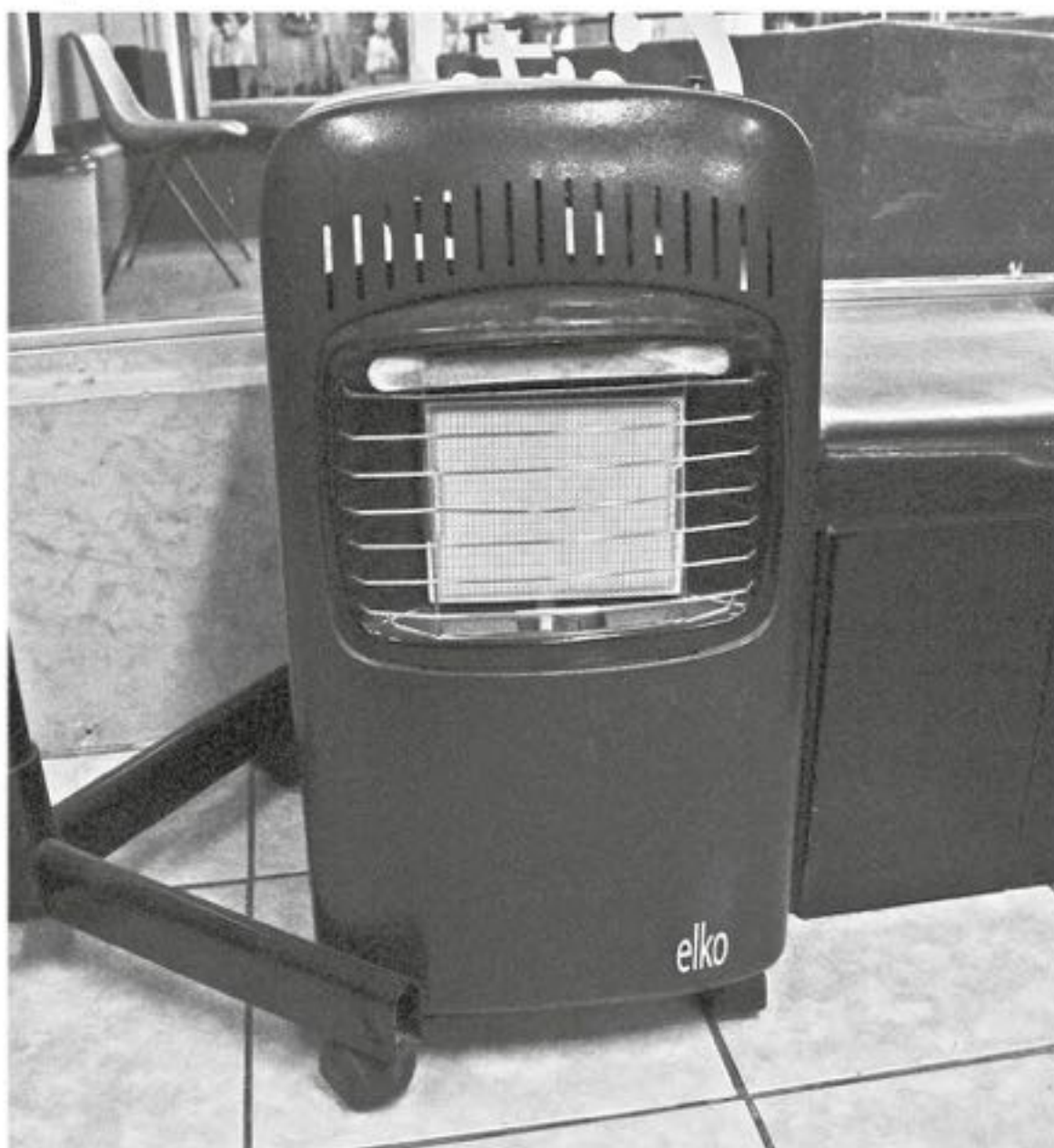
EL BENEFICIO SOCIAL de eliminar el material particulado de la atmósfera fluctuaría entre los US$ 900 y US$ 2.600 por habitante.

Desde el punto de vista económico, el estudio de la FEN establece que el beneficio social de la baja de emisiones de material particulado fino (MP 2,5) en Los Ángeles, desde el punto de vista de la reducción de los costos directos en salud o relacionados con la productividad perdida de la población, que cuenta con más de 230 mil habitantes, con un beneficio unitario por concentración de MP2,5 de 60.879, y US$2.191 por emisiones.