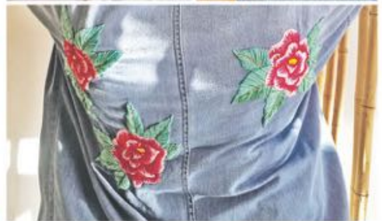
LA ROPA TAMBIÉN ha sido una opción de trabajo en sus talleres, donde por ejemplo aplica la técnica Sachiko.