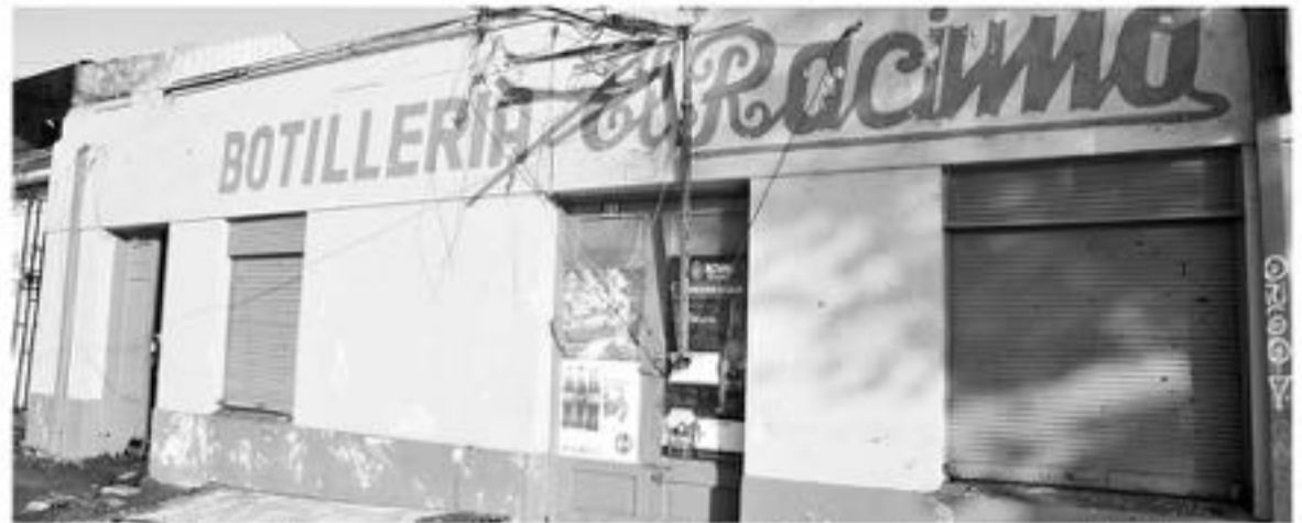
EN EL INCENDIO colaboraron cuatro unidades de Bomberos, quienes trabajaron en evitar la propagación de las llamas.

Sobre los reiterados casos incendiarios que se han generado en la provincia en los últimos días, donde muchas casas han sido afectadas por incendios,