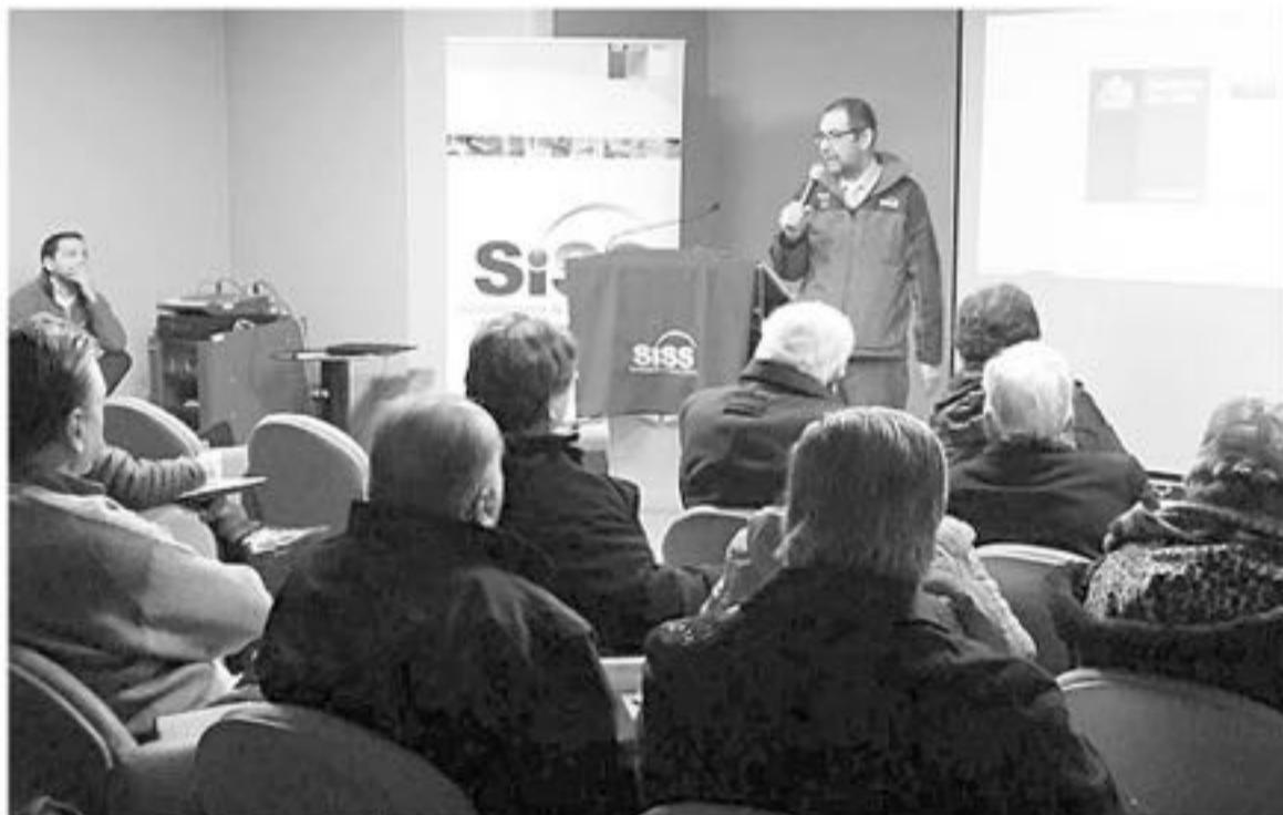
EL ENCUENTRO SE REALIZÓ en el Salón de la Fiscalía Regional del Biobío junto a representantes de la Asociación de Consumidores de Adultos Mayores.

Durante el diálogo se respondieron consultas a mano alzada, donde se plantearon problemas y soluciones prioritarias en cada uno de los temas