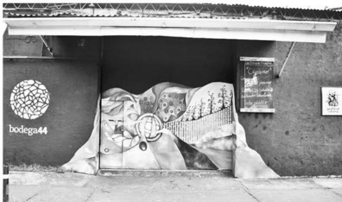
SE INVITA A TODA la familia a disfrutar este viernes y sábado de la Obra de Teatro Infantil "Ayayai".

Es así como el viernes 8 y sábado 9 de junio a las 20 horas se presentará la obra Ayayai de la compañía de teatro Festín de la Risa proveniente de Valparaíso.