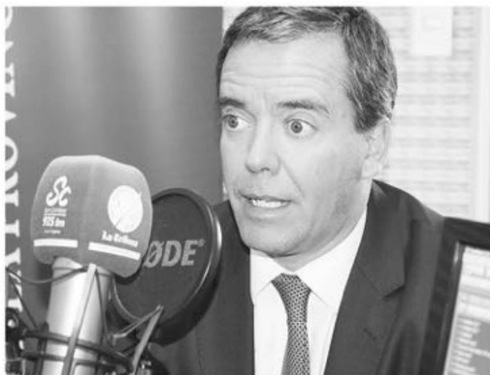
EL SENADOR Harboe aseveró que la Superintendencia de Bancos debe mejorar su capacidad técnica.

Parlamentario PPD descargó su malestar con entidad financiera tras presentar problema informático que puso en riesgo la seguridad de la información de miles de clientes.