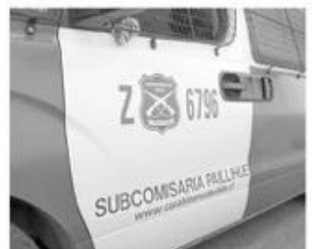
LOS EFECTIVOS POLICIALES fueron interceptados por familiares de los detenidos.

En esta diligencia finalmente fueron detenidas dos personas por microtráfico y otras dos por oponerse a las acciones de Carabineros.