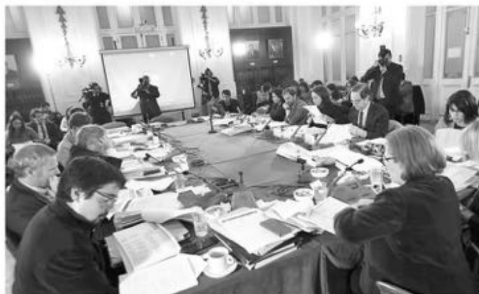
TRAS UNA INTENSA JORNADA la Comisión Mixta de la Cámara de Diputados aprobó el cambio registral de sexo para personas mayores de 18 años.

La votación se centró en propuestas presentadas por la Cámara de Diputados al proyecto de ley que reconoce el derecho a la identidad de género.