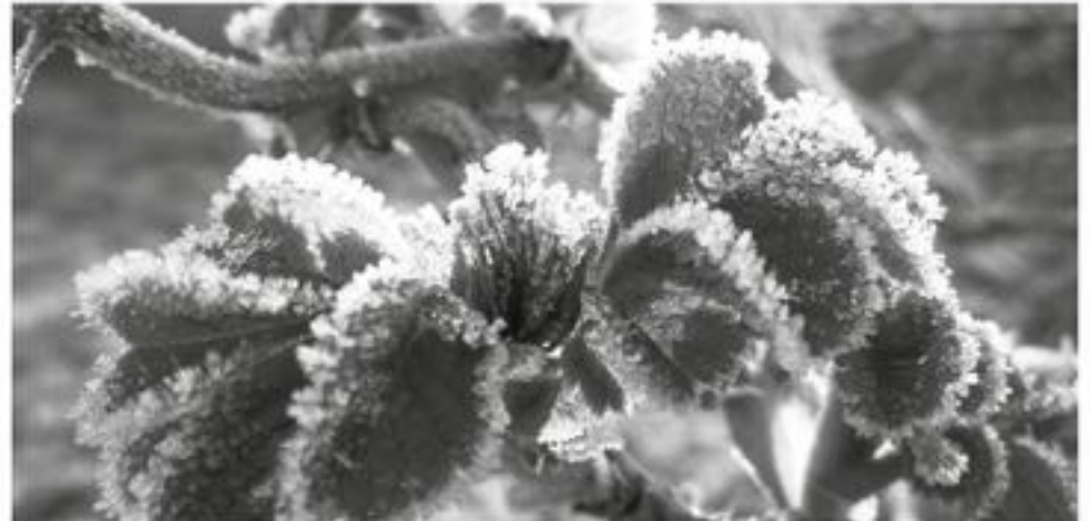
PESE A QUE ESTAS TEMPERATURAS BAJAS no son tan amenazantes como en la época primaveral, igualmente se debe estar alerta ante cualquier contratiempo.

Son aquellas que ocurren por desplazamiento de masas de aire frío provenientes desde el sur, cubriendo áreas extensas de territorio. Son condiciones más persistentes, pudiendo extenderse por varias horas en la noche y parte de la mañana o por varias noches seguidas. Estas heladas se asocian con aire más seco y frío, por lo que son más dañinas para las plantas. Se presentan ocasionalmente pero por sus características, generan grandes daños.