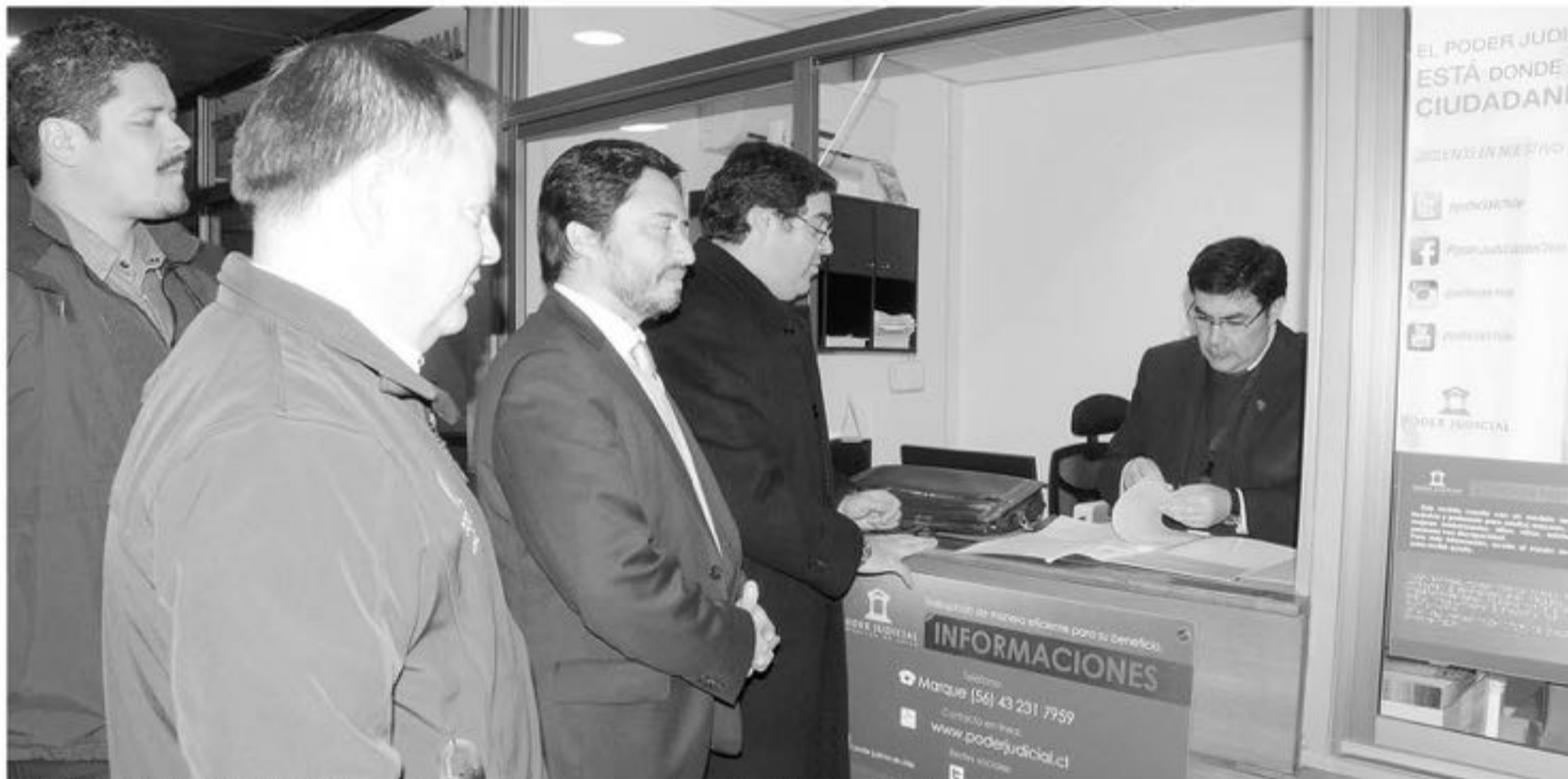
LAS AUTORIDADES SE REUNIERON este pasado martes para presentar la querrela en el Juzgado de Garantía local.

El documento se presentó con personal de la empresa Coopelan, Gobernación Provincial y el seremi de Energía, quienes trabajan en mesas constitutivas para detener estos hechos.