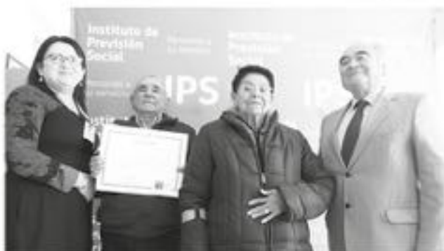
ESTE APOORTE ECONÓMICO de cargo fiscal, se otorga a parejas que posean 50 años o más de matrimonio, y cumplan con los requisitos establecidos por la ley.

Finalmente, para solicitar el beneficio, se deben dirigir al Centro de Atención IPS - ChileAtiende más cercano, ubicados en la provincia de Biobío, ubicado en las comunas de Los Ángeles, Cabrero, Nacimiento, Laja, Mulchén, Santa Bárbara y Yumbel.