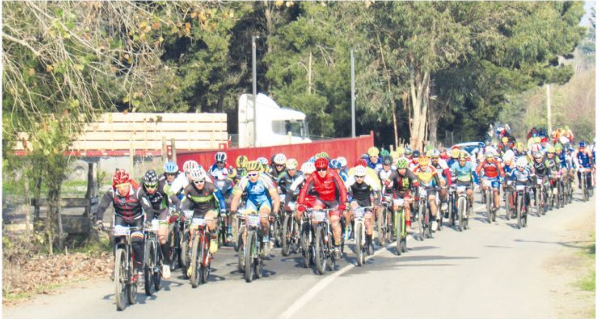
CABRERO vivió el debut en la temporada 2018.

Con 12 fechas a lo largo de la provincia de Biobío la competencia ya es clásica en la zona.