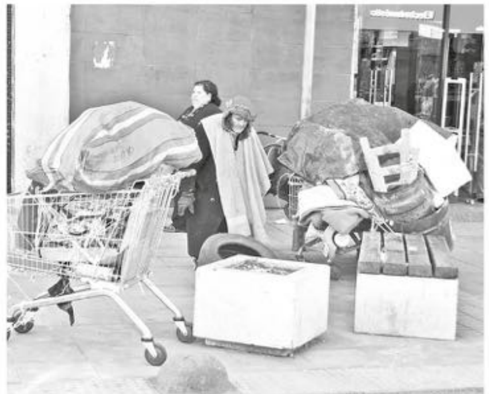
ADEMÁS, ya se está implementando la ruta social, ruta médica y un nuevo albergue en Los Ángeles.

"Fundamentalmente en Los Ángeles, porque tenemos una mayor población y personas en situación de calle. Actualmente, hay identificadas 213 personas que viven