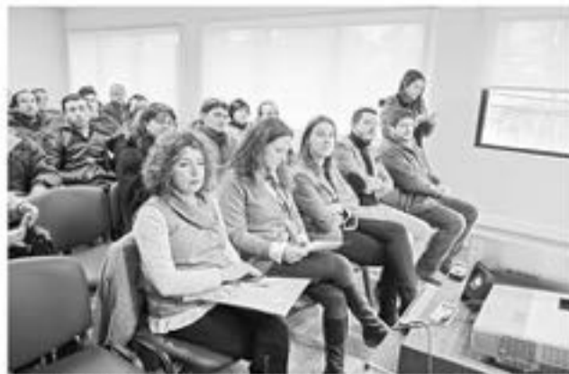
LA SEREMI DE GOBIERNO y la gobernadora de Biobío participaron este martes del Lanzamiento de los Fondos para Organizaciones de Interés Público en la Gobernación Provincial.