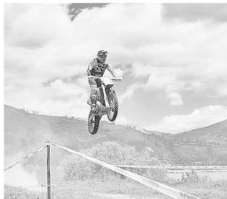
EL EVENTO, que se correrá camino al Natre, revivirá la pasión del mundo tuerca en Los Ángeles.

Por lo mismo, desde la organización destacaron que "se invita a las familias que se acerquen al fundo Higuierillas desde el sábado ubicado camino Rinco Natre terminando el camino pavimentado a 300 metros, para que disfruten junto a sus hijos de esta linda modalidad del deporte motor. Podrán hacer trekking para que se acerquen a las especiales en medio del cerro resultando una muy saludable actividad siendo totalmente gratuita la entrada".