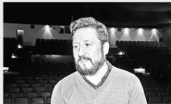
BATERISTA DE LA EMBLEMÁTICA banda de rock Machuca, es parte del staff de profesionales de la Corporación Cultural Municipal.

"Entonces he estado presente en distintos tipo de artes escénicas, colaborando siempre porque en este rubro cuesta un poco lograr