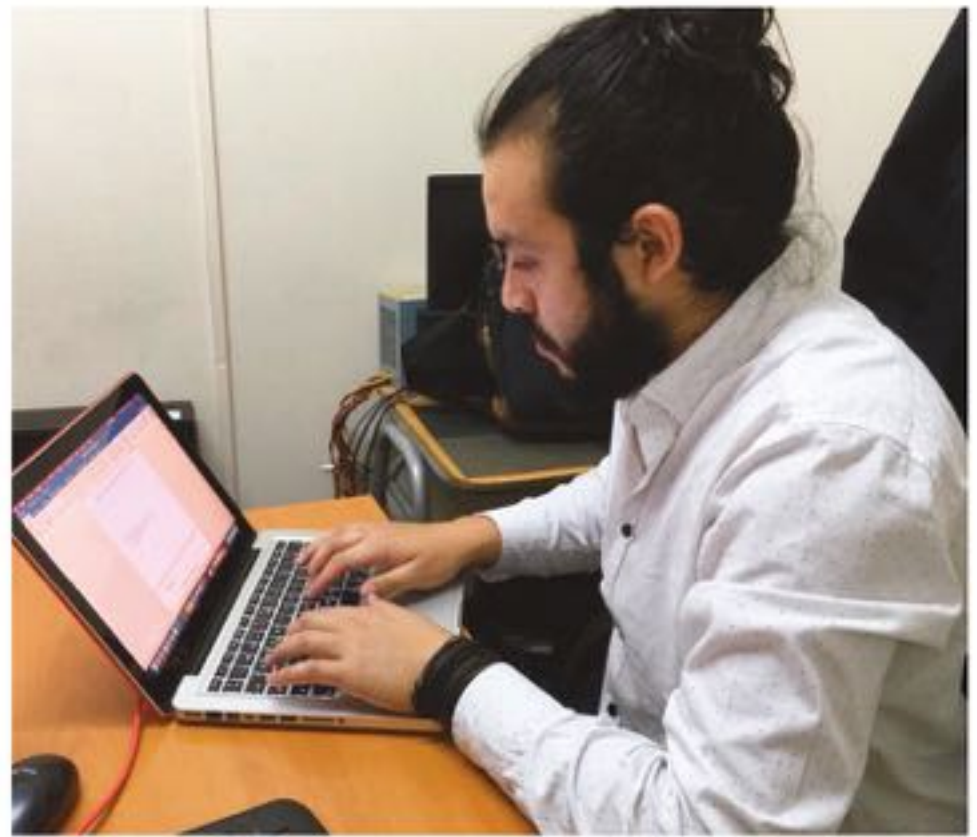
Docentes de establecimientos de Educación Media se capacitan con el programa online "Procesos educativos virtuales" de la Universidad Inacap.

Este curso pertenece a la línea de acción Transformación Digital para la Enseñanza Media del Centro para el Desarrollo de la Educación Media (Cedem) de la Universidad Inacap, dentro de la cual además se imparten talleres de capacitación en TICs y Habilidades del Siglo XXI, además de cursos de competencias audiovisuales.