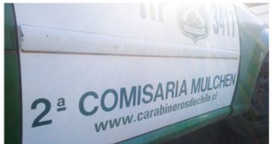
EL HOMBRE FUE DETENIDO por robo de carácter frustrado.

Por este motivo, Carabineros detuvo al sujeto por el delito de robo con intimidación de carácter frustrado, por la amenaza generada.