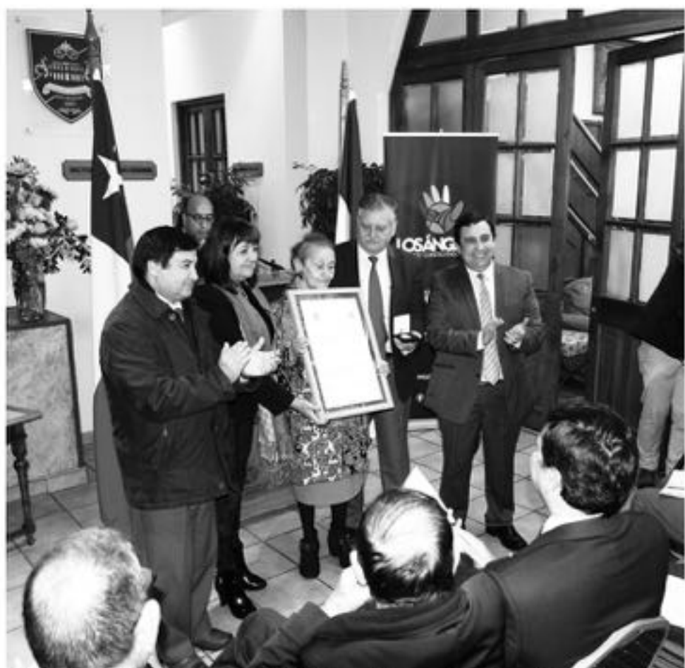
LA CEREMONIA DE RECONOCIMIENTO a ciudadanos destacados se llevó a cabo en el Club de La Unión de Los Ángeles.

Recordemos que esta ceremonia debía haberse desarrollado el lunes pasado, pero debió ser suspendida por las fuertes lluvias que azotaron la comuna durante ese día.