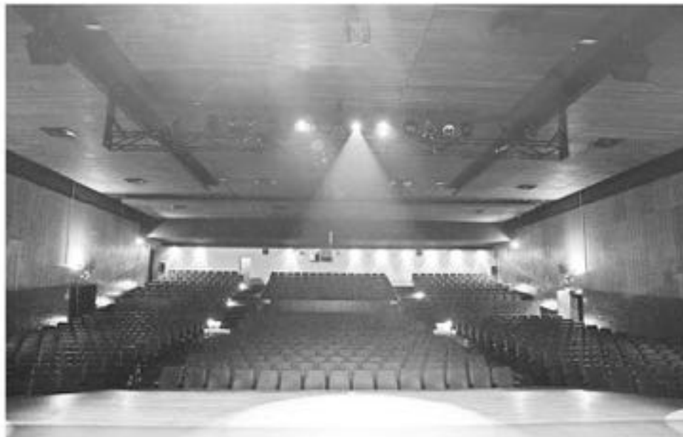
SOBRE EL ESCENARIO del Teatro Municipal serán los conciertos íntimos, de las bandas o los solistas que pasen la final de la selección.

El dossier y sus respectivos archivos adjuntos deben enviarse por correo electrónico, hasta las 14 horas del día 11 de junio, a la dirección produccion@ccmla.cl . En ASUNTO debe incluirse el nombre del músico o banda en el siguiente formato: "MÚSICO" POSTULA SESIONES 2018.