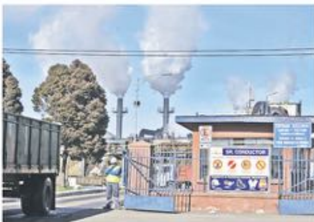
ACTUALMENTE IANSA está siendo objeto de un sumario sanitario por olores molestos, recordemos que la empresa tuvo que pagar una millonaria multa el 2016 por el mismo tema.

que Iansa realice sus procesos dentro de norma, que respete a la comunidad vecina a la empresa enmarcando su comportamiento medioambiental dentro de los estándares permitidos". Además señaló "nosotros no dudamos en acudir a la Superintendencia de Salud en busca de respuestas si estos hechos continúan" expresó el edil en el marco de la celebración del Día Mundial del Medioambiente.