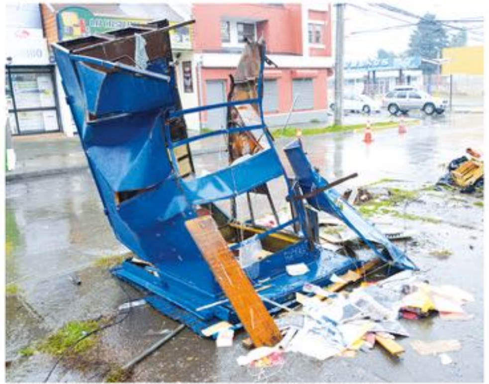
EL ACCIDENTE SE ORIGINÓ en las intersecciones de calle Colón con Janqueo.

De igual manera se pudo corroborar en el mismo lugar, que el kiosco finalizó con daños irreparables producto del impacto, además la pérdida casi total de muchos artículos que este hombre comercializa de manera diaria.