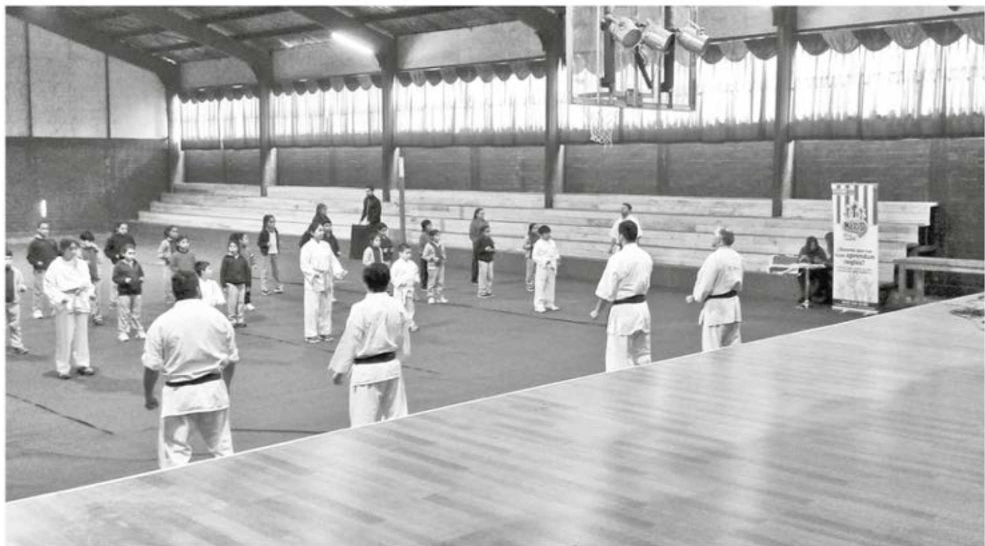
EL KARATE KYOKUSHIN fue una de las actividades más llamativas.