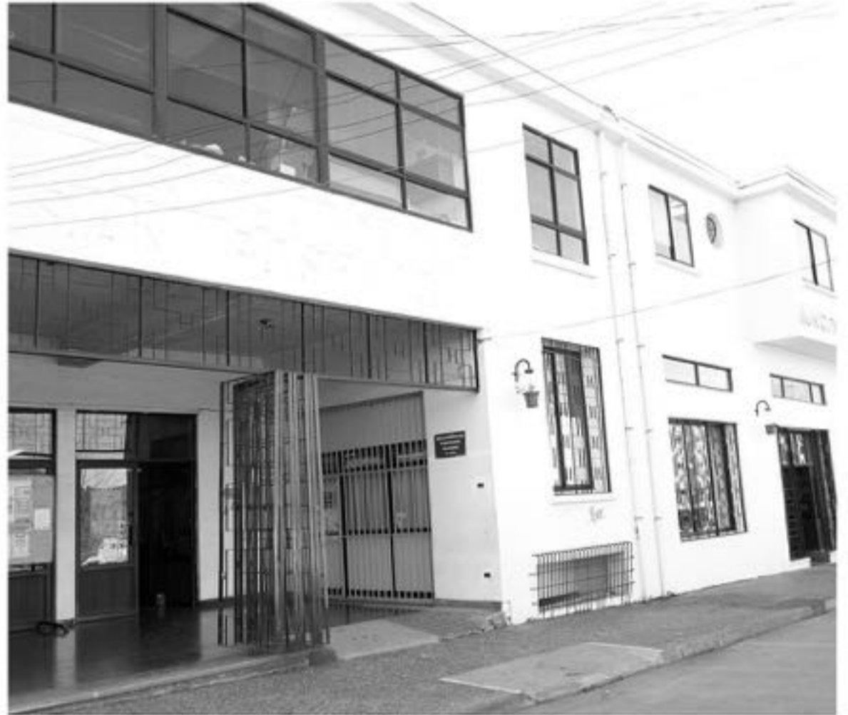
EL RECHAZO A LA MODIFICACIÓN PRESUPUESTARIA presentada por el alcalde de San Rosendo se llevó a cabo este martes donde sesiona el Concejo Municipal de esa comuna (Archivo).