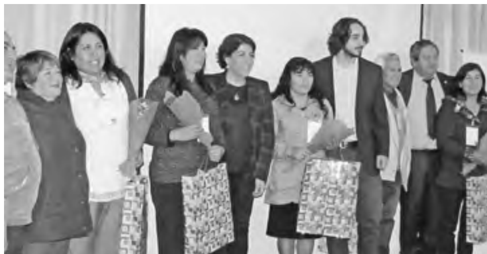
DICHO PROGRAMA se inició en septiembre del 2014 y tuvo una duración de 7 meses.