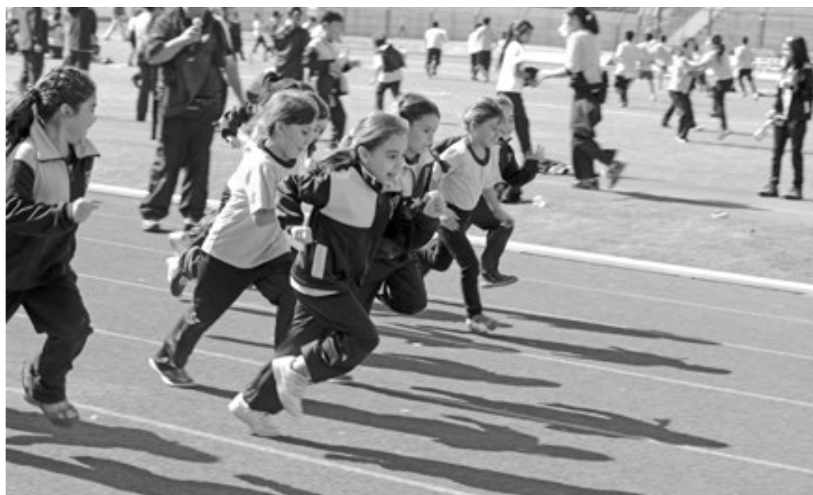
LA ACTIVIDAD FÍSICA es fundamental para reducir los índices de obesidad, y para eso los colegios son clave.

“A los que nos gusta la actividad física, este día pasa a ser el evento del año. Es nuestro cumpleaños, donde debemos promocionar los hábitos