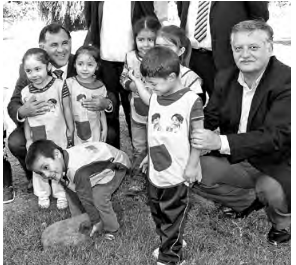
EL JARDÍN ESTARÁ en la población 21 de Mayo.

Es en este contexto, que en la región de Bío Bío, desde el año pasado a la fecha se han ubicado 6 inmuebles que han sido puestos a disposición de esta meta presidencial, a través de concesiones gratuitas desde la Seremi de Bienes Nacionales, uno de ellos, en la intersección de las calles Río Huaqui y Río Quilmes de la Población 21 de Mayo, en el sector sur de nuestra ciudad.