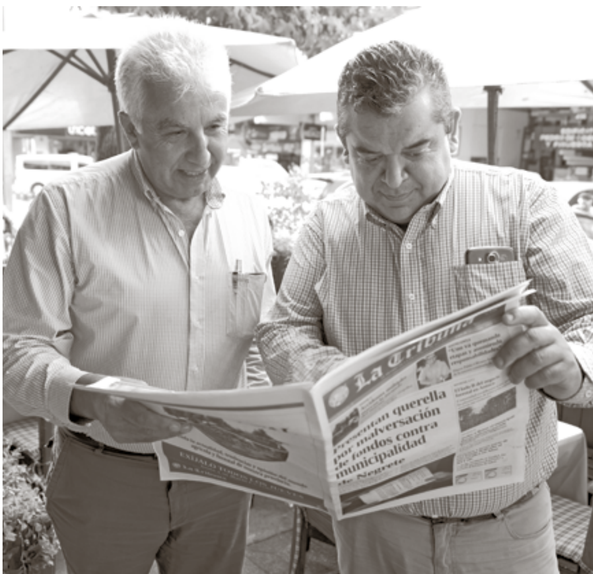
LOS DEMANDANTES EXPLICARON que desean saber cuáles fueron los destinos de los dineros objetados por Contraloría.

Asimismo, fue enfático en indicar que en el DAEM, bajo su mandato, no se realizaron malversaciones de dinero. “Nadie, durante mi gestión, se llevó dinero para el bolsillo o se apropió de dineros públicos, sino que los recursos SEP fueron destinados para satisfacer fines públicos, como los anteriormente expresados. Tan