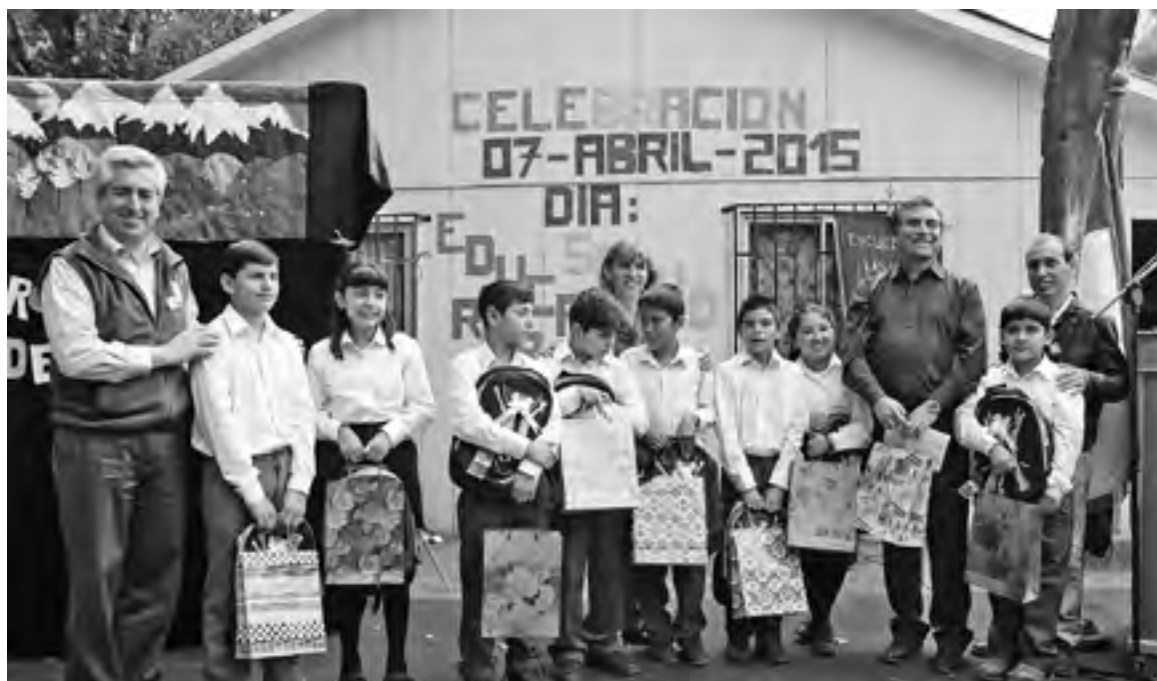
LOS ESTUDIANTES del establecimiento educacional recibieron regalos y útiles escolares.

Entendiendo que también se conmemoraba el Día Mundial de la Salud, en el marco de la promoción de la inocuidad de los alimentos, también participó la directora comunal de esta área, Fabiola Soto,