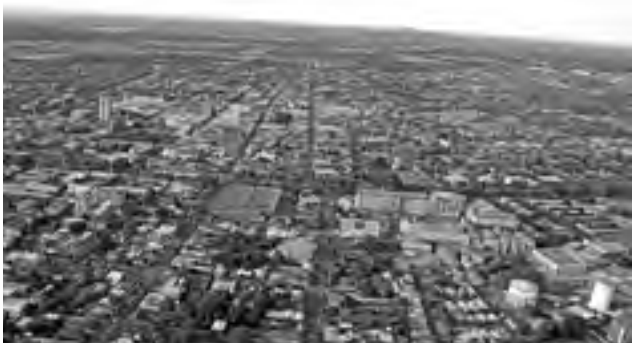
EN LOS ÁNGELES, los delitos violentos han disminuido en un 26% y aquellos cometidos contra la propiedad en un 19%.

Esta cifra corresponde a 565 ilícitos menos en comparación con igual periodo del año pasado; si durante 2014 se registraron dos mil 695 casos, en 2015 el número bajó a dos mil 130.