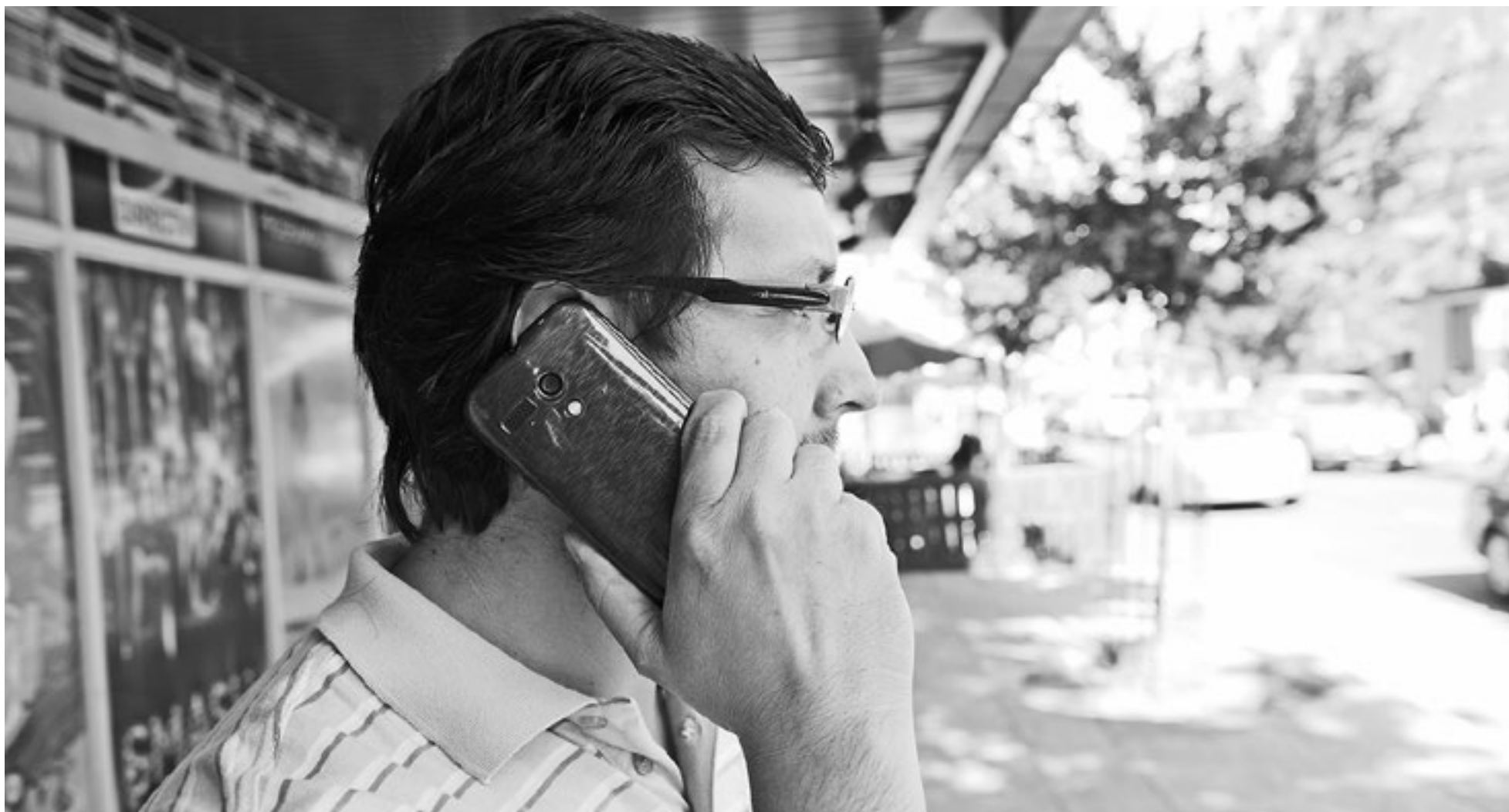
CORROBORAR LA VERACIDAD de la información entregada es una de las recomendaciones para evitar ser víctimas de una estafa telefónica.