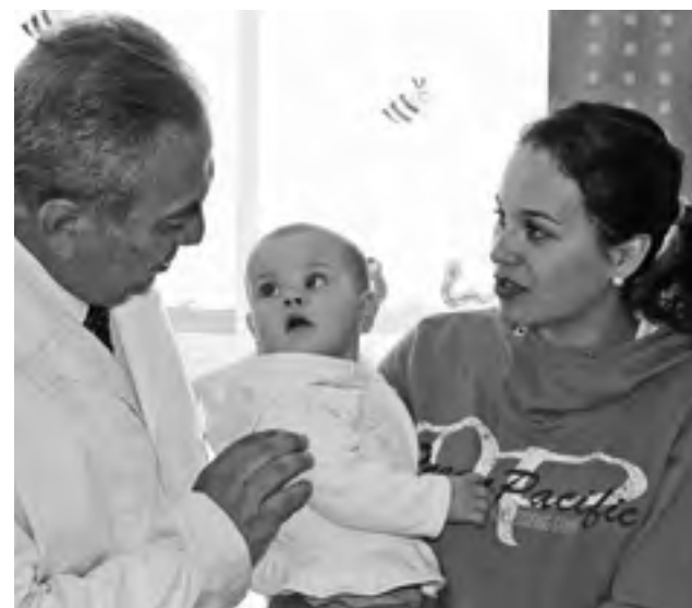
LA VACUNA DISPONIBLE, correspondiente a Influvac del laboratorio Abbott.

cia del Bio Bío, 30 mil 547 ya lo han hecho en estas dos primeras semanas en que el medicamento ha estado disponible a través de las redes asistenciales del sector salud.