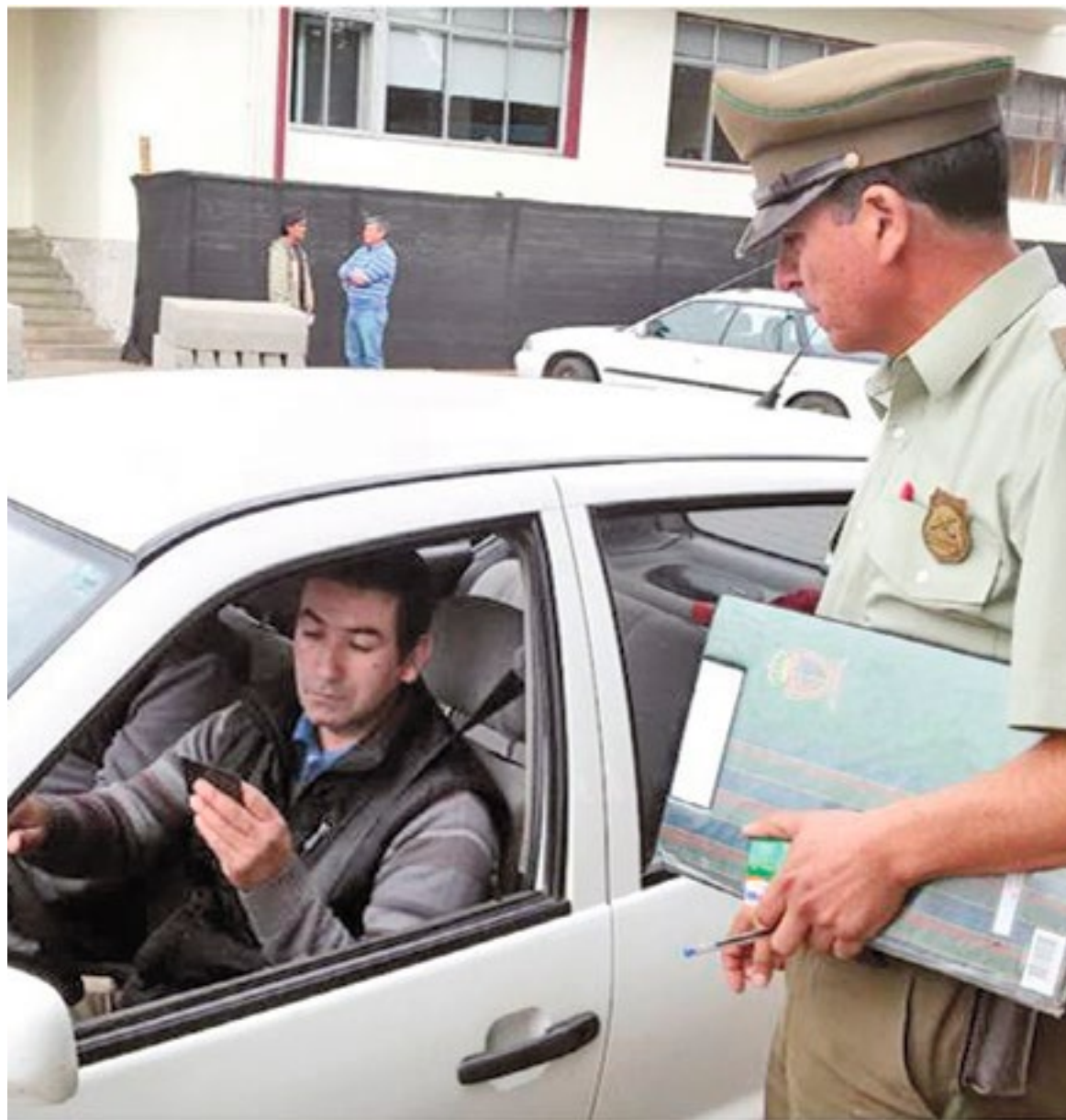
LAS INICIATIVAS ESTUVIERON a cargo de funcionarios de la Oficina de Integración Comunitaria de Carabineros de Mulchén.

La iniciativa también fue replicada en la plaza de armas de la comuna donde Carabineros entregó una serie de recomendaciones para evitar la sustracción de automóviles o de accesorios dentro de estos.