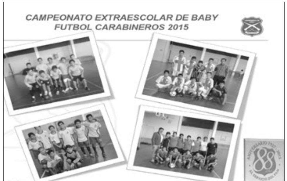
CARABINEROS SE DISPONE a celebrar sus 88 años en Mulchén.

Con una iniciativa distinta, Carabineros de Mulchén quiso dar inicio al mes aniversario, donde la institución cumple este 27 de abril, 88 años de existencia.