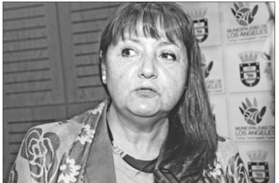
LA EDIL CITÓ LOS DOCUMENTOS del área de Control.