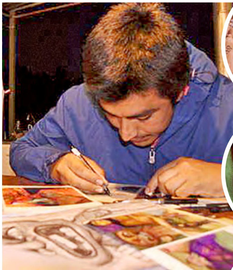
ARTISTA LLAMÓ a no olvidar la historia.

Reconoce como sus principales referentes a Julio Escámez, Santos Chávez, Guillermo Núñez, Nemesio Antúnez, Omar Lara, Floridor Pérez, y en especial los cultores de las