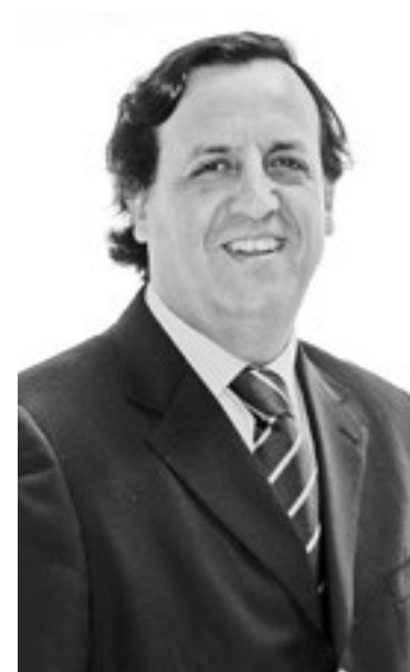
Víctor Pérez Varela Senador de la República

Por lo tanto, el pasar por alto el Día de las Regiones es una mala noticia para nuestras provincias y para millones de personas cuyo gran anhelo ciudadano es que la regionalización sea una realidad. Es por ello y ante esta indiferencia del gobierno que tenemos que levantar nuestra voz con mucha más fuerza, para poder revertir algo que visualizamos día a día y con mayor fuerza, la indiferencia del Gobierno hacia las regiones y sus necesidades, por lo cual, la descentralización debe ser nuestra gran meta a conseguir.