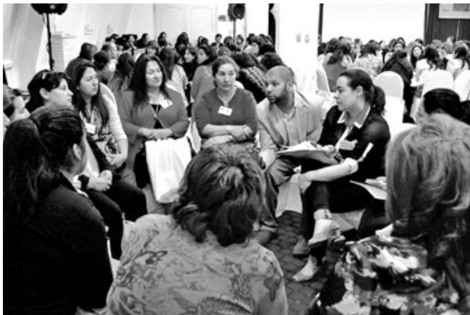
EN LA ZONA, el programa es ejecutado en Cabrero, Los Ángeles, Yumbel, Nacimiento, Laja y a partir de este año en Tucapel.

La autoridad explicó que "en la región del Bío Bío, el 34% de los hogares está encabezado por una jefa de hogar. A nivel nacional es un 39% y la tendencia es a aumentar, lo que significa que más mujeres son receptoras principales de ingresos, o bien que más mujeres están asumiendo solas sus hogares. Lo que resulta muy preocupante es que un 55% de esos hogares se encuentra en situación de extrema pobreza. Por eso es relevante la existencia de un programa que trabaje con jefas de hogar, además porque estas acciones generan un efecto multiplicador, está