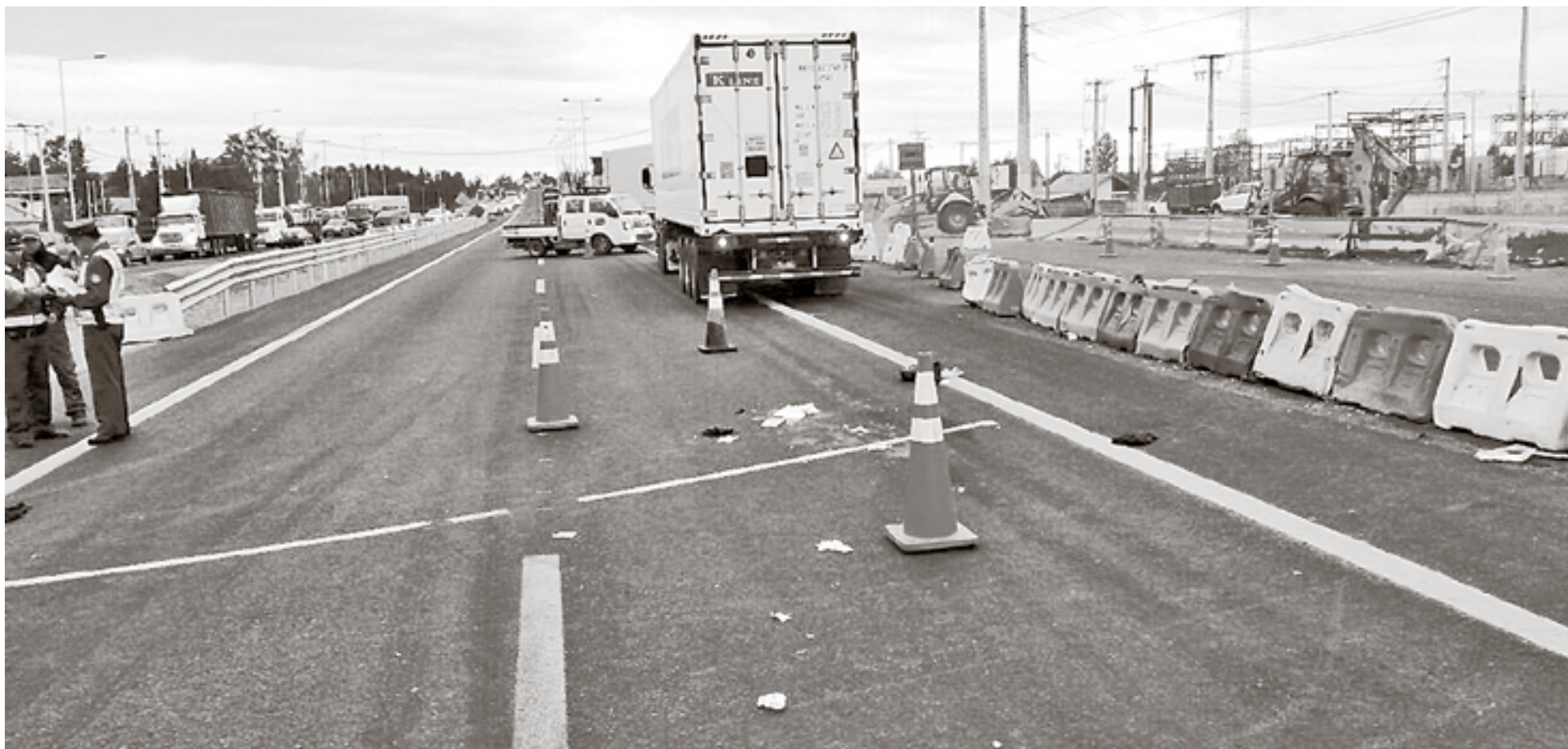
UN CICLISTA RESULTÓ CON lesiones graves después de que fuera impactado por un camión en la Ruta Q-50.