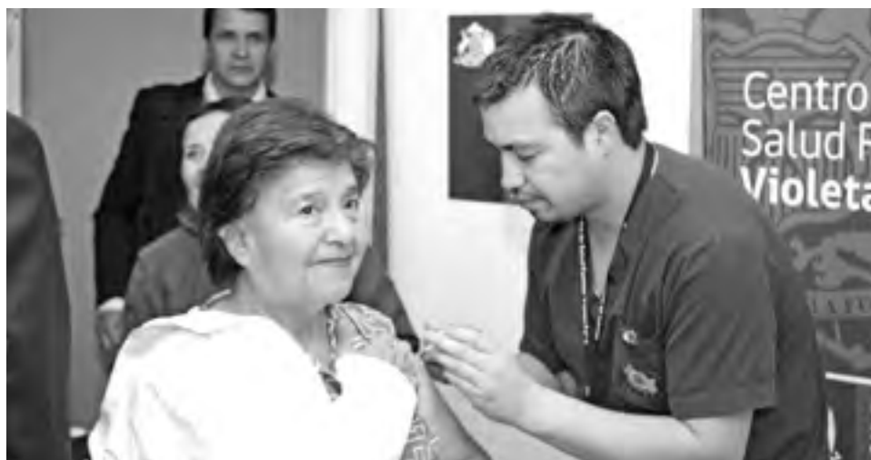
YA ESTÁ INMUNIZADO el 38,9% de los adultos mayores de 65 años.

La inmunización disponible, correspondiente a influvac, la que cumple con la recomendación de la Organización Mundial de la Salud sobre cepas para el Hemisferio Sur y requisitos de seguridad, y permite prevenir una enfermedad contagiosa causada por los virus de la influenza, y que pueden conducir a complicaciones severas como neumonías, dificultad respiratoria, diarrea, convulsiones en