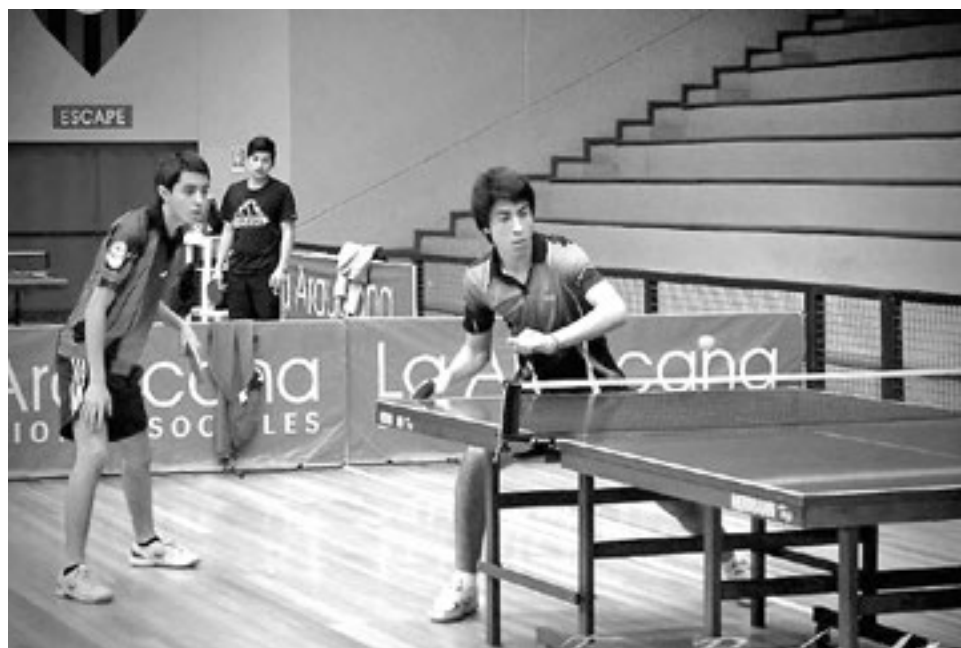
EN NUESTRA PROVINCIA están los mejores tenimesistas de la región de Bío Bío, y lo demostraron en Talcahuano.