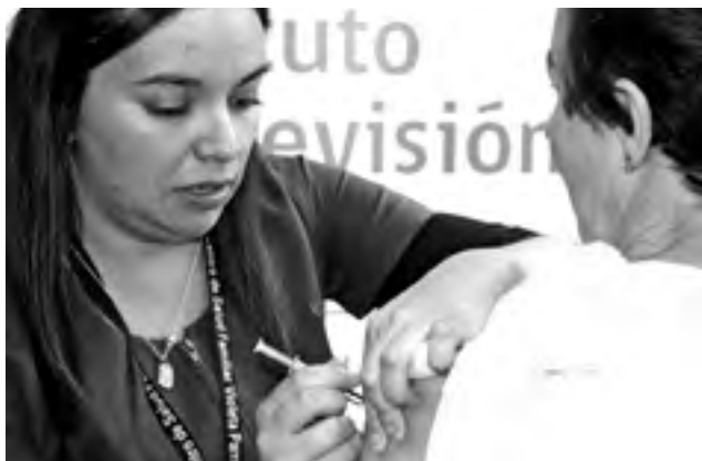
EL 59,1% de los enfermos crónicos de la provincia ya se han vacunado.