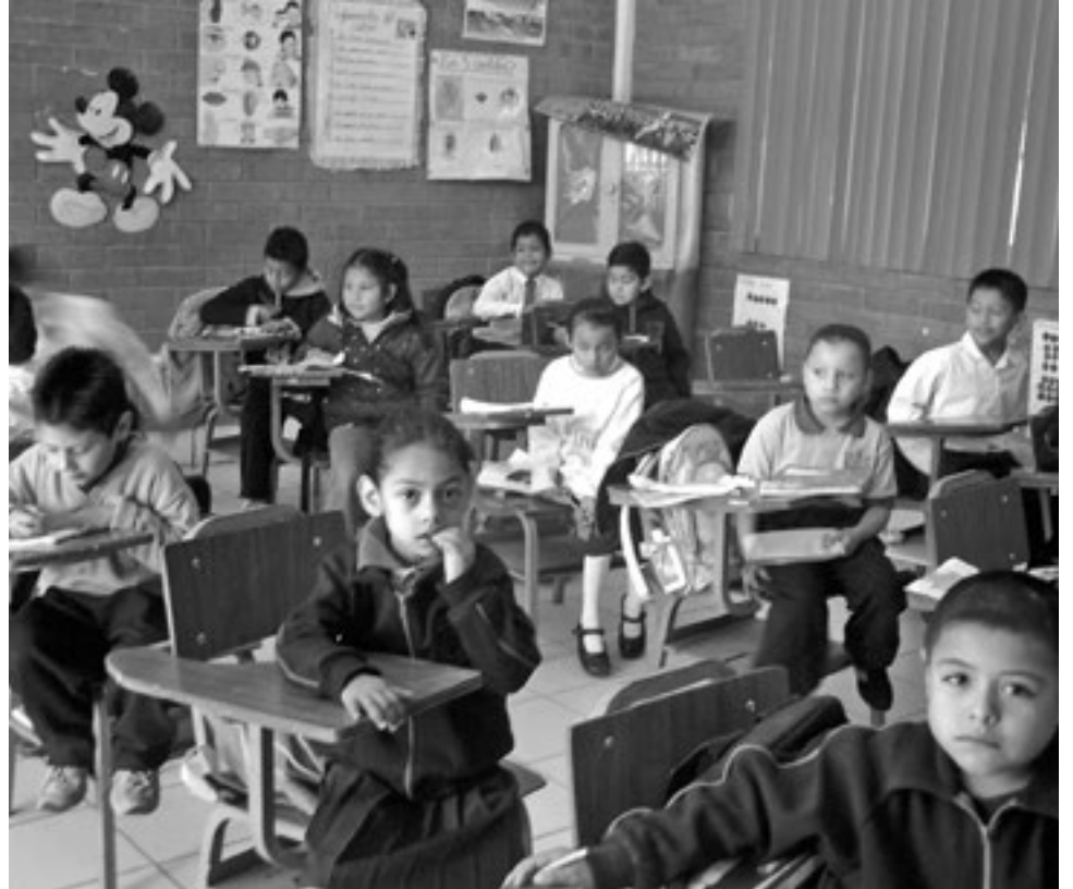
EL PROYECTO BUSCA mejorar la infraestructura de 3 escuelas rurales.

Stark concluyó que el alcalde debe investigar los errores administrativos. "La idea es que, si hay faltas de procedimiento, las deben subsanar a la brevedad, y es el alcalde el llamado a ver esto. Por otro