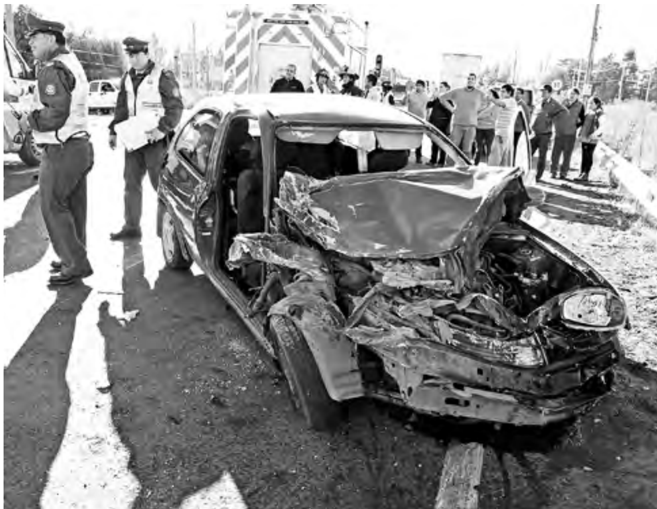
DOS PERSONAS LESIONADAS fue el saldo que arrojó una colisión frontal ocurrida a la altura del kilómetro 503 de avenida Las Industrias.

Por causas que se investigan “un vehículo de carga, un