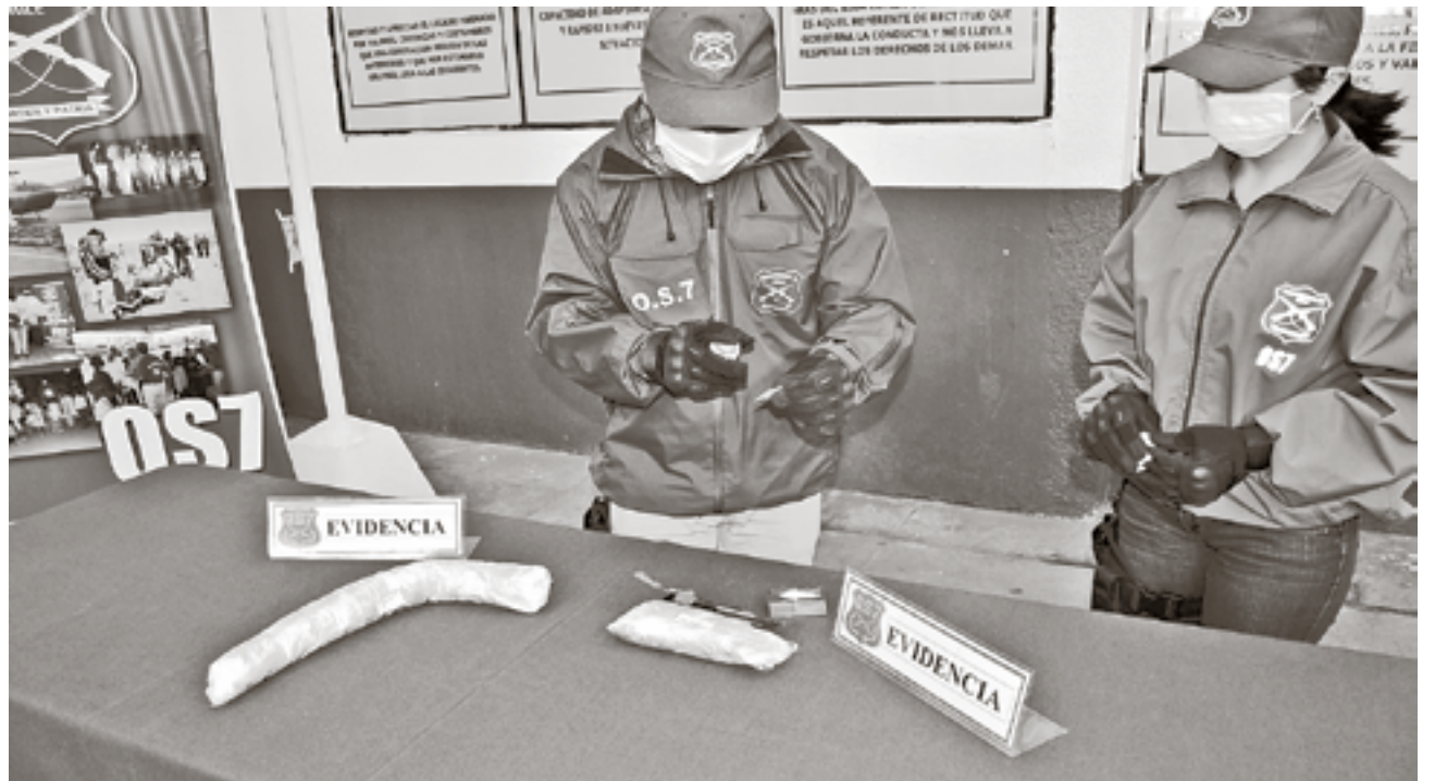
LA DROGA INCAUTADA por el O.S.7 fue evaluada en 15 millones de pesos.

Ambas provenían de la ciudad de Arica y habrían venido a Los Ángeles exclu-