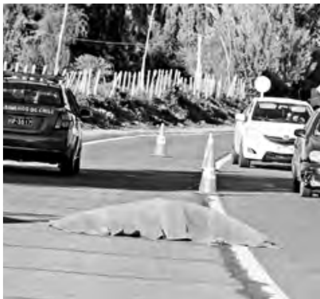
UNA PERSONA perdió la vida después de ser atropellada por un camión en el kilómetro 18 del camino a Antuco.

Asimismo, aún faltaba la constatación de lesiones y la alcoholemia, diligencias que estaban siendo efectuadas en el Complejo Asistencial Dr. Víctor Ríos Ruiz de Los Ángeles.