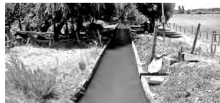
PROYECTO SERÁ EJECUTADO por el Centro Regional de Estudios Ambientales de la UCSC.

El proyecto comenzó su aplicación en abril y tiene una duración de 24 meses, trabajará directamente con 30 agricultores, con un impacto estimativo de beneficio indirecto para 2000 familias de la provincia del Bío Bío.