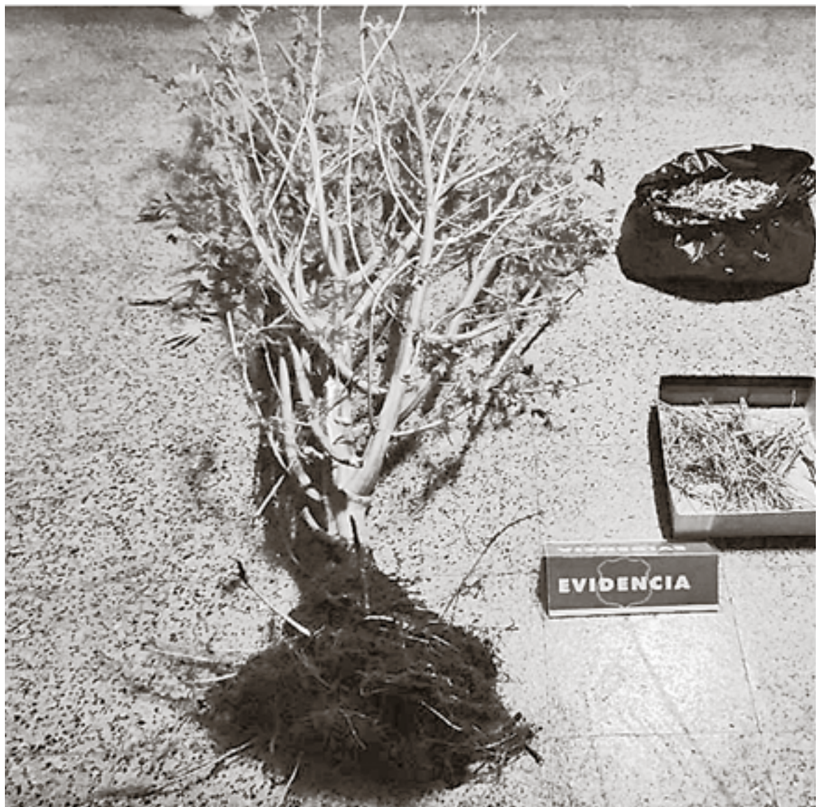
LA DROGA DECOMISADA evitó que una suma importante de dosis llegara a los consumidores.