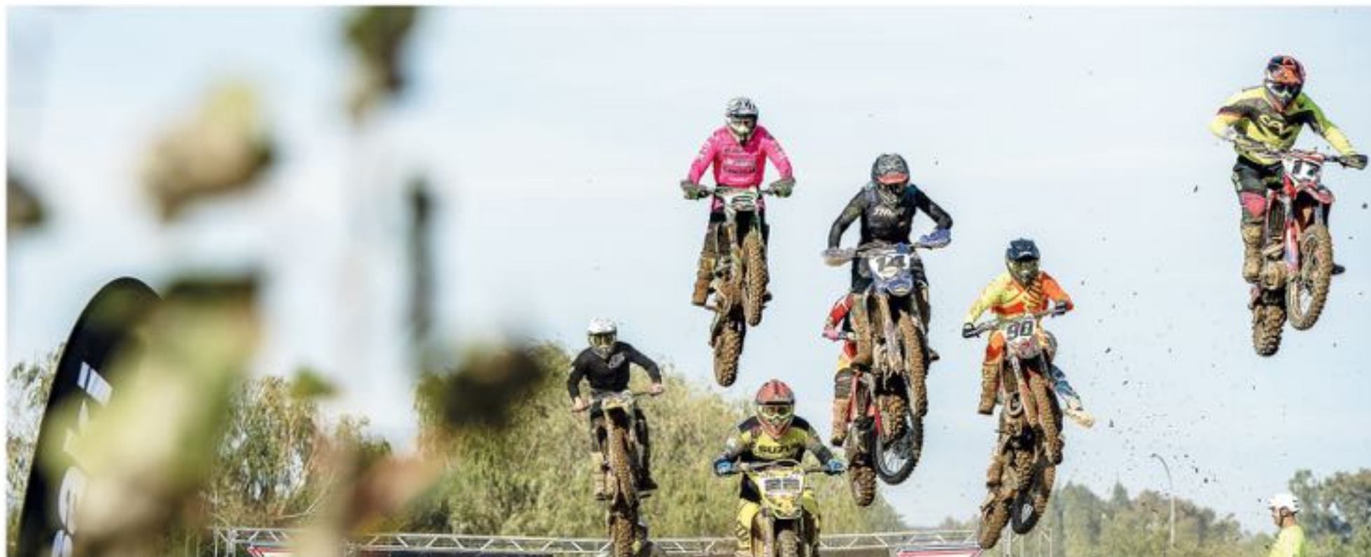
LOS MEJORES PILOTOS del país e incluso de Sudamérica se verán las caras en Los Ángeles.

Tras años de ausencia, la capital de la provincia de Biobío vivirá una fecha de la máxima cita del motocross en el país.