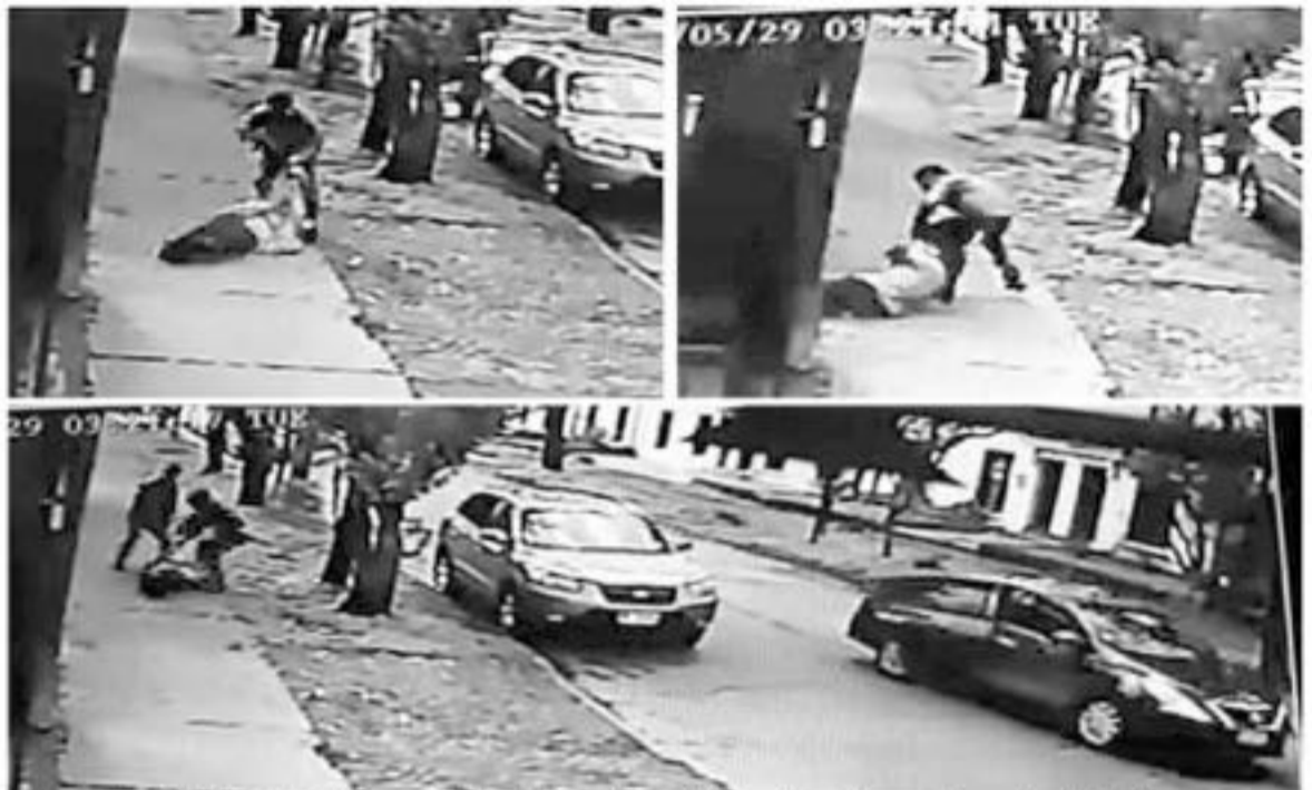
ESTE ACTO DE VIOLENCIA quedó al descubierto, luego de la circulación de un video que fue difundido por cámaras de seguridad aledañas a la vivienda de esta mujer.