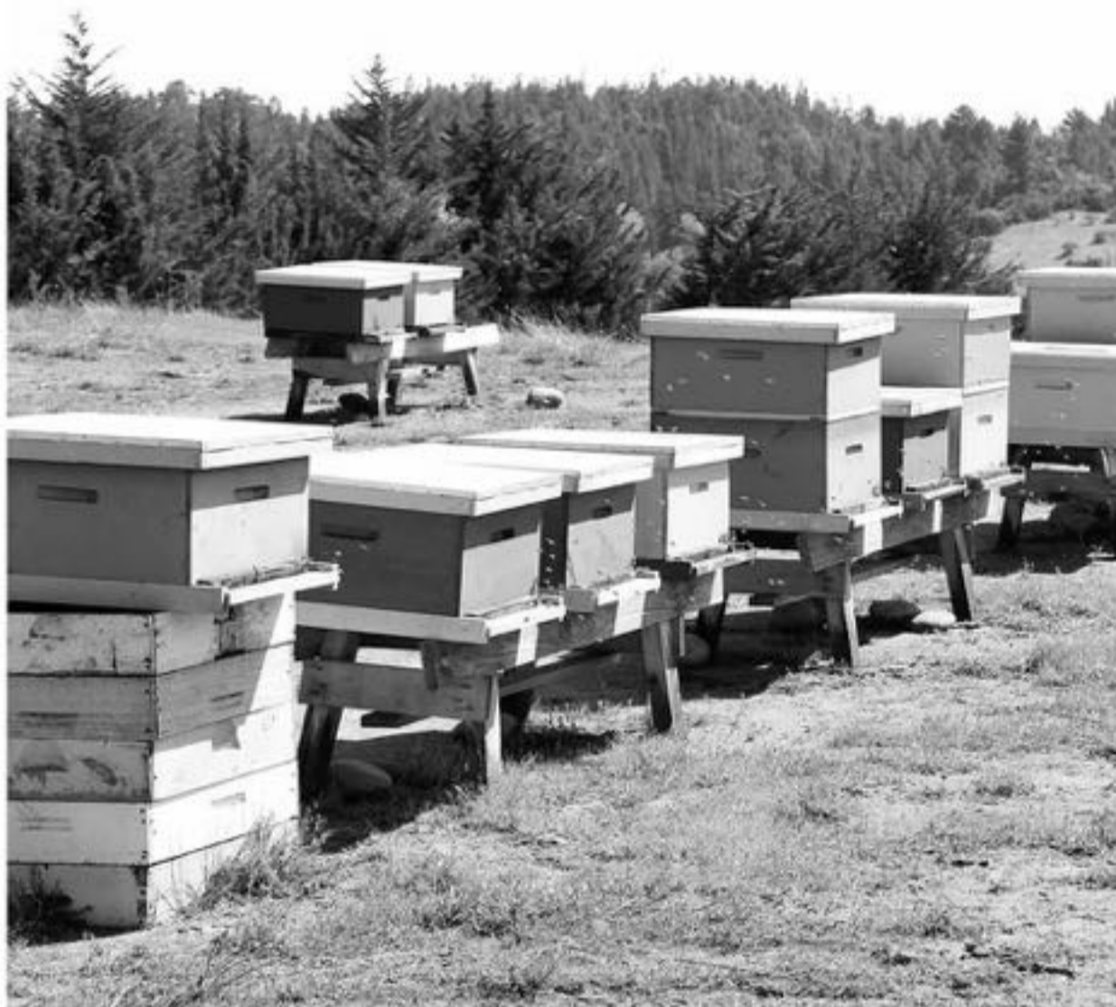
SE HAN DETECTADO FOCOS de esta enfermedad en O'Higgins y Maule.

Loque americana es una enfermedad producida por la bacteria Paenibacillus larvae larvae , que afecta a una o más colmenas en un apiario, provocando, en un principio, una menor producción de miel y finalmente la muerte de la colmena. Para controlarla se deben eliminar las colmenas infectadas. Por ello el profesional llamó a los apicultores que frente a la sospecha de loque americana, den aviso inmediato al SAG y no apliquen antibióticos, ya que, si bien atenúan los síntomas, no los eliminan, pudiendo además dejar residuos en la miel, los que al ser detectados en los mercados de exportación pudieran provocar el cierre de éstos.