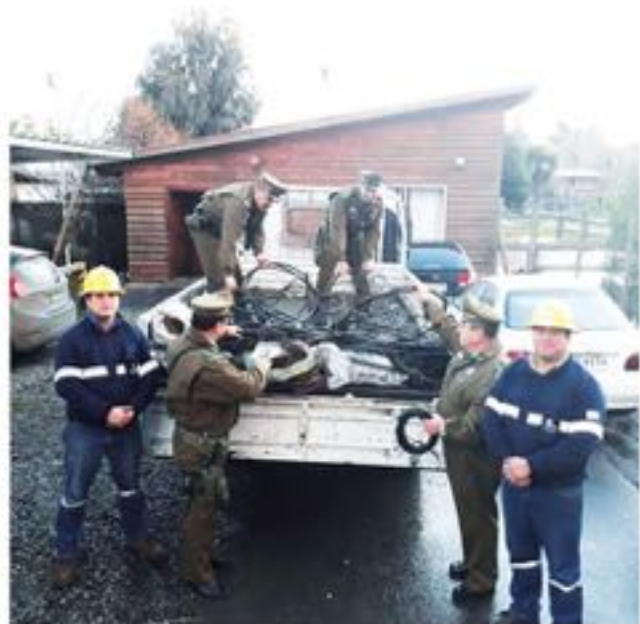
EL INDIVIDUO FUE SORPRENDIDO mientras realizaba la quema de material en un sitio erizado.

En el suceso se presentó personal de la empresa Coopelan, quienes se constituyeron en el lugar reconociendo el cable y la pérdida de estas especies.