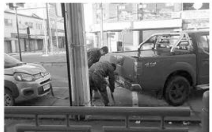
POR ESTE INCIDENTE se generó una investigación para determinar las reales causas de la colisión.

Sobre los involucrados, se trataba de dos mujeres, M.M.F y E.P.A., quienes manifestaron haber cruzado con el semáforo en verde, por lo que se generó una investigación al respecto, para determinar el estado de ambas, en esta colisión.