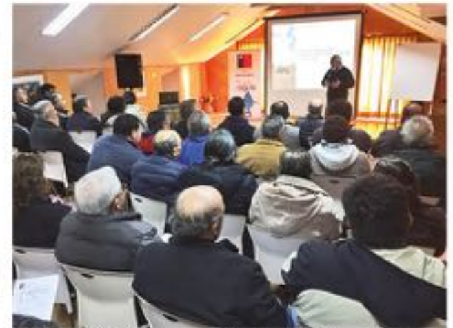
AGRICULTORES y actores del territorio de influencia del Canal Biobío Negrete participaron en el seminario Innovación y Emprendimiento para la Gestión de la Calidad.

Este programa que realiza la CNR que apunta a mejorar la gestión de la calidad