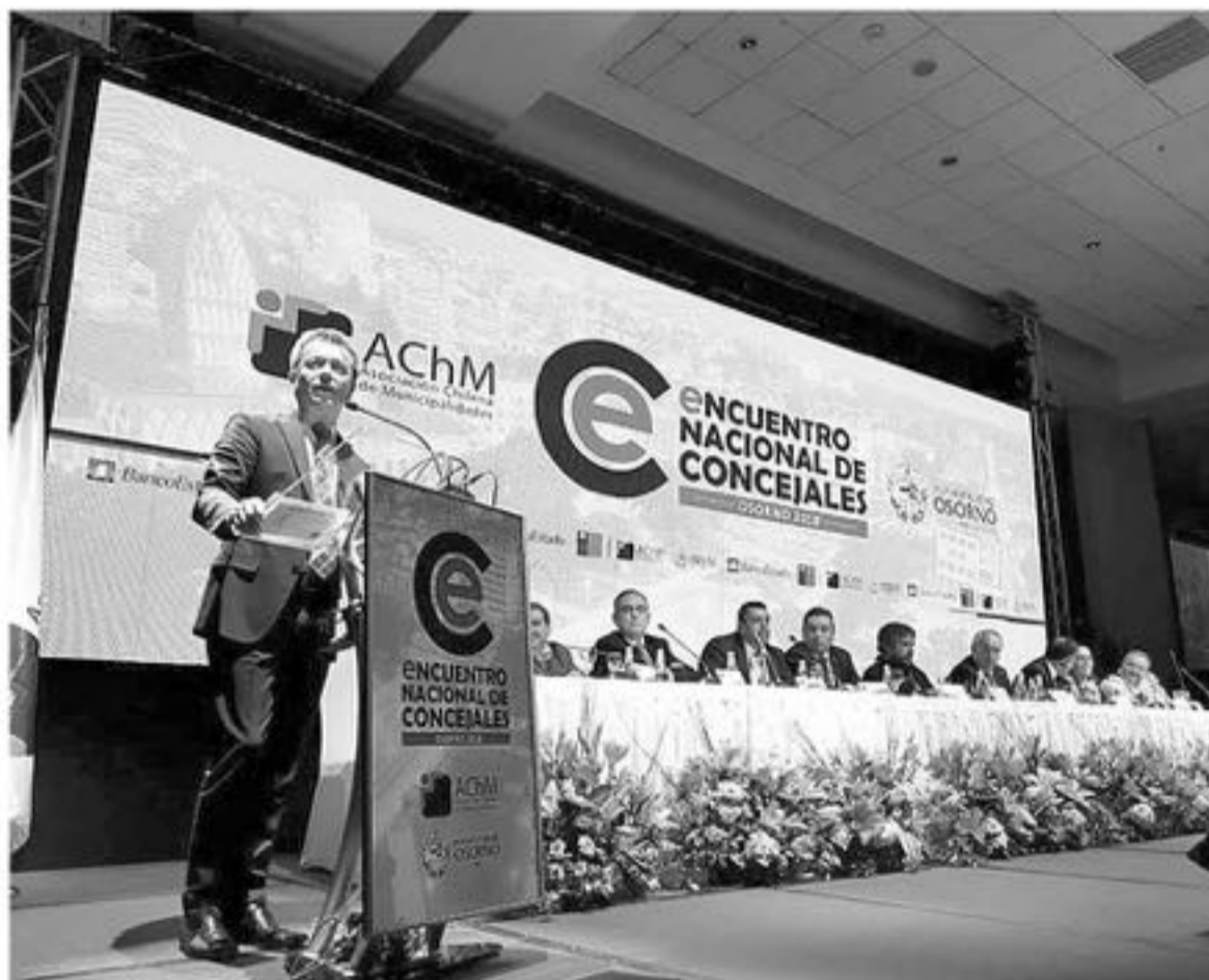
EL SUBSECRETARIO FELIPE SALABERRY anunció que los concejales de todo el país podrán capacitarse gratis ahora a través de la Academia Municipal de la Subdere.

cia de Biobío que asistieron a este Encuentro Nacional de Concejales fue Luis San Martín de Cabrero, quien también celebró la medida anunciada por el subsecretario Salaberry.