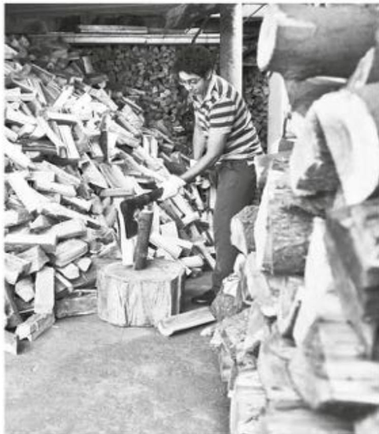
HASTA EL 14 de junio se podrá postular a la iniciativa.

“Los empleos por cuenta propia siguen aumentando en un 18,2% lo que eso significa que para nosotros es bastante preocupante, y se condice obviamente con la disminución del crecimiento económico a nivel nacional y a nivel regional”