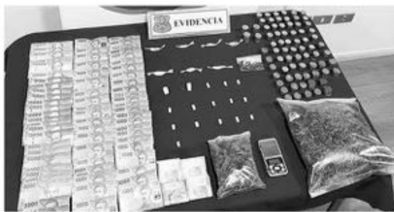
EN EL OPERATIVO se logró recuperar una importante cantidad de marihuana elaborada.

El operativo se generó por medio de una investigación, por orden de fiscalía, donde los profesionales lograron detectar esta venta ilegal.