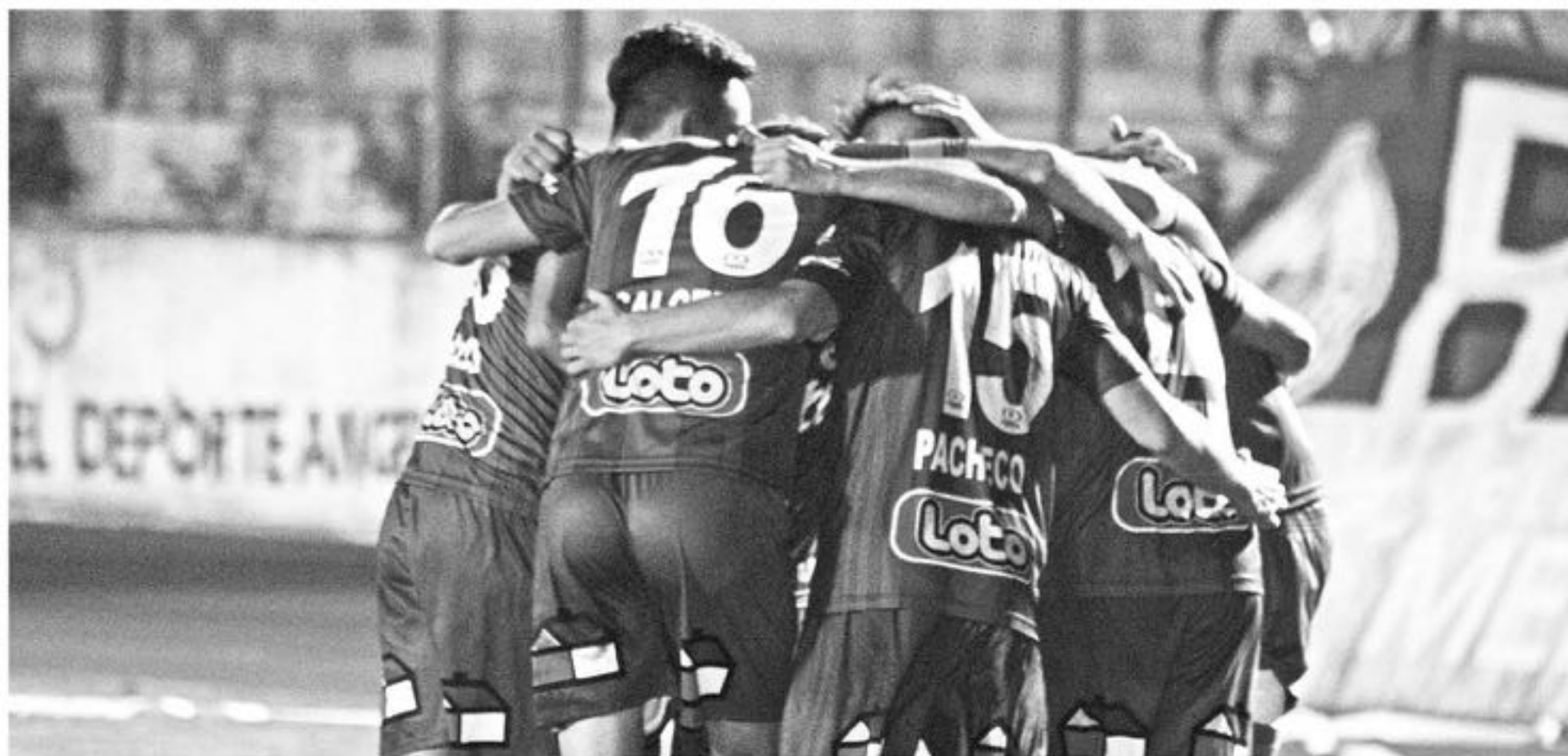
IBERIA QUIERE seguir abrazándose.