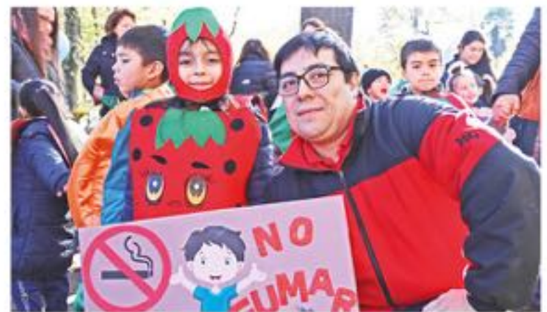
EL EVENTO fue organizado para llamar la atención de los habitantes de esta ciudad.