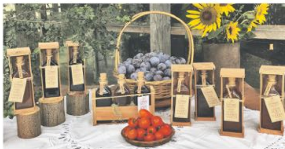
SIRROPE, producto 100% natural hecho por la polcurana.

"Mi mamá era una tejedora, maravillosa y vivimos en Polcura cuando éramos chicos, somos 6 hermanos, y ella a todos por igual nos enseñó a tejer. Mi hermana y yo, somos fanáticas del tejido,