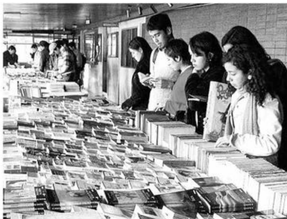
LOS LIBROS FUERON destinados a establecimientos educacionales enfocados en la enseñanza técnico profesional agrícola (Foto de contexto).

La institución ha donado insumos a diferentes establecimientos educacionales, principalmente a aquellos enfocados en la enseñanza técnico profesional agrícola.