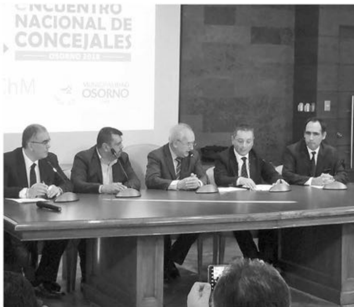
TEMAS EN SALUD, educación pública, transparencia y probidad, entre otros serán abordados en este nuevo encuentro nacional de concejales.

El Encuentro de Concejales será sin duda, la instancia más importante que tendrán las autoridades locales durante este año y se espera que en el debate surjan temas como "concejales on tour"; pago de impuestos por la dieta; permisos de pre y post natal de las concejalas y el desarrollo de una agenda que permita visibilizar el trabajo de fiscalización que realizan en las municipalidades.