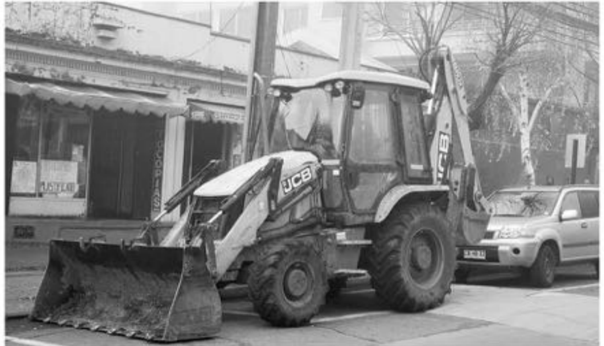
LA MÁQUINA ESTABA SIENDO ARRENDADA por un empresario local, por lo que se mantienen una investigación al respecto para determinar el origen y uso.

Sin embargo, luego de la fiscalización, los profesionales corroboraron que el vehículo detectado, no correspondía al de los denunciados,