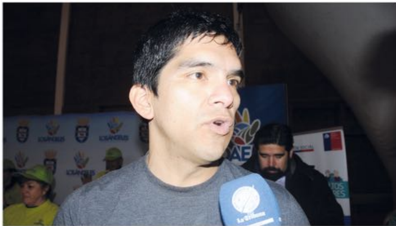
LA MÁXIMA AUTORIDAD de la carrera en la región se mostró tranquilo con las reuniones que se han sostenido.

Pese a que no se atrevió a dar un plazo oficial, reconoció que todo se está llevando a cabo con el fin de poder comenzar luego la edificación de la estructura.