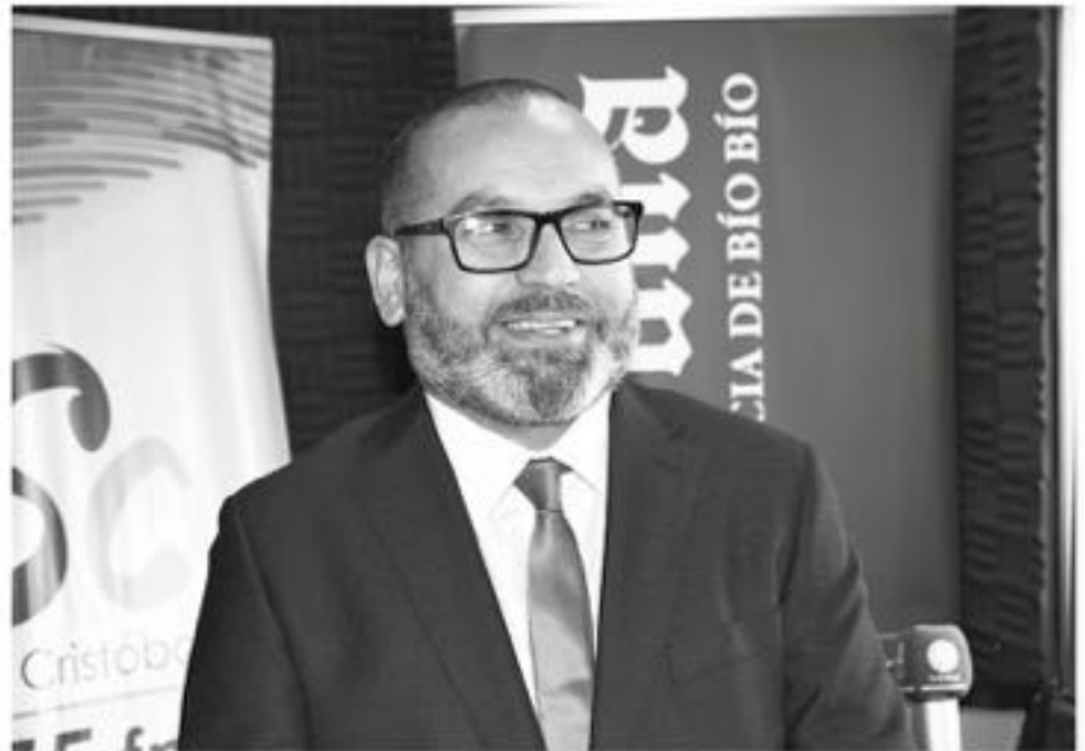
AEDO DESPEJÓ dudas en torno al complejo panorama.

-Es común que la sociedad en general guarde silencio en una violencia, no solamente los niños, ellos no son una excepción a lo que es una estructura social.