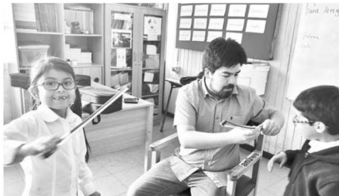
MUY ENTUSIASMADOS SE ENCUENTRAN los alumnos de la escuela por aprender música docta.