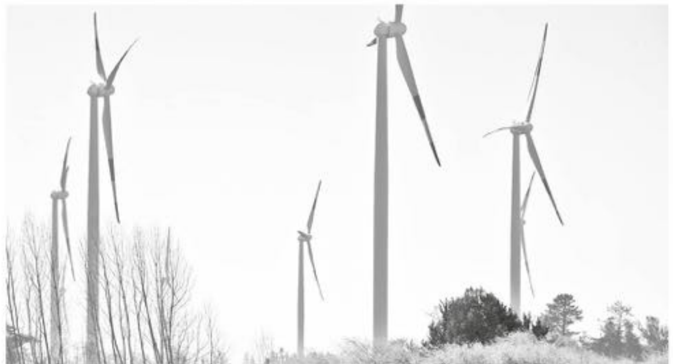
EL PROYECTO se localizará en Los Ángeles, Negrete y Mulchén, muy próximo a la Ruta 5.

Entre los objetivos de la propuesta energética se considera responder a la creciente demanda residencial e industrial del país; compatibilizar la operación de la planta con otras actividades como