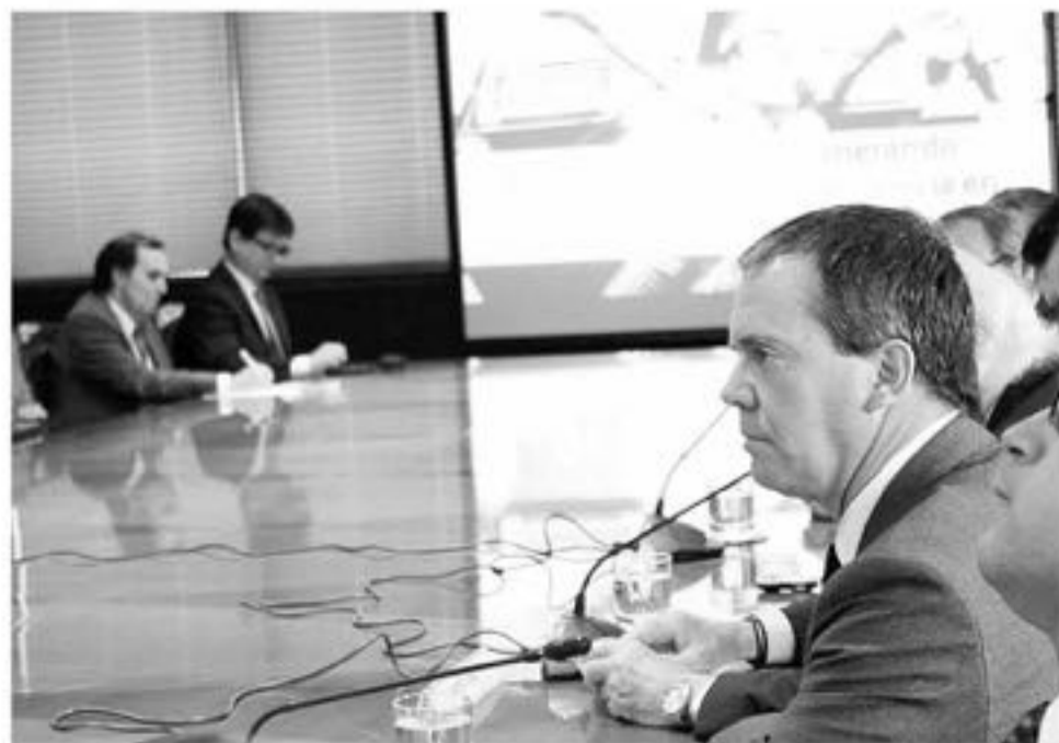
EL LANZAMIENTO de la iniciativa se llevó a cabo en la Cámara de Comercio de Santiago.

Por último, cabe destacar que la Alianza Chilena de Ciberseguridad está integrada por nueve instituciones: La Asociación de Aseguradores de Chile, la Asociación Chilena de Empresas de Tecnología de Información, la Cámara Chilena Norteamericana de Comercio (AmCham Chile), la Cámara de Comercio de Santiago (CCS), el Colegio de Ingenieros de Chile, la Facultad de Ciencias Físicas y Matemáticas de la Universidad de Chile, la Fundación País Digital, el Instituto Chileno de Derecho y Tecnologías y la Universidad Tecnológica de Chile Inacap.