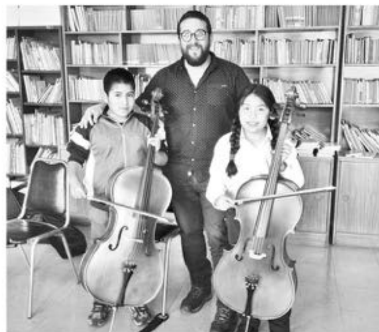
LOS FORMADORES de estos futuros músicos poseen gran experiencia.