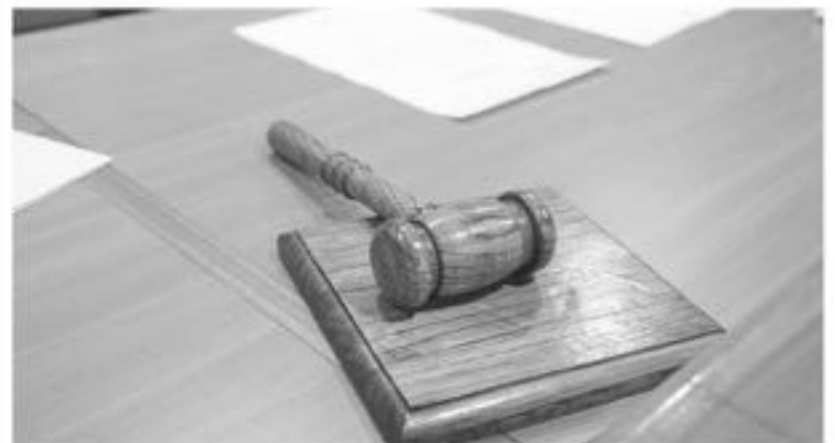
EL HOMBRE quebrantó una orden de alejamiento emitida por el Tribunal de Familia.

Por este delito, el tribunal angelino determinó que el hombre fuera condenado por lesiones leves y lo absolvió por desacato. Sentencia se va a conocer este 4 de junio a las 15:00 horas.