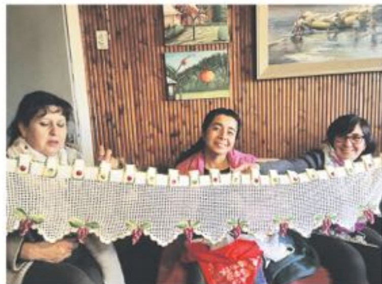
PARTE DEL GRUPO de mujeres de Manos de la Cordillera.

Todos los productos los comercializan a través de internet, por su página de facebook desde Polcura a todo el mundo.