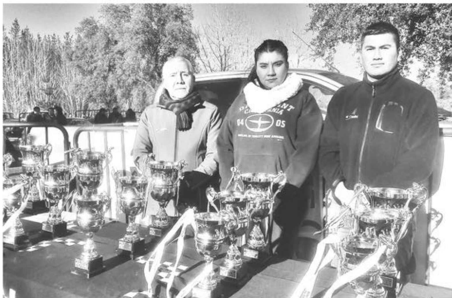
LOS TROFEOS ya están listos para los ganadores.

Tanto los organizadores, producción y representantes de la empresa dieron a conocer que para esta jornada habrá interesantes puntos que dar a conocer con la previa de esta actividad y para lo cual darán a conocer detalles en un lanzamiento con muestra estática y donde la comunidad podrá ver más de cerca los coches que generalmente se aprecian a distancia en el recinto deportivo, dando la ocasión para