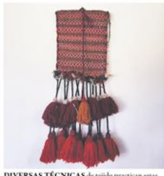
DIVERSAS TÉCNICAS de tejido practican estas mujeres, que se reúnen sagradamente todos los lunes.