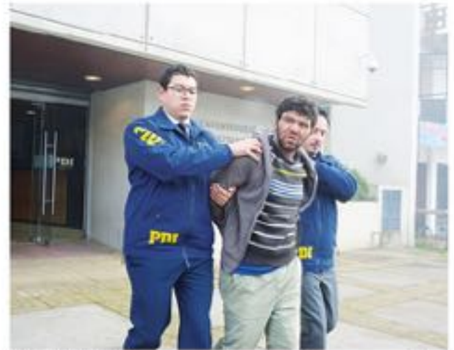
EL HOMBRE conocido como "El correccaminos" es un reconocido delincuente local.

En tanto desde Servicio Nacional de la Mujer y Equidad de Género (Sernameg), explicaron que la víctima aceptó el patrocinio legal y la derivación al centro de apoyo a víctimas de este tipo de delito, tanto para ella como familiares que se vean afectados.