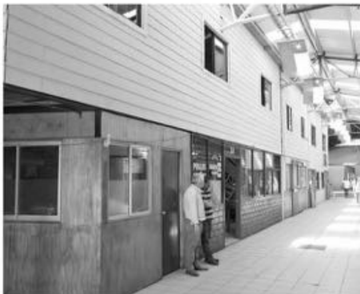
EL HOMBRE MANTENÍA una comercialización de artículos robados en el sector de la Vega Techada.

El hombre fue detenido luego que los mismos locatarios se dieran cuenta de los actos que realizaba.