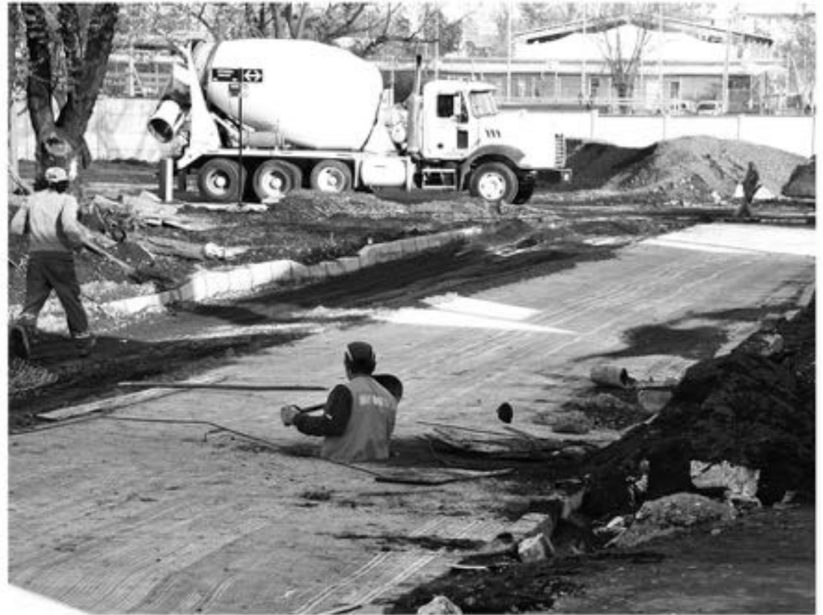
LA EMPRESA CISO LIMITADA es la que se encuentra a cargo de las obras de pavimentación de calle Ruiz Aldea, en Los Ángeles.

"En este caso los vecinos responsabilizan a la constructora, porque esto nunca había sucedido antes",