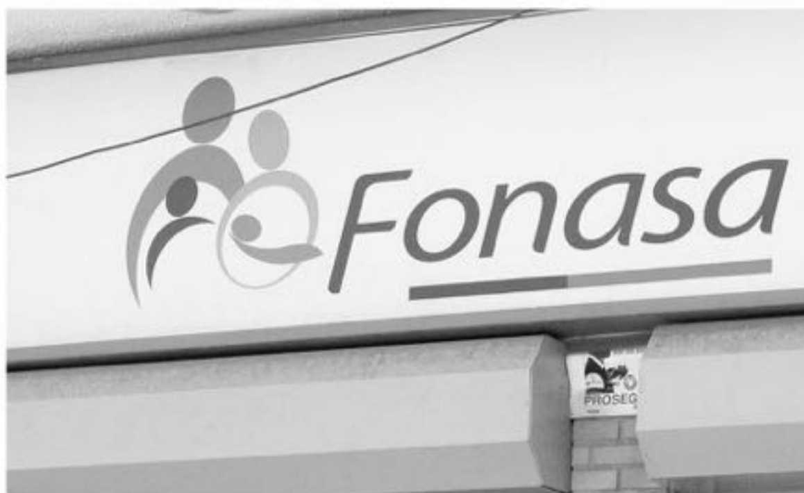
LOS COTIZANTES Y EMPLEADORES tienen hasta el 17 de junio para revisar las propuestas de devolución.

Para consultas, los usuarios deben visitar el sitio web www.fonasa.cl sección "Servicios en