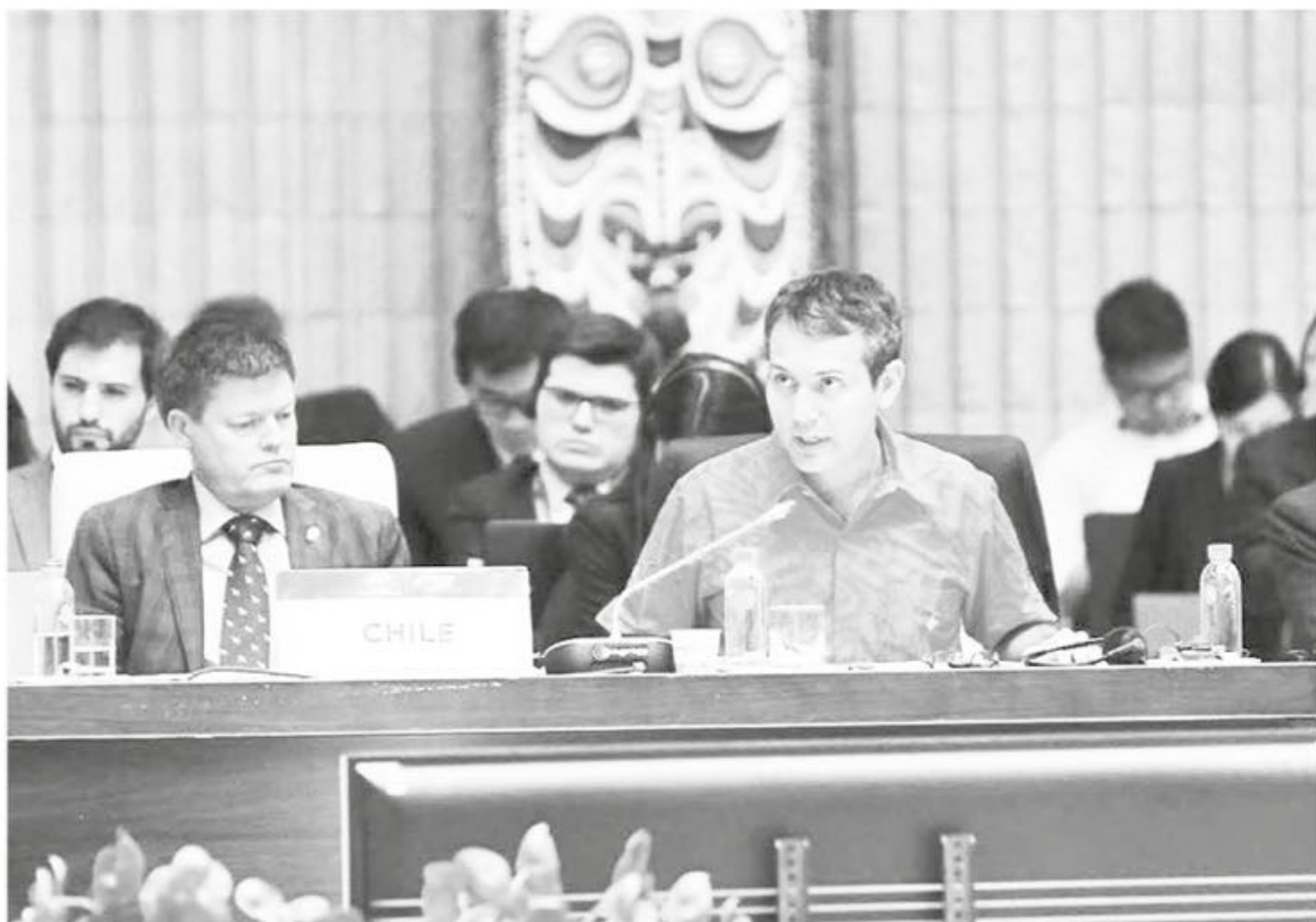
EL DIRECTOR GENERAL de la Direcon señaló que es necesario hacer una reflexión respecto de las oportunidades que ofrece la Era Digital.