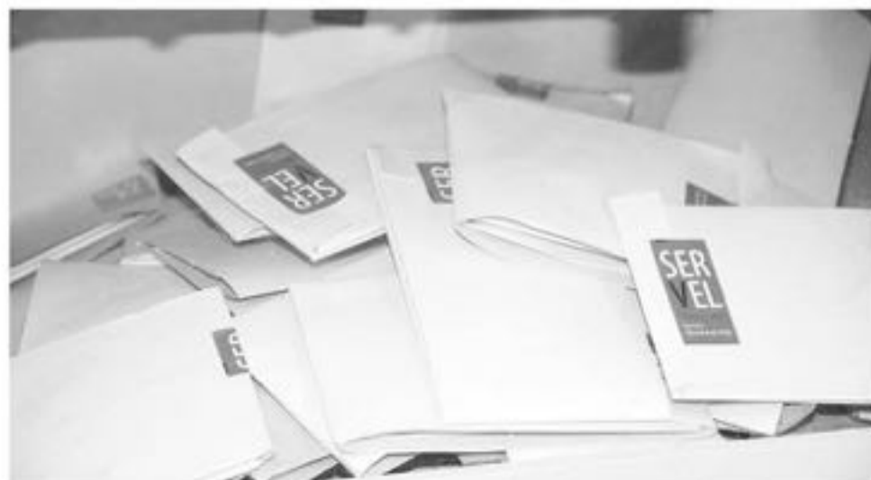
UN 12,5% DEL TOTAL NACIONAL se lleva la región del Biobío en cuanto al pago de devoluciones del Servel a candidatos a cores durante el 2017.

Cabe señalar que, para dar curso a las devoluciones mencionadas, deben haber pasado 20 días hábiles desde que el Servel emitiera la resolución de aprobación de la cuenta de ingresos y gastos que presentó el administrador electoral o el candidato, lo cual ocurrió el pasado 19 de abril. De este modo, según lo establecido en el artículo 17 de la citada ley, los gastos en que incurrieron los candidatos durante sus campañas son reembolsados hasta por una suma que no exceda de las 0,04 UF multiplicadas por el número de sufragios que hayan obtenido en la elección. Si el total de los gastos rendidos son inferiores a la suma que resulte, la devolución de gastos se ajustará a los efectivamente realizados. Por el contrario, del total de gastos rendidos solo se autoriza el reembolso hasta el monto que resulte del cálculo mencionado.