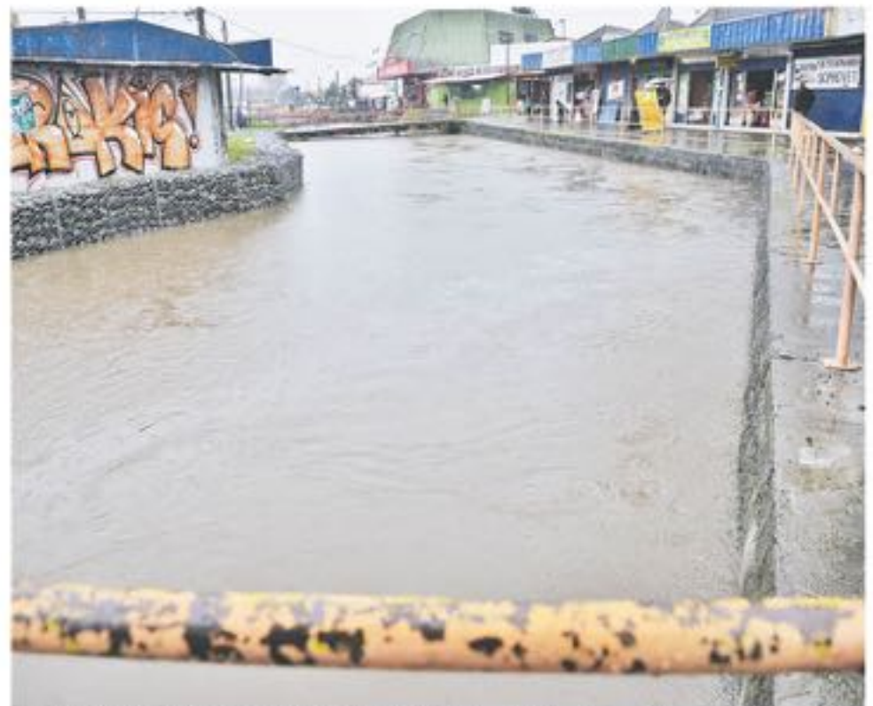
LOS CAMBIOS ESTRUCTURALES de la ciudad también han afectado la capacidad de conducción que debe tener el estero Quilque señalan desde la asociación.

bién se mostró interesada a partir de lo sucedido señala Sanhueza.