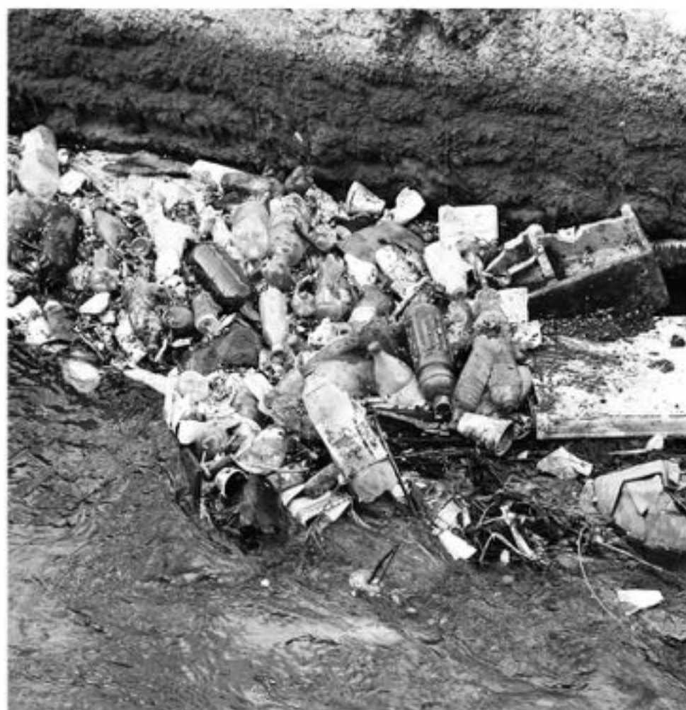
LA BASURA impide el normal desplazamiento del agua.

Durante la "alerta roja" todas las compañías del Cuerpo de Bomberos de Los Ángeles realizaron un arduo trabajo en apoyo a las emergencias que se presentaron durante todo el día en diferentes sectores de la ciudad.