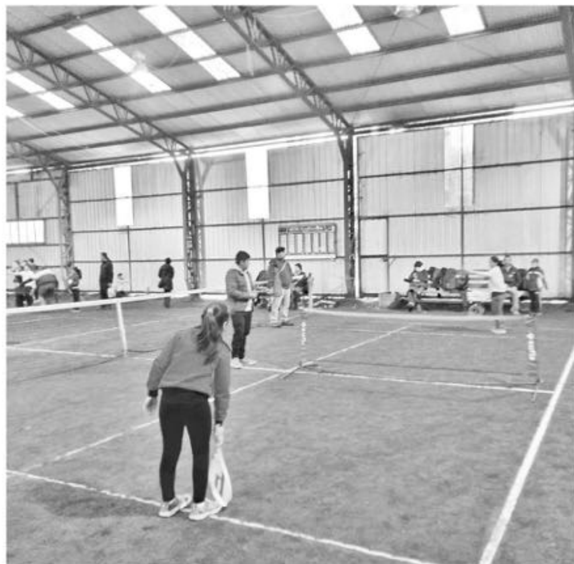
NIÑOS Y NIÑAS LLEGARON hasta el club Avellanito para ser parte de la actividad

Realizado el pasado fin de semana, el evento se llevó a cabo en el club Avellanito.