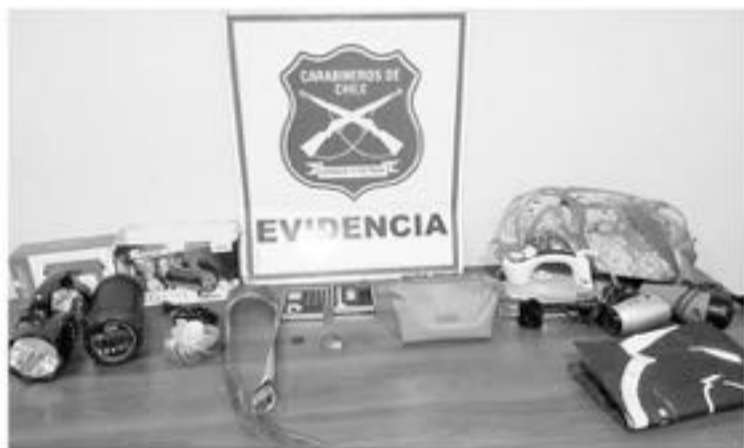
LOS ARTÍCULOS fueron sustraídos, mientras la familia se mantenía en su domicilio.

El responsable del acto, se dio a la fuga luego de ser sorprendido por efectivos policiales que realizaban un patrullaje preventivo.