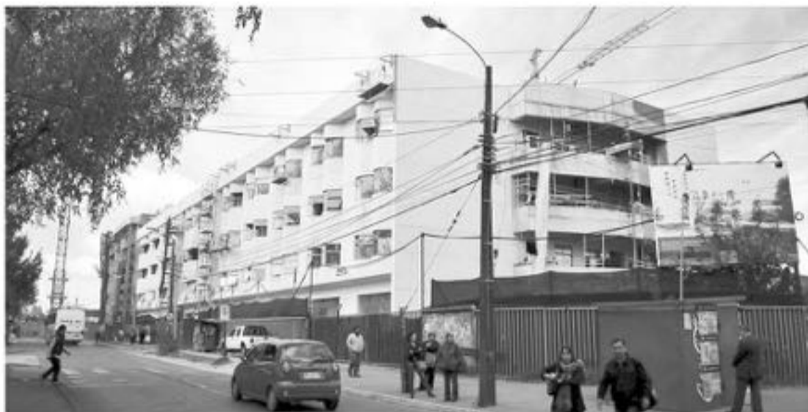
POR EL MOMENTO la mujer se mantiene fuera de riesgo vital.

Cabe recordar que, según las investigaciones generadas por personal de la