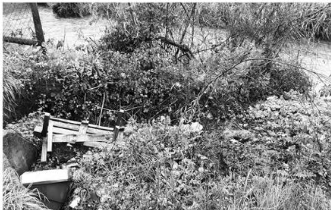
AL FINAL DE AVENIDA ORIENTE con Costanera Quilque Norte son arrojados desperdicios.

El efecto lluvia fue una causal secundaria de esos desbordes" dijo, al agregar que tras la situación vivida en el sector de los terminales de buses rurales de calle Villagrán, se produce porque hay una especie de cuello de botella en ese tramo. "El estero viene canalizado del sector