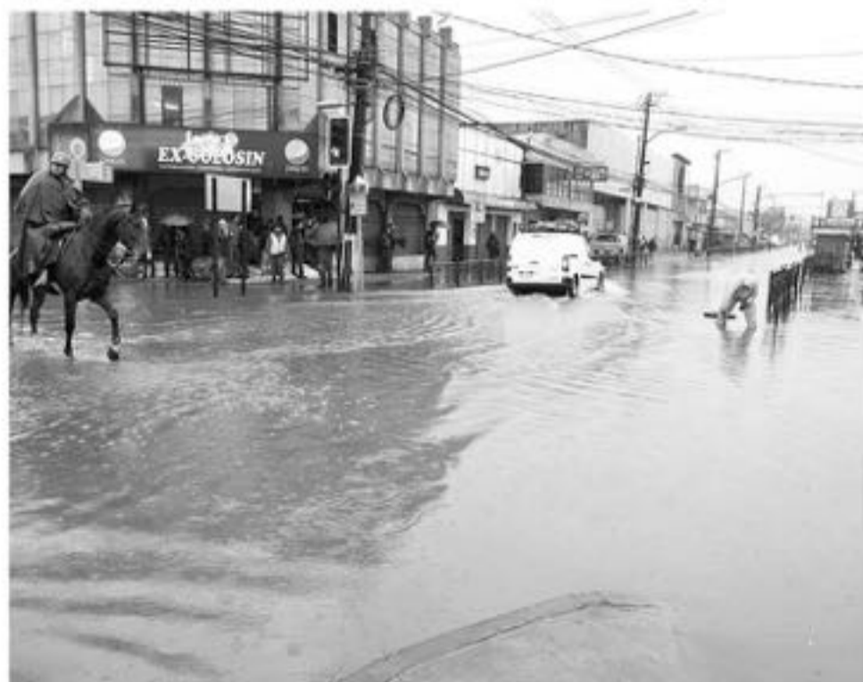
LA GOBERNADORA DE BIOBÍO confirmó que la alerta roja decretada por la Onemi fue levantada durante la mañana de este martes.

Al desborde del Quilque en Los Ángeles se sumaron otras situaciones como el rebalse de alcantarillados en Mulchén y corte de caminos producto de derrumbes sucedidos en Alto Biobío.