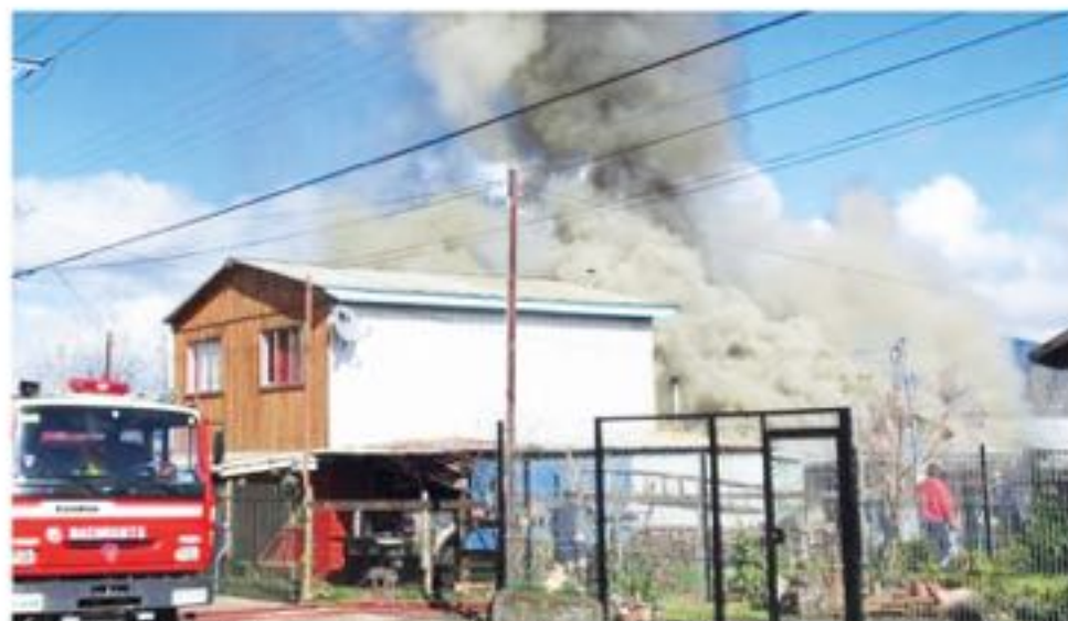
LA VIVIENDA resultó consumida en un 70% debido a este desperfecto.

Cabe destacar que en la vivienda afectada, residían dos adultos, donde no se pudo recuperar especies por la rápida propagación de las llamas en el lugar.