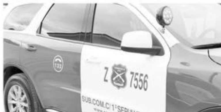
EL HOMBRE FUE DETENIDO en el sector norte de Los Ángeles, portando sustancias ilícitas.

El hombre se mantuvo en control de detención, para generar una investigación al respecto, sobre la procedencia de las sustancias.