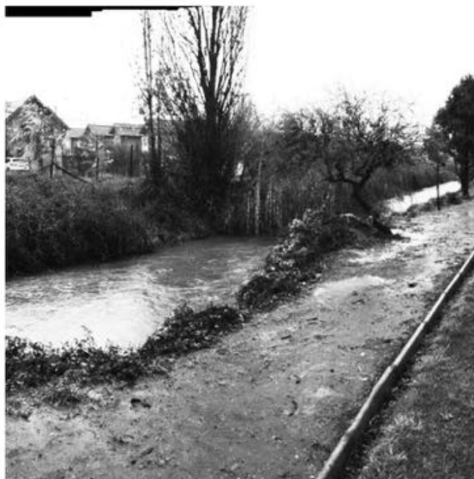
LA LLUVIA FUE UN FACTOR SECUNDARIO en el anegamiento de céntricas arterias de Los Ángeles.