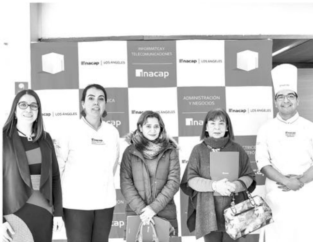
INACAP LOS ANGELES junto con el programa Raíces de la Dirección de Vinculación con el Medio lanzó el interesante concurso "la mejor pollona angelina".

Hay tres destacados establecimientos de Los Ángeles que ya están participando y preparándose para el 22 de