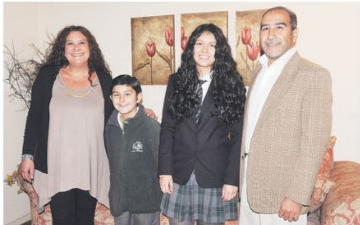
UNA FAMILIA ANGELINA común pero que creen en el esfuerzo y dedicación para cumplir los sueños.

mucha gente me escribe, me hacen preguntas me dicen que es buena que entienden y que han podido disfrutar de ese conocimiento" finaliza esta inquietante joven, que proyecta en todo momento un convencimiento único de lo que siente y vive, acompañada muy de cerca de su familia su motor de fuerza y convicción para lograr todos sus sueños.