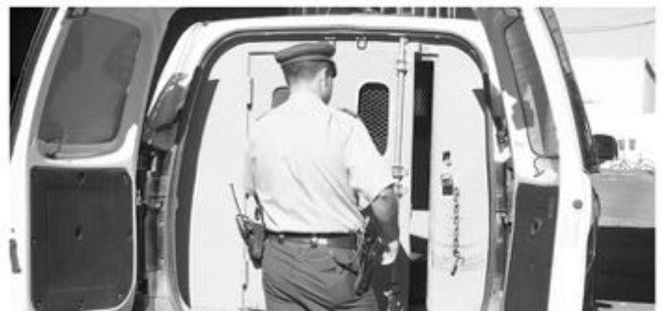
EL HOMBRE QUE REALIZÓ ESTE ROBO por sorpresa mantenía antecedentes por hechos similares.

En el procedimiento la víctima, no logró recuperar su teléfono celular, mientras que el victimario pasó a control de detención por el acto de robo por sorpresa, donde se pudo corroborar que este mantenía antecedentes por actos similares, pero sin causas vigentes.