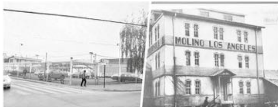
El Molino de Los Ángeles, fue uno de los centros más reconocidos en la ciudad, en este lugar se mantenía un importante centro de comercio y de trabajo. Estaba emplazado en la intersección de las calles Villagrán y Argentina, que con el paso del tiempo, este lugar tuvo un considerable deterioro y con ello, en este lugar se emplazó un estacionamiento.