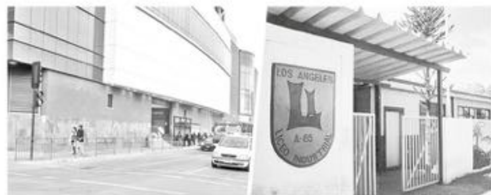
En la calle Valdivia, entre las intersecciones Rengo con Colo Colo, aquí antiguamente se emplazaba el Liceo Industrial de Los Ángeles, centro educacional que vio crecer a muchos angelinos. Con el paso de los años, en este lugar se ubicó el centro comercial más grande de la capital provincial, Mall plaza el Trébol, donde muchas personas disfrutaban agradables tardes de fin de semana.

El comercio angelino, de igual manera ha experimentado grandes mejoras y sus ciudadanos han sido testigos de este crecimiento. Actualmente en calle Colón se presenta gran número de tiendas comerciales, que son el mayor apoyo para el crecimiento provincial.