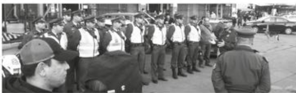
LAS ACTIVIDADES DE FISCALIZACIÓN tuvieron inicio durante la tarde del día jueves.

Durante la tarde del día jueves, se dio inicio en la Vega Techada de Los Ángeles, una amplia distribución especial de los servicios de funcionarios de Carabineros, dispuesto por la Prefectura del Biobío.