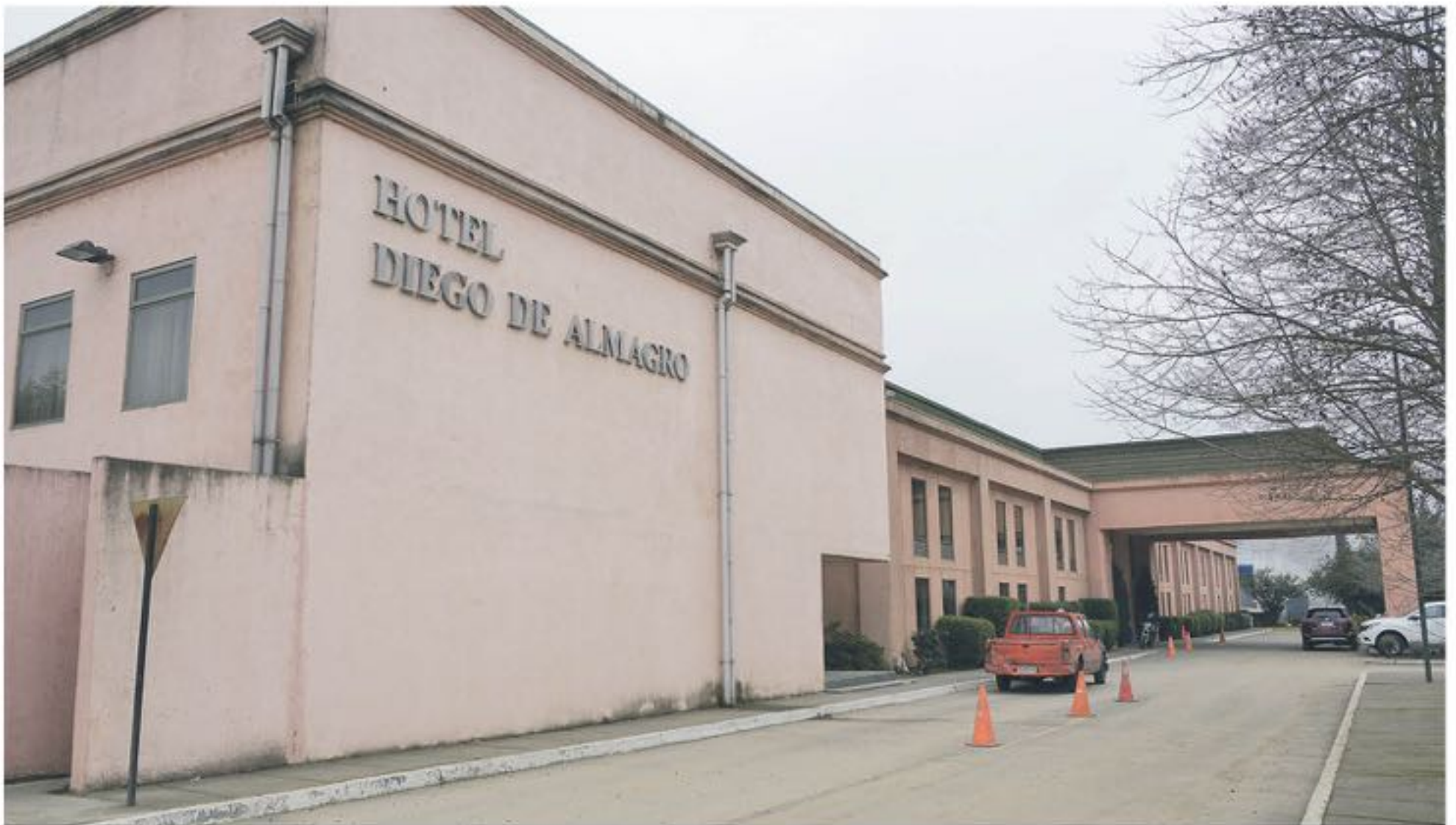
EL PROBLEMA AFECTÓ a 18 personas que comieron en el hotel Diego de Almagro.

Fiscalizadores de la Unidad de Seguridad Alimentaria encontraron deficiencias y ausencia de cumplimiento en protocolos, lo que derivó en el inicio de un sumario sanitario además de la prohibición de funcionamiento de la cocina del mencionado hotel.