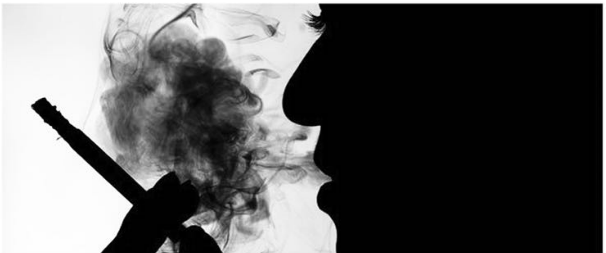
El 86% de las mujeres con criterios EPOC aún no tiene diagnóstico/ EFE/Infografía Ana Marcos

Todo ello para reducir la desigualdad por sexo y género sin olvidar las diferencias clínicas y sociales entre ambos. "Hay que entender que somos diferentes, partimos de una base diferente y en la enfermedad también lo vamos a ser".