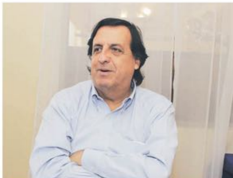
PÉREZ VARELA ACUSÓ al gobierno anterior de utilizar al Sename como “una institución pagadora de favores”.

En opinión del senador de la UDI, el informe recibido por el Presidente Piñera da cuenta del nulo interés que tuvo el gobierno anterior por tratar de solucionar los problemas que aquejan a la institución.