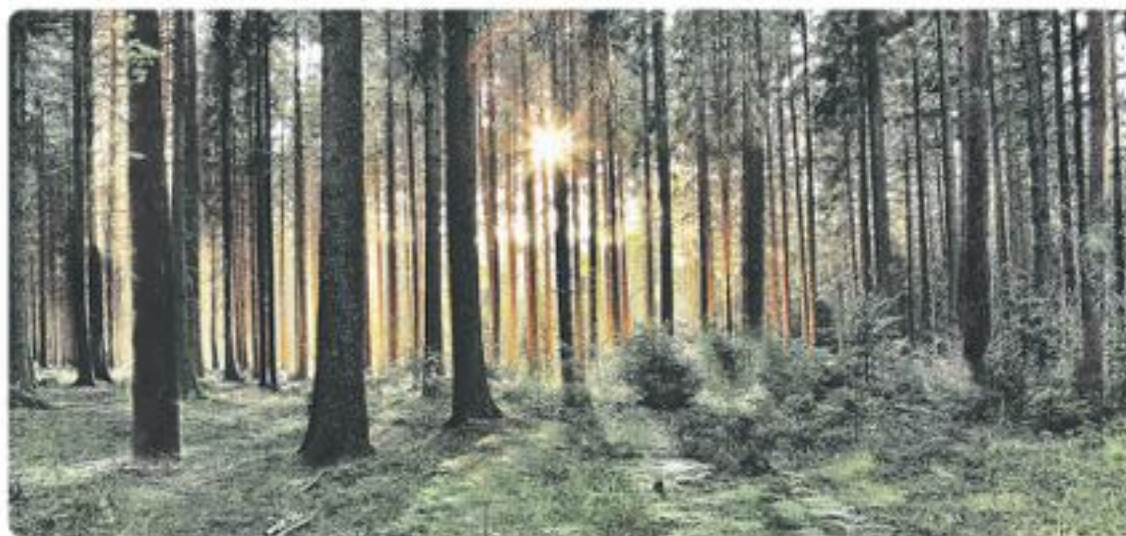
El 75% de los lodos generados en Biobío son destinados a recuperación de suelos

lodos para mejorar suelos forestales y agrícolas, ubicado en el sector de Membrillar. En esta reducida instalación, de no más de 267 metros cuadrados, hemos podido acondicionar los lodos provenientes del tratamiento de aguas servidas y disponerlos en más de 120 hectáreas (al año) de suelos que necesitaban mejoramiento para ser productivos.