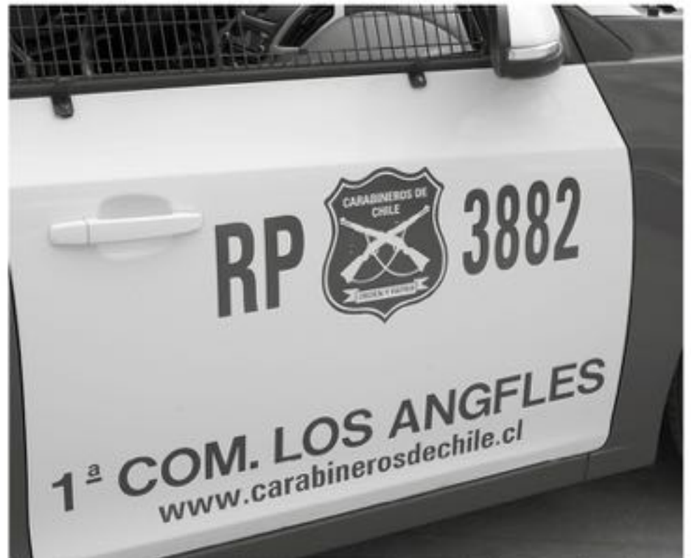
EL HOMBRE FUE PUESTO EN LIBERTAD, para una investigación al respecto, sobre el porte de sustancias ilícitas.

En tanto, sobre los antecedentes penales de este sujeto, cabe señalar que este no mantenía causas vigentes.