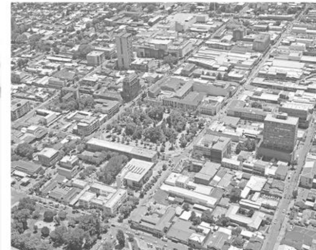
El 26 de mayo de 1739 comenzó el trazado de las calles de Los Ángeles, fecha que con posterioridad se fijó como el día de aniversario de la ciudad.

En lo que respecta al presente, la autoridad angelina destacó la reciente aprobación de recursos por parte de