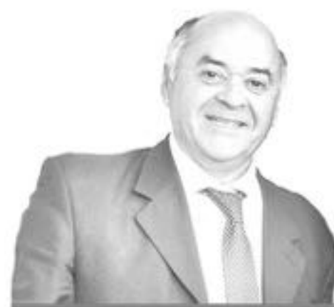
Jorge Ulloa Aguillón Intendente de la Región de Biobío

En su 279 cumpleaños, los invito a seguir trabajando unidos por un mayor progreso urbano, rural y seguir construyendo de esa forma un mejor lugar para cada uno de nosotros, en especial los más alejados del desarrollo.