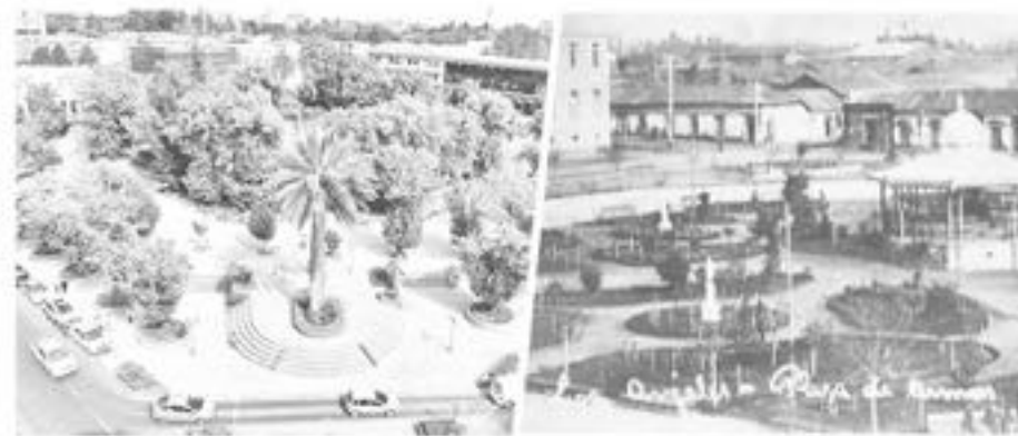
La plaza de armas de Los Ángeles, sin duda es uno de los centros que más ha experimentado cambios es el centro de la ciudad.

Por eso, en un especial histórico, La Tribuna FinDe ha preparado una selección fotográfica con los puntos más reconocidos de la ciudad que han experimentado grandes cambios.