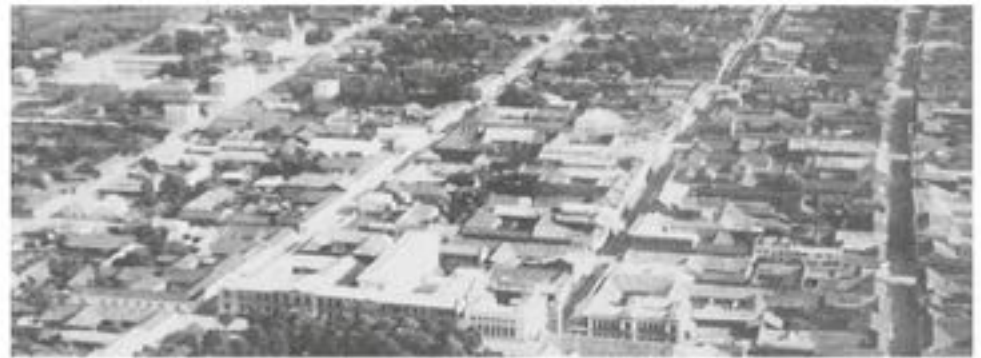
EL 26 DE MARZO DE 1793 se comenzó el trazado de las calles, de lo hoy sería la capital de la provincia de Biobío.

El 10 de enero de 1811 fue elegido por aclamación popular como diputado por La Laja (así se denominaba este sector) al Primer Congreso Nacional. Desde allí impulsó una serie de adelantos para esta zona.