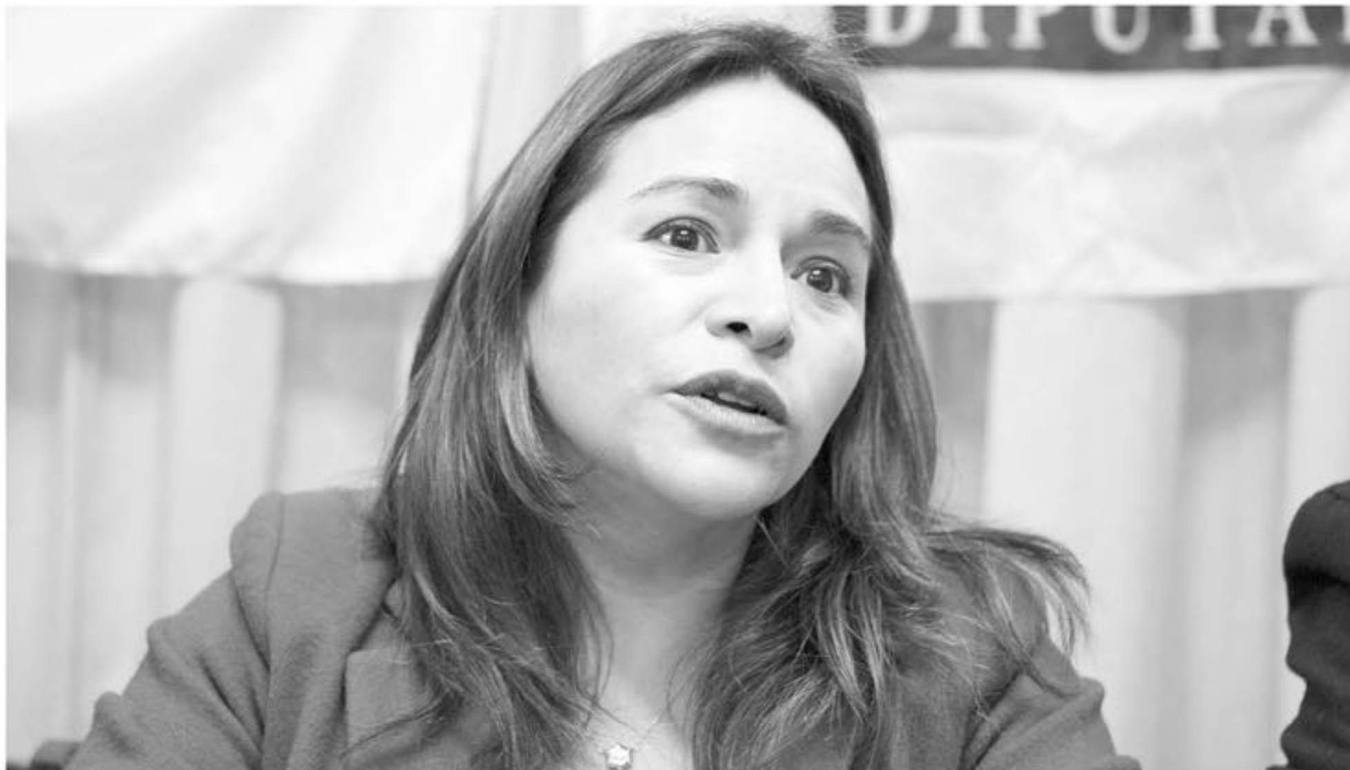
JOANNA PÉREZ postula a convertirse en vicepresidenta nacional de la DC, dentro de una lista que es liderada por el ex diputado Fuad Chaín (Foto archivo).

La diputada Joanna Pérez habló acerca de la crisis que vive su partido y de la visión que representan la lista por la cual postula a la mesa nacional, y que es liderada por el ex parlamentario por La Araucanía, Fuad Chaín.