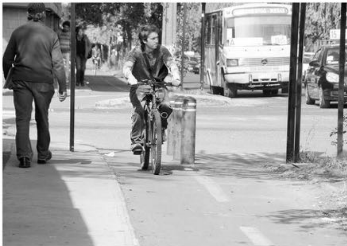
LA LEY DE CONVIVENCIA VIAL fue publicada en el Diario Oficial el jueves 10 de mayo.

Por último, es importante señalar que el 6% del total de fallecidos en siniestros viales en nuestro país son ciclistas. Solo durante el año 2017, la bicicleta participó en 3.853 accidentes de tránsito, y en ellos resultaron 95 ciclistas fallecidos y 3.236 lesionados. En la última década fallecieron 1.183 ciclistas en accidentes de tránsito.