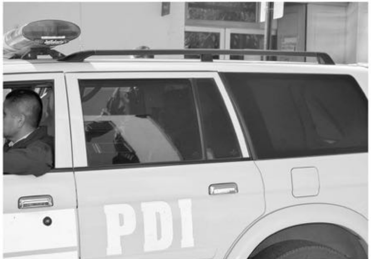
PERSONAL DE LA BRIGADA ANTINARCÓTICOS y Contra el Crimen Organizado, protagonizó el operativo.

En tanto desde la Prefectura de la provincia del Biobío no se refirieron a los hechos, sólo indicaron que la investigación que se está llevando a cabo, permitirá esclarecer los hechos y determinar la participación de los efectivos policiales en este grave hecho.