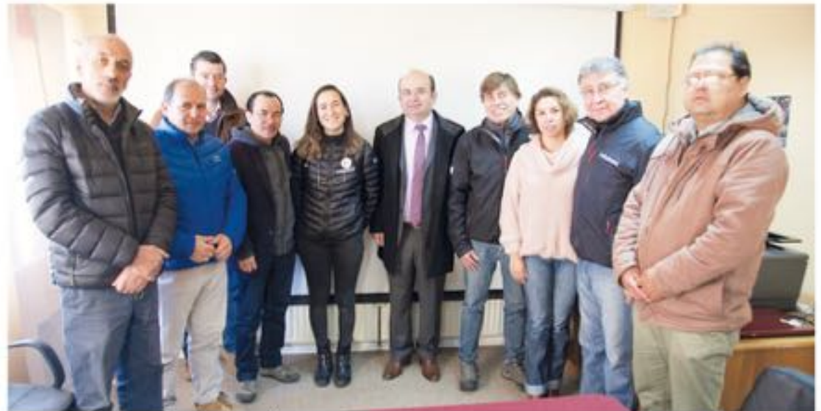
DURANTE LA MAÑANA DEL MIÉRCOLES se reunieron autoridades comunales con la organización del evento.

A ello, agregó que "este evento tiene prestigio a nivel mundial, ganado a lo largo de años y es importante poder ser parte del desarrollo de esta competencia, que no sólo se vive en otras ciudades, sino que está vez en sectores más precordilleranos. Esperamos que en una próxima edición el Rally Mobil pueda recorrer