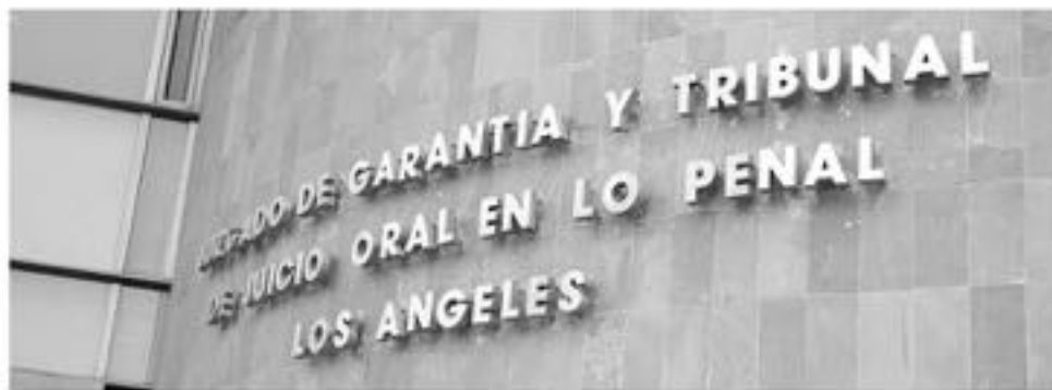
LA MUJER se mantiene en libertad, mientras se realice la investigación respectiva.

La involucrada fue sorprendida en este caso, por personal de OS7 mientras mantenía las sustancias en el interior de su domicilio.