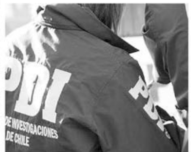
EL AUTOMÓVIL fue recuperado por personal de la Brigada de investigación Criminal.

Sobre esto, el oficial agregó que el individuo al momento de ser descubierto mantenía la camioneta estacionada en las afueras del Circo de México donde efectuaba labores, el que se ubica hace algunas semanas en la capital provincial.