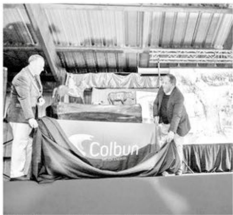
ESTE 2018 se construirá el Monumento al Arriero.

Para este año, continúa el trabajo en fondos concursables de emprendi-