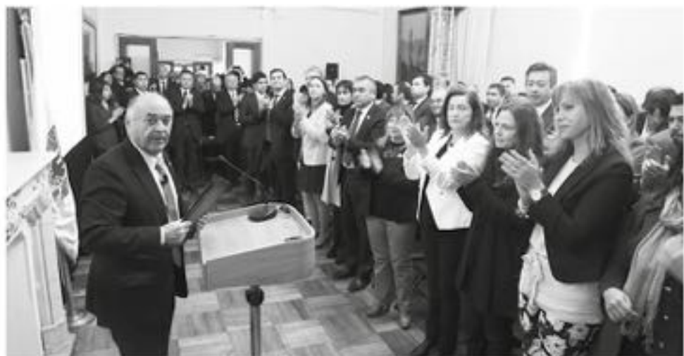
EL INTENDENTE JORGE ULLOA entregó su cuenta pública ante su gabinete regional en pleno, y otras autoridades regionales, entre ellas, varios alcaldes de la Provincia.

llevó a cabo en edificio de la Gobernación Provincial en Concepción, y contó con la participación del gabinete regional en pleno, además de diversas autoridades regionales, entre ellas, varios alcaldes de la provincia de Biobío.