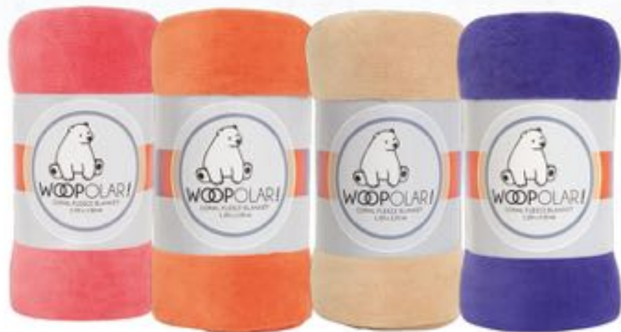
Medida: 1.2x1.5 metros

prepárate con Salcobrand y sigue disfrutando