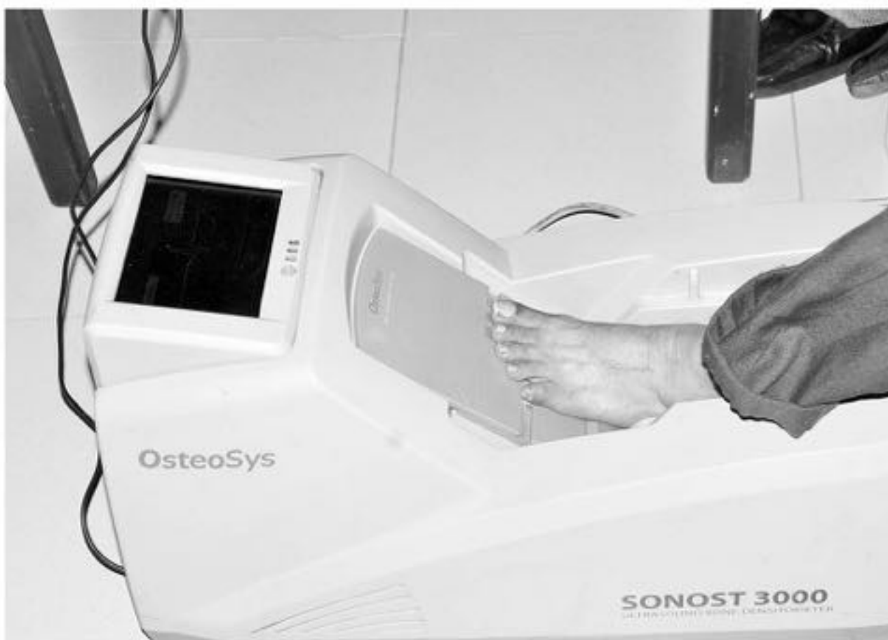
ESTA PATOLOGÍA es producida por una malformación en el colágeno de los huesos, generando fragilidad ósea.

En el mundo, existen diferentes estimaciones sobre las personas que tienen OI. De acuerdo a la Fundación Ahuce de España, la prevalencia es de 1 caso cada 15 mil personas, mientras que según Centro Nacional de Información sobre la Osteoporosis y las Enfermedades Óseas de Estados Unidos, se produce 1 caso por cada 20 mil personas.