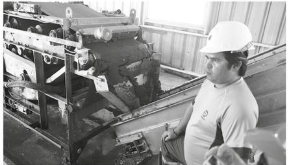
LA INICIATIVA SE EMPLAZARÁ en una zona de plantaciones forestales y a distancia suficiente para no generar molestias a vecinos.

La iniciativa se emplazará en una zona de plantaciones forestales y a distancia suficiente para no generar molestias a vecinos. El que se encuentra en su etapa de evaluación ambiental y considera una inversión de 400 millones de pesos.