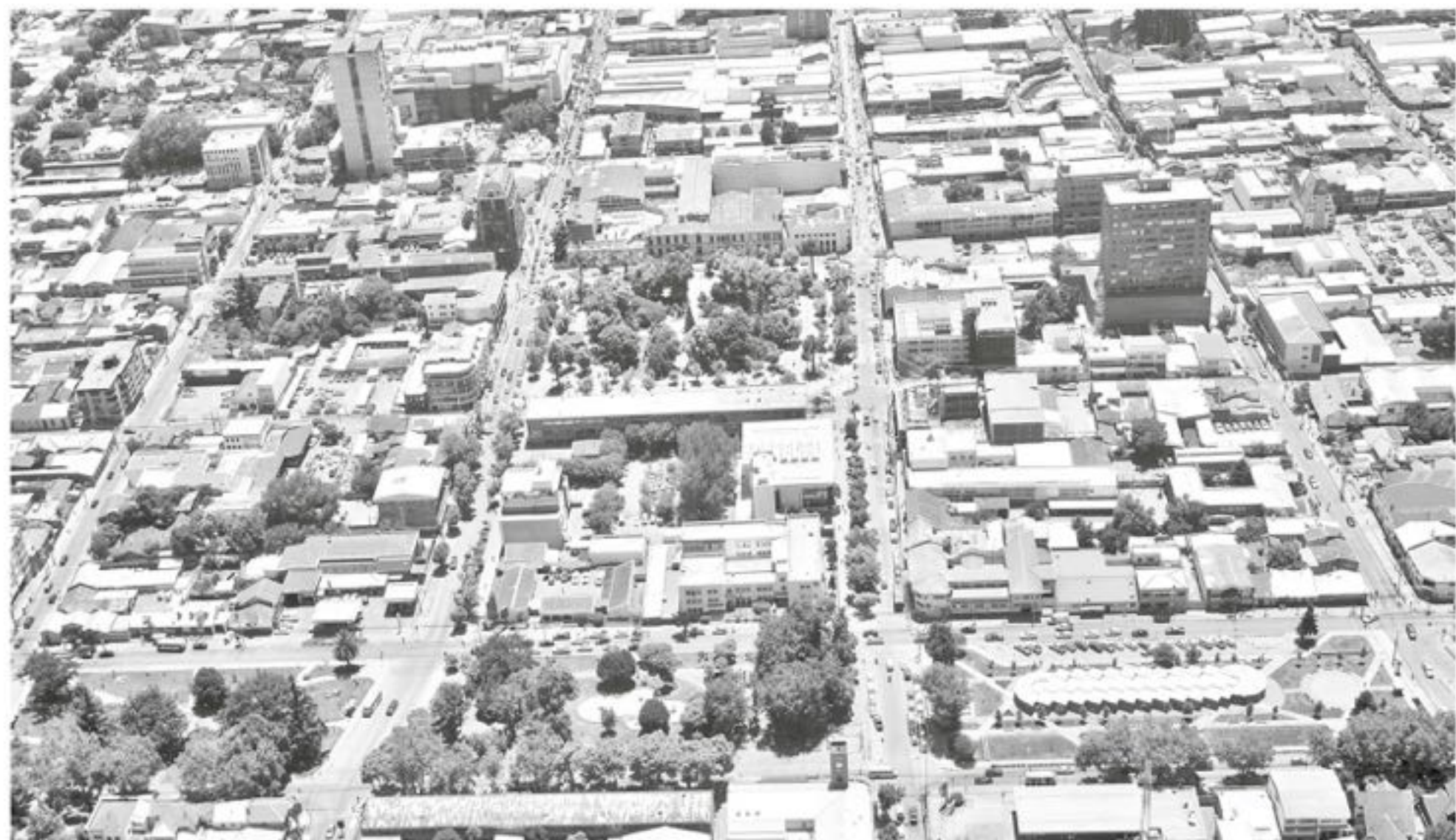
RESPECTO AL "ENTORNO", el 82,4% de la población encuestada en Biobío considera bueno o muy bueno el vecindario que habita.