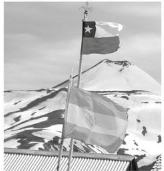
PARA LA CÁMARA DE COMERCIO angelina este año uno de los ejes fuertes es el turismo en toda la provincia, en el contexto del fomento productivo local.

Para la Cámara de Comercio de Los Ángeles este año uno de los ejes fuertes es el turismo en toda la provincia, en el contexto del fomento productivo local.