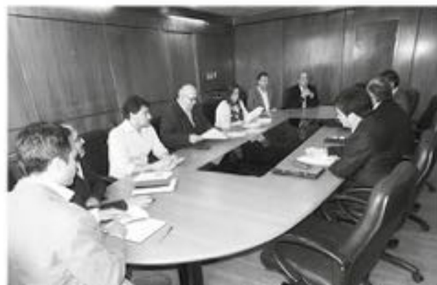
LOS PRINCIPALES REQUERIMIENTOS expresados se englobaron en el problema del abastecimiento de los trozos.