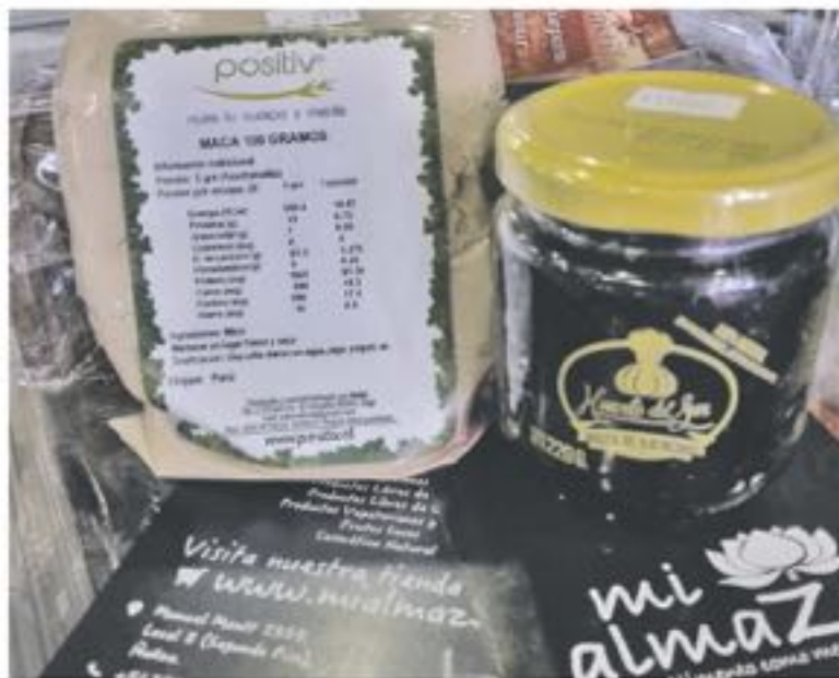
PRODUCTOS INTERESANTES como el viagra natural.