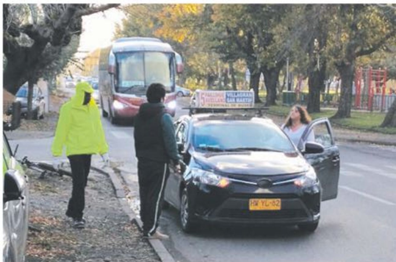
EL ÚLTIMO ACCIDENTE de este sector se registró el pasado lunes 14 de mayo, donde un conductor de una línea colectiva se precipitó contra un ciclista.