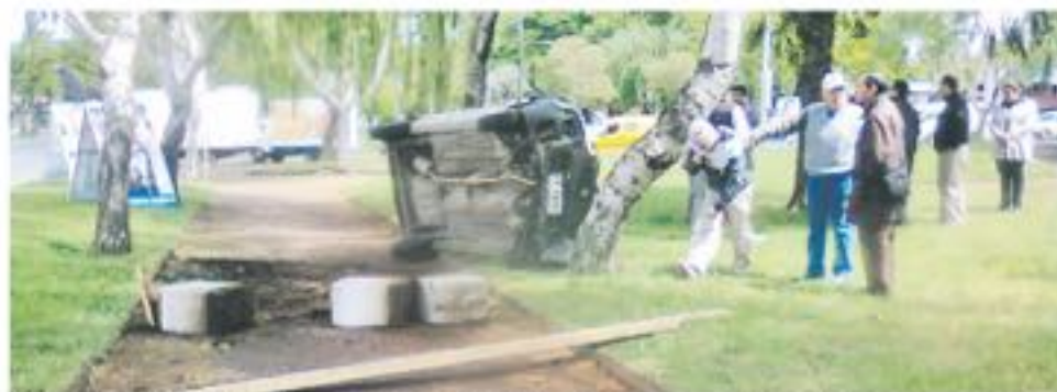
APROXIMADAMENTE EN NOVIEMBRE del 2017 un auto resultó volcado a pocos metros de la avenida principal.