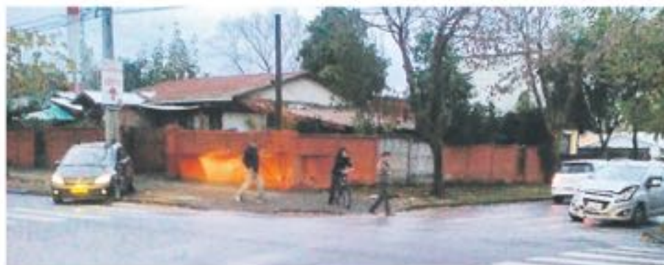
EL 13 DE MAYO, un vehículo chocó con otro quedando en sentido contrario del tránsito.

"Un semáforo tiene un costo aproximado de 60 millones de pesos, por ello todo esto es un proceso complejo, pero no se desconoce la necesidad de este sector" puntualizó el director de Tránsito.