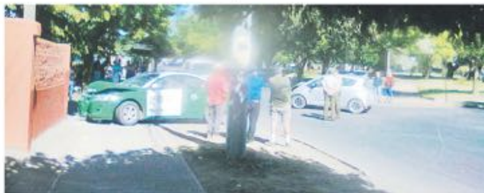
CARABINEROS DE IGUAL manera impactó en el lugar el año 2017.