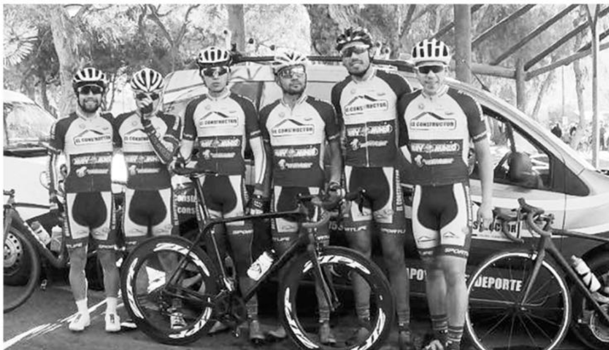
EL EQUIPO NUEVAMENTE destacó y sigue soñando con la gloria.