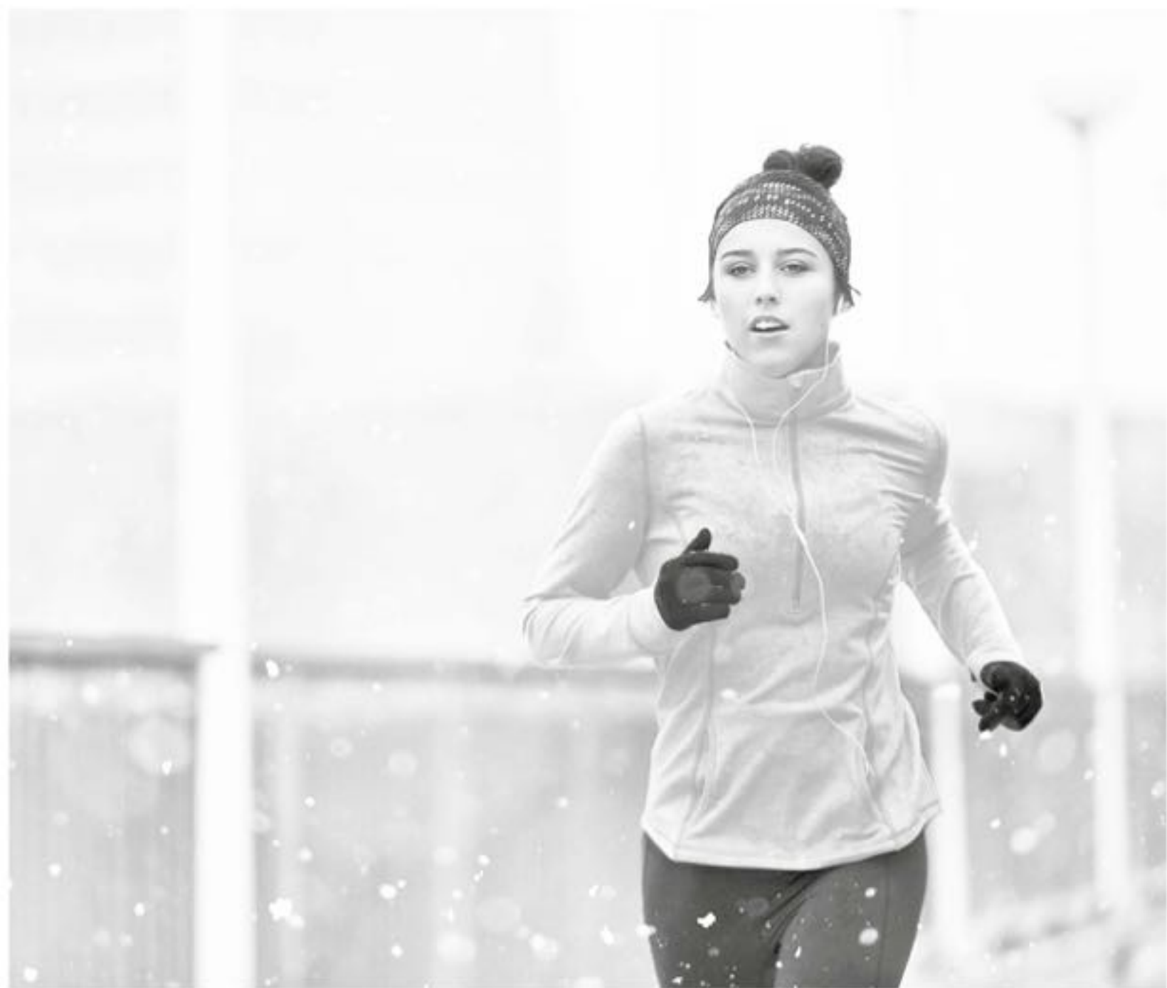
EL FRÍO SI BIEN, no ayuda a la hora de hacer deporte, si se puede contrarrestar.

Cuando concluyas, ten cuidado al estirar puesto que el frío te puede producir algún