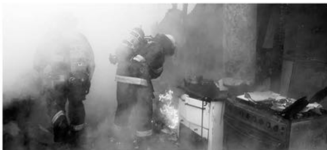
A PESAR QUE EN EL INCIDENTE trabajaron tres compañías de Bomberos, no se pudo evitar que las llamas consumieran la vivienda en su totalidad.

El incidente se mantiene en investigación por parte del departamento de estudios técnicos, ya que no se pudieron determinar las causas que originaron el lamentable siniestro.