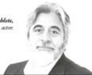
Roberto Poblete, actor

danía y no se pueden borrar las transformaciones que van en su directo beneficio. Sin duda un papelón, que además dio la oportunidad a que cientos de profesionales de la salud dejaran de manifiesto que realmente no están al servicio de todos, sino más bien de unos pocos.