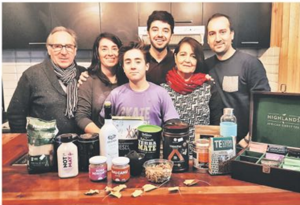
A PARTIR DE SU ESTILO de vida decidieron abrir una tienda saludable que se transformó en un emprendimiento familiar.

Tienen proveedores de todo el país, privilegiando a los productos locales, sin embargo "también tenemos productos importados que no se dan en Chile como por ejemplo el