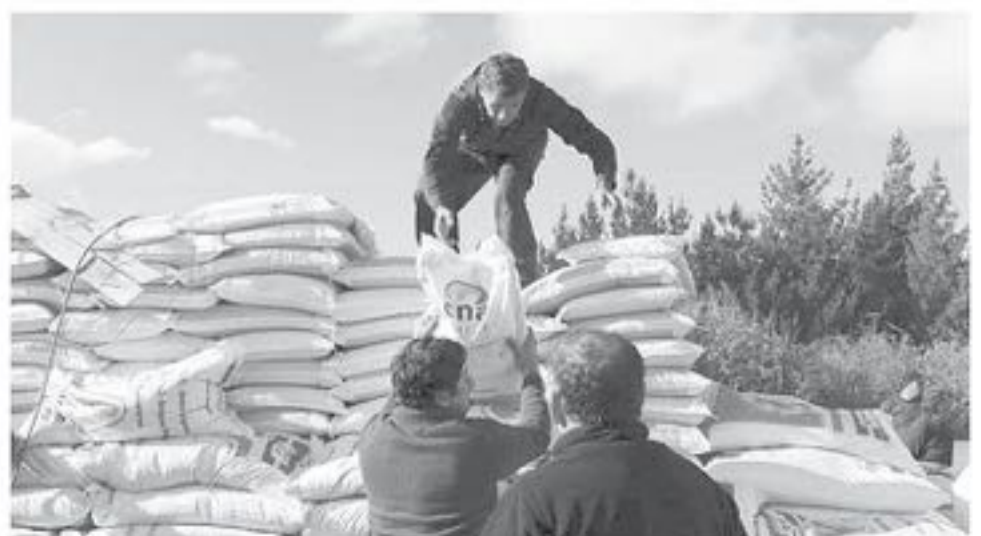
LA ENTREGA se llevó a cabo en el entorno de la sede de la junta de vecinos Dollinco (Foto Facebook Municipalidad de Nacimiento).

Este incentivo estuvo dirigido a usuarios que cuentan con dotación animal y que requieren suplementar la alimentación en época estival, en donde la disponibilidad de forraje es escasa. Un total de 3 millones de pesos fueron otorgados por Indap para hacer posible esta importante ayuda.