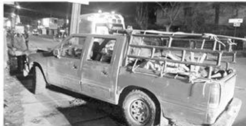
EL INCIDENTE GENERÓ un considerable tráfico vehicular, pasadas las 18:00 horas de este martes.

En el lugar, efectivos de Carabineros trabajó en restablecer el considerable tráfico vehicular y determinar las causas que llevaron a este conductor a generar este incidente.