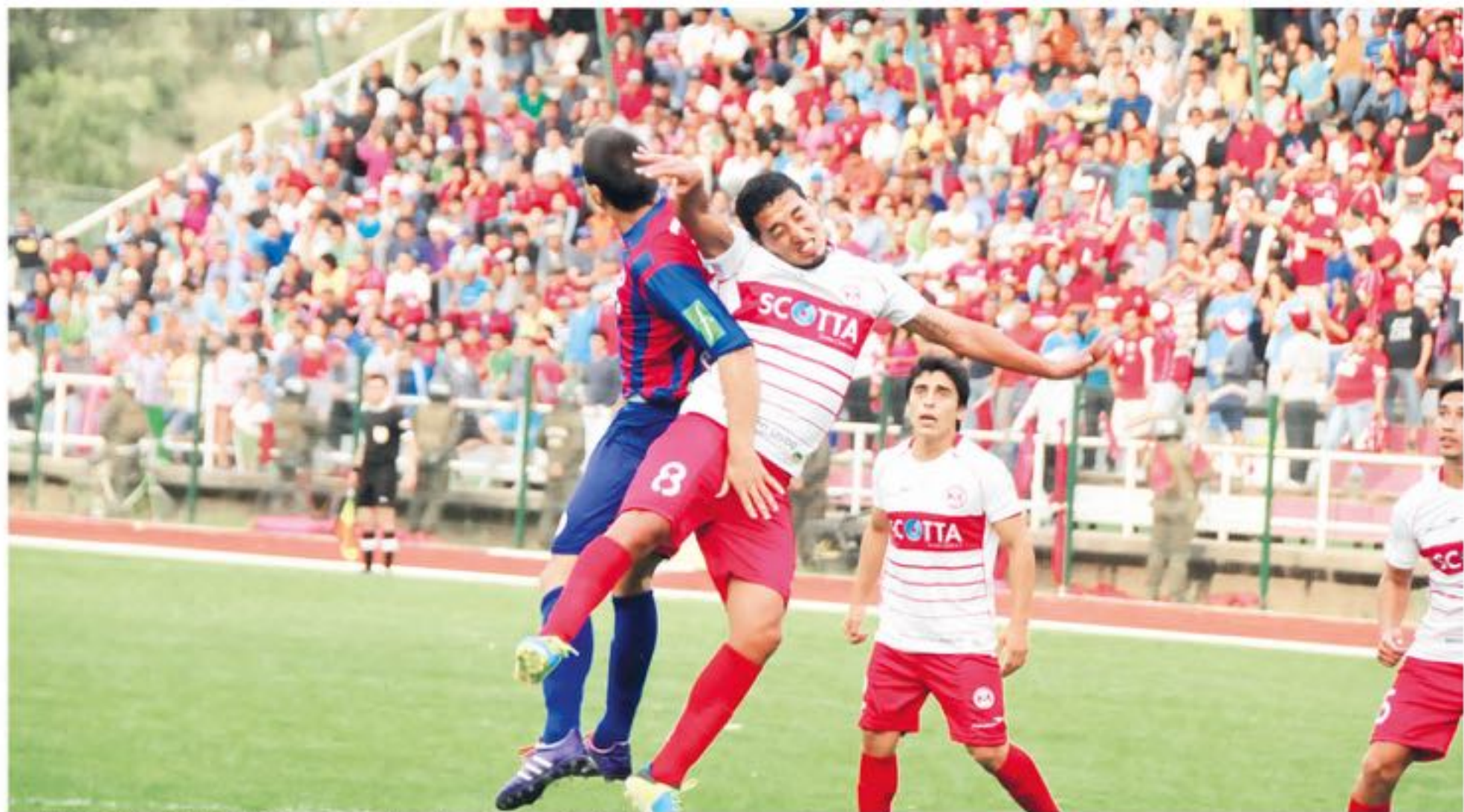
EL ÚLTIMO ENFRENTAMIENTO se vio opacado por los incidentes entre las hinchadas.

Pese a que por la Ley de Estadio Seguro, sólo podían entregar 125 entradas, las autoridades de La Araucanía se comprometieron a entregar cerca de 200 entradas para los simpatizantes de Iberia.