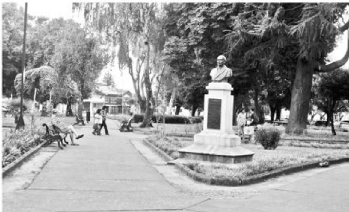
BAÑOS Y MEJORAS en la Plaza Pinto se realizarán con fondos provenientes de la Municipalidad de Los Ángeles.

na que se reunieron con el alcalde Esteban Krause y con uno de los arquitectos de la Municipalidad de Los Ángeles para ver la imperativa necesidad de tener baños y también herosear la plaza en general.