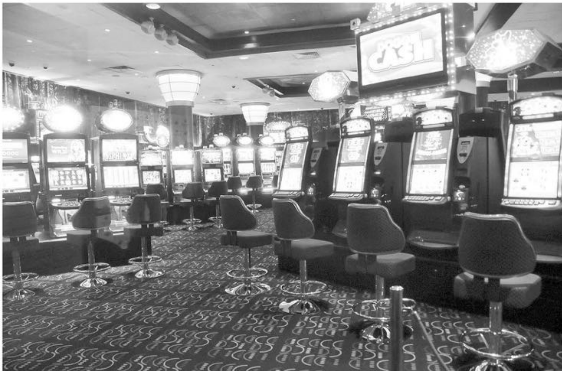
LA SCJ INFORMÓ QUE GENERÓ una recaudación tributaria de $ 117.998 millones en 2017 (Foto de contexto)

Convenio apunta a impulsar una agenda de desarrollo sustentable. En la oportunidad se presentó públicamente la propuesta de generar un sistema de autoexclusión integrado a nivel nacional.