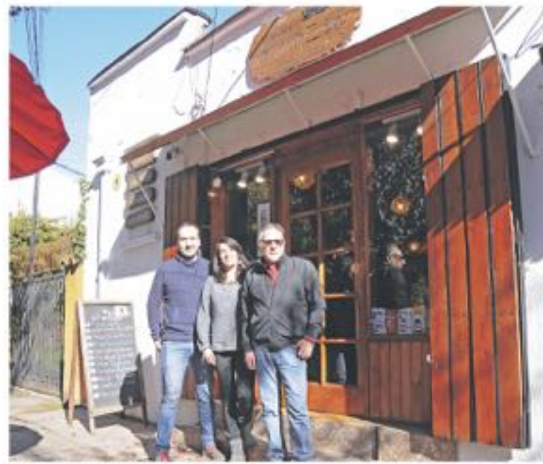
EN LOS ÁNGELES y en Santiago AlmaZen tiene el mismo concepto de calidad.

"Ha sido sorprendente, en la capital hay muchas alternativas de espacios como este, sin embargo, allá llegan muchos angelinos o parientes de personas de acá que nos prefieren por la calidad de los productos que trabajamos y también por la aserti-