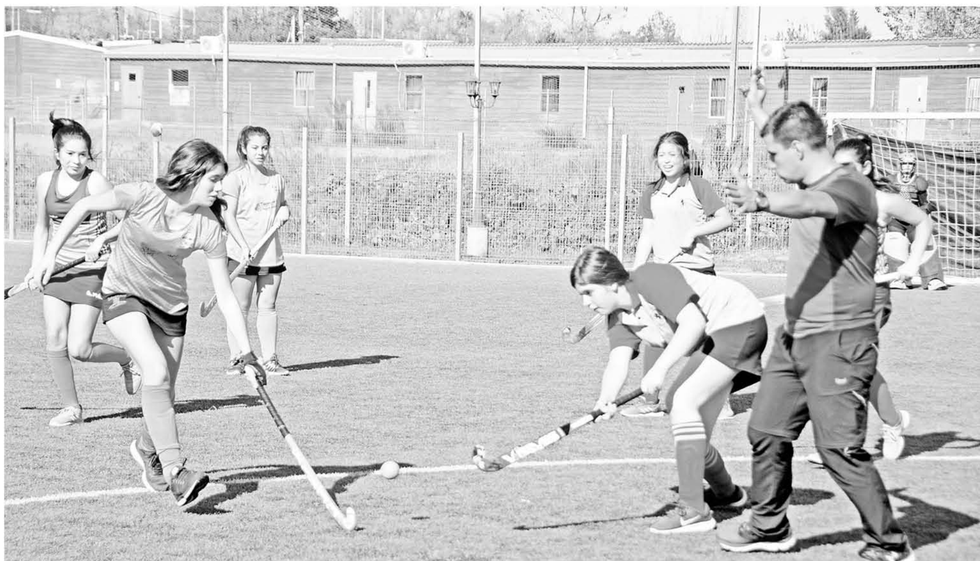
FUERON DECENAS DE DEPORTISTAS que llegaron a la capital de la provincia de Biobío para ser parte de la nueva fecha.