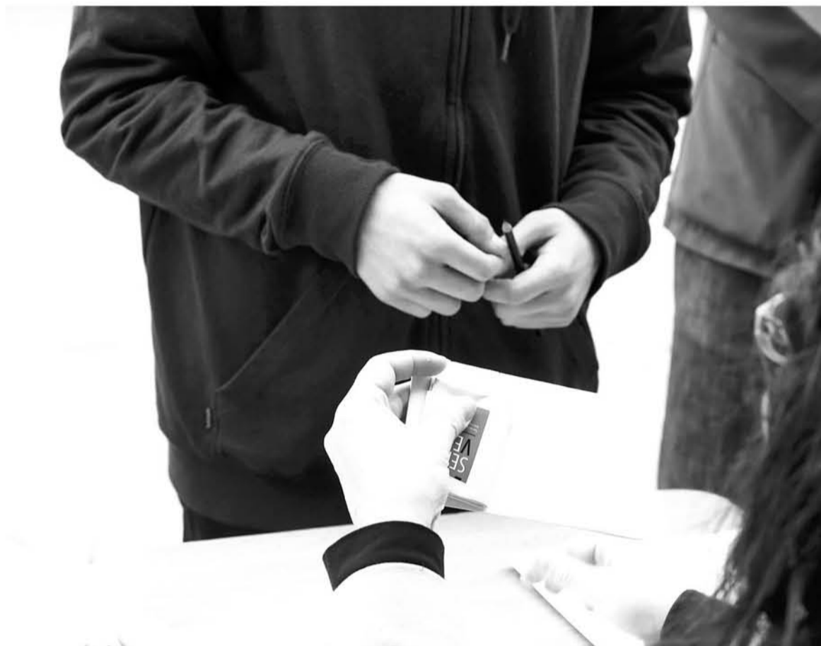
LOS PARTIDOS disueltos no cumplieron con el 3 por ciento de los sufragios en las últimas elecciones, como estipula la ley.

La cancelación de estas colectividades se efectuó mediante la Resolución O-N° 0163, la que implica su eliminación del Registro de Partidos Políticos, con lo que oficializa su disolución.