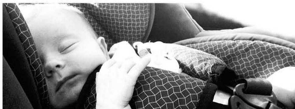
SEGÚN LAS AUTORIDADES, la ley que aumentó las exigencias de traslado de niños en vehículos ayudó para que la cifra de muertes de menores por accidentes de tránsito disminuyeran en el país.

En cuanto a las infracciones por niños menores de 12 años sentados en asientos delanteros, se registraron 1.927 multas en 2017, mientras que en 2016 se registraron 568 y 441 en 2015 por la misma falta.