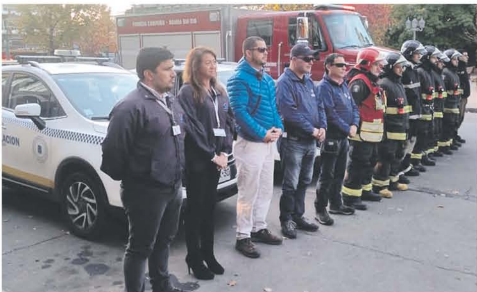
LA ACTIVIDAD CONTÓ con el apoyo de otras instituciones de la provincia.

El accionar de Carabineros estuvo enfocado en los puntos críticos de reincidencia, considerando aspectos situacionales y espaciales de acuerdo a los análisis georeferencial del comportamiento delictual.