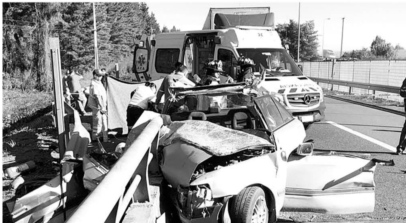
LA FAMILIA se trasladaba por la ruta 5 Sur en dirección al norte, cuando a eso de las 15:30 impactó contra la barrera del puente Chumulco.

Cabe indicar que existe otro hijo de la familia, de