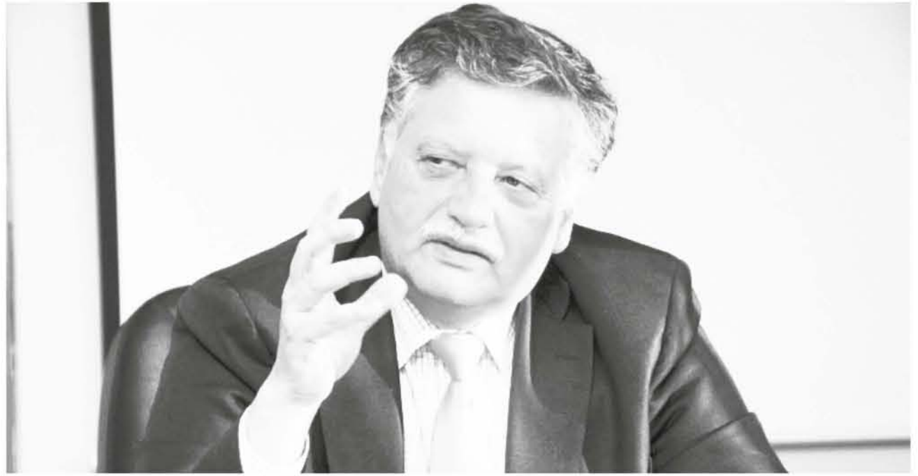
EL ALCALDE DE LOS ÁNGELES asistió recientemente a una sesión de la comisión de Medioambiente de la Cámara de Diputados, donde se entrevistó con el subsecretario del ramo (Foto archivo).

Destacó, además, el hecho de que el plan de descontaminación de Los Ángeles fue el único -entre muchos otros que existen para otras comunas del país- que fue regresado