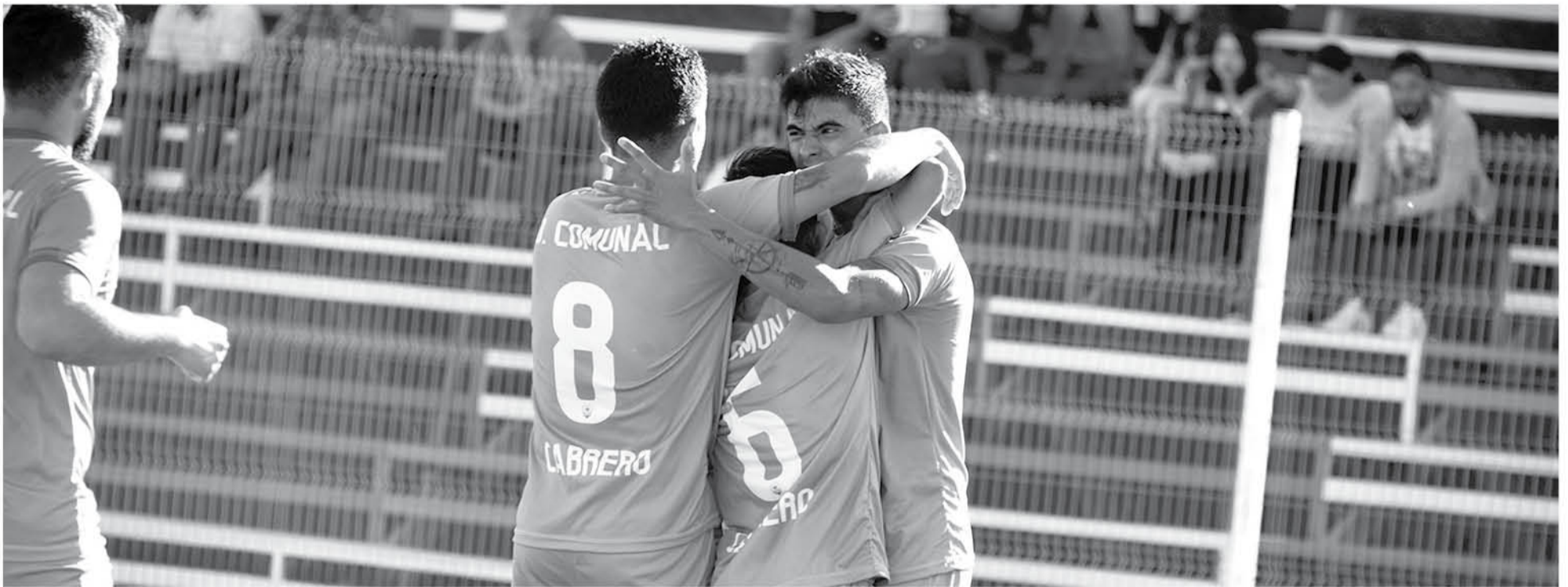
LOS BIOBIENSES ganaron gracias a anotaciones de Soto y Díaz. (Imagen de contexto)