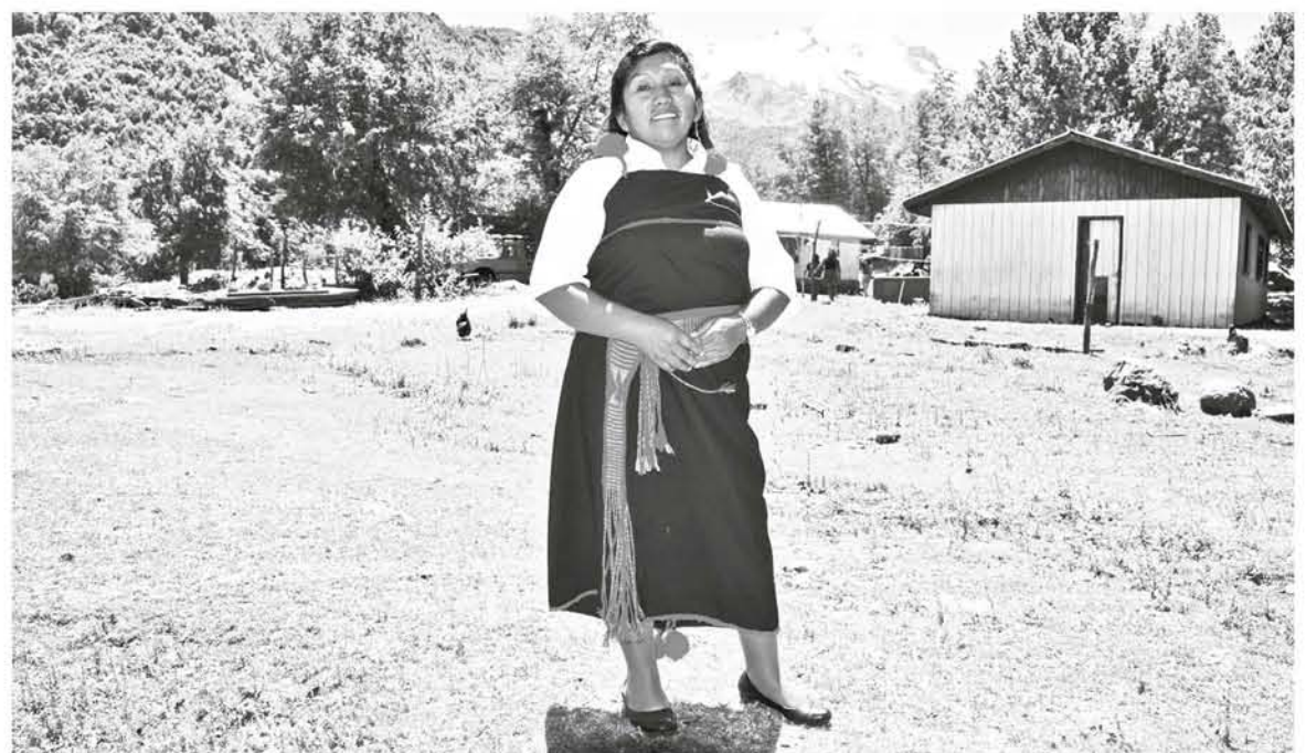
EN ALTO BÍOBÍO, el porcentaje de personas que declaran pertenecer a la nación mapuche es 84,18%.

Sin embargo, en el Censo no se entregaron datos de quiénes se declararon pertenecientes a la nación mapuche, pero sí con identidad territorial local, como el pueblo mapuche pehuenche.