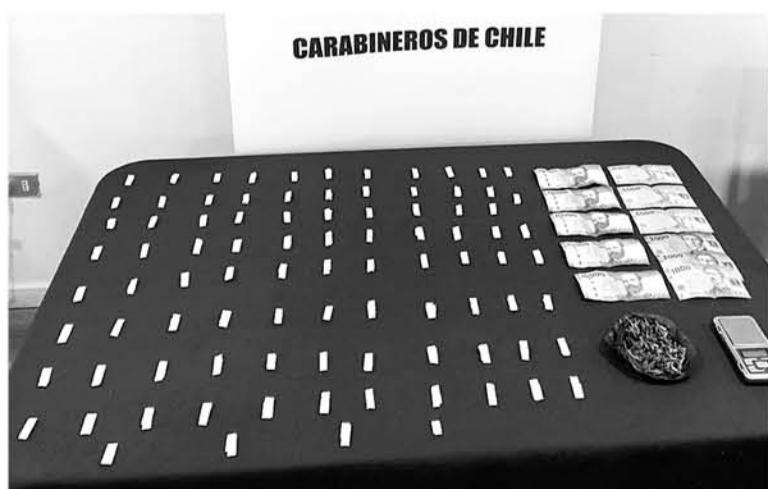
COCAÍNA, MARIHUANA y dinero en efectivo fueron las especies requisadas por el equipo especial de Carabineros en los tres allanamientos.