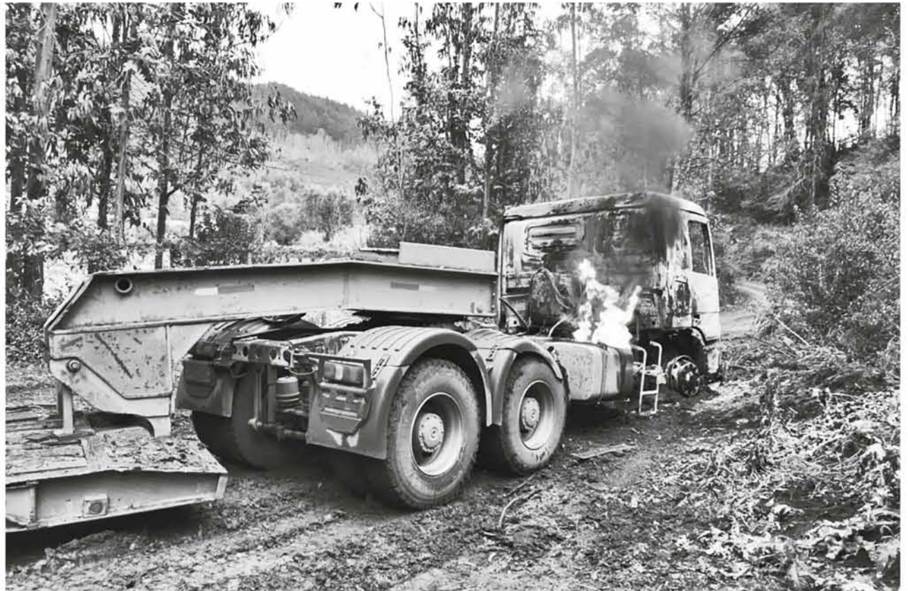
CAMIÓN TIPO CAMA baja resultó quemado debido a un ataque registrado sector Ponuco Alto de la comuna de Contulmo.

Según información de la Acoforag, cada empresa contratista tiene en promedio 100 trabajadores y a la fecha van 78 empresas de ellas afectadas. “Hay 7.800 trabajadores que han sido víctimas de la violencia e indirectamente lo son también sus familias, hablamos de cerca de 30 mil personas en los últimos cuatro años, donde hay consecuencias físicas y psicológicas que aún no se han cuantificado”, explicó Muñoz.