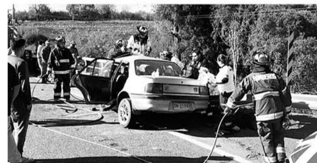
EL CONDUCTOR y su hijo de 4 años permanecen hospitalizados en el recinto asistencial de Los Ángeles.