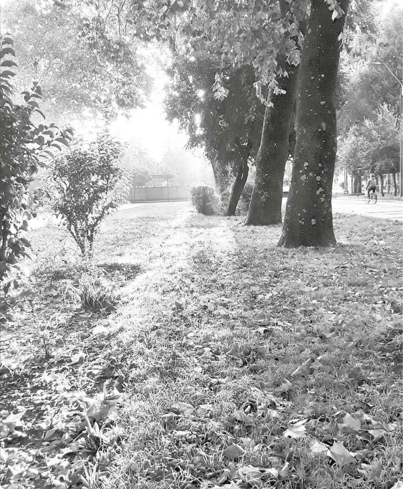
Parque de Mulchén