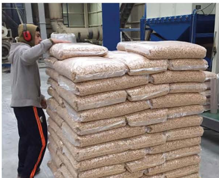
EN LA PROVINCIA de Biobío destacan como fabricantes de pellets las empresas Pro Energy de Los Ángeles y Andes Bio-Pellet de Santa Bárbara.

Para los fabricantes y comerciantes de pellets, por ahora, el principal desafío es cumplir con la demanda de los miles de consumidores que se han cambiado a este producto, requerimiento que no siempre se ha cumplido en años anteriores. Y en el largo plazo, asegurar el abastecimiento sostenido de materia prima durante todo el año, para atraer a nuevos inversionistas y, por qué no, en el futuro incluso poder exportar este biocombustible cada vez más demandado en los hogares de los chilenos.