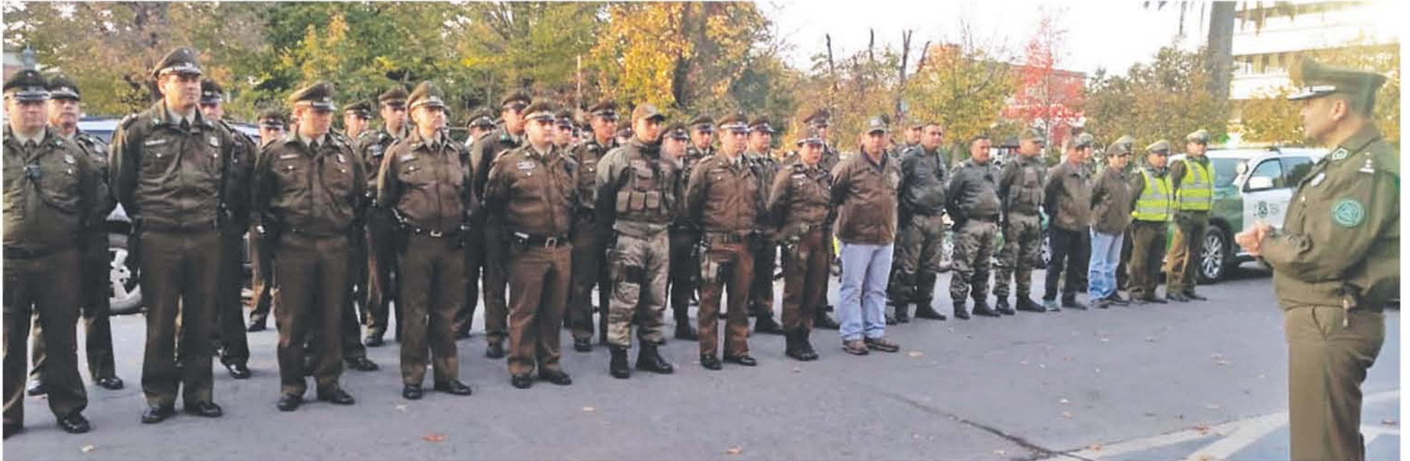
SE DESPLEGÓ LA TOTALIDAD de la fuerza policiaca en controles por diversos delitos.