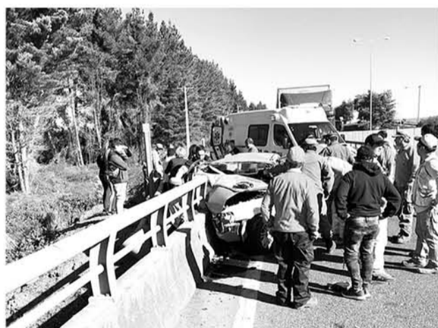
EL ABC de emergencia se constituyó en el lugar, constatando el fallecimiento de una mujer, un lactante de 18 meses y un menor de 9 años.