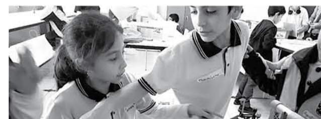
BAJO EL LEMA “La expresión de la diferencia”, entre el 14 y el 18 de mayo se celebrará la Semana de la Educación Artística.

Mulchén, Colegio Alemán y es coordinada a través de la Unidad de Educación del Ministerio de las Culturas, las Artes y el Patrimonio Biobío.