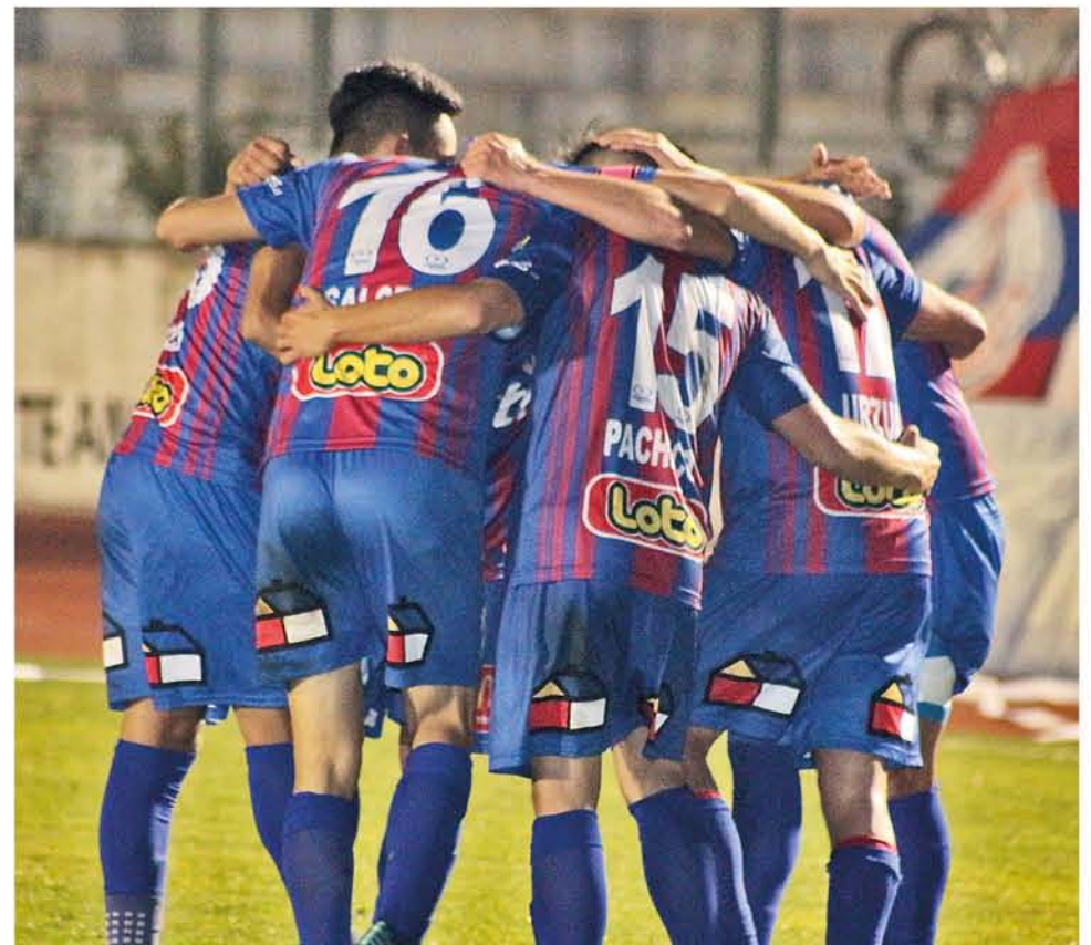
EN IBERIA CONTINÚAN los abrazos en la Segunda División Profesional.

El primer tiempo terminó con un empate sin tantos y con un extraño sabor para los cientos de hinchas que llegaron al estadio municipal de Los Ángeles durante la fría tarde de sábado.