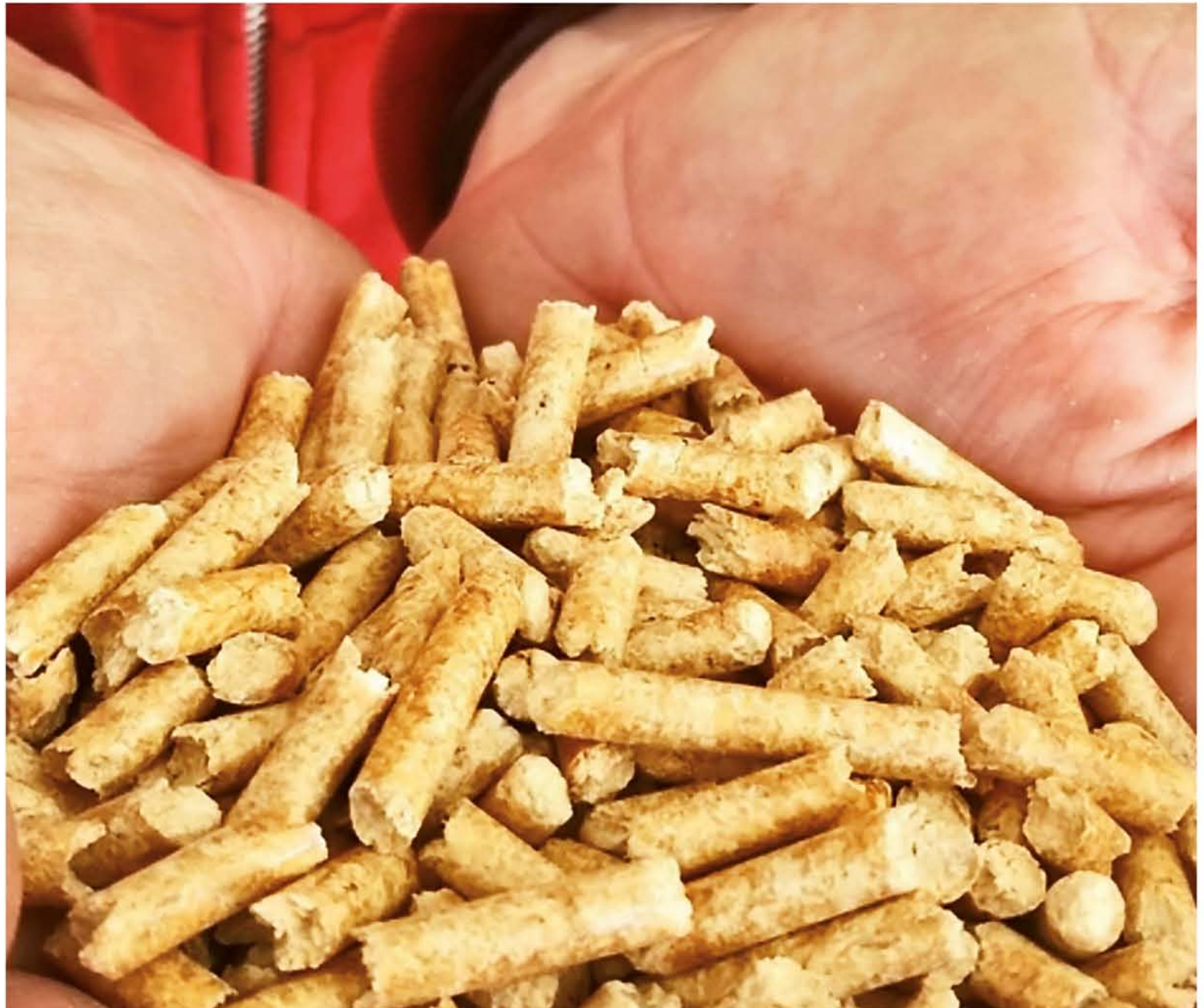
EL PELLETS es el biocombustible a utilizar en Los Ángeles una vez que se materialice el recambio de las clásicas estufas a leña por modernos calefactores que funcionan a base de este producto.

Se trata de Pro Energy de Los Ángeles, cuyo gerente general,