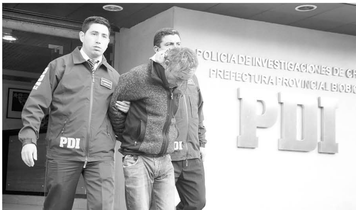
A LAS NUEVE DE LA MAÑANA de este pasado jueves, fue trasladado el victimario hasta el Tribunal Oral en Lo Penal de Los Ángeles, para ser formalizado.

lizada para este homicidio, cabe señalar que en este momento, esto pertenece a una investigación en curso, con varias hipótesis que se están barajando, pero las primeras diligencias darían cuenta de la presencia de un arma de fuego, al interior del domicilio, específicamente en el patio de la casa.