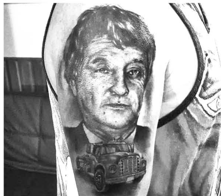
TATUAJE DE ESTILO “realismo” es el que realiza este artista visual.

Facebook: Edwards Tatuador González Portilla. ( https://www.facebook.com/edwardsalexander.gonzalezportilla.3 )