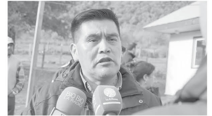
EL ALCALDE PIÑALEO abogó para que se pueda preparar a la comunidad frente a catástrofes ante las constantes alertas del Volcán Copahue.