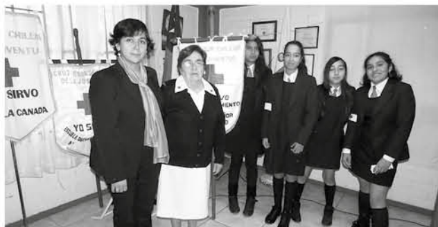
EL DÍA INTERNACIONAL DE LA CRUZ ROJA fue celebrado en Nacimiento por adultos y jóvenes.

La ceremonia fue amenizada por los estudiantes Bet-