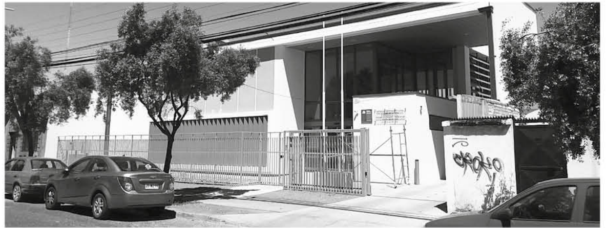
AMPLIAS Y CÓMODAS DEPENDENCIAS esperan a los usuarios a contar de este lunes 14 de mayo en las nuevas oficinas del Registro Civil en Los Ángeles, ubicadas en Freire 351.

El funcionario agregó que, precisamente, producto del traslado, este viernes 11 de mayo la oficina atenderá hasta las 12 horas. "Como medida de contingencia el Civilmóvil apoyará con solicitudes de cédula, pasaporte y clave única, y la oficina ubicada en el mall Plaza de Los Ángeles atenderá certificados y se reforzará con una maleta móvil para tramitación de cédulas de identidad hasta las 14 horas", indicó.