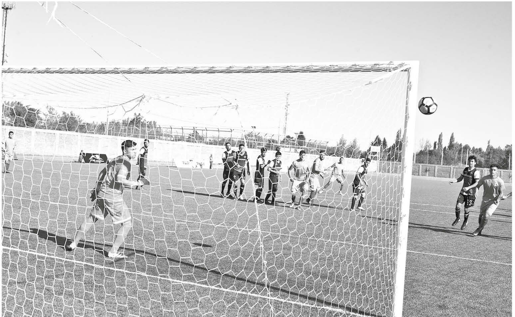
LA IDEA DE ABDALA fue darle tiraje a jugadores que no venían sumando minutos. (IMAGEN DE CONTEXTO)