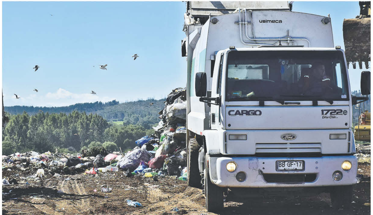
DESDE LA AUTORIDAD SANITARIA se indicó que Temuco aporta el 42%, Lumaco el 0,5% y la Provincia del Biobío, incluido Los Ángeles, Mulchén, entre otros, aporta el 57,5%.

"El tema de fondo aquí es que a la comuna de Temuco les cerraron el relleno sanitario de Boyeco, entonces yo considero que hay una muy mala gestión por parte de las autoridades de esa comuna, porque ellos le avisa-