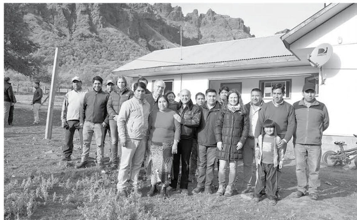
DENTRO DE LA AGENDA, la autoridad aprovechó la ocasión para entregar una vivienda construida con subsidio del Estado, que es la última casa antes de la frontera.