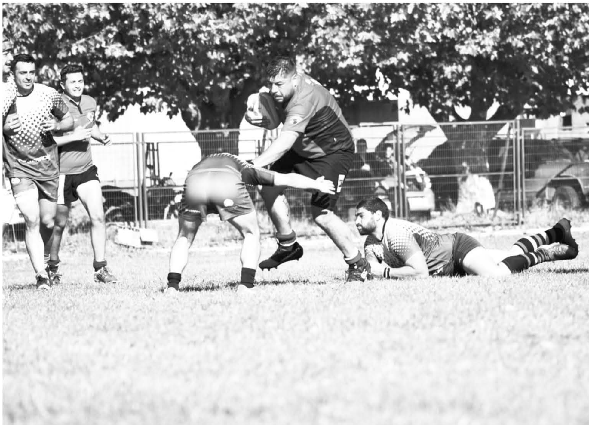
EL EQUIPO ANGELINO se medirá ante Pangué de Chillán en un día y hora aún por definir.