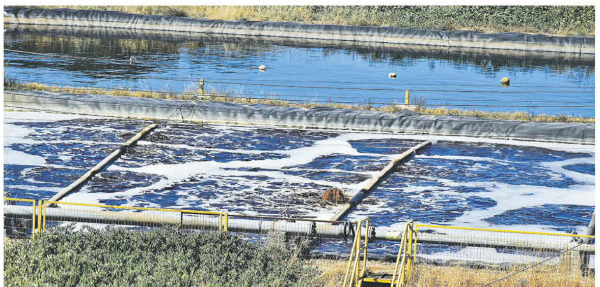
LOS RESIDUOS PROVENIENTES de Temuco son exclusivamente domiciliarios y su recepción no supone impactos en la operación ni en la vida útil del relleno sanitario, señaló KDM.

Asimismo, se requirió la información respecto al cumplimiento de las normativas indicaron que el