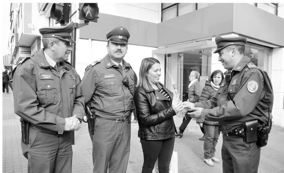
LOS FUNCIONARIOS se distribuyeron por distintos puntos de la comuna, para saludar a todas las madres.

Durante este pasado jueves, personal de diferentes comisarías locales se extendieron por la comuna para entregar un saludo especial a las mujeres que son madres.