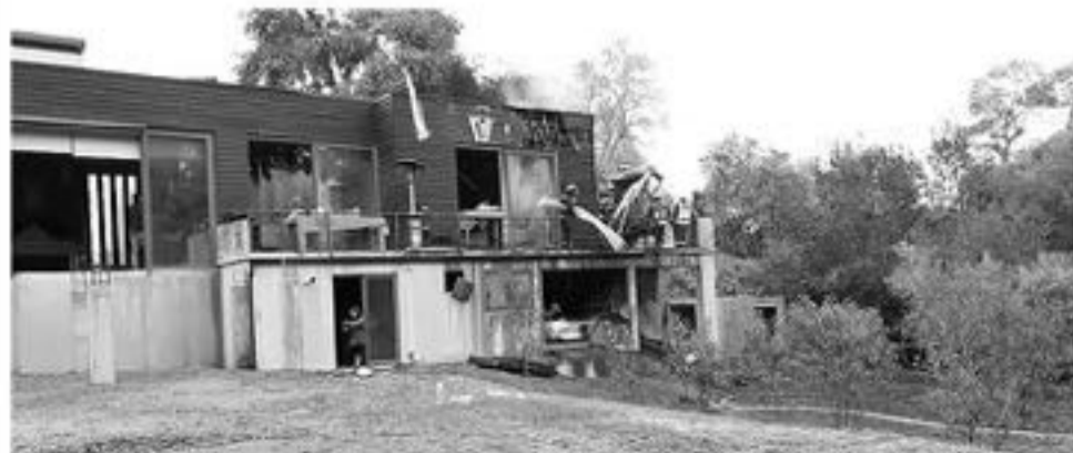
EL INCENDIO FUE CONTROLADO aproximadamente a las 8 de la mañana de este día domingo.

Durante la tarde, personal de Bomberos colaboró en la remoción de escombros de este lugar, desde donde se retiró una importante cantidad de residuos pertenecientes en su mayoría al segundo piso de la vivienda.