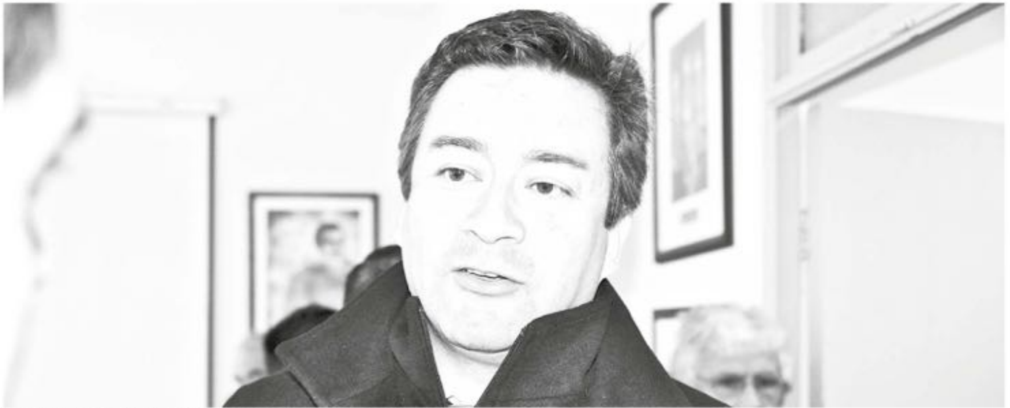
EL SEREMI de Medioambiente destacó el poco tiempo en el que revisaron e incorporaron el plan.