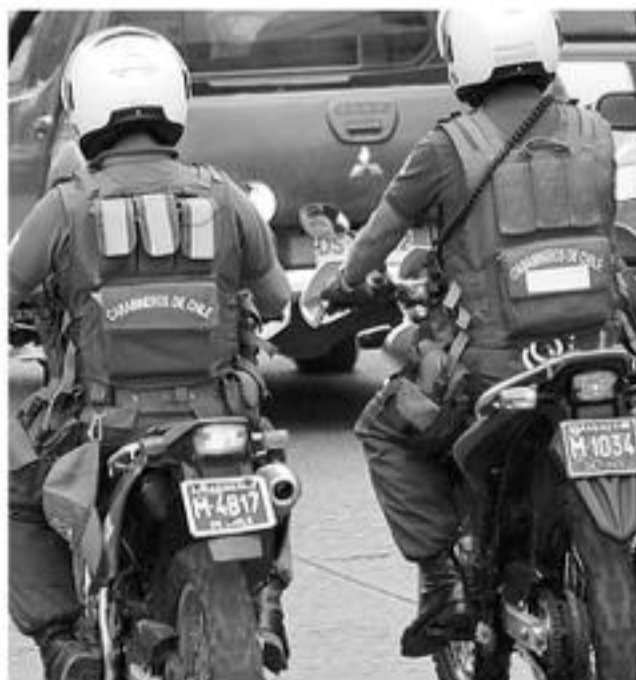
LOS CIUDADANOS HAITIANOS pudieron recuperar sus medios de transporte.

Efectivos policiales lograron recuperar estos medios de transportes desde un bus, donde los sujetos mantenían los artículos que habían sustraído desde un supermercado Líder.