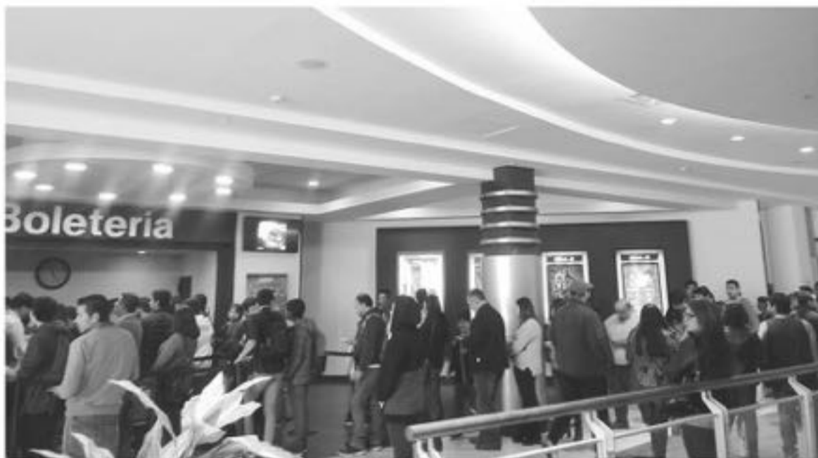
PERSONAL DE LA SIP de Carabineros se encuentra con esta investigación en desarrollo para determinar quién es el responsable de este robo.

algún trabajador del recinto podría haber perpetrado el robo, sin embargo, "consultada la gerente del lugar, no reconoce la cara del individuo", por lo que tendrá que ser la investigación en desarrollo la que logre determinar el paradero del delin-