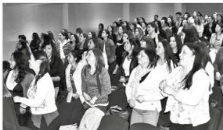
EL ENCUENTRO socializó herramientas relativas a promoción de la salud infantil.

La actividad contó con una asistencia de 230 profesionales de jardines infantiles, escuelas de lenguaje, colegios, Junaeb, Centros de salud y carabineros, de las distintas comunas de la zona.