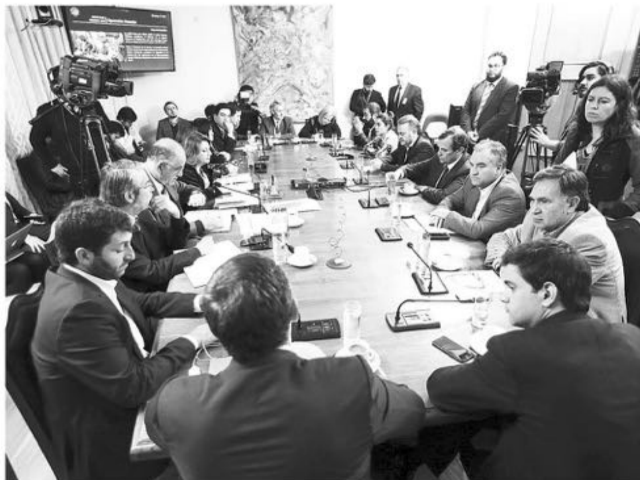
CONTROVERSA GENERÓ entre los miembros de la comisión investigadora de la Operación Huracán la decisión de invitar al líder de la CAM a entregar su testimonio en la instancia.