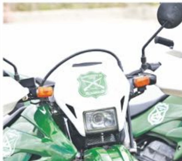
EL MENOR tendrá que declarar hoy en el tribunal angelino.

Sobre esto, se procedió a dar cuenta del hecho al Juzgado de Familia, donde el menor quedó citado a declarar en conjunto con su padre al tribunal este día lunes.