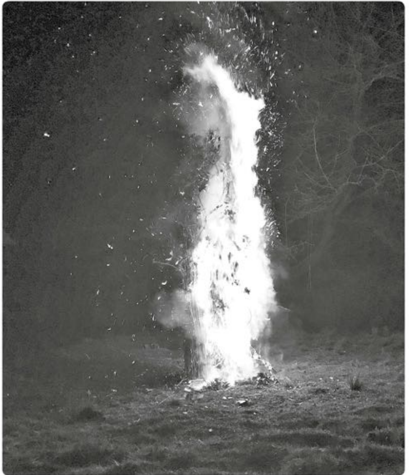
Fotografía: fogata cruz de mayo, Santa Bárbara

SI QUIERE SEGUIR BEBIENDO ES PROBLEMA SUYO, SI QUIERE DEJAR DE BEBER ES PROBLEMA NUESTRO.