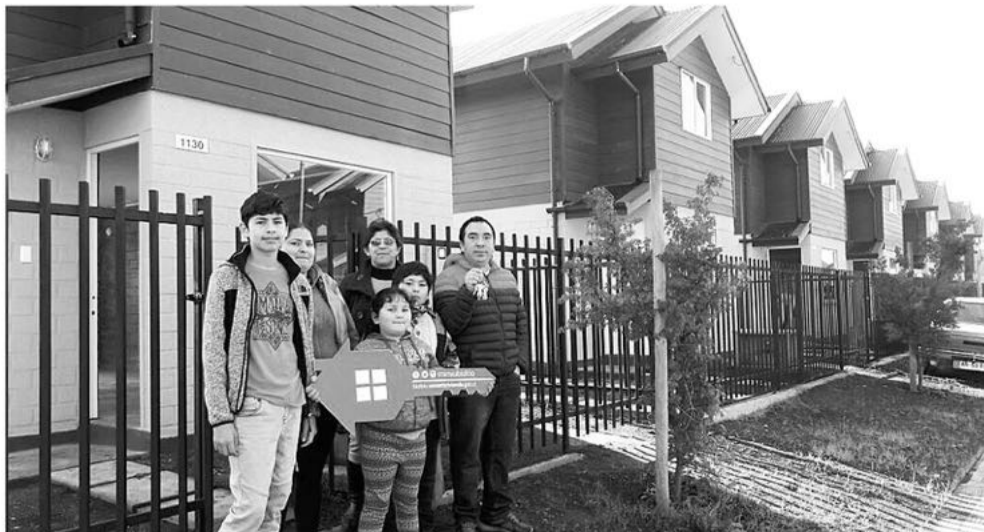
ESTOS PROYECTOS HABITACIONALES emblemáticos cuentan con viviendas de mejor calidad, colectores solares, buena ubicación, accesos a servicios básicos, verdes, estacionamientos y espacios que invitan a construir barrios.

El proyecto considera, además, multicancha, juegos infantiles, plaza de juegos para niños, arborización y paisajismo.