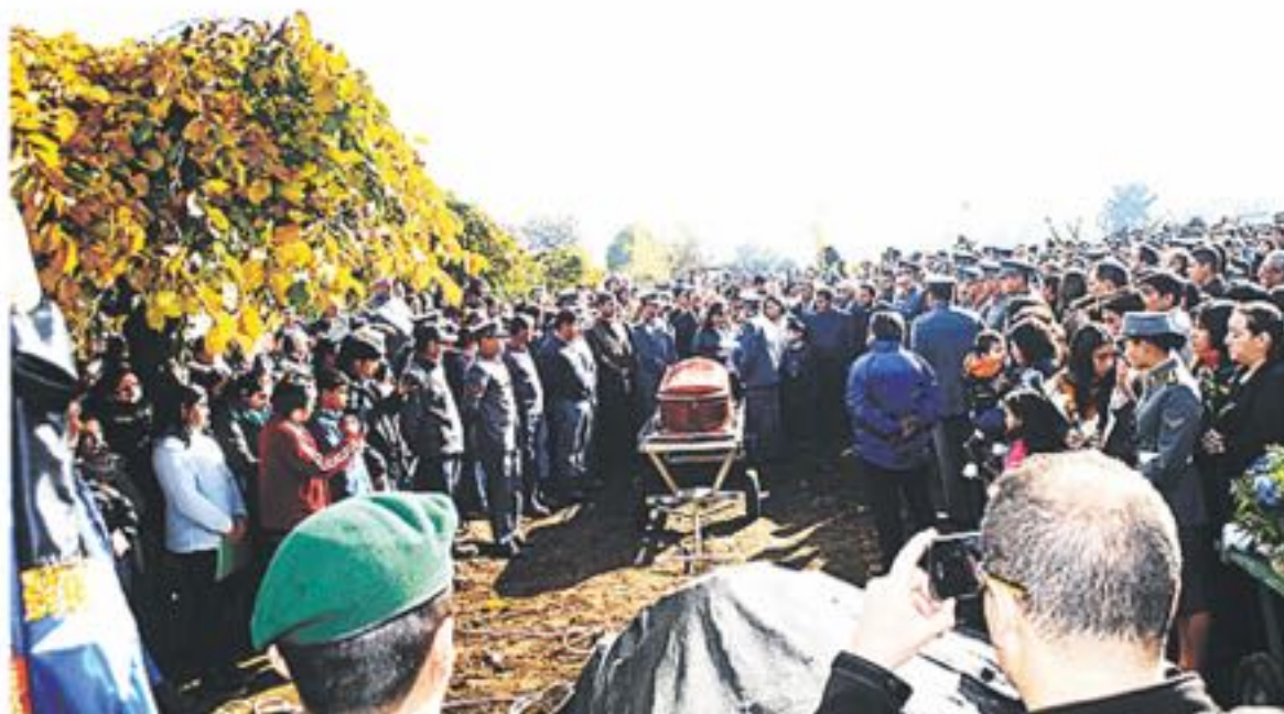
CIENTOS de personas acudieron al último adiós de este joven mártir angelino, muy querido por la comunidad.

Cabe señalar que durante este fin de semana, personal del Ejército llegó hasta las dependencias del destacamento, para entregar palabras de aliento a los familiares, quienes manifestaron el dolor que esto representa para la institución, ya que se trabaja