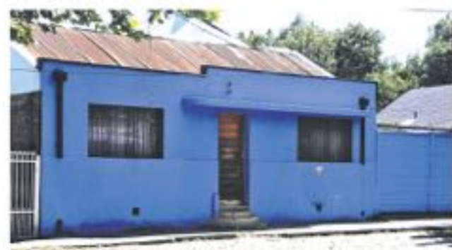
DOS MUJERES quedaron detenidas por frustrar los actos de Carabineros con forcejeos.

Por todo esto, el sujeto y las dos involucradas quedaron a disposición del tribunal, para la posterior investigación sobre este caso, que una vez más marca al reconocido local nocturno.