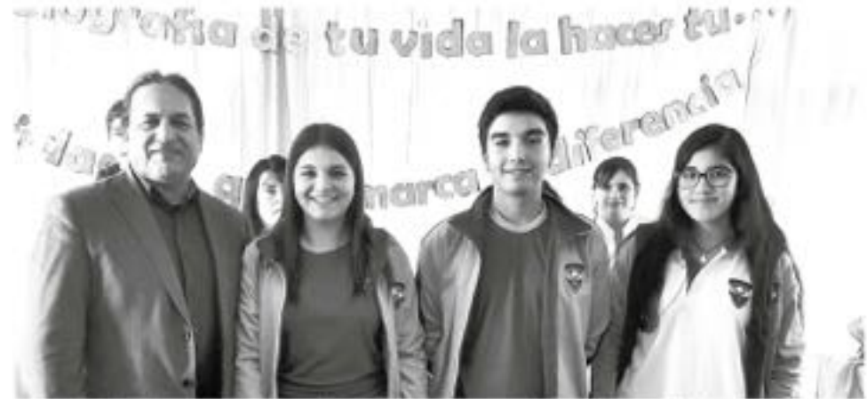
LA MEDIDA fue gestionada por el DAEM de Antuco, mediante recursos de la Ley SEP.

Del mismo modo, la directora del liceo Dr. Víctor Ríos Ruiz, manifestó que "fue un día muy especial para nosotros como liceo, pues pudimos por fin entregar a nuestros estudiantes, y a nuestros padres y apoderados los buzos que se confeccionaron desde el verano, con los que van a poder