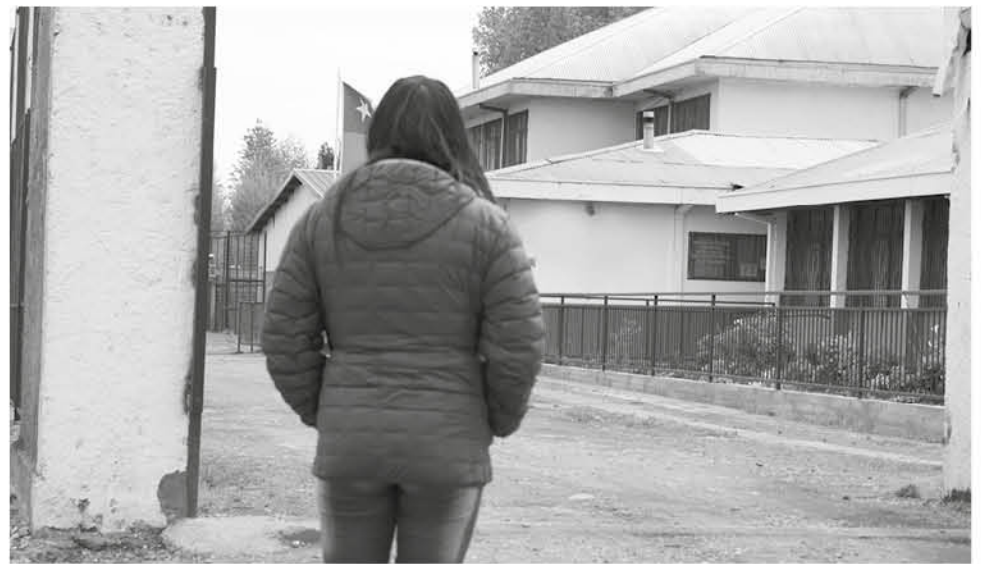
LA MAYORÍA DE LOS NIÑOS que son víctimas de bullying, están entre tercero y quinto básico.

"El protocolo tiene que ser algo que se esté viviendo cada día, ojalá hechos en conjunto con los profesores que no se haga dentro de cuatro paredes, el directivo, jefe UTP, entre otros, que arman un protocolo que en el papel se ve muy lindo y de pronto en la práctica no se puede aplicar. Es fundamental que la comunidad educativa en general, no sólo profesores,