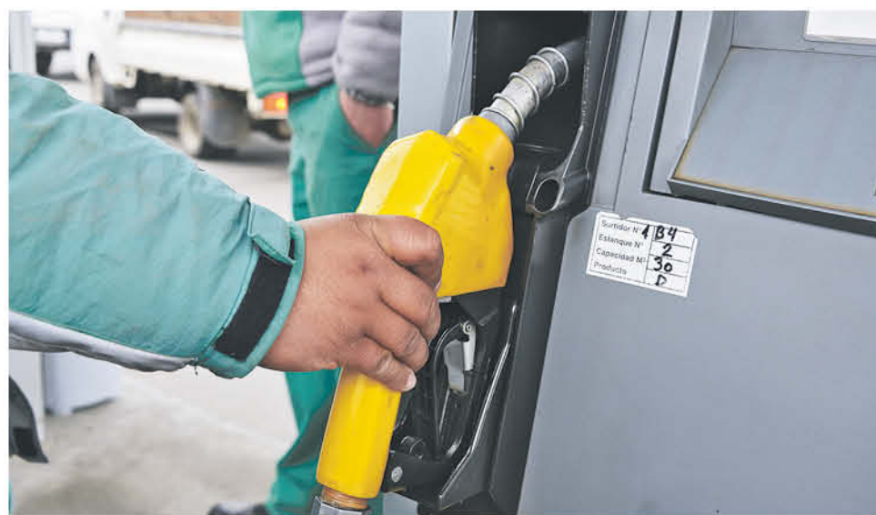
EL NUEVO AUMENTO se registró en todos los derivados del petróleo.

De este modo, los valores y variaciones de los combustibles derivados del petróleo, según su valor promedio en Los Ángeles, presentarán los siguientes precios: para la gasolina de 93 octanos el precio será de $743 en tanto la bencina de 97 costará $793 pesos, el diésel tendrá en valor de $546 pesos por litro y por último el kerosene costará $636.