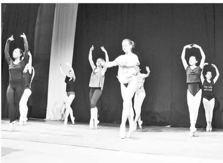
LA OBRA SE VA A PRESENTAR abierta a todo público gracias a la Corporación Cultural Municipal de Los Ángeles.

Este viernes 4 de mayo, a las 19:30 horas, en el Teatro Municipal de Los Ángeles, se presentará el Ballet Municipal con la obra La Fille Mal Gardée, conocida en español como “La hija malcriada”, bajo la dirección artística del maestro Hugo Zárate.