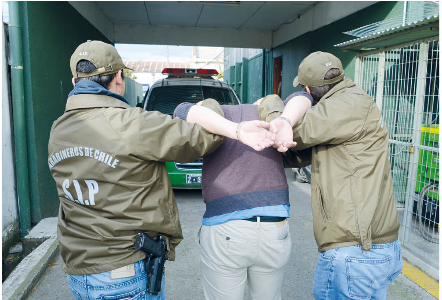
SIP LOGRÓ LA CAPTURA de estas personas que se encontraban solicitadas.

Los capturados pasaron a control de detención del Juzgado de Garantía de Mulchén.