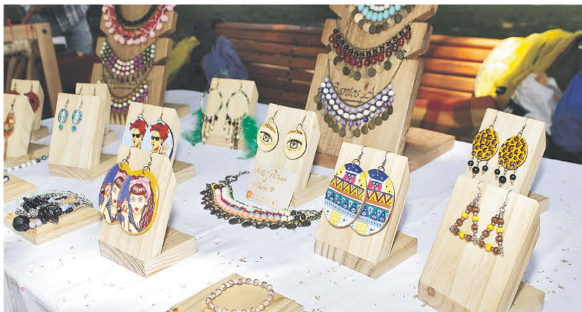
LA ACTIVIDAD se va a desarrollar de manera gratuita a la comunidad con diferentes charlas y actividades enfocadas a la mujer y su familia.

Por todo esto, el reconocido centro de eventos va a abrir sus puertas a todos los interesados, quienes a su vez van a poder recorrer los diferentes centros para los emprendedores