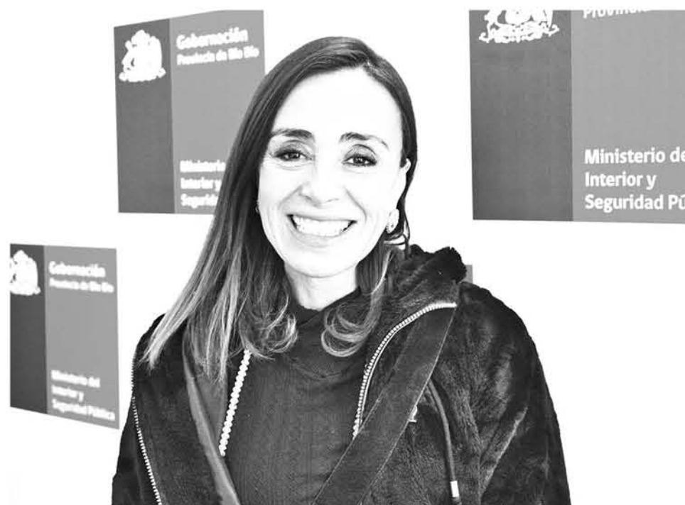
LA ACTUAL DIRECTORA de esta cartera explicó que la primera parte de su trabajo se basa en reconocer las necesidades de nivel provincial.

“Queremos seguir ampliando la cultura a nivel regional y todo esto es un gran cambio, sin olvidar que hace