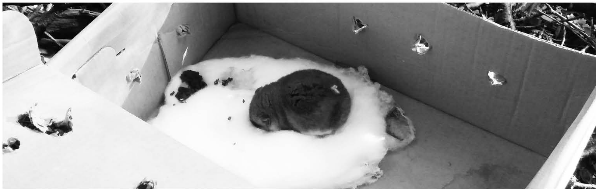
EN UN ÁREA BOSCOSA del Parque Nacional Laguna del Laja fue liberado este ejemplar de marsupial nativo.

Se distribuyen geográficamente desde la Región del Biobío hasta Chiloé, desde la selva costera hasta unos 1.000 m de altura sobre el nivel del mar en la cordillera de Los Andes.