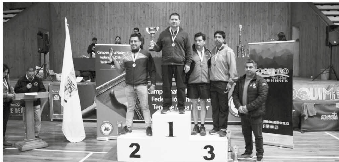
FUERON MÁS DE 250 deportistas que se dieron cita en Coquimbo, donde Moncada se alzó con el título.

Ahora los jugadores se preparan, para participar en el segundo Campeonato Nacional Individual y Dobles Máster 2018, que se desarrollará los días sábado 12 y domingo 13 de mayo en las dependencias del Centro Nacional de Entrenamiento Olímpico, de la comuna de Ñuñoa.