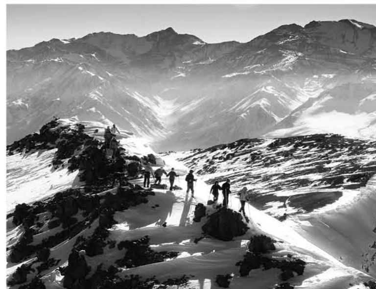
EL 2017 HUBO UN AUMENTO significativo en la llegada de brasileños y uruguayos, con 19,7% y 16,5% respectivamente (Foto de contexto).

hubo aproximadamente 9,24 millones de pasadas por peaje, creciendo un 2,35%, respecto a en la temporada anterior.