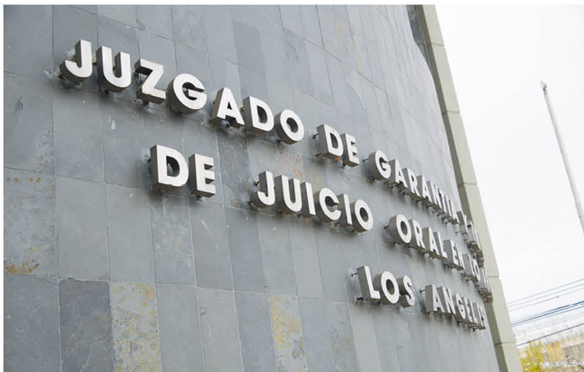
EL FALLO SERÁ el día lunes a las 12 horas.

La audiencia de comunicación de la sentencia que será redactada por el juez Osses Baeza quedó programada para las 12 horas del próximo lunes 7 de mayo.