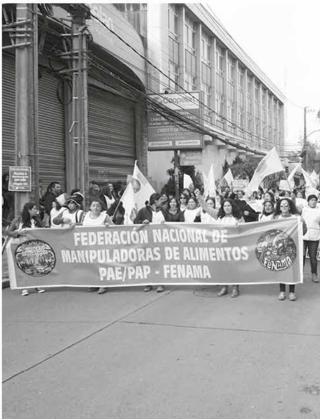
LA MARCHA DE ESTE GRUPO de trabajadoras concluyó en la plaza de armas de la capital provincial.

Mujeres se manifestaron para reivindicar demandas que mantienen como sector. Balance de la jornada fue calificado como positivo por la CUT provincial.