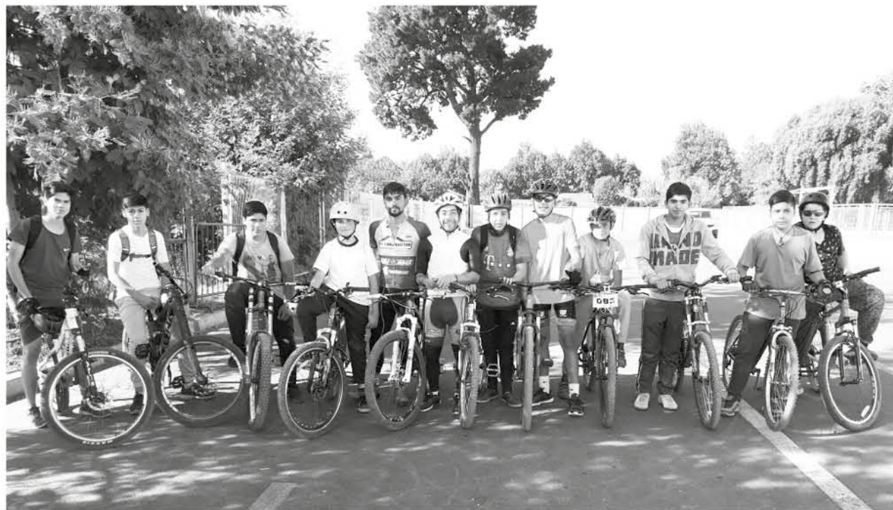
LA IDEA ES QUE PARTICIPEN jóvenes de entre 10 y 17 años.

Al mismo tiempo dejó en claro que el taller es totalmente gratuito.