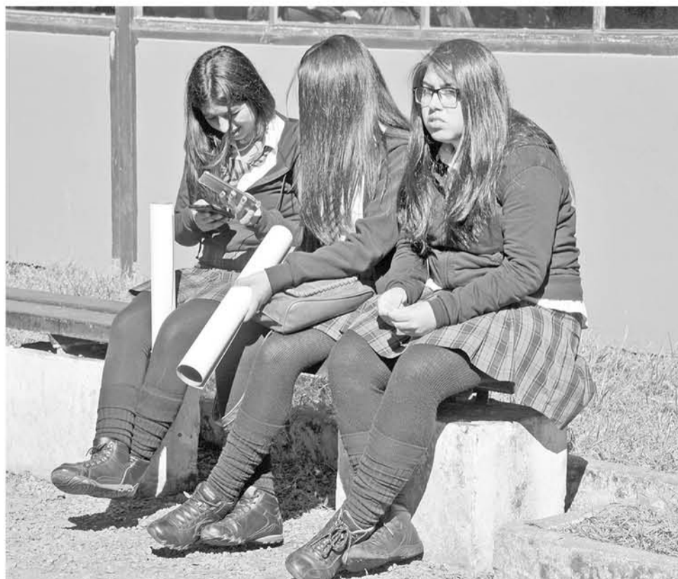
MÁS DE UN MILLÓN de estudiantes a nivel nacional están en condiciones de renovar su pase escolar año 2018.

El trámite se podrá realizar hasta el 31 de mayo en los puntos habilitados a lo largo de todo el país. Para hacer el proceso de revalidación los estudiantes deben tener la condición de alumno regular de un establecimiento reconocido por el Ministerio de Educación