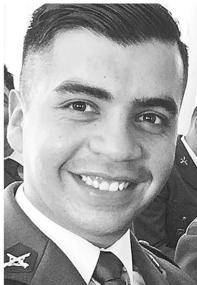
CARABINERO ejerce su función dentro y fuera del uniforme.

Para finalizar, el subprefecto informó que el delincuente pasó a control de detención y quedó privado de libertad mientras dure la investigación, siendo considerado un riesgo para la seguridad de la sociedad.