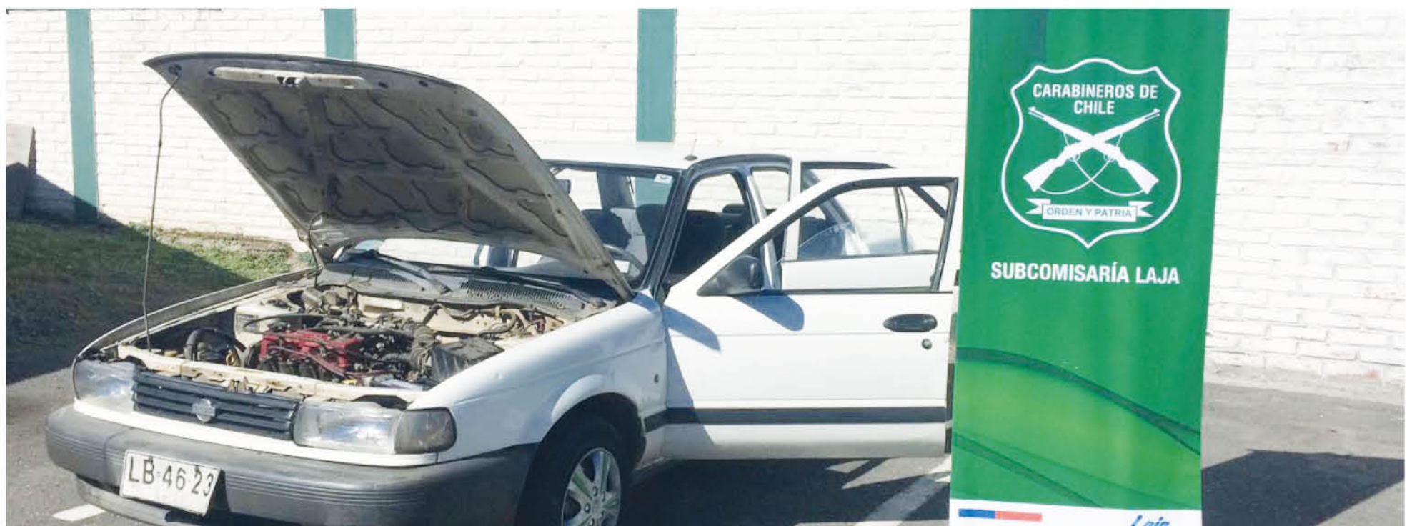
LA FOTOGRAFÍA muestra el vehículo marca Nissan recuperado por los efectivos policiales.

De igual forma se verificó que el imputado mantenía una medida cautelar de arresto domiciliario total.