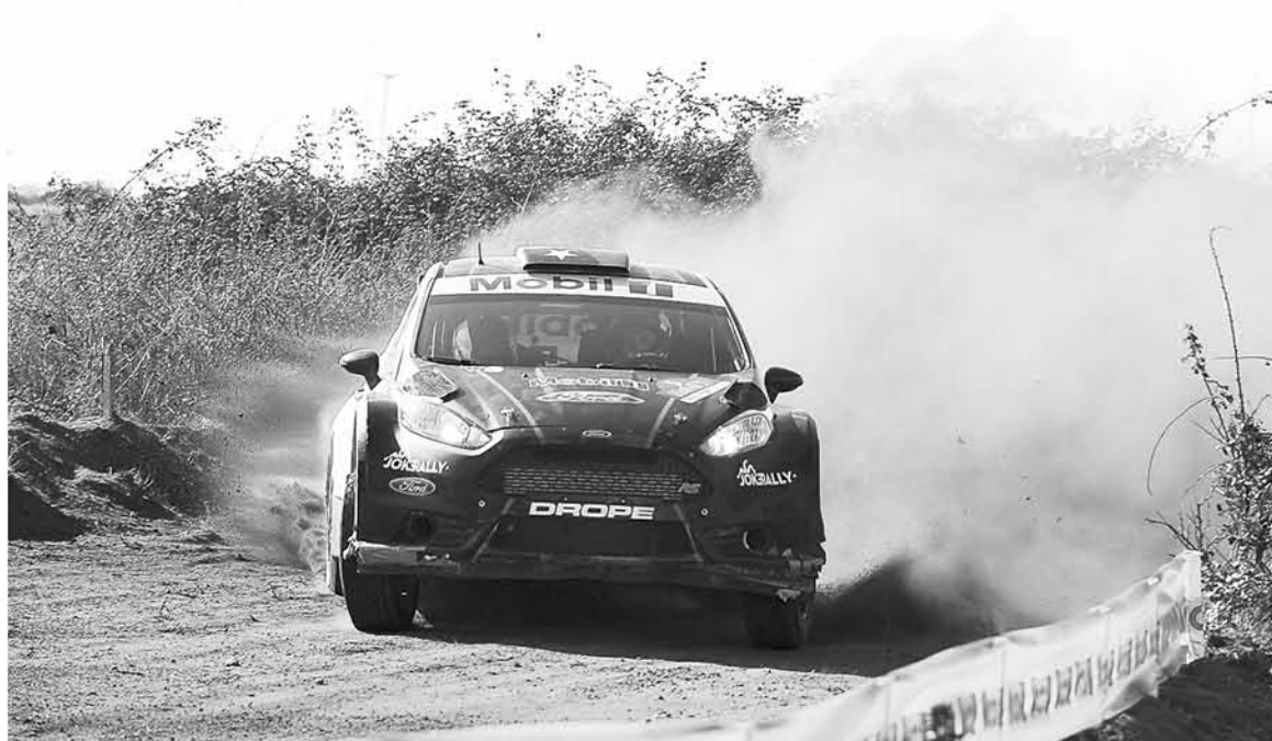
POR UNA DIFERENCIA de más de tres minutos, el angelino arrasó en Concepción y ahora espera por su tierra: Los Ángeles.

Quien no lo pasó bien en la última etapa de este domingo fue "Chaleco" López. En el prime número 9 se encontraba luchando por el tercer puesto cuando tuvo una salida del