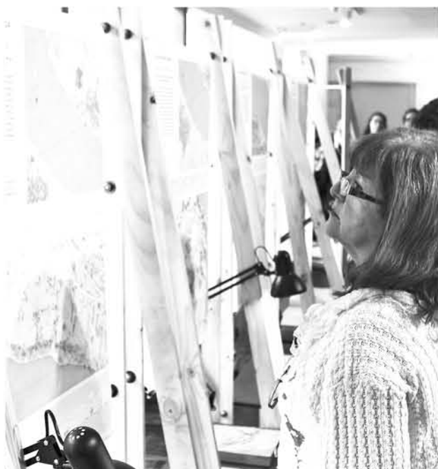
LA RIGUROSA EXPOSICIÓN se basa en una escala original en planimetría de estos momentos históricos.

Hasta el 2 de mayo va a estar disponible la exhibición que busca fomentar la cultura local en materia de fuertes regionales.