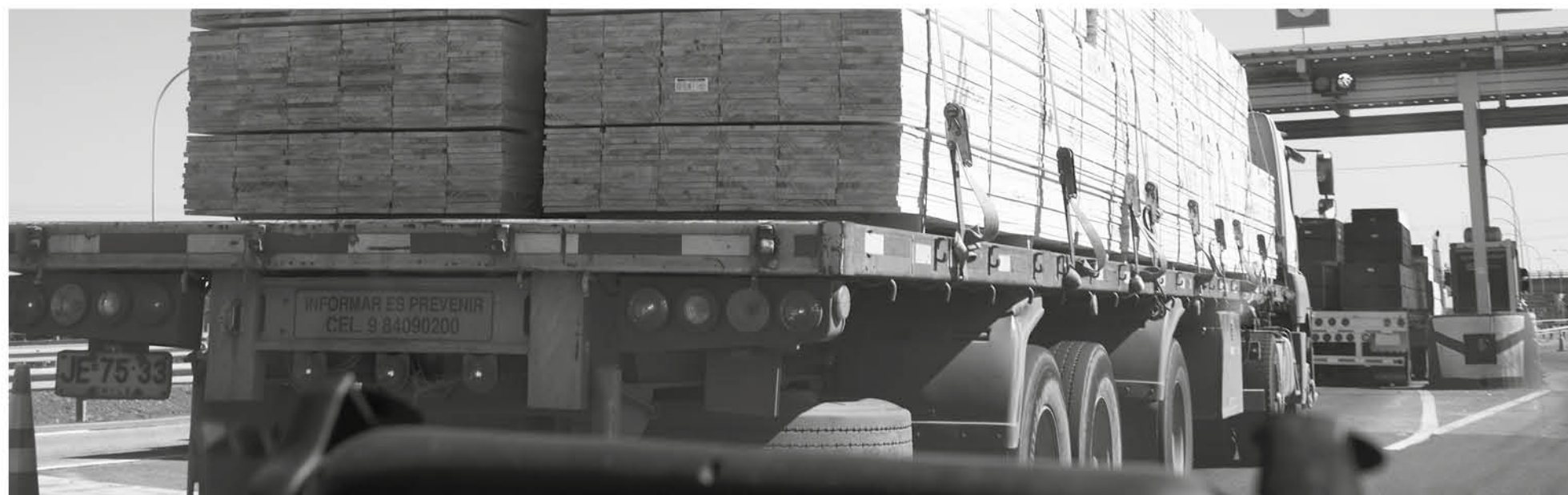
SE ESPERA CONVOCAR alrededor de 160 empresarios chilenos y compradores de Centroamérica y El Caribe.

Ej: Accesorios e insumos para la construcción de casa prefabricada Electromallas Encofrados Materiales prefabricados