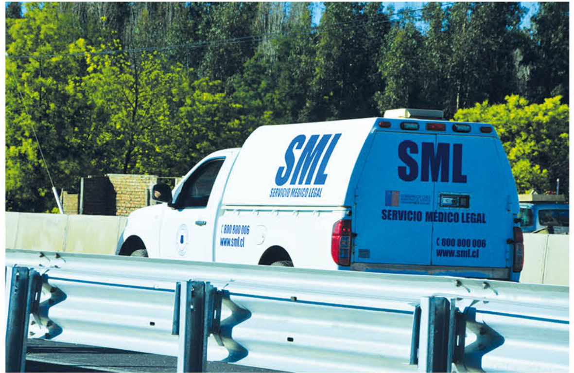
EL CUERPO DE LA VÍCTIMA fue retirado por el Servicio Médico Legal.

Asimismo, informó que ya el sospechoso se encuentra totalmente identificado y a las órdenes de la justicia. Al lugar concurrió personal S.I.A.T Biobío y el cuerpo fue retirado por personal del servicio médico legal.