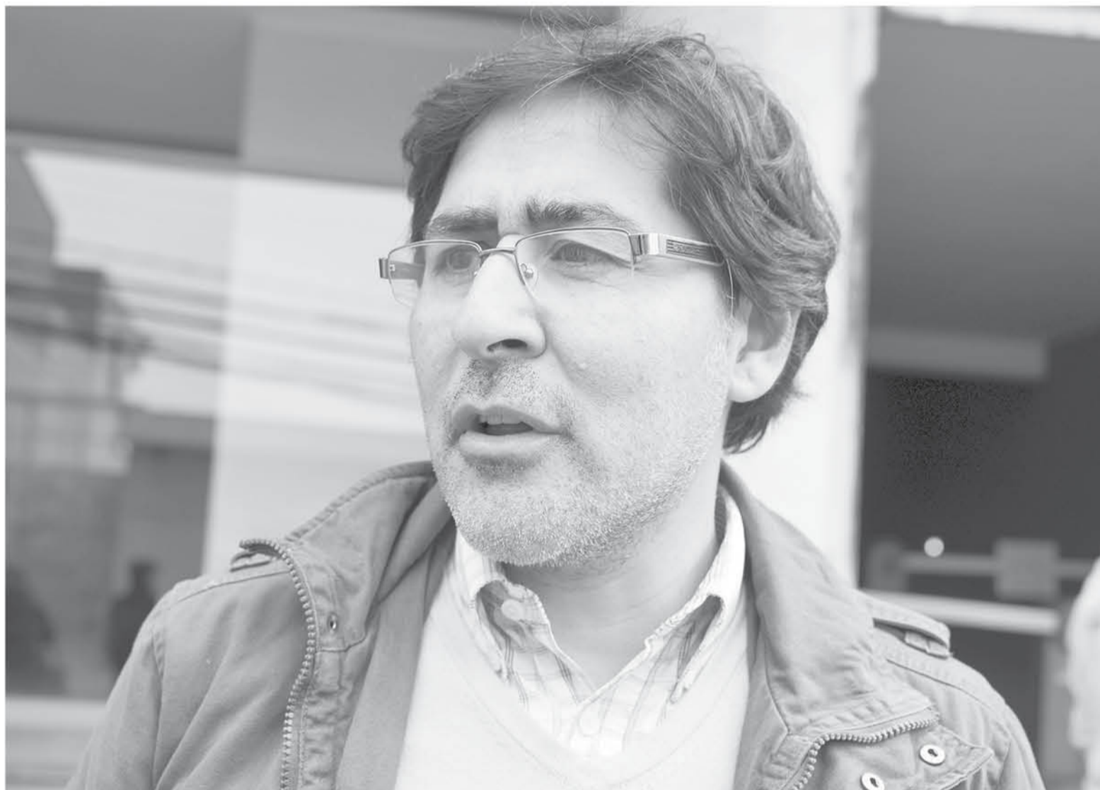
EN OPINIÓN DE PINILLA, Soledad Alvear es una de las recientes líderes de la DC que apoyó decisiones que terminaron por perjudicar al partido.

En ese sentido, destacó liderazgos como el del vicepresidente nacional