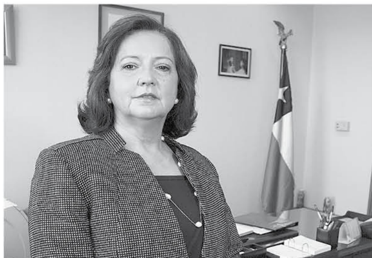
ESTE DOMINGO Soledad Alvear anunció su renuncia a la Democracia Cristiana, dejando así atrás 50 años de militancia en dicho partido.