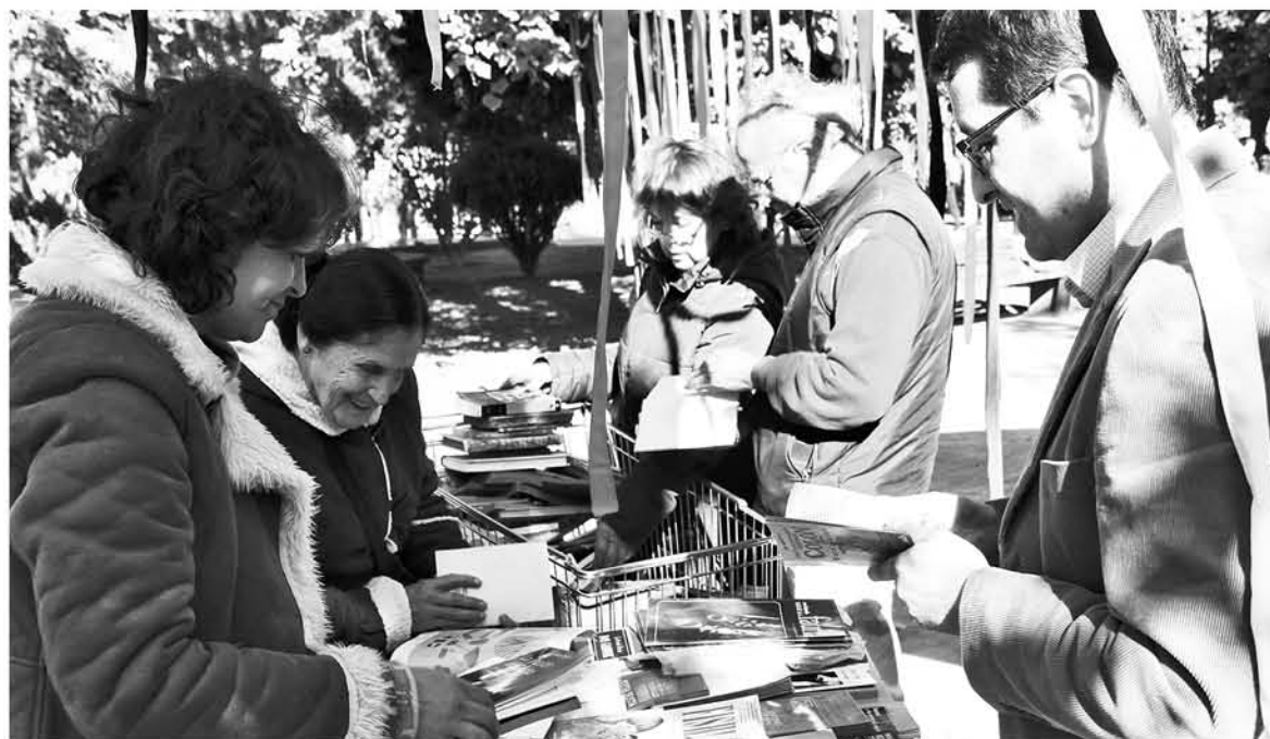
LA CORPORACIÓN CULTURAL Municipal de Los Ángeles dispuso puntos de intercambio para los lectores angelinos. La actividad continuó este martes.

“En esta etapa de su vida ellos buscan mucho refugio en la lectura. Les gusta mucho leer. Los libros que tenemos en el hogar los han leído todos entonces necesitábamos renovar la lectura de nuestros adultos mayores. Estaban muy entusiasmados. Desde que les contamos que iban a participar ellos mismos buscaron todos los libros que tenían en el hogar para intercambiarlos.”