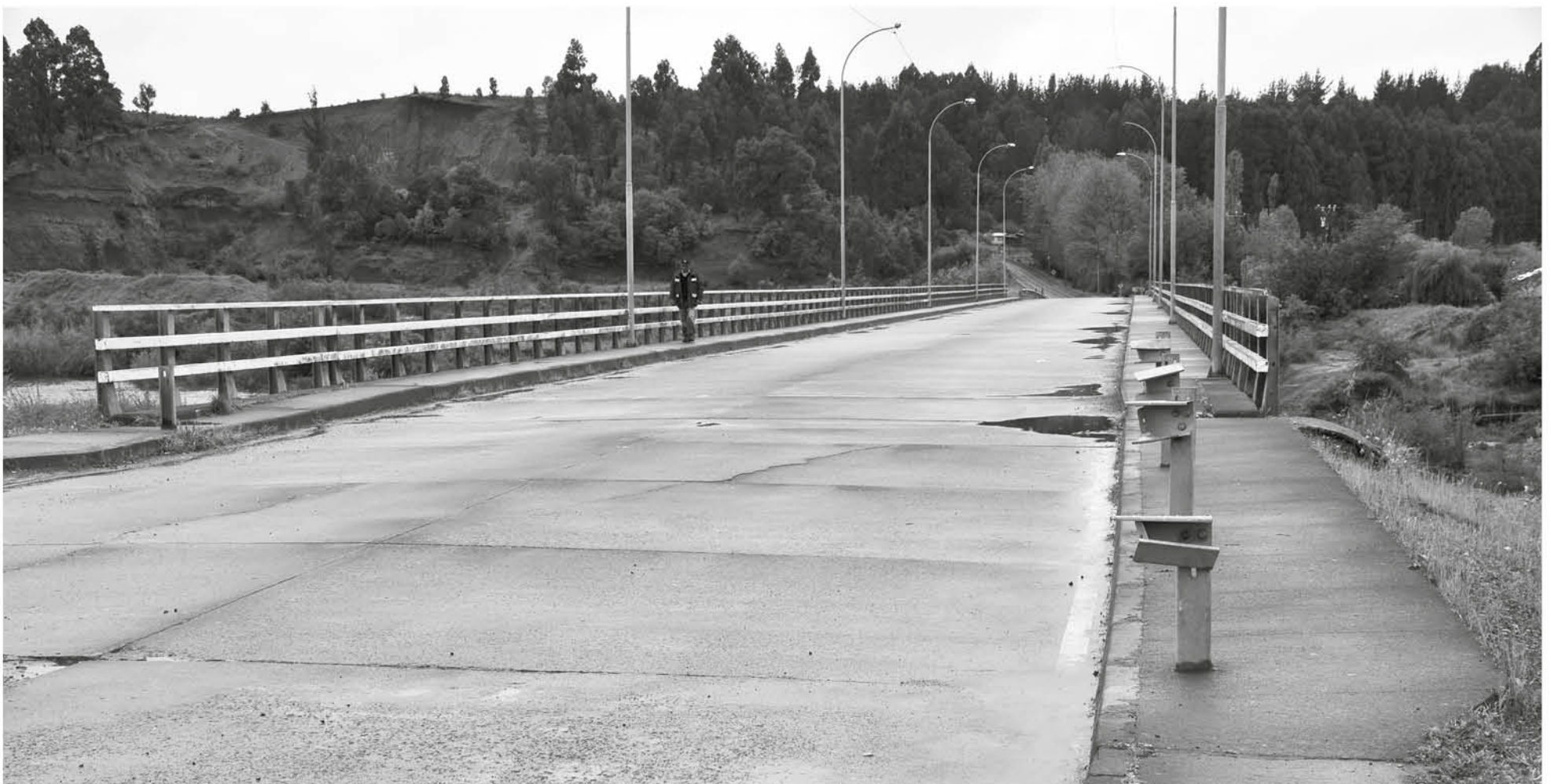
UN PUENTE SOBRE EL DUQUECO, que una a Quilleco con Santa Bárbara, similar al que conecta esta última comuna con Quilaco, sobre el Biobío, es el que anhelan se materialice en el corto plazo los alcaldes de la Amcordi.