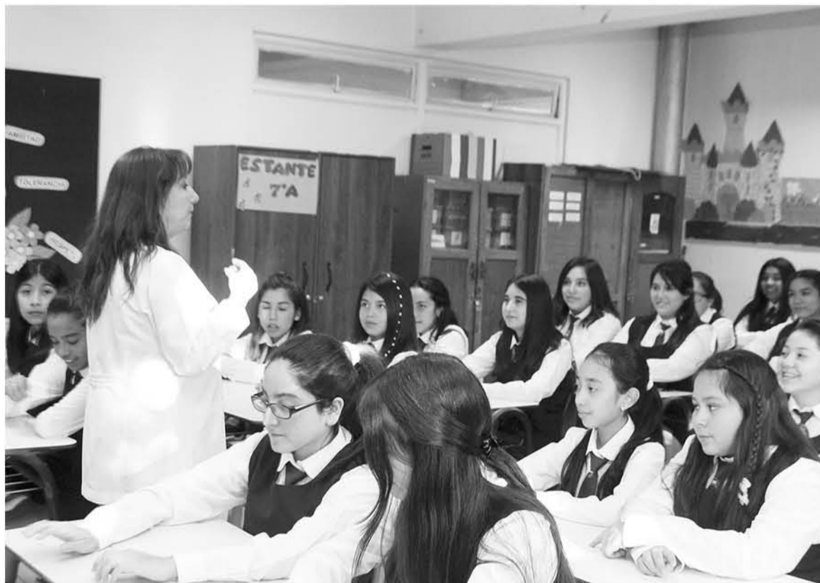
EL PROYECTO tiene como fin exigir una justificación médica (informe del Compín) para poner término a la relación laboral por salud incompatible de los docentes.

Esta declaración generará el retiro del profesional, al que se le pagarán todas las remuneraciones correspondientes al empleo durante seis meses, siendo ello de cargo del sostenedor.