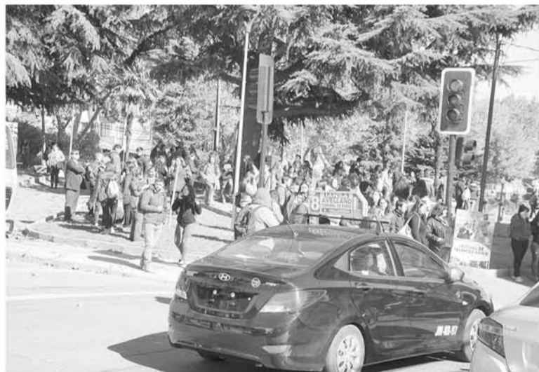
LA EVACUACIÓN ocupó en un inicio el bandejón central de la avenida Ricardo Vicuña.

Al siniestro asistieron las cuatro compañías de Bomberos de la comuna de Los Ángeles.