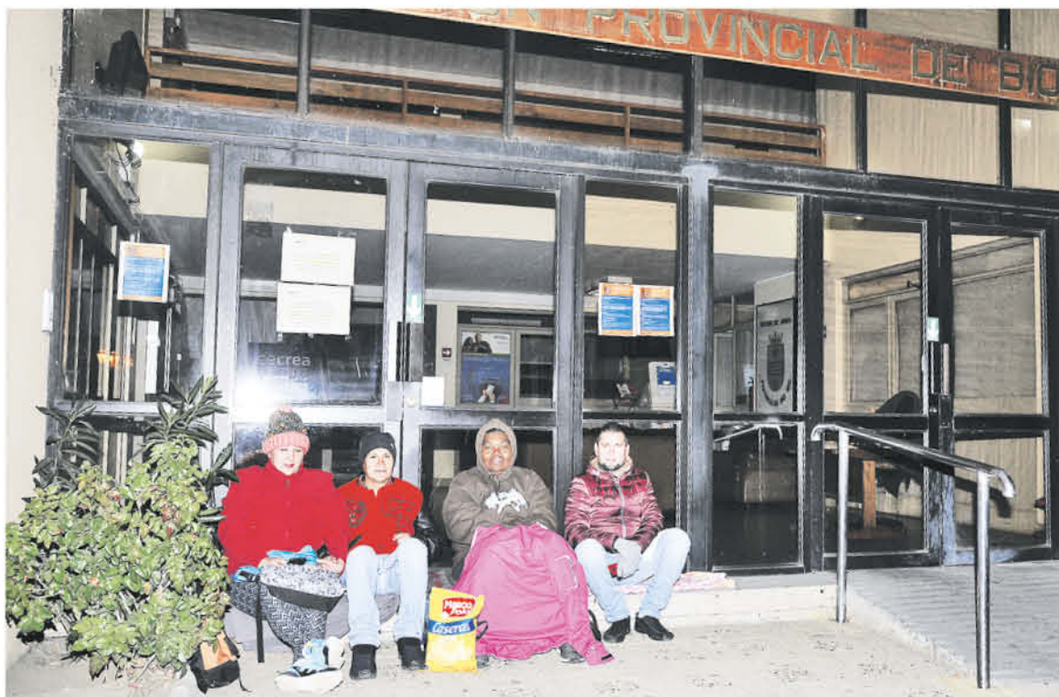
VARIOS MIGRANTES PASARON la noche en espera de alcanzar un lugar en la Gobernación Provincial.

Estos necesitan presentar documentos de identificación (pasaporte o cédula de identidad del país de origen), deben acudir presencialmente para tomar foto, huella dactilar y entregar datos de contacto, además, tarjeta de turismo o certificado de viaje emitido por PDI a quienes entraron por pasos habilitados.