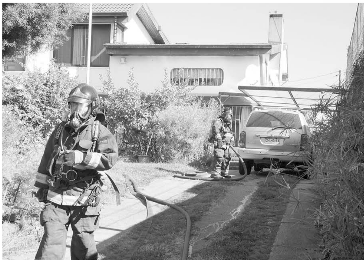
MOMENTOS en el que los bomberos controlaban la situación.

Asimismo manifestó que en la tarde de ayer asistió el maestro a arre-