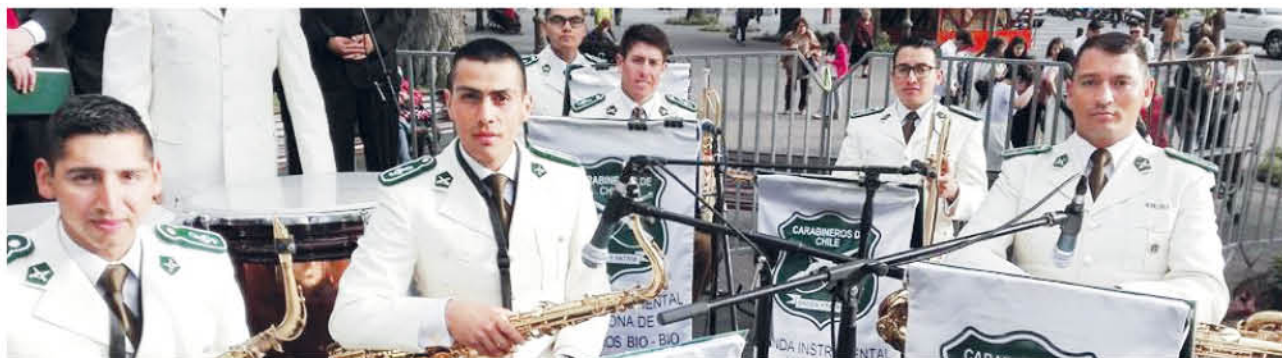
CARABINEROS de Chile.