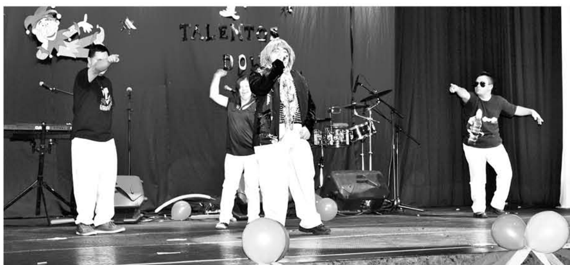
EN LA INICIATIVA los niños con síndrome de Down, presentarán su talento en las actividades de danza, teatro y pintura.

Una de las importancias de esta actividad, es que las partes organizadoras Crecer y la municipalidad de Los Ángeles, han extendido la invitación a todos los vecinos y ciudadanos ya que es una actividad especial de