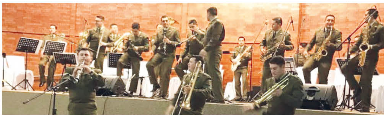
BANDA DE CARABINEROS de la Octava Zona.

Esta actividad, organizada por la Prefectura Biobío N° 20 en el marco del 91° aniversario institucional.