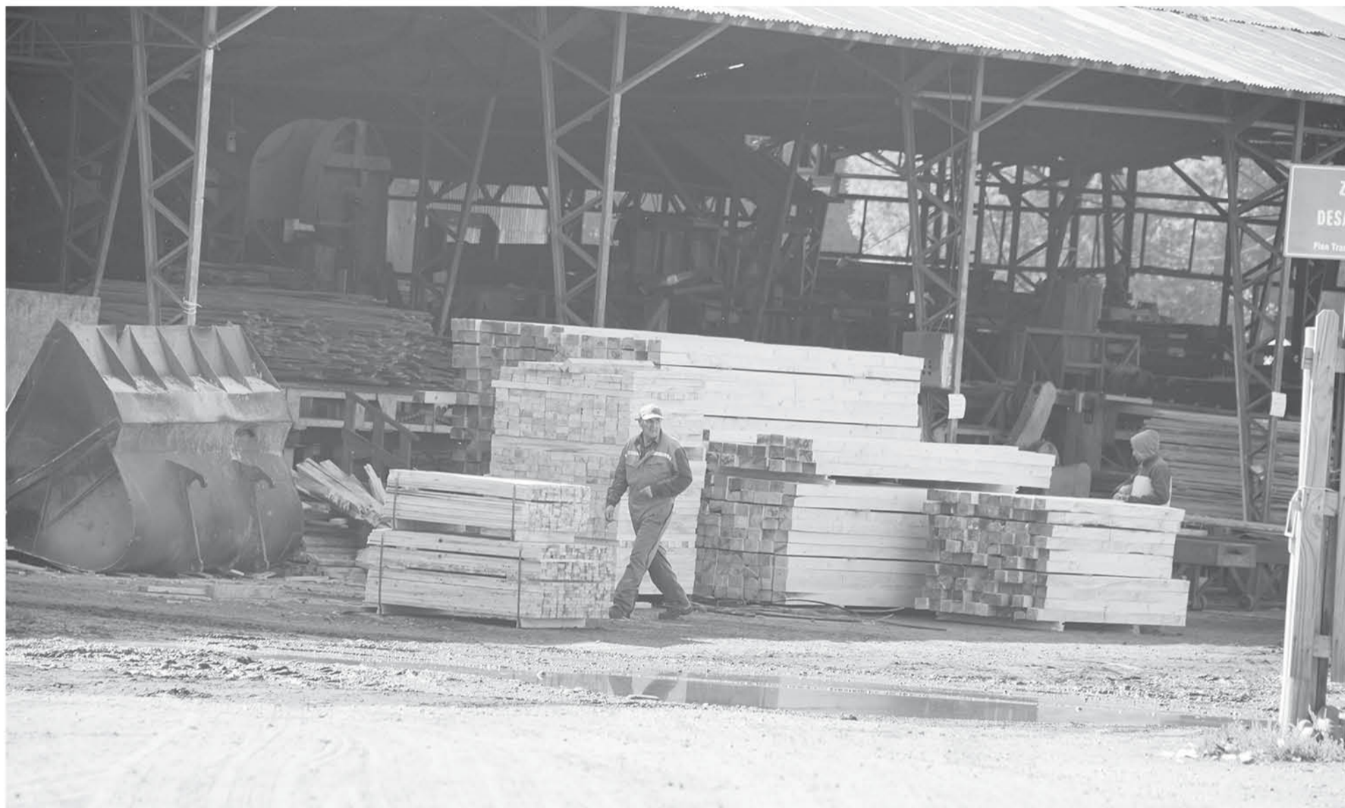
UNA CAÍDA de más de tres metros de altura le costó la vida a un trabajador que prestaba servicios a la conocida empresa Maderas Rarínco.

Un trabajador de 55 años perdió la vida tras sufrir un accidente en la empresa conocida como Maderas Rarínco ubicada en el kilómetro 502 del camino longitudinal.