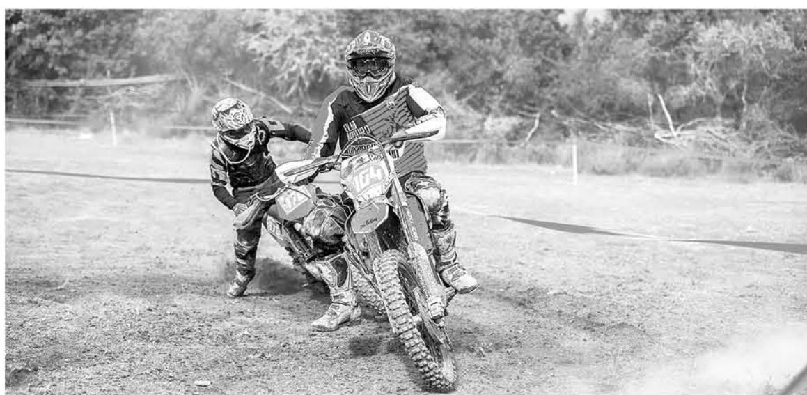
SE ESPERA QUE LA PRÓXIMA fecha vuelva a ser en la séptima región. (Imagen: Productora One Way).

A su vez, sentenció que el balance es muy positivo, debido a la gran cantidad de gente que llegó y es que según Carabineros debieron haber