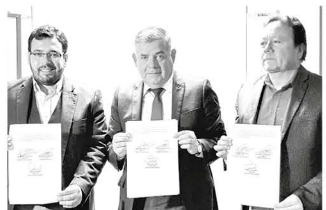
LA OFERTA de tratamiento consta de 8 planes ambulatorios básicos y 7 intensivos en dependencias del Hospital de la comuna.