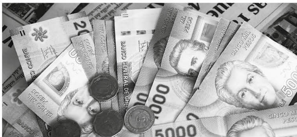
CON ESTA MODALIDAD se pretende hacer más fácil y seguro el cobro de esta devolución.

Con esta iniciativa se espera beneficiar a más de 20 mil empleadores -en promedio- que generan mensualmente un Saldo a Favor.