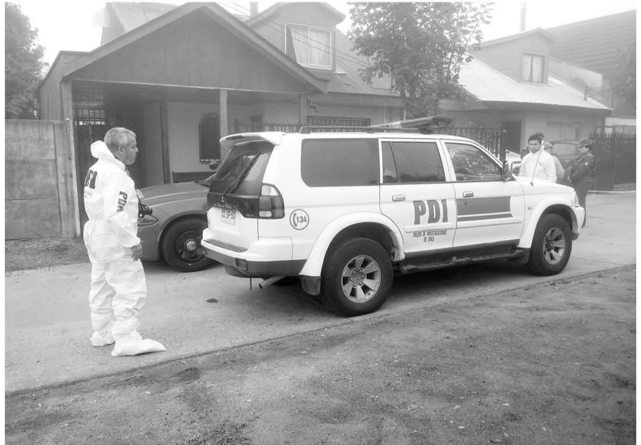
LA MUJER UNA VEZ AGREDIDA, salió a pedir ayuda a los vecinos quienes la llevaron al hospital.

Respecto a la víctima, Quiroz precisó que “este hecho ocurrió en la madrugada en este domicilio de