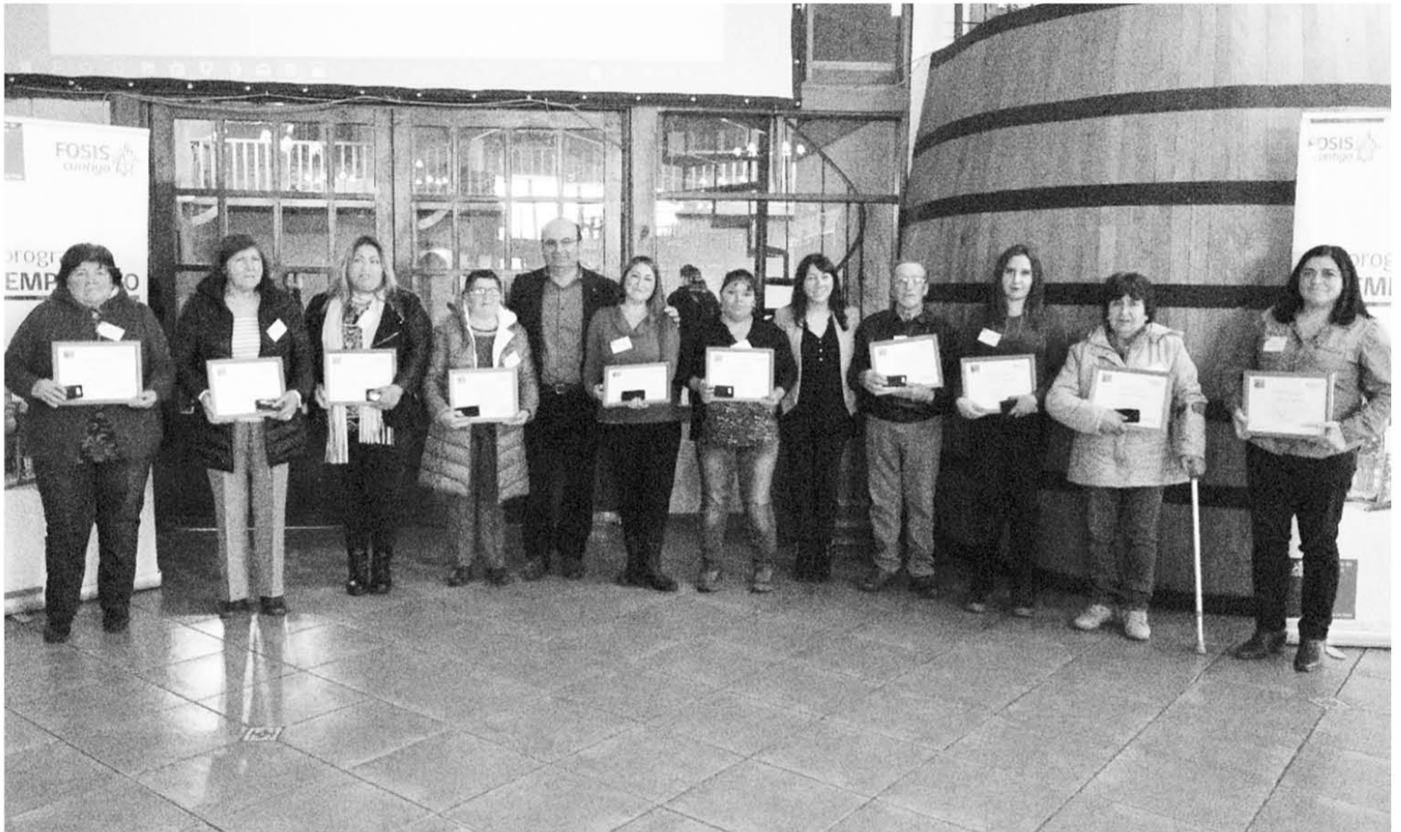
SESENTA FAMILIAS emprendedoras fueron beneficiadas por Fosis.

Los microempresarios recibieron aporte económico, herramientas e insumos para sus emprendimientos, todos pertenecientes al programa Familia del Subsistema Seguridades y Oportunidades.