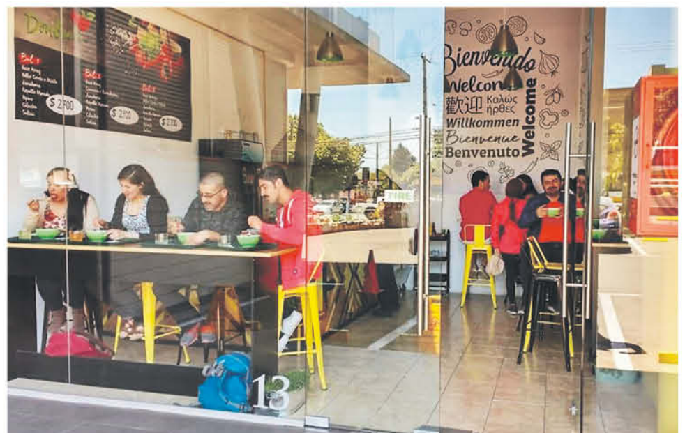
EL RESTAURANT es una alternativa saludable de comida exprés, ubicado en paseo Alcorta local 13 de Los Ángeles.

No hay que olvidar, que todos los platos de este local, se caracterizan por ser una opción baja en calorías para todas las personas de todas las edades.