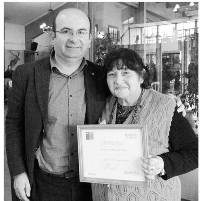
ALCALDE QUILLECANO: "Cuando la jefa de hogar emprende, se capacita, crece y progresa, también crece y progresa su familia".

hogar emprende, se capacita, crece y progresa, también crece y progresa su familia".