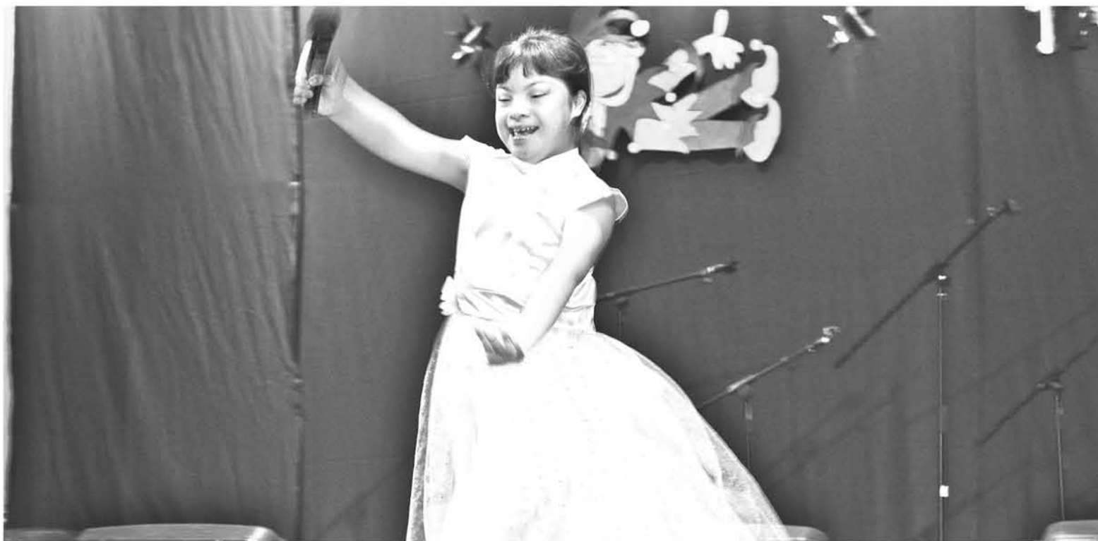
LA ACTIVIDAD se va a realizar este año, en su sexta versión.

Debido a esta iniciativa, se incluyó la participación de diferentes establecimientos educacionales, entre los que se encuentran el colegio San Ignacio, liceo Técnico, la escuela especial Esperanza, personas de