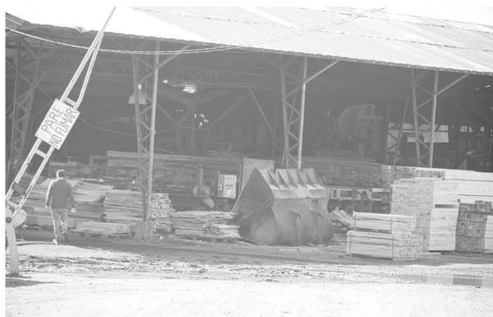
EN EL LUGAR SE PUEDE APRECIAR gran cantidad de trabajadores, transitando por los patios de la empresa sin implementos de seguridad.

recabado por este medio, el trabajador fallecido estaba contratado por una empresa externa a la empresa para realizar trabajos en altura, por lo que las responsabilidades administrativas serán aclaradas mediante el sumario.