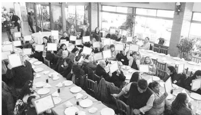
EL PROGRAMA FUE IMPLEMENTADO en otras cinco comunas de la provincia destacando Quilleco por la cantidad de participantes.