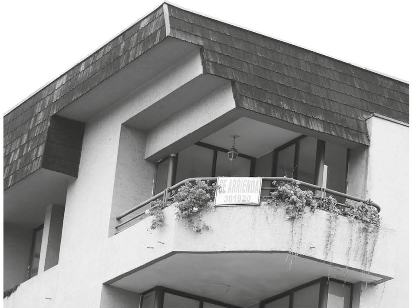
ES NECESARIO ACREDITAR un ahorro mínimo de 4 UF al día de la postulación.

Por cada integrante del núcleo familiar que exceda de tres, el ingreso máximo mensual del grupo familiar se incrementará en 8 UF.