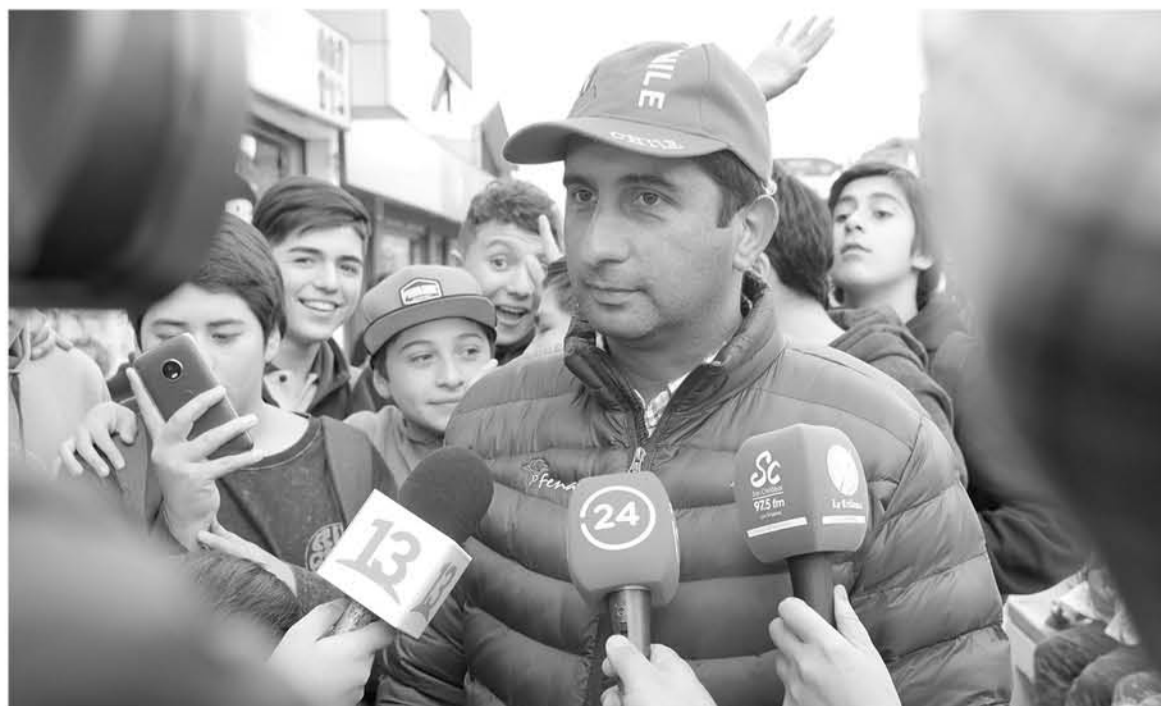
SIN EMBARGO, aseguran que si el tribunal determina lo contrario lo pagarán “de forma gustosa”.

Desde la entidad, aseguraron que tendrá que ser un juez quien determine la decisión final.