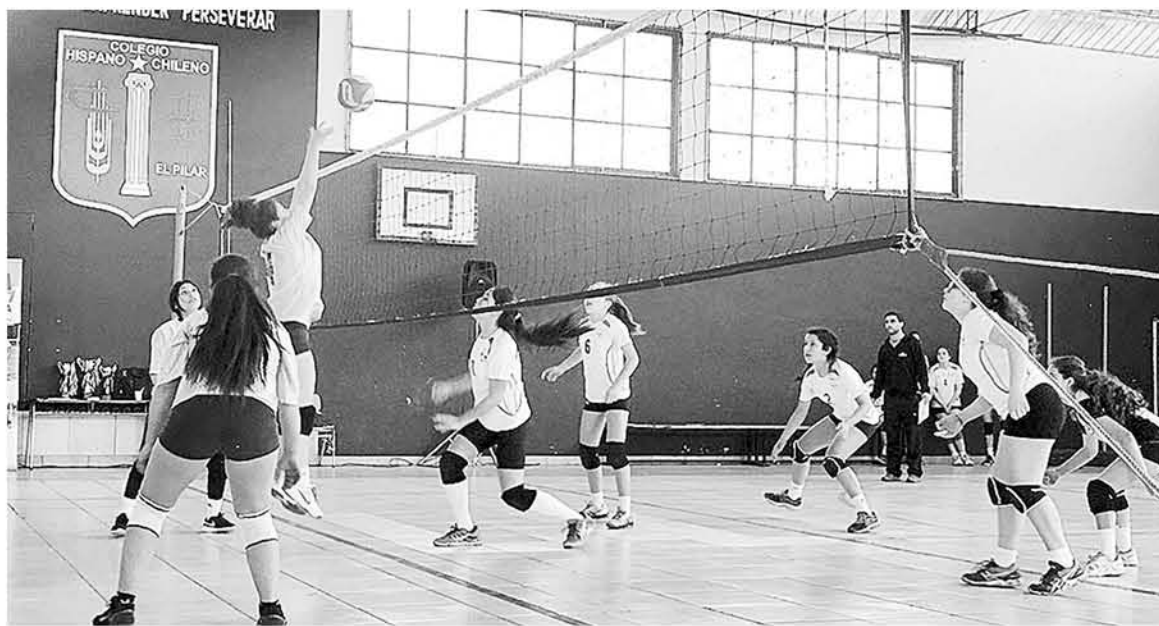
SI BIEN, LA TAREA no será sencilla, se medirán de igual a igual con poderosos como Stadio Italiano o Deportivo Alemán.

A ello, agregó que hay que ser realistas en cuanto al nivel también de los otros competidores, por ello sentenció que "tenemos excelentes jugadoras, de diferentes colegios esto de formar un club es importante porque se da la dinámica y el contacto de niñas de diferentes colegios, pero