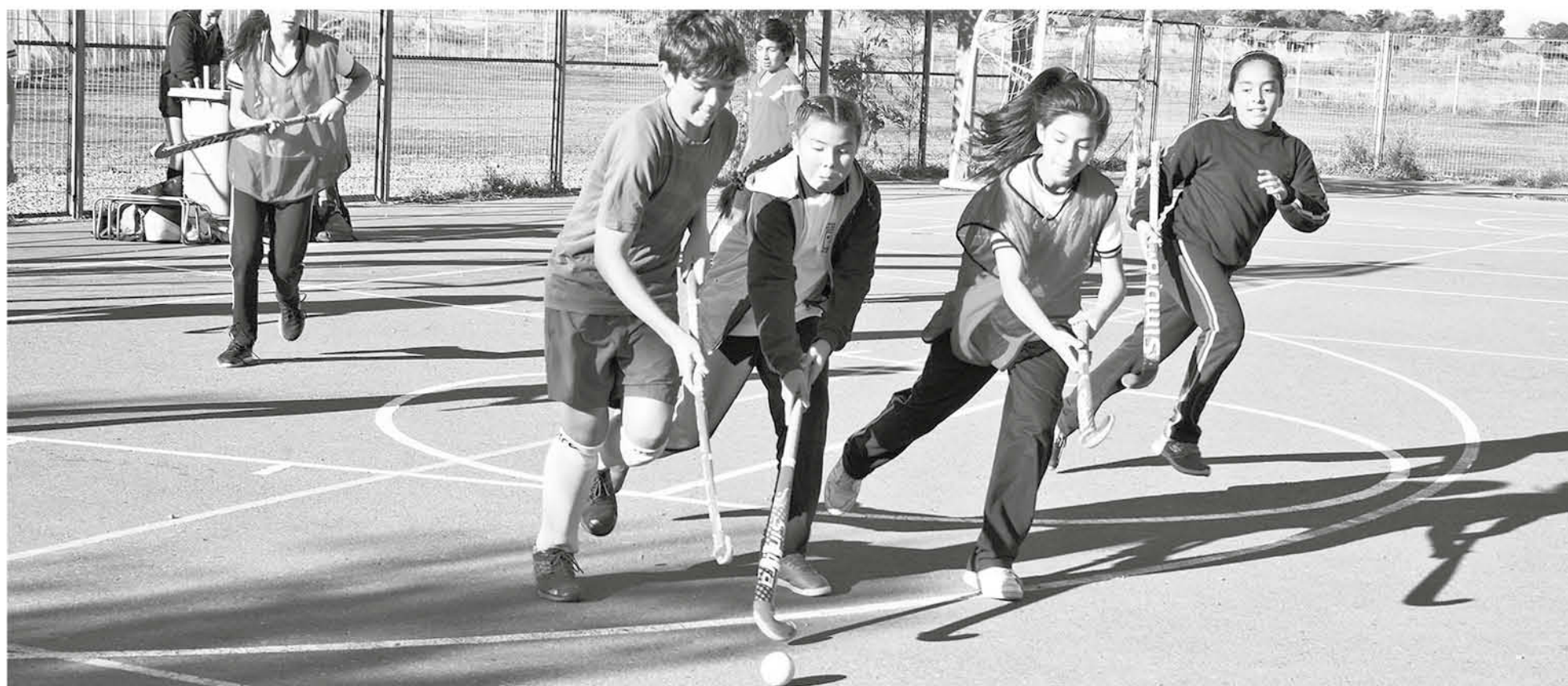
EL EQUIPO BUSCARÁ seguir en racha positiva.