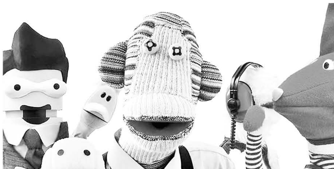
31 MINUTOS JUNTO a todos sus personajes serán los encargados de presentar un gran espectáculo familiar, este sábado 14 de abril a las 15 horas.