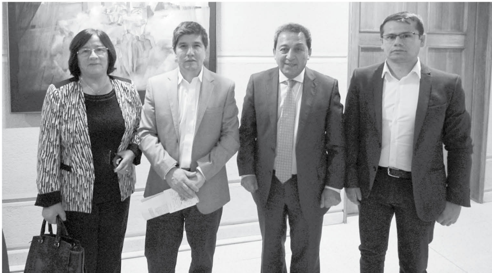
AUTORIDADES VIAJARON hasta Valparaíso para exponer en la Comisión de Energía, la vulneración de la comunidad tras cortes eléctricos.

Comisión de Energía de la Cámara de Diputados analizó la situación de cortes de energía prolongados en Laja, San Rosendo y Santa Juana.