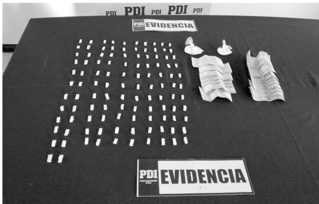
DECOMISAN DROGA y efectivo en el allanamiento.