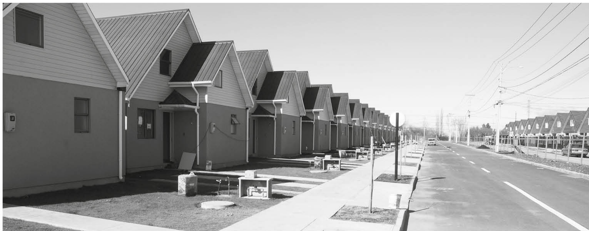
EL PLAZO DE POSTULACIÓN es hasta el 20 de abril, y en el caso de hacer los trámites por internet, es hasta las 18 horas del jueves 19.

Para postular a este beneficio, lo puede hacer vía internet, o en las oficinas de Serviu.