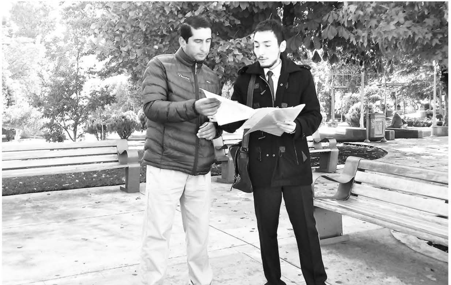
LA EVIDENTE APARICIÓN de malos olores y excesiva cantidad de algas en el río Laja, alertaron a los habitantes de la zona.

"Sentimos que la buena disposición de Lotería duró hasta que los periodistas se retiraron de sus oficinas centrales.