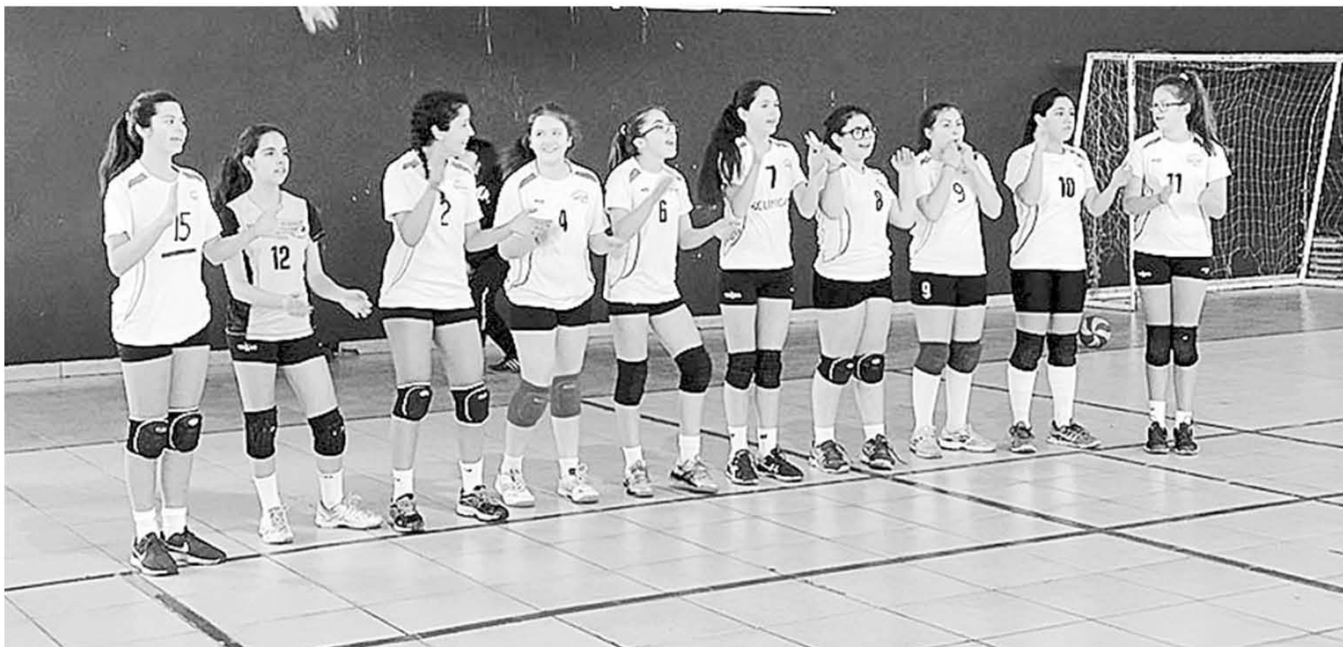
LAS DEPORTISTAS intentarán quedar en la categoría "A".