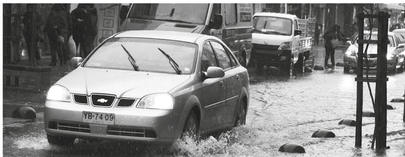
DIRECCIÓN REGIONAL de Onemi e Intendencia Biobío llaman a extremar precauciones.

Las autoridades hacen un llamado a la calma y a ser precavidos en este tipo de situaciones. Manejar con precaución y a la defensiva, manteniendo las distancias pertinentes para evitar colisiones. En el hogar, limpiar techumbres y canaletas y cuando llueva intensamente, salir al exterior sólo si es necesario.