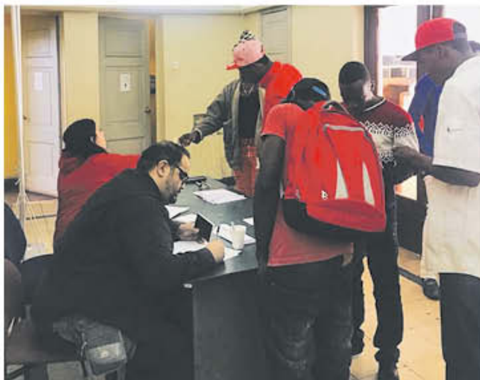
EN ESTA PRIMERA oportunidad, los organizadores realizaron jornadas de respuestas ante dudas de los extranjeros.