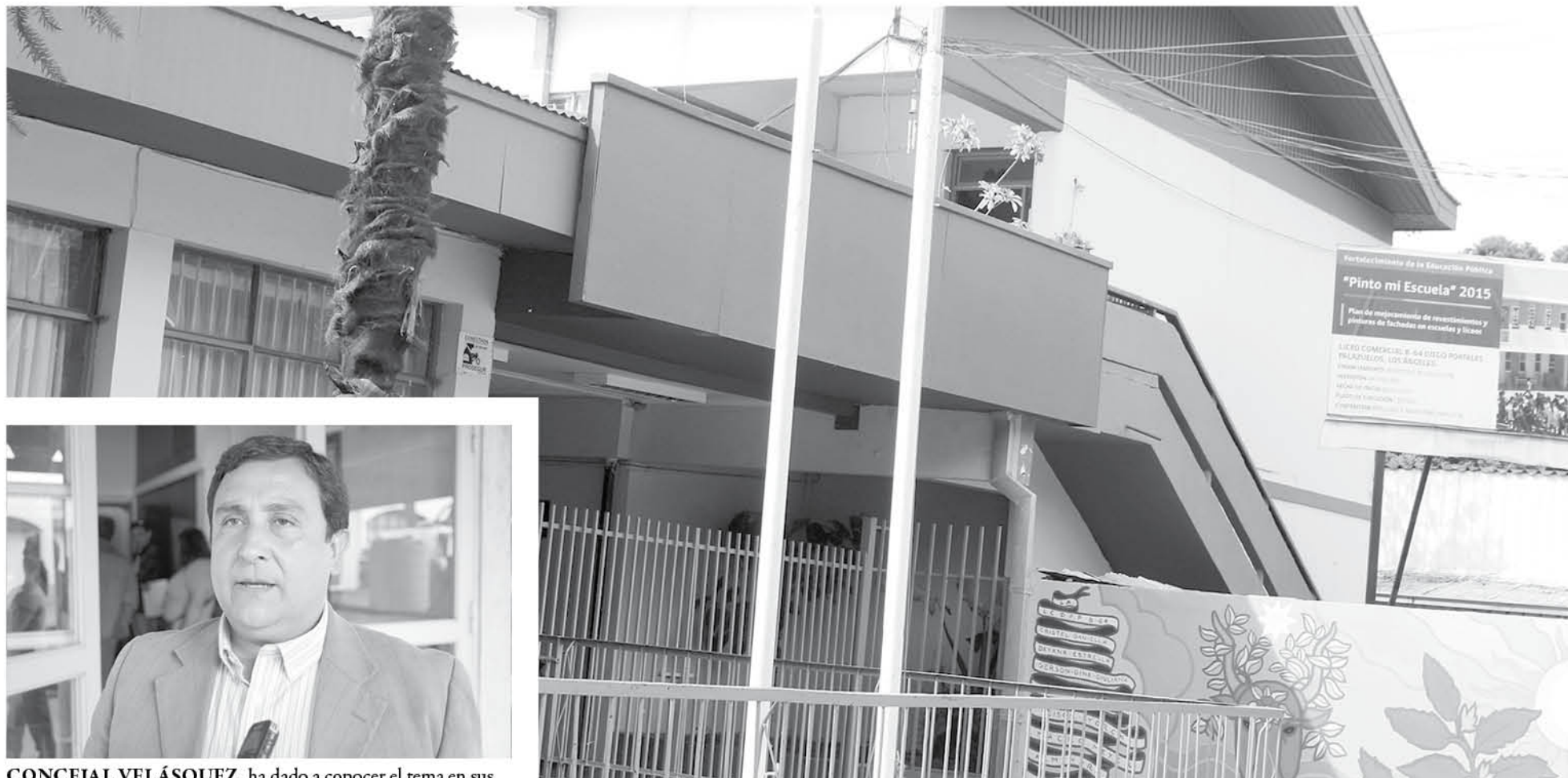
CONCEJAL VELÁSQUEZ, ha dado a conocer el tema en sus intervenciones en el concejo municipal sin respuesta al respecto.