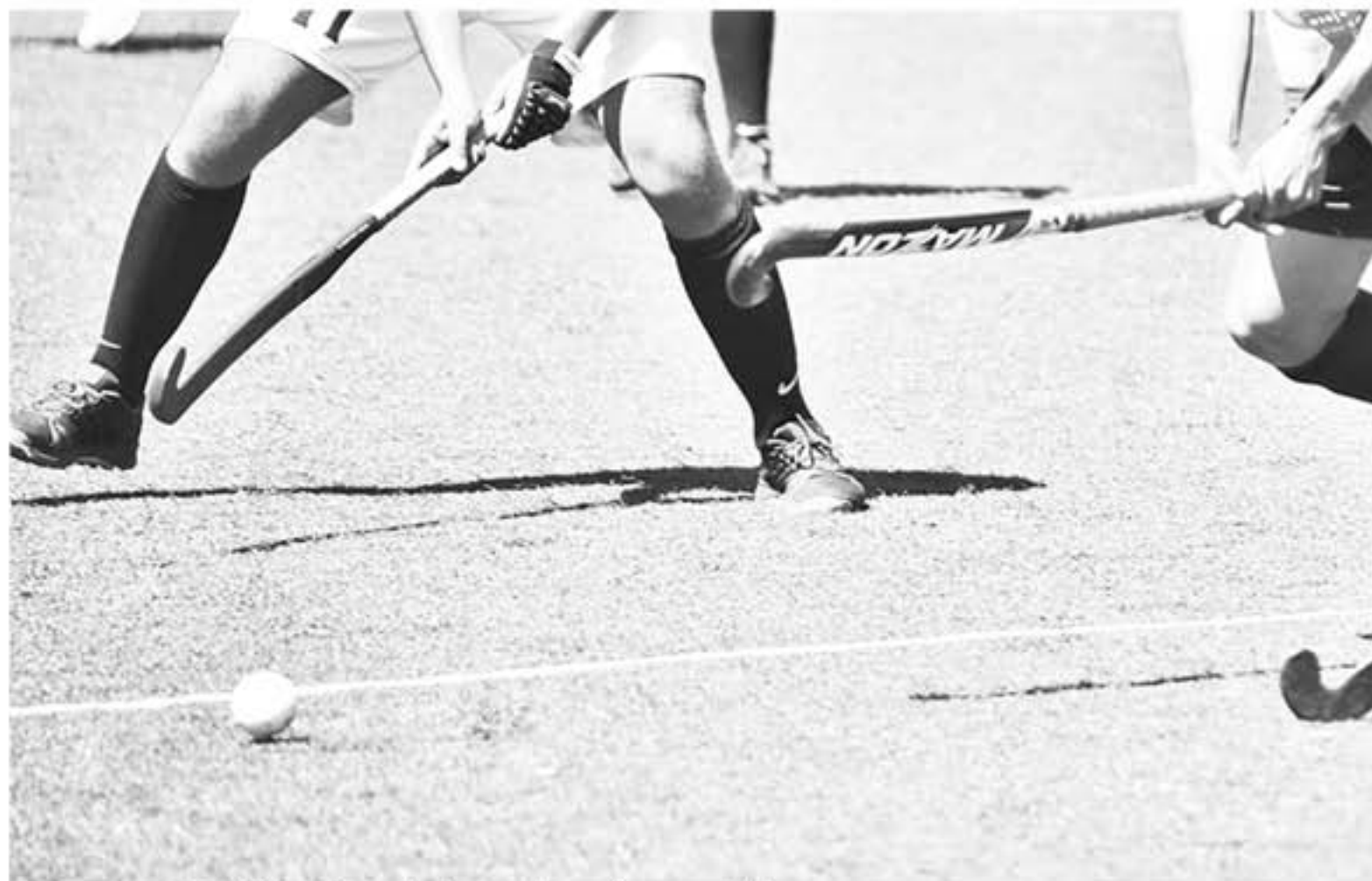
EL HOCKEY ES UNA de las disciplinas que día a día gana adeptos en la provincia de Biobío.

te de Old Mix "en esta presentación logramos ganar dos partidos con el mismo marcador 6 a 0 a Sagrada Familia y a Águilas, mientras que en el partido de cierre nos empataron en el último minuto quedando 2 a 2 frente a Club Manquehue de Santiago un gran mérito del equipo ya que viajamos sin banca y sin arquero dejando todo en cancha por nuestro club, ciudad y familia, esperamos seguir entregando en cartera y tener nuestra revancha en las tres