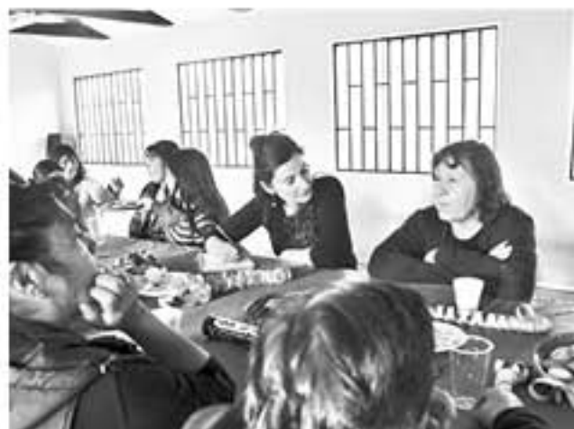
CERCA DE 400 familias son las invitadas a participar en un evento que busca plasmar la identidad local.

Facuse, agregó que "esta es una experiencia muy valiosa para quienes participan porque muchas veces descubren talentos que no habían explorado".