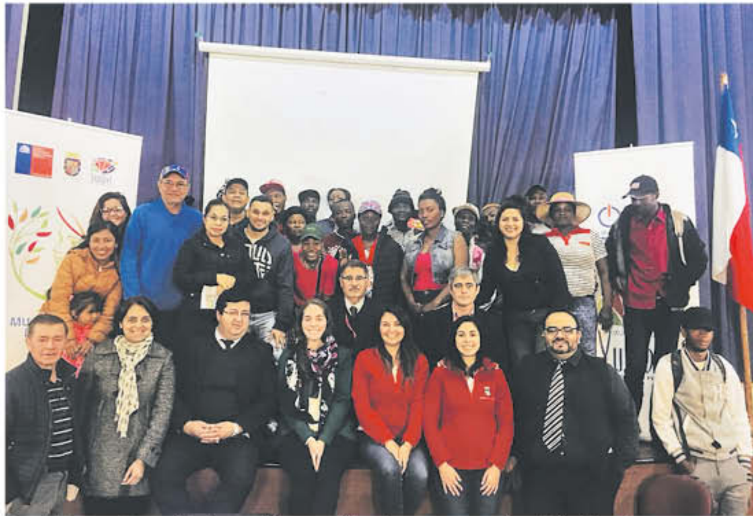
LA ACTIVIDAD SE ENMARCO en el contexto de la creciente población de inmigrantes que actualmente ha llegado hasta la comuna.

Hogar y Omil de Yumbel, explicaron que el proceso permite a la comuna generar mejores lazos con los ciudadanos.