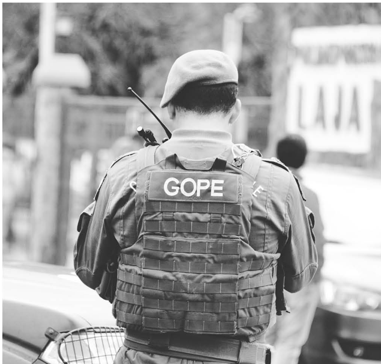
GOPE TRABAJÓ arduamente en labores de búsqueda.

Es relevante destacar que el clima fue importante en esta historia, ya que la constante lluvia en la zona no le era favorable.