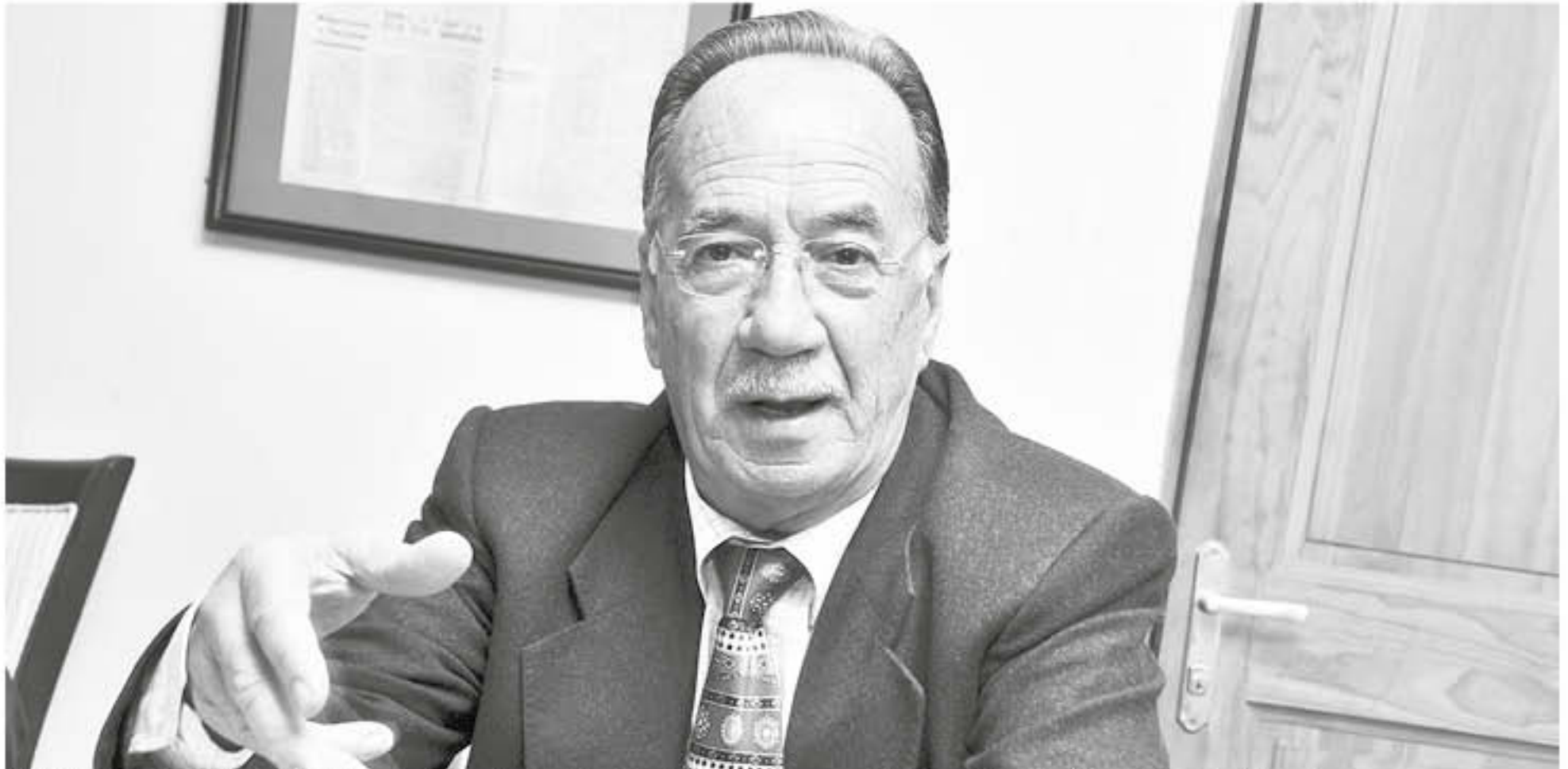
EL DIPUTADO RADICAL, destacó la labor realizada por la directora del servicio, y los grandes avances que se han hecho en el Complejo Asistencial durante los últimos años.

SIGUE LA POLÉMICA POR CARGOS DEL GOBIERNO