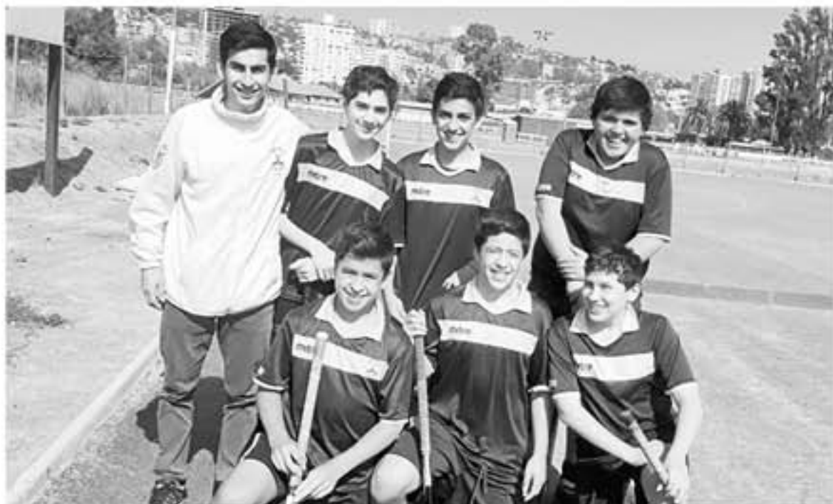
EL EQUIPO de sub 14 destacó en Viña del Mar y espera lo que se viene durante el año.

"Falta más apoyo serio a los deportes que hoy realmente están trabajando duro de forma constructiva que aportan a la ciudad en masificación, en crear identidad y sobre todo formación de jóvenes que optan por seguir una formación distinta por medio del deporte, creando una alternativa de superación en todo sentido. A tomar nota de que para ser grandes, necesitamos apoyos grandes adjunto de compromisos concretos que motiven a seguir incentivando a otros profesionales a seguir trabajando con la misma fuerza y hacer una ciudad potente más de lo que es con más apoyo serio".