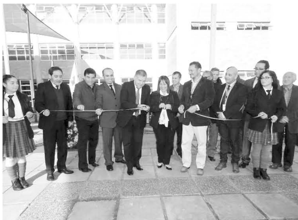
UNA ALIANZA POSITIVA entre la comunidad escolar del Liceo Municipal de Nacimiento y la empresa eléctrica.

Comunidad educativa del Liceo Municipal de Nacimiento, se mostraron muy agradecidos de la gestión ya que les permitirá avanzar en su aprendizaje.