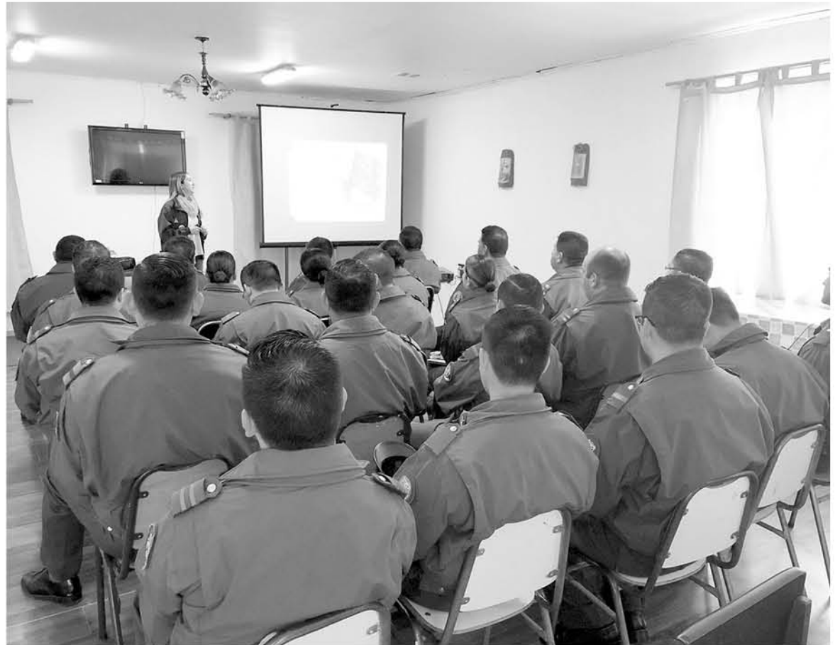
UN TOTAL DE 420 UNIFORMADOS recibieron capacitación de Sistema de Asistencia a Quemadas.

de nuestro país se utilice el fuego como herramienta de eliminación de residuos vegetales que quedan después de faenas agrícolas y/o forestales en los predios. Y debido