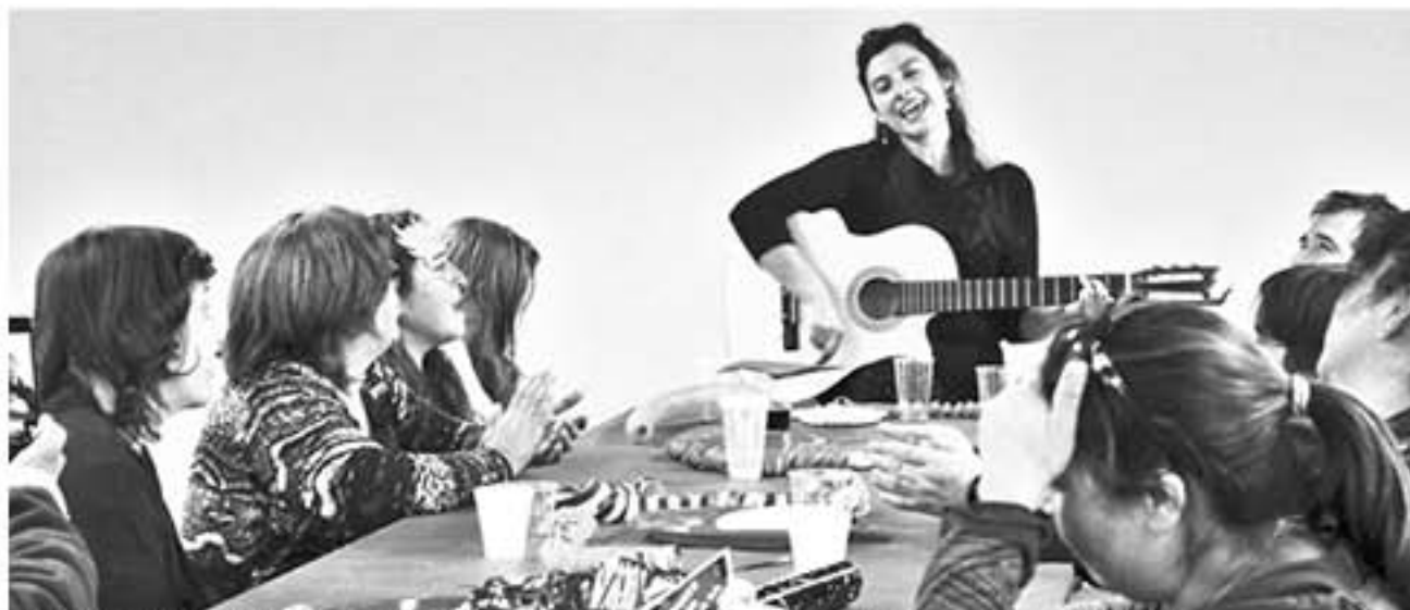
VECINOS DEL SECTOR Jardín de Las Lomas, fueron los pioneros a nivel provincial en realizar esta actividad.

La encargada de guiar a los vecinos manifestó que "el principal aporte de este programa es fortalecer la identidad del barrio y de la comuna.