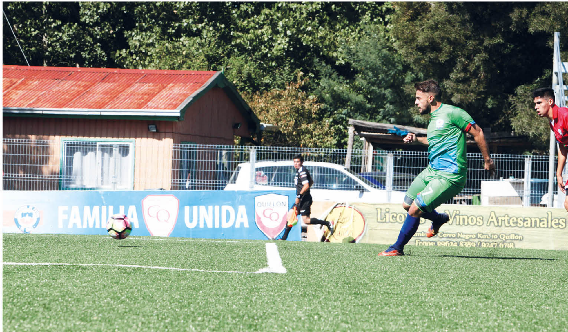
CON UNA CERTERA GOLEADA a Quillón, este fin de semana Cabrero será local ante Pilmahue de Villarrica.

EL ESTRATEGA ANALIZÓ EL GRAN DEBUT EN TERCERA "B"