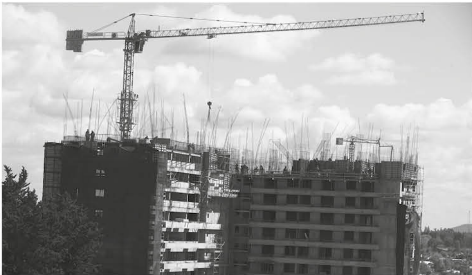
LOS ÁNGELES aumentó sus permisos de edificación, en un 190%.