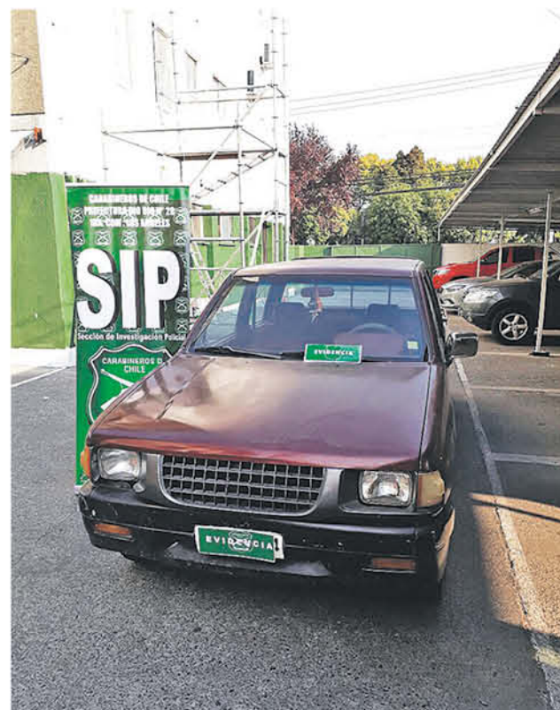
EL VEHÍCULO RECUPERADO por Carabineros estaba en poder de un angelino que no tenía antecedentes delictuales.

En un operativo, personal de esta sección policial dio con el paradero de este vehículo, que provenía de Santiago.