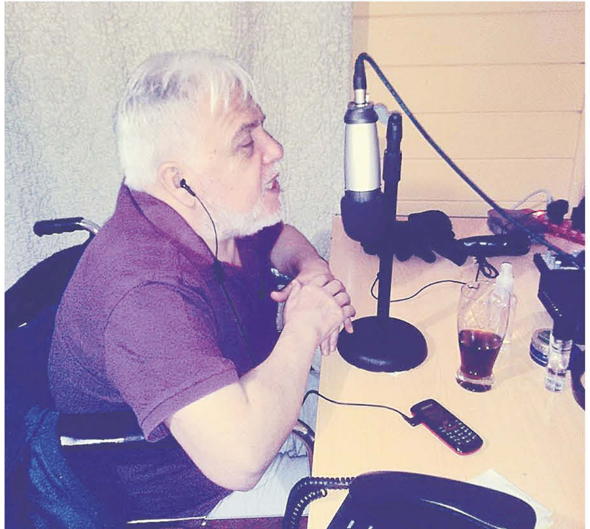
ERA UNO DE LOS ÚLTIMOS locutores de la época de los 70, el que hasta hoy seguía vigente.

"Nacido y criado en Los Ángeles, creo que es el único locutor angelino de la vieja oleada, porque en ese tiempo llegaron varios muy conocidos, pero no eran de la comuna, y él era, de los años 70 en adelante, el único