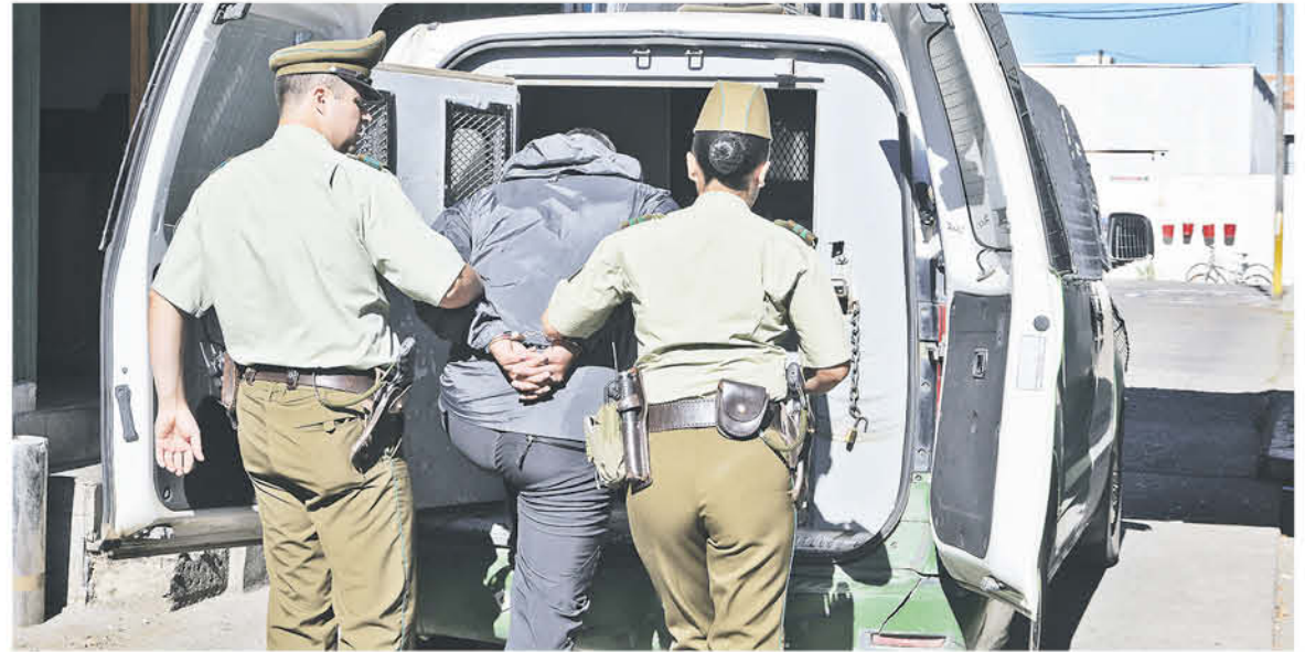
PRODUCTO DE ESTE ILÍCITO se generó una importante persecución por las calles de Los Ángeles.

Al momento de percatarse de esto hecho, los hombres se dispusieron a