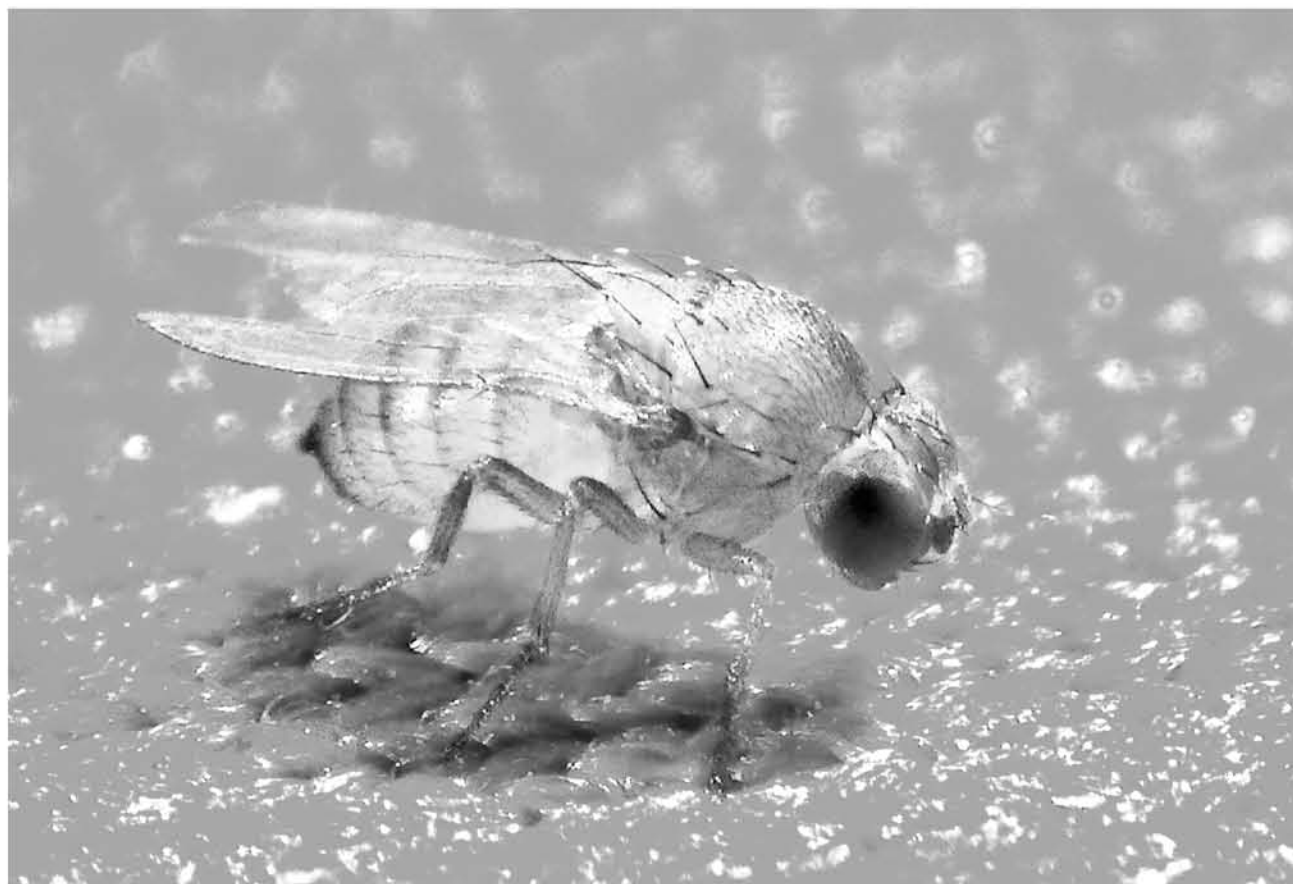
MOSCA DE LAS ALAS manchadas / Créditos: David Duneau blogs.biomedcentral.com

Según las características de los adultos suelen medir de 2 a 3 mm de largo y poseen ojos rojos, tórax café o amarillento pálido y bandas transversales oscuras en el abdomen, las antenas son cortas y con una arista ramificada.