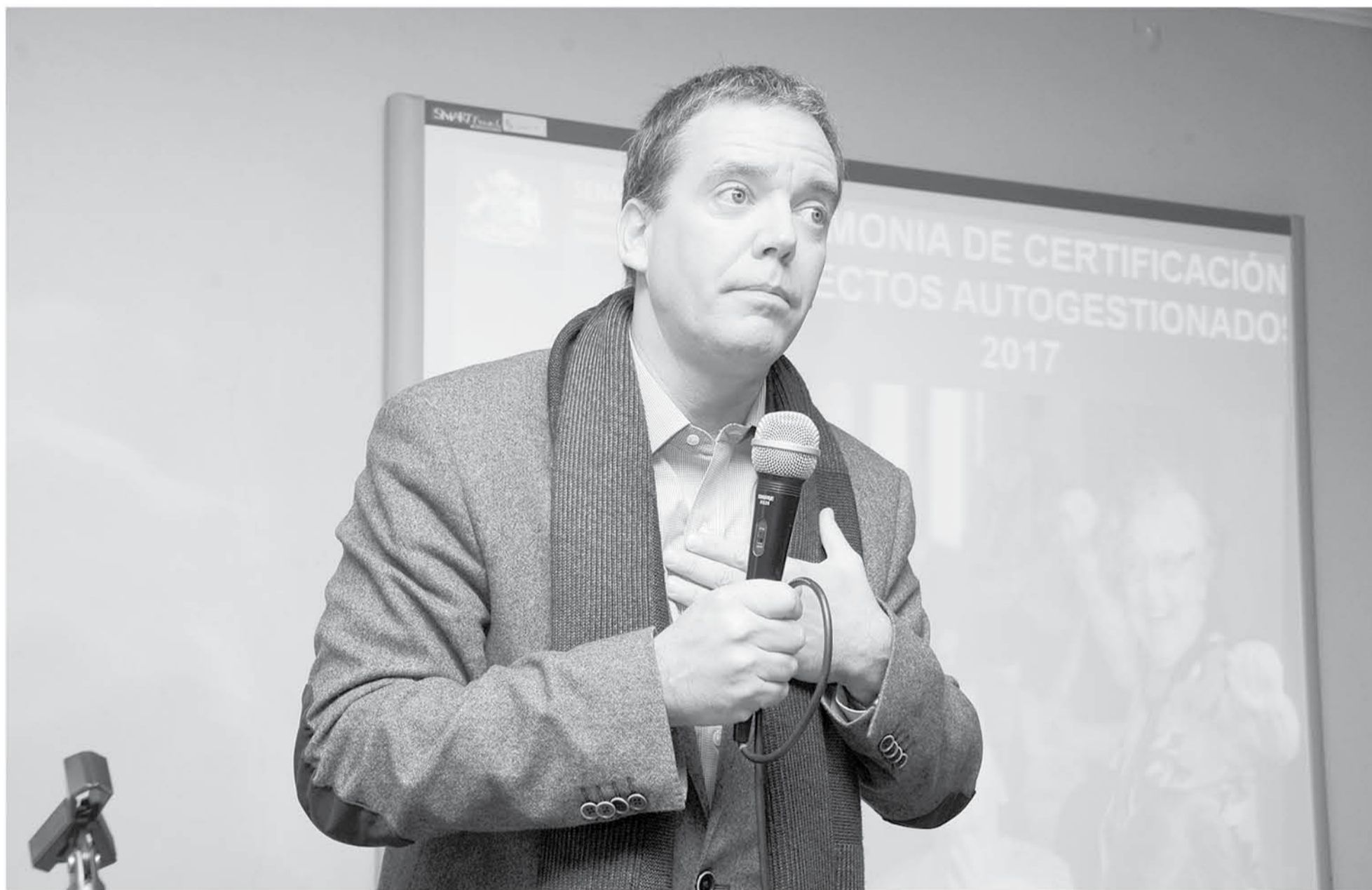
SENADOR FELIPE HARBOE, hace llamado a no politizar la situación del Plan de Descontaminación.

El parlamentario llamó a la templanza para solucionar el grave problema de contaminación ambiental que se suscita todos los años en la estación invernal, que vuelve irrespirable el aire en la ciudad de Los Ángeles.