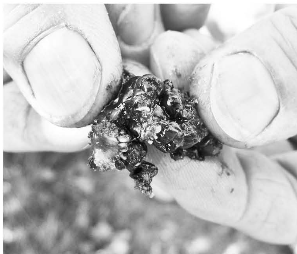
LOS CULTIVOS PUEDEN verse profundamente dañados.

Se suma, además, que la presencia de la plaga requeriría efectuar aplicaciones de pesticidas para su control, lo cual genera mayores costos de producción, consecuencias medioambientales y el riesgo de rechazo de las frutas para exportación debido a los niveles de pesticidas residuales que pudieran superar los límites máximos de residuos.