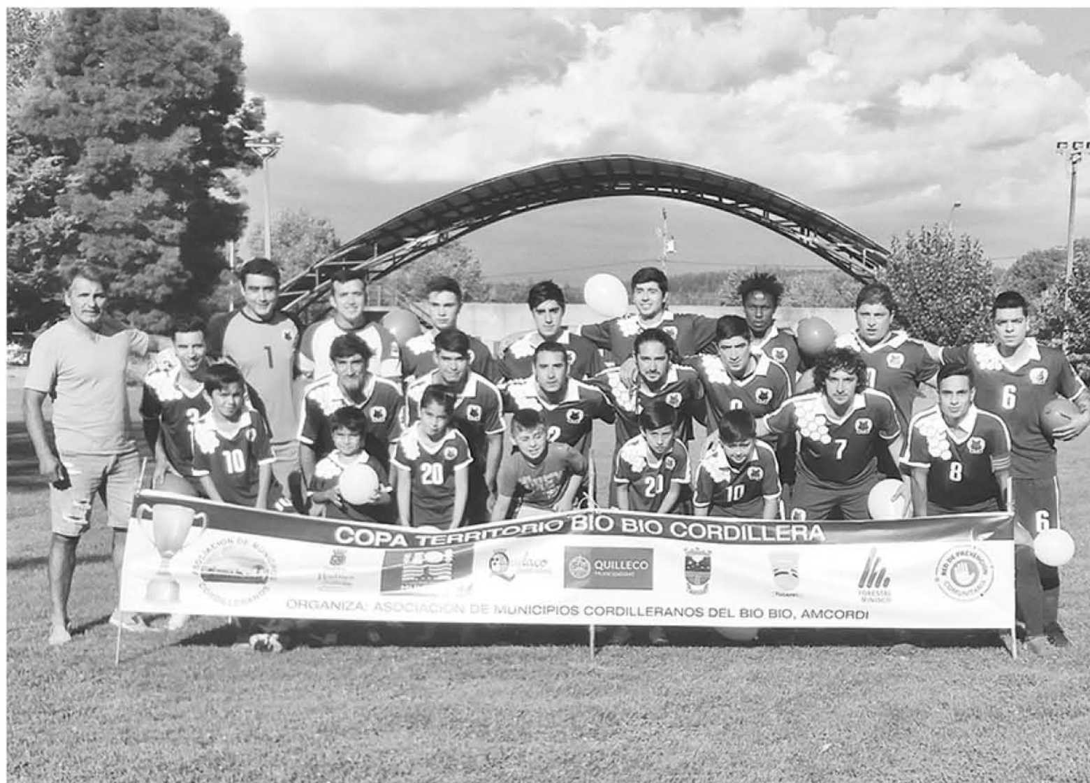
EL ACTUAL CAMPEÓN, Juventud de Quilleco, intentará volver a quedarse con el título este domingo.

Los encuentros se llevarán a cabo en la comuna de Antuco, sorteada al inicio del certamen para albergar el