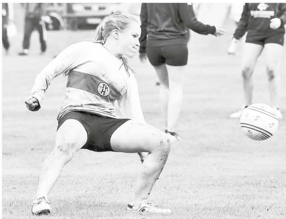
ES UN DEPORTE similar al voleyball. Juegan cinco jugadores por equipo, y cada equipo dispone de tres toques por jugada.

Un partido se juega a 3 o 5 sets, de 11 con diferencia de 2 puntos y "muere-muere" a los 15, aunque los sets depende del campeonato. Actualmente son muchos los países que practican este deporte y cada cuatro años se lleva a cabo el torneo mundial de la especialidad. En el 2006 hay Mundial femenino en Suiza y en el 2007 Mundial masculino en Alemania. El actual campeón masculino juvenil, femenino juvenil y femenino adulto es Alemania, y masculino adulto es Austria.