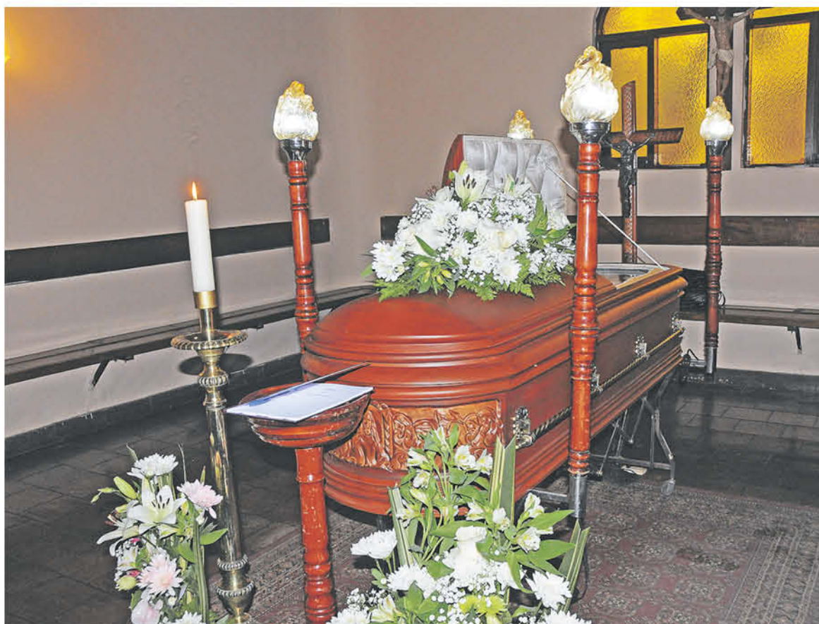
SUS RESTOS ESTÁN siendo velados en la Parroquia Perpetuo Socorro, ubicada en calle Colón 1226.