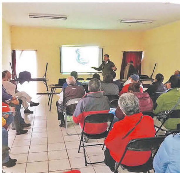
CARABINEROS se encuentra actualmente realizando estas charlas preventivas dirigidas a importante número de la ciudadanía.

A través de estas capacitaciones para los dirigentes, los vecinos pueden obtener las herramientas necesarias para detectar y denunciar actos relacionados a drogadicción, para evitar que se propague al consumo de los jóvenes, por eso, esta es una tarea constante que se extiende a gran parte de la provincia.