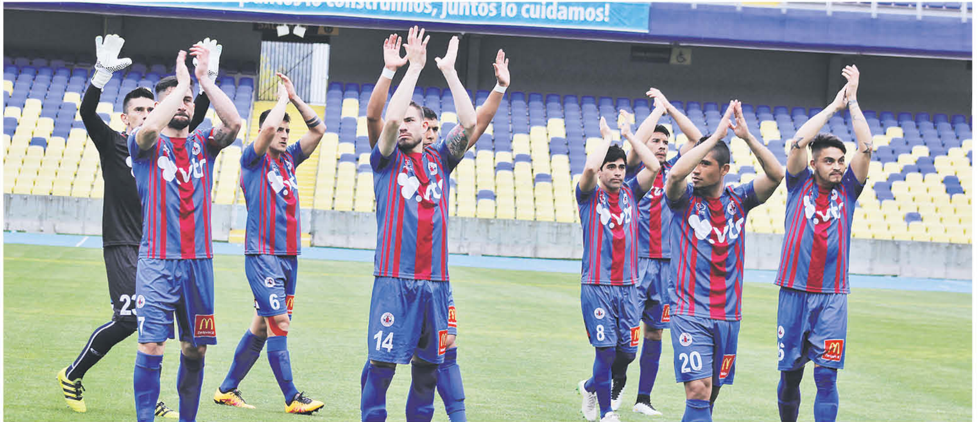
LA "AZULGRANA" volverá al Ester Roa Rebolledo, esta vez para un clásico ante Arturo Fernández Vial.

DONDE SE ENCONTRARÁ CON VIEJOS CONOCIDOS