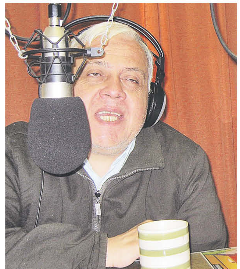
FUE A LOS 12 AÑOS que comenzó con su carrera comunicacional.