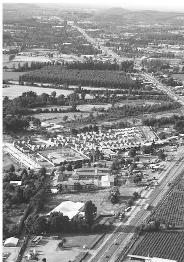
EL 2023 LOS ÁNGELES tendrá una obra vial que unirá Sor Vicenta con avenida Padre Hurtado.