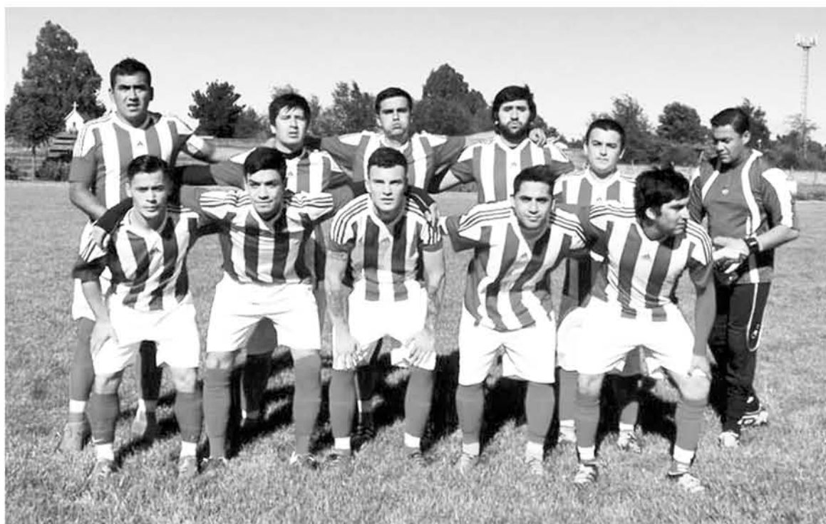
ESTRELLA BLANCA BUSCARÁ dejar sin bicampeonato al equipo quillecano.

En cuanto a la seguridad, sostuvo que "como alcalde he dado la instrucción a nuestro director de seguridad comunal para que pueda coordinarse con Carabineros y así proveer una tranquilidad en el estadio, seguridad para que puedan dis-